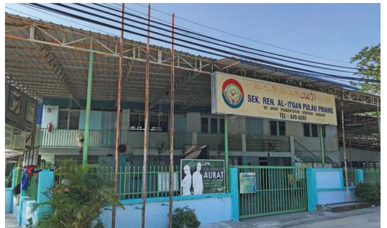
SEKOLAH Rendah Agama Al-Itqan, Teluk Kumbar kini.