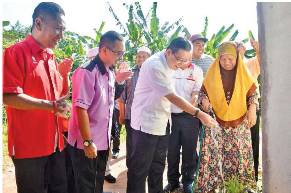
KETUA Menteri dan wakil-wakil terlibat mencuba bekalan air rawat bersih pada lawatan di salah sebuah kediaman di sini baru-baru ini.

"(Selepas ini, kesemua 51 penerima terbabit) tidak perlu bayar kos pemasangan RM1,500 (setiap rumah) atau (kos keseluruhan) RM76,500, cuma tiap-tiap keluarga bayar RM100 cagaran serta RM30 duit setem.