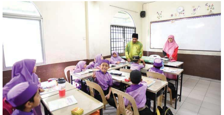
SUASANA pembelajaran di salah sebuah kelas di Madrasah Uthmaniah.

“Melihat kepada perkembangan SAR kini, mungkin Kerajaan Negeri boleh