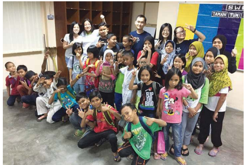
BERGAMBAR kenangan selepas tamat sesi pembelajaran.

Meskipun tiada yuran dikenakan terhadap pelajar-pelajar yang hadir ke Pusat Tuisyen Komuniti berkenaan, PYDC dan PEKA berjaya mengekalkan kehadiran