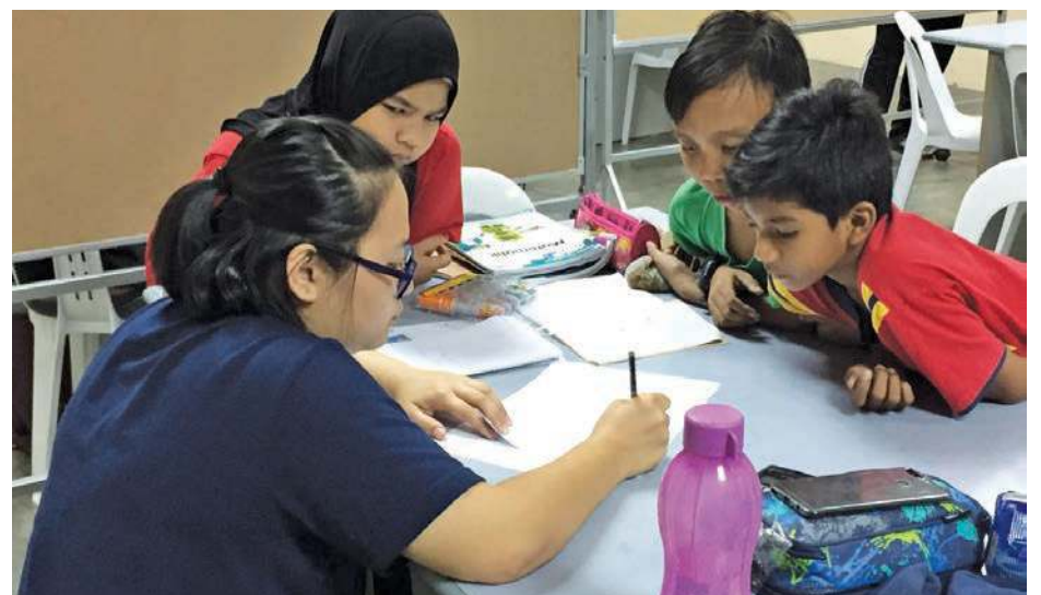
TENAGA pengajar komited memberi tunjuk ajar kepada kanak-kanak yang mengikuti pembelajaran di Pusat Tuisyen Komuniti.

“Kami bukanlah mahu bersaing dengan pusat-pusat tuisyen berbayar lain, tetapi kami menyediakan alternatif kepada pelajar-pelajar ini untuk terus berjaya, lagipun ia terbuka kepada murid sekolah rendah Darjah 4 hingga Darjah 6,” ulas beliau.