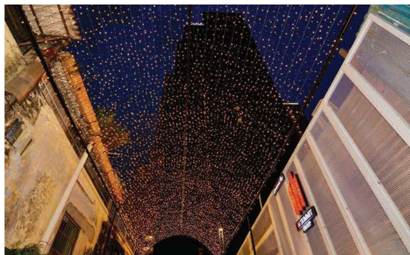
KERDIPAN lampu kecil LED 'terhampar' luas bak bintang di langit.