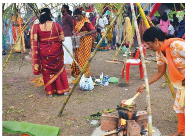
UPACARA memasak nasi ponggal pada sambutan peringkat negeri di sini baru-baru ini.

“Tadbir urus CAT telah membolehkan Kerajaan Negeri