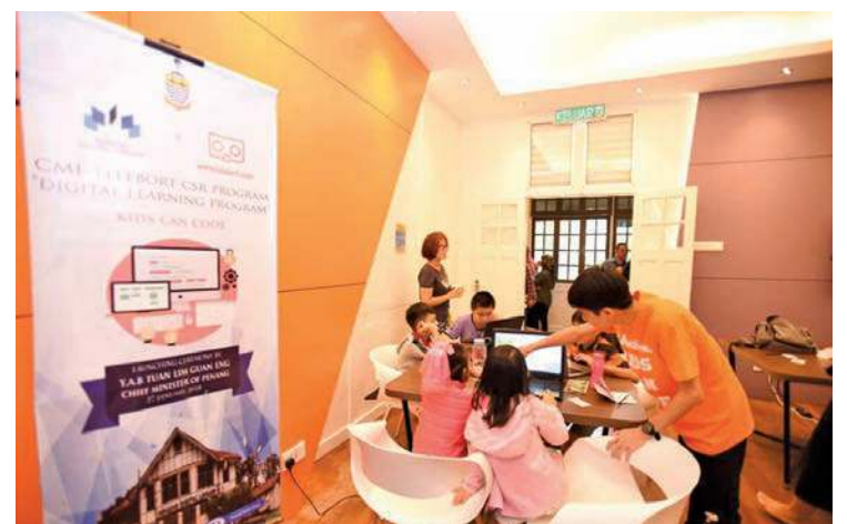
SEBAHAGIAN pelajar yang mengikuti kelas 'Kids Can Code' di PDL di sini baru-baru ini.

"Kedua-duanya akan menjadi perpustakaan digital pertama di Malaysia yang beroperasi 365 hari setahun, 24 jam sehari termasuk cuti umum," katanya yang turut meninjau tapak cadangan