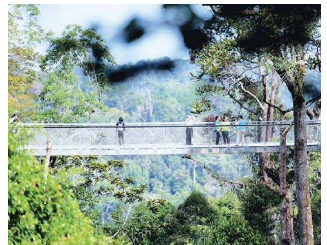
PANORAMA yang berjaya dirakam.