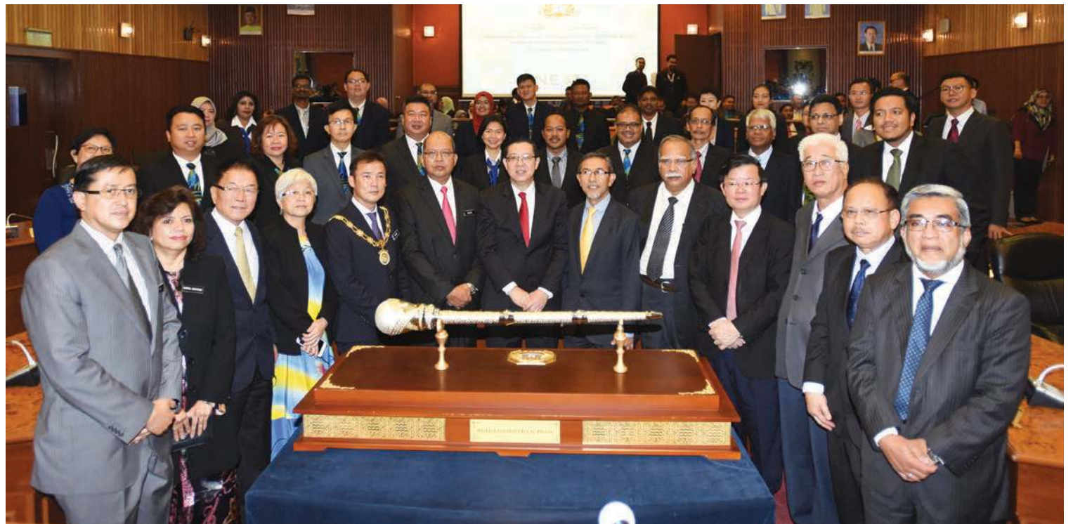
KETUA Menteri dan barisan kepimpinan Kerajaan Negeri merakam gambar bersama-sama selepas selesai Majlis Penerimaan Jawatan Sebagai Datuk Bandar MBPP di sini baru-baru ini.

Mengulas lanjut, Tung Seang berkata, semua 44 sistem sedia ada dalam MBPP akan diintegrasikan menjadi satu sistem tunggal untuk mewujudkan satu data raya.