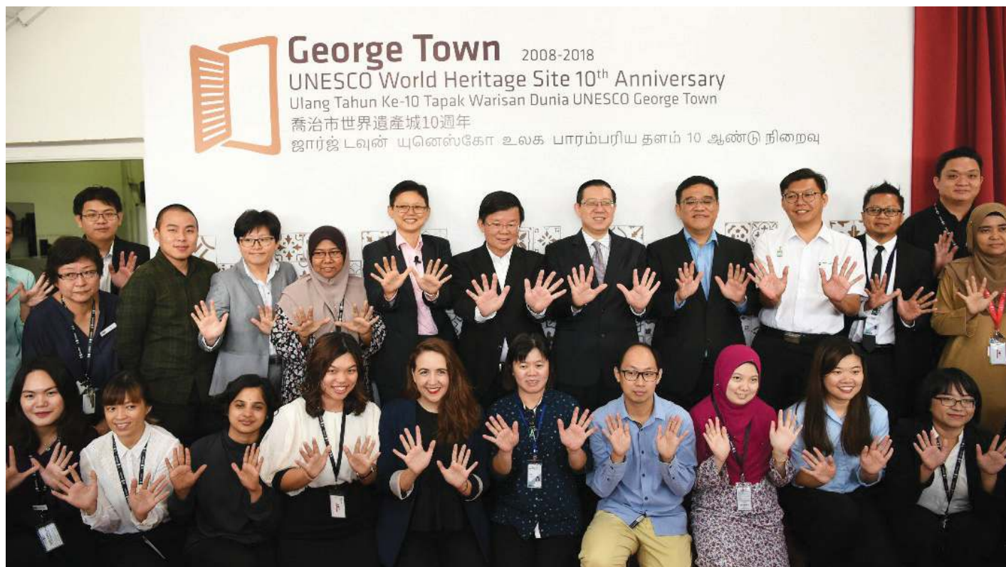
KETUA Menteri dan barisan kepimpinan Kerajaan Negeri merakamkan gambar kenangan bersama-sama kakitangan GTWHI pada Majlis Pelancaran Program Perayaan Ulang Tahun Ke-10 Tapak Warisan Dunia (UNESCO) George Town di sini baru-baru ini.