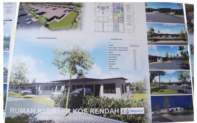
ILUSTRASI reka bentuk projek.

Difahamkan, sejumlah 38 keluarga terpaksa berpindah pada tahun 1990-an kerana Kerajaan Negeri terdahulu mengambil alih kira-kira 1,000 ekar tanah di Byram bagi tujuan mewujudkan tapak pelupusan sisa pepejal Pulau Burong.