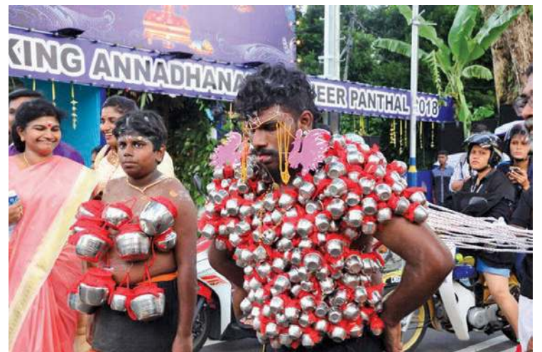
SEBAHAGIAN penganut agama Hindu yang menunaikan nazar.