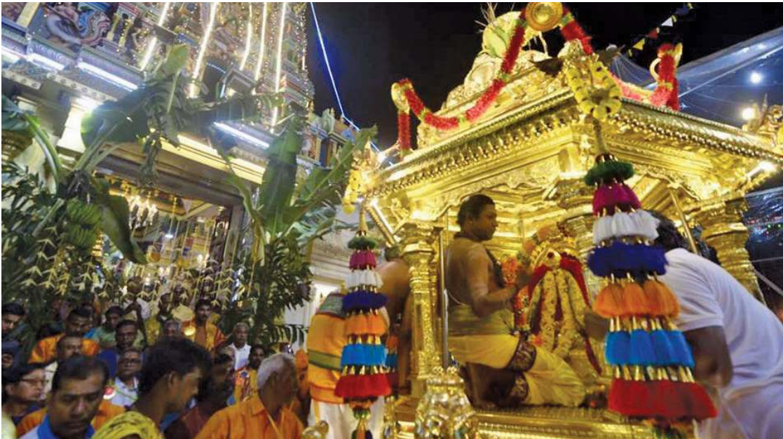
GOLDEN Chariot yang melalui jalan-jalan utama pada sambutan Thaipusam baru-baru ini.

Oleh : WATAWA NATAF ZULKIFLI