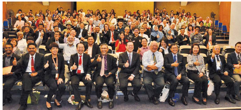
PARA peserta bergambar kenangan bersama-sama Ketua Menteri dan barisan kepimpinan Kerajaan Negeri pada Majlis Perasmian Simposium Pulau Pinang Negeri Mampan di sini baru-baru ini.

“(Dan) dengan data jugalah kita dapat melihat kejayaan inovasi seperti Uber atau Grab , yang mana syarikat tersebut tidak memiliki sebuah teksi pun, tetapi menggunakan aplikasi data yang boleh diakses seluruh dunia menggunakan