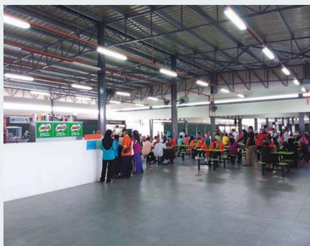
RUPA bentuk Kompleks Penjaja Taman Tasek Mutiara kini.

“Saya berharap bermula pada hari pertama kemudahan (kompleks penjaja) ini digunakan, ia diselenggara dan dijaga dengan baik supaya masalah berhubung dengan kerosakan pada kemudahan awam serta peralatan-peralatan di kompleks ini tidak berlaku,” jelasnya pada Majlis Perasmian Pembukaan Kompleks Penjaja Taman Tasek Mutiara di sini baru-baru ini.