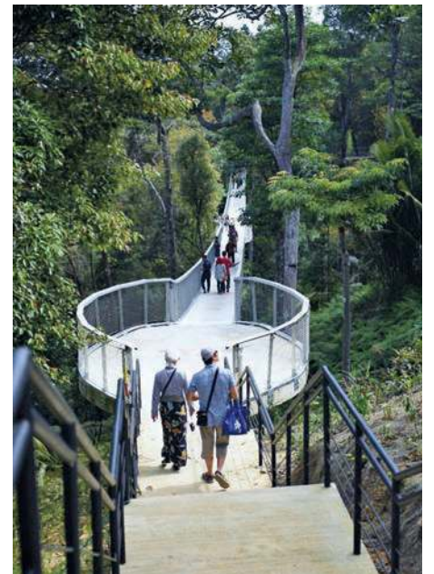
LALUAN yang 'menghubungkan' umum dengan keindahan semula jadi.

"Diharapkan umum akan terinspirasi untuk mempercayai kemampuan mereka sendiri dalam membantu memulihara alam semula jadi," ujarnya sambil memberitahu bahawa potongan yuran masuk 50 peratus akan diberikan kepada pemegang kad pengenalan MyKad ke sini.