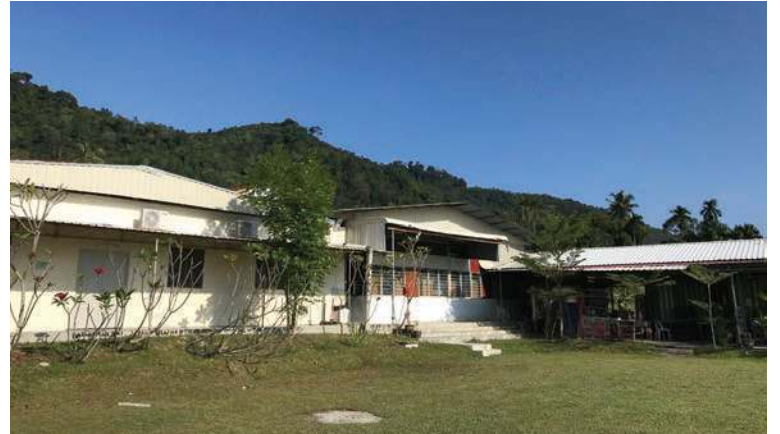
TAPAK Sekolah Menengah Agama Al-Itqan yang bakal dinaik taraf kepada empat bangunan bagi menempatkan pelajar-pelajar sekolah rendah dan menengah di dalam satu kawasan seluas tiga ekar.

“Berasaskan konsep Islam Rahmatun Lil Alamin seperti yang dilaungkan pihak Kerajaan Negeri, Al-Itqan diharap akan menjadi platform buat masyarakat setempat dan pelbagai kaum untuk sama-sama dapat berkumpul dan menikmati pelbagai kelas serta aktiviti di sini kelak,” jelas beliau.