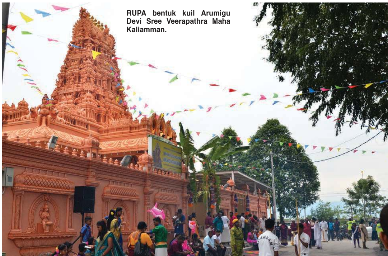
RUPA bentuk kuil Arumigu Devi Sree Veerapathra Maha Kaliamman.

mencatatkan lebih belanjawan sejak 2008 selain kenaikan rizab tunai 100 peratus serta mengurangkan hutang negeri sehingga 90 peratus,” ucapnya pada majlis berkaitan baru-baru ini.