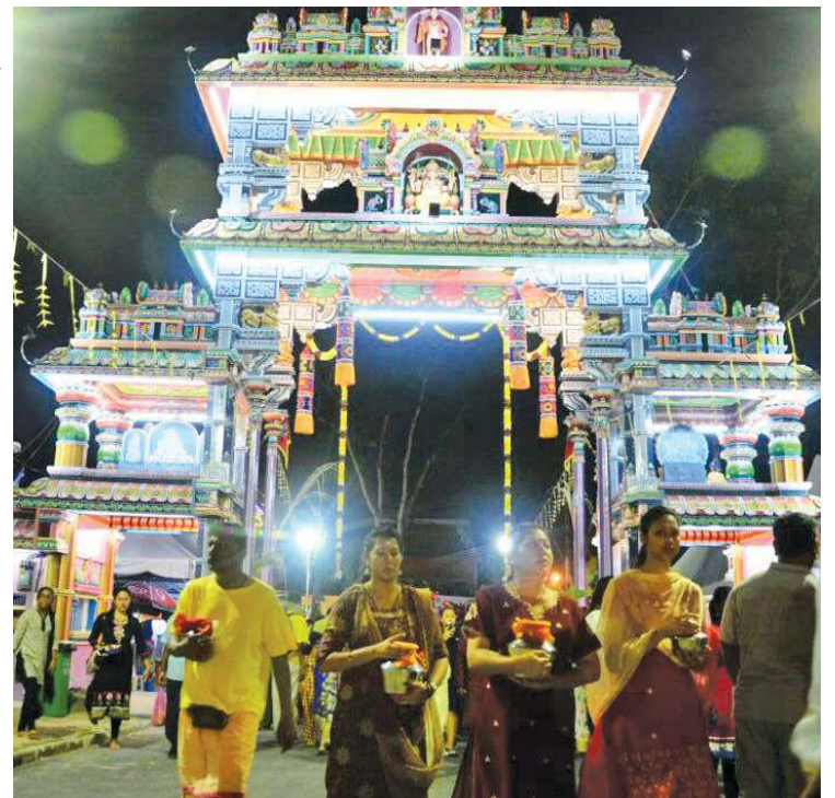
RUPA bentuk pintu gerbang di kuil Sri Arulmigu Balathandayuthapani.

“Pintu gerbang baharu merangkumi enam ciri kuil Dewa Murugan bakal menjadi tarikan pusat keagamaan serta pelancongan kepada negeri Pulau Pinang,” katanya yang juga ADUN Air Putih.