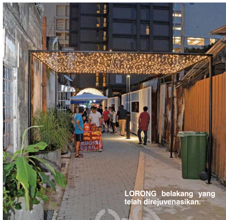
LORONG belakang yang telah direjuvenasikan.

Dikenali sebagai Kerdipan Bintang @ Lilitan Magazine, kawasan tersebut amat sesuai bagi mereka yang ingin m e r a k a m k a n kenangan terindah dengan kerdipan lampu kecil LED 'terhampar' luas bak bintang di langit. Jom!