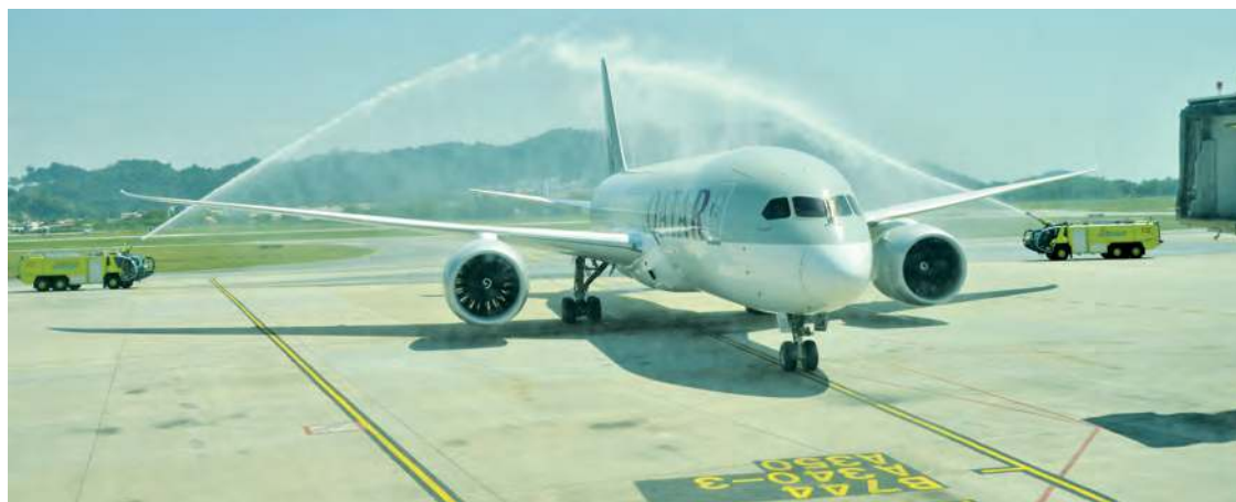
A water salute welcomes the inaugural direct flight of Qatar Airways at the Penang International Airport.