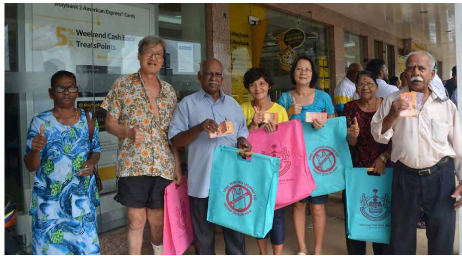
தங்கத் திட்டத்தில் நிதியுதவி பெற்றுக்கொண்ட முத்தகுடிமக்கள்.

இந்த ஆண்டு சுமார் 3,422 முத்தகுடிமக்கள் சன்மானமாக ரிம130.00 பெற்றுக்கொண்டனர். இந்த நிதியுதவி வழங்கும் திட்டம் இரண்டு நாட்களுக்கு வழங்கப்பட்டது. இந்நிகழ்வின் நேரில் சென்று பார்வையிட்ட பிணங்கு மாநில இரண்டாம் துணை முதல்வர் பிணங்கு மாநில அரசின் இலஞ்ச ஊழல் அற்ற நிர்வாகத்தினால் மட்டுமே இத்தங்கத் திட்டங்கள் சாத்தியமாவதாகக்