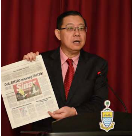
மாநில முதல்வர் மேதகு லிம் குவான் எங் ஜி.எஸ்.தி குறித்த நாளிதழ் செய்தியைக் காண்பிக்கிறார்

நம்பிக்கை கூட்டணி அரசு வருகின்ற பொதுத் தேர்தலில் புத்ராஜெயாவை கைப்பற்றினால் அடுத்த 100 நாட்களுக்குள் பொது மக்களுக்குச் சிரமத்தை அளிக்கும் பொருள் சேவை வரி (ஜி.எஸ்.தி) அகற்றப்படும் என மாநில முதல்வர் மேதகு லிம் குவான் எங் வாக்குறுதியளித்தார்.