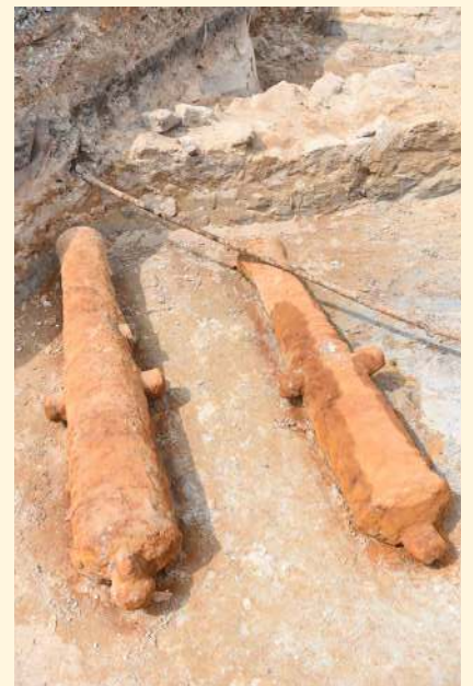
ஃபோர்ட் கார்ன்வால்ஸ் கண்டுபிடிக்கப்பட்டுள்ள இரண்டு பீரங்கிகள்

பிளாங்கு மாநில முதல்வர் அவ்விடத்திற்கு நேரில் சென்று பார்வையிட்ட பின்னர் செய்தியாளர்களிடம் இது பிளாங்கிற்கு சீனப்பெருநாள் கொண்டாட்டத்தில் கிடைத்த இரட்டிப்பு பரிசுகள் என அகம் மகிழ வர்ணித்தார்.