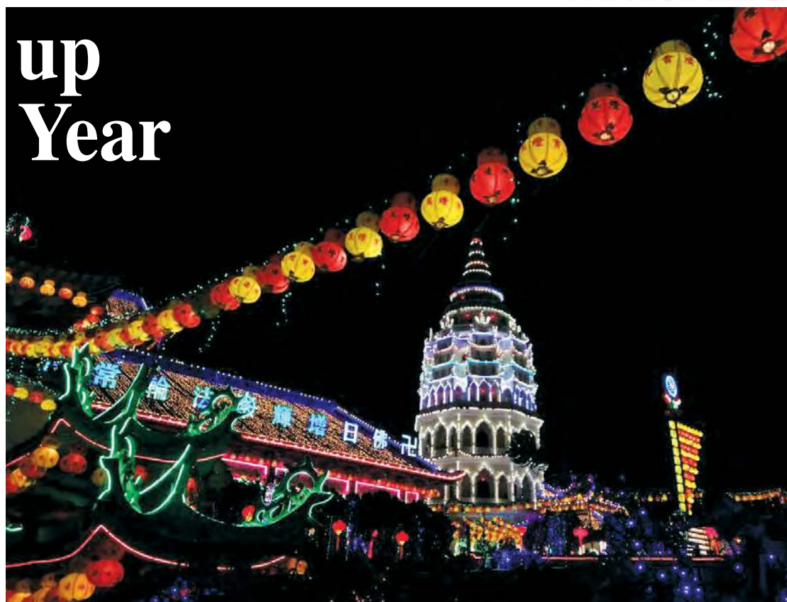
Kek Lok Si Temple glowing in the night sky.

On Chinese New Year's Eve on Feb 15, the monastery will be illuminated all the way up to the Kuan Yin statue and the pavilion.