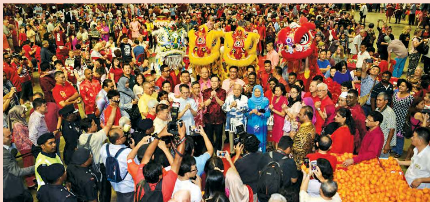
WELCOMING YEAR OF THE DOG: As many as 30,000 people turned up at the Chief Minister’s Open House at SPICE Arena on Feb 16 to celebrate Chinese New Year. SEE PAGES 3 - 5

“Anyone who has income below RM500, we will top up for them.