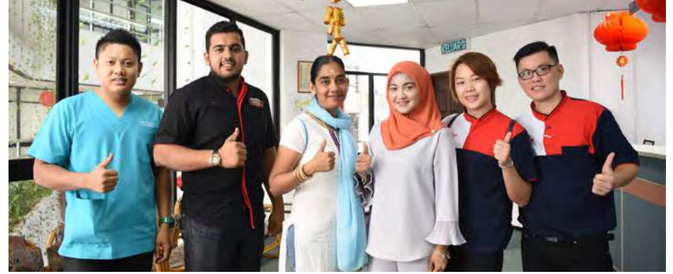
பி.தி.எஸ்.ஆர் கடனுதவிப் பெற்ற சிறு தொழில் வியாபாரிகள்

மாநில அரசு கடந்த 2009-ஆம் ஆண்டு முதல் சமத்துவப் பொருளாதார கடனுதவித் திட்டம் (பி.தி.எஸ்.ஆர்) அறிமுகப்படுத்தியது. இத்திட்டம் வாயிலாக சிறு தொழில் முனைவோர் தங்களின் வியாபாரத்துறையை மேம்படுத்த ஊன்றுகோளாகத் திகழ்கிறது.