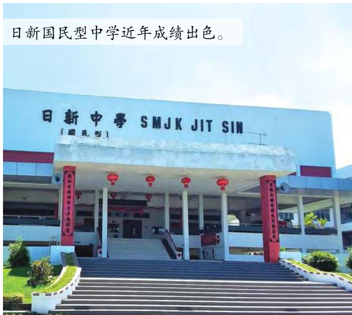
日新国民型中学近年成绩出色。