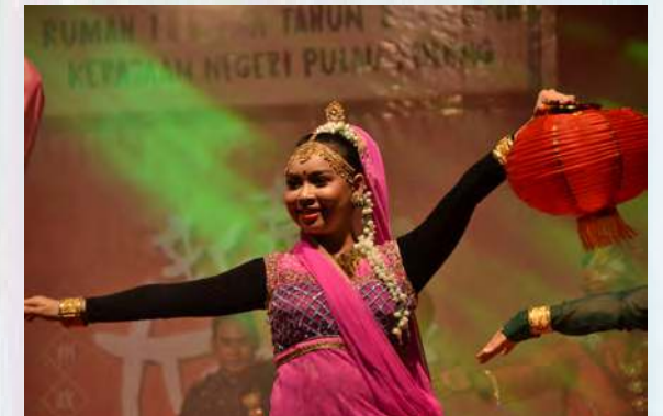
திறந்த இல்ல உபசரிப்பில் இடம்பெற்ற பாரம்பரிய நடனம்