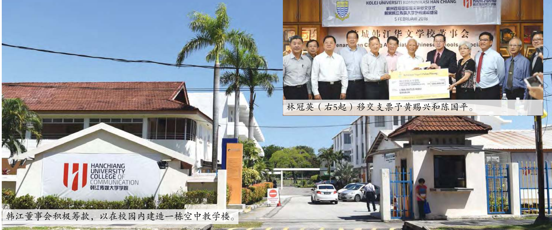
韩江董事会积极筹款，以在校园内建造一栋空中教学楼。