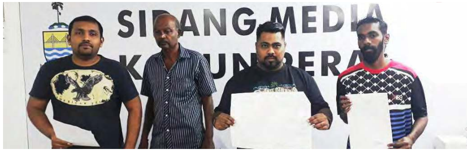
கம்போங் மெய்ன் ரோட் புதிய பணிக்குழு உறுப்பினர்கள்