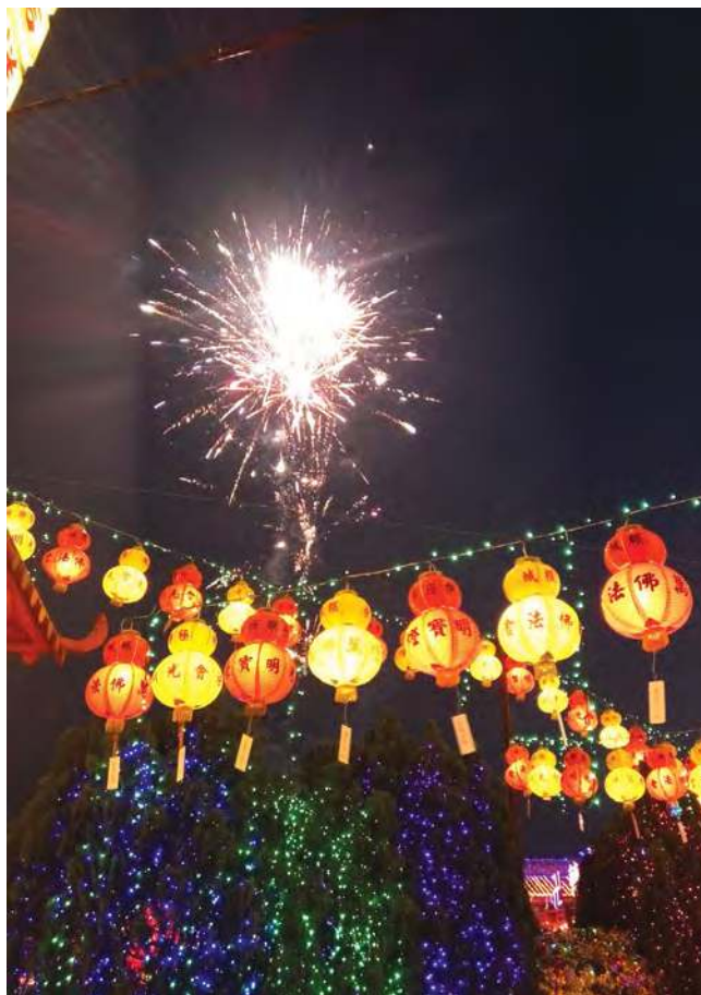
漂亮的烟花为亮灯仪式更添气氛。

有关亮灯仪式早前因经济与人力因素，而面对停办危机，所幸在各界的鼎力支持下，才让灯会得以继续举办，继续照耀槟城。