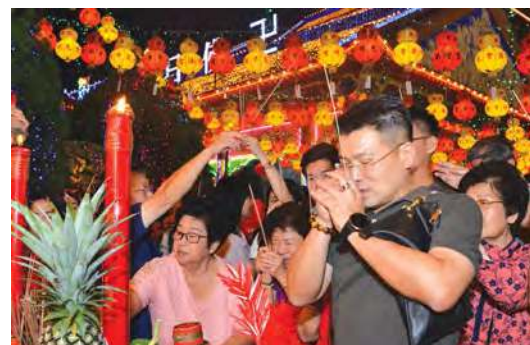
善信们纷纷上香，祈求新的一年事事顺利，身体健康。