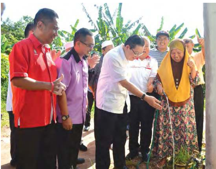
有了自来水，本那牙郊区居民方便得多了，林冠英与居民分享喜悦。

槟州政府助郊区居民安装自来水管，让多户人家摆脱多年来无水之苦。槟州首席部长林冠英说，在获知威北郊外地区部分住户因地主不肯让行，多年来无法在家中安装自来水水表后，而需向邻居借水或打井水来用，州政府立即着手协助这些住户安装自来水水表。