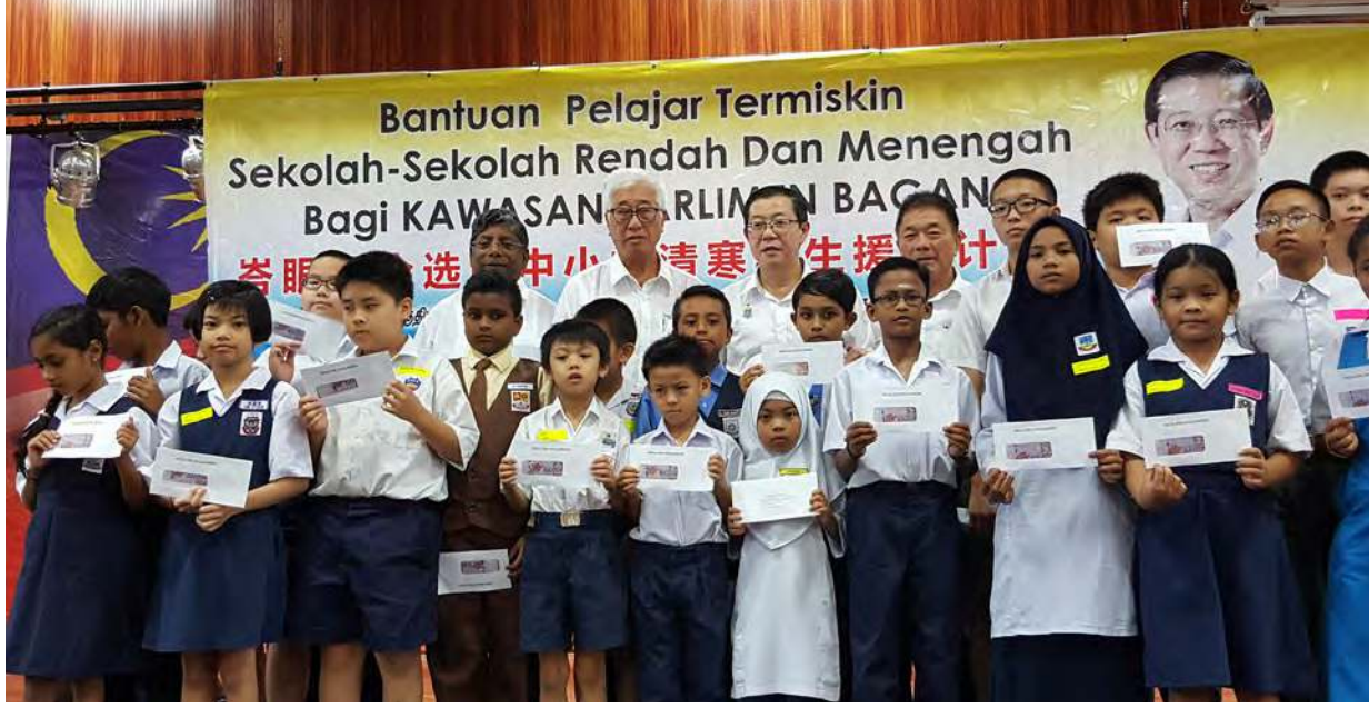
ஊக்கத்தொகை பெற்றுக்கொண்ட மாணவர்களுடன் மாநில முதல்வர் மேதகு லிம் குவான் எங் மற்றும் அரசியல் தலைவர்கள்.

பினாங்கு மாநில அரசு 2011-ஆம் ஆண்டு முதல் பாகான் நாடாளுமன்ற தொகுதியைச் சேர்ந்த வசதி குறைந்த ஆரம்பப்பள்ளி மற்றும் இடைநிலைப்பள்ளி மாணவர்களுக்கு நிதியுதவியாக ரிம484,000 ஒதுக்கீடு வழங்கியுள்ளது.