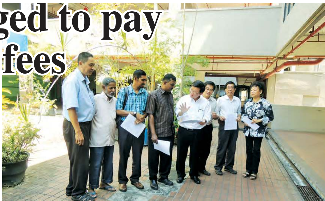
Chow (fifth from from left) and Abdul Wahab discussing issues involving Kedah Road flats.

Apart from that, Chow said more issues cropped up few days later when the water pump also stopped