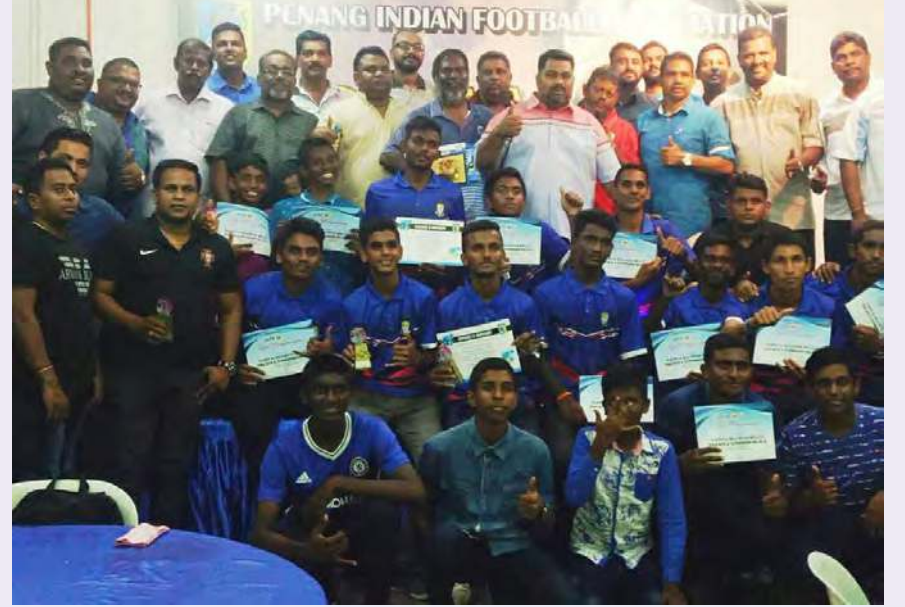
பினாங்கு இந்திய காற்பந்து சங்க உயரிய விருதுகள் பெற்ற விளையாட்டு வீரர்கள் மற்றும் ஏற்பாட்டுக் குழுவினர்

பினாங்கு இந்திய காற்பந்து சங்க (பிபா) ஏற்பாட்டில் முதல் முறையாக காற்பந்து வீரர்களின் திறமையை அங்கீகரிக்கும் வகையில் இந்திய காற்பந்து விருதளிப்பு விழா இனிதே நடைபெற்றது. இந்த விழாவில் காற்பந்து வீரர்கள் மட்டுமின்றி காற்பந்து துறையின் மேம்பாட்டுக்கு ஊன்றுகோளாகத் திகழும் நல்லுள்ளங்களுக்கும் விருதுகள் வழங்கப்பட்டன.