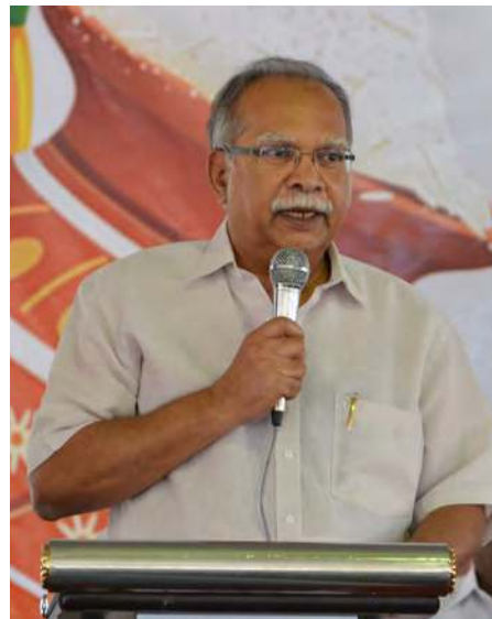
மாநில இரண்டாம் துணை முதல்வர் பேராசிரியர் ப.இராமசாமி

செபராங் பிறை நகராண்மைக் கழகத்தில் பணிப்பூரியும் ஊழியர்களில் 8.4% இந்தியர்கள் (352) என கூறினார்.