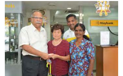
பிறை தொகுதியில் நடைபெற்ற தங்கத்திட்டத்தில் உதவித்தொகை பெற்றுக்கொண்ட பொது மக்களுடன் மாநில இரண்டாம் துணை முதல்வர் மற்றும் செபராங் பிறை நகராண்மைக்கழக உறுப்பினர் திரு டேவிட் மார்ஷல்

மாநில அரசின் இந்த உதவித்தொகைக்கு நன்றி தெரிவித்து கொள்வதோடு மாநில அரசு மக்களின் நலனில் அக்கறை செலுத்துவதை பிரதிபலிப்பதாக