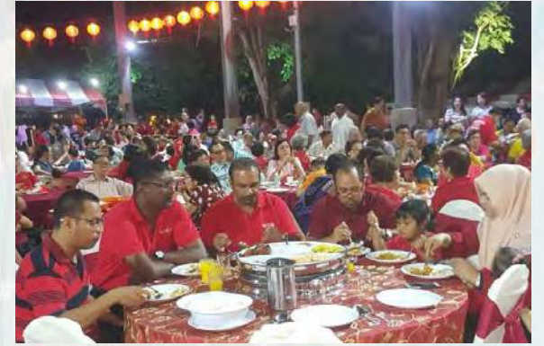
ஸ்ரீ டெலிமா சட்டமன்ற ஏற்பாட்டில் நடைபெற்ற சீனப் புத்தாண்டு திறந்த இல்ல உபசரிப்பு