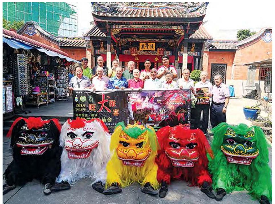
“旺犬报喜”万脚兰蛇庙庙会欢迎您参与其盛。

槟州旅游发展委员会主席罗兴强指出，槟城每年的春节都是全国最热闹的城市，而各个地区在初一至十五也有不一样的庆典活动，其中包括极乐寺万盏亮灯、北海斗母宫灯饰、丹絨道光海珠屿大伯公庙请火仪式及在旧关仔角的元宵节活动等，而在槟城过年不只有中华文化表演，还有来自各地的美食供品尝。