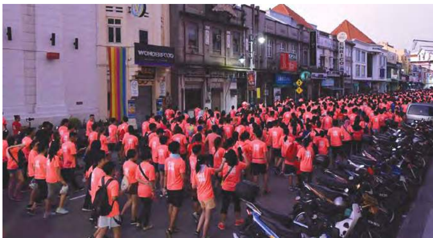
4500名跑者参与占领土库街新春跑，喜迎农历新年的到来。

配合新春的到来，该活动也安排了高桩舞狮表演，精彩的演出博得满堂掌声。民众也纷纷掏出手机，摄下舞狮英姿。