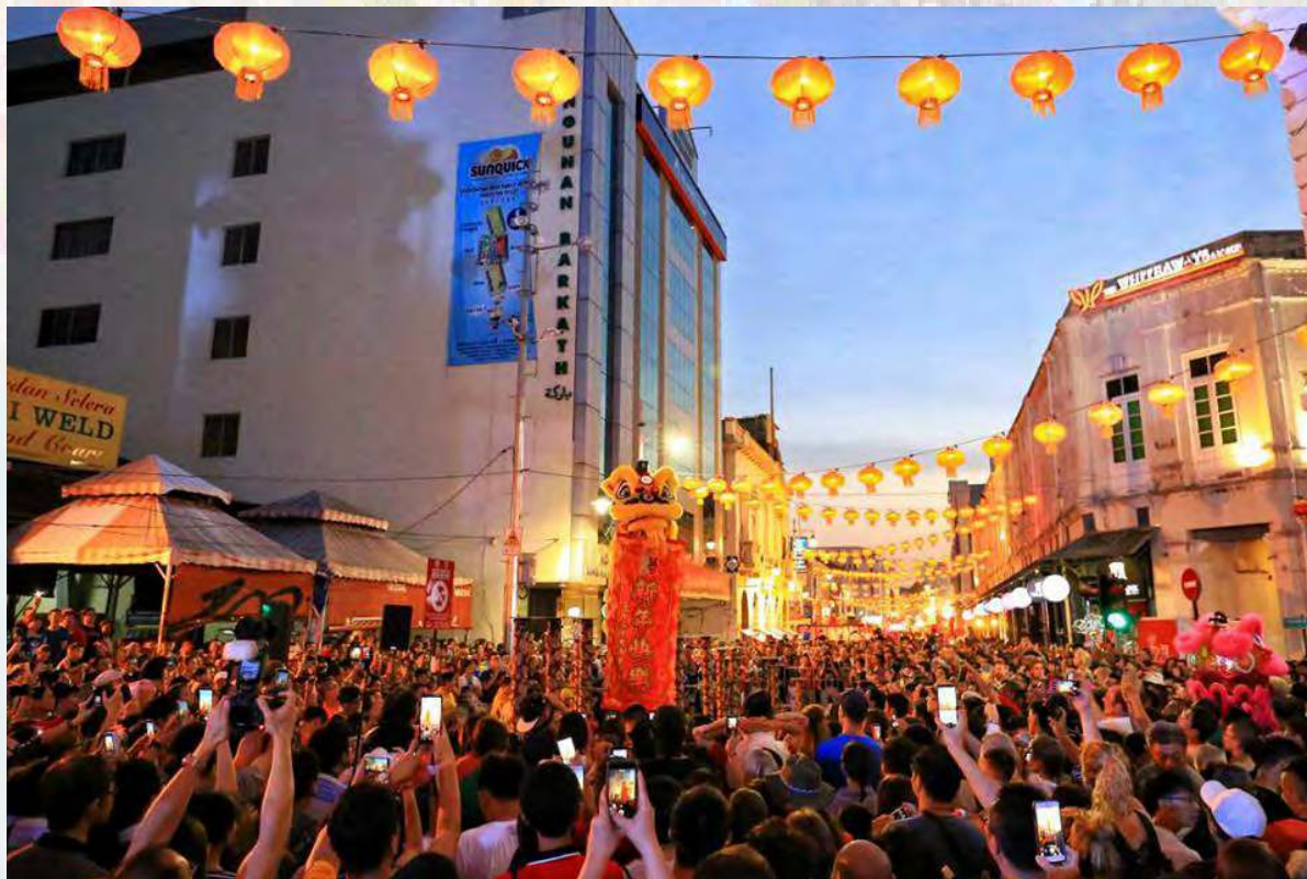
மாநில சீனப்புத்தாண்டு திறந்த இல்ல உபசரிப்பில் கலந்து கொண்ட பொதுமக்கள்

இதனிடையே, பினாங்கு மாநில அளவிலான சீனப்பெருநாள் கொண்டாட்டம் மிக விமரிசையாக கண்கவர் வானவேடிக்கை மற்றும் பாரம்பரிய படைப்புகளுடன் பிரமாண்ட கொண்டாட்டம் கண்டது. இம்முறை பீர்ச் சாலையில் திறந்த வெளியில் இக்கொண்டாட்டம் ஏற்பாடு செய்யப்பட்டது பாராட்டக்குரியதாகும். உள்நாட்டு மற்றும் வெளிநாட்டு மக்கள், சுற்றுப்பயணிகள் என அதிகமானோர் கலந்து கொண்டு இந்நிகழ்வினை மேலும் சிறப்பு செய்தனர்.