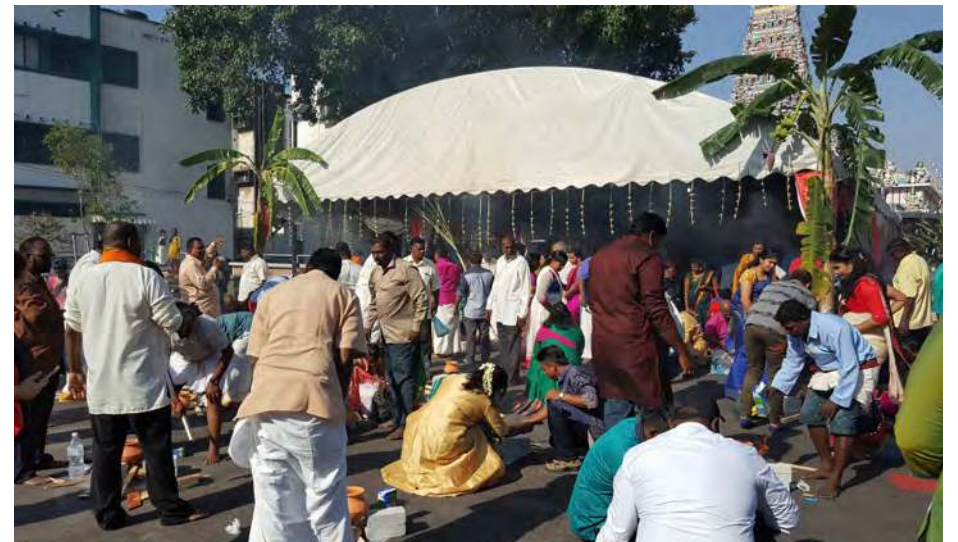
பொங்கல் விழாவில் கலந்து கொண்ட நகராண்மைக் கழக ஊழியர்கள்

முறையாக நடைபெறும் இவ்விழாவில் நகராண்மைக் கழக ஊழியர்கள் தம் குடும்ப உறுப்பினர்களுடன் இந்தியர்களின் கலாச்சாரத்தைப் பறைச்சாற்றும் வகையில் இடம்பெற்ற பொங்கல் வைத்தல், கோலம் வரைதல் மற்றும் அதிர்ஷ்டக் குழுக்கல் போட்டிகளில் கலந்து கொண்டனர்.