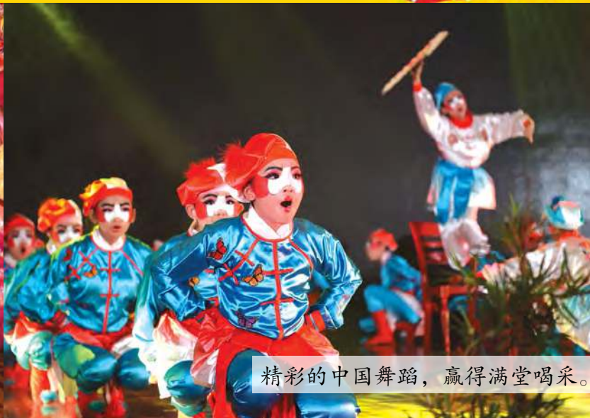
精彩的中国舞蹈，赢得满堂喝采。