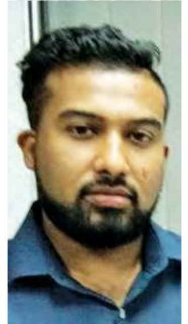
Story by K. Thaarsheeni

HEAVY vehicles parked by the roadside of Kampung Manis in Prai have been hindering the Seberang Perai Municipal Council (MPSP) from collecting rubbish at the dumpsite in the village.