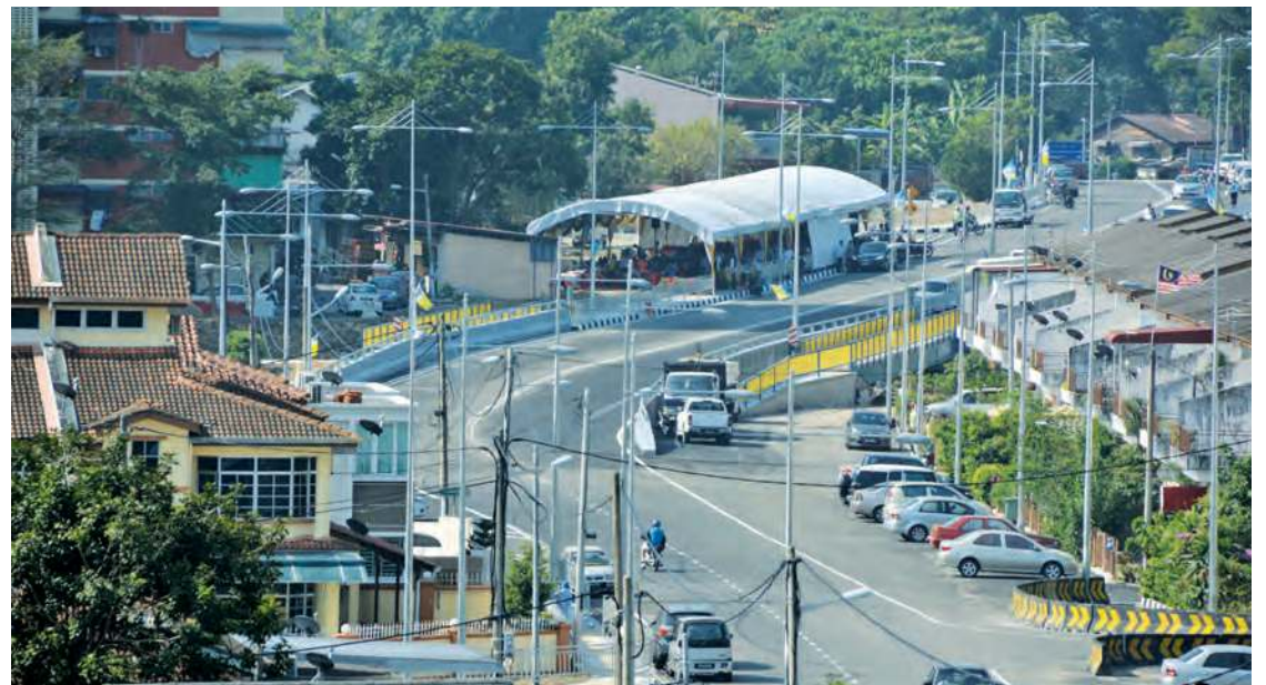
An aerial view of one section of Jalan Zoo that runs over Sungai Air Itam.

Lim said MBPP is also building an alternative 1.4km road project linking Bandar Baru Ayer Itam to