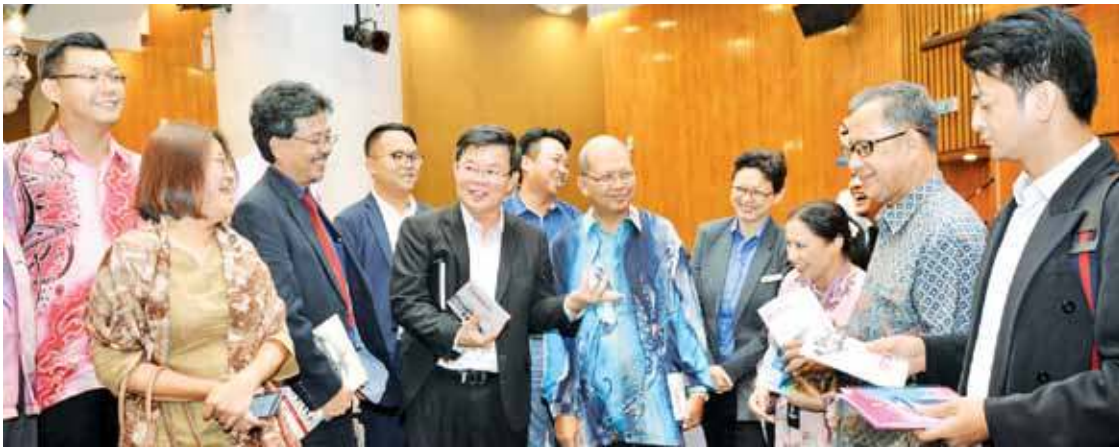
Chow (centre, in black coat) having a light moment with the elected state representatives and government officials in Komtar.