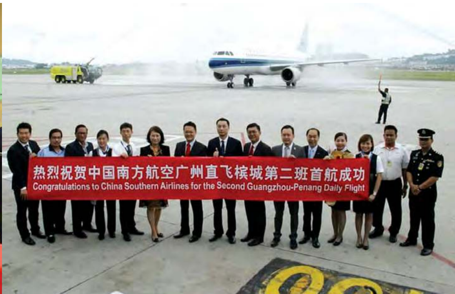
■为应付需求,中国南方航空从广州直飞槟城航班增加一班。