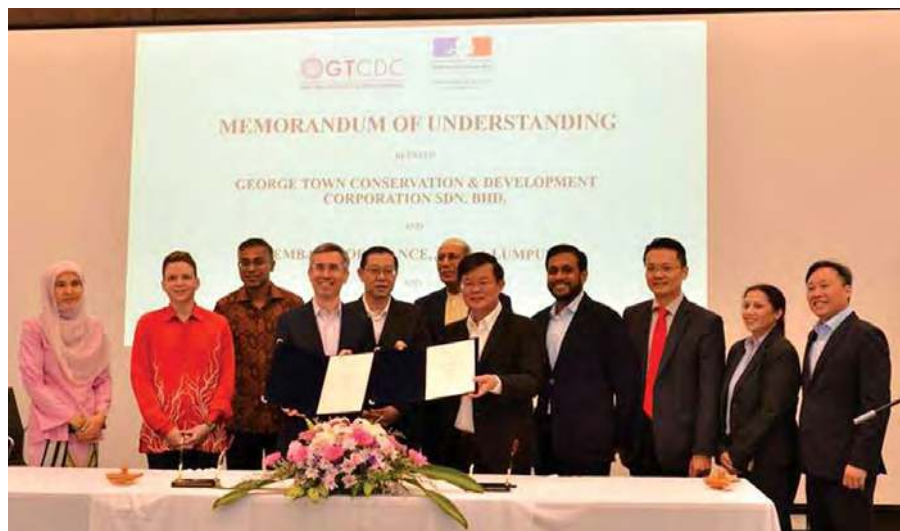
■ 槟州政府属下乔治市保存及发展机构与法国驻马大使馆签署备忘录后，槟首长曹观友与法国大使费德勒展示签署文件。见证者包括财政部长林冠英。

费德勒指出，法国希望能够与大马的新政府多方面合作，并促进双边文化交流，让双方关系更进一步。