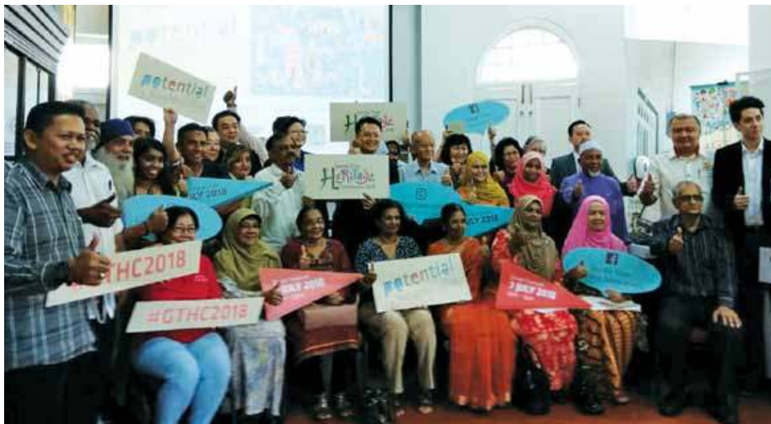
Yeoh (holding a placard) in a group photo with the event partners.

In 2008, George Town and Malacca were listed in the Unesco World Heritage Site and it was a very significant award for Malaysia.