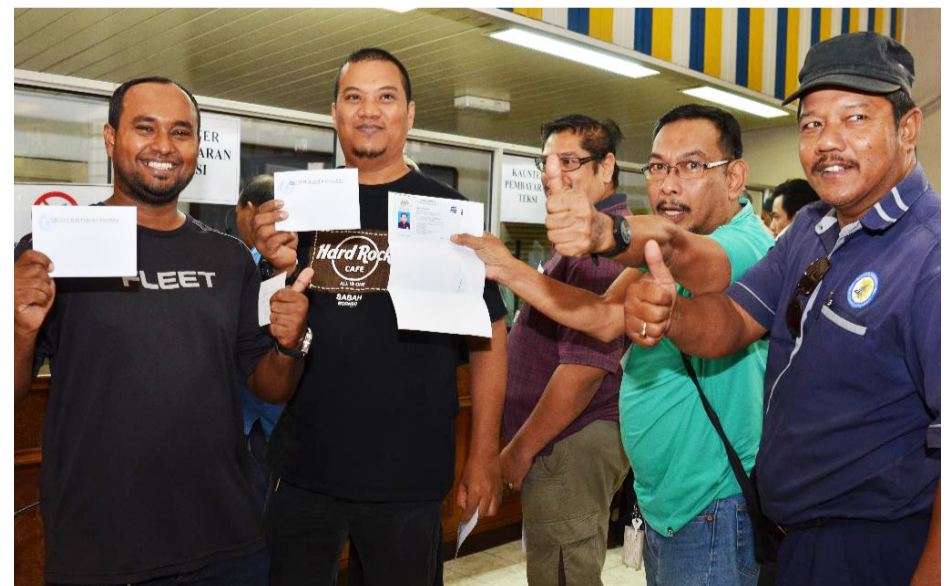
ஊக்கத்தொகை பெற்றுக்கொண்ட ஓட்டுனர்கள்

பிளாங்கிற்கு வருகையளிக்கு சுற்றுப்பயணிகளுக்கு வாடகைக்கார் முக்கிய பங்கு வகிக்கிறது. தரமான சேவையை வழங்குவதன் மூலம் சுற்றுப்பயணிகளின் வருகையை மேலும் அதிகரிக்க முடியும் என நம்பிக்கை தெரிவித்தார். பிளாங்கு மாநில அரசின் திறமையான நிர்வாகத்தால் இது சாத்தியமாகிறது என்பது குறிப்பிடத்தக்கதாகும்.