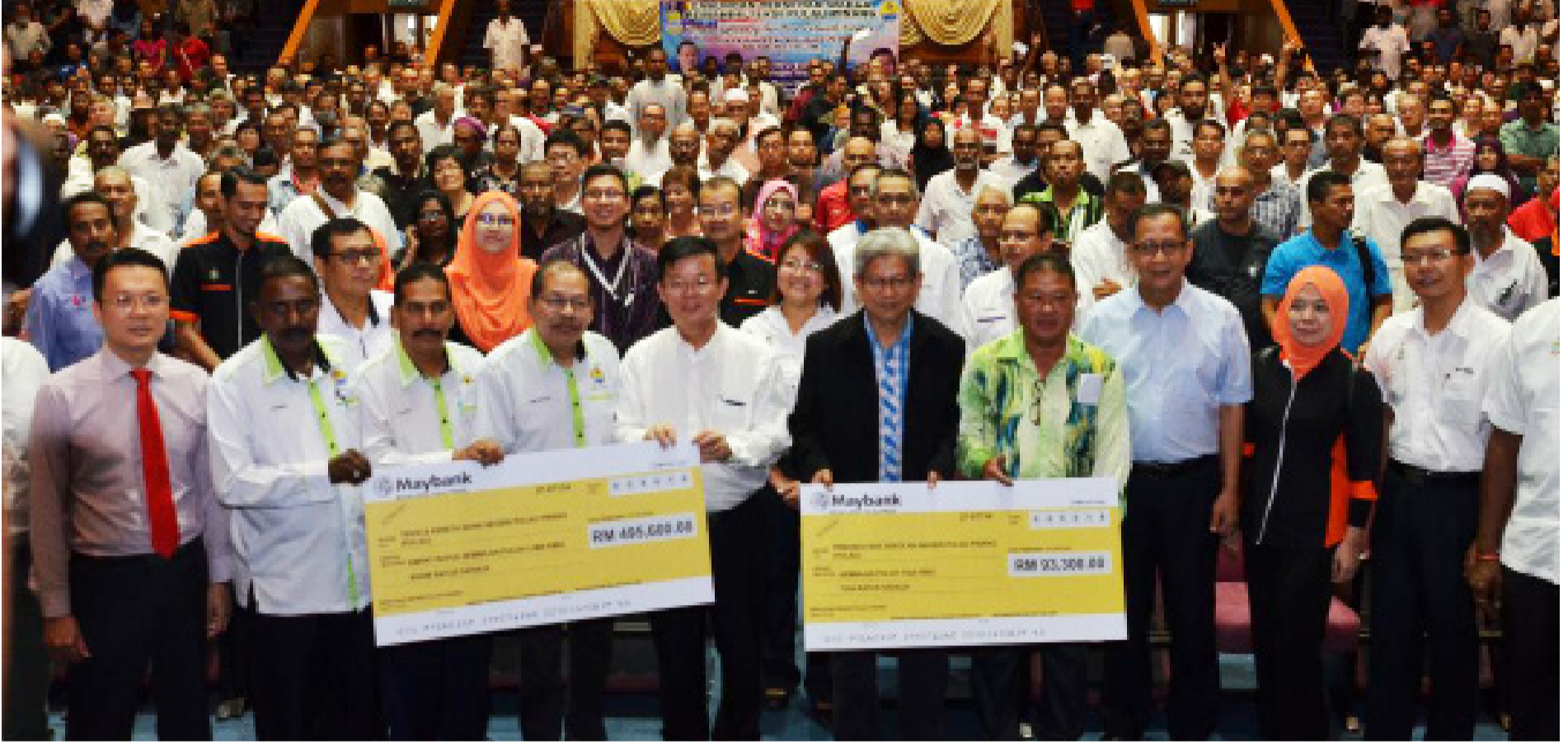
வாடகைக்கார் ஓட்டுனர் மற்றும் பள்ளி பேருந்து ஓட்டுனருக்கு ஊக்கத்தொகை வழங்கும் விழாவில் கலந்து சிறப்பித்தார் மாநில முதல்வர் மேதகு சாவ் கொன் யாவ் மற்றும் அரசியல் தலைவர்கள்.

பிளாங்கு மாநில வாடகைக்கார் மற்றும் பேருந்து ஓட்டனர்களின் சேவையும் பங்களிப்பும் அங்கீகரிக்கும் வகையில் மாநில அரசு ஒவ்வொரு ஆண்டும் ஊக்கத்தொகையாக தலா ரிம600-ஐ வழங்குகிறது. இரண்டாம் முறையாக வழங்கப்படும் இந்த ஊக்கத்தொகையைப் பெற்றுக்கொள்ள பேருந்து மற்றும் வாடகைக்கார் ஓட்டினர்கள் வருகை புரிந்தனர்.