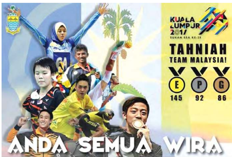
TAHNAH PARA ATLET PULAU PINANG YANG MENYUMBANG EMAS UNTUK TEAM MALAYSIA DI SUKAN SEA KUALA LUMPUR 2017