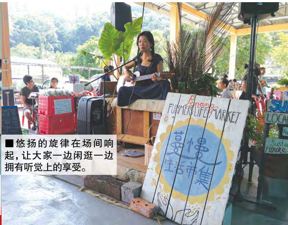
■ 悠扬的旋律在场间响起，让大家一边闲逛一边拥有听觉上的享受。