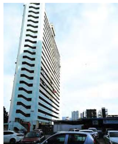
■五条路组屋组屋人口密集，民生问题会比其他地区多。