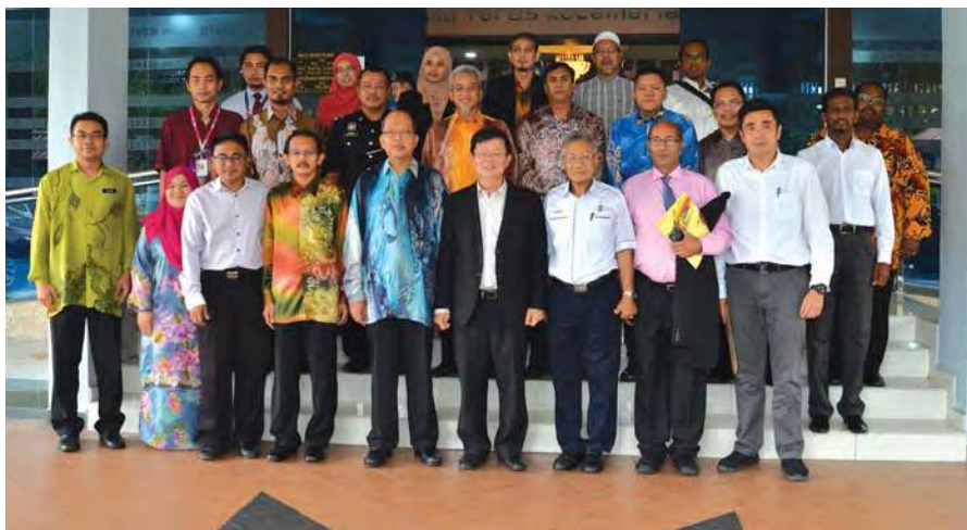
■曹观友巡视威南县土地局后,与出席者合影。

槟城首长曹观友巡视威南县土地局,聆听当局官员汇报该局的工作概要及行政方针,以确保该局跟上步伐,为当地民众带来更好的服务。