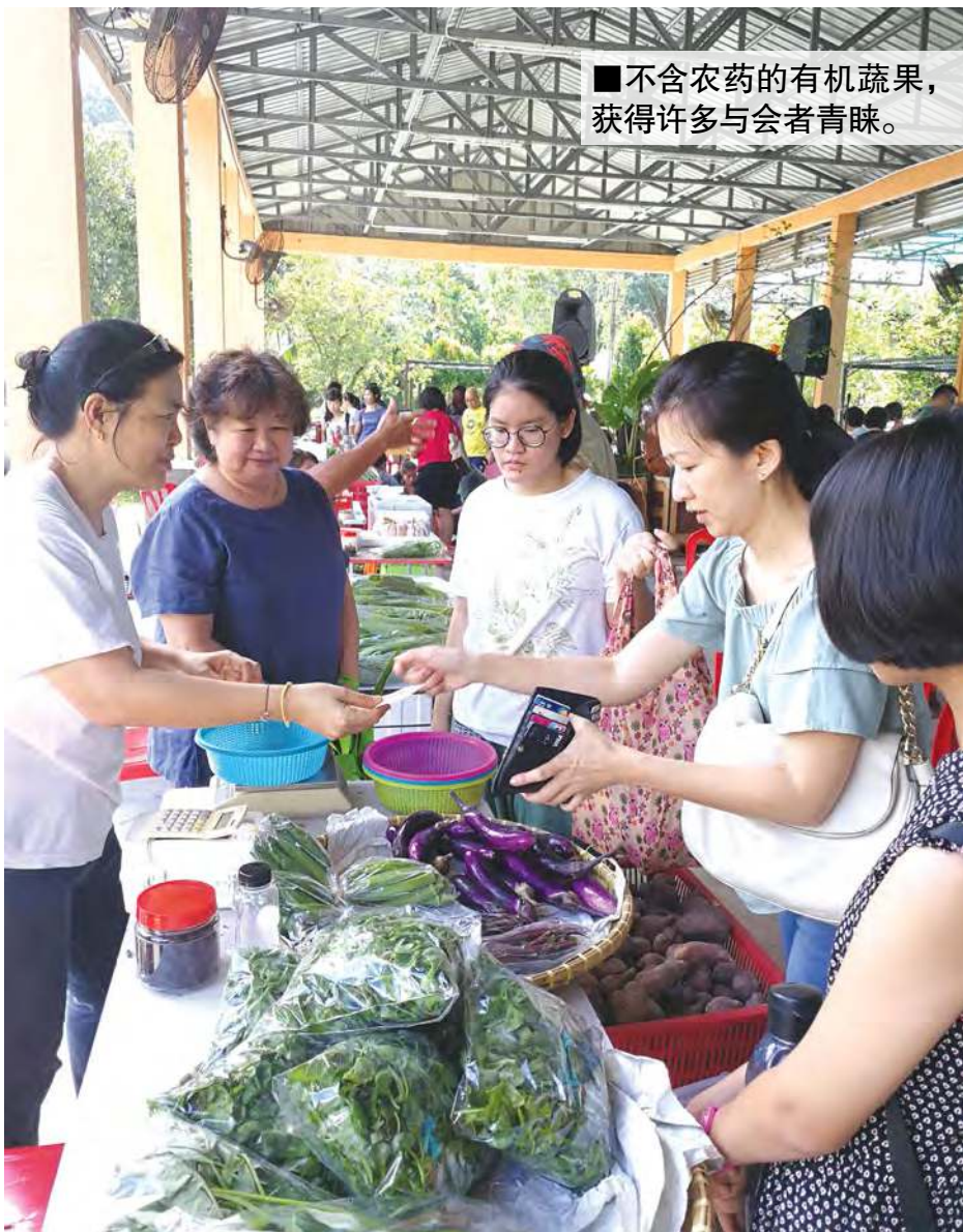
■ 不含农药的有机蔬果，获得许多与会者青睐。

欲知详情，可到脸书浏览Man Man Market 蔓慢市集网页，获取更多情报。