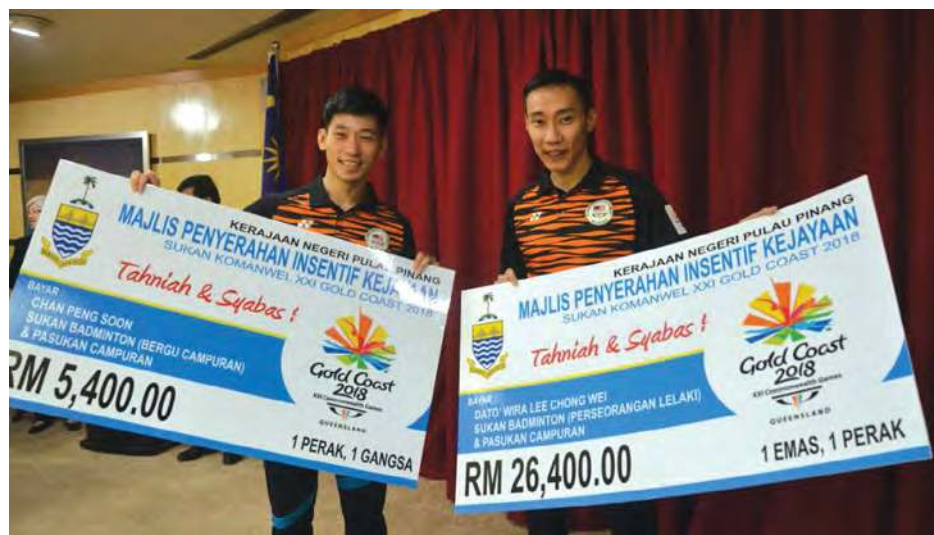
■李宗伟 (右) 与陈炳顺开心展示檳州政府奖励金。

与吴柳莹搭档拿下混双铜牌的陈炳顺，获得3000令吉奖励金，以及混合团体赛得银牌，获得2400令吉奖励金。一共获得5400令吉。