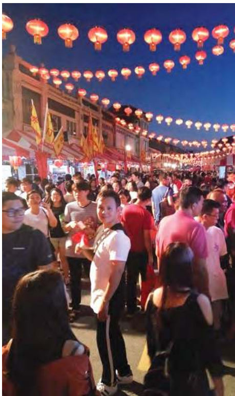
■ 槟城庙会深受欢迎，是农历新年重头节目。