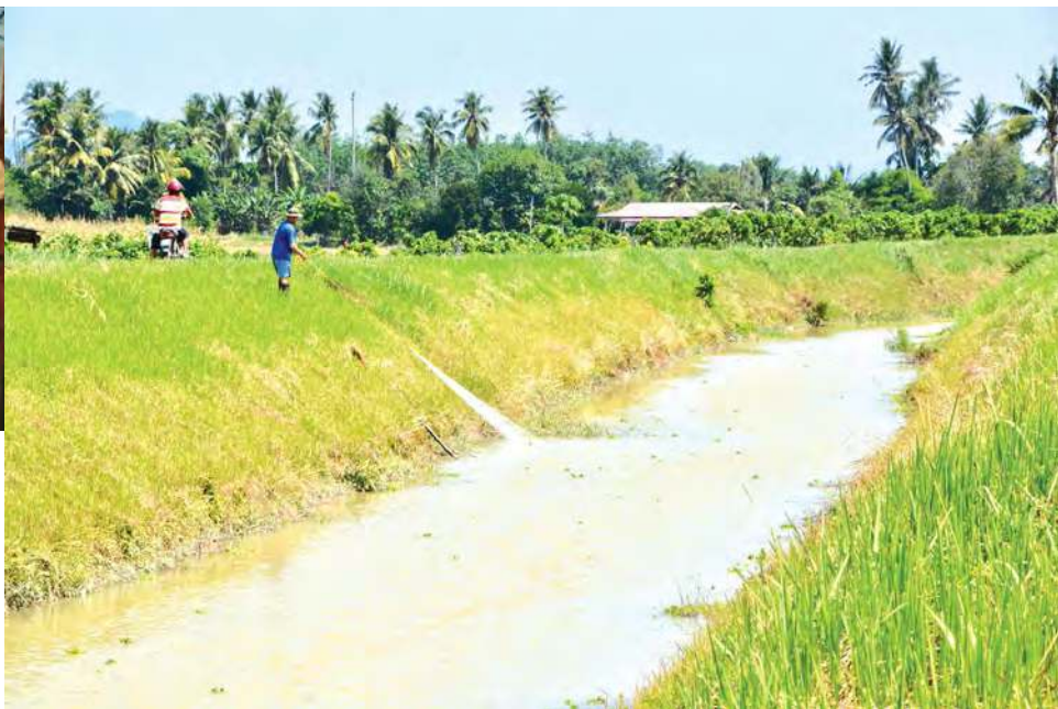
■ 槟榔东海民风纯朴，以务农为主要经济命脉。