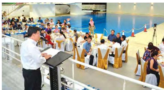
槟州业余游泳总会颁奖晚宴别开生面在池畔举行。