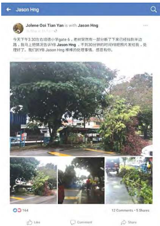
■民众在方美铼面子书留言感激后者高效率处理民生问题。