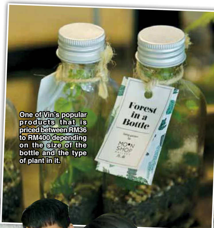
One of Vin's popular products that is priced between RM36 to RM400 depending on the size of the bottle and the type of plant in it.