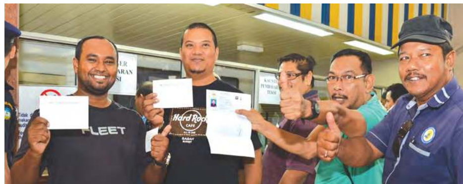
■ 受惠者高兴的举出大拇指, 称赞州政府政策。