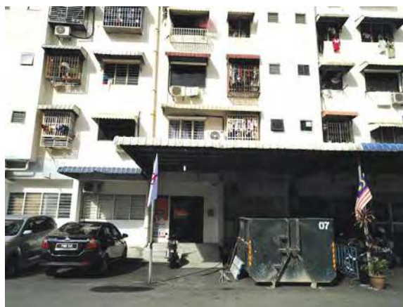
■魏子森服务中心设在五条路彩虹公寓第11座底楼。