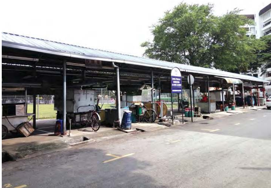
柔佛路小贩中心获市政厅批准增设遮篷。

他说，他已知会当地几个小贩业者有关申请获批事项，小贩们皆对市政厅的决定表示欢迎。槟岛市议员王宇航与市政厅代表均出席是次新闻发布会。