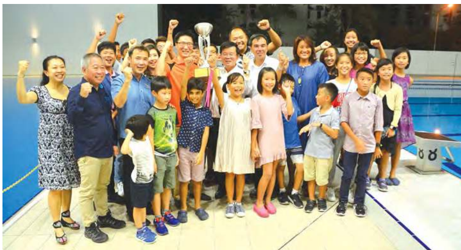
曹观友与获奖游泳选手开心合影。

集游泳池、脚车跑道及篮球场于一体的体育中心料将在明年动工， 槟城体育设施进一步提升！