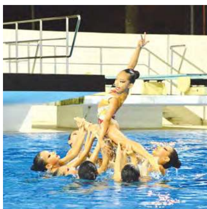
晚宴上呈献精彩韵律泳表演。