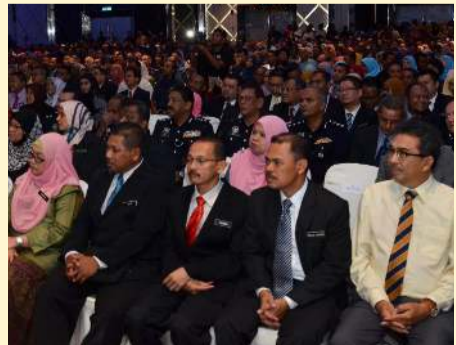
பிளாங்கு மாநில அரசு ஊழியர்கள்

பிளாங்கு மாநில அரசு பொது, தனியார் மற்றும் பொதுமக்கள் (PUBLIC, PRIVATE & PEOPLE PARTNERSHIP) நிலைப்பாட்டினை செயல்படுத்தியுள்ளது. இம்முன்றின் ஒத்துழைப்புடன்