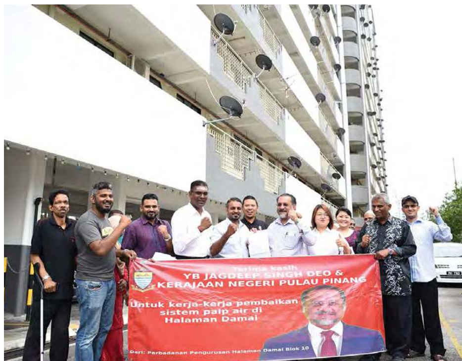
■ 居民拉布条感谢议员们为该组屋申请维修水管经费，减轻管理层负担。

槟州地方政府、房屋及城乡规划委员会主席佳日星指出，他将在未来注重槟州房产的三大领域，既解决槟州组屋维修基金和中央政府组屋维修基金重叠行程浪费问题、建议一马房屋维修基金易名和居者有其屋。