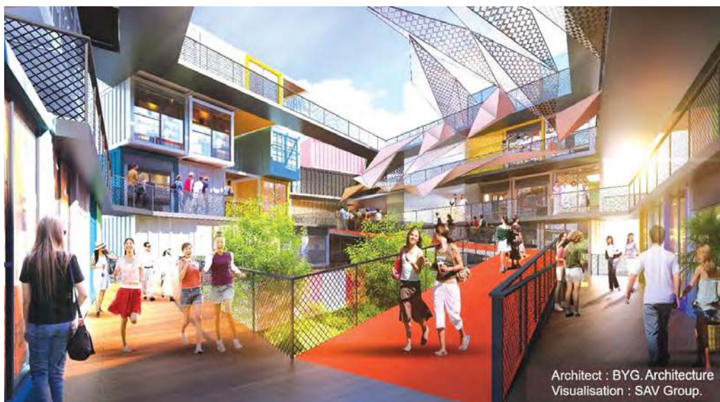
Architect : BYG Architecture Visualisation : SAV Group.