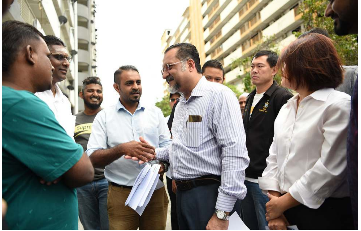
ஹலாமான் டாமாய் அடுக்குமாடி குடியிருப்பை நேரில் சென்று பார்வையிட்டார் ஆட்சிக்குழு உறுப்பினர் திரு.ஜெக்டிப்.

21.7 மில்லியன் செலவில் ஒதுக்கீட்டுடன் ஒப்புதல் கிடைக்கப்பெற்றுள்ளது. அவை, மின்தூக்கி பழுதுபார்த்தல் மற்றும் மேம்பாடு, 53 நீர் நிரப்பிகளின் விண்ணப்பத்திற்கான மேம்பாடு, 11 கூரைகள் மேம்பாடு என இவற்றில் அடங்கும்.