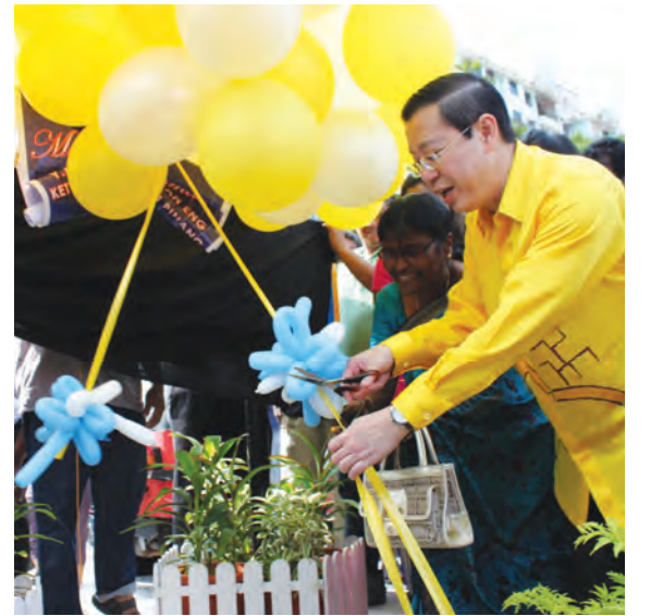
முதல்வர் லிம் குவான் எங் பலூன்களைப் பறக்கவிடுகிறார்.