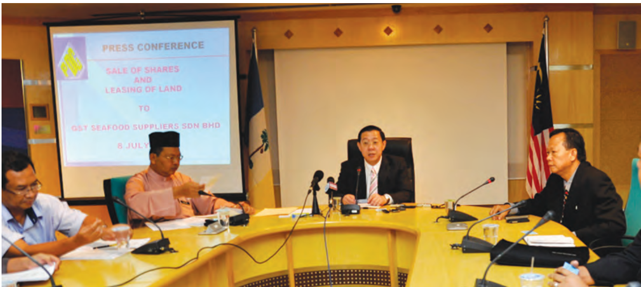
Chief Minister Lim Guan Eng at the Press Conference on the sales of shares and leasing of land.

According to Mr Lim, the decision by the PDC to divest from PDC Aquaculture is because aquaculture is