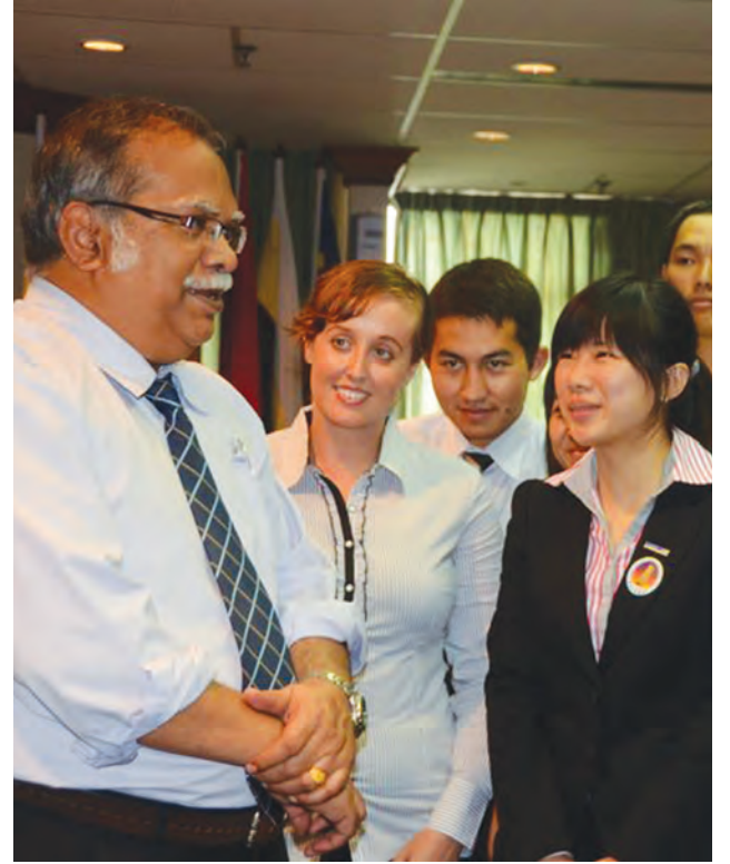
பேராசிரியர் மாணவர்களுடன் கலந்துரையாடலில் ஈடுபட்டிருந்தபோது.