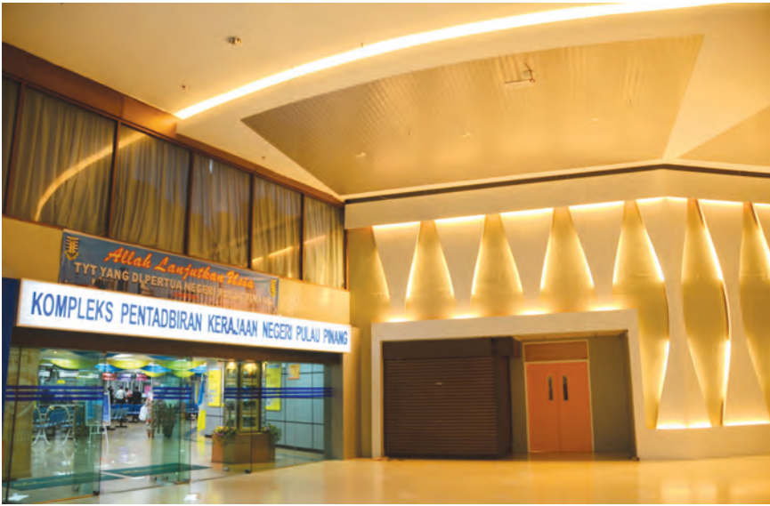
Level 3 of Komtar has been given a facelift.