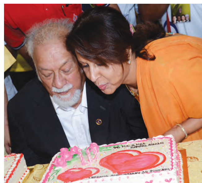
YB Karpal Singh, Member of Parliament for Bukit Gelugor and his wife celebrating their 41st wedding anniversary.