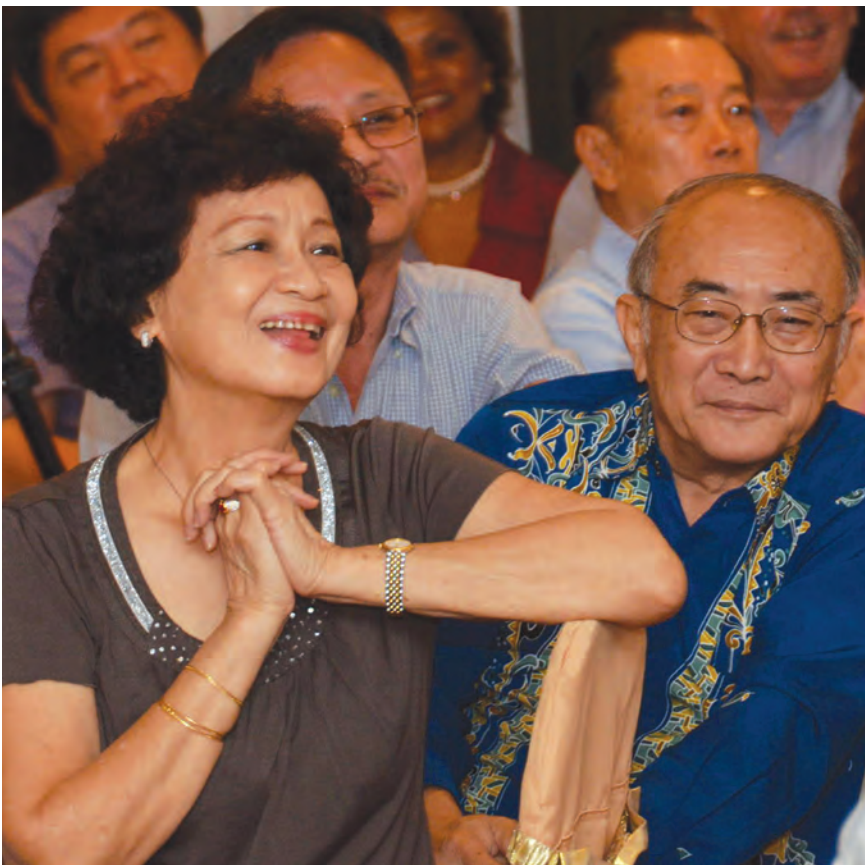
Members of Penang Club listening attentively to CM Lim Guan Eng's talk.