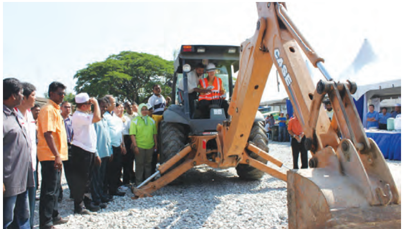
峇眼人民等了16年的峇眼民主城公园在林冠英主持动土仪式后，将增添一个休闲好去处。

（北海訊）峇眼人民等了16年，终于盼到由槟州首长林冠英宣布及主持动土礼的峇眼民主城公园后，耗资60万令吉的民主城公园计划通过私人界领养，预料将在今年9月竣工。