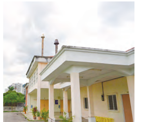
மின்சார மின்கடலை நிலையம்.