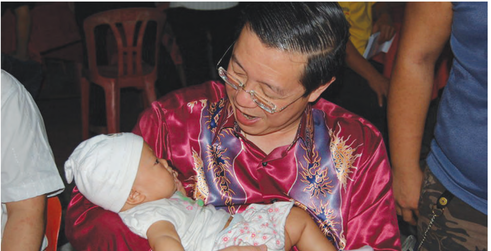
Chief Minister Lim Guan Eng with a baby.