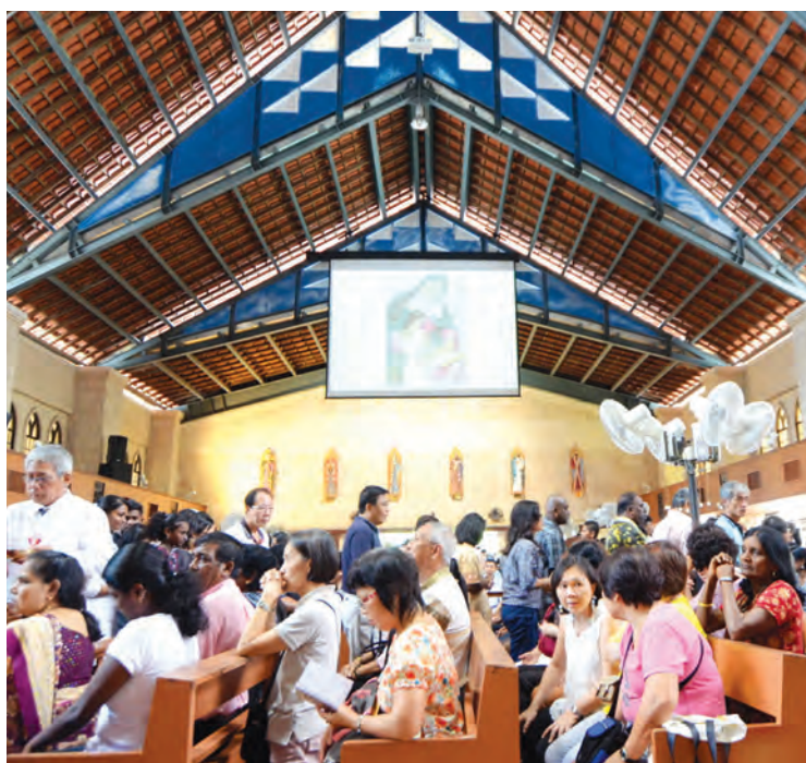
Catholics celebrating St. Anne's Feastday in Bukit Mertajam.