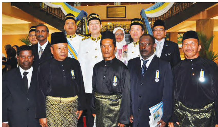
6名清沟英雄除下黄色制服，换上笔挺西装接受槟州元首封赐PBS勋衔，林冠英（后排中）亲自赞扬他们的默默付出，尤其是每天都执行常人做不到的3D工作。

槟州元首去年已封赐PBS勋衔给槟州市政局的清沟英雄，今年则是轮到威省市政局的清沟英雄。