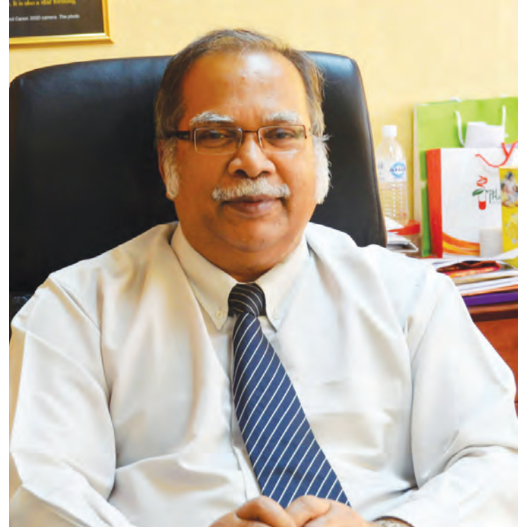
நாட்டிற்கும் கிடைத்த அரும் சொத்து. பேராசிரியர் அவர்களால் நாட்டிற்கும் பெருமை, நமக்கும் பெருமை!

இவ்வாறாக இனமான உணர்வுள்ள உலகத் தமிழர்கள் பெரும்பான்மையோர் பேராசிரியர் டாக்டர் பி. இராமசாமியை நன்கு அறிந்து வைத்துள்ளனர். பேராசிரியர் நமது மாநிலத்திற்கும்