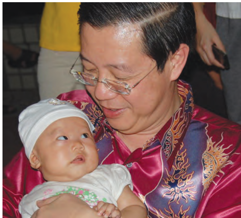
幼吾幼以及人之幼，秉持着亲民原则的林冠英温柔地把新生宝贝抱在怀中，而小宝贝则张着骨碌碌的眼睛仿佛在说：叔叔的怀抱很温暖哦。

他续称，槟州宝贝计划的资金来源与乐龄人士回馈金一样，都是槟州开源节流的成果，槟州推行的肃贪政策已经获国际透明组织表扬，而他将在州行政会议上提呈这项计划，预料每年将耗费500万令吉到1000万令吉。