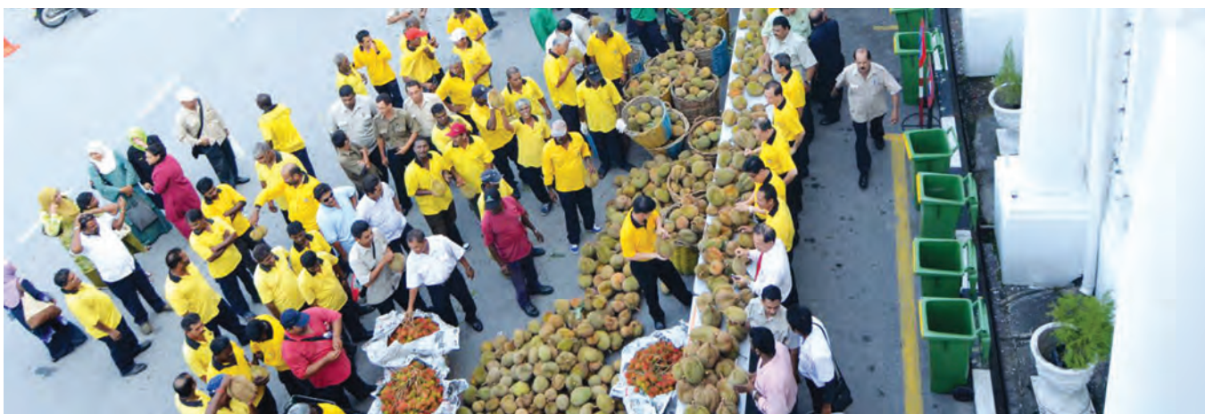
2,000 branded durians with mangosteens and rambutans.