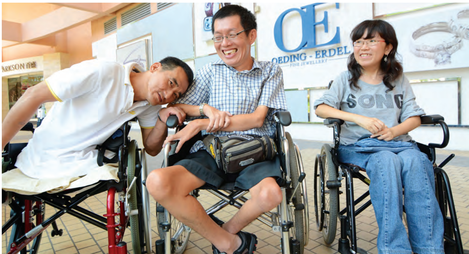
They are all smiles.