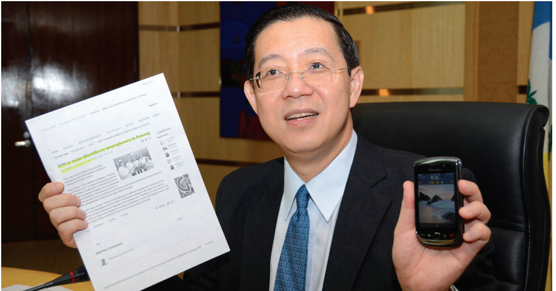
CM Lim with the news and his own BlackBerry.

FROM July 2011 onwards RIM is manufacturing smartphones from the BlackBerry portfolio in Penang for the world market.