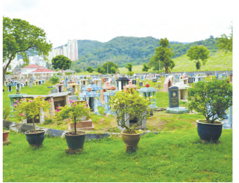
மயானத்தை அலங்கரிக்கும் பூச்சாடிகள்.