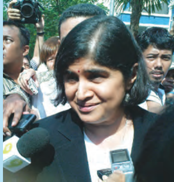
பெர்சே தலைவர் டத்தோ டாக்டர் அம்பிகா சீனிவாசன்

கடந்த சனிக்கிழமை ஜூலை 9-ஆம் திகதியன்று கோலாலம்பூரில் நிகழ்ந்த பெர்சே பேரணி மலேசிய வரலாற்றில் பதியப்பட வேண்டிய சரித்திர நிகழ்-வாகும். மலேசியாவின் புதியதொரு விடியலுக்கு இந்தப் பெர்சே பேரணி அடித்தள மிட்டுள்ளது. பல தடைகளையும், அச்சுறுத்தல்களையும் மீறி தலைநகரில் கூடிய பெர்சே பேரணி, மக்கள் அரசியலில் விழிப்புணர்வு பெற்று தெளிவடைந்து விட்டனர் என்பதனைத் தெள்ளத் தெளிவாக உலகிற்கு எடுத்துரைக்கின்றது.