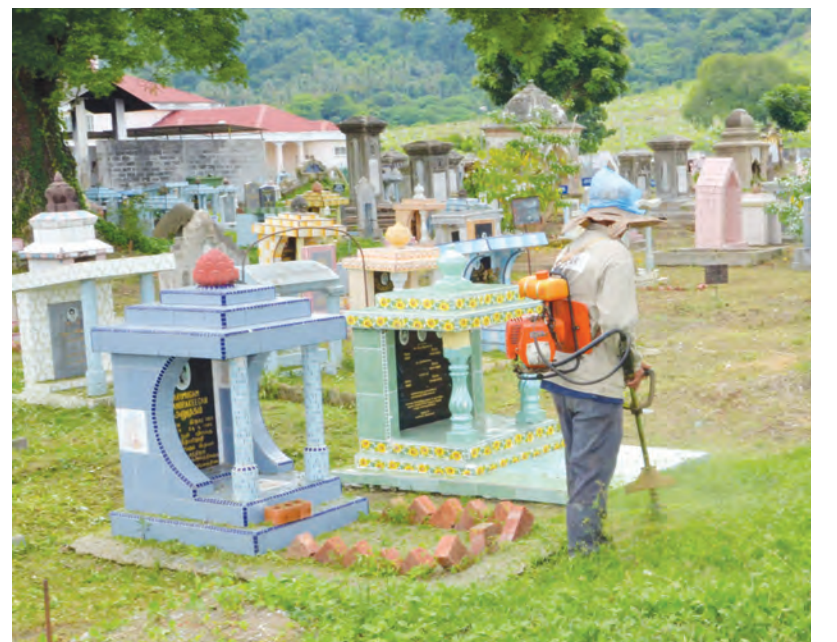
மயானத்தை அலங்கரிக்கும் பூச்சாடிகள்.