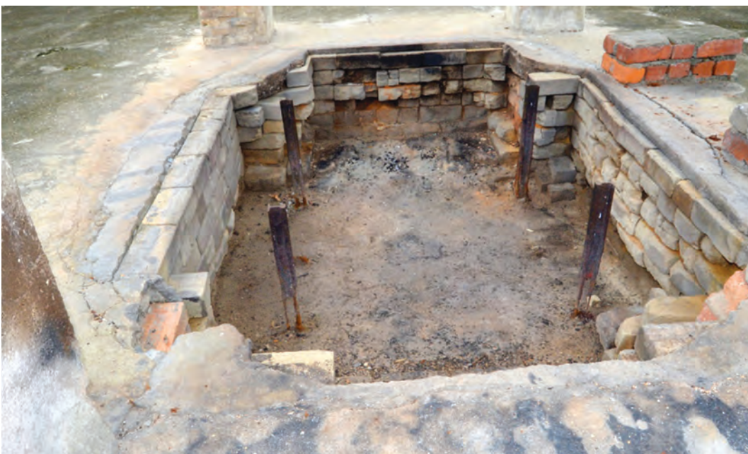
பாரம்பரிய முறையிலான கட்டைகளால் எரிக்கப்படும் இடம்.