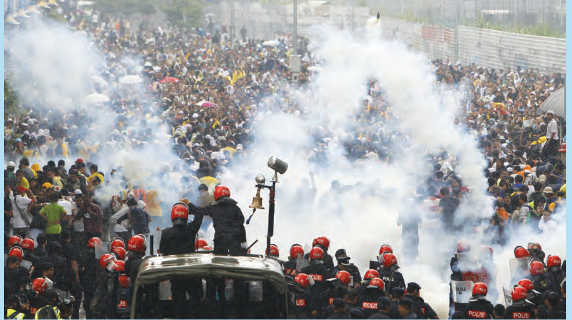
காவல் துறையினர் கண்ணீர் புகை குண்டுகளை பெர்சே ஆதரவாளர்கள்மீது வீசும் காட்சி

பெர்சே தேசிய முன்னணிக்கு எதிராக செயல்படும் அனைத்து சிலர் பரப்புரைகள் மேற்கொண்டு வருகின்றனர். உண்மையில் பெர்சே, தேசிய முன்னணிக்கு எதிரான அமைப்போ மக்கள் கூட்டணிக்கு ஆதரவான அமைப்போ கிடையாது.