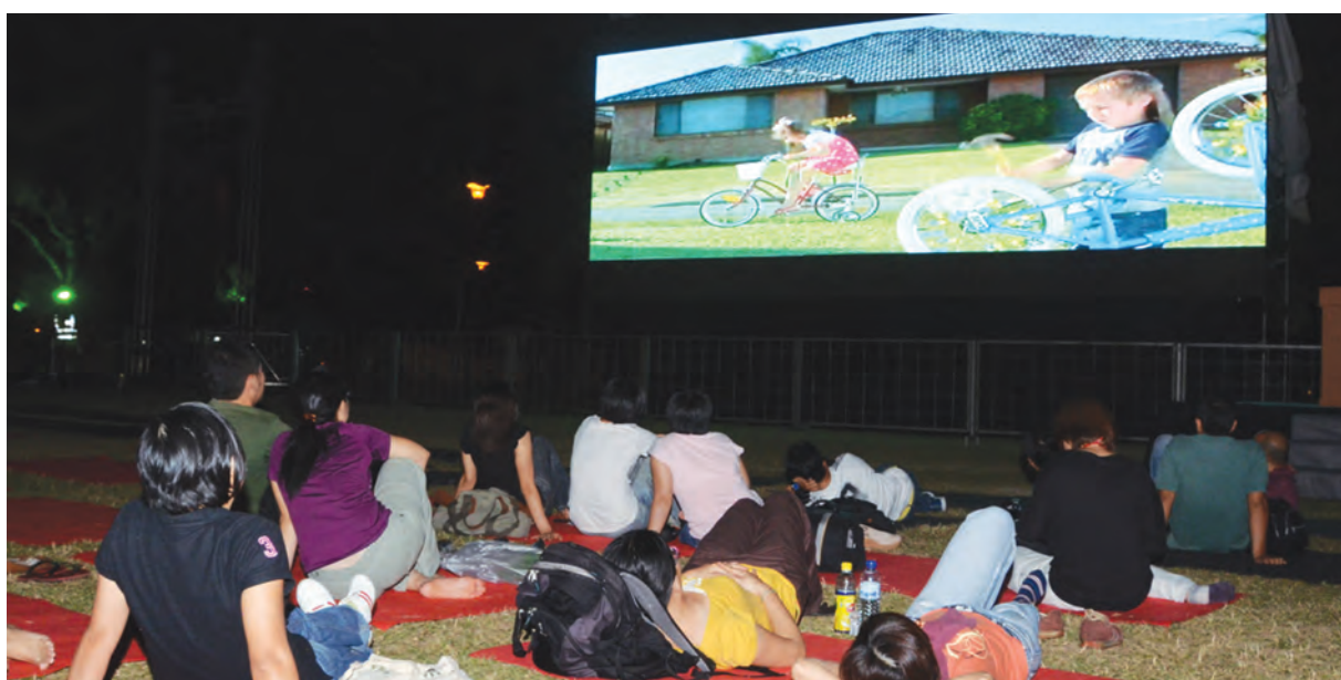
A group of reporters enjoying Tropfest at the grounds of the Esplanade.