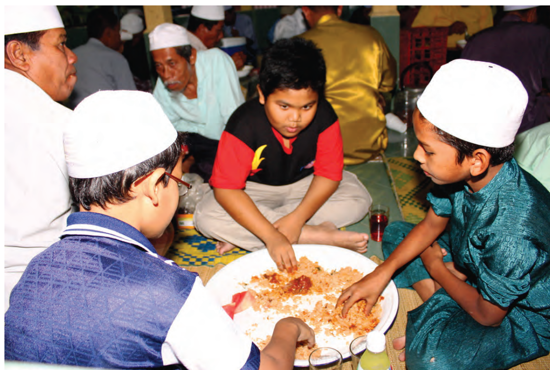
Children breaking fast together at Masjid Tuan Samad, Permatang Sungai Dua, Penang.