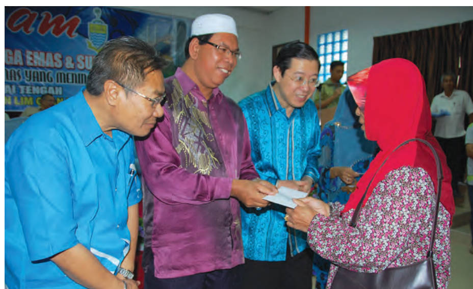
YB Dato Mansor Othman, Deputy Chief Minister I, YB Dato' Salleh Man, State Assemblyman and Chief Minister Lim Guan Eng.

According to the Transparency International, the Penang administration is the first Malaysian state government to implement the open tender system for