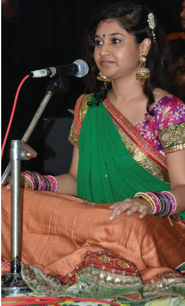
இசைக்கச்சேரி வழங்கும் நுண்கலை கோயில் மாணவி

முதல்வர், துணை முதல்வர் இருவரோடு இணைந்து வருகை புரிந்திருந்த பிரமுகர்கள் விழா இடத்தினை பார்வையிட்டனர். நிகழ்வின் மற்றொரு முக்கிய அங்கம் பாரம்பரிய உணவுகளே. உணவுகளை விற்பனை செய்ய பல கடைகள் அமைக்கப்பட்டிருந்தன. ஒவ்வொரு கடைகளையும் பார்வையிட்ட முதல்வர் வியாபாரிகளோடு உரையாடத் தவறவில்லை. பல கடைகளுக்கு மத்தியில் அமைக்கப்பட்டிருந்த இடியாப்பம் விற்கும் கடை பலரின் கவனத்தை கவர்ந்தது. இடியாப்பம் செய்வதை நேரடியாக மக்கள் காண அக்கடை வகை செய்தது. அக்கடைக்கு வந்த முதல்வருக்கு இடியாப்பம் பிழிந்து காட்டப்பட்டது. இடியாப்பம் செய்யும் முறையை முதல்வருக்கு துணை முதல்வர் மிக அழகாகச் செய்து காட்டியது அனைவரையும் புன்னகைக்கச் செய்தது எனலாம். மாநில முதல்வரும் துணை முதல்வரும் இவ்வாறு மக்களோடு ஒன்றிணைந்துப் பழகியது மாநிலத்தில் நிலவும் சிறந்த நல்லிணக்கத்தினையே காட்டுகின்றது.