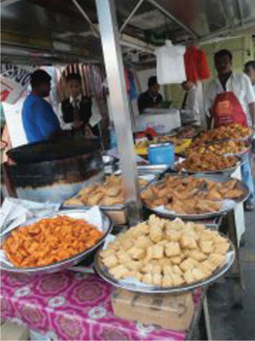
உணவுகளைச் சோதனையிடும் சுகாதார அலுவலக அதிகாரிகள்

பினாங்கு மாநில வடகிழக்கு மாவட்டச் சுகாதார அலுவலகம் பினாங்கு தீவின் நகராண்மை கழகத்தோடு இணைந்து சந்தை வீதியில் (Market Street) உணவகங்கள், உணவு கடைகள் ஆகியவற்றில் பராமரிப்பிற்கானச் சோதனை நடவடிக்கையில் ஈடுபட்டது.