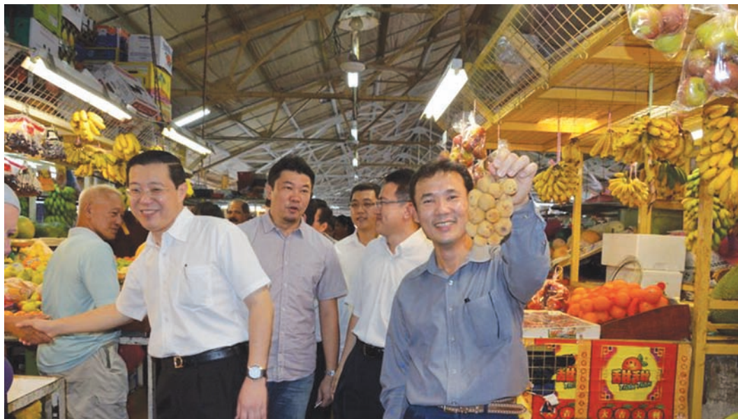
The Pulau Tikus market is a vibrant, crowded and very popular morning market in Penang.

An eye-catching modern signage greets people while the cleanest toilets, labelled as “five-star” toilets are found in this