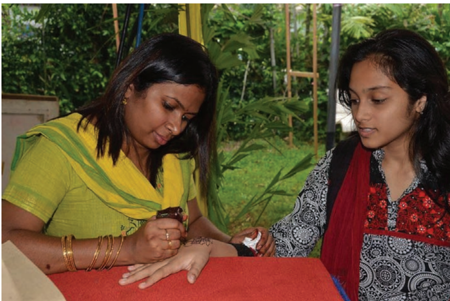
வருகையாளர் ஒருவர் மருதாணி இட்டுக்கொள்கிறார்.

இன்றைய நாளில் உலக அளவில் கிளைகள் கொண்டு இந்திய பாரம்பரிய நடனங்களையும், இசையினையும் கற்றுக் கொடுப்பதிலும் மக்களிடம் பரப்புவதிலும் சிறந்து விளங்குமிடம் நுண்கலை கோயில் அல்லது ‘தெம்பள் ஆப் பைன் ஆர்ட்ஸ்’