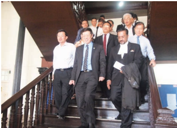
Press Conference Statement by the Executive Council of the State of Penang, in George Town on 15 December 2011.

The High Court's Judgment Against the Publisher of Utusan Malaysia Shows that Utusan Malaysia's Coverage was Malicious, Intended to Mislead Readers and Made in Bad Faith, and Proves that the Penang Chief Minister, the DAP and the Pakatan Rakyat State Government are Not Anti-Malay or Anti-Islam