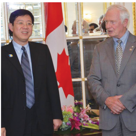
加拿大总督大卫约翰斯顿（右）拜访槟城时表示，加拿大有意与槟州合作以促进两国在旅游、教育、文化、以及贸易上的关系，他同时赞扬槟州在古迹保育方面做得够全面。旁为槟州首长林冠英。