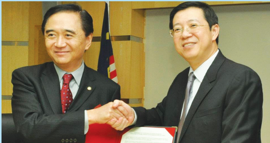
林冠英（右）代表槟城与代表日本神奈川县的知事黑岩祐治签署联合声明，共同促进繁荣。

日本神奈川县知事黑岩祐治于11月21日率领代表团与由槟州首长林冠英为首的槟州政府签署联合声明，双方承诺继续加强双边关系的决心、加强管理和科技领域的合作，维持双方的互相认知和理解，加强人民关系、文化、文物和旅游及各人文领域，包括教育、青年职业培训和人类资源开发、继续促进两地，以及整个亚洲地区互惠互利的信任和信心。