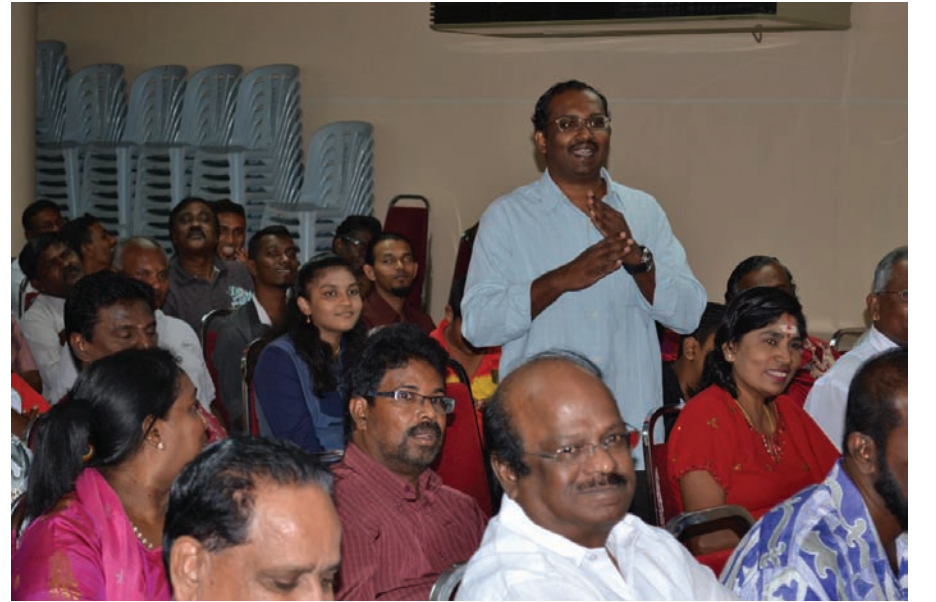
நிகழ்வில் கலந்துகொண்ட ஒரு பகுதியினர்