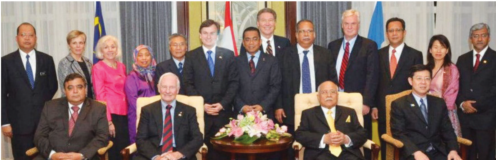
由加拿大总督大卫约翰斯顿（前排左2）率领的加拿大官访团礼貌拜会槟州元首敦阿都拉曼（前排右2），同时获得由槟州首长林冠英（前排右1）率领的槟州代表团的热切招待。