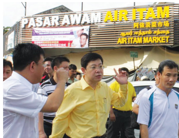
The upgraded Air Itam market

And to cheers from all present, especially the market traders and hawkers, CM Lim promised: “The Penang state government will continue its efforts to upgrade infrastructure and basic amenities for the people.”