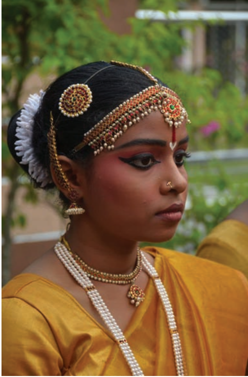
பாரம்பரிய நடன உடையில் நடனப் பெண்மணிகள்

“கலை, மனிதனாகப் பிறந்த அனைவரும் அள்ளி அள்ளி பருக வேண்டிய அமிர்தம்” ஆழ்ந்த கருத்துகளை உணர்த்திடும் உண்மையான வரிகள் இவை. இயந்திரம் போன்ற வேலை, இனிமையற்ற வாழ்வு என இன்றைய வாழ்க்கை நிலை சென்றுக் கொண்டிருக்கையில் மனிதனைத் தன் இன்னல், சோகம், குறைகள், ஆகியவற்றில் இருந்து சற்றே மீள் செய்து புத்துணர்வு பெறச் செய்யும் சக்தி கலைக்கு உண்டு. இதனால்தான் நம் முன்னோர்கள் இயல், இசை, நாடகம் ஆகியவற்றிற்குச் சங்க காலம் தொட்டு முன்னுரிமை தந்து வந்துள்ளனர்.