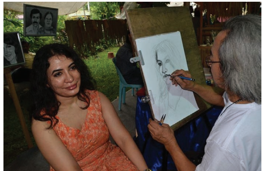
நேரில் அமர வைத்து ஓவியம் வரையப்படும் காட்சி

“இசை, கலை, கலாச்சாரத்தின் மீது கொண்ட காதலினால் அமையப் பெற்ற இவ்வமைப்பு, சமயம், இனம் போன்ற பிரிவுகளைக் கடந்து, பல்லினங்களையும் ஒன்றிணைத்து செயல்பட்டு வருகிறது. இதனால் தான் இன்று இந்த நிகழ்வில் சில முஸ்லிம் பொது இயக்கங்களும் கலந்துகொண்டுள்ளன. இது இந்தியக் கலைகளின் இன, மதபேதமற்ற வாழ்வியலைக் காட்டுகிறது. இக்கூற்று நமது ஜோர்ஜ்டவுன் நகருக்கும் பொருந்தும். ஏனெனில், கடந்த 200 ஆண்டுகளாகப் பல தரப்பிலிருந்து தொந்தரவுகள் வந்தபோதிலும் இங்கு மக்கள் சுமுகமான, ஒற்றுமையான வாழ்வினையே வாழ்கின்றனர்.”