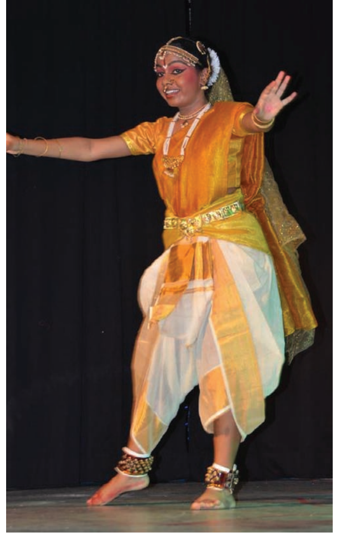
வருகையாளரைக் கவர்ந்த இந்தியர்களின் பாரம்பரிய நடனம்

கோயிலின் பாடகர்கள். குழுவாக அமர்ந்து ஒருமித்த குரலில் அவர்கள் பாடிய வேளையில் பாடலுக்கு ஏற்ற இசையினை இசைக்குழுவினர் வழங்கினர். சற்றே விறுவிறுப்பான துள்ளல் மிகுந்த இசைப்பாடலை இறுதிப் பாடலாக அக்குழுவினர் பாடுகையில், அதுவரையில் தங்களது ஆர்வத்தினைக் கட்டுப்படுத்தி அமர்ந்திருந்த அமைப்பின் மாணவர்கள் தங்களையும் மறந்து அபிநயம் பிடித்து ஆடத்தொடங்கினர். தாளத்திற்கு ஏற்ற அபிநயம் பிடித்து அனைவரின் கைதட்டல்களையும் வாங்கிச் சென்றனர் அம்மாணவர்கள்.