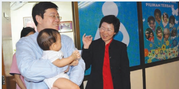
州府位于光大47楼的母乳喂哺室在槟州首长林冠英（左）主持开幕礼后正式启用，公务员无需再到厕所挤奶或哺乳。右为王国慧。

州府位于光大47楼的母乳喂哺室在槟州首长林冠英主持开幕礼后正式启用，公务员无需再到厕所挤奶或哺乳，反而可以舒服地在沙发上挤奶后再储存在准备好的冰箱，以保持母乳新鲜。