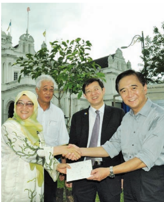
日本神奈川县县长黑岩祐治（右1）在官访槟城时，在槟州首长林冠英（右2）、槟州行政议员彭文宝（左2）以及槟岛市政局主席芭达雅（左1）的陪同下，在旧关仔角大草场栽种象征两地友好关系的友谊之树。黑岩祐治也说，在看到槟城良好地保留许多珍贵的古迹后，他会把该讯息带回日本，希望神奈川县的三浦半岛鎌仓市能向槟城取经，晋身世遗名列。