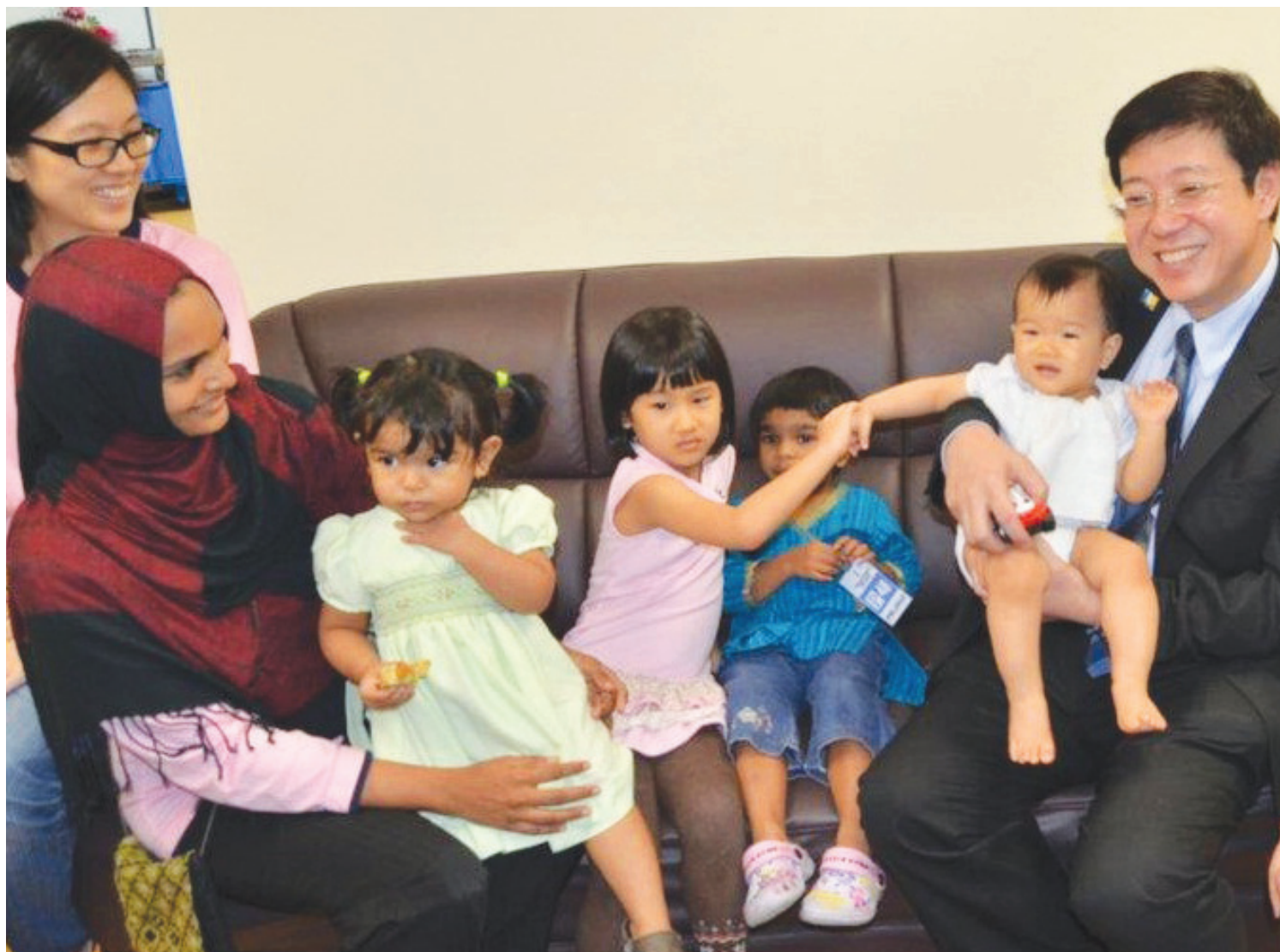
林冠英(右1)为新生宝宝捎来“金喜”，凡在2011年1月1日当天或之后出生的槟州宝宝父母都可申请槟城宝贝计划200令吉补贴金，首批补贴金将于2012年1月1日开始发放。

“自从执政槟城之后，槟州的财务每年均有盈余，在2008年，我们的财政盈余是8800万令吉，2009年则是7700万令吉，以及2011年的3300万令吉。槟城州政府良好的财务管理、廉洁及反贪的努力，也获得了总稽查司及国际透明组织的认可及表扬。”