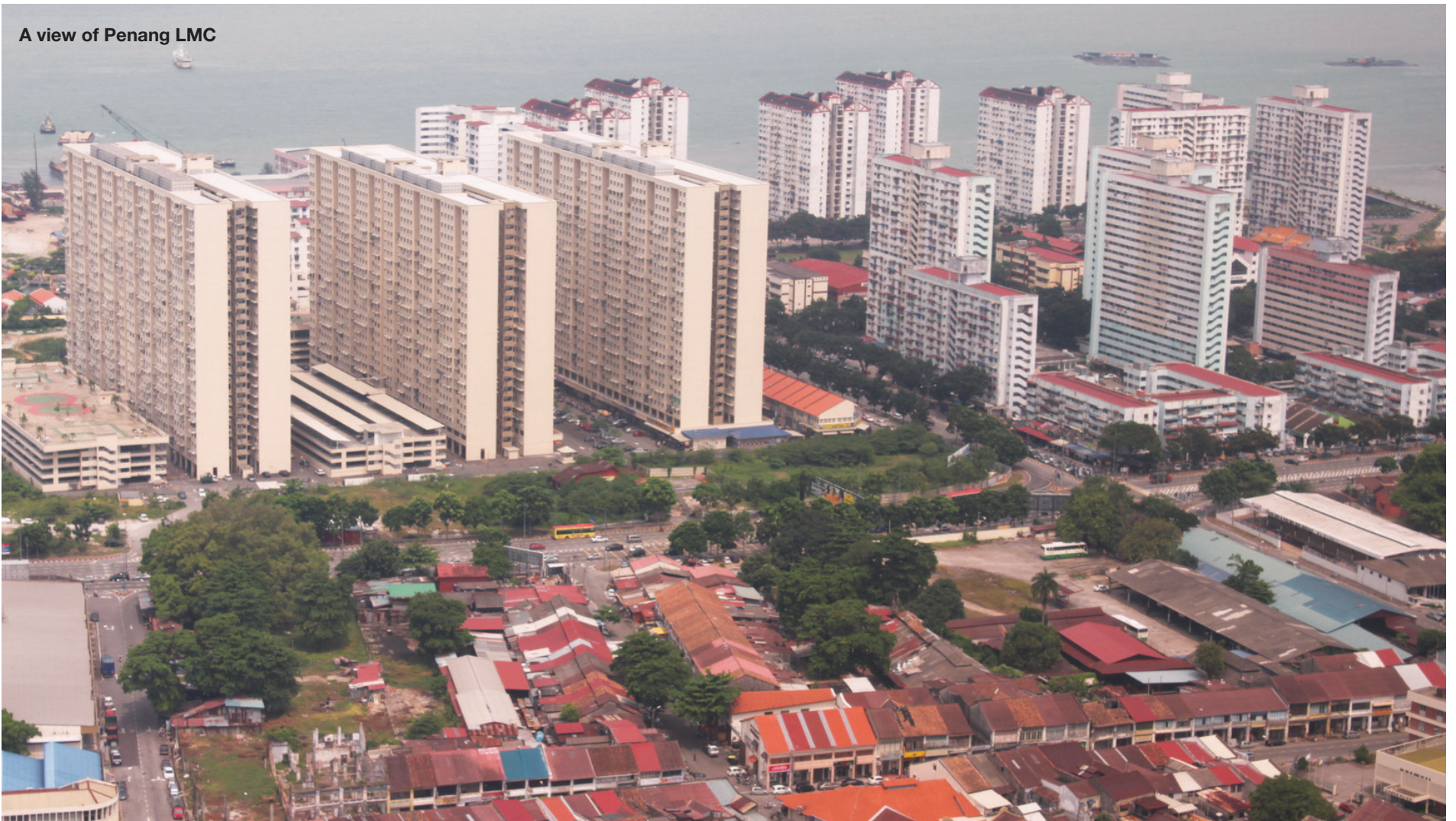
A view of Penang LMC