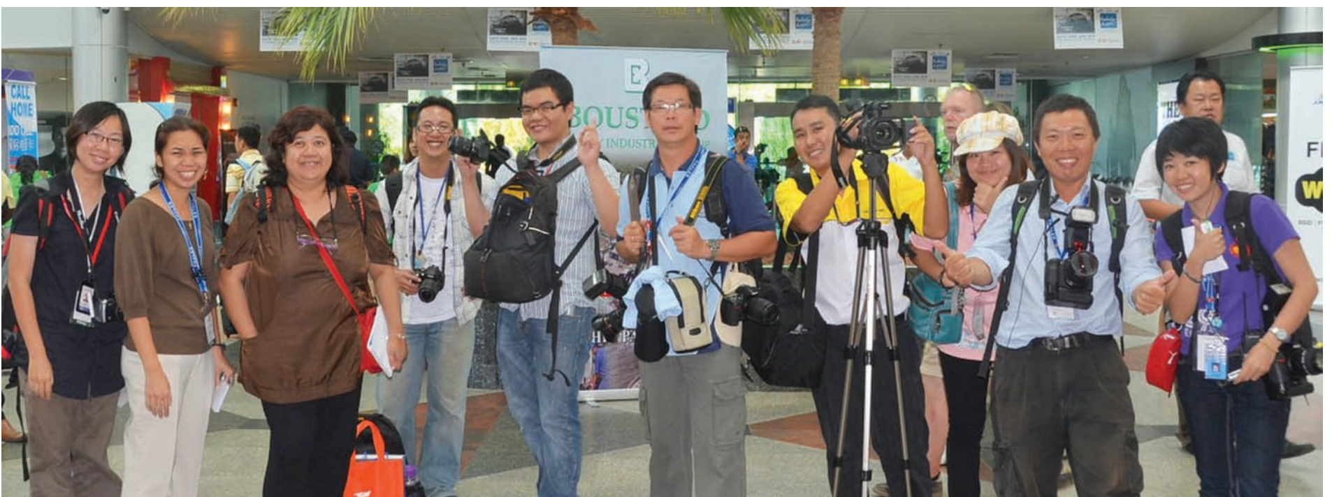
'Members of the media from Penang and Kedah at the Langkawi International Airport'