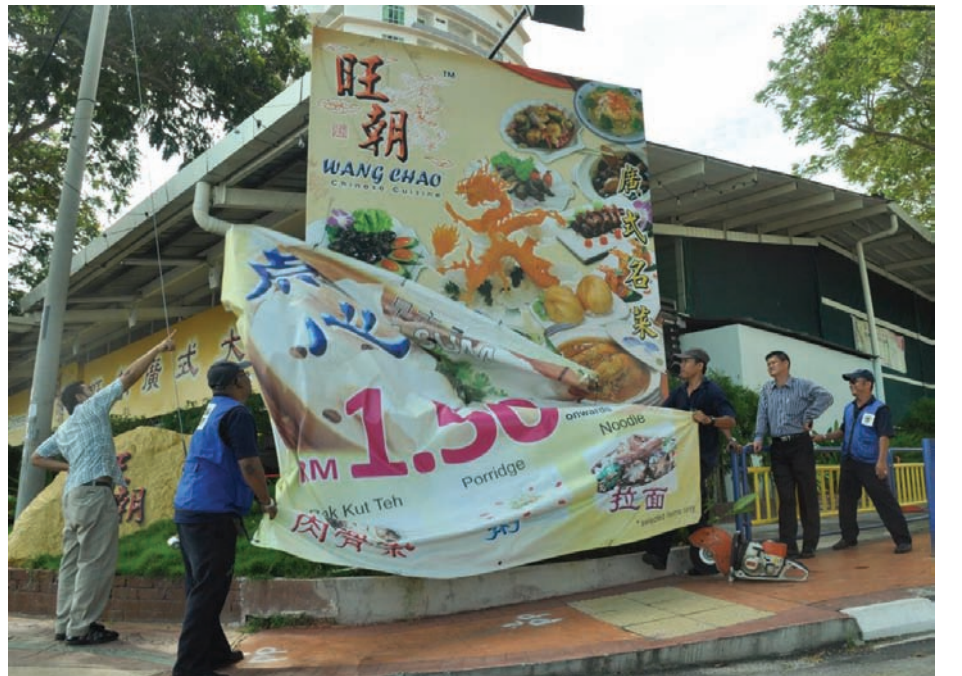
நடவடிக்கையில் ஈடுபடும் நகராண்மை கழகத்தினர்

பதாகைகள் மட்டுமின்றி உரிமம் இல்லாத விளம்பரப் பலகைகளும் அடையாளங் காணப்பட்டு வருகின்றன. பினாங்கில் சுமார் நூற்றுக்கும் மேற்பட்ட விளம்பரப் பலகைகள் உரிமம் இன்றி அமைக்கப்பட்டுள்ளன என தெரிய வந்துள்ளது. அவற்றை அகற்றும் நடவடிக்கையில் பினாங்கு தீவின் நகராண்மை கழகம் தற்போது ஈடுபட்டுள்ளது.