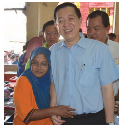
Chief Minister Lim Guan Eng gets a hug during his walkabout at the Jelutong market