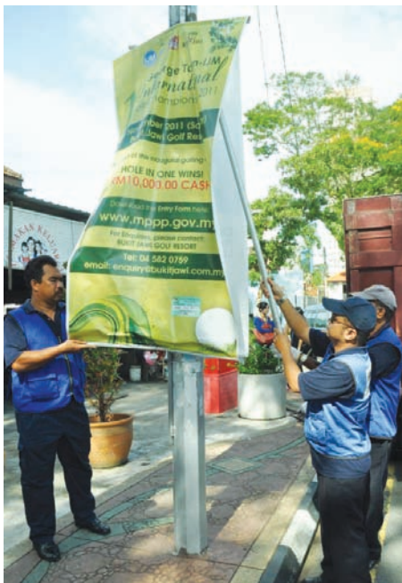
MPPP enforcement officers removing illegal banner

Ong: Up to September 2011, the MPPP has taken down 54,057 streamers. It means that the MPPP has lost RM1,090,140 in terms of permit fees. In 2010, 58,994 streamers were removed and the MPPP lost a total of RM1,179,880.