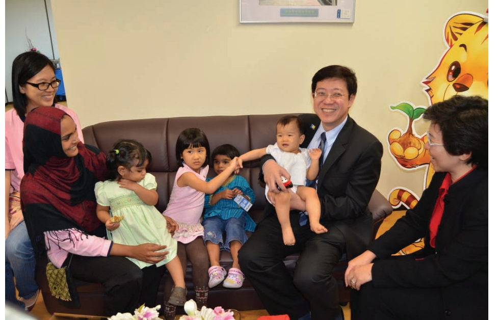
குழந்தைகளுடன் மாநில முதல்வர் திரு. லிம் குவான் எங்

பிணங்கு மாநில மக்கள் கூட்டணி அரசாங்கம் பிறந்த குழந்தை முதல் முதியவர் வரை அனைத்துத் தரப்பினர் நிலையிலும் அக்கறை செலுத்தி வருகிறது என முதல்வர் செய்தியாளர்களிடம் தெரிவித்தார். வருங்காலங்களில் இதுபோன்ற தாய்ப்பால் கொடுக்கும் அறைகள் அனைத்துத் துறைகளிலும் ஏற்பாடு செய்ய வேண்டும் எனவும் அவர் கேட்டுக்கொண்டார்.