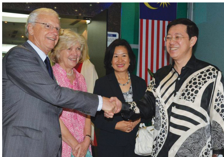
槟州首长林冠英（右1）及夫人周玉清（右2）亲自在槟城国际机场迎接特地来在百忙中抽空前来槟城半日游的澳洲维多利亚总督亚历克斯切诺（左1）及其夫人伊丽莎白。