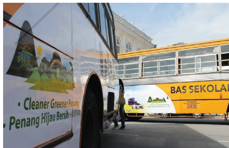
槟城学生巴士公会以行动支持州政府的“绿意槟城”计划，载着“绿意槟城”广告到处跑，为该计划做宣传。

值得一提的是，槟城是全马首个落实绿色学生巴士的州属，全马共有2万5000辆大中小型学生巴士，槟城则有约200辆，其中共有15辆巴士出席推介仪式。