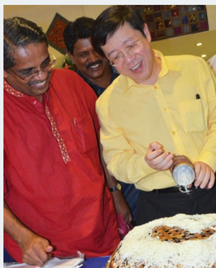
CM Lim tries to make putu mayam or string hoppers, a popular traditional Indian snack which is still popular today

CM Lim praised Lydia for making Penang the first breastfeeding friendly state in Malaysia -- the first step towards a healthier future generation of Penangites.