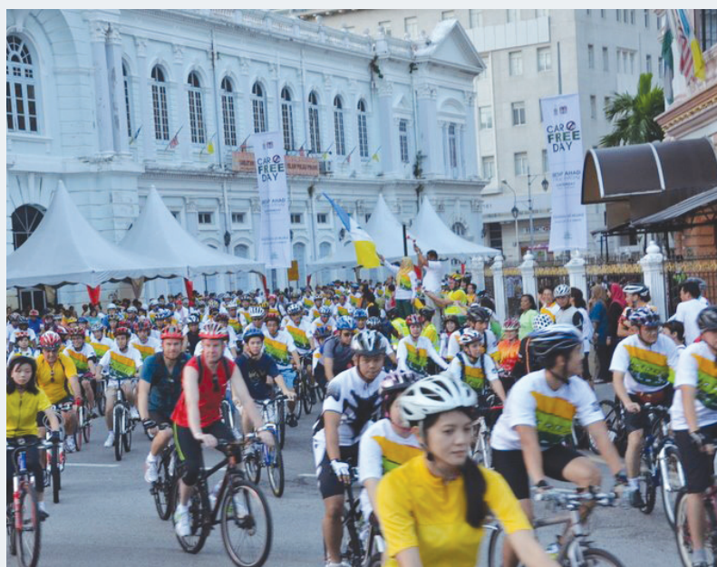
槟州政府史无前例将每个星期日设为“无车日”，让脚车骑士能够真正的放心在古迹区街道上自由自在地踩脚车，而这无车日运动获得逾3000人的支持。