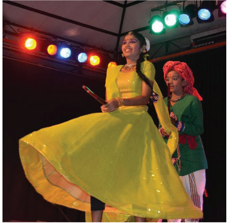
கோலாட்டம் ஆடும் மாணவர்கள்

(Temple of Fine Arts) ஆகும். 1981ஆம் ஆண்டு கோலாலம்பூரில் நிறுவப்பட்ட இந்த நுண்கலை கோயில் 1986ஆம் ஆண்டு பிளாங்கில் தன் கிளையினைத் திறந்தது. இவ்வாண்டு பிளாங்கு மாநிலத்தில் நிறுவப்பெற்றுள்ள நுண்கலை கோயிலின் 25ஆம் ஆண்டாகும். இதனைக் கொண்டாடி மகிழும் பொருட்டு டிசம்பர் 3, 4ஆம் திகதிகளில் “இந்திய நடனம், இந்திய கலை” எனும் கருப்பொருளில் கலை விழா ஒன்று ஏற்பாடு செய்யப்பட்டு சிறப்பாக நடந்தேறியது.