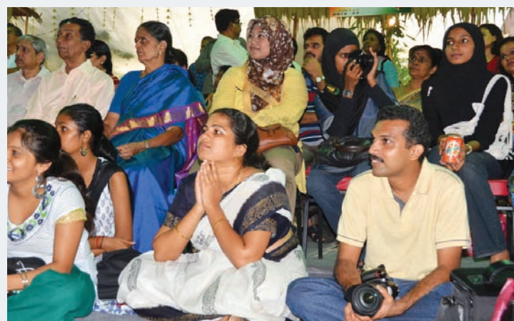
The audience comprising various races and religions are mesmerised by the beautiful dance and melodious Indian music.

"For 200 years, we have been able to live with peace and harmony. Despite of certain efforts to destroy this, Penang has become a showcase that if we allow our people's heart to reach out and touch each other we will live in peace and harmony. For this reason, Unesco has awarded to George Town the Unesco World Heritage Site status because Penang is the role model of