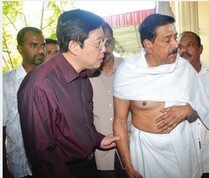
CM Lim offers his condolences to MIC president Datuk G. Palanivel.

All the leaders spent sometime offering their words of comfort to the family of Palanivel before the cortege leaves for cremation at the Batu Lanchang Hindu crematorium.