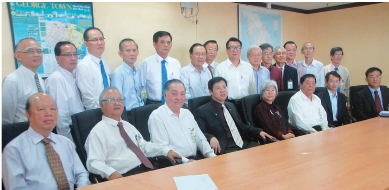
槟州5所独中董事代表与槟州首长林冠英（前排左4）会面商讨后一致同意平分这200万拨款，即每所独中将获得40万令吉。

值得一提的是，首长林冠英也呼吁学校善用太阳能来成为“独立发电厂”，为学校财务开新路及绿路，既能环保又有钱赚。