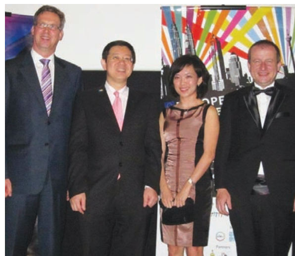
槟州首长林冠英（左2）受邀为首次在槟举办的欧盟电影节主持开幕，左起为欧盟驻马大使文森彼克、高美莉及波兰驻马大使亚当仄罗尼。