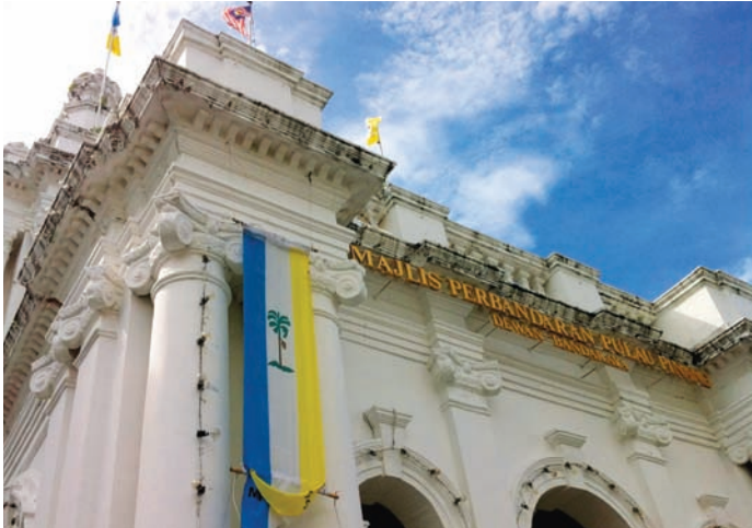
Penang City Council (MPPP) building at Esplanade

It surely is good to note that both councils sent acknowledgement emails to the complain-