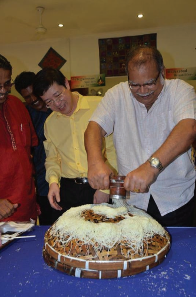
துணை முதல்வர் மாநில முதல்வருக்கு இடியாப்பம் பிழிந்துக் காட்டுகின்றார்

“கடந்த 25 ஆண்டுகளாக இங்கு இந்நிகழ்வினை வெற்றிகரமாக நடத்திவரும் ஏற்பாட்டாளர்களுக்குப் பிணங்கு அரசு சார்பில் மனமார்ந்த நன்றியினைக் கூறிக் கொள்கிறேன். இந்நிகழ்வின் வழி பிணங்கின் அமைதியான, வளமான வாழ்வினைப் பற்றி பலரும் அறிந்து கொள்வர் என நம்புகிறேன்.” என முதல்வர் தமதுரையில் குறிப்பிட்டார். இந்த வெள்ளி விழா ஆண்டின் வெற்றிக்கு முதல்வர் ரிம 10,000 நன்கொடையாகத் தந்தது அனைவரையும் மகிழ்ச்சியில் ஆழ்த்தியது எனலாம்.