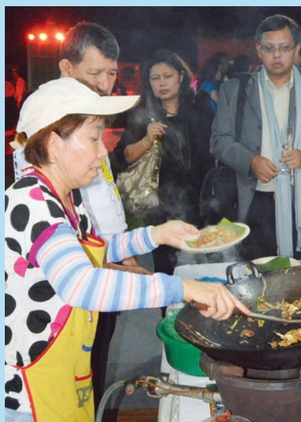
The Char Koay Teow stall is popular with guests too

In another 18 months, Penangites will have a green and natural theme park to escape to spend precious time with families and friends. The Escape Resort will also draw tourists from far and near in tandem with Penang’s aim to be an international tourist destination.