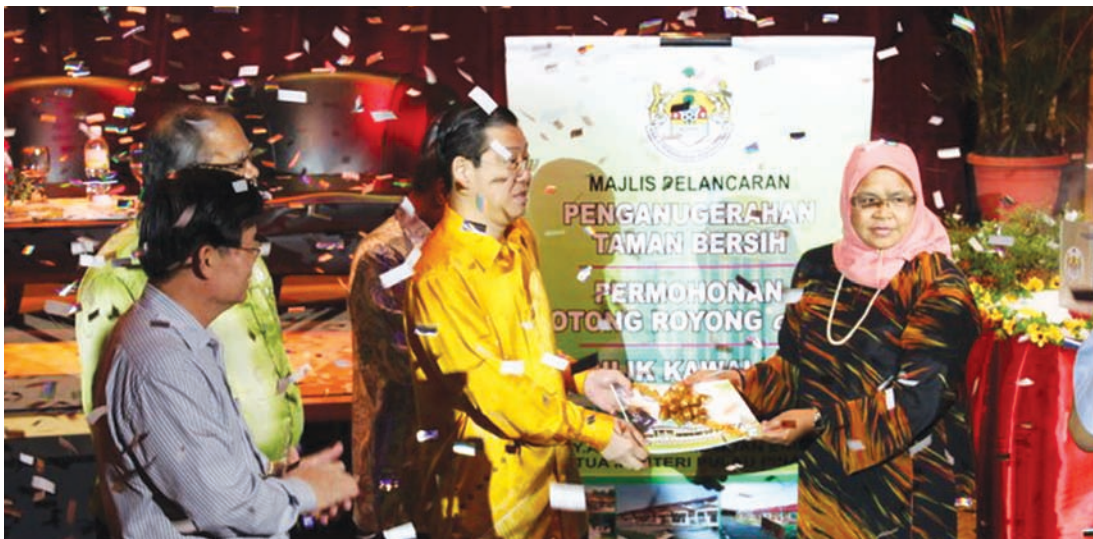
LIM Guan Eng menyampaikan cenderamata kepada Maimunah Mohd. Sharif semasa Majlis Sambutan Perayaan Hari Majlis MPSP kali ke-37 baru-baru ini.

SEBERANG PERAI – Perayaan Hari Majlis Majlis Perbandaran Seberang Perai (MPSP) yang diadakan setiap tahun bukan sahaja diraikan dalam kalangan warga MPSP, malah turut diraikan bersama warga Seberang Perai dan warga Pulau Pinang. Acara perayaan kali ke-37 ini disambut bertujuan mengeratkan hubungan antara warga MPSP dan masyarakat.