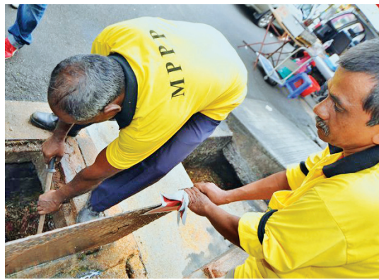
PARA Pekerja Am MPPP membersihkan saluran longkang bagi mengelakkan kejadian banjir kilat di pusat bandar George Town di sini.

Manakala projek jangka masa sederhana bertujuan meningkatkan tahap kecekapan sistem saliran untuk tempat-