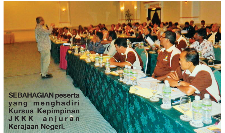
SEBAHAGIAN peserta yang menghadiri Kursus Kepimpinan JKKK anjuran Kerajaan Negeri.