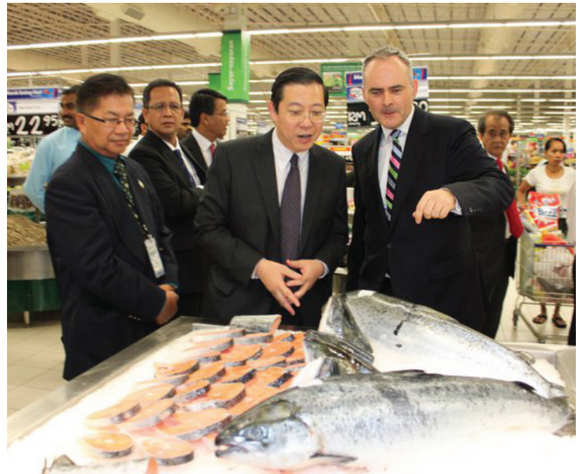
KETUA Menteri tertarik melihat ikan segar bersaiz besar yang terdapat di Tesco Seri Tanjung Pinang bersempena majlis pelancarannya baru-baru ini.