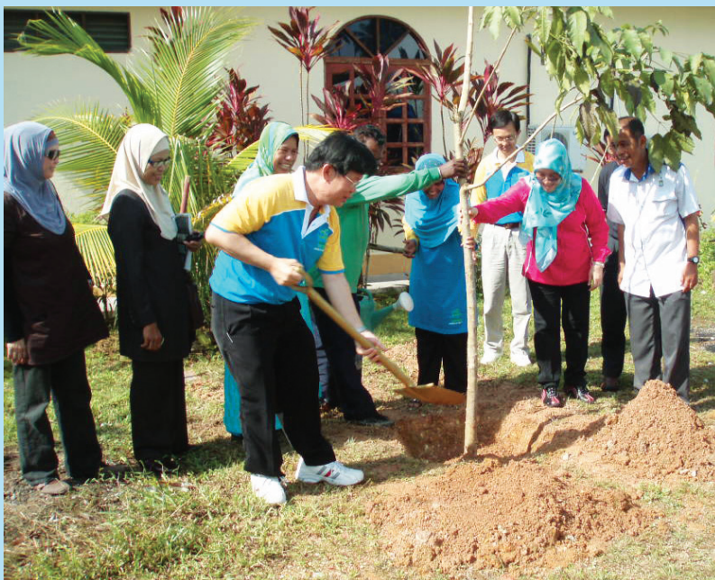
CHOW Kon Yeow (empat dari kiri) menanam pokok teduhan bersempena Program Pulau Pinang Bersih dan Hijau di sini baru-baru ini.

Turut hadir bagi menjayakan program yang