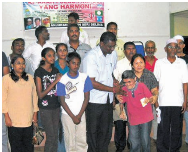
ANTARA penerima-penerima bantuan daripada ADUN Seri Delima baru-baru ini.