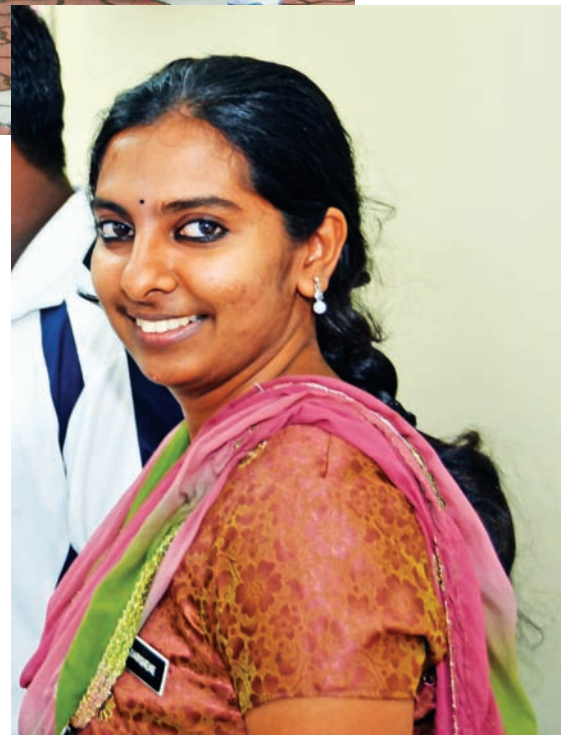
SEORANG guru Sekolah Tamil Azad ceria selepas pihak sekolah terbabit memperoleh bangunan baru yang dibina di sebidang tanah bernilai RM13 juta hasil sumbangan Kerajaan PR Pulau Pinang.