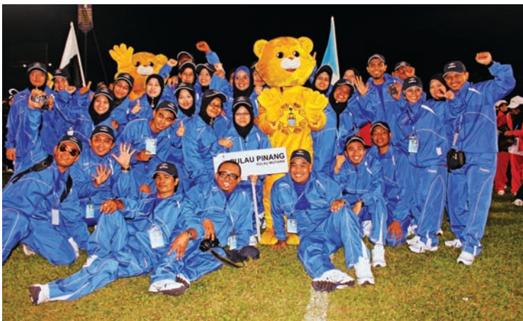
KONTINJEN Pulau Pinang bergambar kenang-kenangan selepas Majlis Perasmian Kejohanan Sukan Dwi Tahunan Pejabat-pejabat Kewangan dan Perbendaharaan Negeri Se-Malaysia Kali XI Tahun 2011, baru-baru ini.