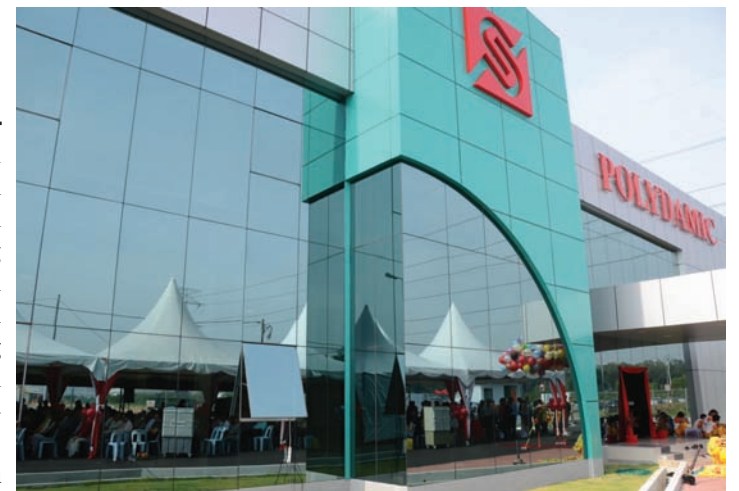
BANGUNAN Polydamic Sdn. Bhd. yang terletak di Bukit Minyak.

Dalam ucapan Ketua Menteri, beliau yakin bahawa dengan pelaburan baru Polydamic, ia akan dapat menyokong perkembangan industri