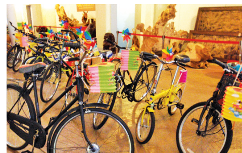
Colours Of Malaysia Lantern Bicycle Night Ride and Lantern Bicycle Decoration Competition • 10 September 2011 • Penang New World Park