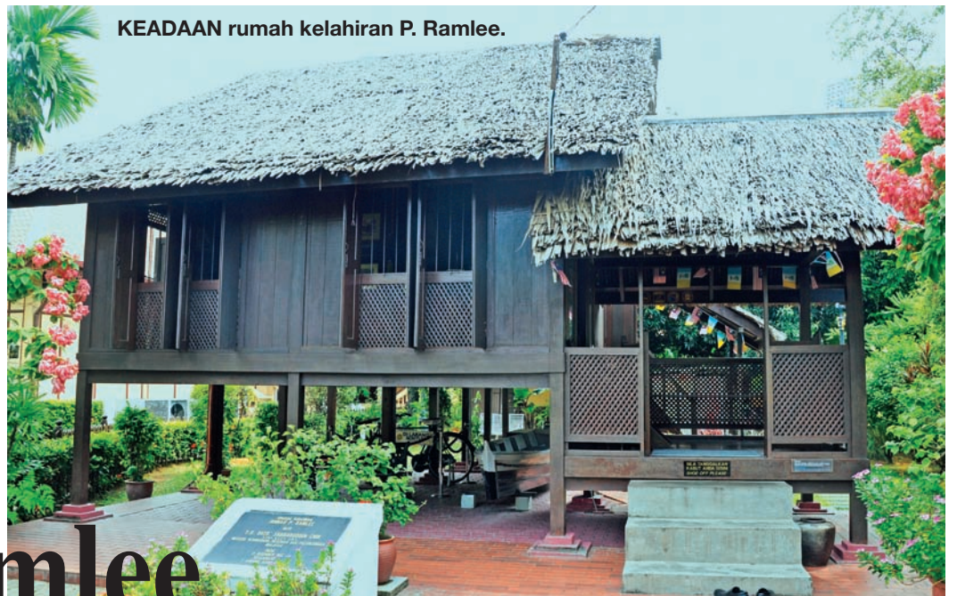
KEADAAN rumah kelahiran P. Ramlee.