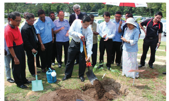
KETUA Menteri menanam pokok sebagai simbolik dalam menjadikan Pulau Pinang negeri hijau pertama di Malaysia.

Beliau juga berharap agar orang ramai memberikan kerjasama penuh agar segala usaha yang telah dilaksanakan oleh Kerajaan Negeri PR dapat terus bertahan dan