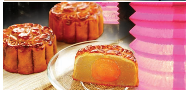
Pesta Tanglung • 12 September 2011