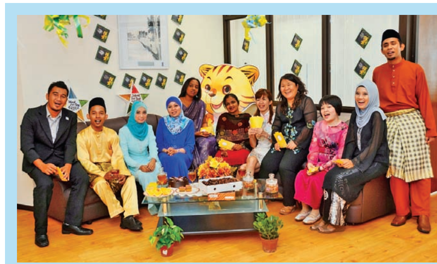
PARA Penjawat Awam Kerajaan Negeri Pulau Pinang yang terdiri daripada berbilang kaum bersama-sama meraikan sambutan Hari Raya Aidilfitri dalam suasana yang muhibah.

“Program yang diperkenalkan oleh kerajaan negeri, iaitu “Penang World