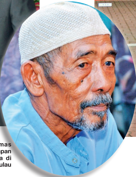
SEORANG warga emas yang meghayati ucapan Ketua Menteri ketika di majlis buka puasa di Pulau Pinang.