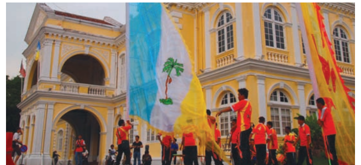
All Star National Chingay Competition • Penang • 4 September 2011 • City hall, Esplanade • 8pm