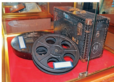
GAMBAR-gambar yang dipamerkan di Galeri P. Ramlee.