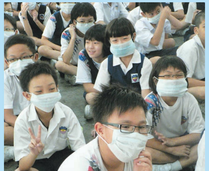
SEBAHAGIAN murid SJK (C) Li Hwa memakai topeng penutup mulut dan hidung yang diedarkan pihak MPSP.

Menurut jurucakap MPSP, murid-murid sekolah diberi perhatian khusus oleh kerana antibodi badan yang tidak begitu kuat berdasarkan faktor usia mereka. Namun, bagi kawasan-kawasan yang ingin mendapatkan topeng tersebut boleh mengemukakan permohonan kepada pihak MPSP. Rakyat juga boleh melayari laman www.doe.gov.my bagi mendapatkan informasi terkini keadaan jerebu yang melanda negara.