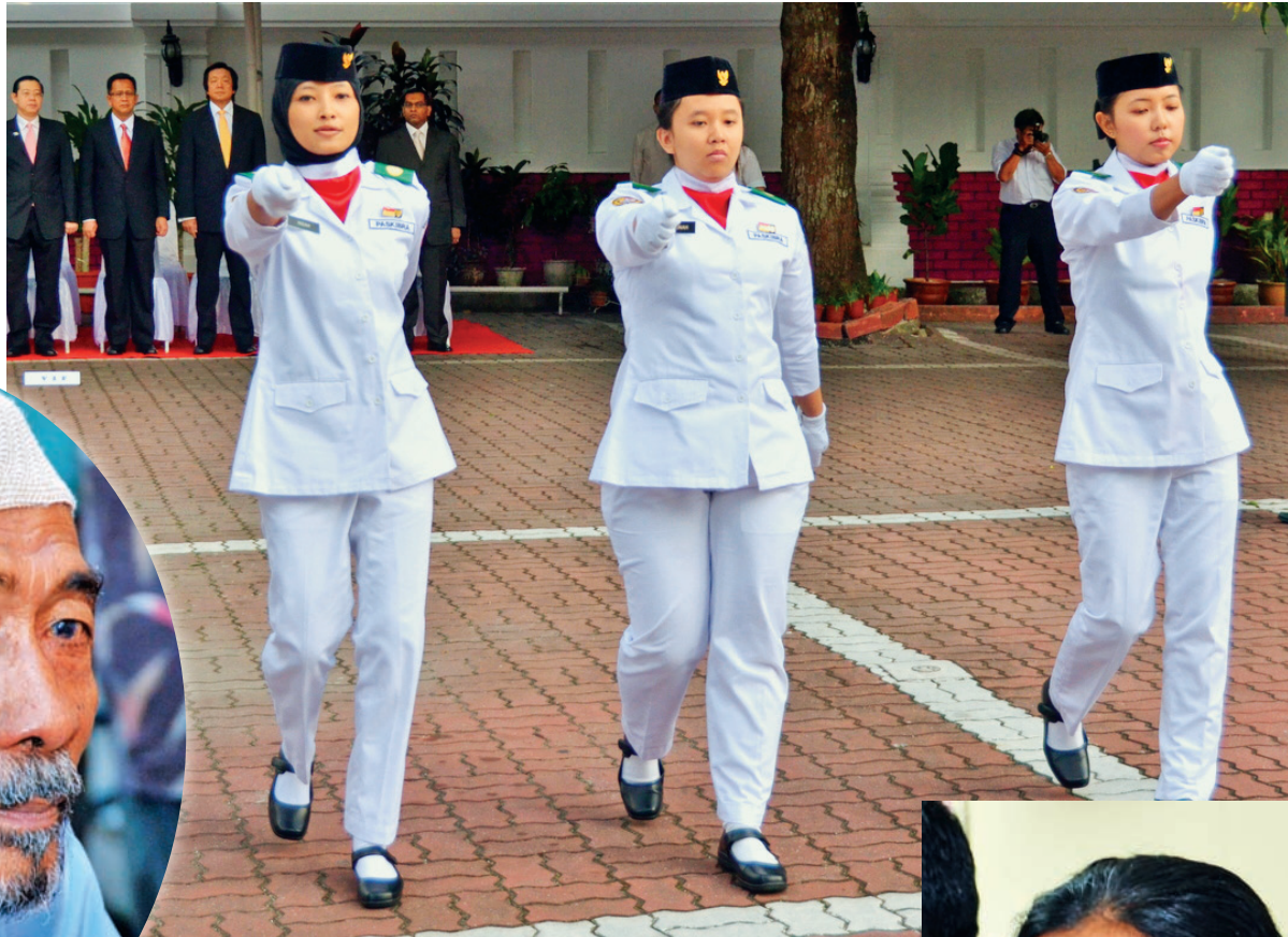
PERBARISAN sempena sambutan Hari ASEAN ke-44 di Konsulat-Jeneral Indonesia, Pulau Pinang.