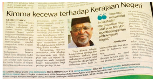
KERATAN akhbar Sinar Harian 25 Julai 2011.