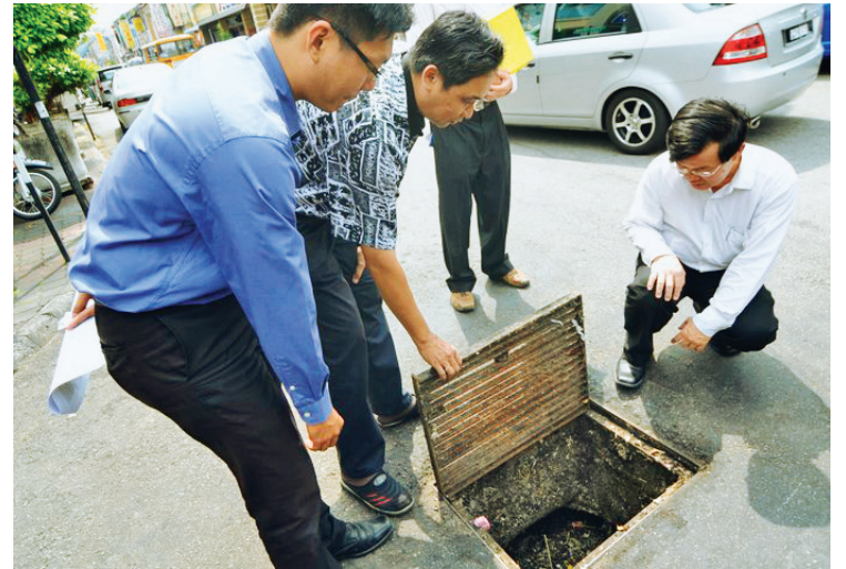
CHOW Kon Yeow (kanan sekali) meninjau saluran air dalam longkang di persimpangan Lebih Cintra dan Lebuhraya Kimberley.

Pengerusi Jawatankuasa Kerajaan Tempatan dan Lalulintas, Chow Kon Yeow berkata, pihak majlis memandang serius maklum balas awam berhubung kejadian banjir kilat di pusat bandar George Town dan adalah menjadi keperluan kepada pihak terbabit untuk mencari jalan penyelesaian pada kadar segera.