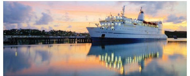
Logos Hope • Penang • 30 Ogos - 27 Sept 2011 Logos Hope is the world's largest floating book fair, offering over 5,000 books at affordable prices.