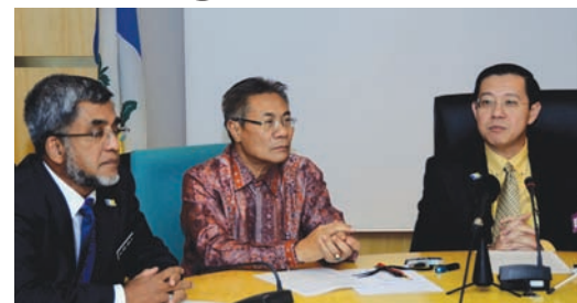
L-R : YB Abdul Malik Kassim, Deputy Chief Minister I Dato' Mansor Othman and Chief Minister Lim Guan Eng.

FOLLOWING the allegation that over 1,500 permanent residents being allowed to register as new voters, the Penang state government has revealed that there is a shocking sudden increase in the number of voters in the state to the tune of nearly 32,000 in the past three months alone.