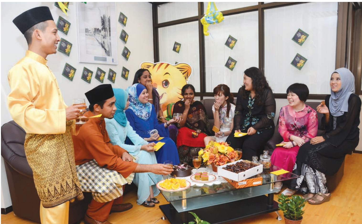
Multi-racial civil servants in Komtar celebrate Hari Raya and are especially happy because they received half a month 'duit raya' bonus or minimum RM600 each, which is RM100 more than other states in Malaysia.