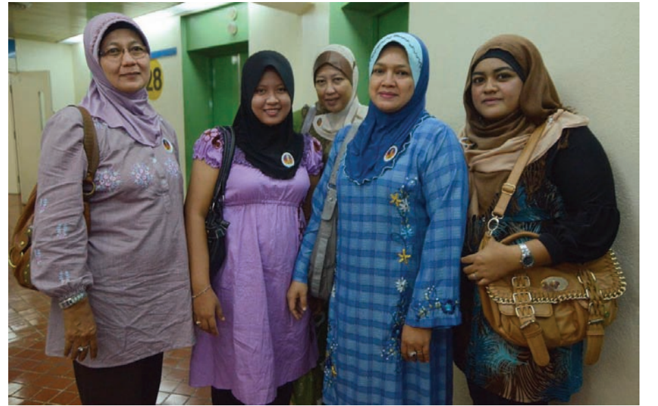
மாநில அரசாங்க ஏலத்தின் மூலம் குத்தகையை பெற்ற மகளிர் குத்தகையாளர்.