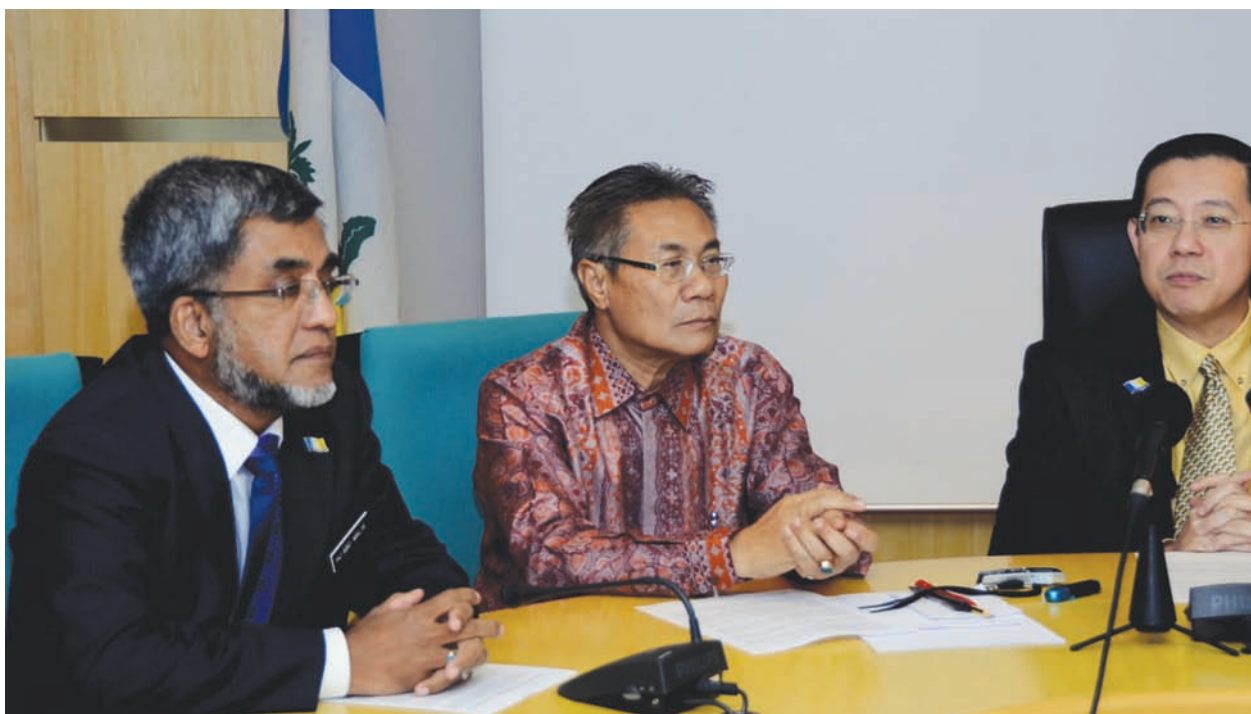
林冠英（右）促槟州人民需防备不惜以肮脏卑鄙手段、做手脚来赢得议席的国阵，同时也能站出来捍卫以民为本的民联州政府。左起为槟州行政议员阿都玛烈以及槟州第一副首长拿督曼梳。

“2011年首季共有13个选区的选民增长人数超过1000人，其中巴东拉浪及垄尾区的选民人数增长甚至超过3000人，而峇都茅则超过2000人。”