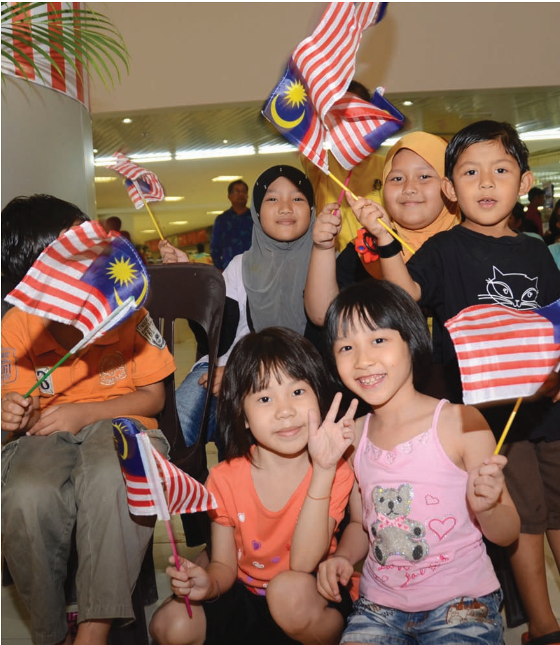
September 16 is Malaysia Day. It is declared a public holiday from 2010. Multi-racial children waves the Malaysia flag at Komtar.