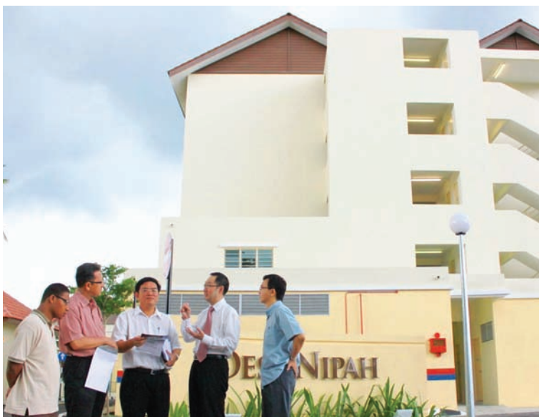
State Town and Country Planning, Housing and Arts Committee chairman Wong Hon Wain (middle) inspecting the 80 units homes costing RM30,000 each at Desa Nipah, Balik Pulau.