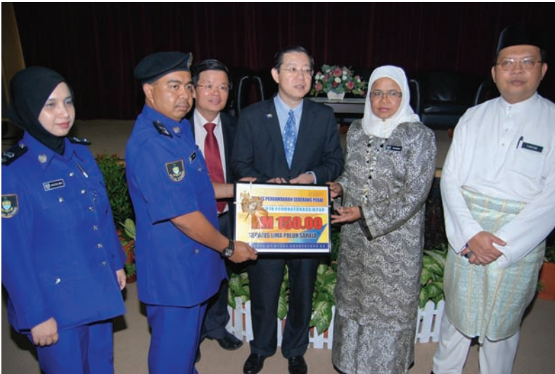
செபராங் பிறை நகராண்மைக்கழகத்தைச் சேர்ந்த ஊழியர்களுக்கு முதல்வர் ஊக்குவிப்புத் தொகையினை வழங்குகிறார்.

இவ்வாண்டு ஜூலை தொடக்கம் குறிப்பிட்ட ஊழியர்களுக்கு ஒவ்வொரு மாதமும் ரி.ம. 150 ஊக்குவிப்புத் தொகையாக வழங்கப்படும். கொள்முதல், கட்டட இடிப்பு, வாகனங்களைப் பூட்டுல் போன்ற நடவடிக்கைகளை மேற்கொள்ளும் அமலாக்கப்பிரிவினர் பல வகையான அச்சுறுத்தலுக்கு உள்ளாகின்றனர். சில சமயங்களில்