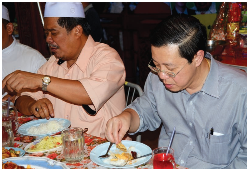
PAS deputy president Mohamad Sabu and Chief Minister Lim Guan Eng in Bayan Lepas on the first day of Ramadhan. They were in ISA detention together. CM Lim eats with his hands, without fork and spoon as he said he had 'practised' in ISA with Mat Sabu.