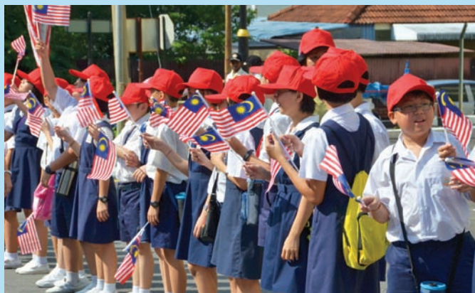
School children lined the streets, welcoming the King and Queen.

The royal visit was certainly the grandest social event in Penang since the Pakatan Rakyat took control of the state in March 2008.