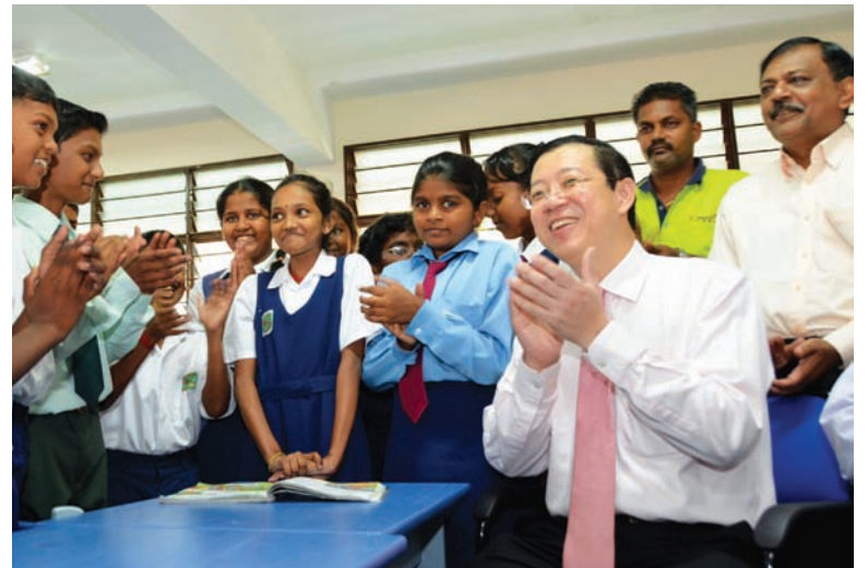
Chief Minister Lim applauded after listening to the students reading a story.

Currently, the Azad school has 13 rooms, of which 6 are used as classrooms to house 84 students from Standard 1 to Standard 6. The new school building opened in April 2011 and there are plans to set up a kindergarten next year.