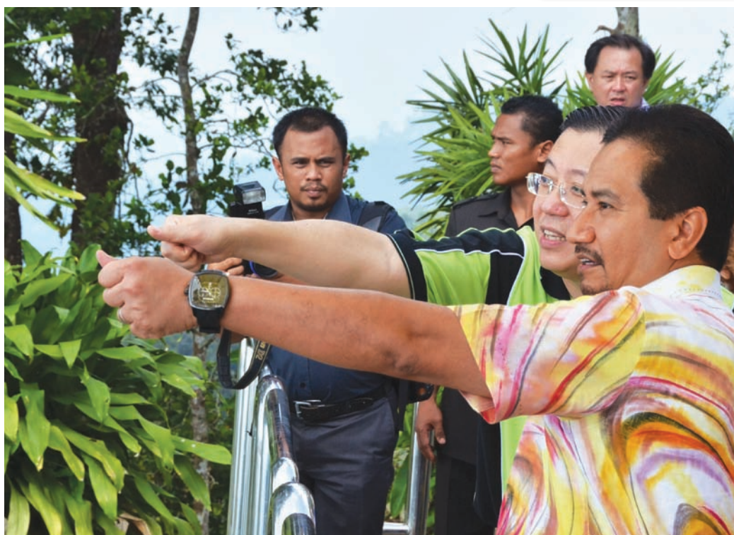
Chief Minister and Yang di-Pertuan Agong Tuanku Mizan Zainal Abidin during his visit to Penang at a function in Bukit Bendera recently.

Penang's dominant role in the medical tourism industry in Malaysia is backed up by figures. Of Malaysia's total medical tourism receipts in 2009 of RM288 million, Penang contributed RM164 million or 57%. In 2010, of Malaysia's total medical tourism receipts of RM336 mil-