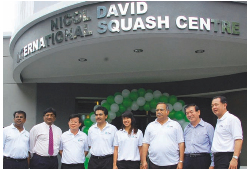
Dato' Nicol David at The Nicol David International Squash Centre with Penang State leaders.