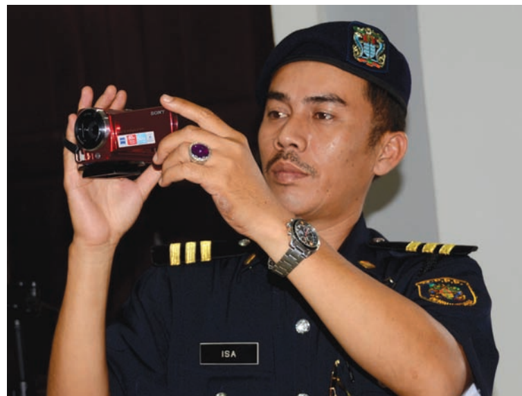
MPPP and MPSP enforcement officers will be equipped with video cameras to document enforcement duties carried out by the council.