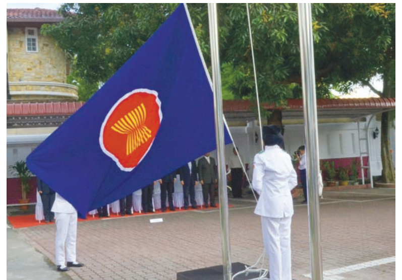
It is a historic moment for Penang when the ASEAN flag was raised for the first time at the Consulate-General of Indonesia to mark the 44th anniversary on 8th August, 2011.