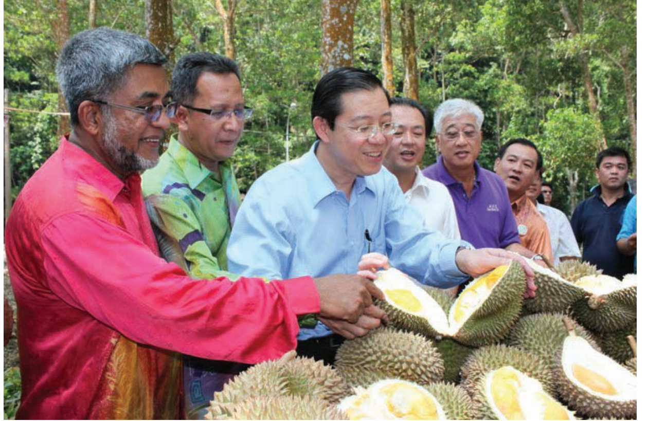
டுரியான் பழ விழாவில் முதல்வருடன் ஏனைய அரசியல் பிரமுகர்கள்.

காட்டிற்கு அரசன் சிங்கம். அதுபோல் பழங்களுக்கு அரசன் டுரியான். இதனை தமிழில் முள்நாறிப்பழம் என்று அழைப்பர். நமது உள்ளூர் பழங்களில் மிகவும் பிரசித்தி வாய்ந்த பழமும் இதுவே. அதுவும், பாலிக்புலாவ் டுரியான் பழங்கள் நாடு முழுவதும் பிரபலம்.