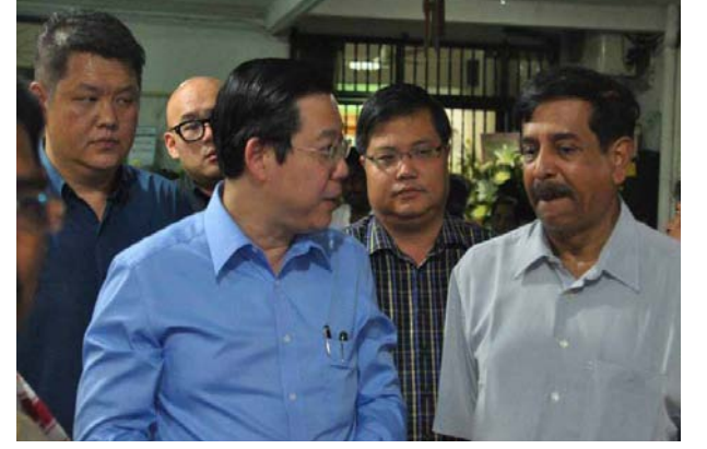
முதல்வருடன் உரையாட்டும் மஇகா தேசிய தலைவரும் பிரதமர் துறை அமைச்சருமான டத்தோஸ்ரீ பழனிவேல்.