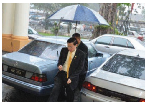
即使下着滂沱大雨，槟州首长林冠英还是风雨无阻地出席州议会。