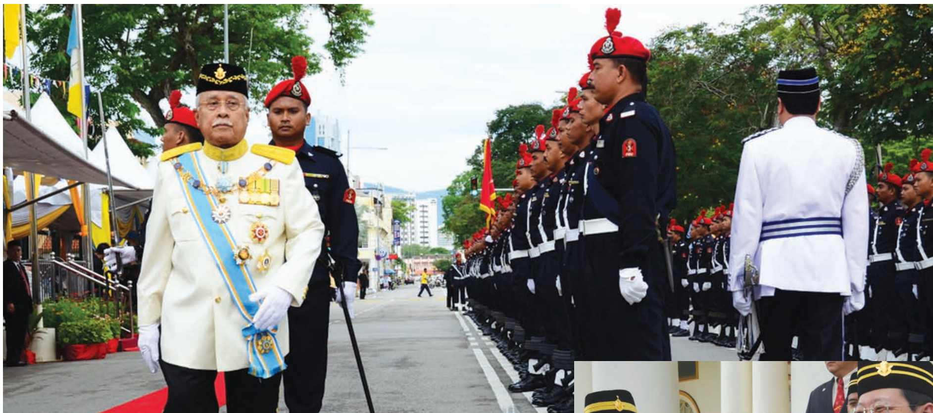
The Governor inspecting the Guard of Honour.

PENANG State Assembly opened on 30th April, 2012 for the fifth session of the 12th Penang State Assembly.