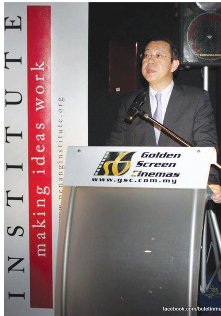
During the screening of the movie 'Urbanized' at GSC, Gurney Plaza on 19 April, 2012, Chief Minister Lim Guan Eng announced the proposal to increase the minimum limit for foreign purchases of all properties from the existing level of RM500,000 to RM1 million with a higher limit of RM 2 million for landed properties in Penang Island and retaining the present RM 500,000 limit for Permanent Residents. The screening of the documentary "Urbanized" by Gary Hustwit was organised by Penang Institute along with Think City. The film highlighted many of the serious challenges which are faced by an increasingly urban world. It also showed how some of these problems are addressed.