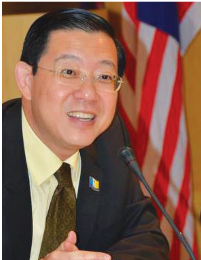
前任槟州首长丹斯里许子根任期间每趟出国花费比现任首长林冠英多3.1倍，但民联州政府在2008年至今，透过出国官访取得了显著的收益，促使槟州创造历史，在2010及2011年，投资额连续两年全马居冠。

前、现任槟州首长出国开销比一比，前任槟州首长丹斯里许子根任期间每趟出国花费，竟然是现任首长林冠英的3.1倍。