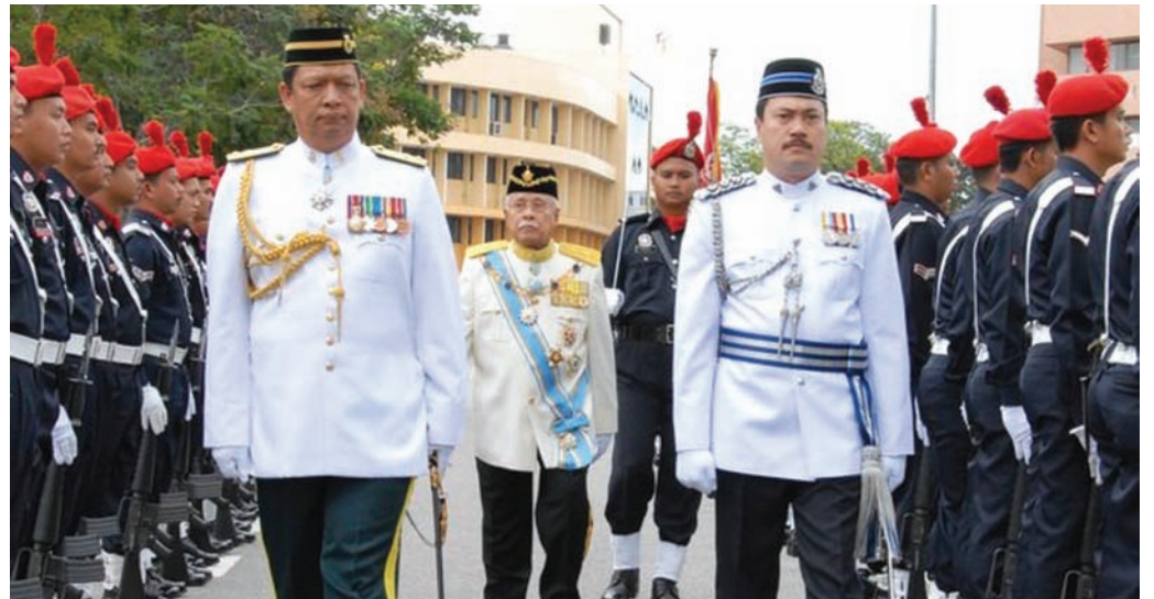
槟州元首敦阿都拉曼阅兵。