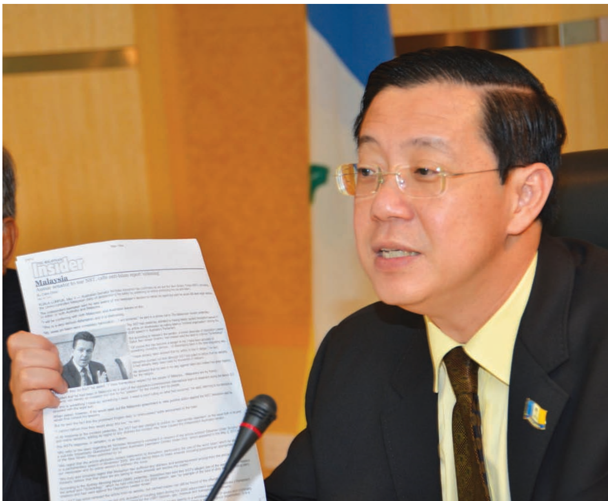
CM Lim showing members of the media the article from The Malaysian Insider.

It has been reported that Senator Xenophon intends to go ahead and sue the New Straits Times for the damage that has been done to his reputation, despite the newspaper's admission of guilt and statement of regret. In the case of a false news report carried by the New Sunday Times, Mingguan Malaysia and