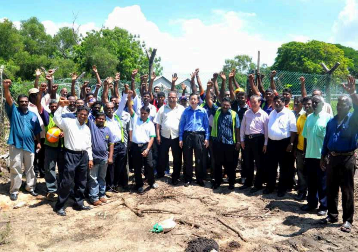
ஆலய உடைப்பால் மனங்கொதித்து போயிருக்கும் இந்தியர்களில் ஒரு பகுதியினர்.

40 ஆண்டுகள் பழமை வாய்ந்த இந்தச் சிறிய வழிபாட்டு தளத்தில் இப்பகுதியில் கடலில் வேலைக்குச் செல்லும் இந்திய மக்கள் வழிபட்டு வந்தனர். கடலுக்குச் செல்வோர் வீடு திருப்பிட நாட்கள் ஆகும். அவர்கள் பாதுகாப்பு வேண்டி இங்கு வழிபட்டு செல்வது வழக்கம். பிளாங்கு துறைமுக அதிகாரிகளின் காரணங்களை