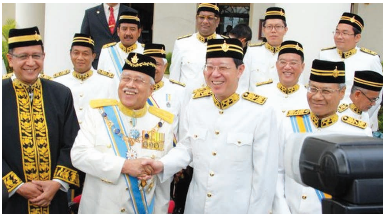
槟州元首敦阿都拉曼（左2）主持槟州第12届第5季第1次州立法议会开幕后，与槟州首长林冠英（右2）握手，旁为槟州议长拿督阿都哈林（左1）及槟州第一副首长拿督曼梳（右1）。