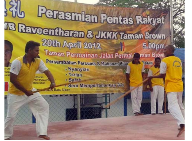
சிலம்பாட்டத்தை மக்களுக்கு செய்து காட்டிய காட்சி.

மக்கள் மேடை திறப்பு விழாவின் போது பல்வேறு படைப்புகள் அரங்கேறின. சீலாட தற்காப்பு கலை காட்சி, சிலம்பாட்டக் காட்சி, பரத நாட்டிய படைப்பு, சிறுவர் சிறுமியரின் இசைப் படைப்பு என பல நிகழ்வுகள் அரங்கேறி மக்கள் மனதினைக் கவர்ந்தன. மேலும் பத்து உபான் பகுதியின் மே வங்கி ஊழியர்களுக்கு அவர்களின் சேவையைப் பாராட்டி சான்றிதழ்களும் வழங்கப்பட்டன.