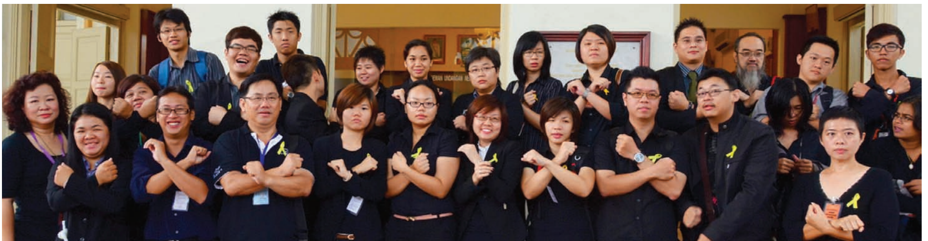
Penang journalists wearing black with yellow ribbons in a group photo at the Penang State Assembly