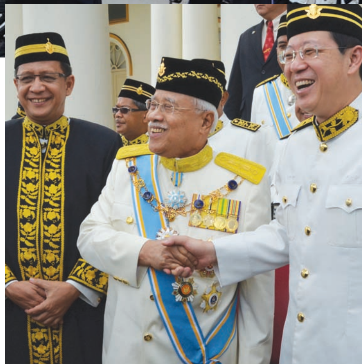
From left to right - Penang State Assembly Speaker, Dato' Abdul Halim Hussain, The Governor and CM Lim.