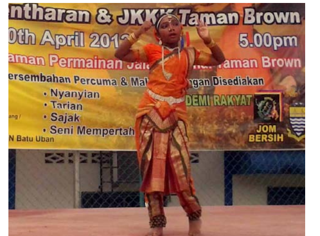
பரதக் கலையில் மிளிரும் சிறுமி.