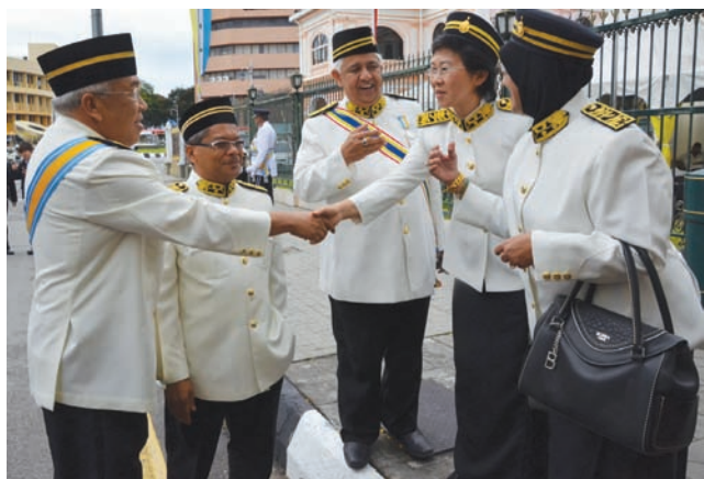
The Assemblymembers greeting each other.