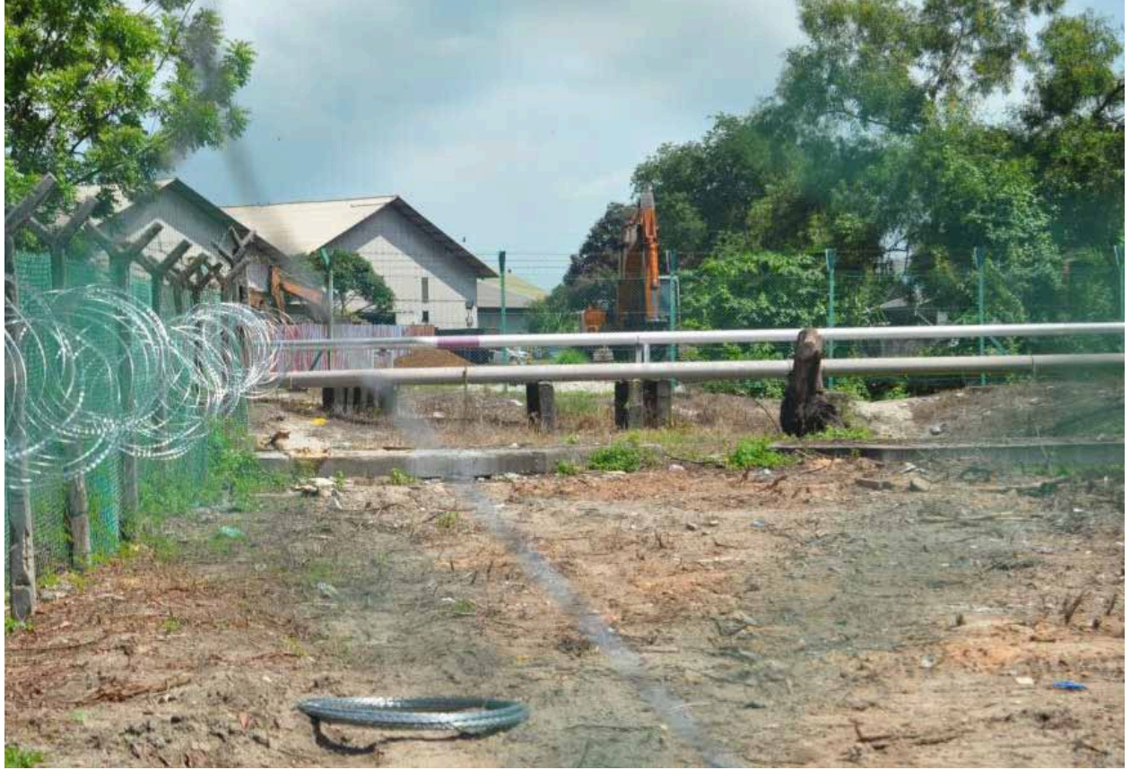
உடைக்கப்பட்ட முனிஸ்வரர் ஆலயம் அமைந்திருந்த பகுதி தற்போது வேலியிடப்பட்டுள்ளது.