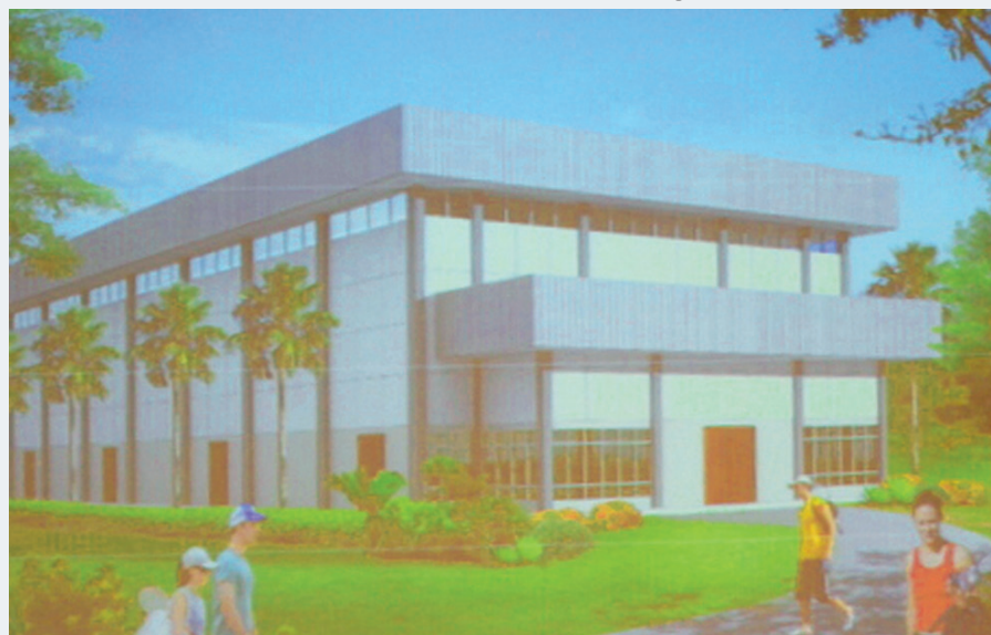
Artist's impression of Penang Badminton Academy .