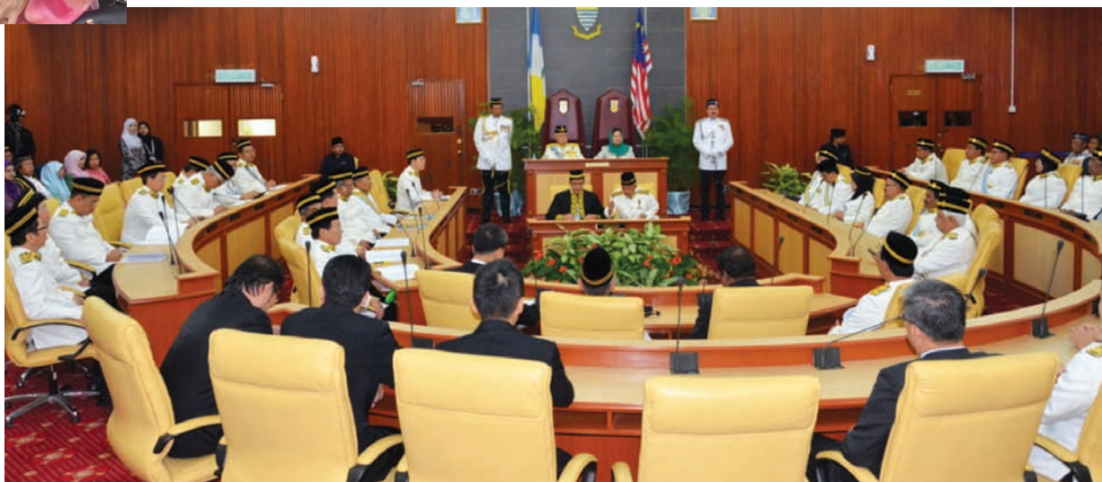
The State Legislature convenes.