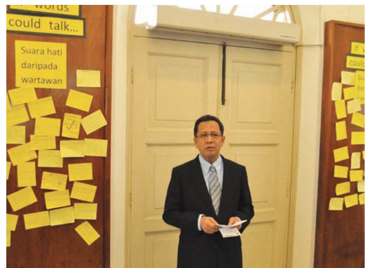
槟州媒体在槟州议会发动“记者心声角落”活动，透过纸条留言监督槟州议员，槟州议长拿督阿都哈林对该项活动表示支持，同时也珍惜媒体所作出的努力及贡献。