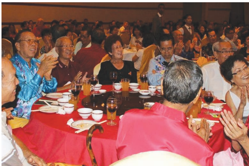
The Penang Teachers' Cooperative Society (PTCS) celebrated its 80th anniversary on 21st April, 2012. Since its inception in 1928, the PTCS has come a long way from being one of the pre-war cooperatives in the country to become one of the most well-managed co-ops in the country with a substantial paid-up capital and share capital of more than RM35 million. The PTCS has 5,000 members.