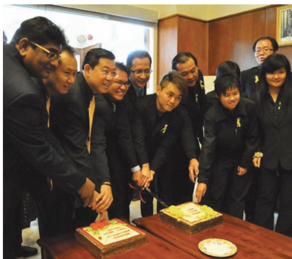
为配合世界新闻自由日，槟州首长林冠英（左3）及多名州议员与采访槟州议会的槟州记者们齐切蛋糕。