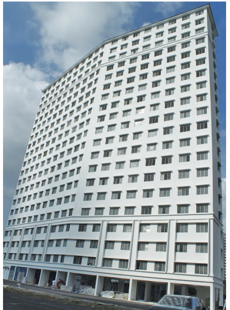
搁置7年之久的湖内安宁园组屋房屋发展计划终于竣工。

黄汉伟说，自民联於308执政槟州后，已很少看到购屋者拉布条进行抗议活动，这显示房屋被搁置的情况已获改善，根据房屋部提供的全国房屋发展计