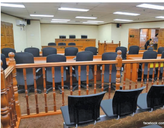
上诉局议事厅设立在光大57楼，那么上诉局就无需经常换地点来进行听证会，这非常方便大家。

专业人士在城乡规划方面拥有丰富知识、经验及技术，而且上诉局议事厅设立在光大57楼，那么上诉局就无需经常换地点来进行听证会，这非常方便大家。”