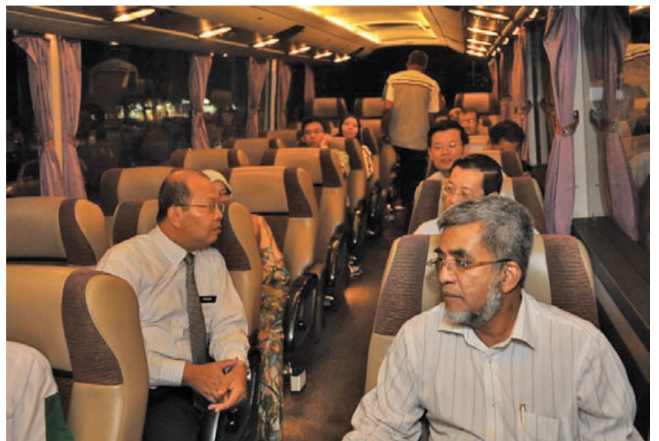
林冠英与行政议员们从威省搭免费巴士到，体验上班族搭巴士上班的生活。

“这计划优先开放给妇女及摩哆骑士，同时也开放给联邦政府公务员，惟还是会优先开放给州级公务员。槟州政府是首个提供免费巴士服务给公务员的州政府。如果公务员被发现意图转让给其他人来赚钱，那么州政府