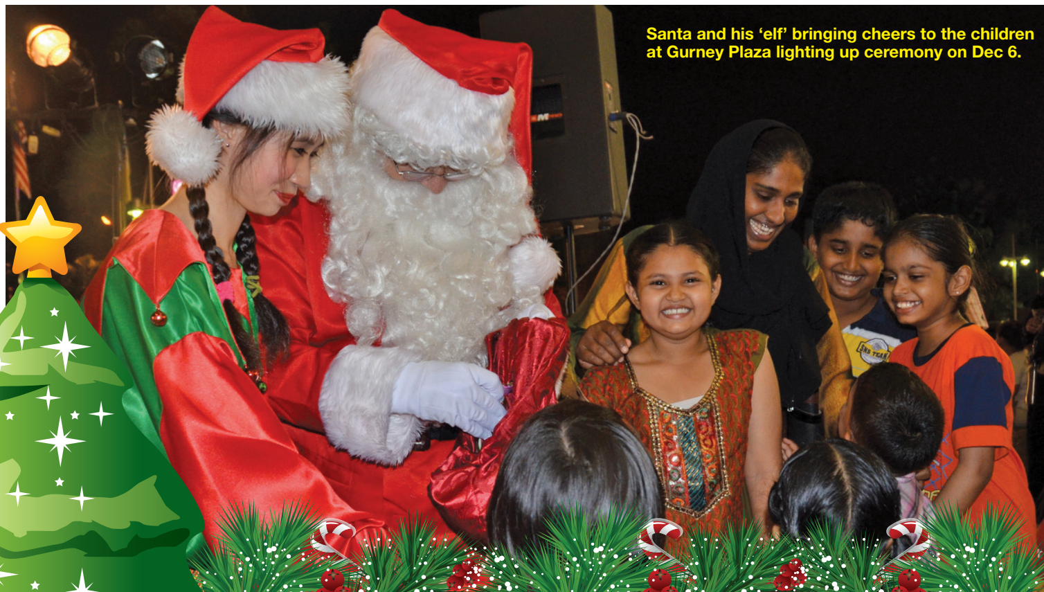
Santa and his 'elf' bringing cheers to the children at Gurney Plaza lighting up ceremony on Dec 6.

“If we rub shoulders in a friendly way tempered with mutual understanding and respect,