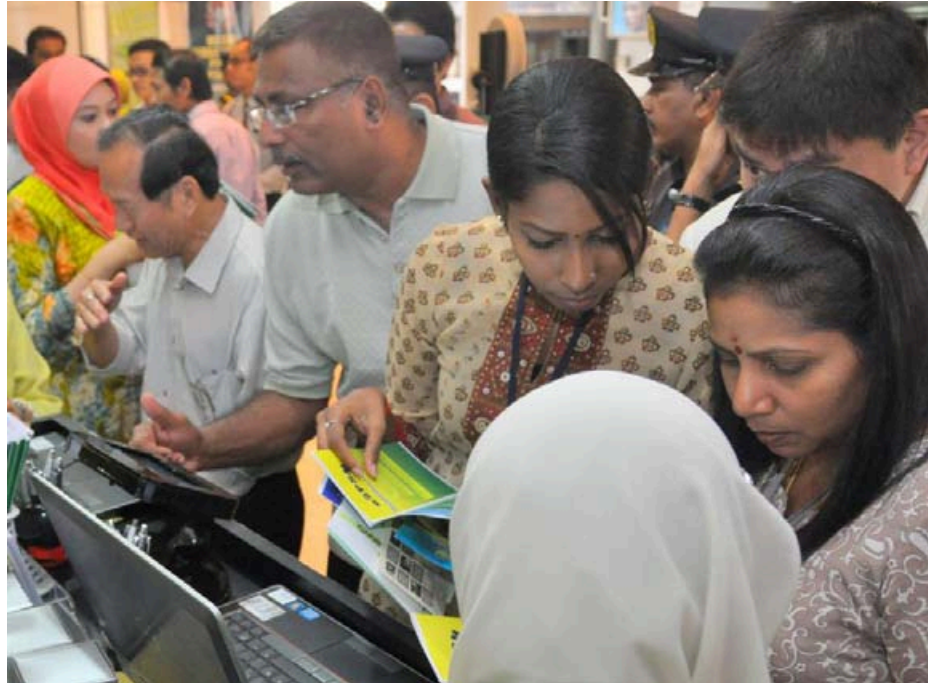
மின் அரசாங்கச் சேவையைப் பற்றி தகவல்களைப் பெறும் வருகையாளர்களில் சிலர்

கடந்த ஆண்டு செபெராங் பிறை சன்வே கர்னிவலில் நடைபெற்ற இக்கண்காட்சி இம்முறை 'எளிய மின் அரசாங்க சேவை 'EZ eG' என்னும் கருப்பொருளில் நடத்தப்பட்டது. அரசாங்கச் சேவையை வலுப்படுத்துவதற்கு இணையத்தின் வாயிலாக மக்களுக்கு எளிதான முறையில் விரைவாகவும் வசதியாகவும் வழங்க இந்த மின் அரசாங்க சேவை மிகவும் துணை புரியும் என்று பினாங்கு முதல்வர் மேதகு லிம் குவான் எங் இதன் தொடக்க விழாவில் கருத்துரைத்தார். மாநில அரசின் அதிகாரப்பூர்வ இணையத்தளத்தின் வாயிலாக 8 பினாங்கு நகராண்மைக் கழக இணையச் சேவையும் பினாங்கு செபெராங் பிறை நகராண்மைக் கழக இணையச் சேவையும் உட்பட 34 இணையச் சேவை செயற்படுகின்றன. அவற்றுள் 'e-bayar' என்னும் இணையம் வழி கட்டணம் செலுத்தும் முறை முதன்மையாகச் செயற்பட்டு