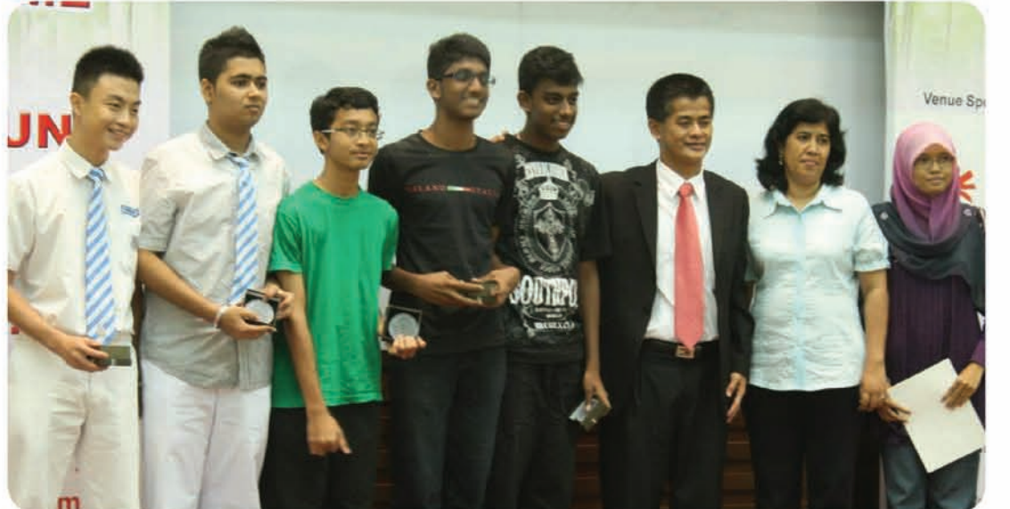
பிளாங்கு அறிவியல் சபையின் ஏற்பாட்டில் நடைபெற்ற இளம் அறிவியல் மேதைகளுக்கான விருதளிப்புப் போட்டியில் பங்குபெற்ற பிளேங் ஃப்ரி இடைநிலைப்பள்ளி மாணவர்களும் ஆசிரியர்களும்