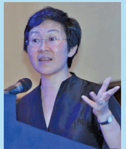
Ong hopes the event will help foster closer ties among sports staff and officers.

"The Penang state government hopes by organising FESMAS 2012, it will foster closeness and friendship among staff and officers who are involved in sports development in the country and will encourage collaboration and lasting friendships at all times during and after the tournament," Ong said.