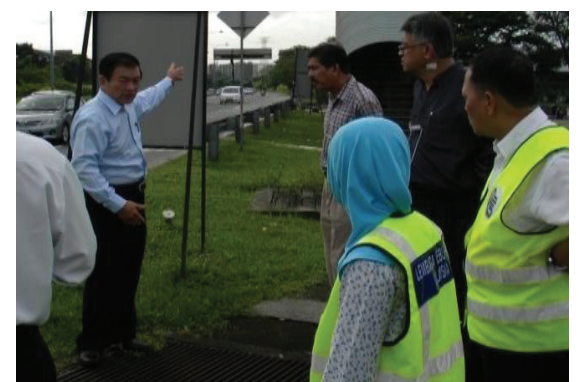
JKR officers and the relevant departments visiting the construction site of Jalan Baru connect to Jalan Bagan 29 and Jalan Siram, Butterworth.