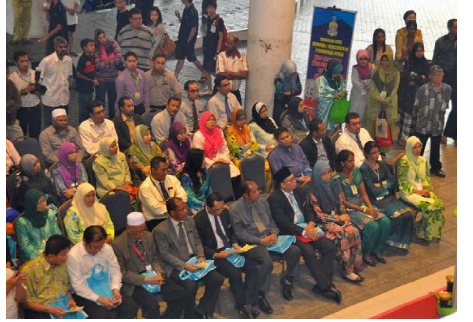
பினாங்கு மின் அரசாங்கச் சேவைக் கண்காட்சிக்கு வருகை புரிந்தவர்களில் ஒரு பகுதியினர்.

'eRumah' இணையச் சேவையின் வழி பினாங்கு மக்கள் குறைந்த விலை வீடுகள் விண்ணப்பிக்கவும் அதன் விண்ணப்ப நிலையை அறிந்து கொள்ளவும் பயன்படுத்தலாம். மேற்கல்வியைத் தொடரும் மாணவர்கள் அரசாங்கக் கடனுதவியை பெற 'e-Pinjaman