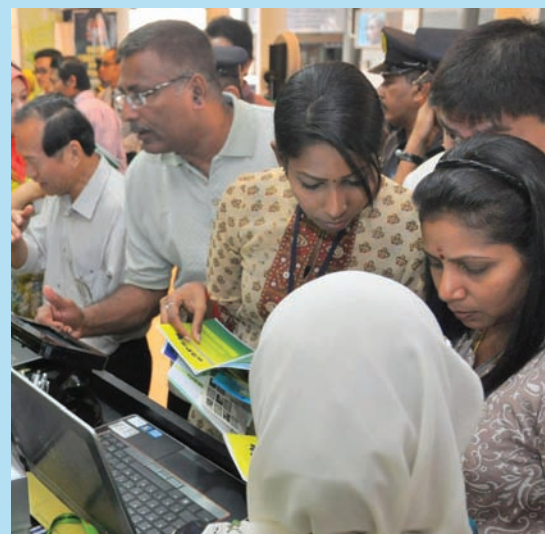
民众在光大底楼举行“Ez电子政府展览会”上参观各部门所推出的政府网络系统。

与去年在双威省展出的概念相同，同时调查显示，96%使用者现有的网络者都觉得十分满意。