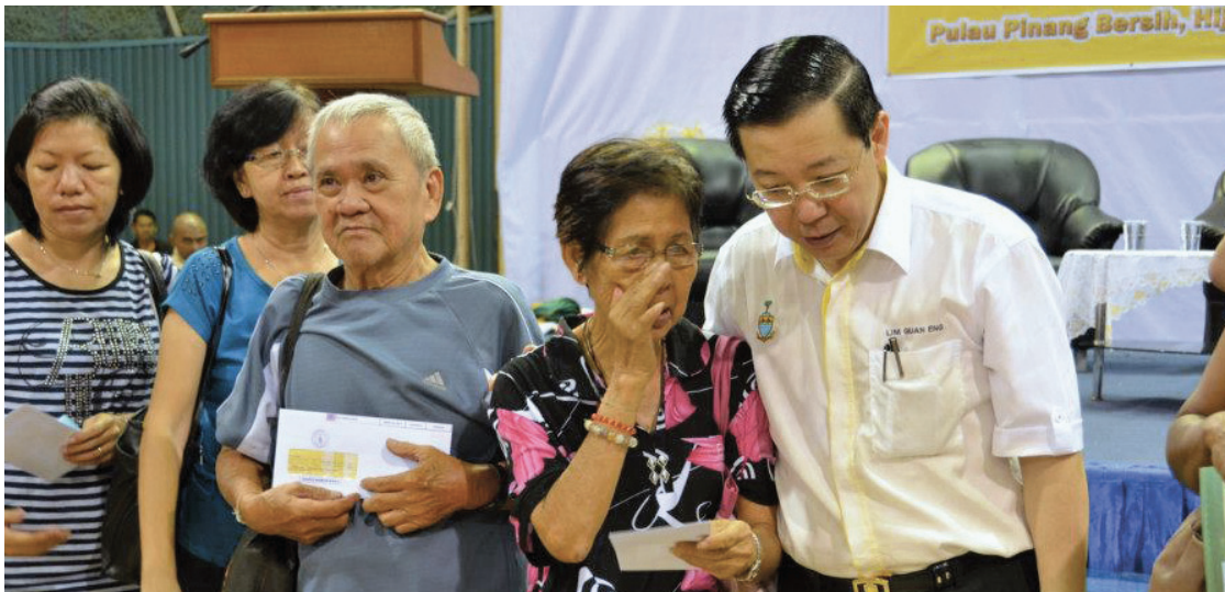
A recipient of the RM1,000 under the Senior Citizen Appreciation Programme is touched with the gesture of receiving money but at the same time, sad with the loss of loved ones.