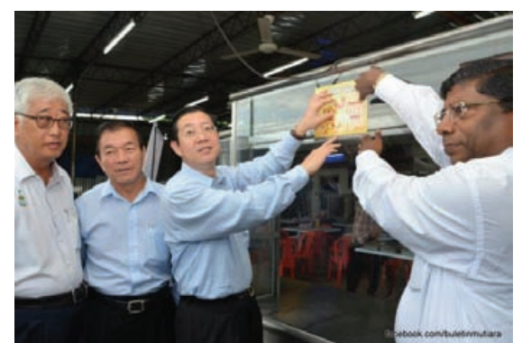
WiFi launch at Medan Selera Bus Terminal, Butterworth.