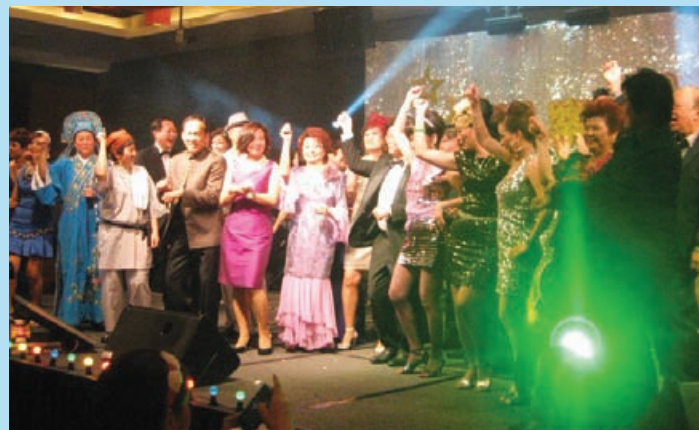
《欢乐满滨江》慈善筹款晚宴聚集了各界名人公开献唱，为慈善尽心尽力筹获45万令吉。

国会议员、州议员、拿督斯里、拿汀斯里、丹斯里、拿督拿汀身穿五六十年代流行服装，化身为艺人在台上，载歌载舞地为慈善演出，仿佛重入时光隧道，让观众重温当时地名曲。