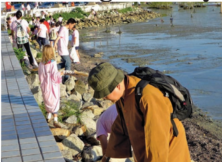
Spotted amongst the 2,400 volunteers taking part in Cleaning Gurney are a monk and a little girl, busydigging out thrash from Gurney Drive.

WHEN 2,400 people gathered under the hot sun on Nov 25 at Gurney Drive, away from the media glare and publicity, digging thrash from the mud, toiling and sweating, we have to trust that they were doing something they truly believe in and for something they love. At 11am