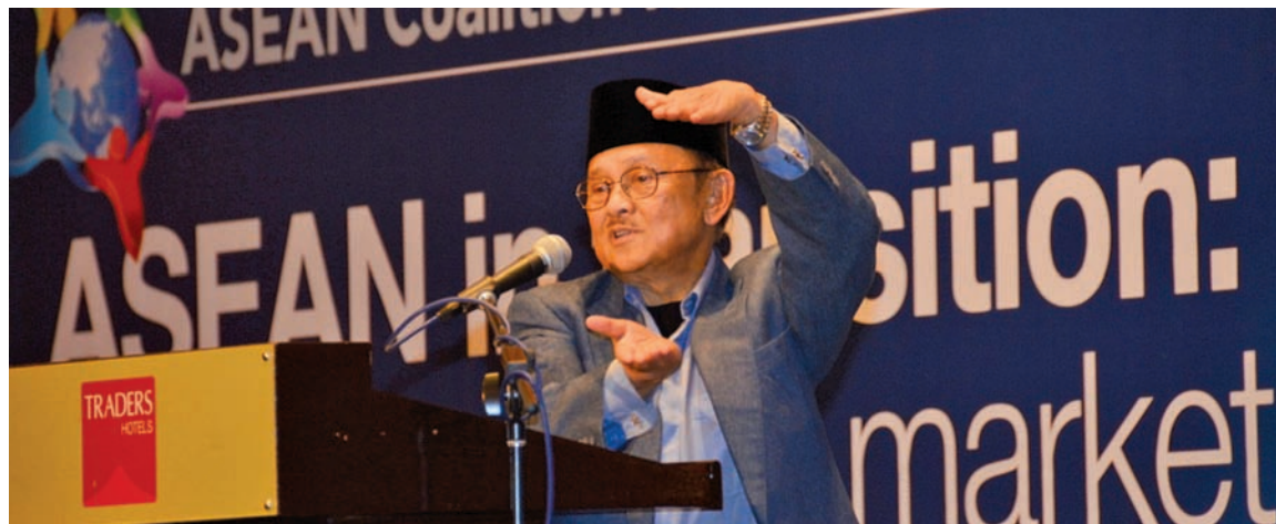
BJ Habibie talking about “ASEAN in Transition : From Emerging Markets to Clean Governance”.

“We know this effort towards clean governance is not easy. The corrupt cronies are strong but let us prove that honesty and people’s power is stronger.”