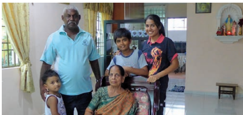
Dass and his mother together have a comfortable home which is on the same spot where their old house was.