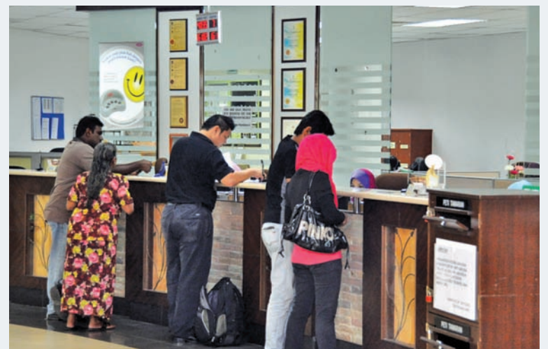
Ratepayers paying their bills at MPSP counter in Bandar Perda.