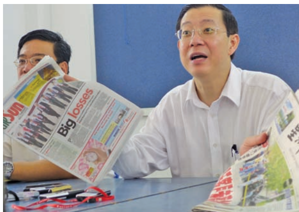
Lim showing to members of the media the headlines on the losses faced by the depositors published by several newspapers.

"Now, isn't it Bank Negara and BN's responsibility to take action against those involved? Bank Negara should investigate if any party is using it as a front for money laundering. Where did the money go? I am sure