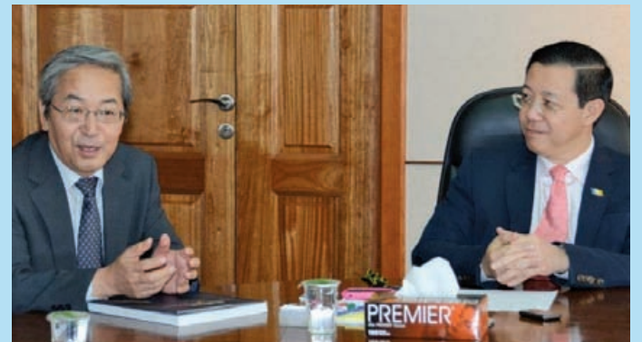
新领事野田（左）表示，这是他第一次来到檳城，11月尾才刚正式上任的他已经可以感受到檳城人的热情，虽然天气还是炎热些，但是还是挺舒适的。

他说，许多日本人在檳城居住，而檳城更是有许多日本企业、学校、餐厅等，日本人所经营的高尔夫球场等，甚至檳城有着日本最盛大的节日日本鬼节。