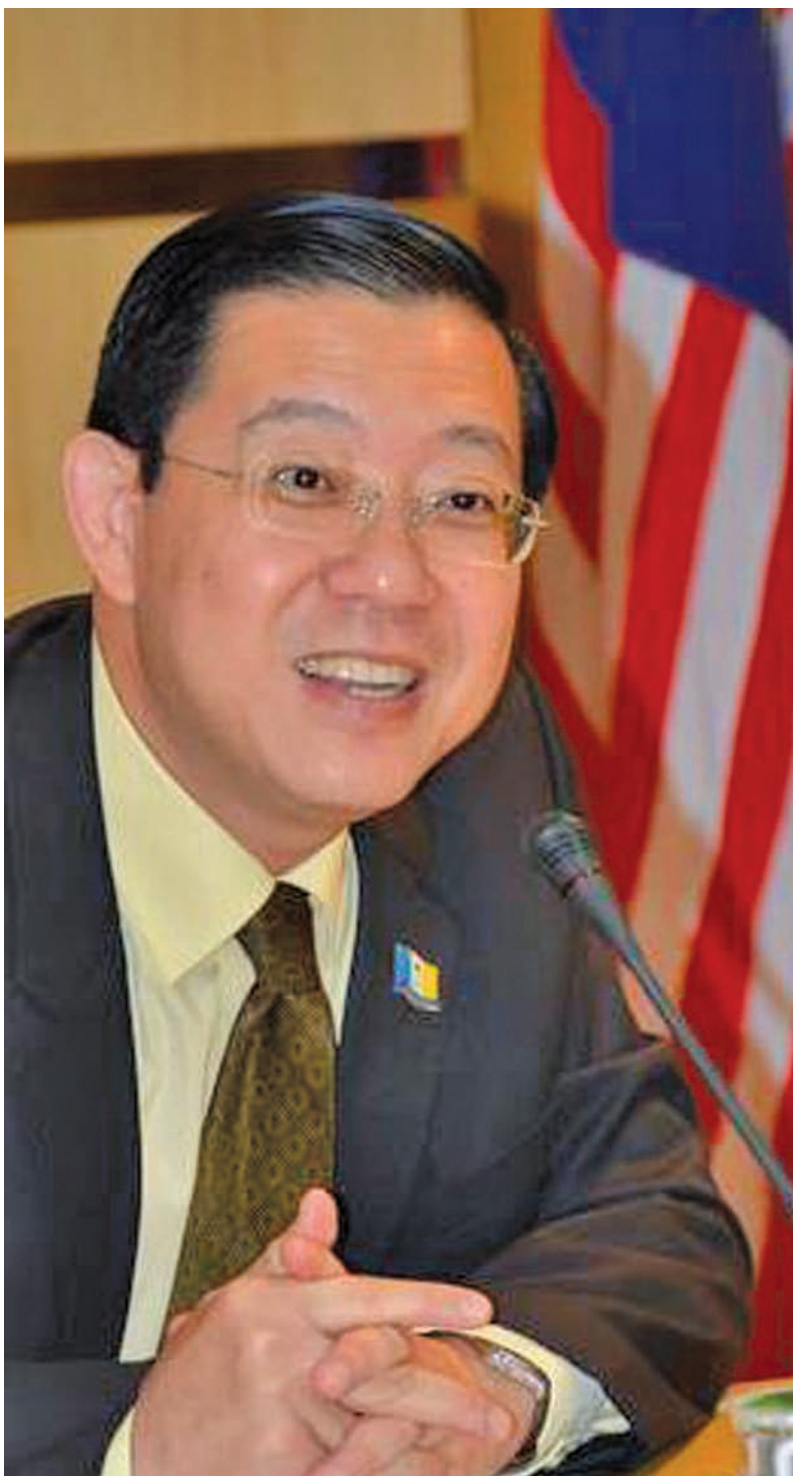
槟州首长林冠英认为，首相送槟州人民两大礼，那就是承诺如果国阵重掌槟州或考虑建单轨轻快铁，并兴建2万间可负担人民房屋，很明显地这是买票行为，也承认国阵从前无法兑现诺言。（档案照）

首相拿督斯里纳吉日前访槟派大选糖果，许下承诺称如果国阵重夺槟州政权，将“考虑”建单轨轻快铁及兴建2万间可负担人民房屋；槟州首长林冠英则认为，首相送槟州人民两大礼，承诺如果国阵重掌槟州或考虑建单轨轻快铁，并兴建2万间可负担人民房屋，很明显地这是买票行为，也承认国阵从前无法兑现诺言。