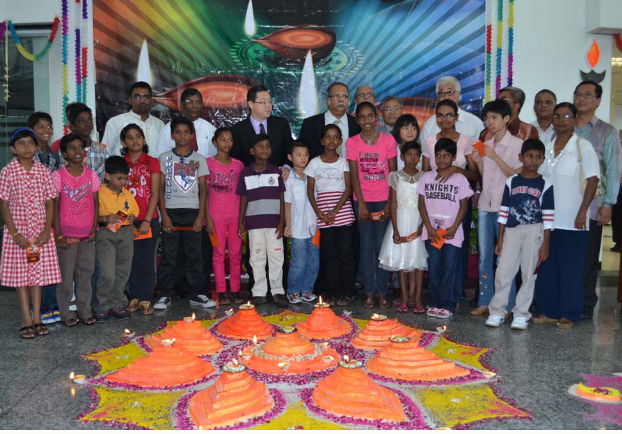
கையில் அன்புத்தொகையுடன் ஸ்ரீ சஹயா சமூக இல்லக் குழந்தைகள். அவர்களுடன் மாநில முதல்வர் மாண்புமிகு லிம் குவான் எங்கும் உயர்மட்டத் தலைவர்களும்