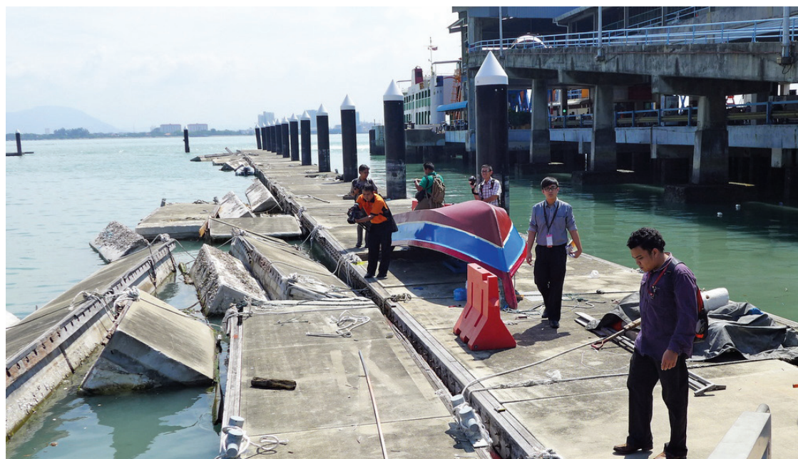
Media photographers and videographer documenting and filming the sad state of the Tanjung Marina with broken pontoons.

TCM sits on a 3.96 acre piece of land belonging to MPPP while the building was built by Penang Port Commission (PPC) and managed by Penang Port Sdn Bhd. (PPSB). PPC had written twice to the Penang State Town and Country Planning department to request for Temporary Occupation Certificate as they were unable to obtain TOC because of money owing to IWK which amounted to RM871,740.00