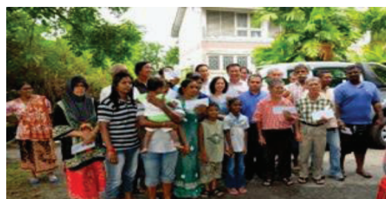
Donations given to the storm victims at Jalan Mak Mandin.