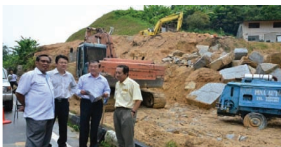
EXPLORING the Intersection Upgrade Project sites at Jalan Tun Sardon/Jalan Paya Terubong.