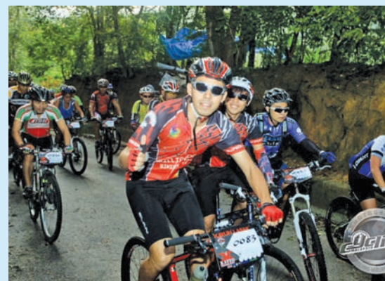
Kayuh Lasak 2012 participants going uphill.

The shortest time taken to complete the adventurous trail was about three hours but mountain bikers know that this is not a competition and timing is not as important as the sportsmanship, stamina and pride of completing the whole ride.