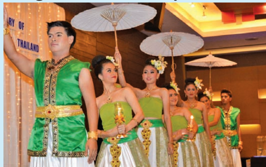
The dancers putting on a performance for guests present.