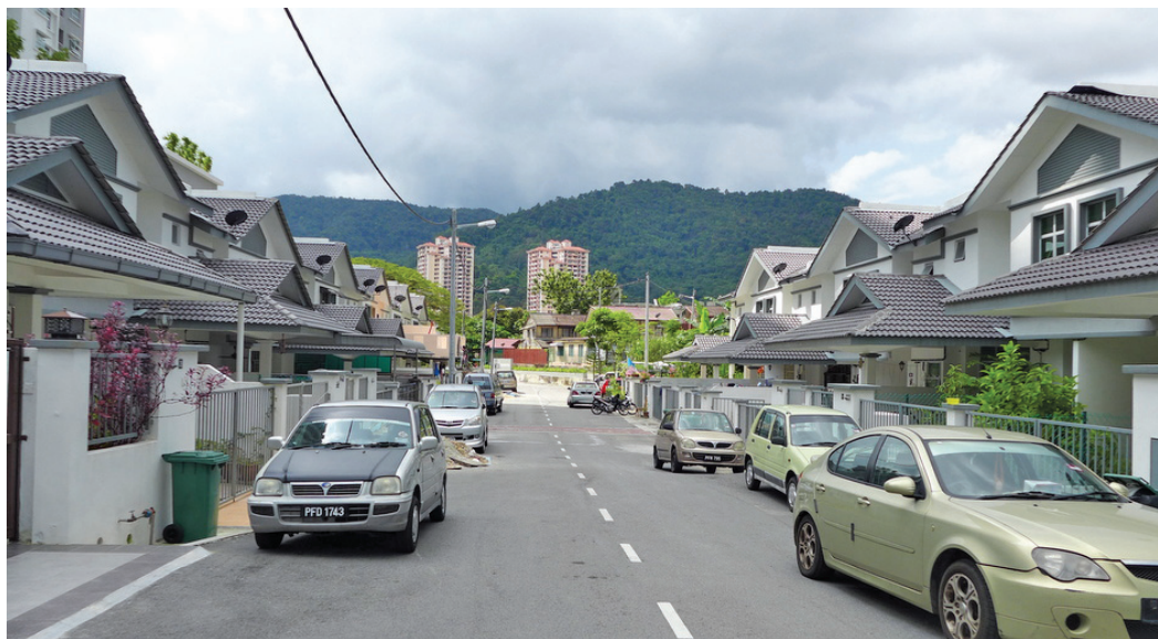
The two rows of compensated landed properties in Taman Buah Pala where the former Kampung Buah residents are staying now.