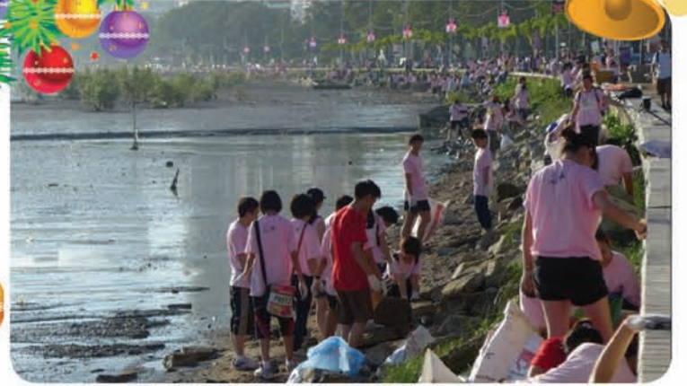
தூய்மையான பசுமையான பிளாங்கு என்னும் கொள்கையை நிலைநாட்ட அண்மையில் கெர்னி கரையைத் தூய்மைபடுத்திய தன் ஆர்வளர்களைப் படத்தில் காணலாம்.