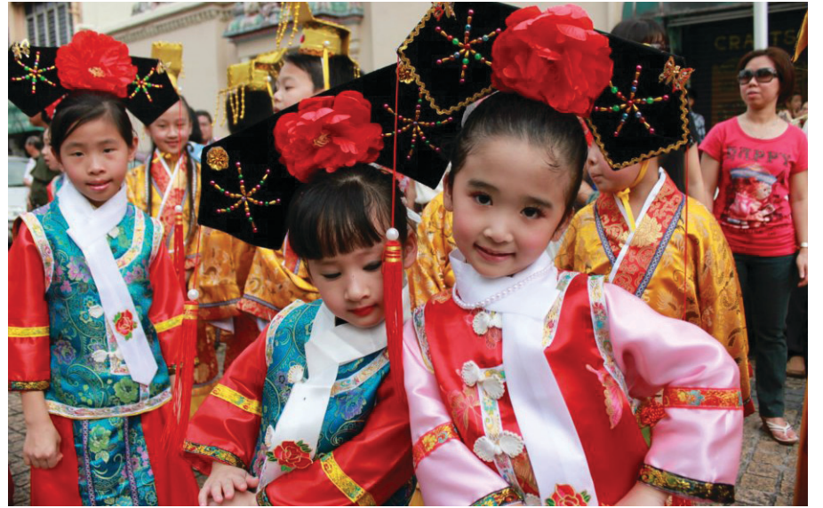
AKSI beberapa kanak-kanak yang bakal membuat persembahan pada Majlis Sambutan Kebudayaan dan Warisan Tahun Baru Cina di Jalan Kapitan Keling.