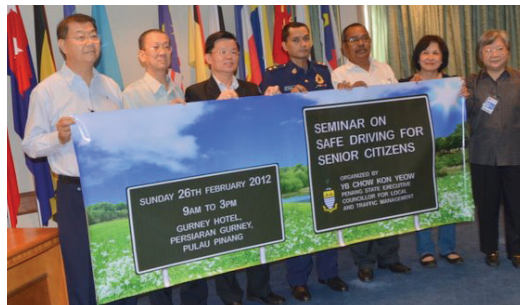
CHOW Kon Yeow (tiga dari kiri) bergambar kenang-kenangan bersama barisan penganjur seminar ‘Keselamatan Anda Tanggungjawab Kami’ khusus untuk warga emas di sini baru-baru ini.

Menurut Pengerusi Jawatankuasa Kerajaan Tempatan dan Pengurusan Lalulintas, Chow Kon Yeow yang ditemui pada sidang medianya, seminar tersebut diadakan bagi meningkatkan kesedaran mengenai keselamatan jalan raya, menjadi pengguna yang bertanggungjawab dan dalam jangka masa panjang mengukuhkan mod pengangkutan awam untuk memberikan