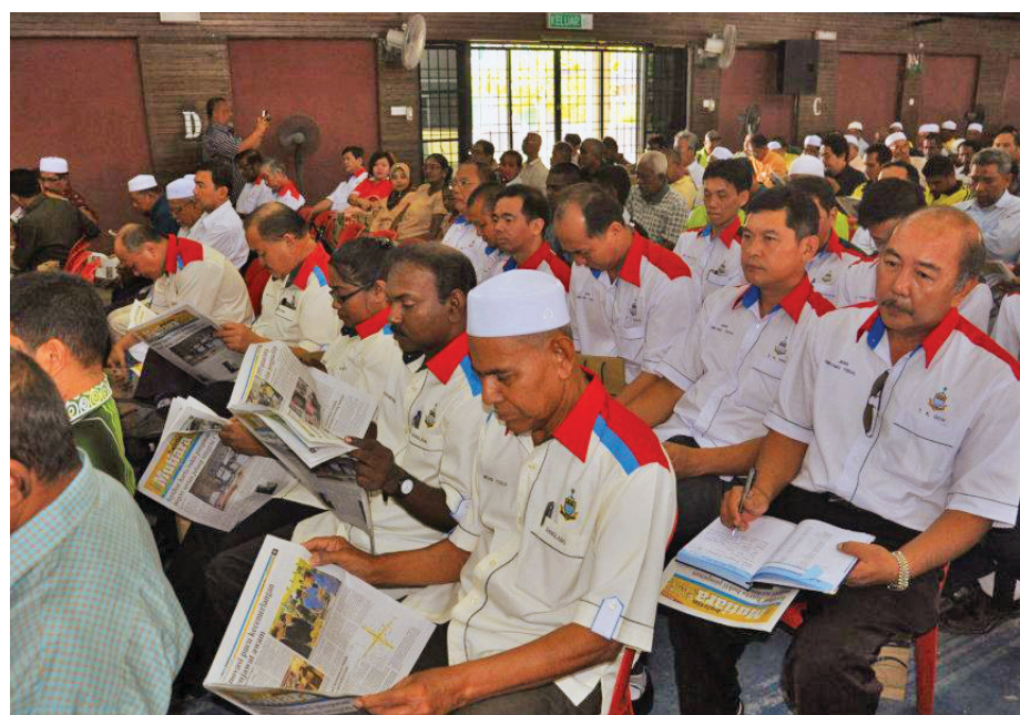
JAWATANKUASA Kemajuan dan Keselamatan Komuniti (JKKK) Bahagian Se- berang Perai membaca liputan berita Buletin Mutiara sementara menunggu ketibaan dif-dif jemputan khas pada Program Ketua Menteri Bersama ADUN, JKKK dan Pegawai Penyelaras KADUN Bahagian Seberang Perai di Dewan Besar Sungai Dua.