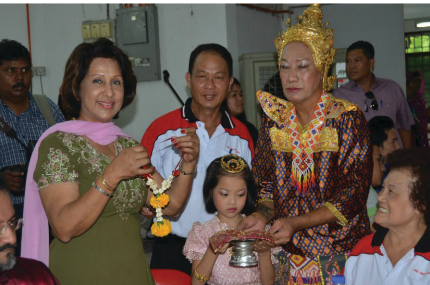
RI kepada Ahli Parlimen Bukit Gelugor memegang kalungan bunga un- disampaikan kepada para penari sempena Majlis Rumah Terbuka Tahun Cina DUN Datuk Keramat.