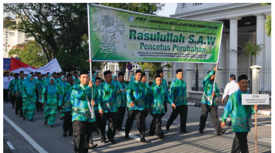
delegasi Ahli Dewan Undangan Negeri (ADUN) turut serta dalam perarakan yang disertai oleh 46 kontijen dan 2,000 peserta.