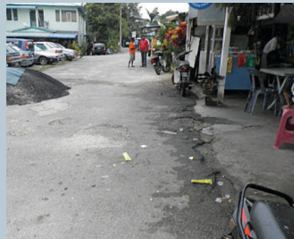
KEADAAN jalan yang tidak sekata dan berlubang membahayakan pengguna.