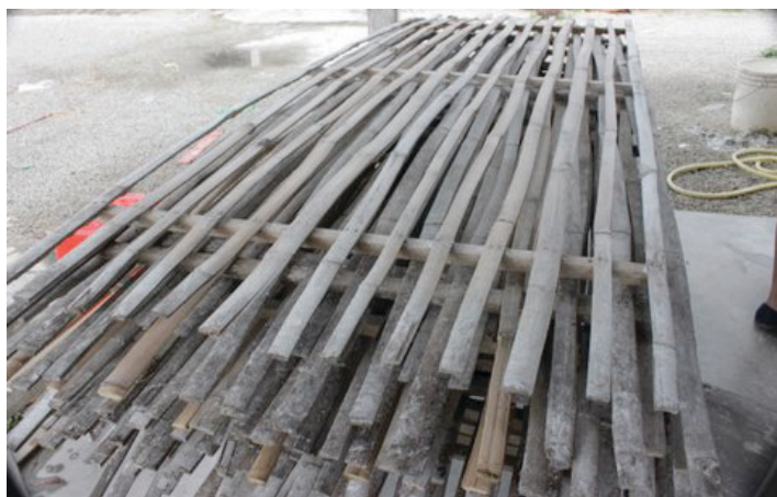
AMPAIAN yang digunakan untuk proses pengeringan bedak sejuk.

“Selepas dua minggu, beras yang direndam akan menjadi liat, berbau seperti