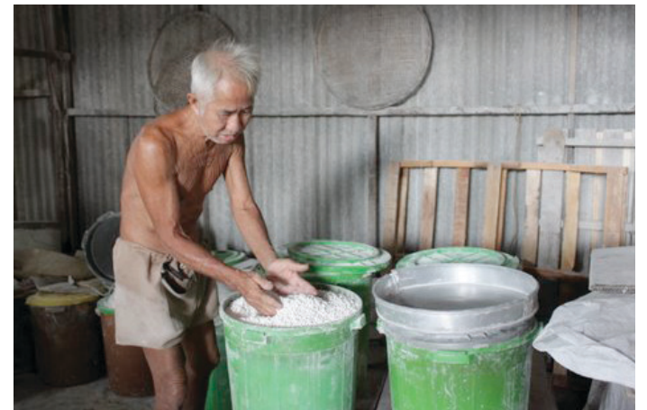
UNCLE menunjukkan bedak sejuk yang telah dikeringkan dan sedia untuk dimasukkan ke dalam botol untuk dipasarkan.