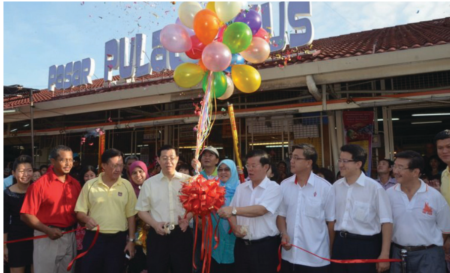
KETUA Menteri (depan, empat dari kiri) bersama Patahiyah Ismail (tengah, bertudung) dan Chow Kon Yeow (empat dari kanan) melepaskan belon simbolik Perasmian Pasar Pulau Tikus di sini baru-baru ini