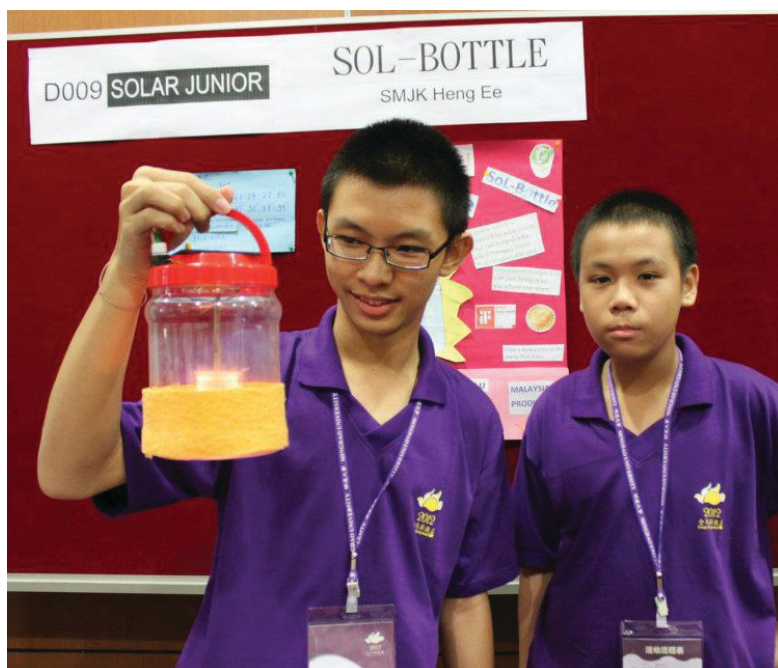
SEORANG pelajar menunjukkan reka ciptanya pada penganjuran Pameran dan Pertandingan Reka Cipta Solar Malaysia di SMJK Heng Ee.