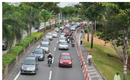
KESESAKAN lalulintas dirakamkan pada waktu puncak yang terpaksa dilalui oleh pengguna saban hari kini.

Guan Eng berkata, lebih 300,000 kenderaan melalui lebuhraya berkenaan