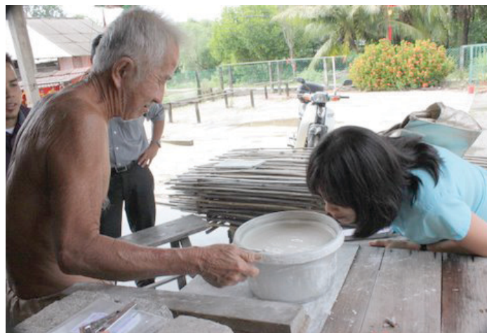
PENULIS cuba menghidu cecair bedak sejuk yang berbau seperti tapai.

Kepada mereka yang tidak mengenali bedak sejuk, lontarkanlah persoalan tersebut kepada ibu, bapa atau nenek masing-masing. Dahulu kala, bedak sejuk merupakan satu-satunya produk kecantikan yang digunakan oleh kaum hawa untuk menghaluskan kulit sebagai tarikan pemikat.