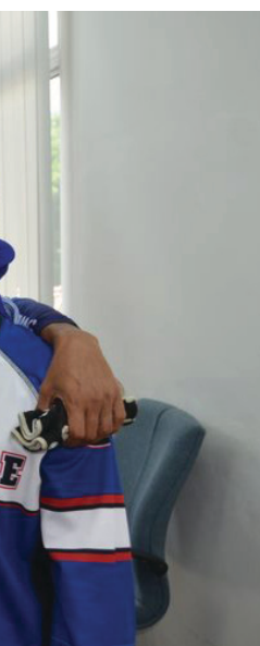
I Amal Pulau Pinang ahli keluarganya se-