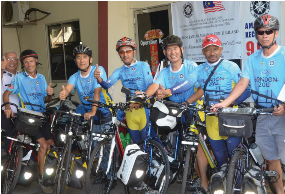
PASUKAN berbasikal "Kayuhan Basikal Amal Pulau Pinang ke London 2012" bagi mengumpulkan dana RM2 juta untuk badan bukan kerajaan (NGO), St. John Ambulan Pulau Pinang.