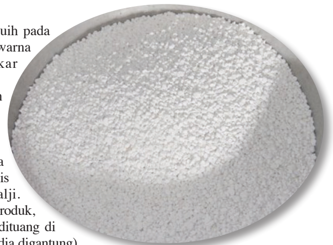
BEDAK sejuk yang telah dikeringkan.

bedak-bedak sejuk tersebut kemudian dimasukkan ke dalam botol secara manual untuk dipasarkan.