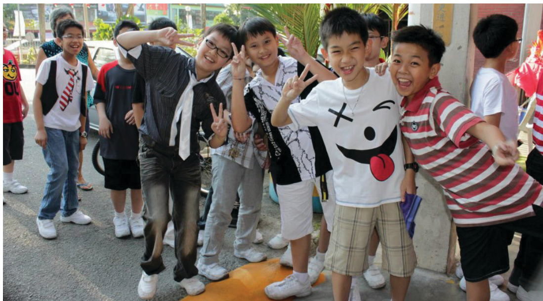
SEKUMPULAN pelajar SJK (C) Kwang Hwa, Butterworth ceria selepas menyerahkan per- mainan lama kepada Pertubuhan Wanita Mutiara untuk tujuan amal.