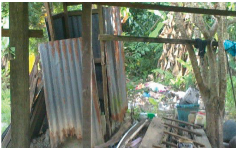
KEADAAN tandas usang yang bakal dinaiktaraf hasil inisiatif khas PPK Bertam.

Selain pasangan suami isteri itu, turut dibanci adalah lima kediaman lain yang turut dikategorikan sebagai kurang berkemampuan dan memerlukan bantuan segera untuk memperbaiki rumah sedia ada.