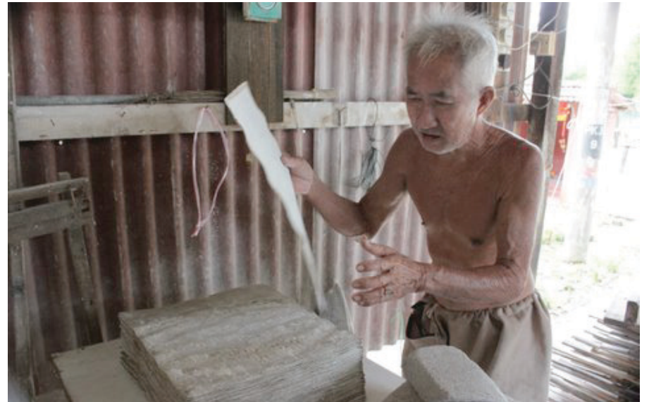
UNCLE menunjukkan kertas yang menjadi pelapik bedak sejuk untuk dikeringkan.