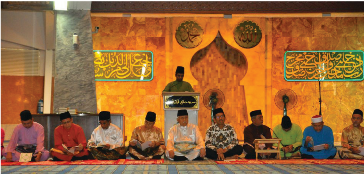
TUAN Yang Terutama Yang Dipertua Negeri, Tun Abdul Rahman Abbas (lima dari kiri) bersama barisan kepimpinan Kerajaan Negeri pada Majlis Kesyukuran Bacaan Yassin Sempena Sambutan Maulidur Rasul 1433H/2012M di Masjid Negeri Pulau Pinang.