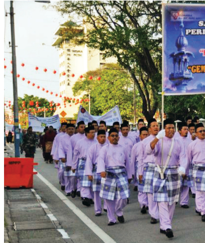
AKSI kontinjen Tenaga Nasional Berhad (TNB) pada persembahan Maulidur Rasul 1433H/2012M Peringkat Negeri Pulau Pinang.