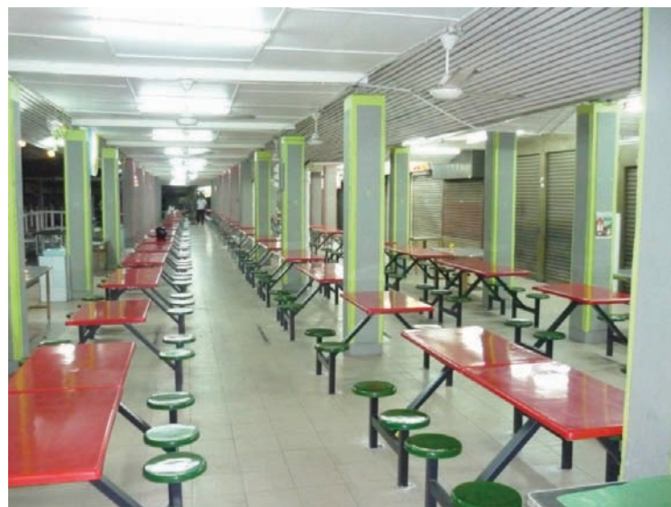
KEADAAN Astaka Selera Taman Tun Sardon yang lebih selesa dan bersih.

Di samping penyediaan 115 set meja dan kerusi, pembaikan siling dan tiang, turut dilaksanakan adalah beberapa kelengkapan kemudahan tambahan kepada 26 peniaga di sana.