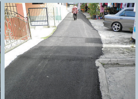
JALAN bertar di Kampung Nelayan, Sungai Batu yang telah siap diturap.