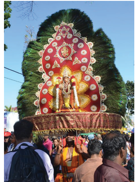
ANTARA kavadi yang dibawa berarak berjalan menuju ke kuil.