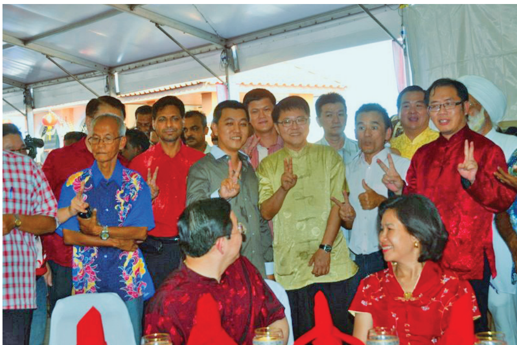
KETUA Menteri dan isteri tersenyum melihat gelagat Ahli-Ahli Dewan Undangan Negeri yang hadir pada Majlis Rumah Terbuka Tahun Baru Cina Barisan Nasional di Tanjung Marina, Weld Quay.