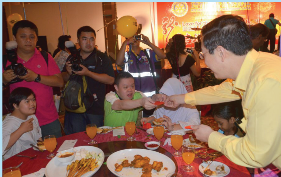
KETUA Menteri menyerahkan 'ang pow' kepada salah seorang kanak-kanak istimewa pada Majlis Makan Tengahari Sambutan Tahun Baru Cina di Sunway Karnival, Seberang Jaya, di sini baru-baru ini.

Bagi memeriahkan majlis, beberapa persembahan istimewa juga telah disajikan kepada tetamu seperti persembahan alat muzik dan tarian.