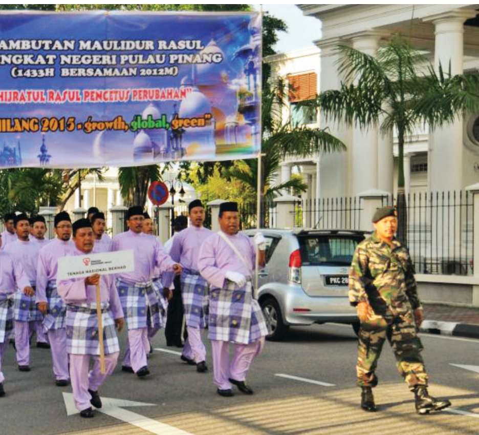
erarkan Sambutan ang.