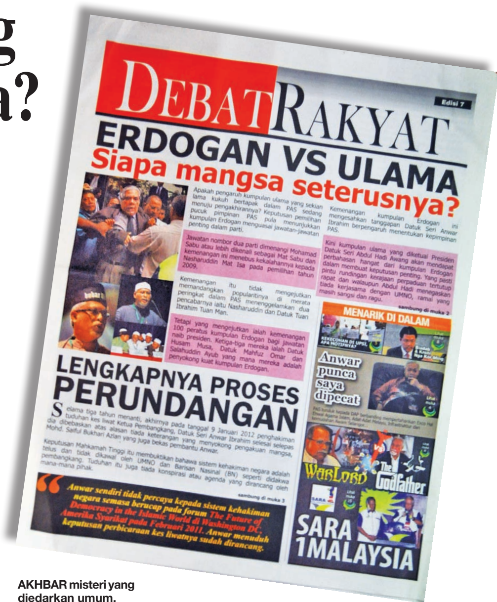
AKHBAR misteri yang diedarkan umum.

Dijangka, penyebaran akhbar berunsur hasutan dan fitnah oleh pihak tertentu akan diteruskan demi memujuk rakyat khususnya pengundi Melayu supaya menolak rekod perubahan yang dibawa oleh Kerajaan Negeri Pulau Pinang sejak empat tahun lepas.