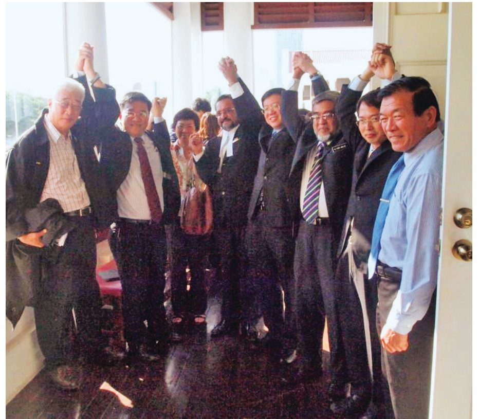
KETUA Menteri (empat dari kanan) bersama barisan Exco Kerajaan Negeri menunjukkan tanda kemenangan selepas Hakim mengumumkan keputusan kes fitnah membabitkan Utusan Malaysia di sini baru-baru ini.

menerima dan menyokong penuh keputusan Mahkamah Tinggi berharap penghakiman ke atas Utusan menjadi iktibar kepada media arus perdana yang lain.