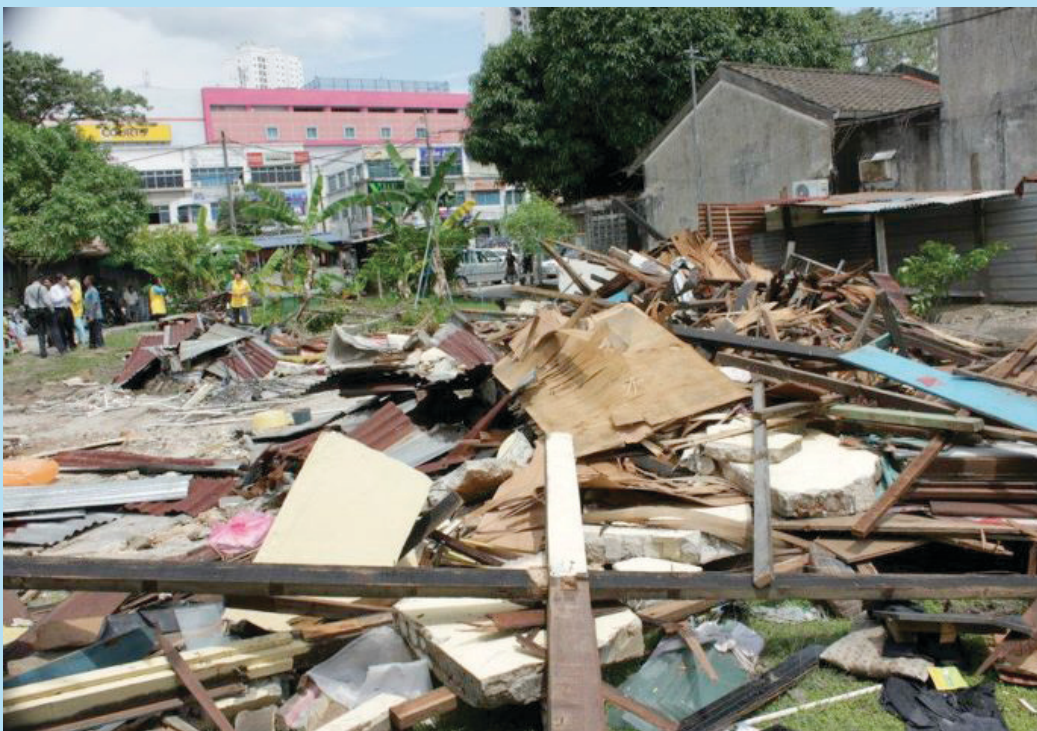
SISA kesan perobohan rumah pusaka di Sungai Nibong.