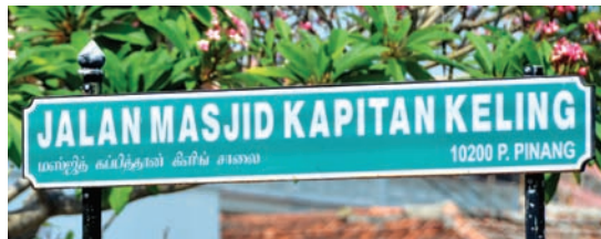
Road names in Tamil.

even land are also made available for Tamil schools and Indian temples. It has also been unprecedented in Malaysia's history that Tamil has been included in public road signs, such as those in George Town.