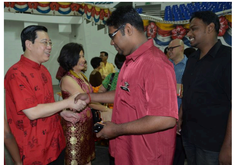
திறந்த இல்ல உபசர்ப்பில் வருகையாளர்களை வரவேற்கும் முதல்வர் தம்பதியர்.