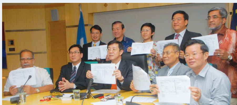
Penang State Exco members declared their assets on January 2012.