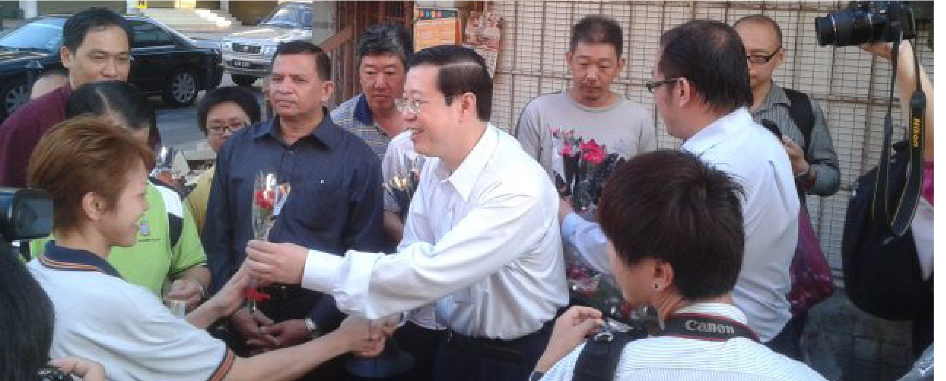
அன்பர்கள் தினத்தில் மக்களுக்குப் பூக்கள் தந்து வாழ்த்தும் முதல்வர்