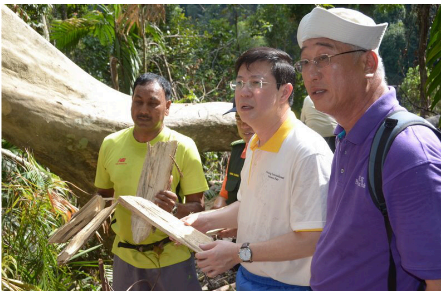
கள்ளத்தனமாக வெட்டப்பட்ட மரங்களை முதல்வர் பார்வையிடுகிறார். அருகில் சட்டமன்ற உறுப்பினர் தரு பி யுன் போ.