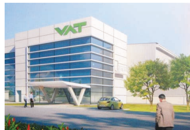
Artist impression of the VAT factory.

VAT came to a very quick decision in February 2011 to move to Penang also because its customers move from the USA to Asia. The company said it is confident of tripling its production in the years ahead.