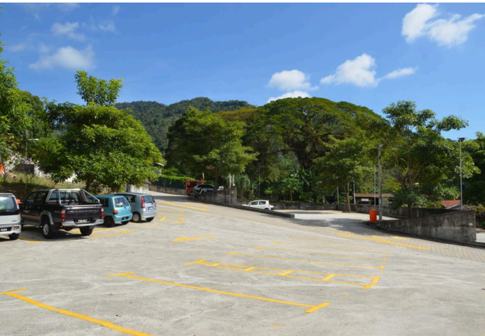
புதிய வாகன நிறுத்துமிடம்.