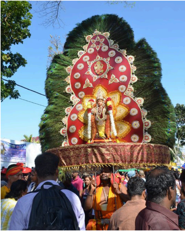
கண்களும் மயில் காவடி

நமது மலேசியத் திருநாட்டில், தீபாவளி, பொங்கல் திருநாளை அடுத்து இந்துக்கள் விமரிசையாகக் கொண்டாடும் பண்டிகைகளில் தைப்பூசத் திருநாளும் ஒன்று. பல்லின மக்கள் வாழும் நம் மலை நாட்டில் தைப்பூசத் திருநாள் மாபெரும் சமய விழாவாக உருப்பெற்றுள்ளது. இதில் இந்துக்கள் மட்டுமின்றி சீனர்களும், பிற வெளிநாட்டுச் சுற்றுப்பயணிகளும் திரளாகக் கலந்துக் கொள்கின்றனர். இன்னும் சிலர் ஒரு படி மேலே போய் காவடிகளும் தூக்குகின்றனர். மலேசியாவில்