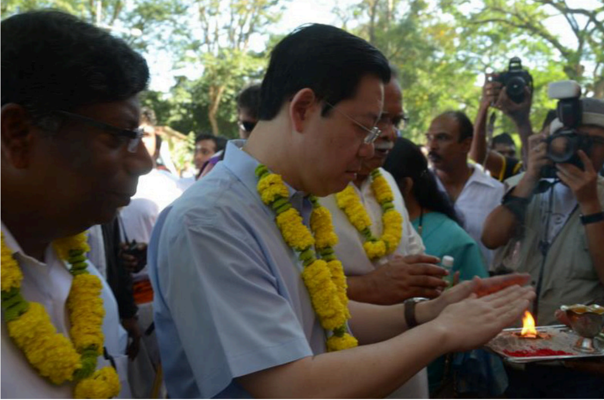
கற்புரத்தைத் தொட்டு வணங்கும் முதல்வர்