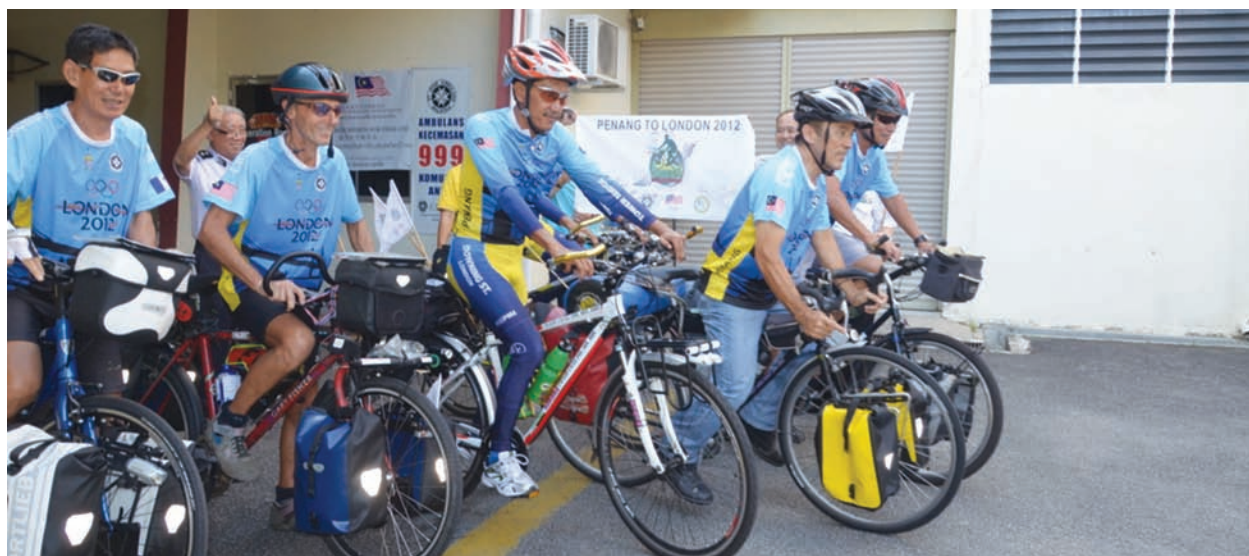
The team leaving for London.