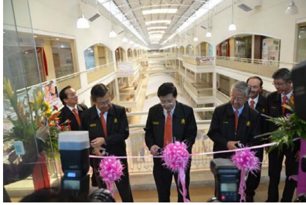
மலேசிய உற்பத்தியாளர்கள் சம்மேளனத்தின் அலுவலகத்தை முதல்வர் (நடுவில்) திறந்து வைக்கிறார்.

மலேசிய உற்பத்தியாளர்கள் சம்மேளனத்தின் அலுவலகம் இவ்விடம் திறக்கப்படுவதன் மூலம் பிளாங்கின் அடையாளத்தை வெளியுலகிற்கு உணர்த்த ஒரு மைல்