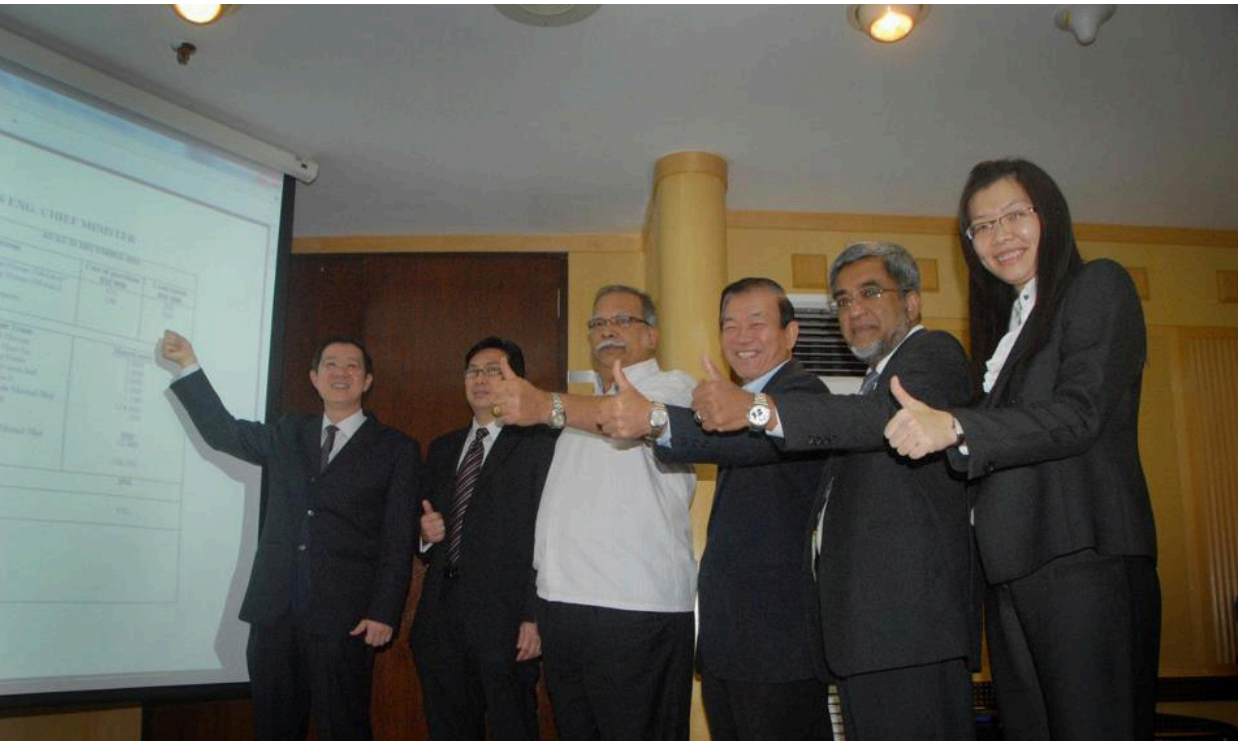
முதல்வருடன் இணைந்து சொத்து விவரங்களை வெளியிட்ட ஆட்சிக்குழு உறுப்பினர்கள்

நேர்மையான தலைவர்களே நாட்டினை நேர் வழியில் கொண்டு செல்ல முடியும். மக்களுக்கும் நன்மைகளைக் கொண்டு சேர்த்திட முடியும். பிணங்கு மாநில மக்கள் கூட்டணி அரசு இதனை நன்கு உணர்ந்து தெளிந்துள்ளது என்று கூறினால் அது என்றுமே மிகையாகிவிடாது.