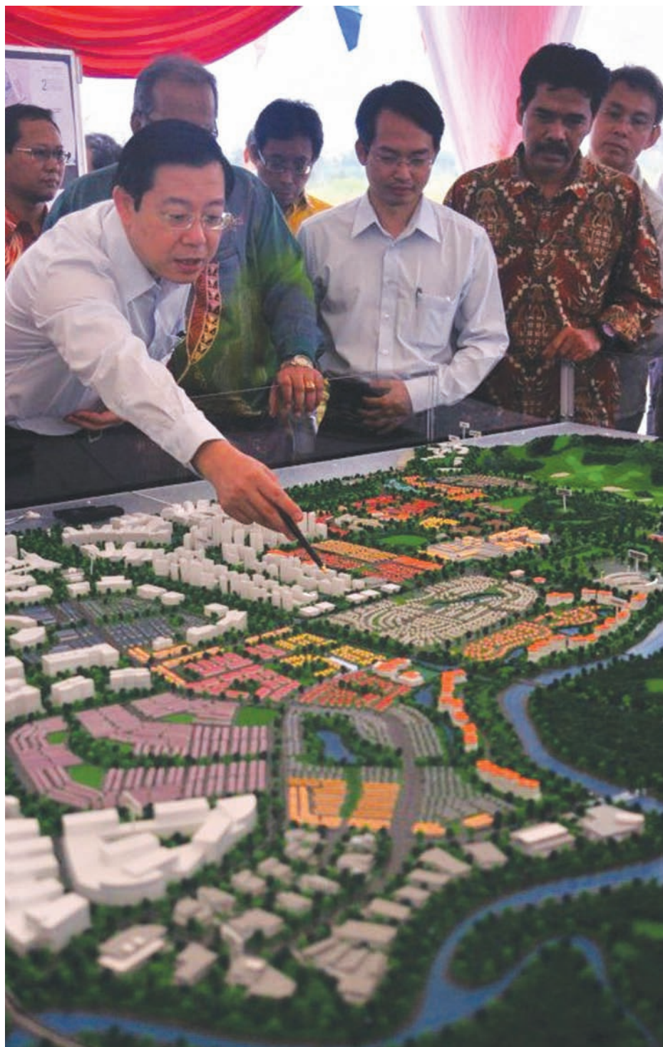
槟州首长林冠英表示，峇都加湾桂花城可负担房屋计划的首阶段工程将兴建2000个单位，每单位的建筑面积约800平方尺，每栋公寓的高度不同，那就是分别会有9楼或16楼，预计首阶段工程将于2015年竣工。