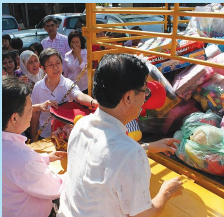
北海光华小学的学生及家长在过去1年收集了逾千件二手玩具，在响应这项运动的同时，也借着这项运动培养孩子的同理心。