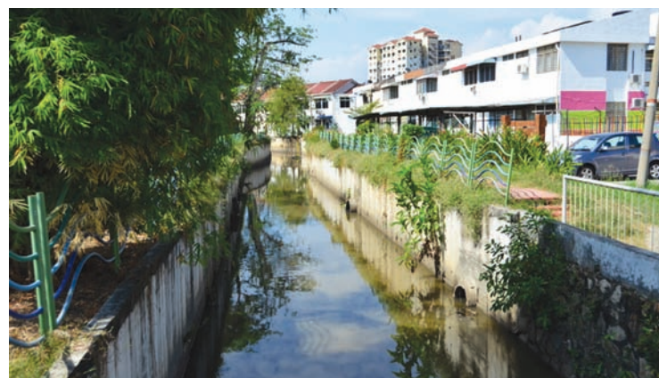
The widening of Sungai Jelutong has eased the flood woes faced by the people.