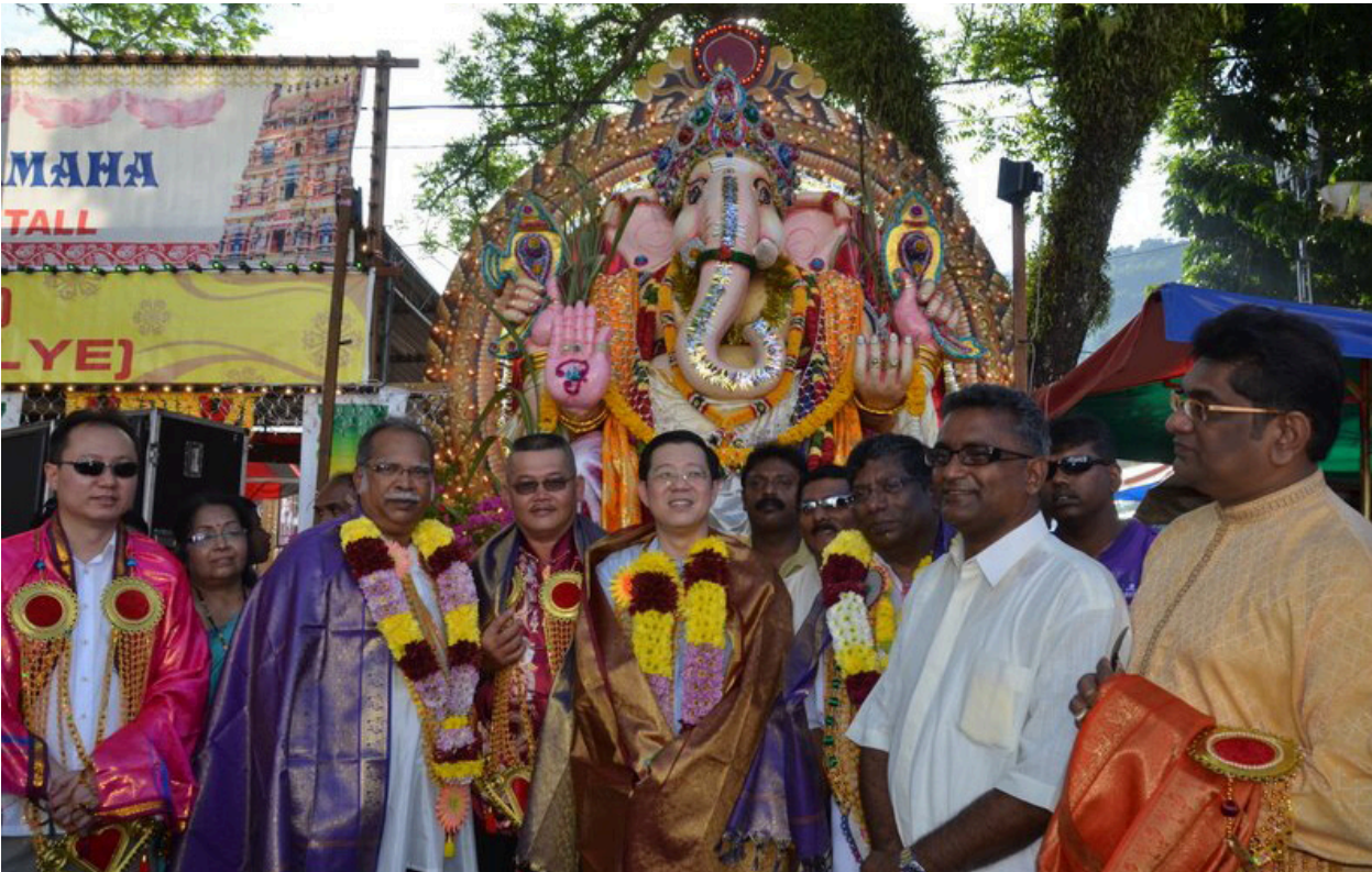
தண்ணீர் பந்தங்களுக்கு வருகையளித்த முதல்வர், துணை முதல்வர் மற்றும் ஏனைய ஆட்சிக்கு உறுப்பினர்கள்

தைப்பூசம் என்பது உலகெங்கும் பரவி உள்ள சைவ சமயத்தைச் சார்ந்த தமிழர்களால் கொண்டாடப்பட்டு வரும் ஒரு விழாவாகும். தை மாதம் தமிழர்களுக்குப் புனிதமான மாதமாகும். முருகனுக்கு உகந்த தினம் தைப்பூச தினம் என்பர். ஒவ்வொரு வருடத்திலும் தை மாதம், பூச நட்சத்திரமும் பெளர்ணமி திதியும் கூடி வரும் நன்னாளில் முருகனுக்கு எடுக்கப்படும் விழாவினையே நாம் தைப்பூசம் என்றழைக்கிறோம்.