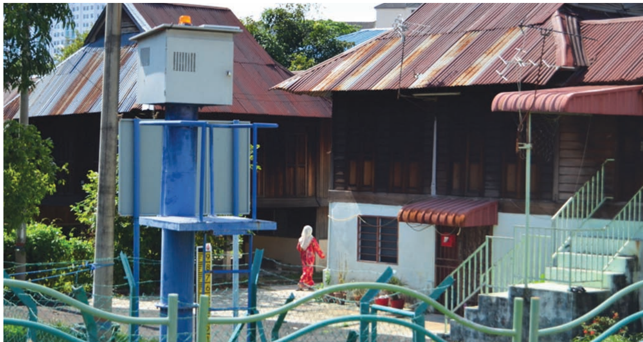
Flood sirens installed to alert residents.

Jagdeep also pointed out other factors that have helped to curb floods, such as of the reduction in use of plastic bags after Penang implemented the 'No Free Plastic bags' campaign.