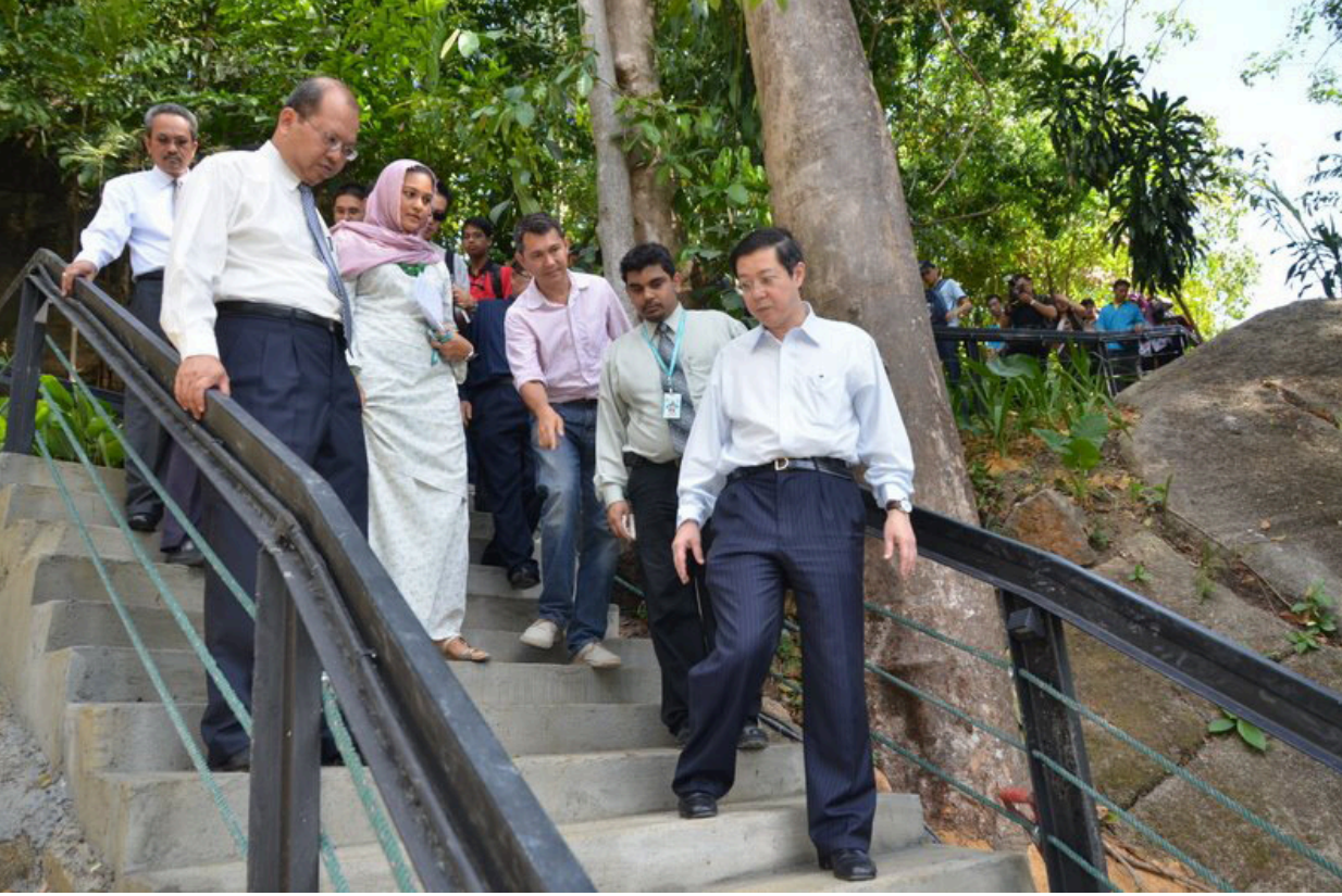
இயற்கை நடைபாதையை பார்வையிடும் முதல்வர் ஸ்ரீ.