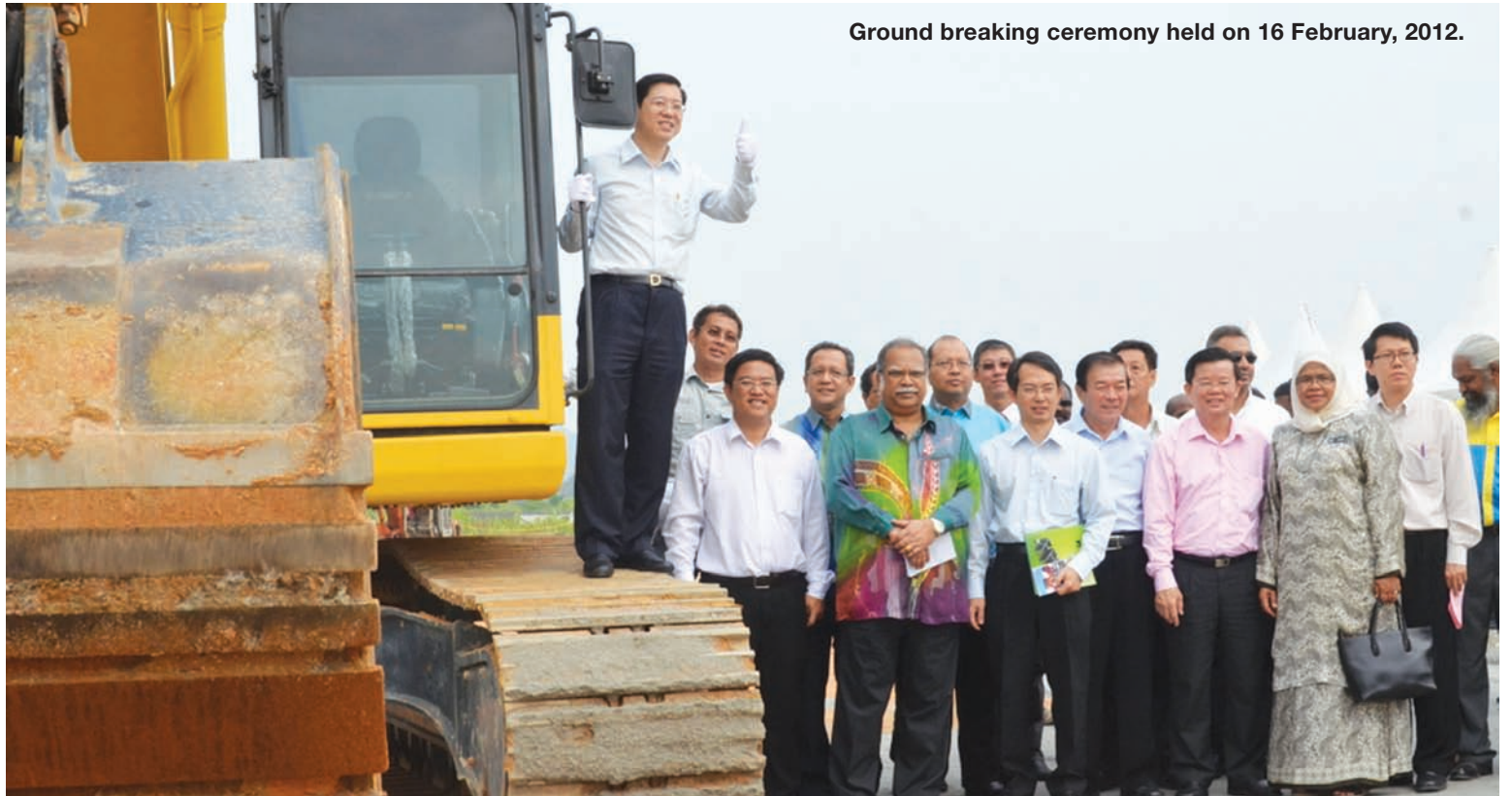
Ground breaking ceremony held on 16 February, 2012.

The first phase consists of 16 blocks of about 2,000 units. The project is scheduled to begin by the end of this year and will take about three years to complete. The ground-breaking ceremony for the project was held on 15th February.