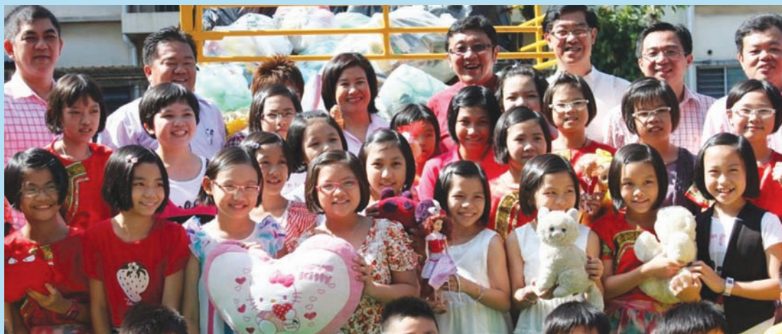
由槟州国州议员夫人协会推动的槟州玩具图书馆计划获得热烈响应，北海光华小学学生及家长在过去1年收集了逾千件二手玩具，移交给槟州国州议员夫人协会主席周玉清州议员（后排中）。

北海光华小学为响应这项活动，该校学生及家长在过去1年收集了逾千件二手玩具，并且于2月11日移交给该协会。