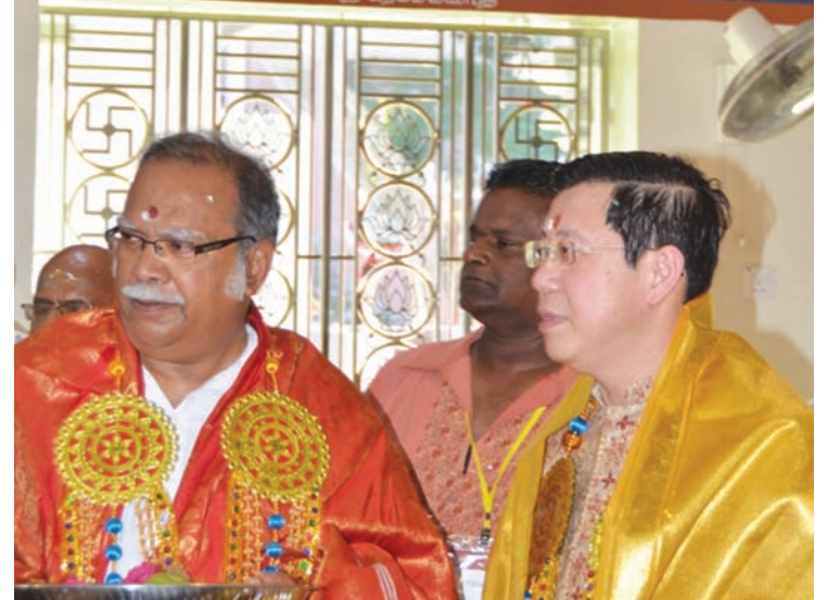
Chief Minister Lim Guan Eng and Deputy Chief Minister II Prof. Dr. P. Ramasamy at the Thaipusam festival.