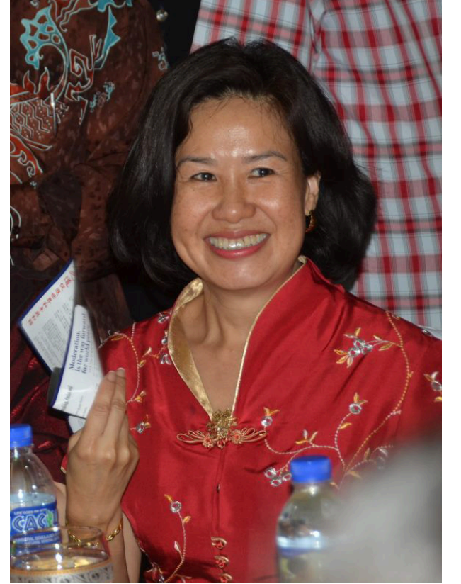
பிளாங்கில் நடைபெற்ற தேசிய முன்னணியின் சீனப்புத்தாண்டு கொண்டாட்டத்தில் புன்முறுவலோடு தருமத் பெத்த சயு