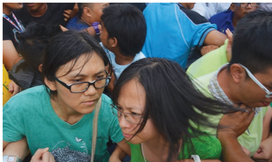
Two girls were shoved and pushed during the Himpunan Hijau Anti-Lynas protest by people believed to be members of UMNO and Perkasa.

have changed a lot. There are good changes but there are also several incidences from restless parties. Demonstrations, chaotic and unruly behaviour, protests etc are some of the problems we undergo for making that decision to vote for change.