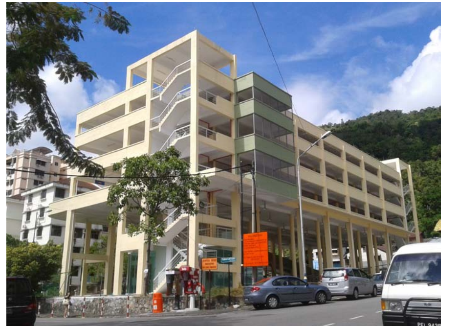
சர்ச்சைக்குரிய அடுக்குமாடி வாகன நிறுத்துமிடம்.