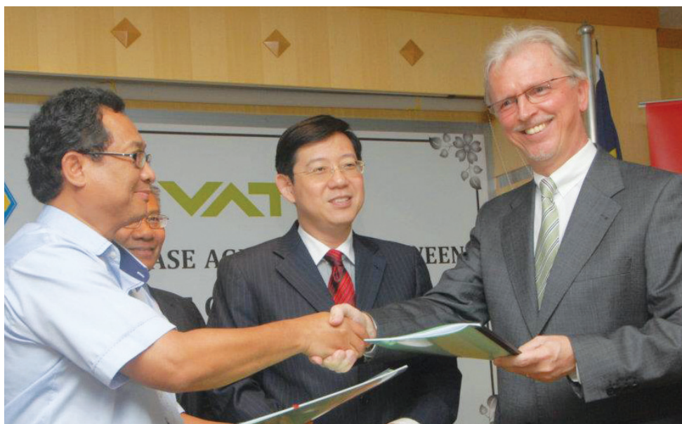
Signing ceremony of the sale and purchase agreement between VAT and Penang Development Corporation (PDC) on February 8, 2012, at Komtar.

“PENANG is clearly superior to others. The decisive factors were the availability of qualified staff, being able to call on high-quality, competent suppliers, modern transportation infrastructure and an attractive level of costs. What particularly weighed in the balance is the exemplary support from InvestPenang and the Malaysian Investment Development Authority (MIDA).”