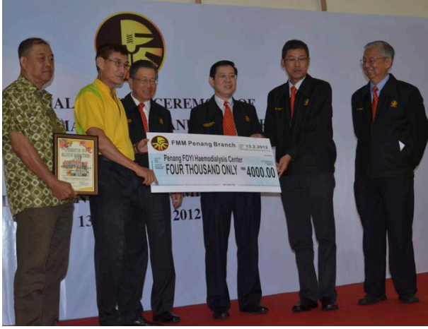
இரத்த சுத்தகரிப்பு நிலையத்திற்கு முதல்வர் மாதர் காசோவை வழங்குகிறார்.