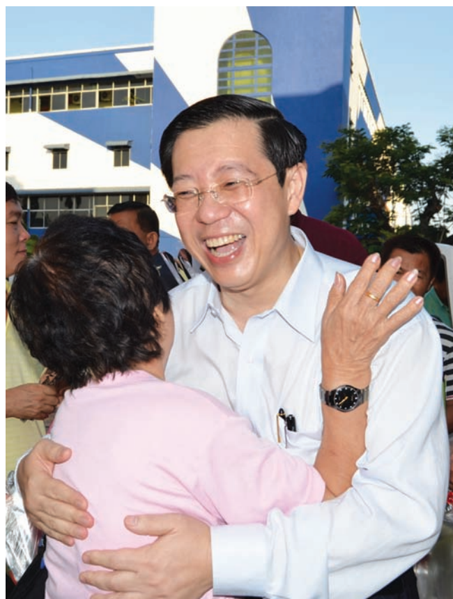
CM gets a hug at the Chowrasta market.

Some one thousand carnations were handed out, bringing smiles of friendship to all races on this special day.