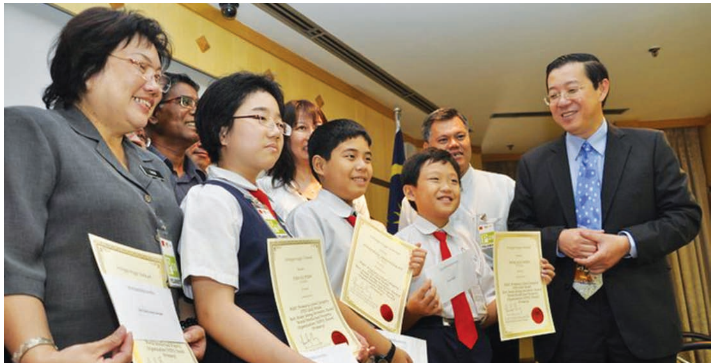
槟州民联政府在去年10月份宣布快乐学习计划，分发每人100令吉给一年级、四年级、中一及中四学生以减轻家长的负担，但槟州教育局迟迟未提供学生名单给州政府。（档案照）

PERMOHONAN RUMAH KOS RENDAH / SEDERHANA RENDAH