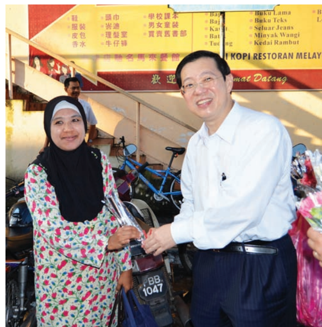
A stalk of fresh carnation is given to both genders on Valentine's Day .