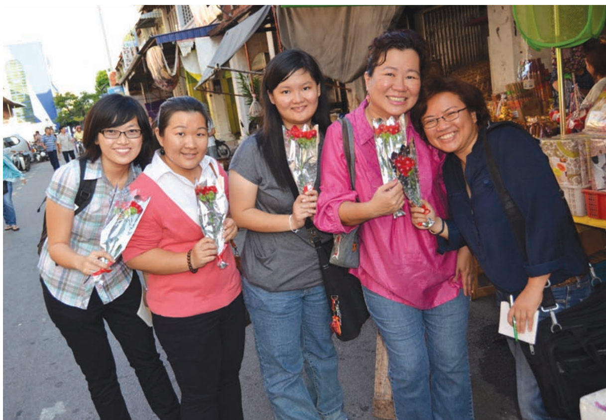
Reporters who covered the event also get a stalk of carnation .