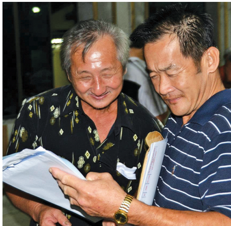
平安村村民顺利拿到已获更新的地契，脸上的笑容也随着扬起。

“州政府从未忘记对人民许下的承诺，首长这次亲自移交地契，证明民联政府是讲到做到的。”