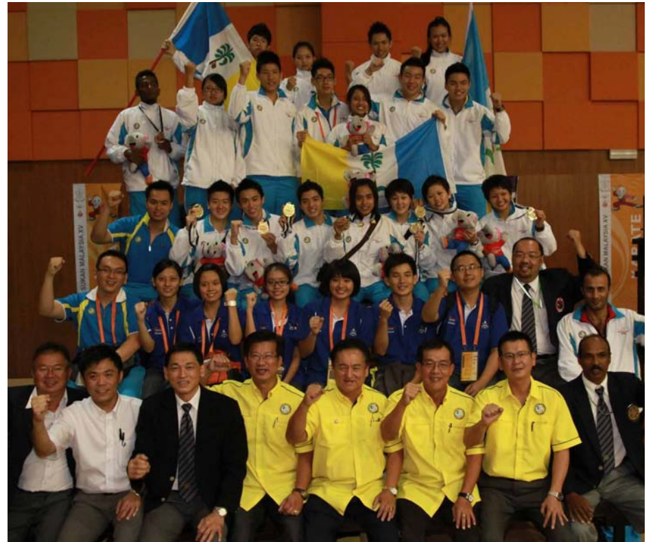
பிளாங்கு மாநிலத்தை பிரதிநிதித்து போட்டியாளர்கள்.

தொடக்கத்திலேயே பிளாங்கு மாநிலம் 3 தங்கம், 1 வெங்கலம் வென்று வெற்றியை முத்தமிட்டது.