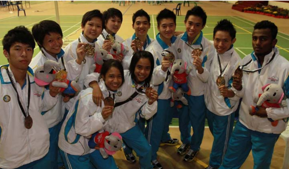
பதக்கம் வென்ற கராத்தே குழுவினர்.

16 தங்கம், 16 வெள்ளி, 32 வெங்கலம் என 16 பிரிவுகளாக மொத்தம் 64 பதக்கங்கள் போட்டியில் வெல்வதற்காக பிரித்து வைக்கப்பட்டன. போட்டியின் முதல் நாள்