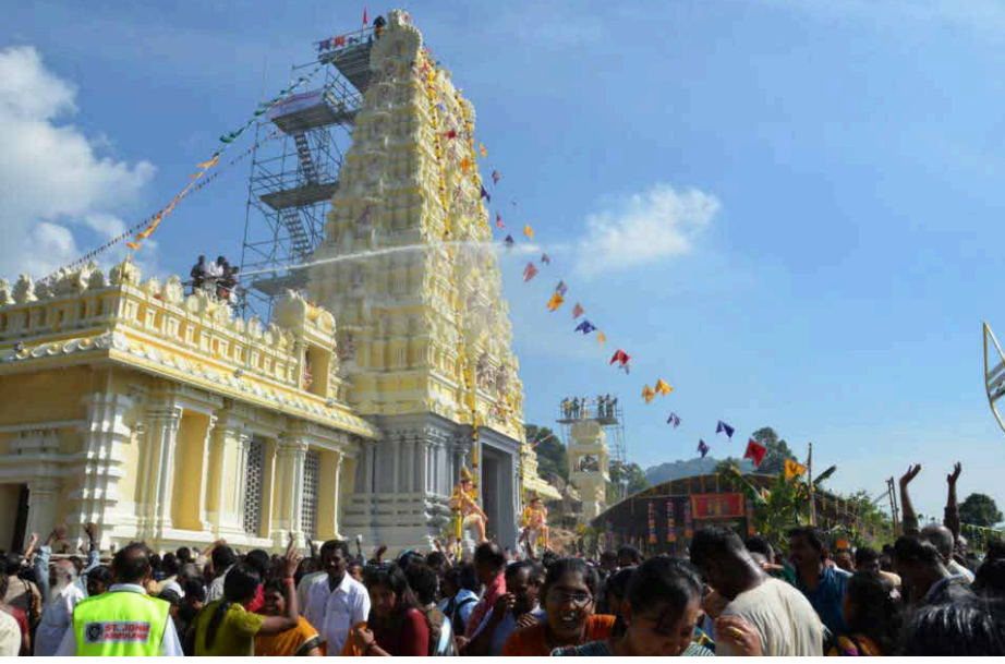
பக்தர்கள் மீது புனித நீர் பாய்ச்சப்படுகிறது

தென் கிழக்கு ஆசியாவிலேயே மிகப் பெரிய முருகப் பெருமான் கோவிலாக பிளாங்கு தண்ணீர்மலை பால தண்டாயுதபாணி கோயில் நிமிர்ந்து நிற்கிறது. இந்த ஆலயத்தின் திருக்குட நன்னீராட்டு விழா கடந்த ஜூன் 29-ஆம் திகதி வெள்ளிக்கிழமை அன்று மிக விமரிசையாக நடந்தேறியது.