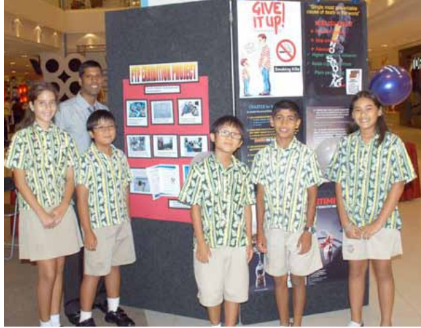
நகழ்ச்சியில் பங்கேற்ற சிறுவர் சிறுமியர்.

“பிறை மாநகராட்சி(MPSP) மற்றும் பிணங்கு தீவின் நகராண்மைக் கழகம்(MPPP) ஆகியவற்றிற்குப் பொது இடங்களில் வெண்சுருள் துண்டுகளை