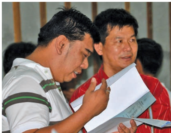
民联政府讲到做到，平安手握已获更新的地契，终于都能放下心中大石。

选更新60年或99年地契，同时还可以选择分6年（6期）摊还更新费，并且还获得槟州政府给予高达88%（60年）及90%（99年）折扣的地契更新方案，可谓槟州空前最大批的租赁地契更新案。