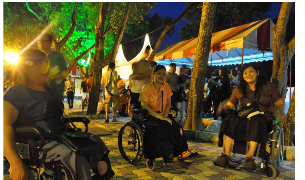
சக்கர நாற்காலியில் விழாவில் புன்னகையுடன் வலம் வந்த நங்கைகள்.

பசுமை விழாவில் இரசாயனங்கள், தூய்மைக்கேட்டினை விளைவிக்கும் பொருட்கள் ஆகியவற்றை பயன்படுத்தாது இயற்கையின் வளத்திற்கும் மேன்மைக்கும் துணை நிற்கும் பொருட்களைப் பயன்படுத்த ஊக்குவிக்கப்பட்டது. கலந்து கொண்ட மக்கள் ஆடல், பாடல், இலவச உணவு வகைகள், விளையாட்டுகள் என பல அங்கங்களால் மகிழ்ச்சியுற்றனர்.