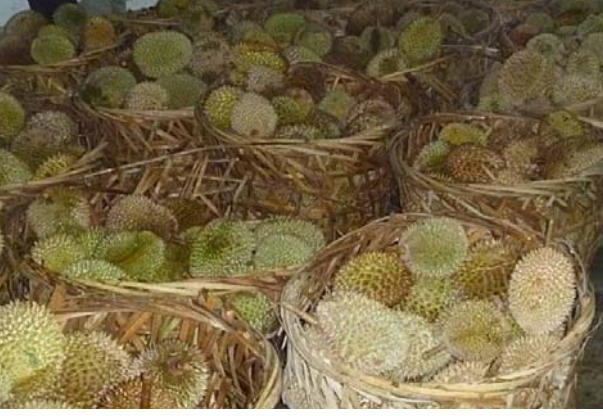
கூடை கூடையாகக் குவித்து வைக்கப்பட்டிருக்கும் முள்ளாறிப்பழங்கள்.

பிளாங்கு நகராண்மைக் கழகத்தினர் ஏற்பாட்டில் 'முள்ளாறிப்பழ விழா' பிளாங்கு மாநில நகராண்மைக் கழக கட்டிடத்தின் பின்புறம் சிறப்பாகக் கொண்டாடப்பட்டது. பிளாங்கின் பாலிக் புலாவ் முள்ளாறிப்பழம் நாட்டில் பிரசித்தி வாய்ந்தது அனைவரும் அறிந்த ஒன்று.