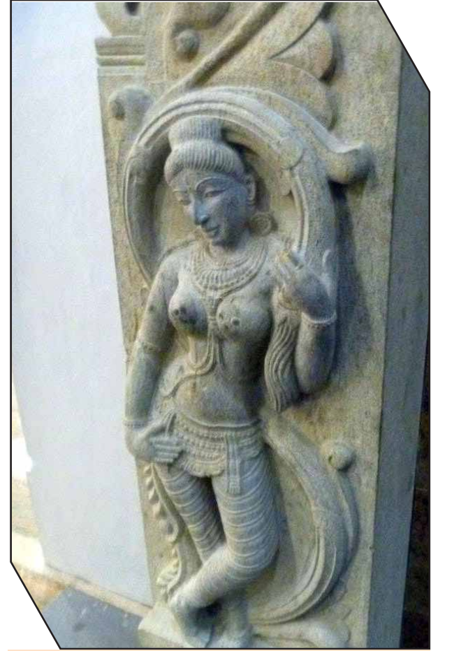
கலை நுணுக்கத்துடன் செதுக்கப்பட்டிருக்கும் சிலை வடிவம்.