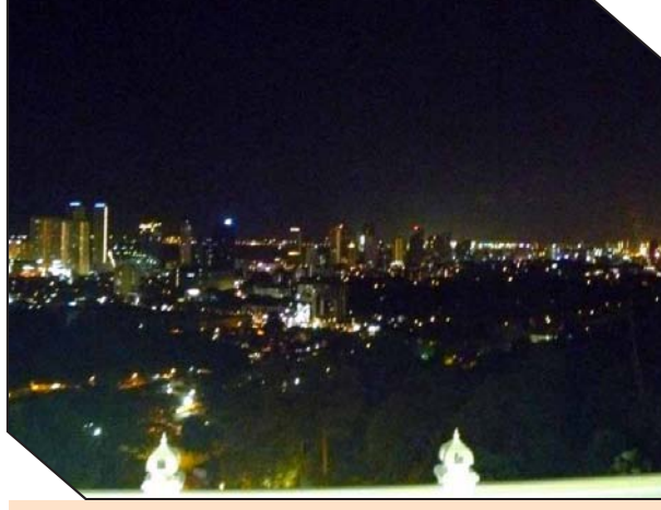
ஆலயத்தின் மற்றுமொரு சிறப்பு – பீனாங்கு தீவின் இரவு நேரக் காட்சி !