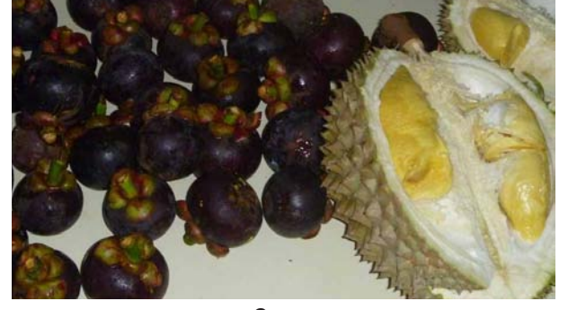
பருவ காலத்தில் மட்டுமே கிடைக்கும் மங்குஸ்தீன் மற்றும் முள்ளாறிப்பழங்கள்.