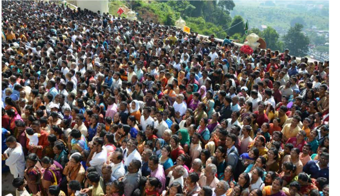
ஹாலையெனத் திரண்டிருக்கும் மக்கள்

ஆலய வளாகத்தில் மின்னியலில் இயங்கும் ஹாலந்து நாட்டு மணிப்பீடம் பிரம்மாண்டமாக காட்சியளிக்கிறது.