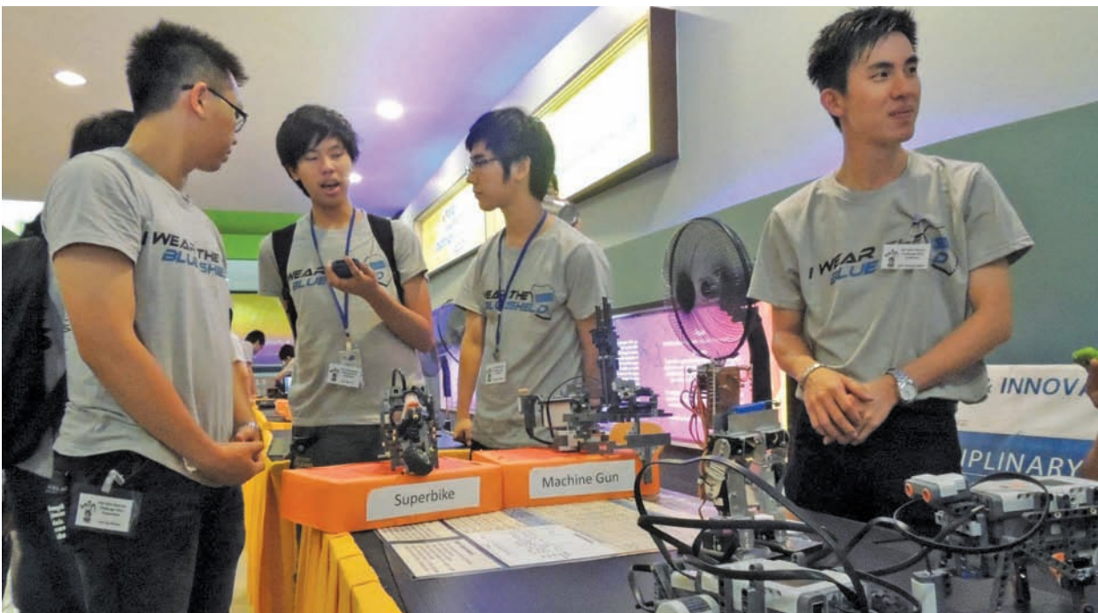
Members from a participating team discussing their robotic project during the Robotic Challenge.