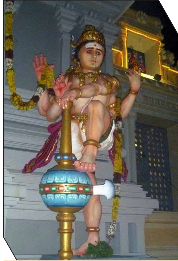
வாசலில் கம்பீரமாய் வீற்றிருக்கும் சிலை.