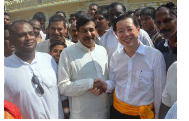
முதல்வர் ஸ்ரீமதி மஇகா தேசியத் தலைவரும் பிரதமர் துறை அமைச்சருமான டத்தோ ஸ்ரீ ஜி. பழனிவேல்.

மேலும் ஆலயக் கதவுகள் 18 அடி உயரமும் 7.5 அங்குலமும் கொண்ட பர்மா தேக்கு மரத்தால் உருவாக்கப்பட்டுள்ளன. ஆலயத்தின் அருகில் இரு சிறிய ஒன்று கூடும் மண்டபமும் அமைக்கப்பட்டு வருகிறது.