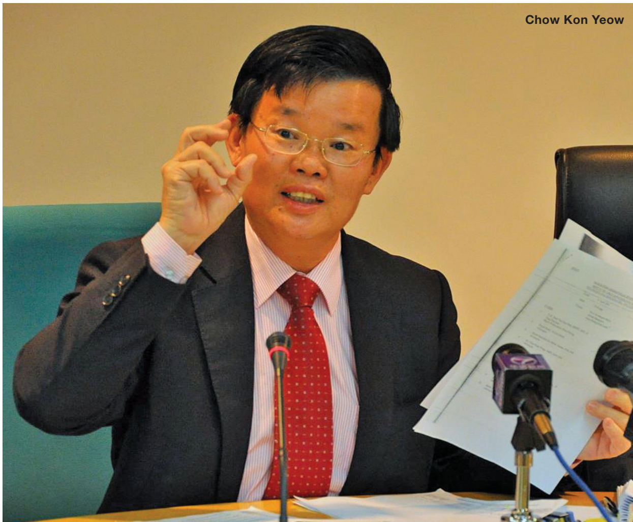
Chow Kon Yeow

MPPP had made 2006 to 2012 documents available for public viewing until September as a proof of Penang's CAT administration.