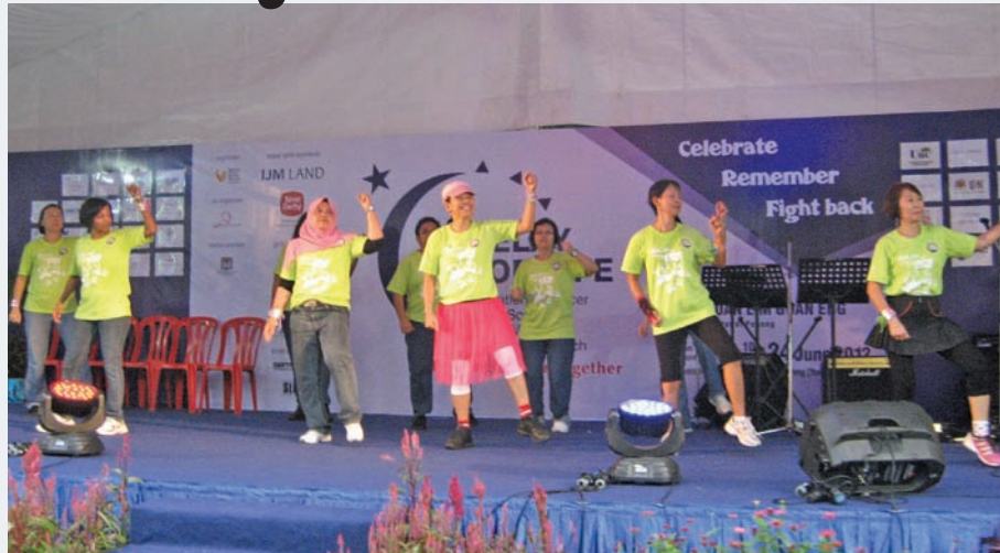
A group of Cancer Survivors putting on a dance performance for the crowd.

commitment to this on-going battle. Every step we take moves us nearer to