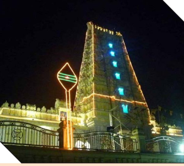
ஆலய கோபுரத்தின் இரவு நேரக் காட்சி.