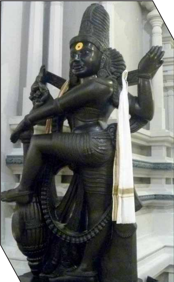
சந்நத் வாசலில் அழகுநவாய் உருவச்சிலை!