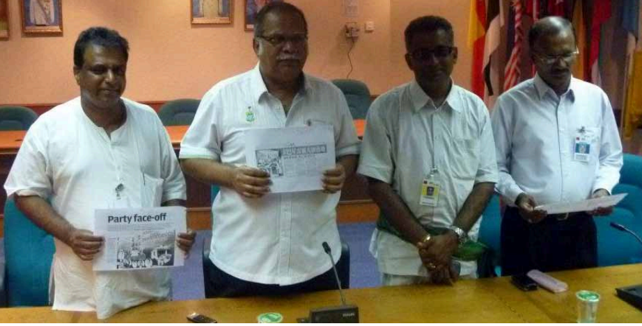
செய்தியாளர்கள் கூட்டத்தில் கலந்து கொண்ட இரண்டாம் துணை முதல்வரோடு ஆலய நிர்வாகிகள்.