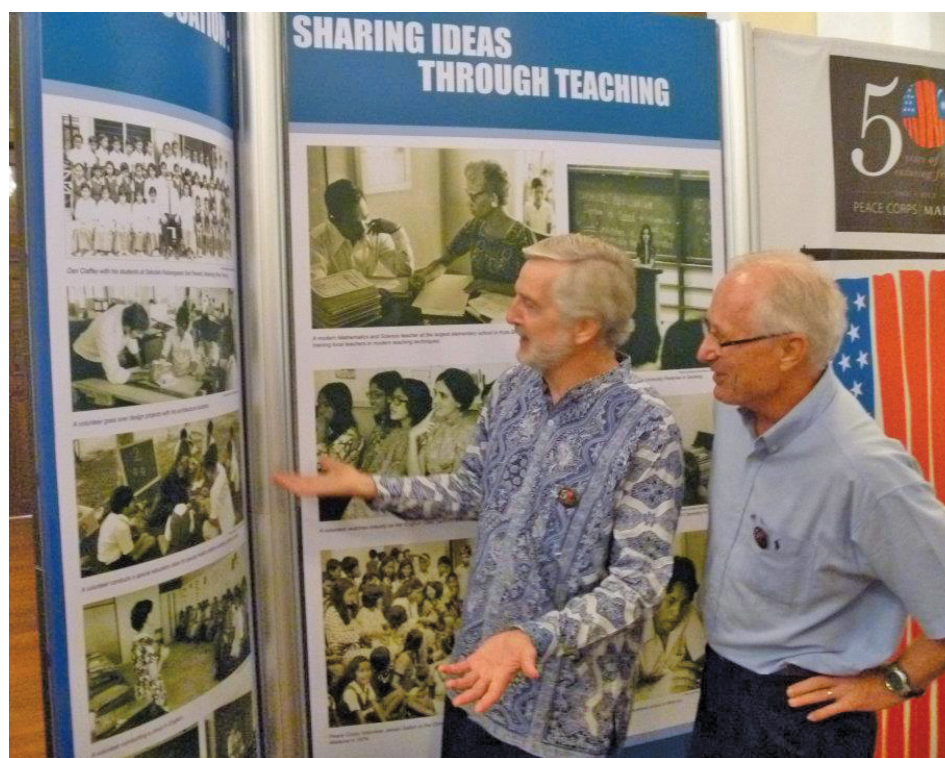
Two guests taking a look at an exhibit.

Peace Corps presence in Malaysia began in early 60s when American volunteers arrived to teach English and American culture.