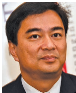
His Excellency Mr. Abhisit Vejjajiva

Some suggestions from Abhisit included information posted on government websites to inform the public, allowing people to lodge complaints, free press which is an important watchdog as