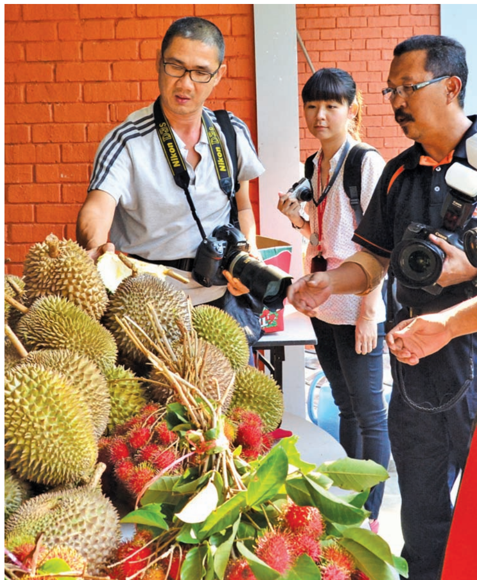
Press members looking at the delicious durians and rambutans.