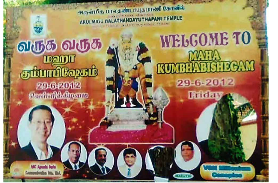
கிழிக்கப்பட்ட பதாகைகளில் ஒன்று.