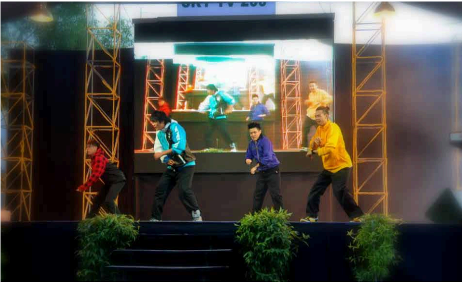
விழாவில் இடம்பெற்ற நடனக்காட்சி.

மக்கள் நலன் விரும்பும் பிணங்கு மக்கள் கூட்டணி அரசு ஆட்சியில் அமர்ந்த நாள் முதல் மக்கள் நலன் தொடர்பான பல கூறுகளை ஆராய்ந்து அவற்றில் ஈடுபட்டும் வருகின்றது. அதன்வழியில் அமைந்ததே சுத்தமான, பசுமையான, பாதுகாப்பான, சுகாதாரமான பிணங்கினை உருவாக்கிடும் இலக்கு.