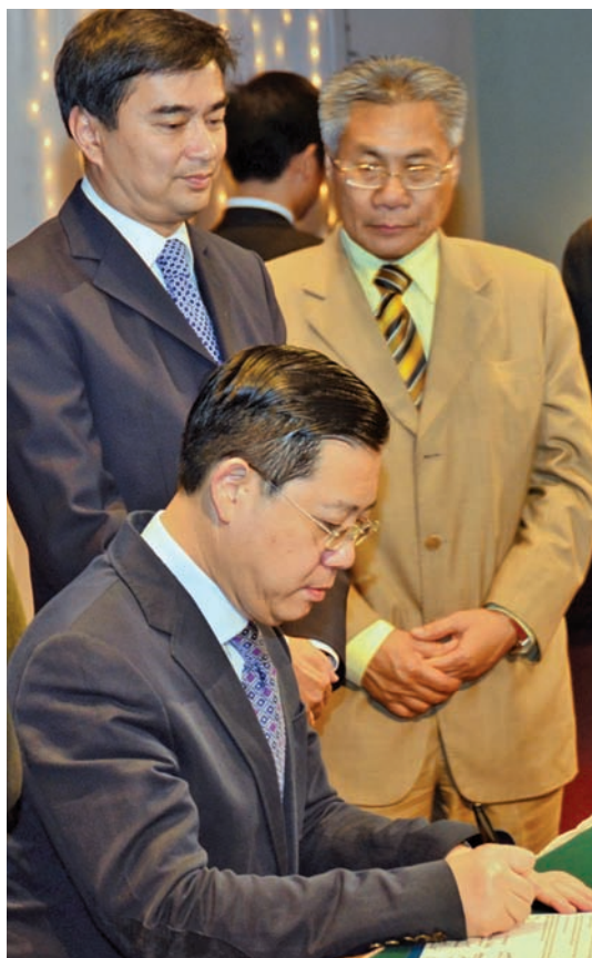
Chief Minister Lim Guan Eng signing the Penang Declaration while H.E. Mr. Abhisit and Deputy CM I, Datuk Mansor Othman waiting to sign the joint declaration.