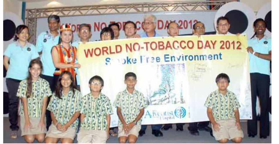
உலக புகையிலை அற்ற தினம் 2012 கொண்டாட்டத்தில் பங்கேற்பாளர்கள்