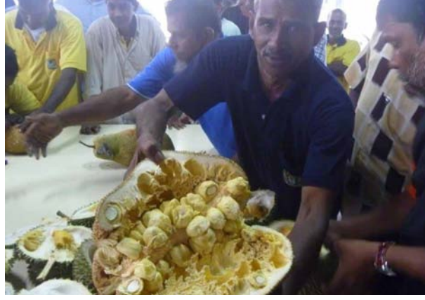
உமிழ்நீரை சுரக்கச் செய்யும் பலாச்சுளைகள்.

முள்ளாறிப்பழத்தின் நாற்றம் பத்தடி தள்ளி இருந்தாலும் ஒருவரை சுண்டி இழுக்கும் ஆற்றல் உடையது. இப்பழம் குறிப்பிட்ட பருவ காலத்தில் மட்டுமே விளைவதால் இதற்கு மக்கள் மத்தியில் எப்பொழுதும் மதிப்புண்டு. ஏனைய பழங்களைக் காட்டிலும் முள்ளாறிப்பழத்தினி விலையும் சற்று அதிகம்தான். அதனால் சாமானிய/ ஏழைத் தொழிலாளிகளால் இப்பழங்களை அதிக அளவில் வாங்கி உண்ண முடிவதில்லை.