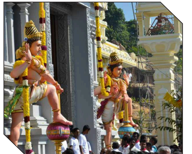
நன்னீராட்டி விழாவின் போது ஆலய வளாகம்.