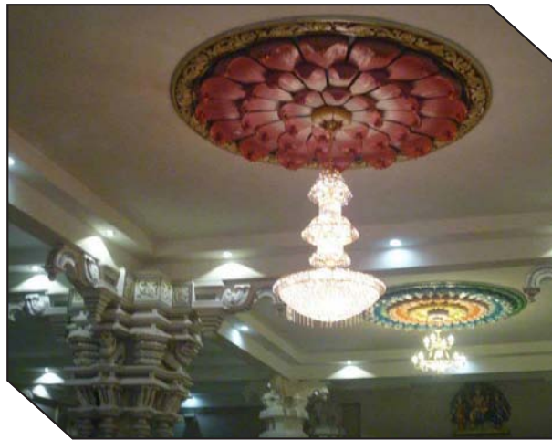
ஒளி சந்நதும் வண்ண விளக்கின் தோரணை.