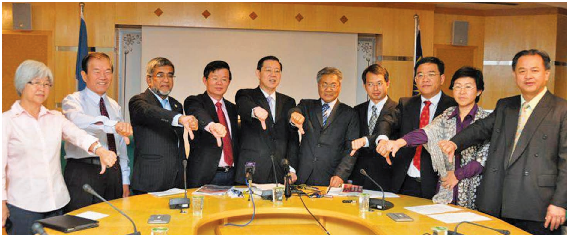
槟州首长林冠英（左4）与一众行政议员们同声谴责马华利用下流政治招数来进行人身攻击。