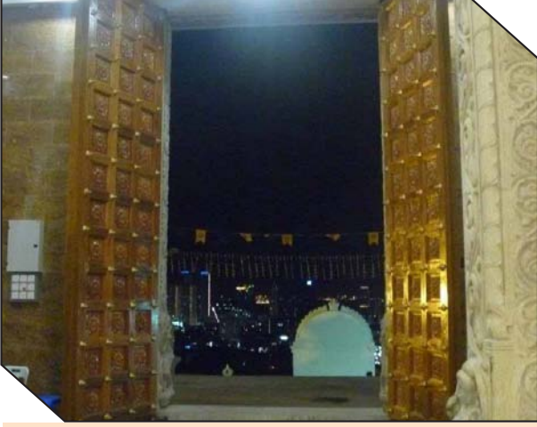
பக்தரை வரவேற்றதும் ஆலயக் கதவுகள்.