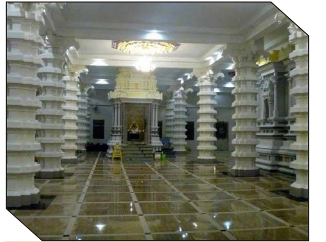
கலை அழகுமிக்க ஆலயத்தின் உட்புறம்.