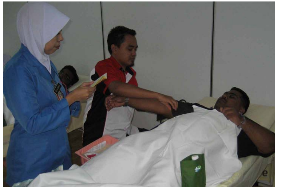
இரத்த தானம் வழங்கும் பங்கேற்பாளர்.

மதியம் 2 மணிக்கு நிறைவு பெற்ற இந்நிகழ்ச்சியில் 43 இரத்த பைகள் நிரப்பப்பட்டன. 60 பங்கேற்பாளர்கள் பதிவு செய்து கொண்டதில் 17 பேர் முதல் கட்ட இரத்த பரிசோதனைகளில் தேர்வு பெறாது போகவே எச்சிய பங்கேற்பாளர்களின் இரத்தம் தானம் ஏற்கப்பட்டது. பங்கேற்பாளர்களுக்கு நற்சான்றிதழ் வழங்கி சிறப்பிக்கப்பட்டது.