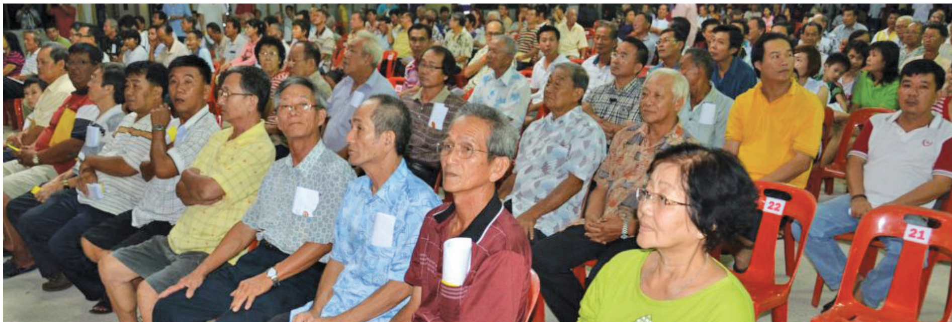
威北打昔汝莪平安村204名村民在苦等7年后，终能够顺利从槟州首长林冠英手中接过期盼已久的地契。