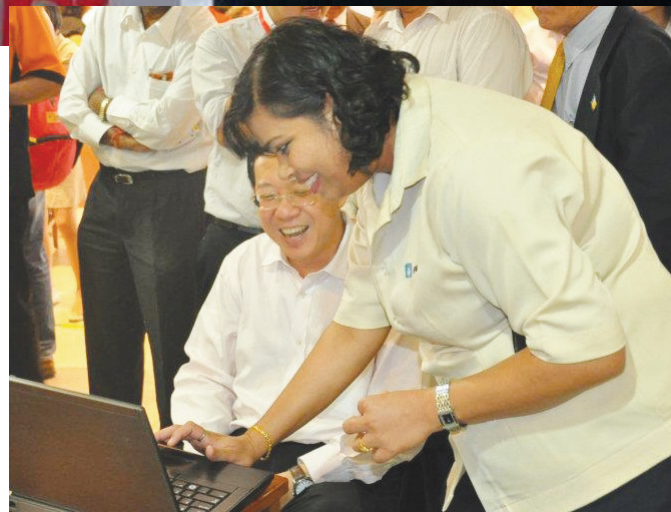
槟州首长林冠英（坐者）在主持推介礼后不忘亲自登录Penang Free Wifi网站，确定是否真的能上网。

值得一提的是，首长在推介第二阶段时，不忘打趣地提醒民众不要在这些热点下载电影或者是看戏，而占用了网速，导致其他人无法享用这项服务。