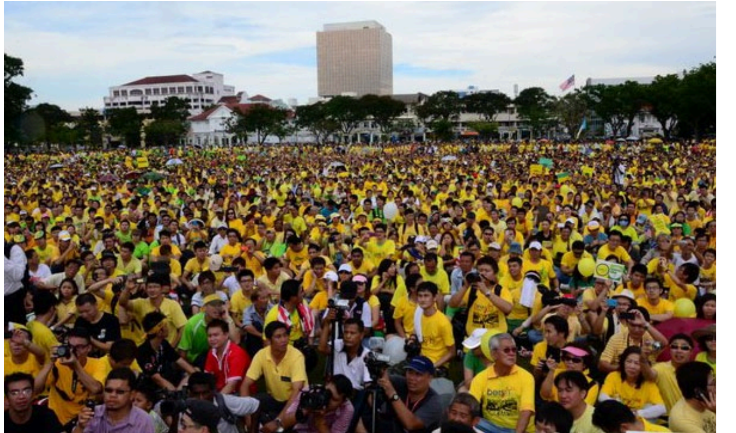
பிளாங்கில் அவையெனத் திரண்ட மக்கள் கூட்டம்.

மாநில முதல்வரின் உரைக்குப் பின் பேரணியினை நிறைவுக்குக் கொண்டு வந்தனர். ஆயிரக்கணக்கான மக்கள் கலந்து கொண்ட பேரணி சிறிதும் பதற்றமோ,