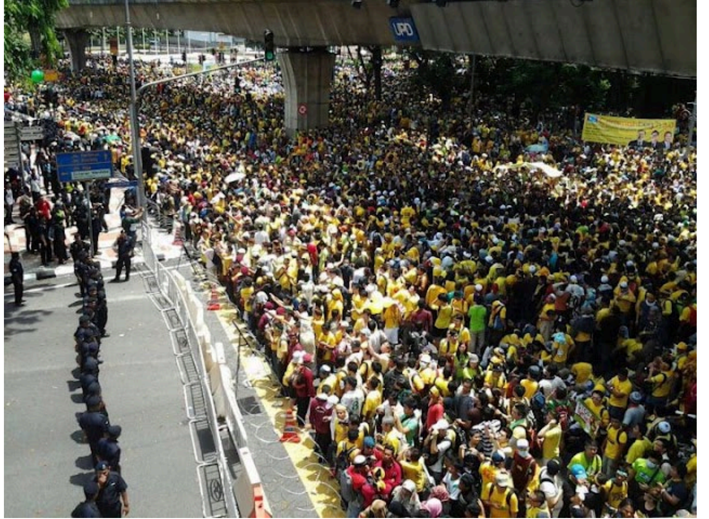
தலை நகரில் பெர்சே 3.0 பேரணி.

மக்கள் அமைதியாய் கூட விருப்பம் தெரிவித்தும் தலைநகரில் அனுமதி மறுக்கப்பட்டது. பேரணி முதல் நாள் இரவு தொடங்கி சாலைகளை மூடி வைத்தனர். இருப்பினும் மக்களின் வருகையைத் தடுக்க இயலவில்லை. 300,000 பேர்