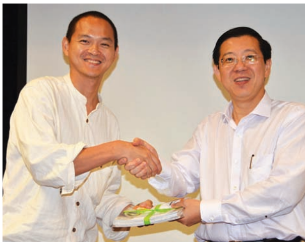
Professor Ong Kian Ming who visited Penang for a book launch shaking hands with CM Lim.

Facebook fans on CM Lim Guan Eng Facebook at http://www.facebook.com/cmlimguaneng have responded with comments.