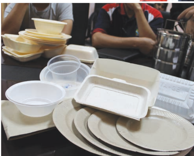
自槟州政府实施禁用保丽龙碗具措施后，市场上出现形形色色的替代碗具，但其实这些碗具是否能够安全使用，也是个疑问。

他也说，槟岛市政局领先全国，成为第一个全面禁用保丽龙碗具的地方政府，因此，他希望民众能