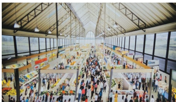
湖内平安花园巴刹的设计概念图。

湖内居民等了20年终于等到第一座巴刹，而建立在湖内平安园的巴刹也是莪尾选区的首座巴刹，估计将于9月竣工、年杪前即可启用。