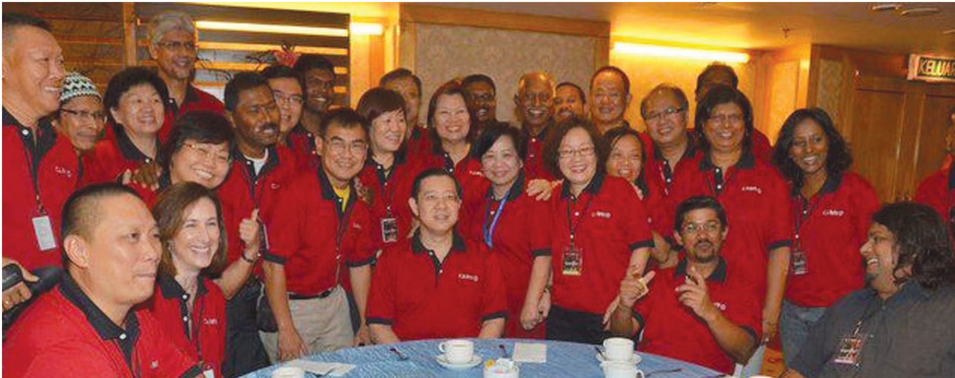
槟州首长林冠英（坐者中）与来自全国的公民记者们在2012年公民记者研讨会中开心合影。