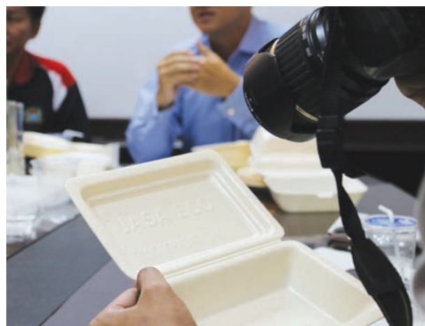
这是不符合安全标准的碗具。