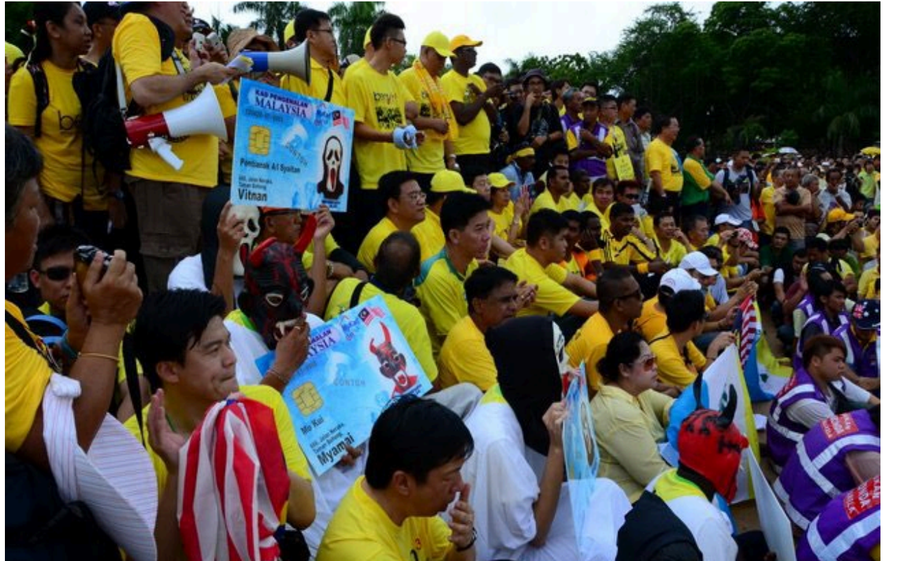
ஆவ் வாக்காளர்களைக் குறிக்கும் பதாகைகளை ஏந்தி மக்கள்.

கூடிய மாபெரும் பேரணியாக இம்முறை பெர்சே 3.0 தலைநகரில் திகழ்ந்தது. ஆனால் திடீரென்று கலவர பூமி போல் அனைத்தும் மாறிப்போனது. ஆர்ப்பாட்டக்காரர்கள் தடுப்பு வேலிகளைக் கடந்து வந்தனர் என்று கூறி காவல் துறையினர் கண்ணீர் புகை தாக்குதலையும் இராசயன நீர் தாக்குதலையும் மேற்கொண்டனர்.