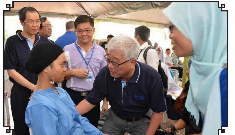
காது கோளாத பிள்ளைகளுக்கு உதவி சாதனம் தரும் நிகழ்ச்சியில் சட்டமன்ற உறுப்பினர் திரு பி யுன் போ.