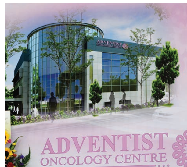
An artist's impression of AOC.

to RM 218 million or 66% of the total RM336 million national medical tourism receipts. In 2011, it is expected that medical tourism in Penang will hit RM250 mil which is two third of Malaysia's total revenue in the sector. In 2010 the Hotel Resort Insider, named Malaysia as one of the top five medical tourism destinations in the world. Penang clearly stands out as a premier Medical City where patients from within ASEAN and further afield will be able to come to seek a "holistic" and cost-effective healthcare.