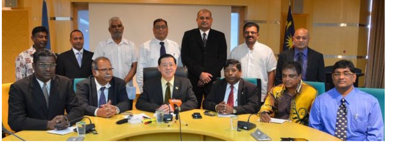
பினாங்கு இந்து அறப்பணி வாரியத்தின் புதிய செயற்குழு உறுப்பினர்கள்.