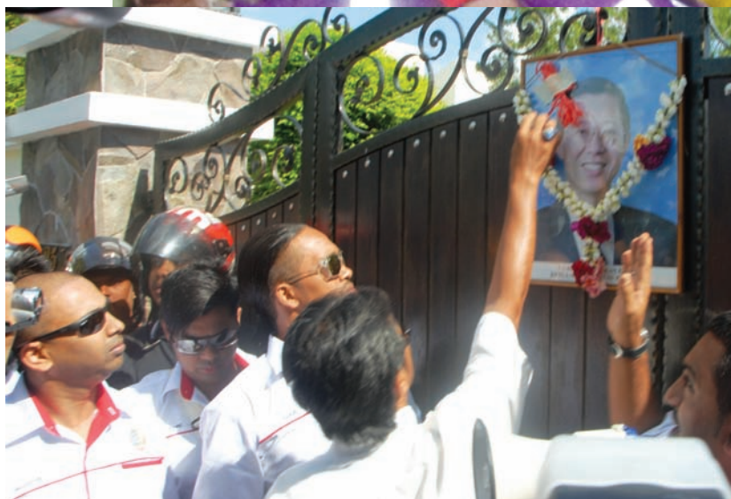
PERKASA protesting outside CM Lim’s house on 10th May, 2012.

against the Umno and Perkasa members who assaulted the two reporters but