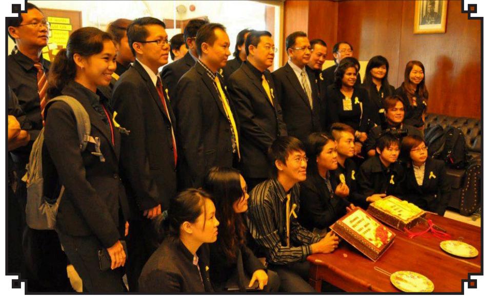
சட்டமன்றத்தில் கொண்டாடப்பட்ட உலக பத்திரிகையாளர் சுகந்திர தினத்தில் பத்திரிகை நண்பர்களுடன் சட்டமன்ற உறுப்பினர்கள்.