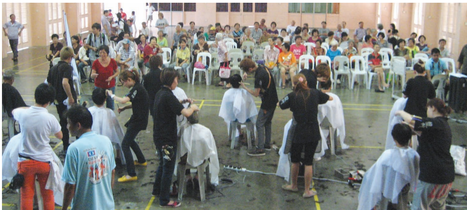
Some of the residents having their hair cut, while others are waiting for their turn to do so.

"It should be emulated by other YB's to benefit their constituents," she added.