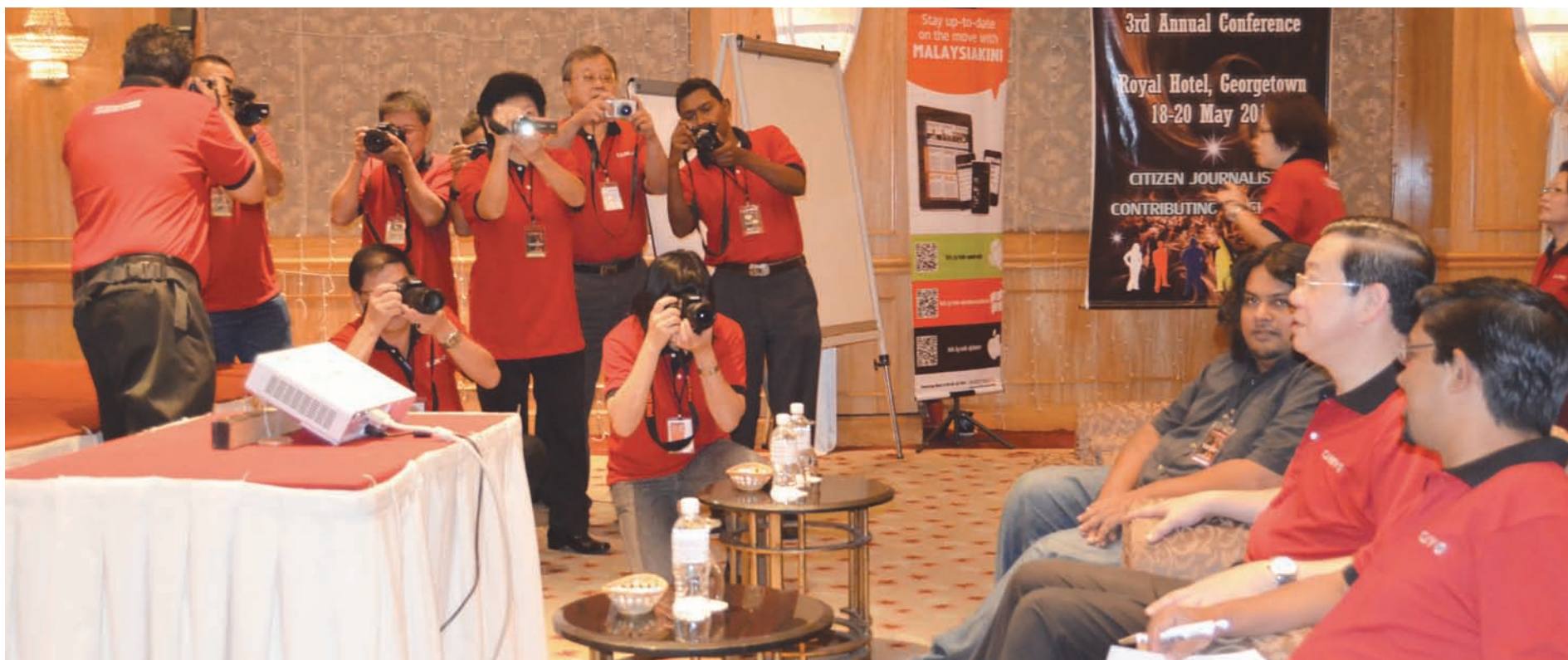
Citizen Journalists busy snapping photos and recording videos at the opening of the conference.