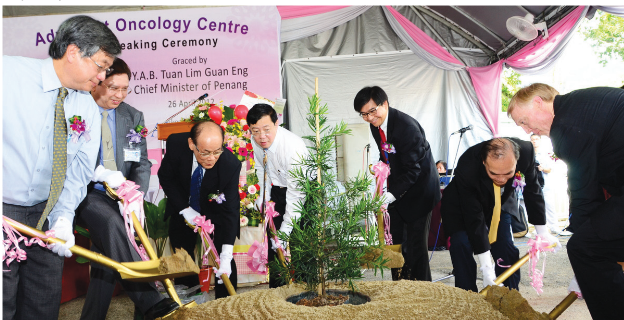
Groundbreaking ceremony of Penang Adventist Oncology Centre.