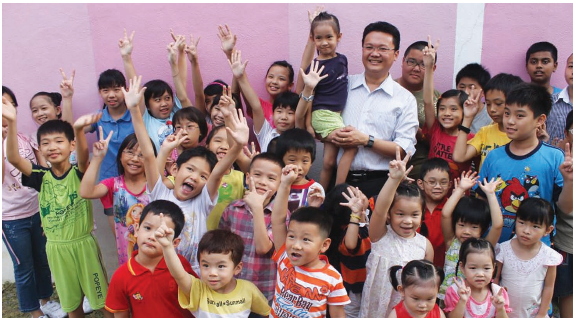
Assemblymember of Paya Terubong said, "Children are beacons of hope. The joy exuded by children is like a ray of hope. It guides us towards smooth sailing from dangerous rocky valley and canyons to a new life and also new hope, to support us to continue to fulfill our dreams."