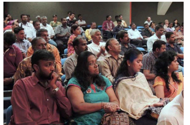
நகழ்வில் கலந்துக் கொண்டவர்கள்