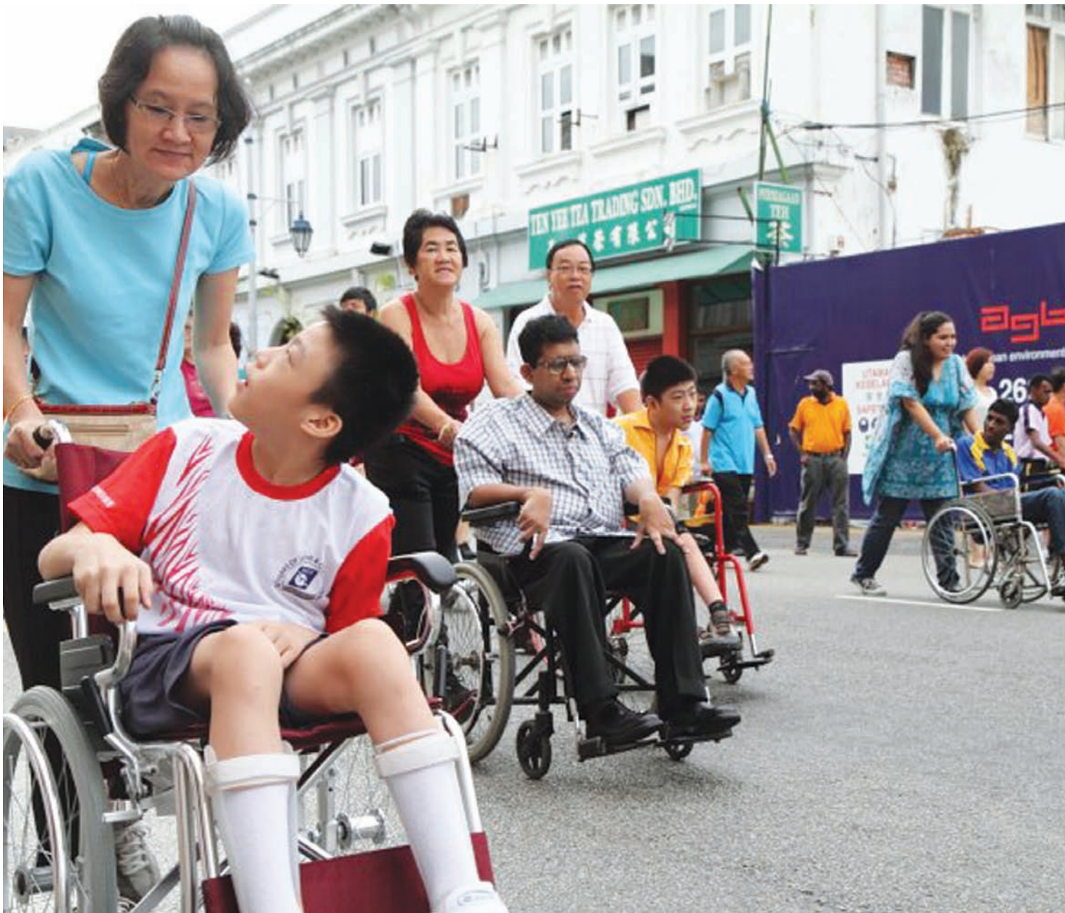
Penang Global Tourism is the new state tourism bureau set up to work with key tourism players inside and outside Penang, to promote the state through better ties, reliable data and feedback and synergistic activities. On 13 May, 2012 residents from the Penang Spastic Centre had much fun moving along Beach Street on Penang Car Free Day. Due to bad weather, 10 residents out of 30 joined in the morning program organized specially for them by PGT that started at 8.30am from the Tourist Information Centre. After the program, the residents were treated to a hearty breakfast at Whiteaways' courtyard and they received goodie bags filled with yummy foodstuff and a plush toy.