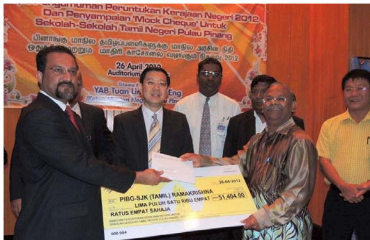
மாதிரி காசோலைகளுடன் தலைமையாசிரியர்களும் பெற்றோர் ஆசிரியர் சங்கத் தலைவர்களும்

தங்க மாணவர் திட்டத்தின் வழி, முதலாம் மற்றும் நான்காம் ஆண்டு மாணவர்களுக்குத் தலா ரிம. 100 பினாங்கு மாநில அரசாங்கத்தால் வழங்கப்படுவது நாம் அனைவரும் அறிந்ததே. சுமார் 2000 தமிழ்ப்பள்ளி மாணவர்கள் இத்திட்டத்தின் மூலம் பயனடைவார்கள் என கணிக்கப்படுகிறது. எனவே, பள்ளி தலைமையாசிரியர்களும், பெற்றோர் ஆசிரியர் ஆசிரியர் சங்கமும் மாநில அரசாங்கத்தின் திட்டங்களை ஆதரித்துத் துணை நிற்க வேண்டும் என முதல் லிம் குவான் எங் கேட்டுக் கொண்டார்.