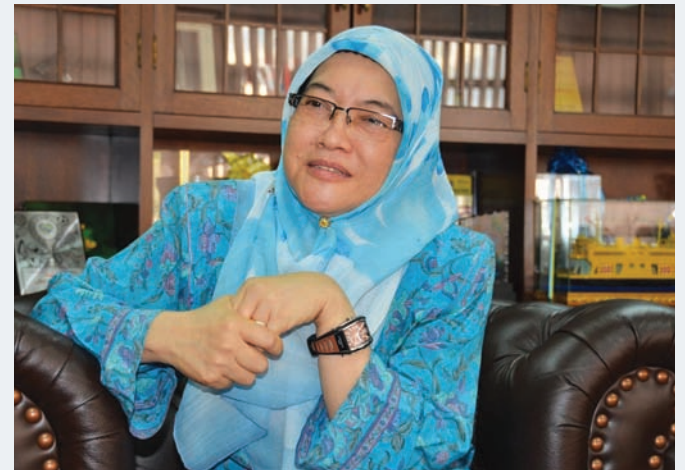
President of The Municipal Council of Penang Island (MPPP), Patahiyah looks forward to welcome the Mayors of 68 cities to Penang in September 2012 at the 5th TPO Forum 2012 - historic first time in Malaysia

To keep up to date with the preparation of this exciting event, please visit the Penang TPO website at http://www.penangtpo.com/