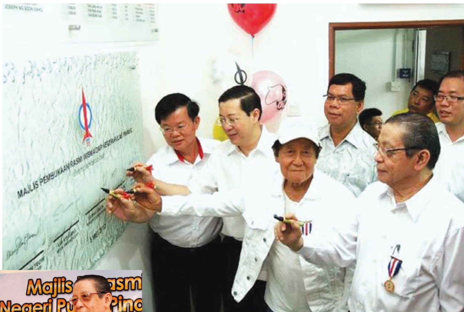
DAP's secretary general YAB Lim Guan Eng (front row, third from right), chairman YB Chow Kon Yeow (fourth from right), Life Adviser Chen Man Hin (second from right) and Parliamentary Leader Lim Kit Siang (right) putting their signatures on the plaque, during the launch of Wisma DAP.

He added that Penang DAP will finalise its prepa-