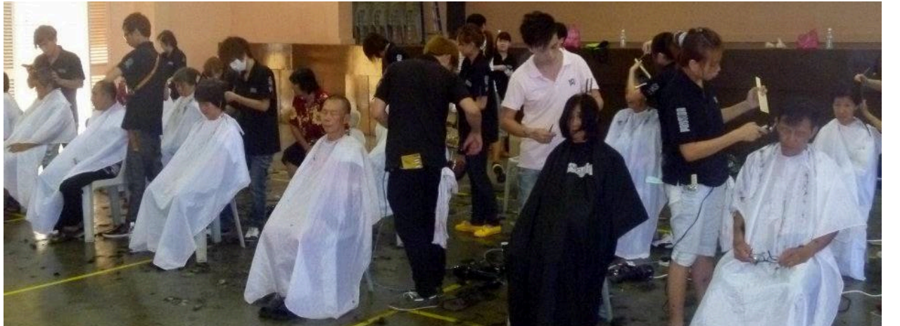
நிகழ்ச்சியில் கலந்து கொண்ட மக்களுக்குச் சிகை அலங்காரம் செய்யப்படுகிறது.