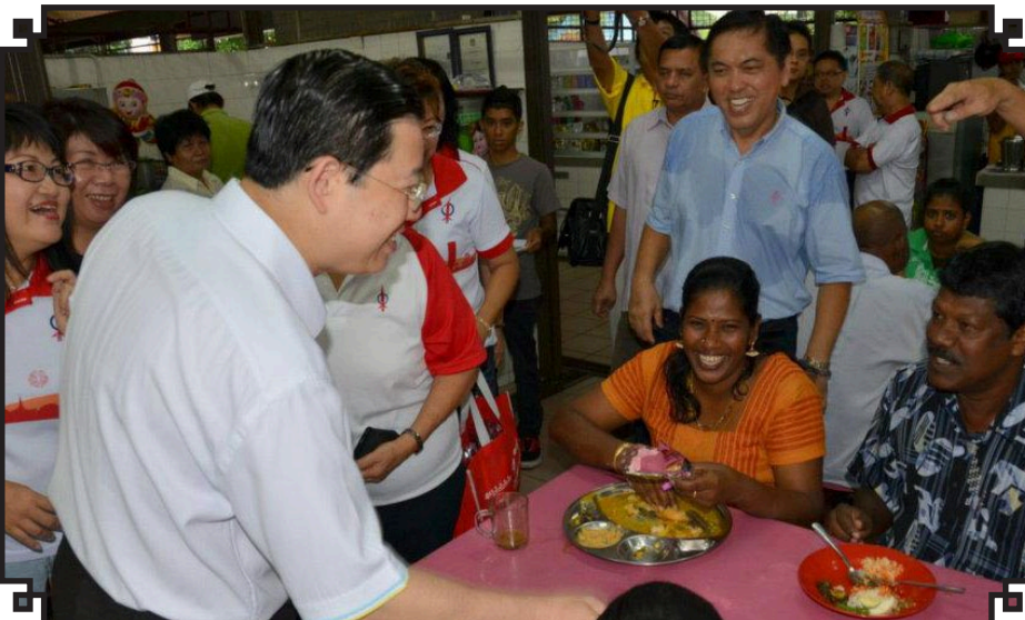
அன்னையர் தினம்- ஆயோர் புத்தே பகுதியில் அன்னையர் தினத்தன்று பூக்கள் தந்து வாழ்த்து தெர்வித்தும் மாநில முதல்வர்.