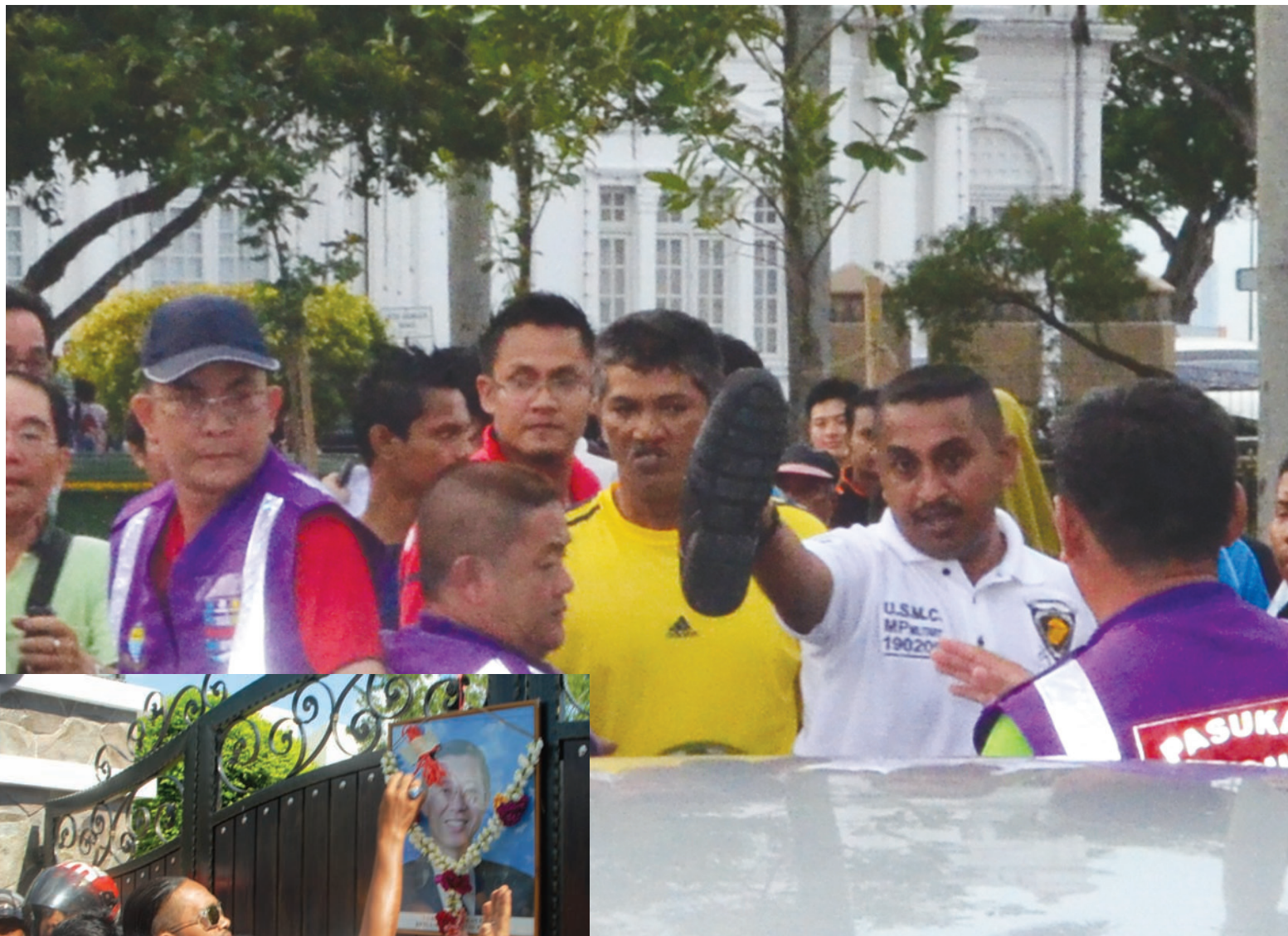
26 February 2012 - PERKASA member threatening to throw his shoe at CM at Himpunan Hijau.

Lim lodged a police report on 28 February, 2012, citing: “For my personal safety, I hereby lodge a police report against violent threats by Umno and Perkasa members. Should anything happen to me, Umno and Perkasa have to bear full responsibility. It is up to the police to show that they can perform their duties without fear or favour by acting not only