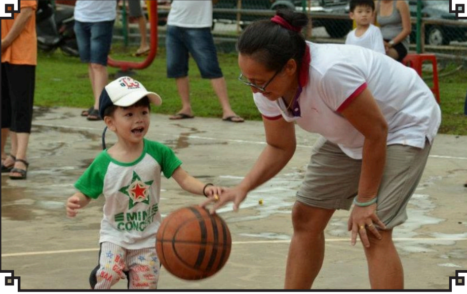
கூடைப்பந்து விளையாட்டு தளத்தின் திறப்பு விழாவில் விளையாட மகமும் இளம் பிஞ்சு.