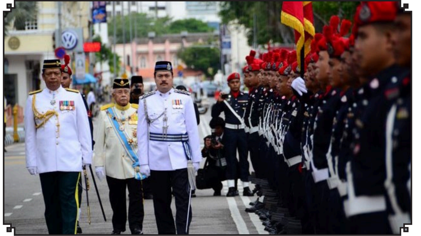
ஆளுநருக்கு மரியாதை அணிவகுப்பு வழங்கப்படுகிறது.