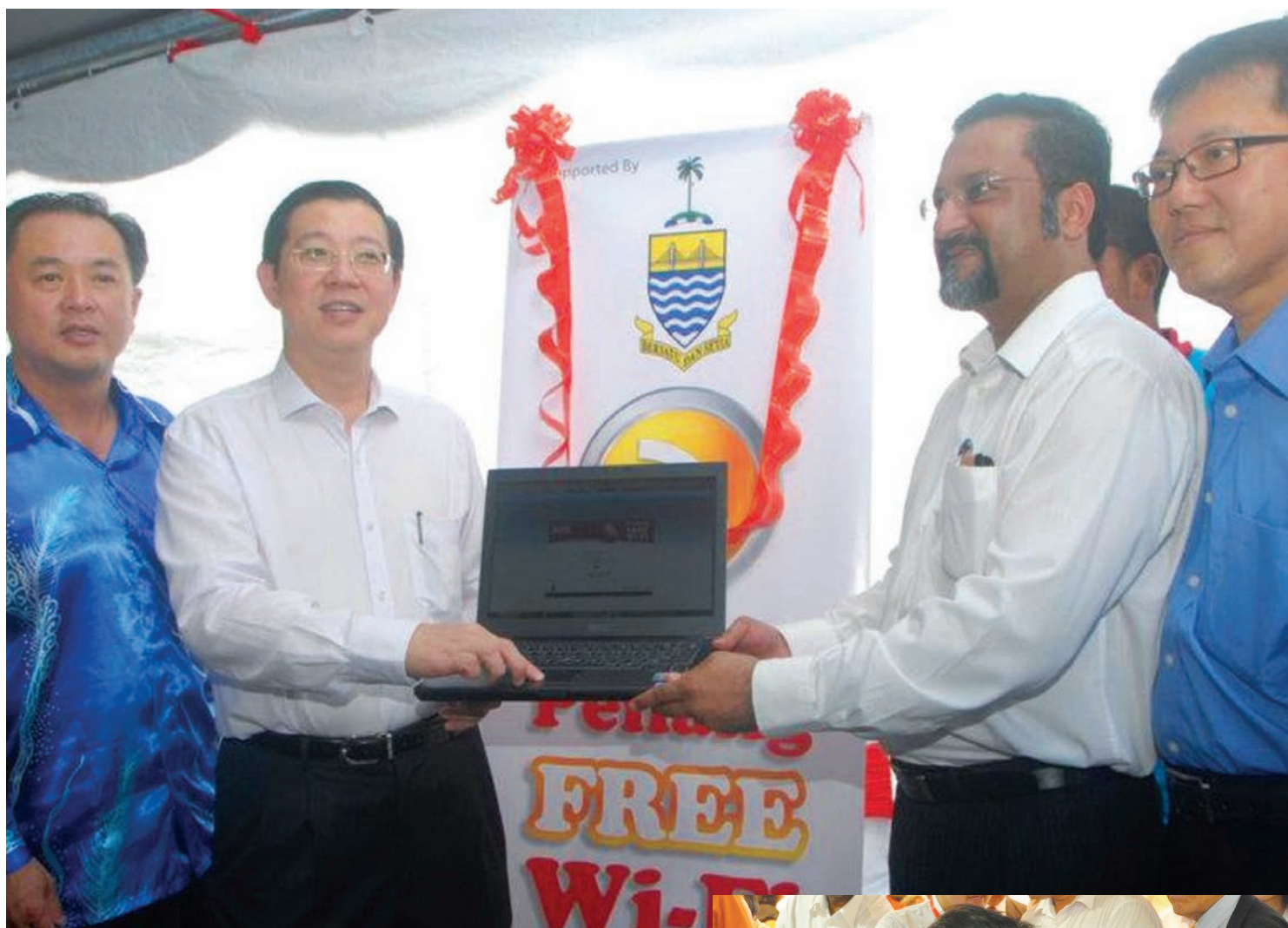
槟州首长林冠英（左2）在峇都兰樟区州议员罗兴强（左起）、柑仔园区州议员佳日星及日落洞区国会议员黄泉安陪同下，为柑仔园区的第二阶段免费无线上网计划主持推介礼。

此外，首阶段的网速是25Mbps，而第二阶段的网速则是提升至50Mbps，网民将能