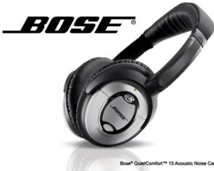
Bose® QuietComfort™ 15 Acoustic Noise Cancelling™ headphones

“ஆசியா-பசிபிக் வட்டாரத்திலும், ஆசியான் நாடுகளின் அமைப்பு இரீதியிலும் காண்கையில் பினாங்கின் அமைப்பு நல்லதொரு வியாபார வாய்ப்பினை வழங்குகின்றது. மேலும் இந்தியா, சீனா, நியூசிலாந்து, ஜப்பான், தென் கொரியா ஆகிய நாடுகளோடு தடையற்ற வர்த்தக ஒப்பந்தங்களை ஆசியான் கூட்டமைப்பு கொண்டுள்ளது. இதுவே போஸ் நிறுவனம் பினாங்கினைத் தமது களமாகத் தேர்ந்தெடுக்க காரணமாக அமைந்துள்ளது,” என மாண்புமிகு முதல்வர் லிம் குவான் எங் நிகழ்வில் தெரிவித்தார்.