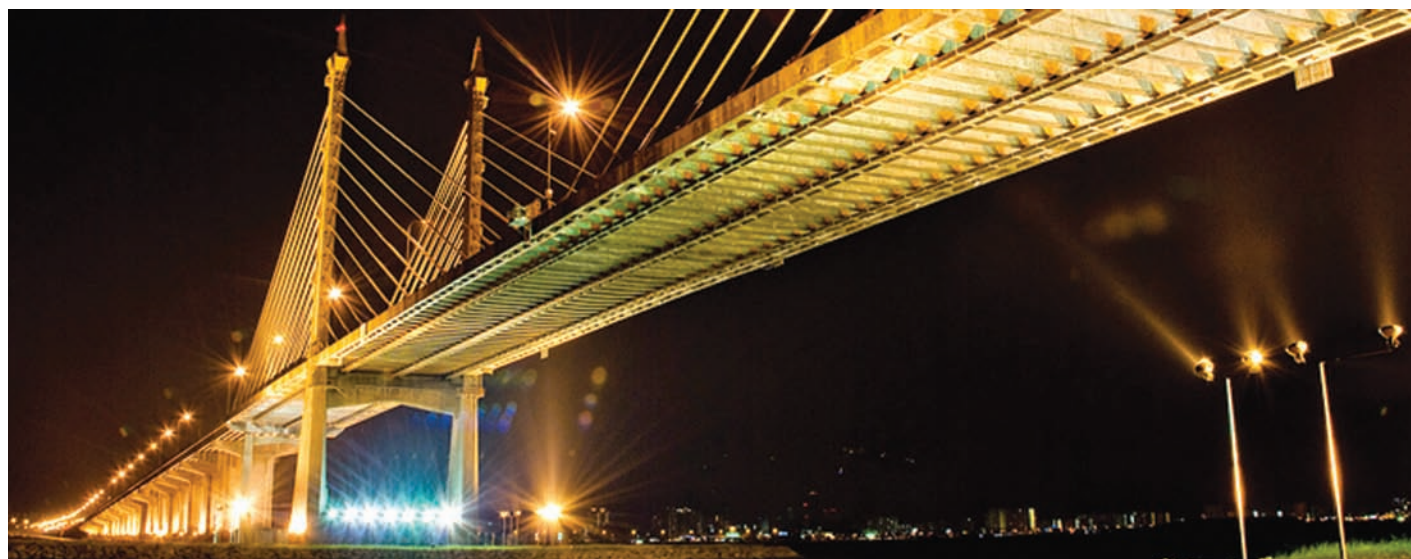
槟城大桥公司特许经营商在1994年易手管理权后，槟州发展机构就失去了15%股权。