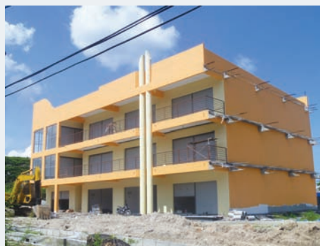
3-storey shop lots.