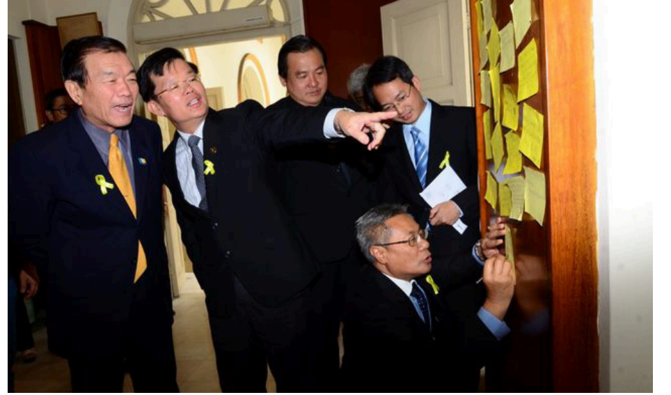
பத்திரிகையாளர்களின் கருத்துகளைப் பார்வையிடும் சட்டமன்ற உறுப்பினர்கள்.