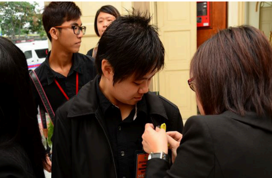
கறுப்பு உடை அணிந்த பத்திரிகையாளருக்கு மஞ்சள் பட்டை அணிவிக்கப்படுகிறது.

இனிவரும் காலங்களில் மக்களுக்கு உண்மையை உரைத்திட உழைத்திடும் பத்திரிகையாளர்கள் சரிவரப் போற்றப்படுவர் என நம்பிக்கை கொள்வோம்.