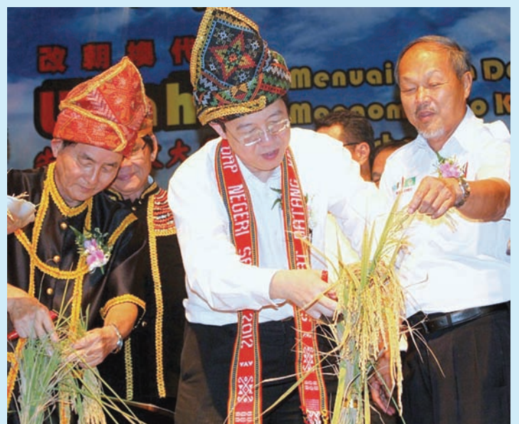
CM Lim joining Sabah DAP leaders at the Harvest Festival in Sabah.

He shared many of Penang's policies, welfare programs and examples set by the State with the Sabahans. He added, "DAP also proposes to provide a RM1 billion Sabah Endowment fund that delivers 3Es of building human talent by providing education opportunities, uplifting the economic livelihood of native Sabahans and ending poverty. This Endowment fund would give cash handouts to the poor, provide equal economic opportunities, offer scholarships to the needy and install free wifi in public places not just in towns but also in villages. Penang has provided free wifi in public places throughout Penang. If Penang can do it, so can Sabah."