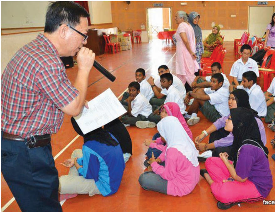
A tutor from PELLTA explaining to students the details of the workshop.

He said through the Fun English Camp programmes, Pertubuhan Wanita Mutiara hopes to raise the standard of English in Balik Pulau to be at par with that of George Town.