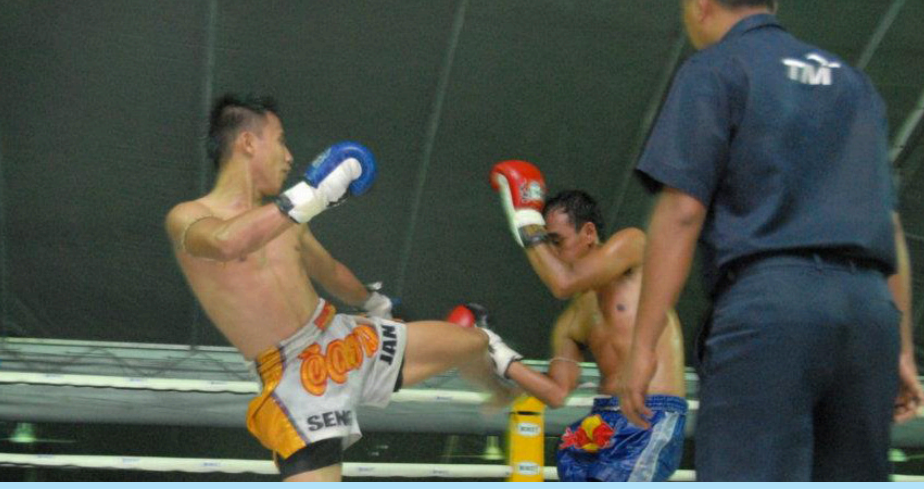
பாடாங் கோத்தா மைதானத்தில் நடைபெற்ற தாய்லாந்தின் புகழ்பெற்ற முவா தாய் (Muay Thai) போட்டி.