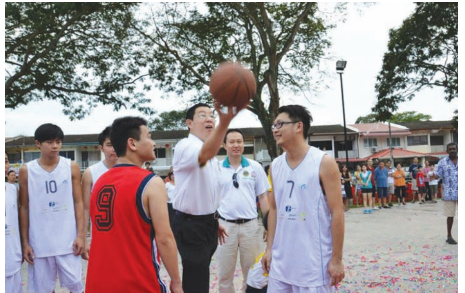
Assemblymember of Air Putih, CM Lim Guan Eng playing basketball with the residents of Air Putih at the upgraded basketball court in Taman Lumba Kuda.

Residents around the Medan Lumba Kuda area are especially glad that their neighbourhood rarely experiences flash floods which they used to have. Prior to 2008, the area was well-known to get flash floods that rise very high. Due to extension of the monsoon drains and proper drainage carried out by Penang Pakatan Rakyat State Government, people can now sleep peacefully whenever it rains.