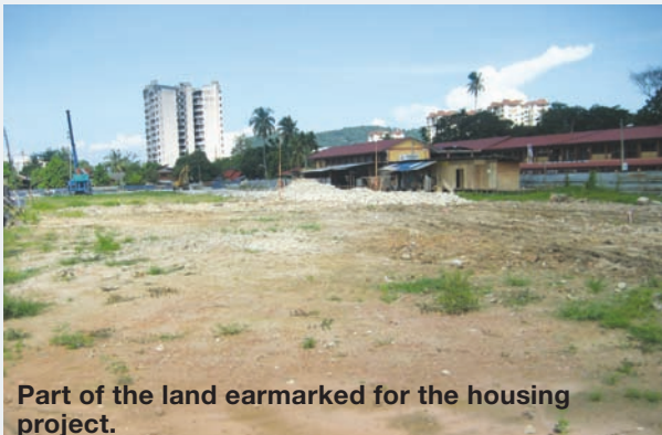
Part of the land earmarked for the housing project.

Also present were the senior engineer of JKP Sdn