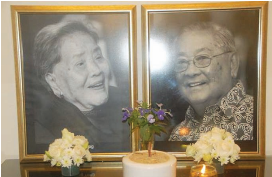
敦林苍祐与杜潘吴欣燕携手走过数十载，生前的鹣鲽情深，让后人感动不已。