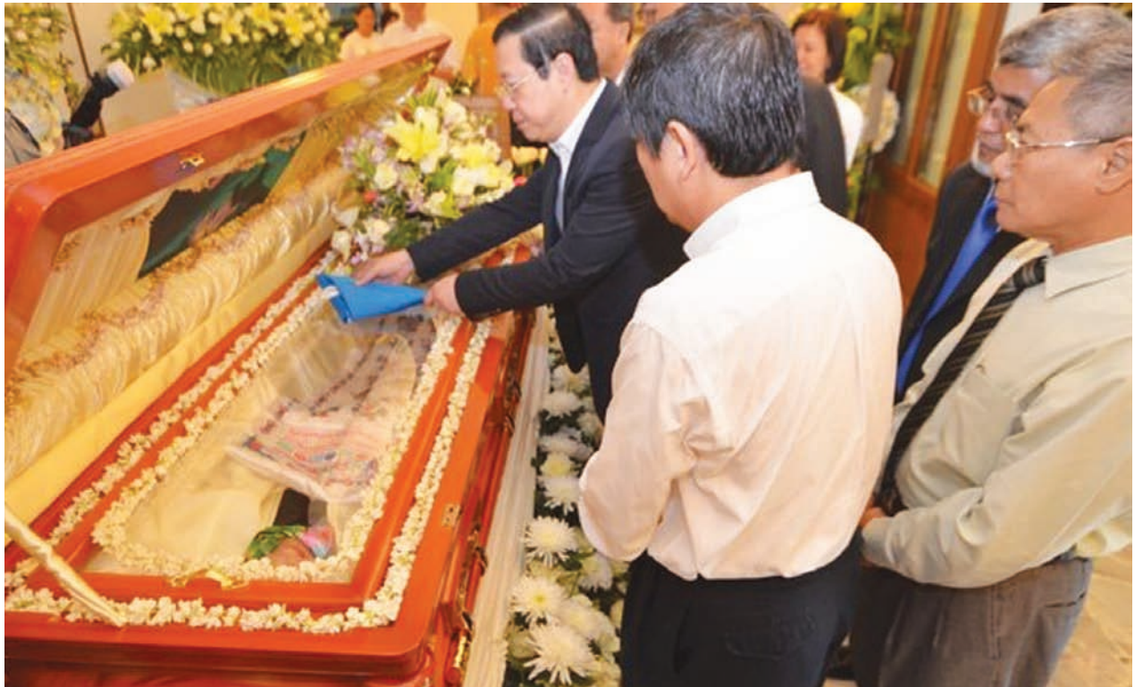
槟州首长林冠英在多名行政议员陪同下，为敦林苍祐夫人杜潘吴欣燕献上一面州旗，以表珍惜她对槟州的贡献。