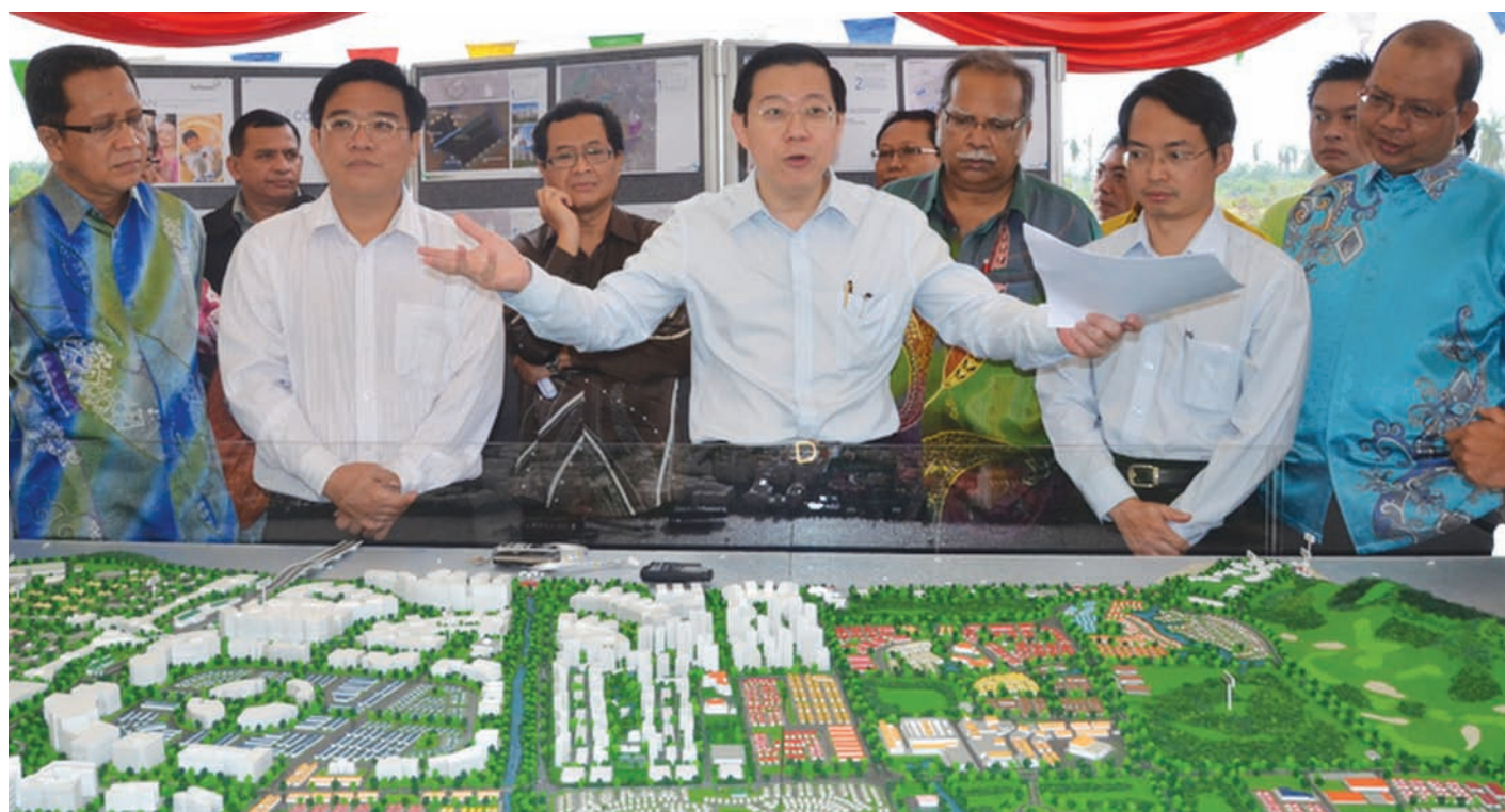
Chief Minister Lim Guan Eng at the Ground Breaking Ceremony in Batu Kawan.

Further, BN’s claims that the price of property in Penang has risen because the state government has increased land premiums is false as the Penang Land Office has maintained the land conversion rates at the same percentage rates as the previous BN state government. Property prices are determined by market forces of supply and demand and public confidence in the state government. No government in the world, including China and US, can force the property market to rise or fall in value.