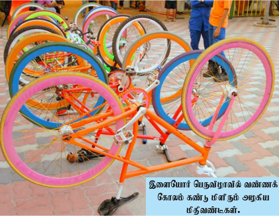
இளையோர் பெருவிழாவில் வண்ணக் கோலம் கண்டு மீளும் அழகிய மித்வண்டிகள்.