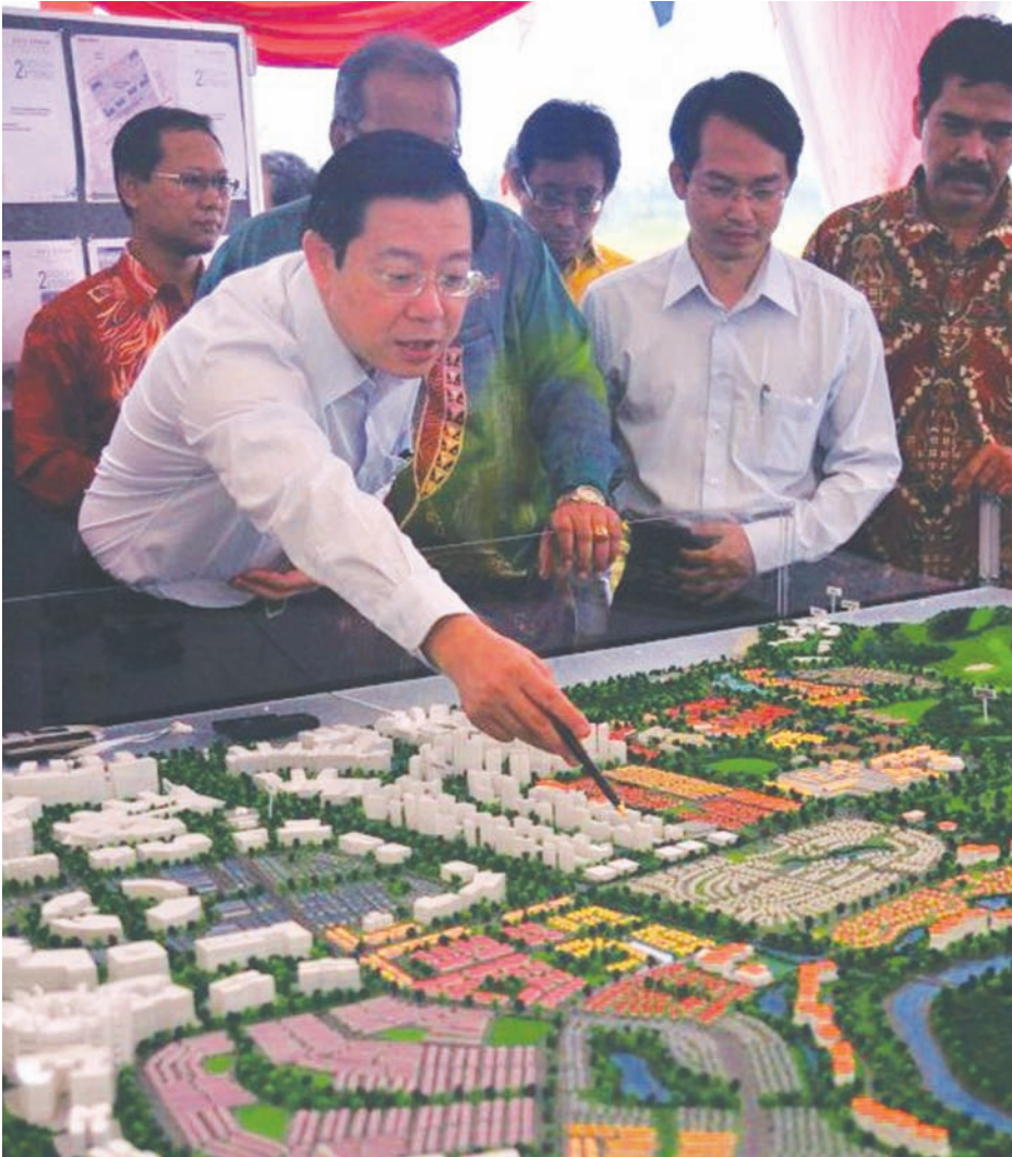
檳州首长林冠英（左1）已于2012年2月17日推介耗资27亿令吉的第一期可负担房屋计划，包括位于威南峇都加湾200英亩的1万2000个单位。第二期计划则是涵盖了77英亩的土地，檳州政府同时也已经确认地点，以兴建6000个可负担房屋。

檳州政府将以可负担房屋5亿令吉基金来第一期及第二期可负担房屋计划，那就是将在檳州五个县属兴建至少1万8000个可负担房屋单位，惟这1万8000个可负担房屋单位是由檳州发展机构来推行，另外私人界也将兴建另外的2万个单位