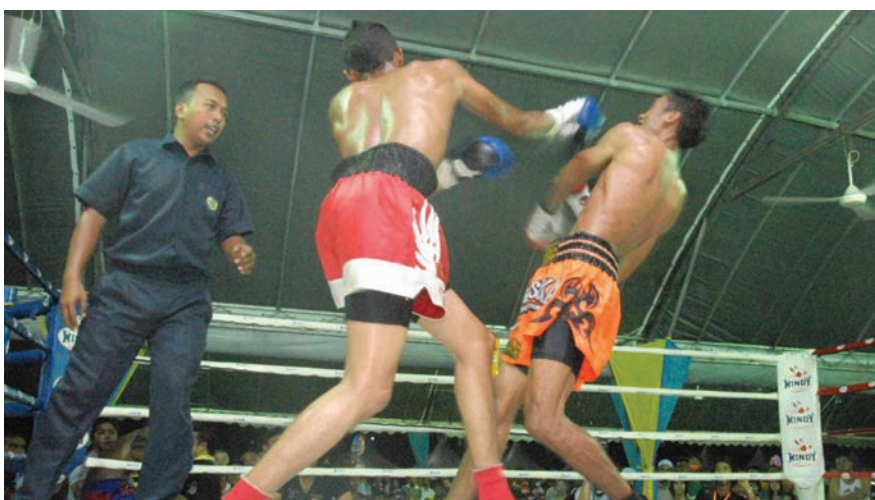
Penangites had a taste of the thrilling, combative sport Muay Thai or Thai Boxing recently. Thousands gathered at the Esplanade field to watch the boxers battling it out in the ring. The event received the support of the Penang State Government, MPPP and UPEN (Penang Economic Planning Unit). The boxers were from several States in Malaysia and Thailand.