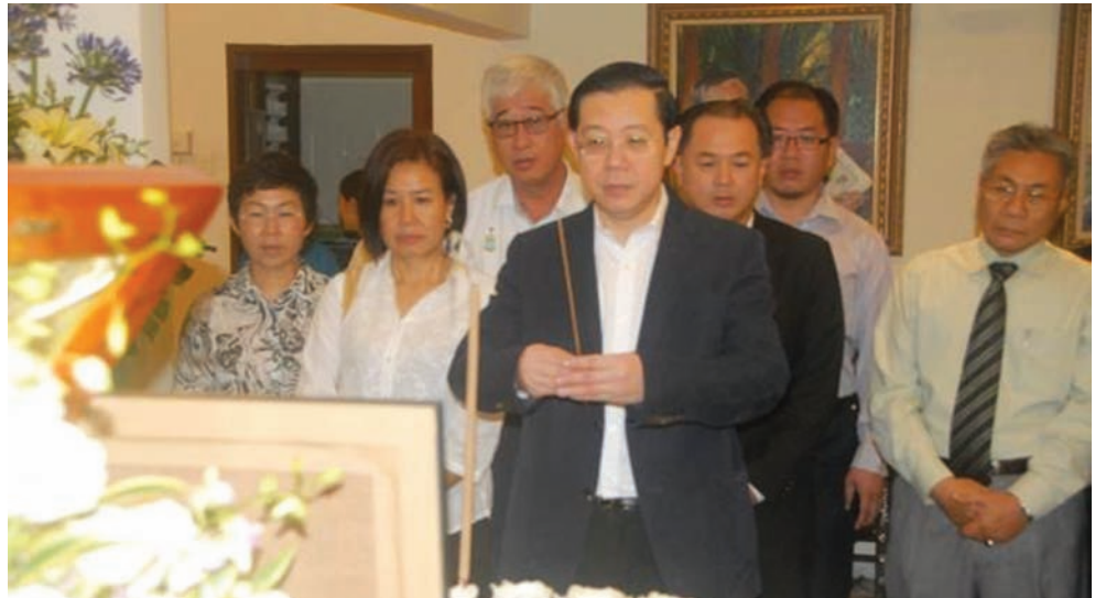
槟州首长林冠英（前）与槟州第一副首长拿督曼梳（后排右起）、槟州行政议员罗兴强、槟州首长夫人周玉清、槟州行政议员王国慧、槟州行政议员彭文宝以及光大区州议员黄伟益，上香拜别杜潘吴欣燕。