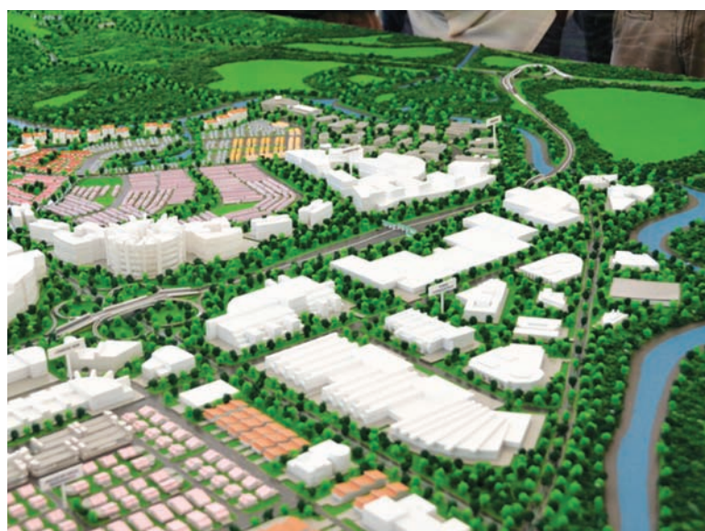
An artist impression of the Batu Kawan affordable housing project.

The Penang state government has acknowledged the rise in property prices due to rising public confidence in the CAT administration of competency, accountability and transparency, which has resulted in record budget surpluses yearly and also a record debt reduction of 95%. To ensure that there are sufficient affordable housing, the state government has allocated a RM500 million for it. This is the largest amount for affordable housing allocated by any state government in Malaysia. Under Phase 1 of the affordable housing programme, 12,000 units will be built in Batu Kawan, Seberang Perai Selatan. Phase 2 in the remaining four districts around Penang will see another 6,000 units of affordable housing being built.