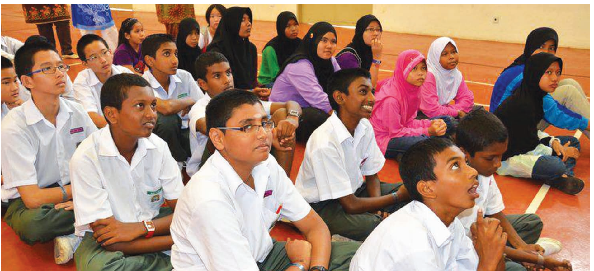
Some of the students listening to instructions during the workshop.

"We also plan to organise monthly art classes in the near future and are looking for teachers to set up the classes."