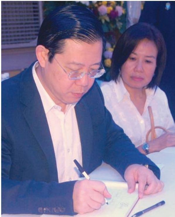
槟州首长林冠英为杜潘吴欣燕写下追悼挽词，并表示槟城人不会忘记，杜潘生前的优雅及尊贵。