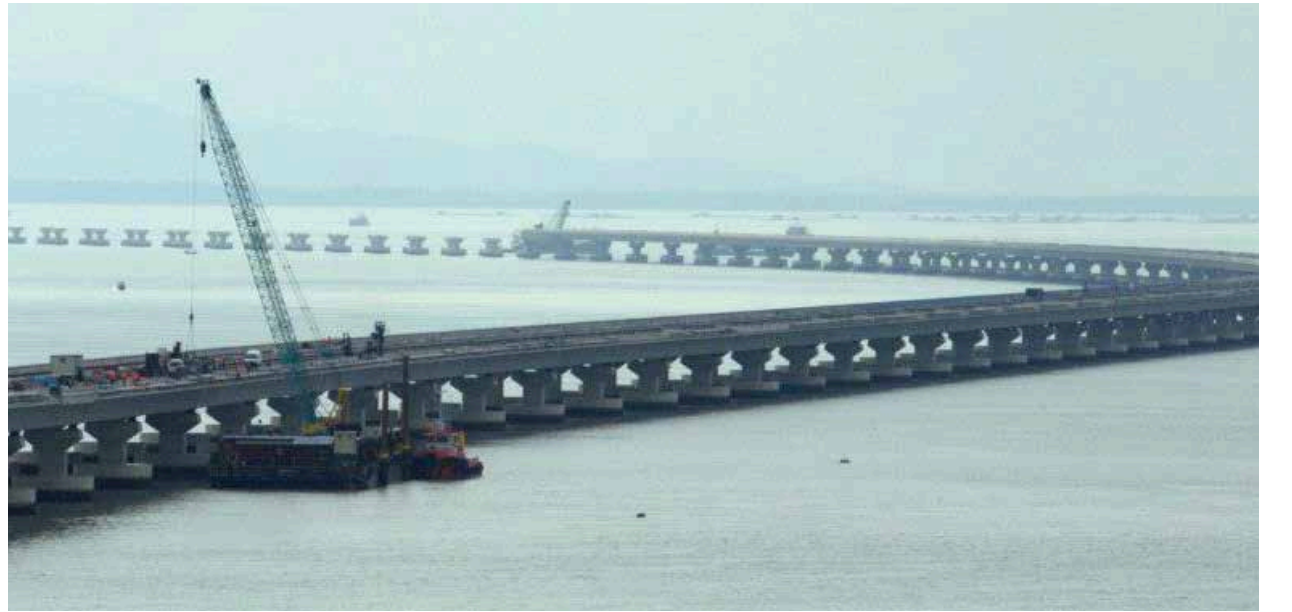
16.4 கிமீ நீளமுள்ள இரண்டாம் பாலத்தின் வளைவுப் பாதை