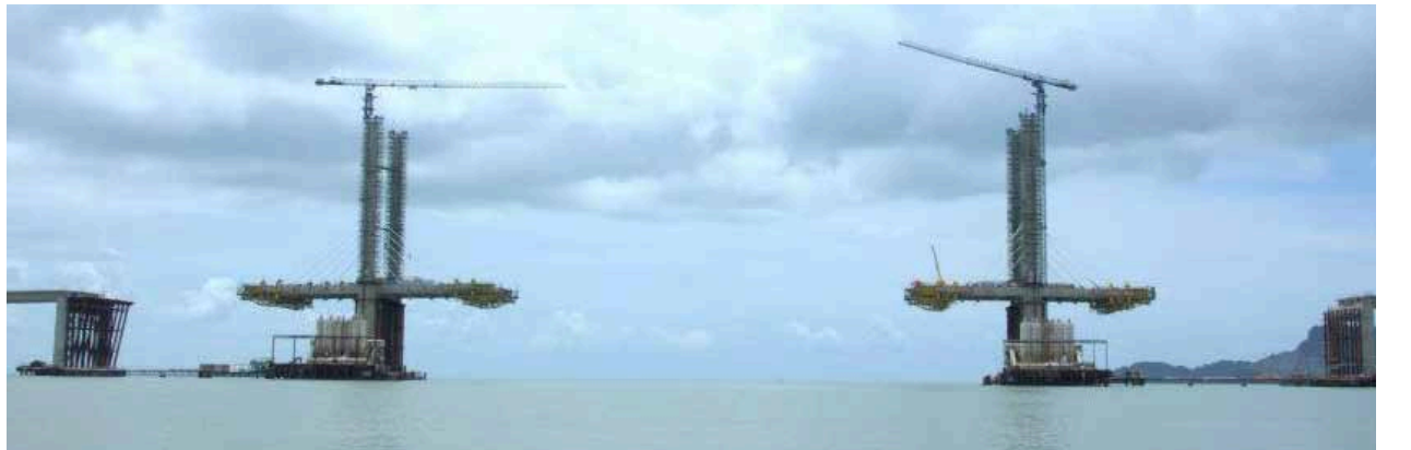
அடுத்த ஆண்டு ஏப்ரல் மாதத்திற்குள் ஒன்றிணைக்கப்படவிருக்கும் பாலத்தின் பிரதான நடுப்பகுதி