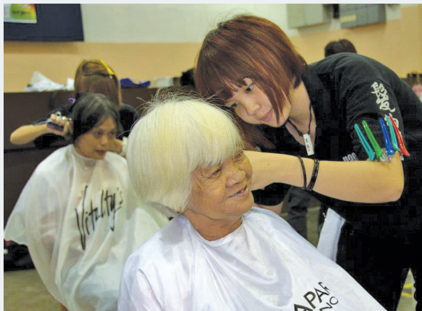
老人家笑得如此灿烂，可见她对理发师的手艺很满意。

植物园区州议员王康立与服务队和檳州打枪埔发展及社区安全委员会在25日早在打枪埔市政局民众会堂免费帮打枪埔居民理发，时间从9时开始至12时结束。这项活动是由发绅理发学院赞助。