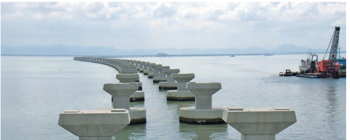
用作撑托桥身的桥墩。