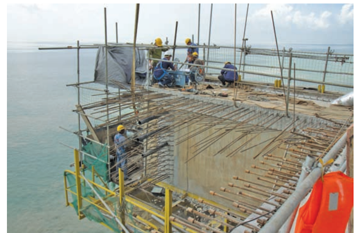
建筑工友谨慎地完成每项建桥细节。