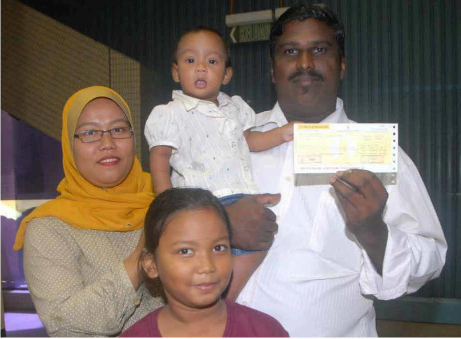
குடும்பத்தினருடன் தங்கக் குழந்தை நொர் ::பாரிசா ஹனிஸ்