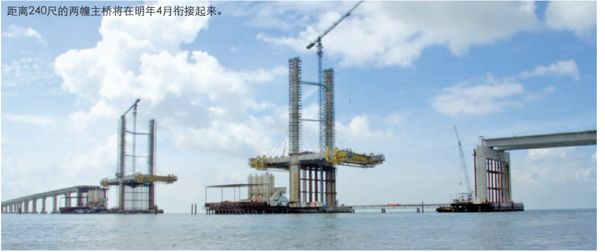
距离240尺的两幢主桥将在明年4月衔接起来。