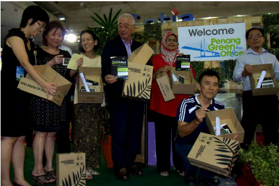
பினாங்கு பசுமை அலுவலகத் திட்டத்தின் தொடக்கக் கருவிப் பெட்டிகளுடன் ஆதாரவாளர்களும் ஆட்சிக்குழு உறுப்பினர்களும்.

மேலும், இத்திட்டத்தில் பங்கு கொண்ட முதல் 1000 அலுவலகப் பிரதிநிதிகளுக்குத் தொடக்கக் கருவிப் பெட்டிகள் வழங்கப்பட்டது.