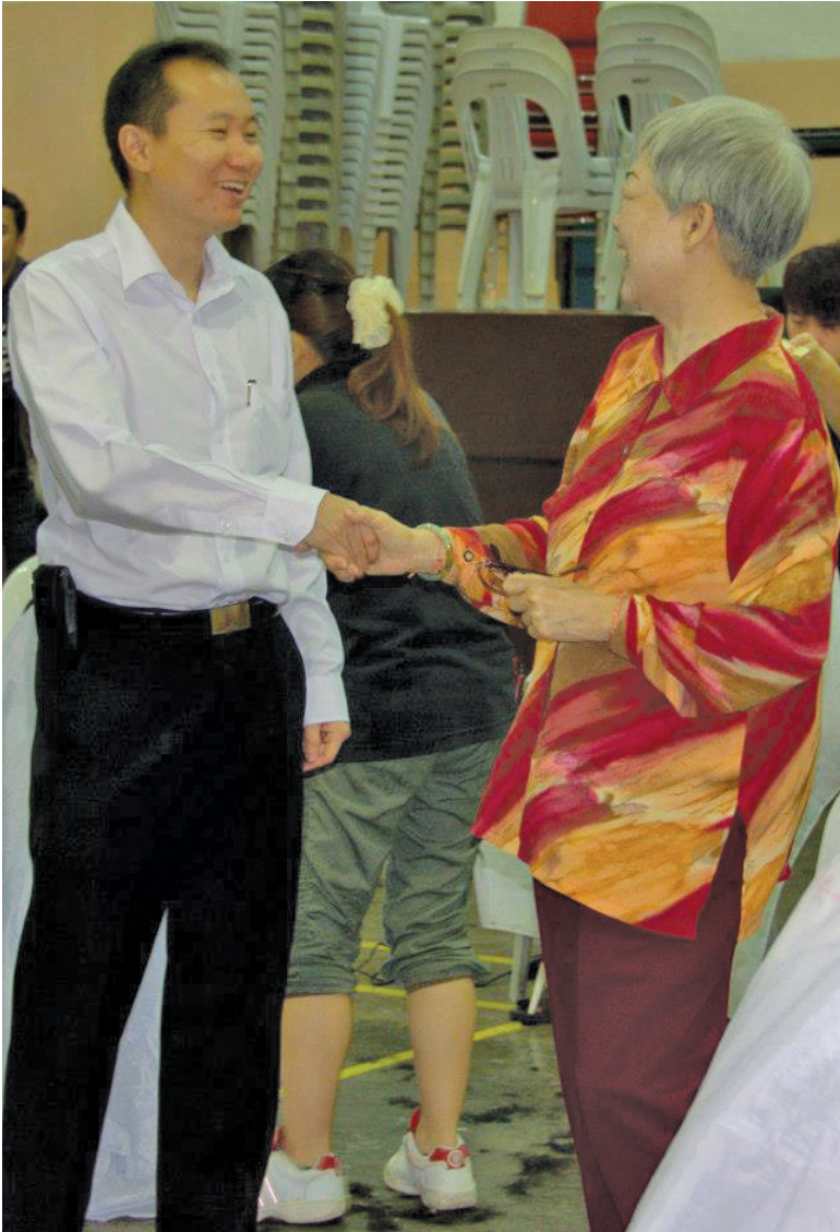
Ong attending to the people in his constituency.