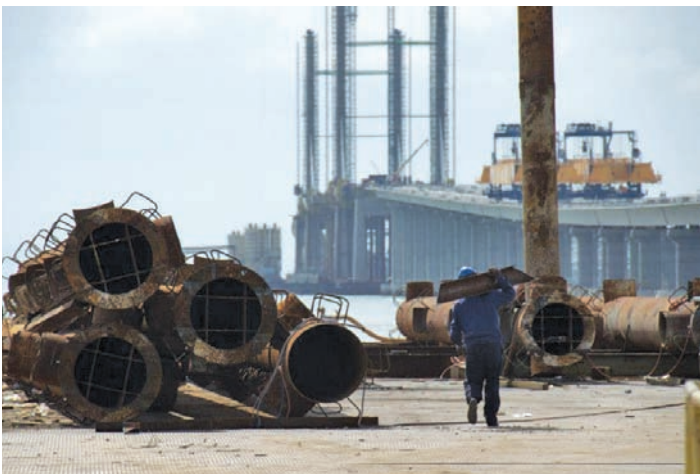
檳城第二大桥兴建工程目前正如火如荼地进行着。