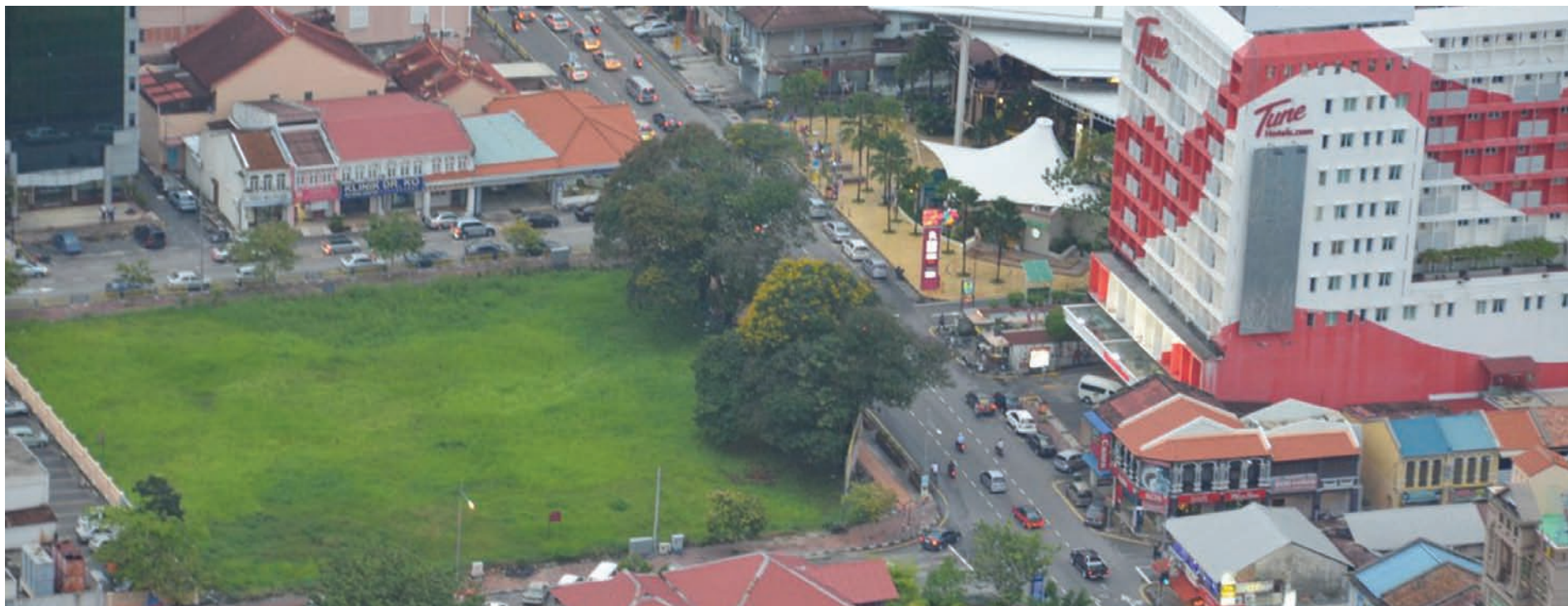
An aerial shot of Taman Manggis which is a piece of green field along Jalan Burmah/Jalan Zainal Abidin.