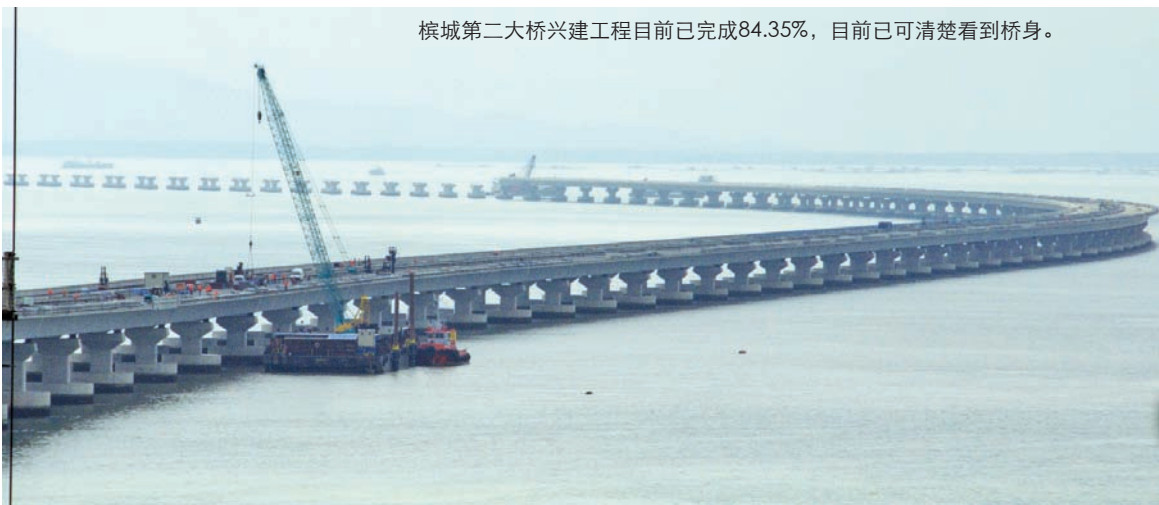
檳城第二大桥兴建工程目前已完成84.35%，目前已可清楚看到桥身。