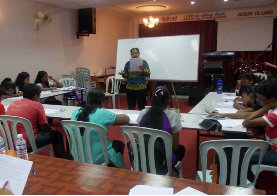
ஆங்கிலப் பாடத்திற்கான தேர்வு வழிகாட்டி கருத்தரங்கு நடைபெறுகிறது.