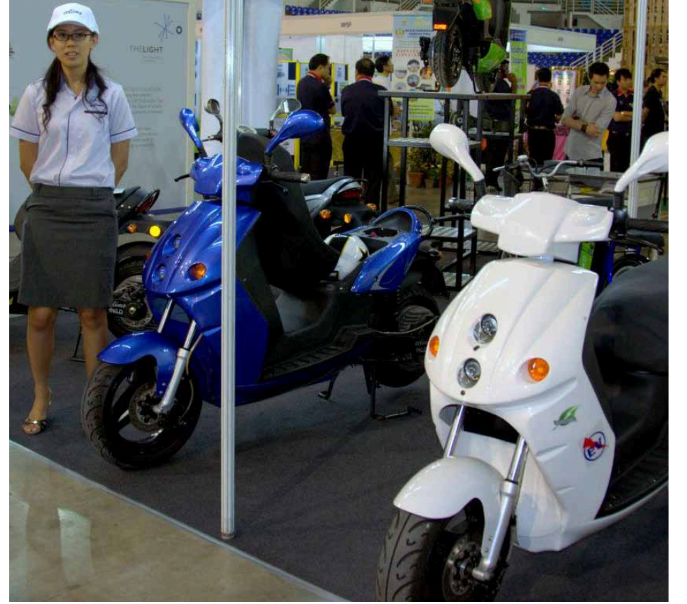
அதிர்ஷ்டக் குழுக்கலின் முதன்மைப் பரிசான மின் மேட்டார் வண்டி.

இத்தொடக்கக் கருவிப் பெட்டிகளுக்கு முதன்மை ஆதரவாளர்களாகக் கொணிக்கா மினொல்டா மற்றும் தெட்ரா பாக் நிறுவனங்கள் திகழ்ந்தன. அரசாங்கத் துறையைச் சேர்ந்த அனைத்து அலுவலகங்கள் உட்பட தனியார் நிறுவனங்களைச் சேர்ந்த பதிவு பெற்ற தொழிற்சாலைகள், வங்கிகள், பேரங்காடிகள், தங்கும் விடுதிகள் போன்ற நிறுவனங்களும் இத்திட்டத்தில் பங்குபெற்று சான்றிதழ் பெற வரவேற்கப்படுகின்றன.