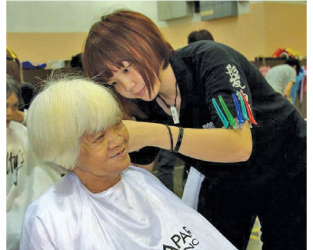
A happy, smiling resident of Rifle Range posing for Buletin Mutiara while getting a new hair do.

They also hope there is more welfare aid for the people in the form of free rice, food and cash. Currently, the sen-