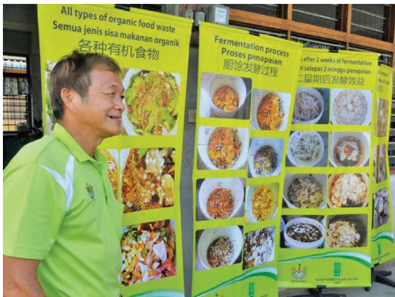
A staff member of MPSP posing with charts on how to turn kitchen waste into organic compost.