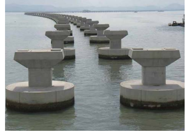
இன்னும் பாதைகள் அமைக்கப்படாத பாலத்தின் ஒரு பகுதி

ரிம 4.5 பில்லியன் பொருட்செலவில் அமைக்கப்படும் இவ்விரண்டாம் பாலம் பினாங்கின் தலையாய சின்னமாகத் திகழும் என்பதில் எவ்வித ஐயமுமில்லை. இவ்விரண்டாம் பாலத்தின் வடிவமைப்பு அப்படியே முதல் பாலத்தை ஒத்திருப்பதால் உலகிலேயே மிக நீளமான இரட்டைப்பாலத்தைக் கொண்ட முதல் மாநிலமாகப் பினாங்கு மாநிலம் சரித்திரப் பதிவேட்டில் முத்திரை பதிக்கும் எனலாம்.