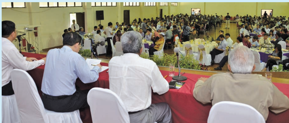
An overview of the hall in the Caring Society Complex.