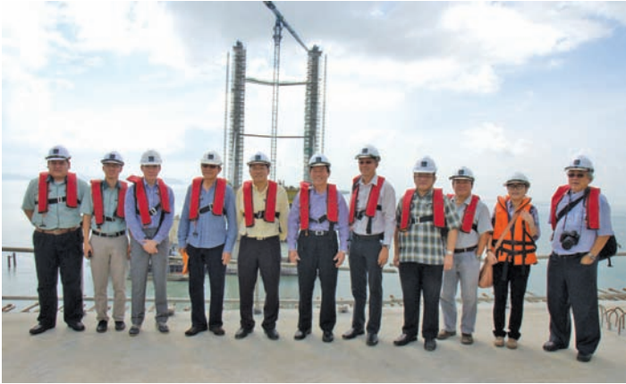
林峰成行政议员（中）与槟州交通理事会聆听槟州第二大桥有限公司的檳城第二大桥工程汇报会。