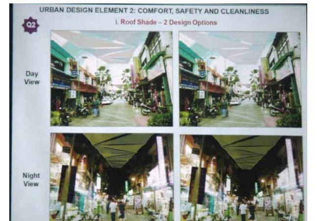
கூரைநிழல் வடிவமைப்பைப் பகலிலும் இரவிலும் படத்தில் காணலாம்