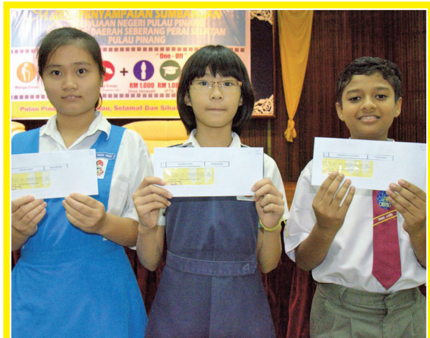
Year 1, Year 4 and Form 1 and Form 4 school children from Penang received RM100 from the state government under the Golden Students Program. Please contact your state assemblymember or area co-ordinator's service centre to register your child under this programme.

“The Federal government should be aware that Penang played a significant