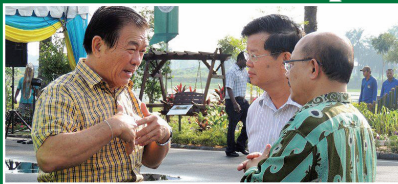
Penang state level was celebrated on Oct 6 at Vision Park in Kepala Batas