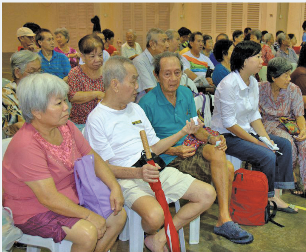
当地居民在领取号码后便耐心地坐着等待，同时欣赏工作人员所播出的影片。

他也表示，打枪埔组屋将安装电眼，目前除了J座没有安装，因为该座所使用的升降机还未更新，待J座升降机安装后也同样会安装上电眼。