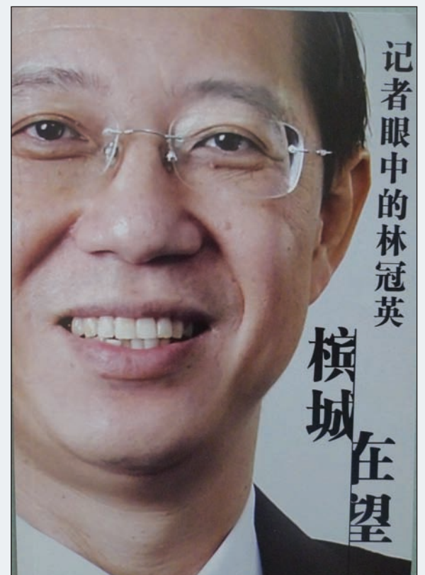
山寨版《檳城在望》在州内巴刹流传，旨在扭曲及破坏民联的良好施政。