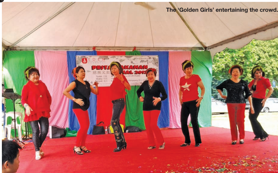
The 'Golden Girls' entertaining the crowd.

He added that at the present moment the centre has 145 people and its community service unit is servicing and providing food aid, medical assistance, transportation and other service facilities to some 30 families in the community.