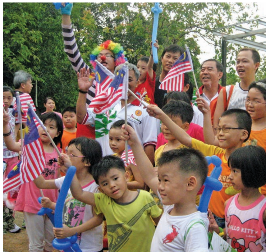
Children waving the Jalur Gemilang to show their patriotism during a group photo session on top of Station 3, after the Merdeka Day Colouring & Drawing Competition.