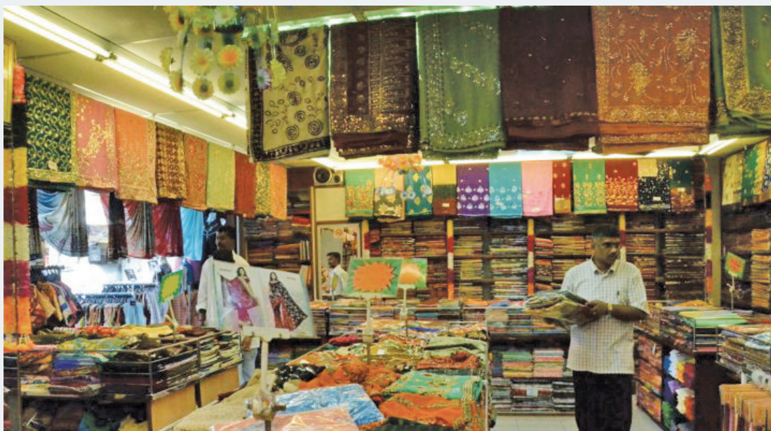
File photo of a saree shop in Little India which enjoys brisk business especially during festivals like Deepavali and Thaipusam

He said Little India in Penang takes on a festive atmosphere this year for it is crowded with shoppers who are preparing for Hari Raya and Deepav-