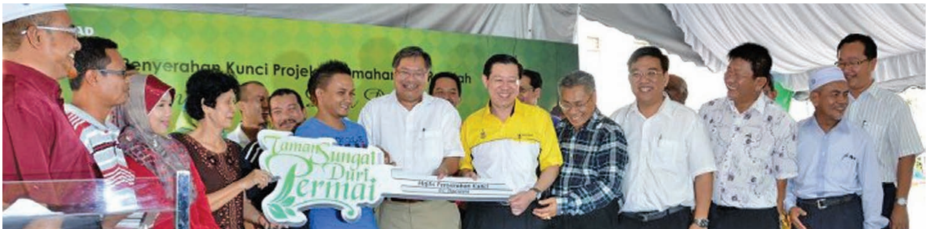
Representatives of Taman Sungai Duri Permai House Owners posing for a group photograph.

Story by Danny Ooi , Pix by Law Suun Ting