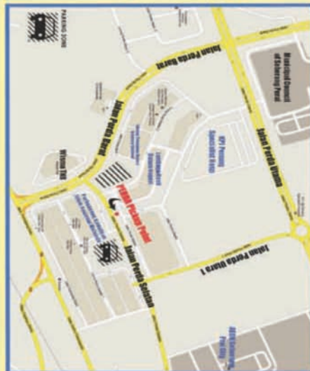
Map of Pickup Point Location