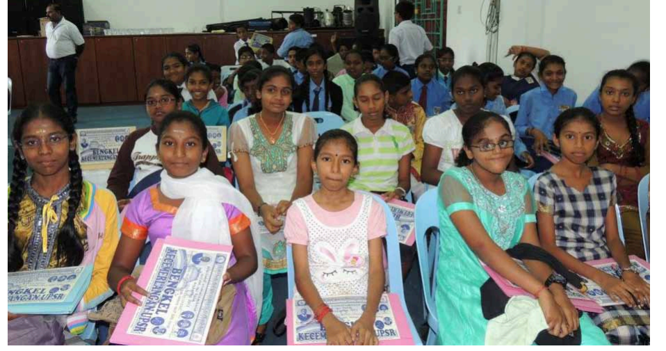
வழிக்காட்டிக் கோப்புகளுடன் மாணவர்கள்.

காலைச் சிற்றுண்டி, மதிய உணவு மற்றும் தேநீர் விருந்தினை இலவசமாக வழங்கினர் என்பது குறிப்பிடத்தக்கது. சுமார் 9 மணித்தியாலம் நடைப்பெற்ற இக்கருத்தரங்கினைப் பிளாங்கின் துணை முதல்வர் பேராசிரியர் டாக்டர் ப. இராமசாமி அதிகாரப்பூர்வமாகத் தொடக்கி வைத்துச் சிறப்புரையாற்றினார். பிளாங்கு மாநிலத்திற்கு தற்போது இருக்கும் 28 தமிழ்ப்பள்ளிகள் போதாதென்றும், இன்னும் பல தமிழ்ப்பள்ளிகள் எழுப்பப்பட வேண்டும் என அவர் கூக்குரலிட்டார். அதிலும் தமிழர்கள் அதிகமாக வாழும் பாகான் டாலாம் வட்டாரத்தில் மிக அவசியமாக ஒரு தமிழ்ப்பள்ளி கட்டப்பட வேண்டும் என அவர் வேண்டுகோள் விடுத்தார். மத்திய அரசு தமிழ்ப்பள்ளிக்கான கட்டடம் கட்டத் தயாராக இருப்பின் மாநில அரசு அதற்குத் தேவையான நிலத்தினை வழங்கும் எனவும் அவர் வாக்குறுதி வழங்கினார்.