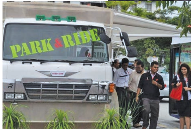
为了缓解槟城大桥的交通流量，槟州政府宣布在BEST计划中新增2个站，那就是在柔府汽车城及大山脚柏达镇，预定在9月3日开跑，让柔府及大山脚区民众也能受惠。