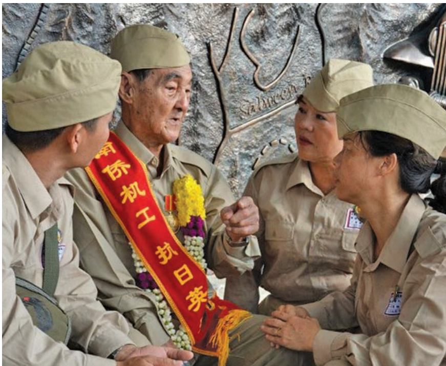
One of the war veteran recalling his experience at the War Memorial to the younger generation dressed in costumes like the uniforms from 1941 for the ceremony.