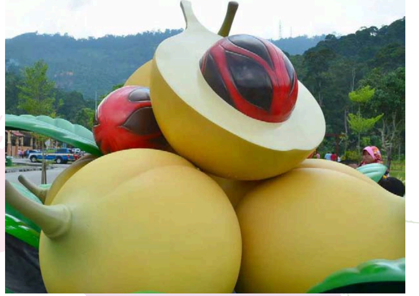
பாலிக் புலாவ் சிறிய பூங்காவில் கண்ணைக் கவரும் 'புவா பாலா'.