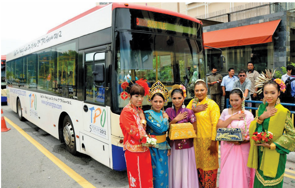
Models dressed in national costumes from the countries who are participating in the TPO like China, Vietnam, Russia, Japan, Korea, Indonesia and others posing in front of the 'Wrap Up' Rapid Penang bus.