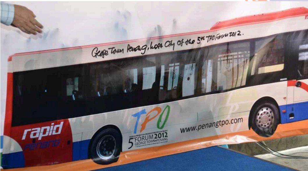
சுற்றுலாத் துறையை விளம்பரப்படுத்தும் மாதிரி பேருந்து.