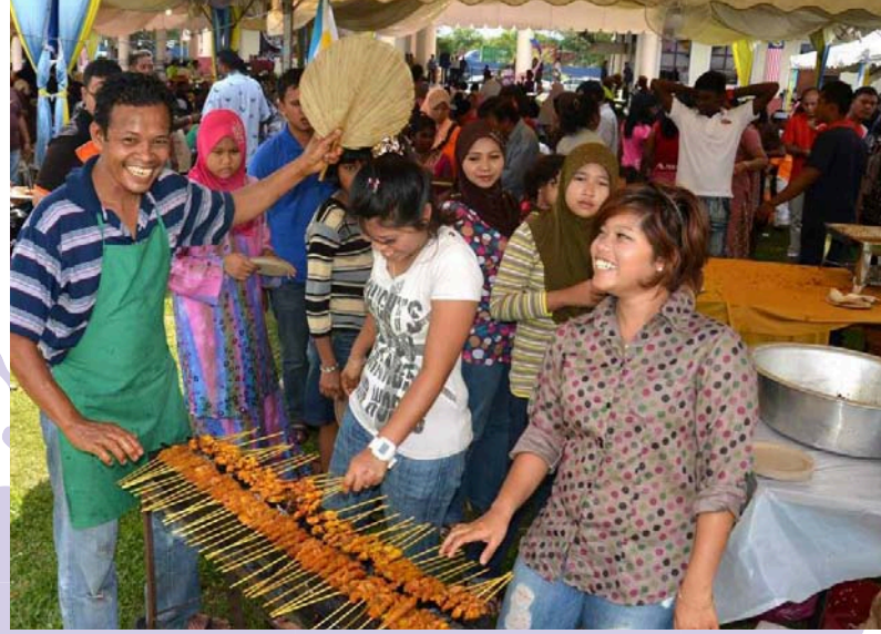
பினாங்கு மாநில நோன்புப் பெருநாள் திறந்த இல்ல உபசரிப்பு.