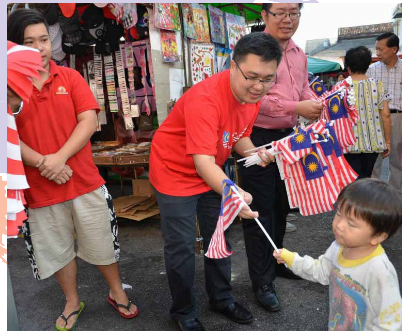
சுதந்திர தினத்தை முன்னிட்டி சாவ் இரஸ்தா பகுதியில் இலவச தேசிய கொடிகள் விநியோகிக்கப்பட்டன. அதனைக் கையில் ஏந்தும் குழந்தை ஒன்றினைப் படத்தில் காணலாம்.