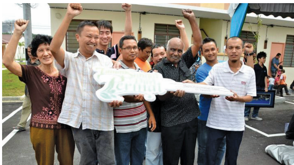
Happy house owners of Taman Sungai Duri Permai

"This commitment proves wrong the claim by the Opposition party that the Pakatan State Government has failed to build affordable houses for the benefit of Penangites," he stressed.