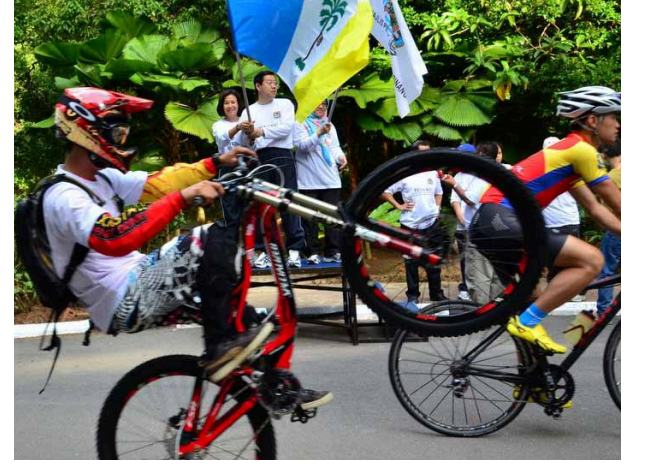
மிதிவண்டியை ஒரு சக்கரத்தில் ஓட்டிச் செல்லும் ஒரு பங்கேற்பாளர்.

மேலும், தனியார் நிறுவனங்களின் ஆதரவோடு இந்த ஆண்டு 16 மிதிவண்டிகள் பூட்டிவைக்கும் இடங்கள் பேருந்து நிறுத்தங்களில் அமைக்கப்பட்டுள்ளன. அதுமட்டுமின்றி ஒரு தனியார் நிறுவனத்தின் ஆதரவோடு இளையோர் பூங்காவில் (Youth Park) இரண்டு மிதிவண்டிகள் நிறுத்தும் அடுக்குகளும் அமைக்கப்பட்டுள்ளன. அதனைக் கடந்த ஆகஸ்ட் 26-ஆம் திகதி மாண்புமிகு முதல்வர் உயர்திரு லிம் குவான் எங் இளையோர் பூங்காவிற்கு வருகை புரிந்து அதிகாரப்பூர்வமாகத் திறந்து வைத்தார். அந்நிகழ்வில் பொத்தானி மலை வாயிலாக இளையோர் பூங்காவிலிருந்து கொடி மலைக்குச் செல்லக்கூடிய மலைமிதிவண்டிப் பாதையும் திறப்பு விழா கண்டது. முதல்வர் லிம் குவான் எங் அந்தப் பாதைகளைக் குறிக்கும் வரைபடத்தின் திரையைத் திறந்து அதில் கையொப்பமிட்டுச் சிறப்புச் செய்தார். மாநில அரசும் பிணங்கு நகராண்மைக் கழகமும் ஒன்றுபட்டு, மாநில அரசு சார்பற்ற இயக்கங்களுடனும் தனியார் நிறுவனங்களுடன் இணைந்து மிதிவண்டி ஓட்டுதலை ஒரு சிறந்த போக்குவரத்துக் கருவியாகவும் உடற்பயிற்சிச் சாதனமாகவும் பயன்படுத்த ஊக்குவித்து வருகிறோம் என முதல்வர் தம் சிறப்புரையில் வலியுறுத்தினார்.