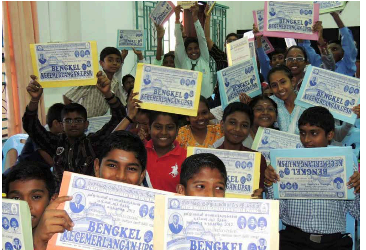
கருத்தரங்கில் பங்குப்பெற்ற மாணவர்களுள் ஒரு பகுதியினர்.

“தொட்டனைத் தூறும் மணற்கேணி மாந்தர்க்குக் கற்றனைத் தூறும் அறிவு”.