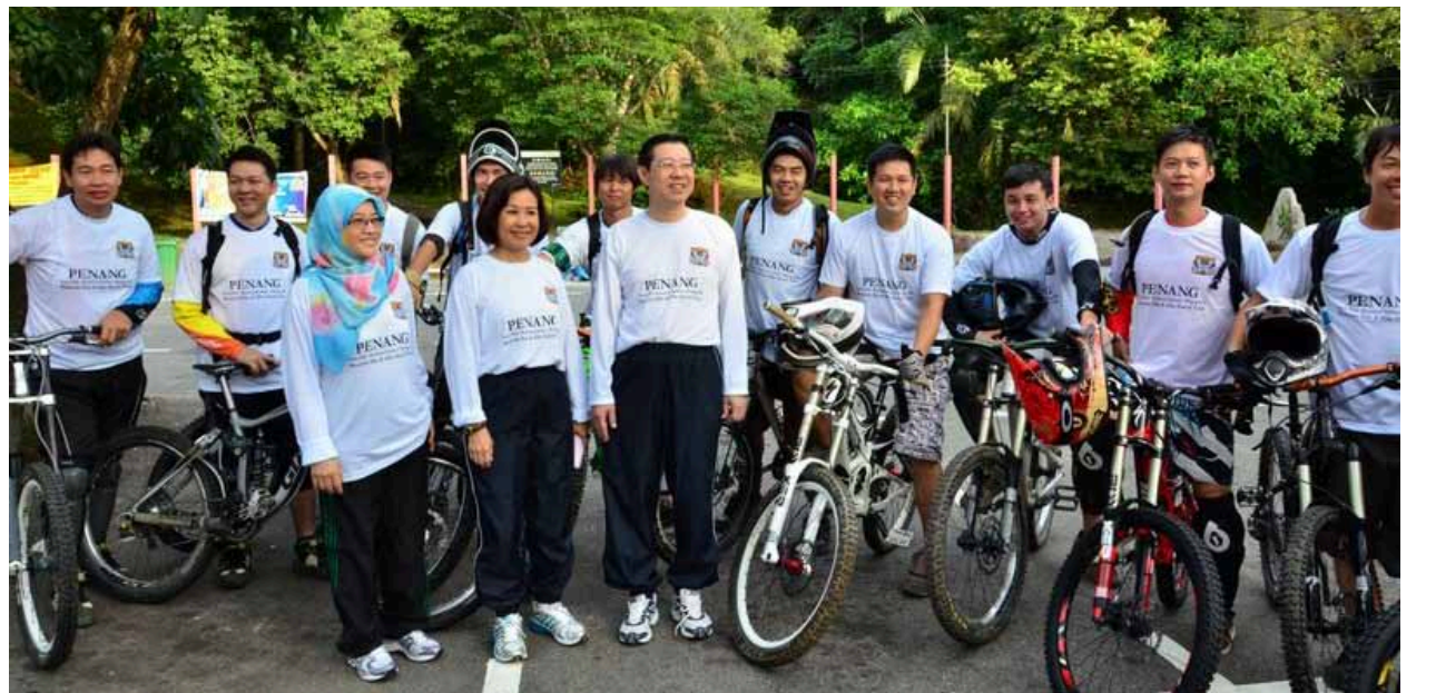
பங்கேற்பாளர்களுடன் நகராண்மைக் கழகத் தலைவர், முதல்வர் திரு லிம் குவான் எங் மற்றும் அவர்தம் மனைவி

‘நோயற்ற வாழ்வே குறைவற்ற செல்வம்’ என்ற பழமொழிக்கொப்ப நோய் நொடியின்றி நலமாகவும் வளமாகவும் வாழ மிதிவண்டியைப் பயன்படுத்துவோம்; சாலை நெரிசலையும் குறைப்போம்.