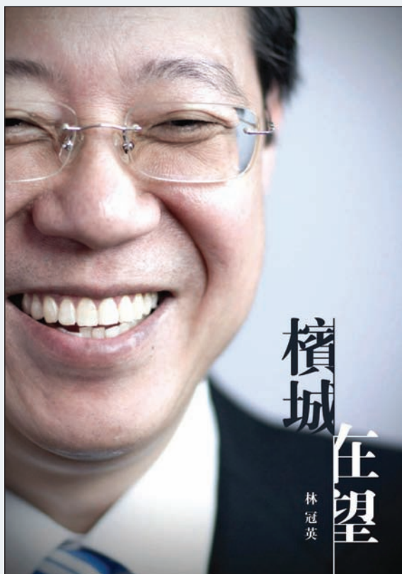
槟州首长林冠英的正版著作《檳城在望》。

有意提供照片及情报者，可电邮 cheongyinfan@penang.gov.my 告密者身份将获得保密。