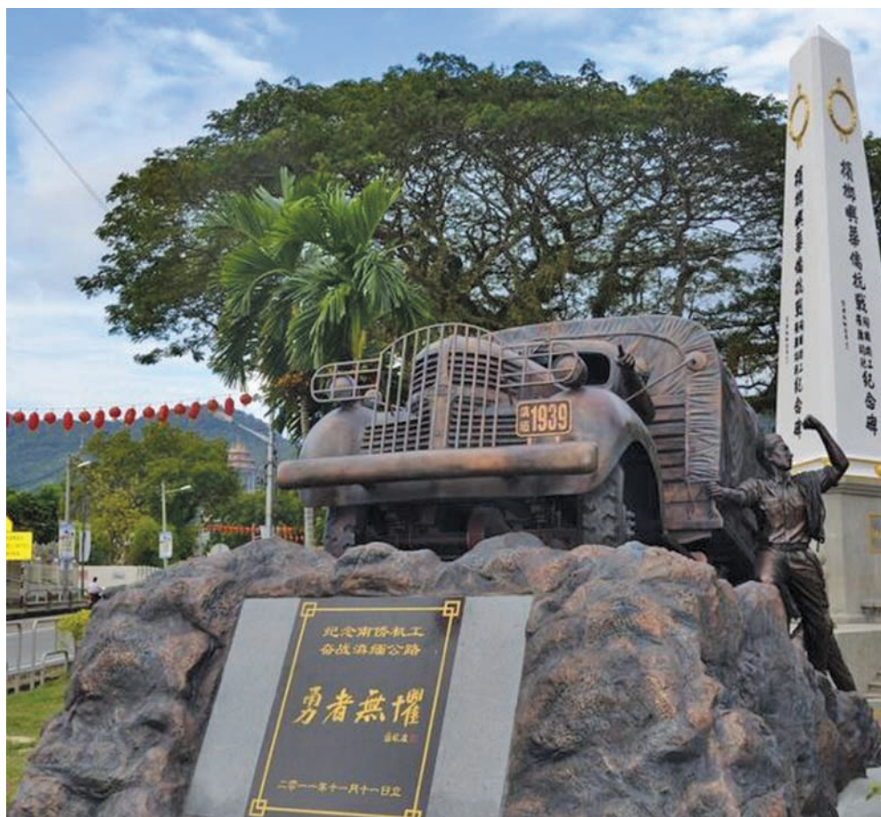
The sculpture and obelisk at the War Memorial in Air Itam.