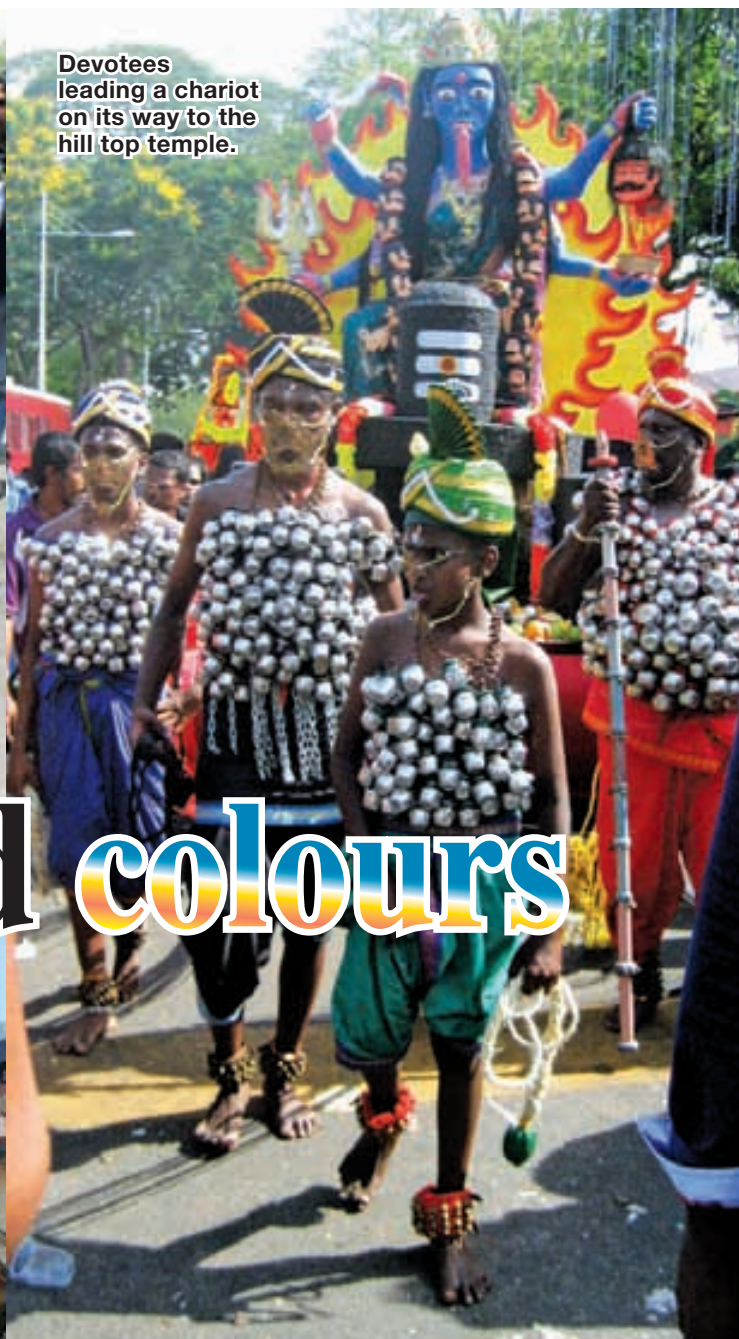
Devotees leading a chariot on its way to the hill top temple.