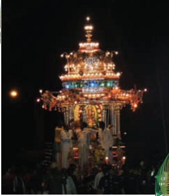
இரவில் ஜோலி ஜோலிக்கும் வெள்ளி இரதம்