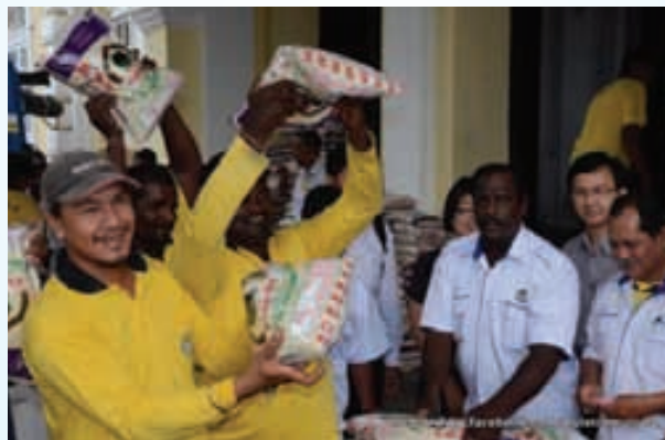
அரிசிப் பொட்டலத்தைப் பெற்றுக் கொண்ட பினாங்கு நகராண்மைக் கழகப் பணியாளர்களில் ஒரு சிலர்.

என்றார் நகராண்மைக் கழக ஆலோசகர் ஒங் ஆ தியோங். கடந்தாண்டில் நடத்தப்பட்ட 'தூய்மையான கழிப்பறை 2012' போன்ற பிரச்சாரம் நகராண்மைக் கழக ஊழியர்களின் சிறந்த சேவையினை நன்கு புலப்படுத்தியது எனலாம். பினாங்கு நகராண்மைக் கழக இயக்குநரான உயர்திரு முபாரக் பின் ஜுனாஸ் நகராண்மைச் சேவைத் துறை ஊழியர்கள் பயன்படுத்தும் வாகனங்களையும் அதன் செயல்பாட்டினையும்