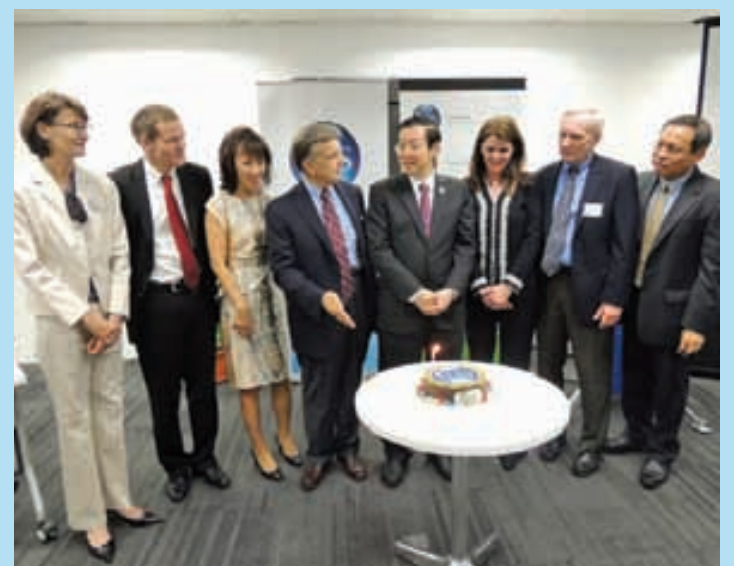
槟州首长林冠英在IHS公司首席执行官杰瑞斯特及IHS公司领导层陪同下，切蛋糕庆祝该公司成立一周年。

IHS公司首席执行官杰瑞斯特表示，该公司成立时只有80名员工，一年后已经达到111名员工，该公司将增加多一层办公室，扩大公司计划之外，也会聘请多145名各领域专才，为槟州子民造就业机会。