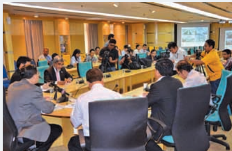
File pic of a press conference taking place at Level 28, Komtar where the chief minister’s office is located.