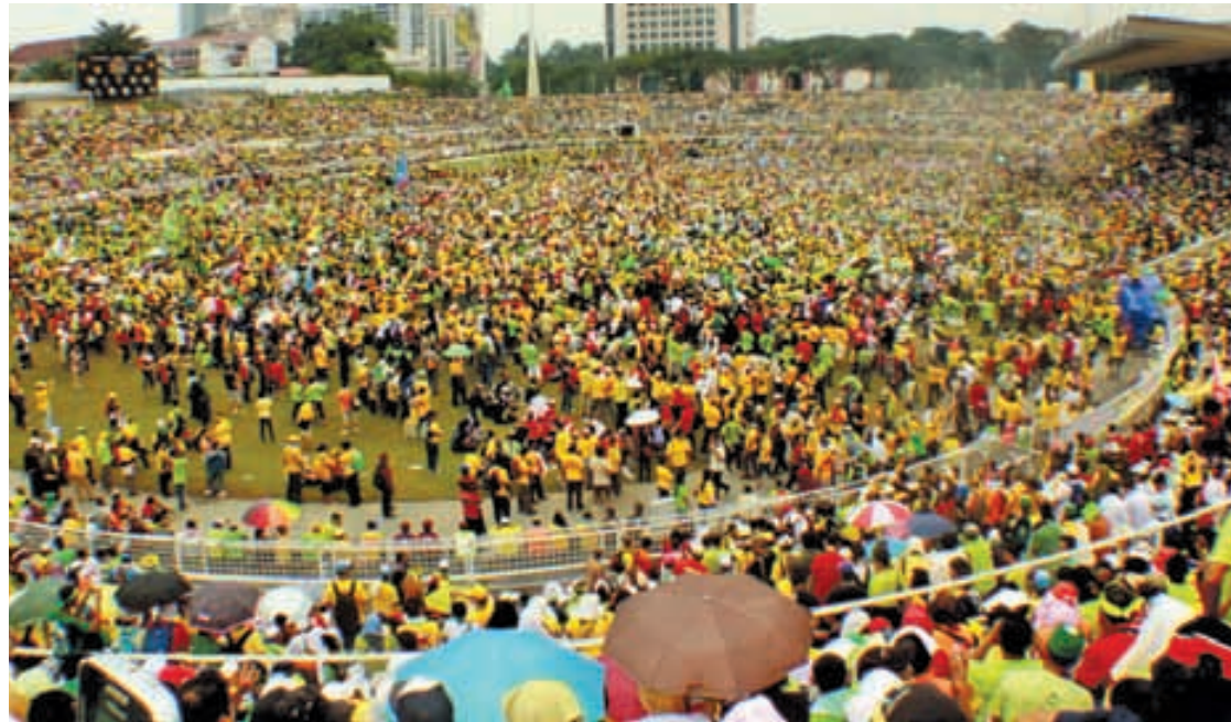
There was only standing room when 150,000 people packed into the Stadium Merdeka, filling up even the football field.

Story by Chan Lilian