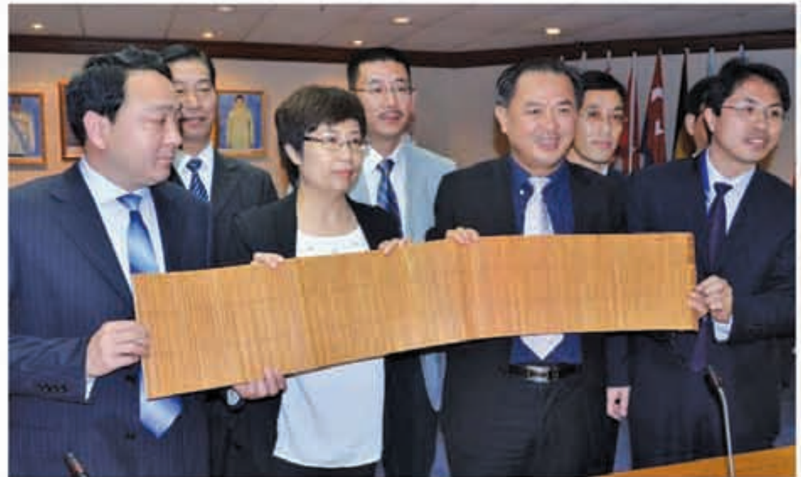
Law (front row, third from left, receiving a bamboo souvenir from the Henan tourism officials.

The delegates said that they will encourage the people in Henan Province to holiday in Penang.