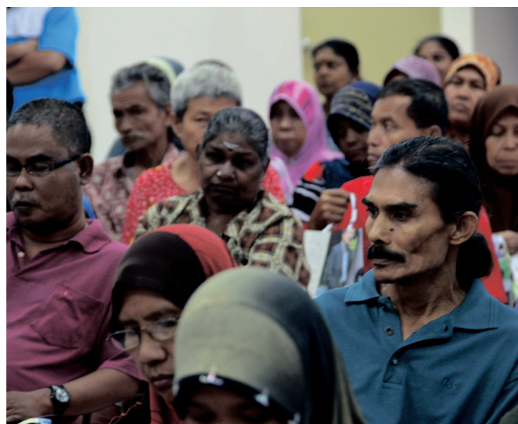
Recipients waiting to receive their AES contribution.

The state government promises to constantly strive to improve the quality of life for its people as a whole and ensure to be a people-oriented government always.