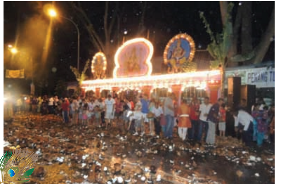
வெள்ளி இரதம் ஜாலான் உத்தாமாவில் அமைந்துள்ள பந்தல்களுக்கு வரும் முன் பக்தர்கள் தேங்காய் உடைத்து வேலவனை வரவேற்கின்றனர்.