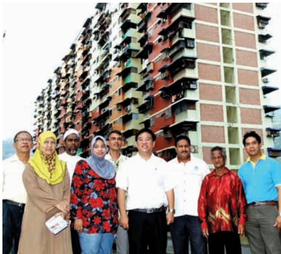
Kampung Melayu flats dwellers delighted with the new coat of paint.