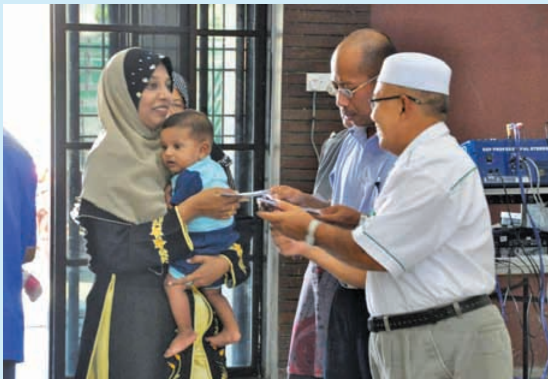
This mom is glad to receive the RM200 Golden Child token for her child.