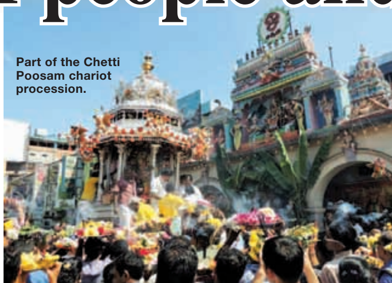
Part of the Chetti Poosam chariot procession.

"Today we celebrate Thaipusam in the new Arulmigu Sri Bala Thandayuthabani Temple, which is supposed to house the largest Lord Murugan Temple