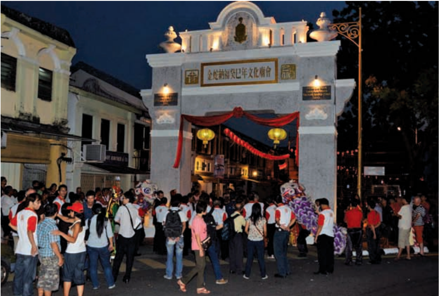
Part of the crowd that witnessed the lighting-up ceremony at Jalan Mesjid Kapitan Keling, George Town.

"We also want them to know how their ancestors came from China to Penang or other places in the country to work and live," she said during the lighting-up ceremony of the arch and lanterns on Jan 30 by Chief Minister Lim Guan Eng.