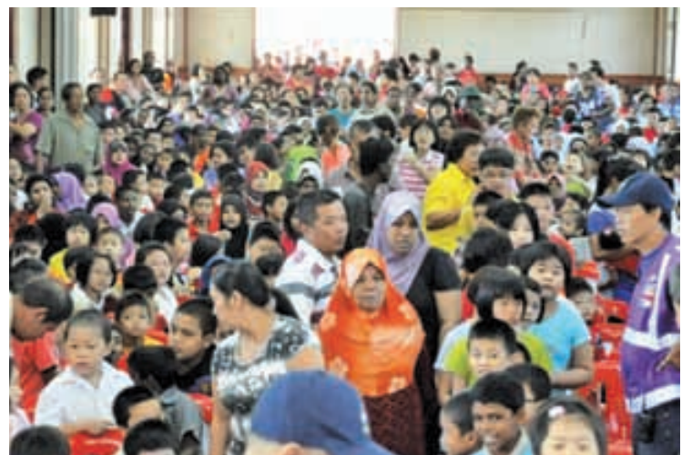
槟州首长林冠英以首长身份拨款给峇眼区贫穷学生，结果被教育局刁难，导致最少有5所学校不敢提供贫穷学生名单给槟州政府而无法获得援助。

他说，去年州政府颁发援助金给区内贫寒学生时，槟州教育局都能够提供资料给州政府，结果有逾600名贫寒学生领取各100令吉援助金，而今年教育局却不知何故拒绝再提供名单，所以只有约500名学生前来领取而已。