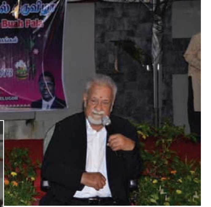
நாடாளுமன்ற உறுப்பினர் மாண்புமிகு திரு கர்ப்பால் சிங் சிறப்புரையாற்றுகிறார்.

அதன் பின்னர், ஆண் பெண் இரு பாலருக்கும் கயிறு இழுக்கும் போட்டி நடத்தப்பட்டது. பெண்களும் தமிழ் மறவர்கள் என்பதை இந்தக் கயிறு இழுக்கும் போட்டியில் பங்கெடுத்து நிரூபித்தனர். போட்டியாளர்கள் தங்கள் முழு வலிமையையும் கொண்டு வெற்றி பெற வேண்டும் என்ற வெறியில் முழு முச்சாக நின்று கயிறு இழுத்தது தமிழர்களின் வீரத்தைப் பறைசாற்றியது. தொடர்ந்து, சிறுவர்களை மகிழ்ச்சி படுத்தும் வண்ணம் அவர்களுக்கென்று பலூன் ஊதி வெடிக்கும் போட்டி, மாவில் ஒளிந்துள்ள மிட்டாய்களை வாயால் ஊதி எடுக்கும் போட்டி, போன்ற போட்டிகள் நடத்தப்பட்டன. சிறுவர் சிறுமியர்கள் குதூகலத்துடன் போட்டிகளில் பங்குபெற்று மகிழ்ச்சி வெள்ளத்தில் மூழ்கியிருந்தனர். வெற்றி பெறுவது இவர்களது நோக்கமன்று, நண்பர்களுடன் சேர்ந்து விளையாடுவதே இவர்களுக்கு மிகுந்த மகிழ்ச்சியை அளிக்கக் கூடியதாக விளங்கியது எனலாம். போட்டி விளையாட்டுகள் முடிவடைந்தபின் 10 மண் சட்டிகளில் பொங்கல் வைக்கப்பட்டது. இது ஒரு போட்டியாக அல்லாமல் மிகவும் ருசியான பொங்கலை வைக்க வேண்டும் என்ற நோக்கில் அனைவரும் ஒற்றுமையுடன் பொங்கலை வைத்தனர்.