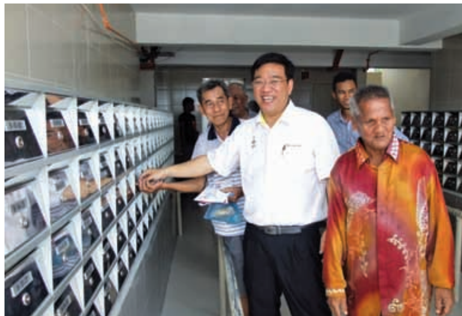
New post boxes for Air Itam residents.