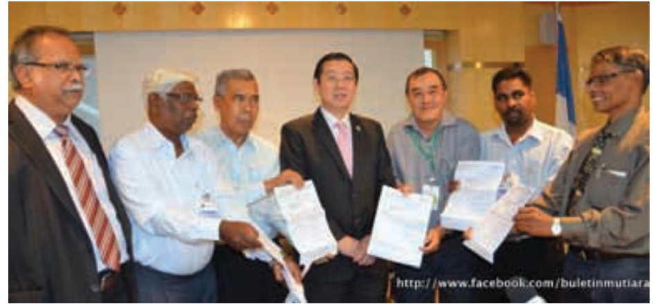
ஐந்து சிறப்பு அதிகாரிகளுடன் மாண்புமிகு பினாங்கு மாநில முதல்வர் லிம் குவான் எங்கும் துணை முதல்வர் பேராசிரியர் ப இராமசாமியும்

சபாவில் மேற்கொள்ளப்பட்ட 'ஐசி' திட்டம் அதாவது அரசு விசாரணை ஆணையம் மூலம் இரண்டு ஆண்டுகளாகக் கள்ள குடியேறிகளாக வசித்தவர்களுக்குக் குடியுரிமை வழங்கியது அறியப்படுகிறது. இருப்பினும், கூட்டரசு அமைப்புச் சட்டம் 18- கீழ்க் குடியுரிமை பெறுவதற்கு இந்த நாட்டில் 10 ஆண்டுகள் வசித்திருக்க வேண்டும். இதன் மூலம், சட்டப்படி வசிக்கும் நாடற்ற குடிமக்களுக்குக் குடியுரிமை வழங்காமல் கள்ள குடியேறிகளுக்குக் குடியுரிமை வழங்கிய தேசிய முன்னணியின் செயல்பாடு நன்கு புலப்படுகிறது என்று முதல்வர் கருத்துரைத்தார். குடியுரிமைப் பிரச்சனைக்கான இந்தச் சிறப்புக் குழு நியமனம் மாநில அரசு பினாங்கு வாழ் மக்களின் மீது கொண்டுள்ள அக்கறையையும் கடமையையும் வெளிபடுத்தி நிற்கிறது.