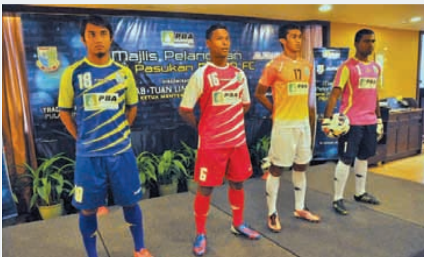
PBAPP FC players proudly displaying their official jersey for 2013.