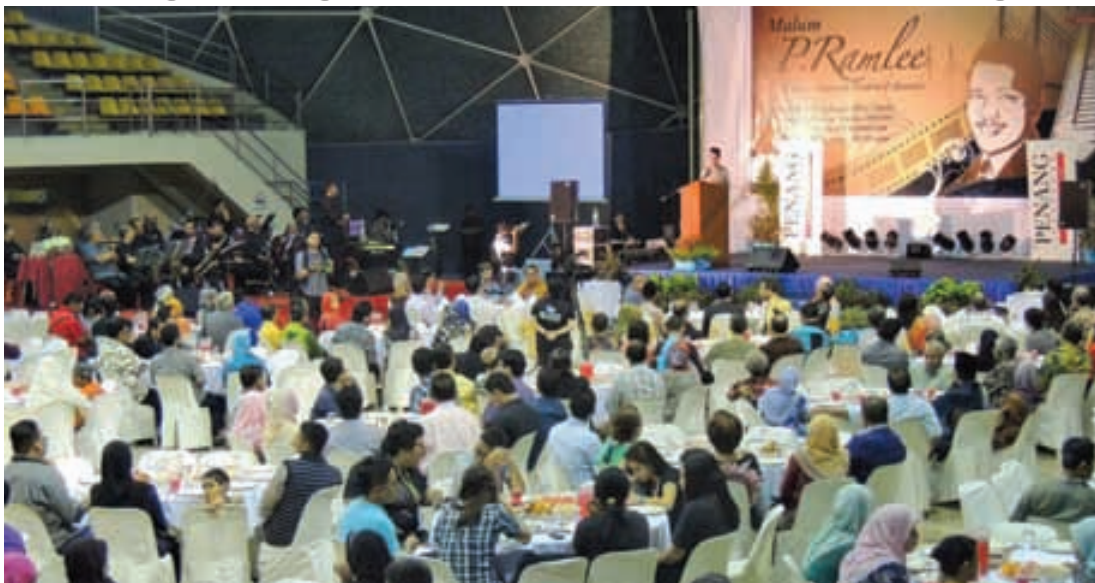
Part of the crowd attending the P. Ramlee Festival Night at Komtar.