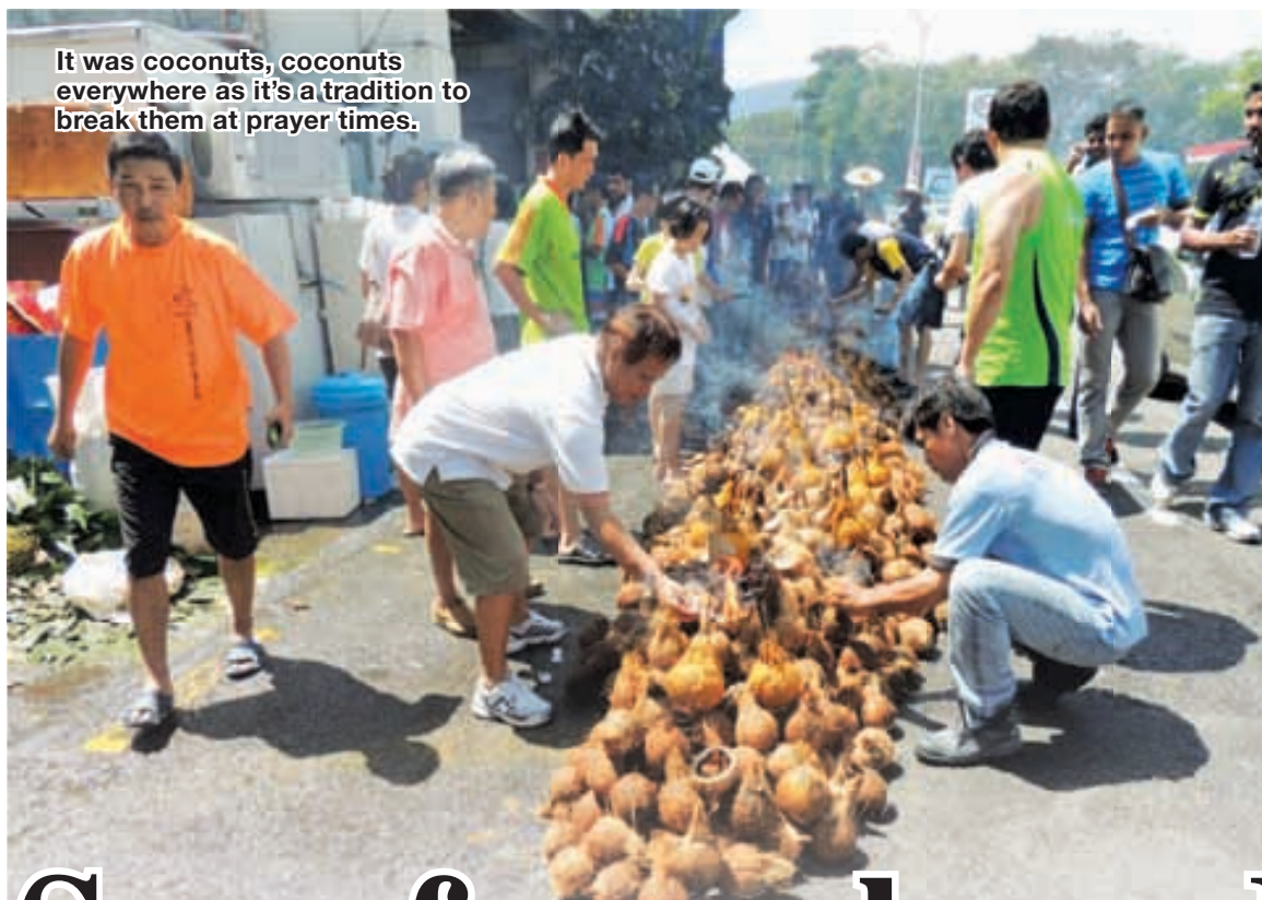
It was coconuts, coconuts everywhere as it's a tradition to break them at prayer times.