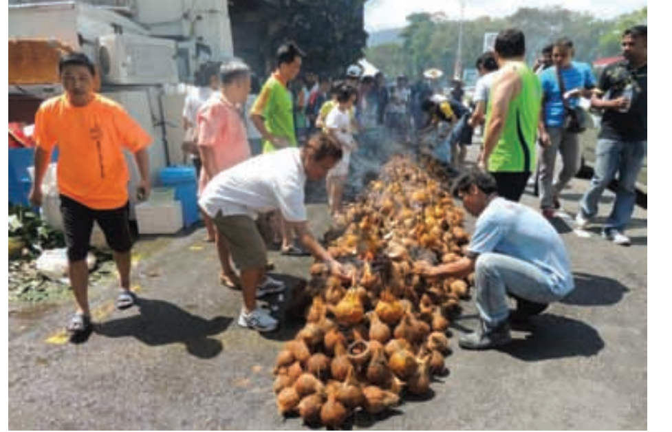
திருக்குமரனுக்குத் தேங்காய் காணிக்கை செலுத்தக் காத்திருக்கும் சீனர்கள்

மலேசிய அளவில் பத்து மலைக்கு அடுத்து தைப்பூசத் திருநாளை மிகவும் விமரிசையாகக் கொண்டாடப்படும் தலமாகப் பினாங்கு தண்ணீர்மலை ஆலயம் திகழ்கிறது. எழில்மிகு இயற்கை தலத்தையும், பசுமை நிறைந்த சூழலையும், மெருகூட்டும் பல கலை அம்சங்களையும் கொண்ட பினாங்கு அருள்மிகு பாலதண்டாயுதபாணி ஆலயம் கடந்த ஆண்டு ஜூன் மாதத்தில் ஒரு கோடி வெள்ளி செலவில் நிர்மாணிக்கப்பட்டுத் திருக்குட நன்னீராட்டு விழாவிற்குப் பிறகு கடந்த ஜனவரி 27-ஆம் திகதி தனது முதல் தைப்பூசத் திருவிழாவை மிகவும் கோலாகலமாகக் கொண்டாடியது.