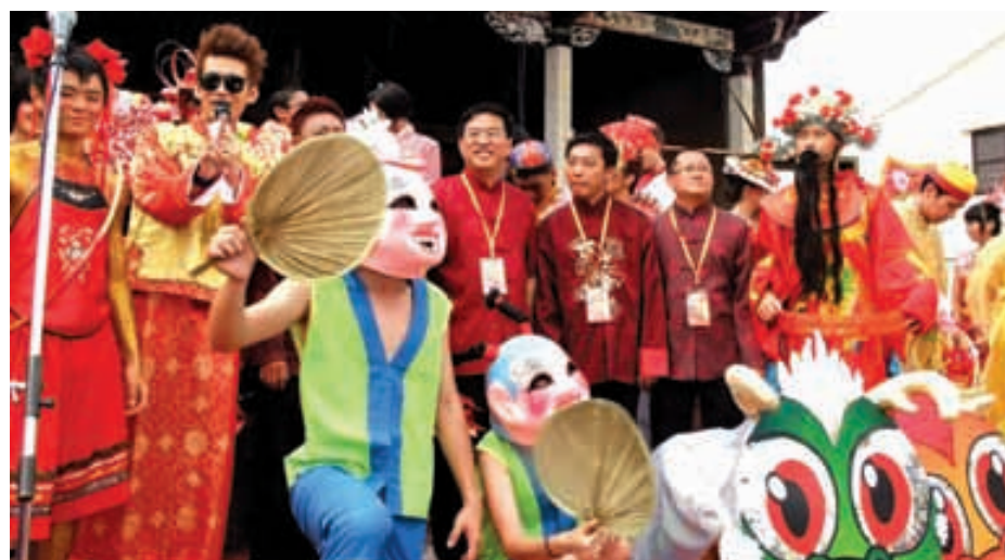
Culture and tradition play a vibrant role in Penang.

4. Setting up of Penang Philharmonic to replace the Penang State Symphony & Chorus (PESSOC). In 2012, Penang Philharmonic held 11 concert shows.