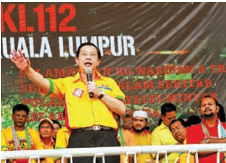
“If Pakatan Rakyat goes to Putrajaya, there will be free wi-fi for Malaysia like the Penang free wi-fi enjoyed by Penangites,” Lim told the 150,000 crowd.

Thunderous claps rang through the packed the stadium when Lim announced that if Pakatan Rakyat goes to Putrajaya, the whole of Malaysia will also enjoy free Wi-Fi.