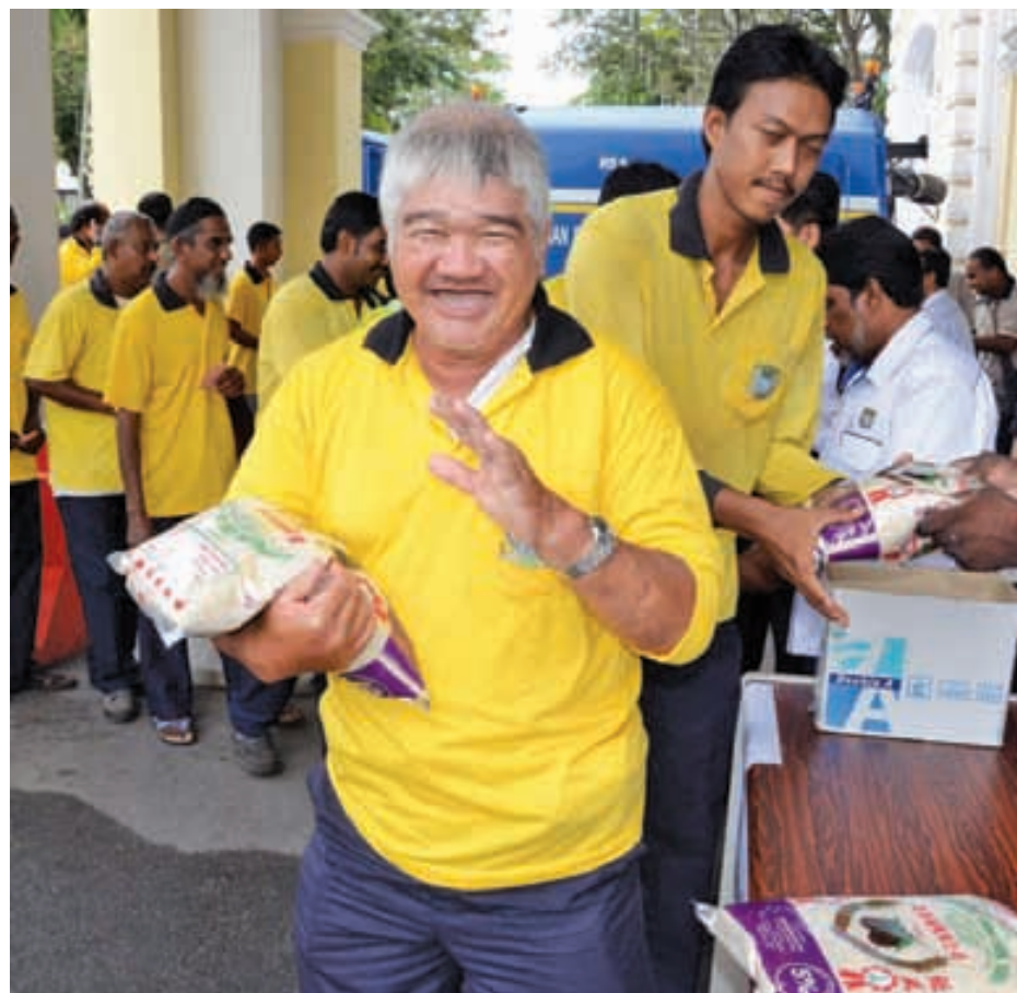
Loke's brightest toothless smile says how happy he was to receive free rice given by MPPP councillors.

have been selected to receive special awards from the Governor during his birthday.