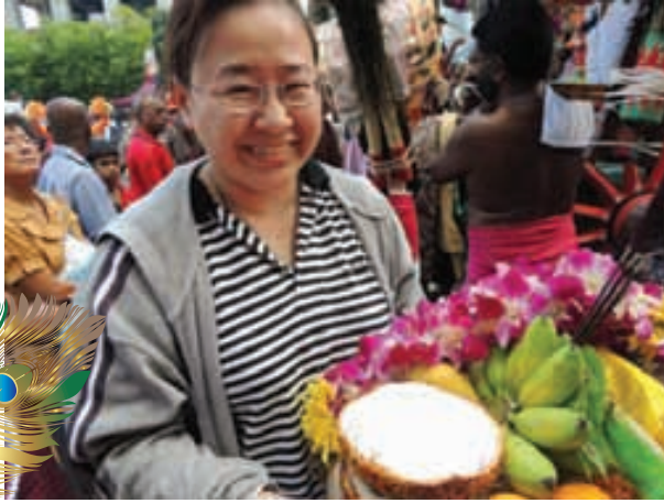
திருக்குமரனின் திருவருளைப் பெற தீபாராதனை எடுக்கும் பிணாங்கு வாழ் சீனப்பெண்மணி