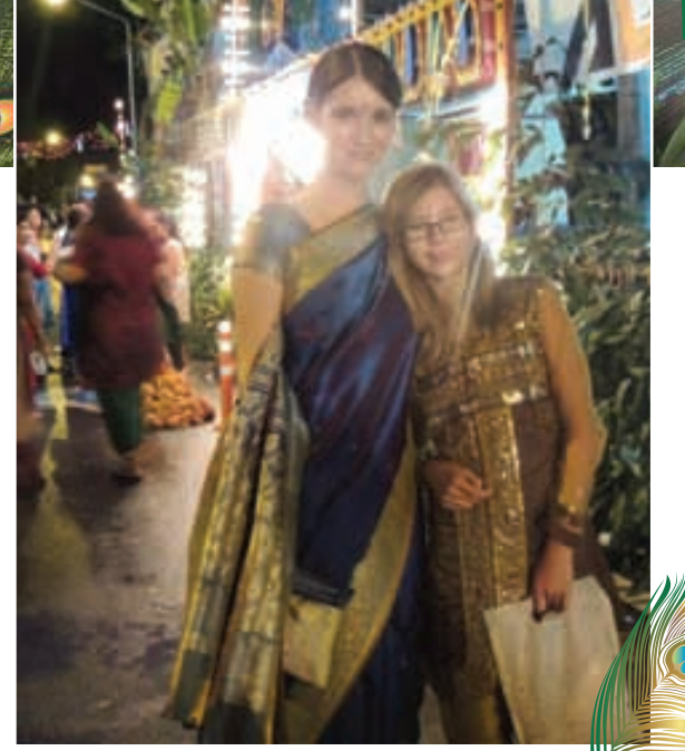
நம் இந்தியப் பாரம்பரிய உடையில் வெளிநாட்டுச் சகோதரிகள்