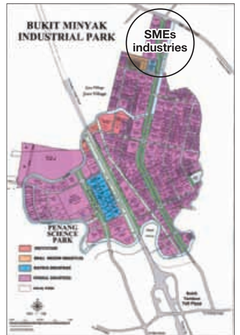
Map shows the SMEs industries (in orange) located at Bukit Minyak.

"It is important that we receive your feedback so that we can build even better facilities to improve our delivery system to