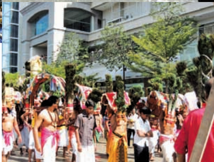
Devotees on their way to fulfil their vows.

The Penang Hindu Endowment Board (HEB) which runs the Thaipusam festivities is also celebrating its own home for the first