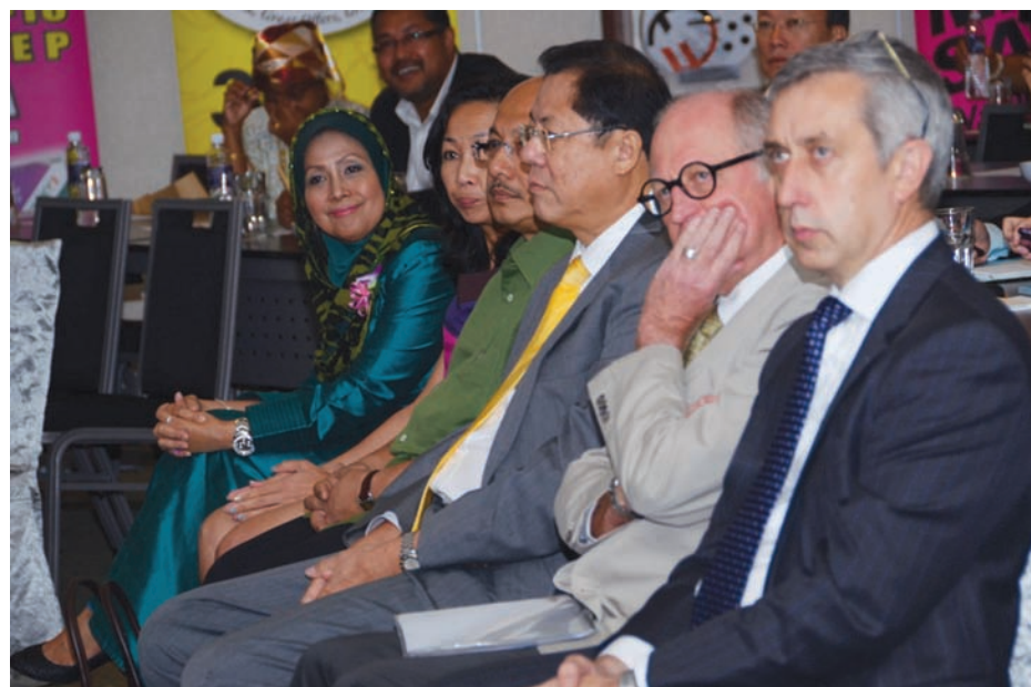
Guests listening to Lim giving his opening address.

Chief Minister Lim Guan Eng, who was invited to deliver his keynote address at the MICE Conference, said: "By 2015, Penang will not only see a new convention and exhibition venues when SPICE is completed. By 2017, another convention venue will be completed, the Penang Waterfront Exhibition Centre by the IJM Group at The Light in Jelutong. This is a good indication of the growing needs for