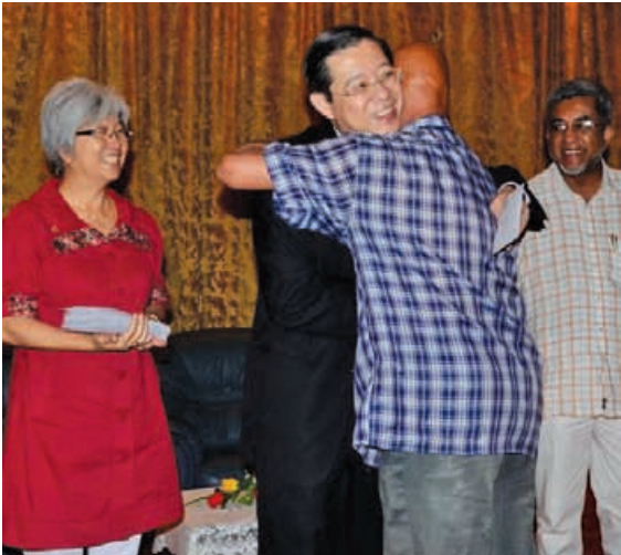
凡已在乐龄人士辅助金计划下登记的乐龄人士在往生后，其授权继承人可获得一次性1000令吉抚恤金。