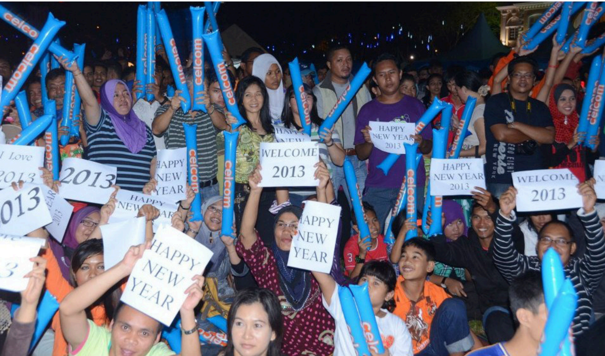
புத்தாண்டு மகிழ்ச்சியில் முழுகியிருக்கும் மக்கள் கூட்டம்