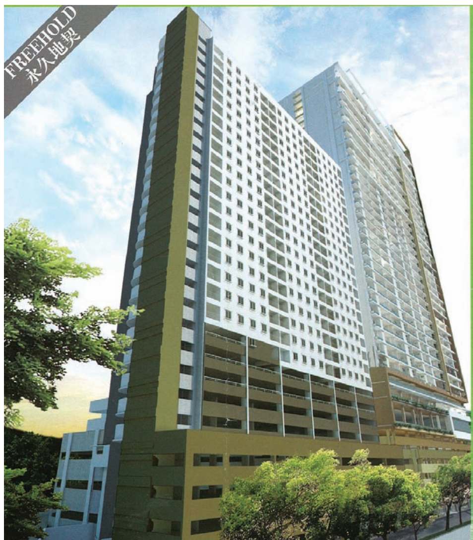
位于发林天德园原址甘妈园的新中廉价组屋发展计划Shineville花园只有234个单位，惟申请人数已超过1000份。