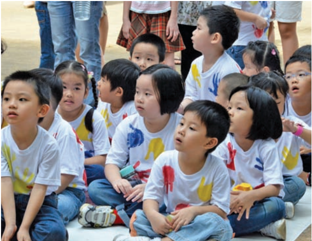
继推行了数项福利计划而取得坊间良好反应后，槟州政府再于2012年落实快乐学生计划，那就是小学一年级、四年级；中学初一及初四的学生皆可获得一次性的100令吉辅助金。