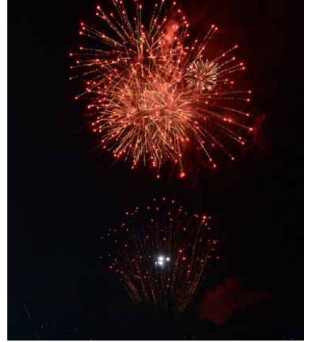
புத்தாண்டை வரவேற்ற வண்ண மயமான வானவெடிகள்

ஏறக்குறைய 50,000 பேர் இப்புத்தாண்டுக் கொண்டாட்டத்தில் கலந்து கொண்டனர். மலாய், சீனர், இந்தியர் என நாட்டின் தலைச் சிறந்த கலைஞர்கள் பங்குபெற்றுத் திரளாக வந்திருந்த மக்களை மகிழ்வித்தனர். ஆடல் பாடல் என்று புத்தாண்டுச் சிறப்பு மேடைப் படைப்புகளை மக்கள் கண்டு களித்தனர். அதில், பினாங்கு இந்திய மக்களை மகிழ்விக்க கோலாலம்பூரைச் சேர்ந்த வில்லன் குழுவினர் வந்திருந்தனர். அவர்கள் வழங்கிய பாடல்கள் இந்திய மக்களை மட்டுமன்றி அனைத்து இனத்தவரையும் கவரக் கூடிய வகையில் அமைந்தது. அனைத்து கலைஞர்களின்