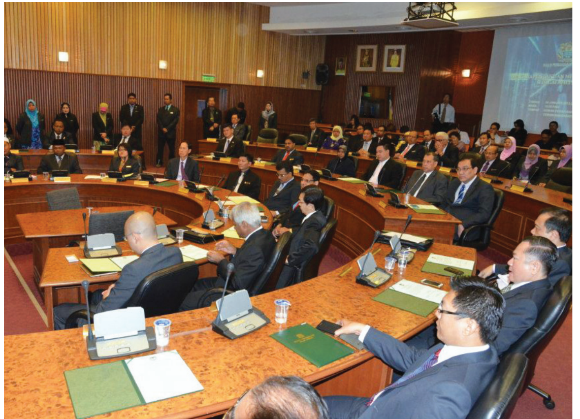
Councillors listening attentively to the speeches before the swearing-in ceremony at the Penang Municipal Hall.

"If we want to move forward and see positive changes, enforcement must be carried out without fear or favour and according to the rule of law."