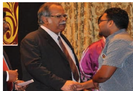
Hindu Endowments Board generously gives scholarships to students.