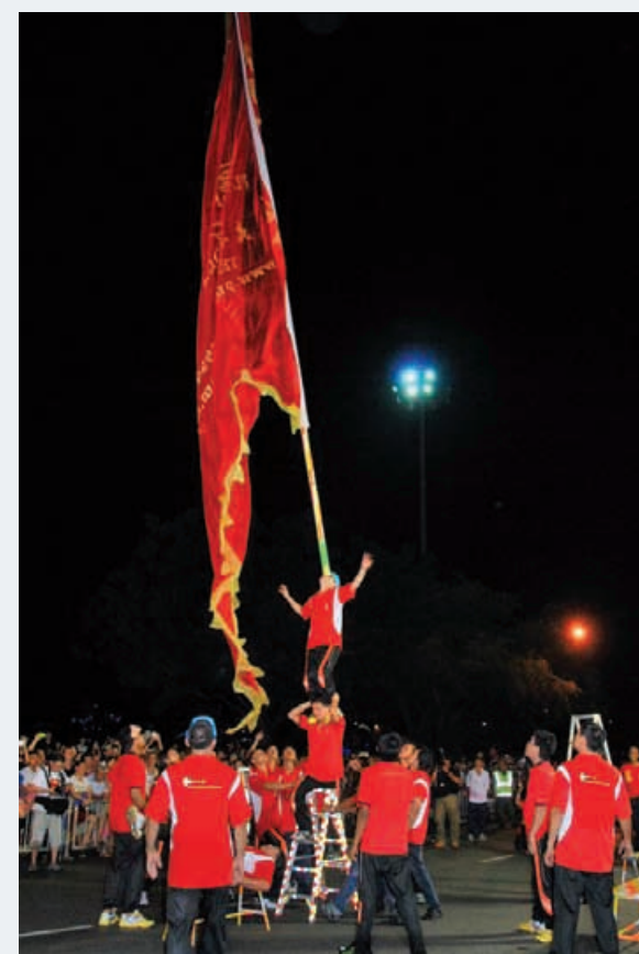
A Chingay group displaying their act for the crowd at the Esplanade ground.

"I hope the activities and programmes will help promote the culture and arts of the State globally and place Penang as a unique tourist destination."