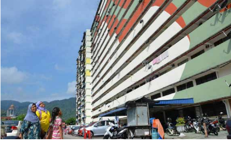
மறு சாயம் பூசப்பட்டப் பிறகு அழகாக தோற்றமளிக்கும் கம்போங் பிசாங் அரசாங்க அடுக்குமாடி வீடமைப்பின் ஒரு கட்டடத்தைக் காணலாம்.