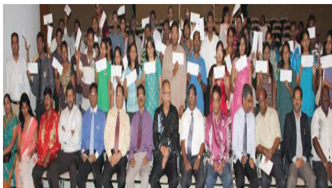
Students receive financial assistance from the Commissioners of the Hindu Endowment Board.