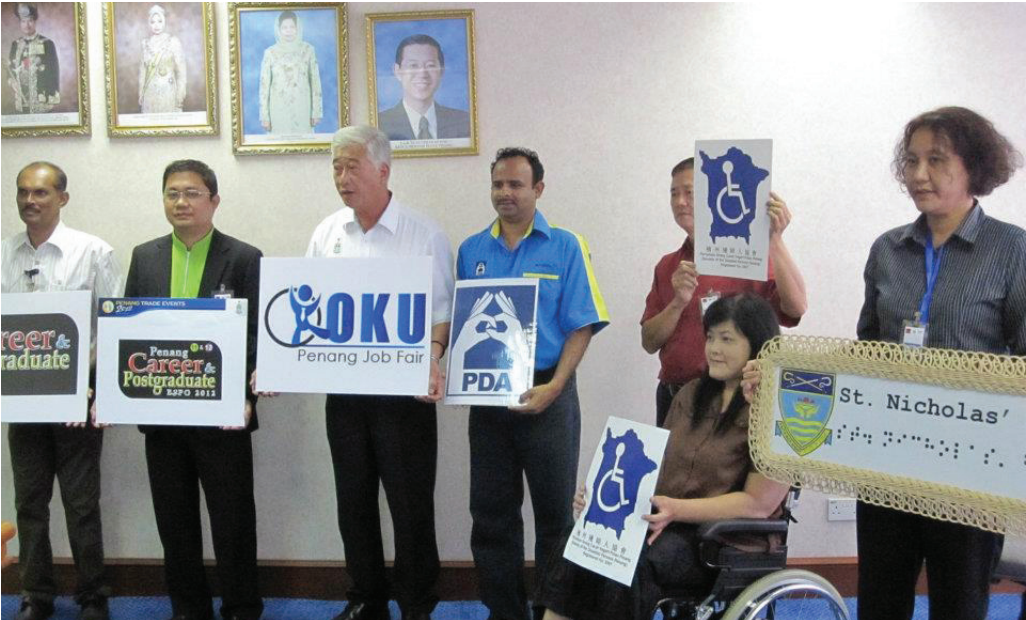
槟州政府非常关注能力差异人士的福利，因此，已向槟州福利局登记的能力差异人士则可在能力差异人士辅助金计划下每年获得100令吉。