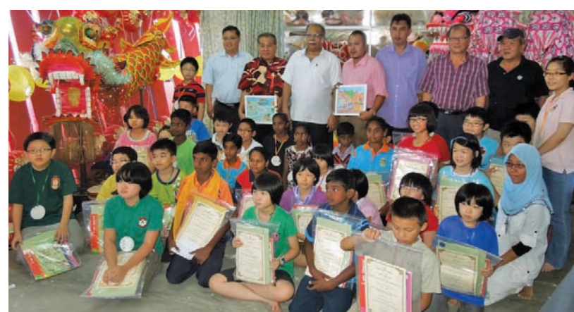
Creative Learning In English Programme on Dec 19, 2012 at Persatuan Sukan dan Kebudayaan Tiong Hua Hall, Kepala Batas.