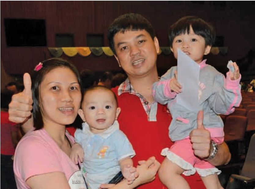
在宝贝计划下，每名刚出生的宝宝都可获得一次性的100令吉辅助金，象征着槟州政府迎接小生命的到来。