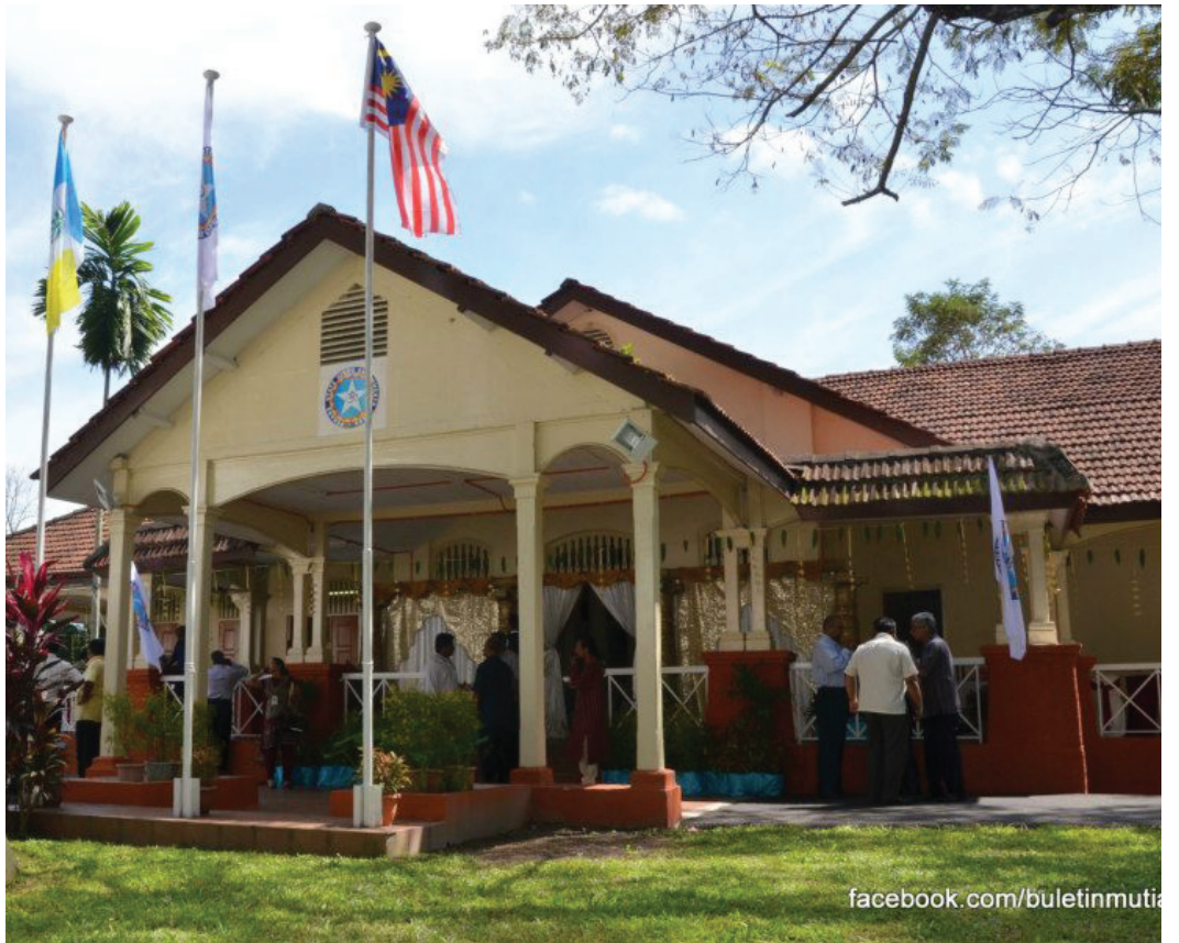
The board's office at Jalan Macalister was officially opened by Lim on Dec 14.

From 2010-2012, a total of RM579,353 was distributed to 456 students who needed help to continue their studies.