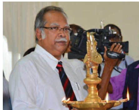
Prof. Ramasamy during the opening of new office of Lembaga Wakaf Hindu.