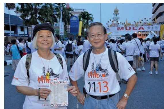
Lam and his wife stay in London but love to have their holidays in Penang.