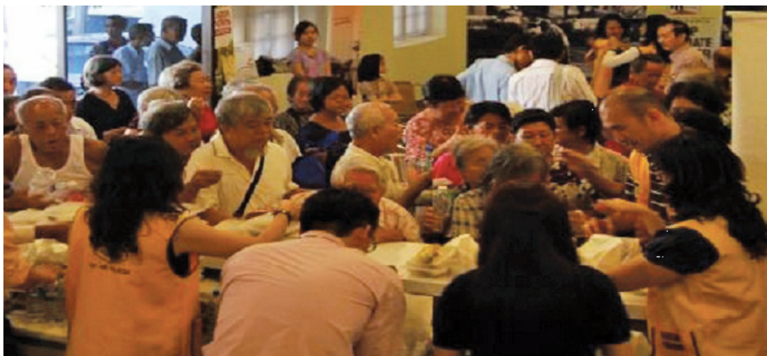
Needy people getting their food from the organisers.