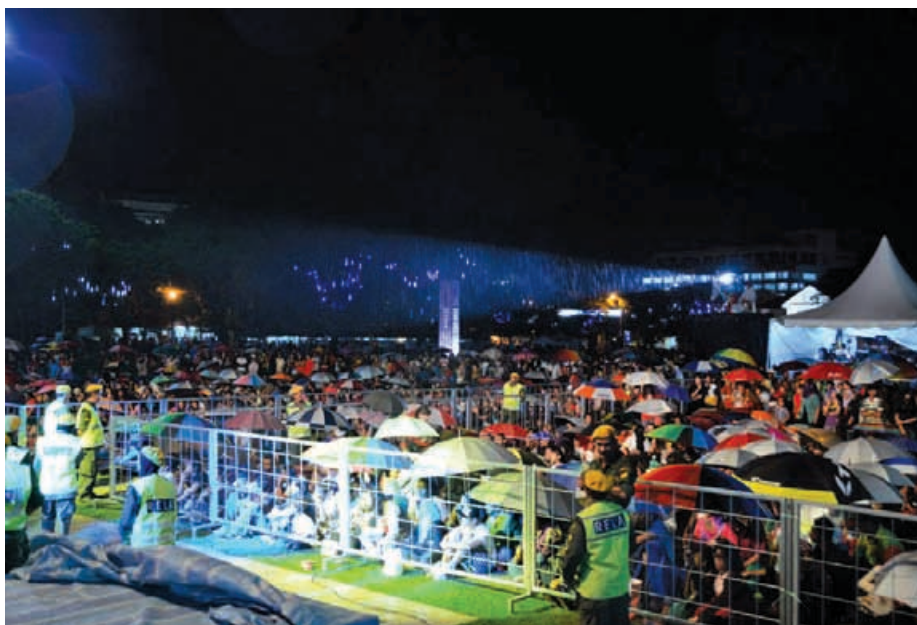
尽管《2013年金碧辉煌倒数庆典》当晚下起雨来，但民众不但没有散去，而是撑起雨伞继续留守，许多民众更是冒雨到场参与庆典。

《2013年金碧辉煌倒数庆典》由CreatiVision联合大马Volkswagen集团、槟岛市政局、天地通亚通电讯公司及SuriaFM电台联办。