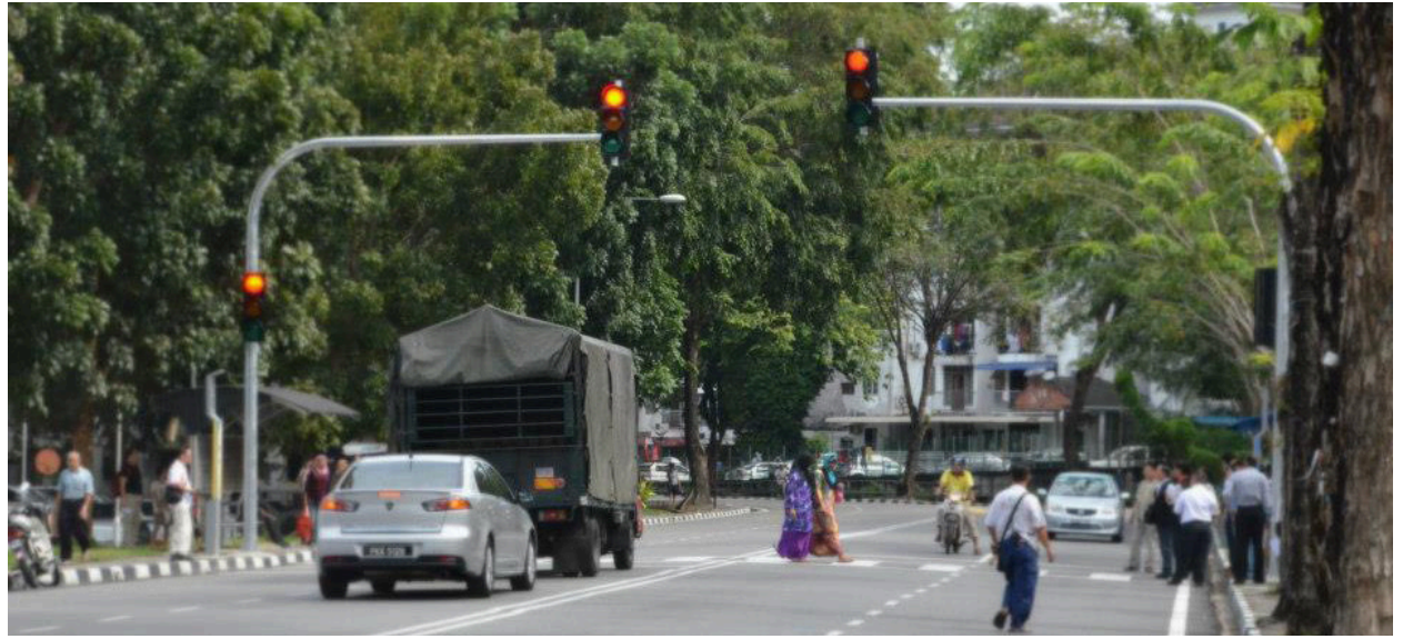
புதிதாய் அமைக்கப்பட்டிருக்கும் போக்குவரத்து விளக்குகளைப் பயன்படுத்தி இரு மலாய்ப் பெண்கள் சாலையைக் கடந்து செல்கிறார்கள்