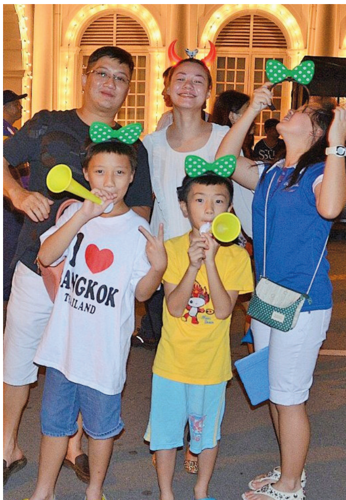
《2013年金碧辉煌倒数庆典》可看到一家大小前来倒数跨年。