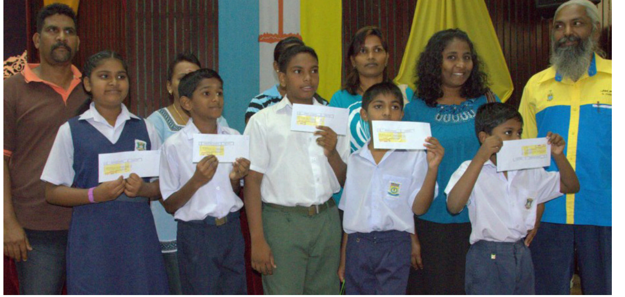
தங்கத் திட்டங்களில் பயன்பெற்ற நம்மவர்களில் சிலர்

வசதி வாய்ப்பற்ற பொருளாதார நலிவுற்ற மக்களுக்கு உதவி புரிவதே மக்கள் கூட்டணி அரசின் தலையாய கொள்கையாக விளங்குகிறது. அதன் பொருட்டே 2010-ஆம் ஆண்டு தொடங்கி மாநில அரசு பல