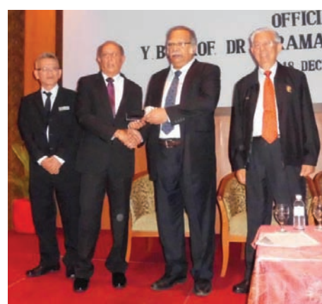
Employment Law Forum, 2012 Penang at Bayview Hotel, Georgetown, Penang on Dec 18, 2012.