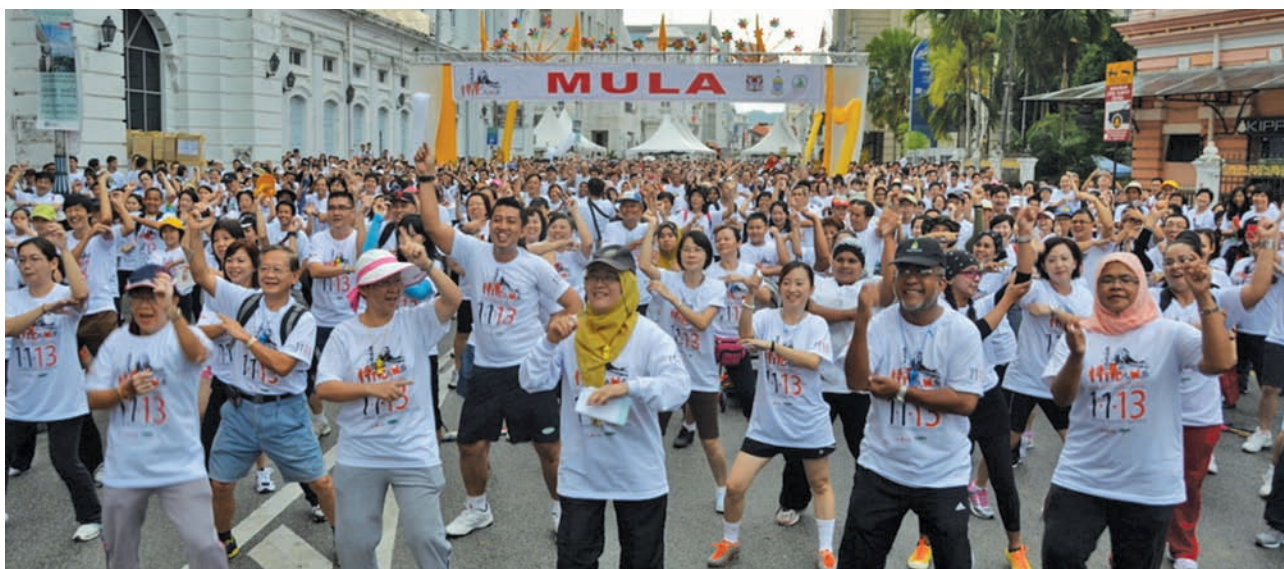
The Penang state exco members and MPPP and MPSP chiefs joining thousands of participants doing the ‘Oppa Gangnam Style’ at the mass aerobics before the walk.

‘The Penang State Government is for the people of Penang’