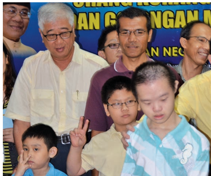
Aid to those who need it will help the state to eradicate poverty this year.

At the same time, construction will begin for the first of 18,000