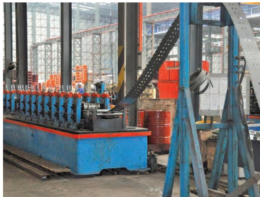
The interior of the BWYS Group factory.

The state government hopes that companies such as BWYS will share its experiences with other local SMEs that could be cash strapped and lack the expertise to expand their business.