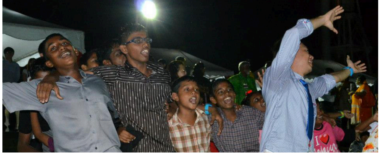
கிறிஸ்துமஸ் கொண்டாட்டத்தை உல்லாசமாகக் கொண்டாடி மகிழும் இந்தியச் சிறுவர்கள்

அன்றிரவு கனத்த மழை பெய்த போதிலும் மக்கள் கூட்டம் ஆயிரக்கணக்கில் வந்து குவிந்து கிறிஸ்துமஸ் கொண்டாட்டத்தை மெருகூட்டினர். இம்மழைக்கு இடையே