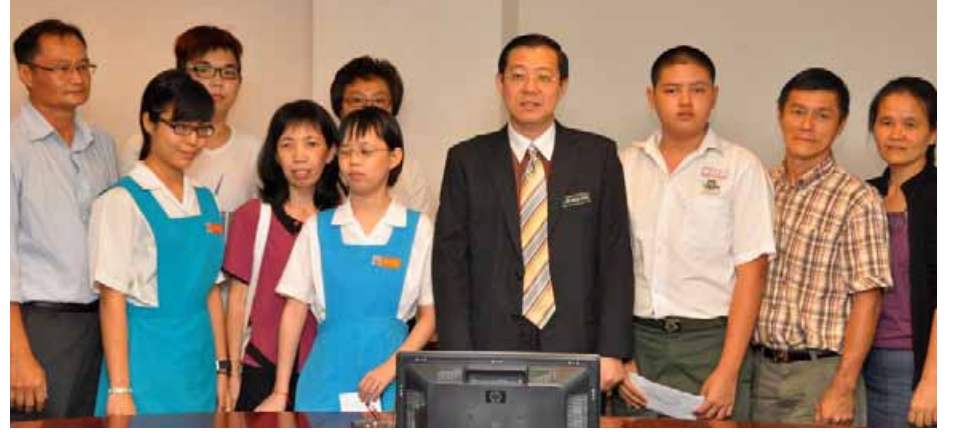
பி.எம்.ஆர் தேர்வில் அனைத்துப் பாடங்களிலும் ஏ பெற்றுச் சாதனை புரிந்த பார்வை குறையுள்ள மாணவர்கள் மற்றும் அவர்களின் பெற்றோர்களுடன் பிணங்கு முதல்வர் மேதகு லிம் குவான் எங் (நடுவில்). முதல்வர் அவர்களுக்குச் சிறப்பு அன்பளிப்பு வழங்கி பாராட்டுத் தெரிவித்தார்.