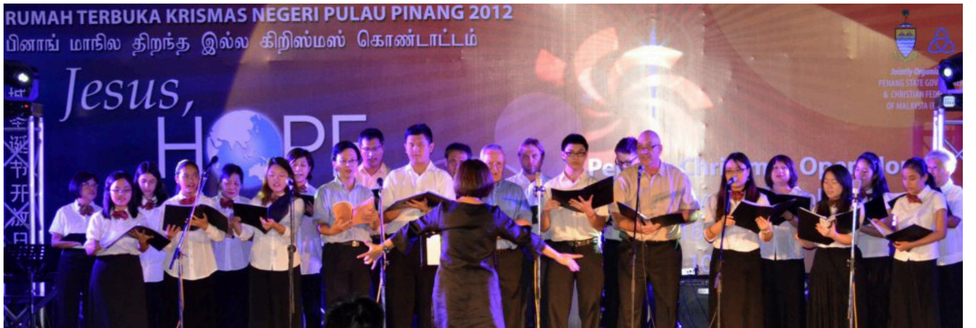
பினாங்கு தேவாலயத்தைச் சேர்ந்த இளைஞர்கள் குழும் பாடலை வழங்குகின்றனர்.