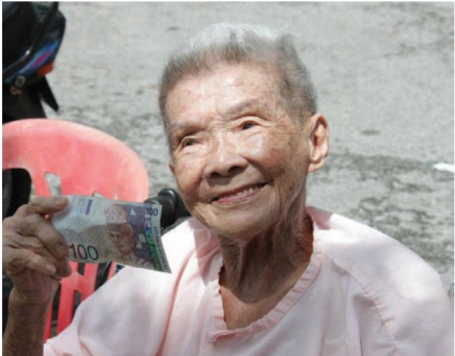
乐龄人士回馈计划是槟民联政府执政槟城后推行的首个利民政策，目前共有36万4330人受惠。