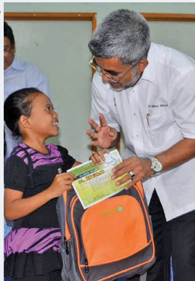
Datuk Abdul Malik Kassim, assemblymember for Batu Maung distributing free a school bag to a little girl who is all full of smiles.