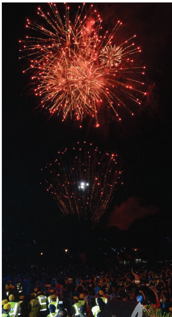
槟州首长林冠英以“世界尚未终结，斗争仍需持续”名句来呼吁民众在新的一年里仍然需要奋斗以创造更美好的未来。

由CreatiVision联合槟岛市政局及多个私人集团举办的《2013年金碧辉煌倒数庆典》吸引了万人挤满旧关仔角草场齐齐倒数跨年，当晚除了有韩流K-POP争霸赛，更邀请了著名演唱嘉宾为跨年庆典演唱。