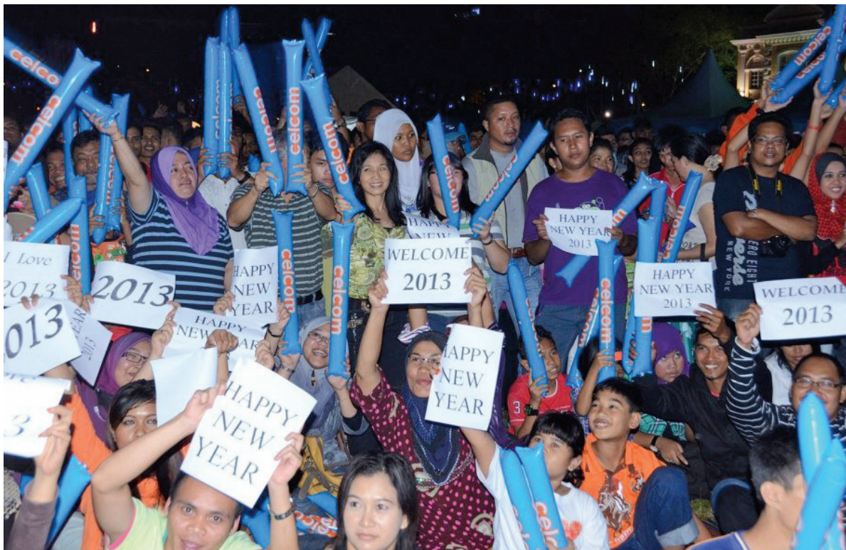
由CreatiVision联合槟岛市政局及多个私人集团举办的《2013年金碧辉煌倒数庆典》吸引了万人挤满旧关仔角草场齐齐倒数跨年。