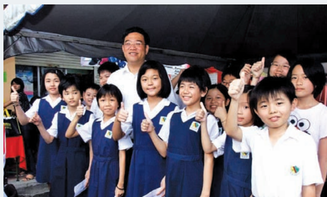
Children in the Air Itam constituency received vouchers from their assemblymember Wong Hon Wai to purchase their 'Back to school' necessities.

Although the gesture is not big, the impact on the children is big because they know that out there, there are adults like these state assemblymembers who care for them.