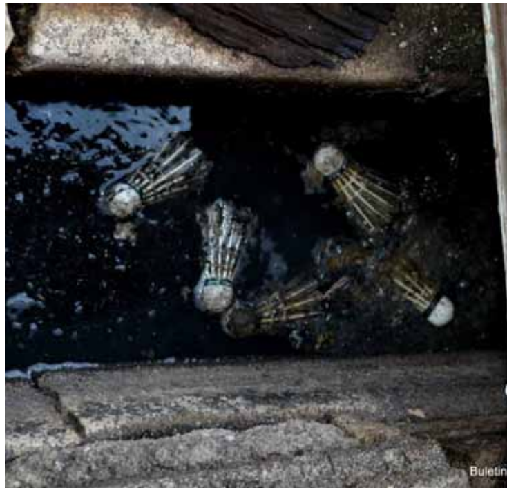
KEADAAN longkang yang tersumbat dengan sampah-sarap.

“Walaupun pihak MPPP datang membersihkan longkang-longkang di sini,