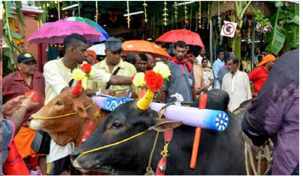
SAMBUTAN penuh tradisi masyarakat berketurunan Hindu pada sambutan Fire Walking di Kuil Kahlee Ama.