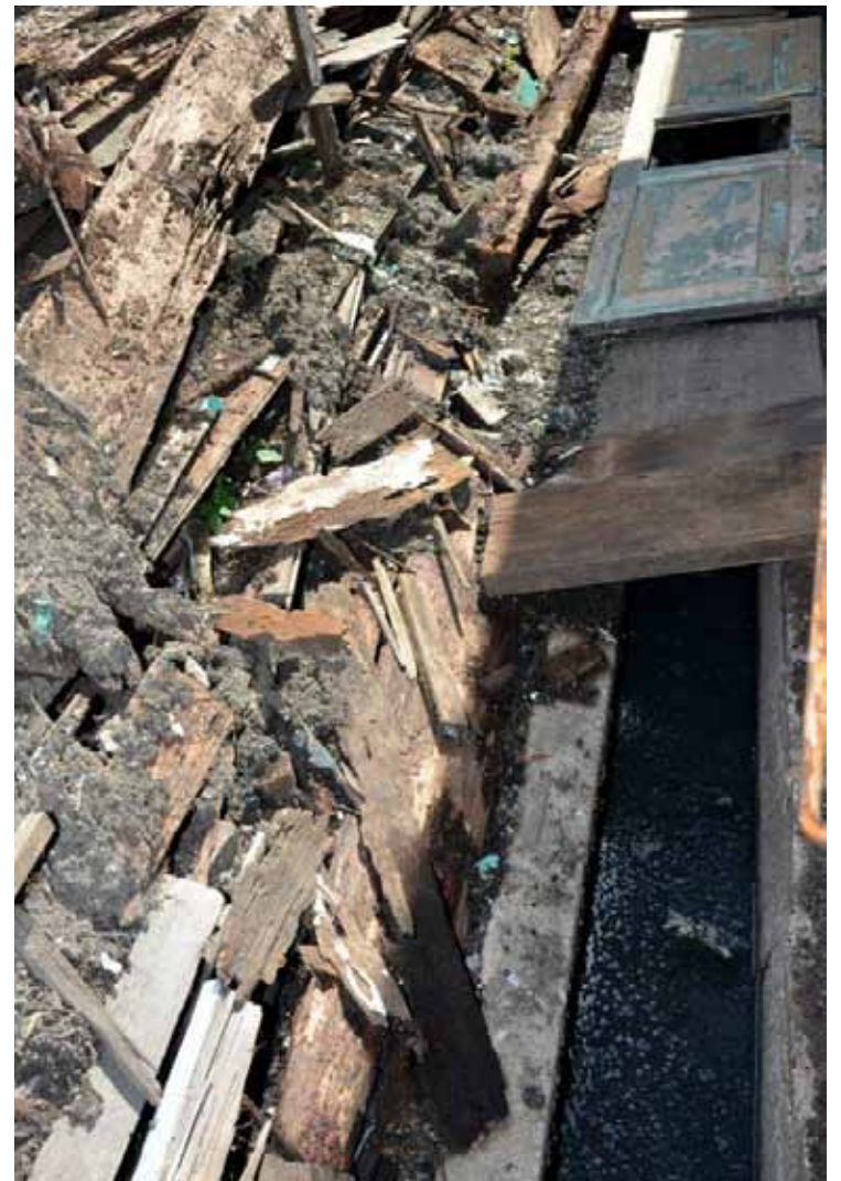
BAHAN -bahan binaan menyebabkan saiz longkang yang kecil menjadi tersumbat di Kampung Pengkalan Weld di sini.

“Saya sendiri akan memantau perkembangan kelulusan projek ini dengan pihak MPPP,” ujarnya.