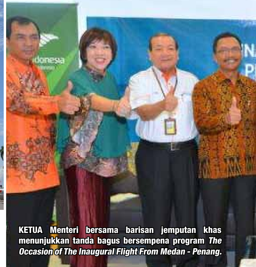
KETUA Menteri bersama barisan jemputan khas menunjukkan tanda bagus bersempena program The Occasion of The Inaugural Flight From Medan - Penang .