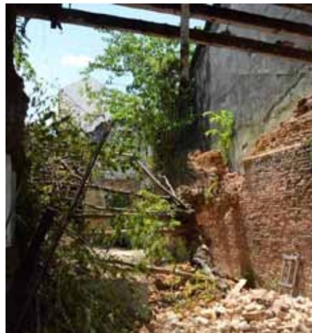
BANGUNAN warisan yang ditumbuhi pokok tumpangan.

“Bandar George Town semakin dikenali dan hartanah di sini sangat bernilai. Daripada dibiarkan usang, tidak dijaga dan roboh begitu sahaja, seeloknya ia