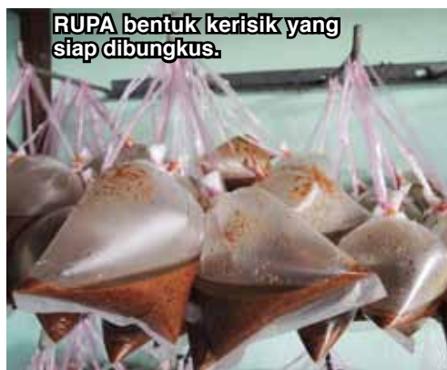
RUPA bentuk kerisik yang siap dibungkus.

Zaliha adalah bermula seawal 7 pagi hingga pukul 1 petang bagi menghasilkan kerisik yang pengeluarannya dijenamakan atas nama arwah ibunya, Asiah.