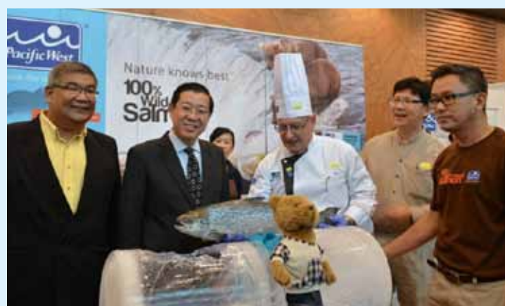
SEORANG chef mengeluarkan ikan dari bongkah ais yang dipecahkan Ketua Menteri sebagai simbolik Majlis Perasmian iFOODex Ke-16 di sini baru-baru ini.