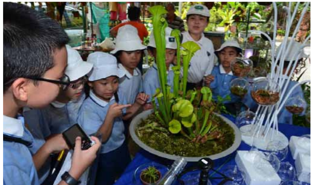
TUMBUHAN unik yang memperoleh perhatian sekumpulan pelajar pada penganjuran Pesta Bunga Pulau Pinang 2013.