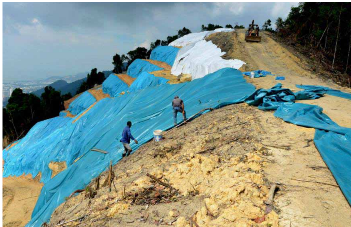
KEADAAN bukit yang ditarah tanpa kebenaran MPPP di Cangkat Bukit Gambir di sini.

Kon Yeow yang juga Ahli Dewan Undangan Negeri (ADUN) Padang Kota berkata, pihaknya telahpun menyerahkan notis pemberhentian operasi serta-merta kepada pihak yang dipercayai sebagai tuan tanah