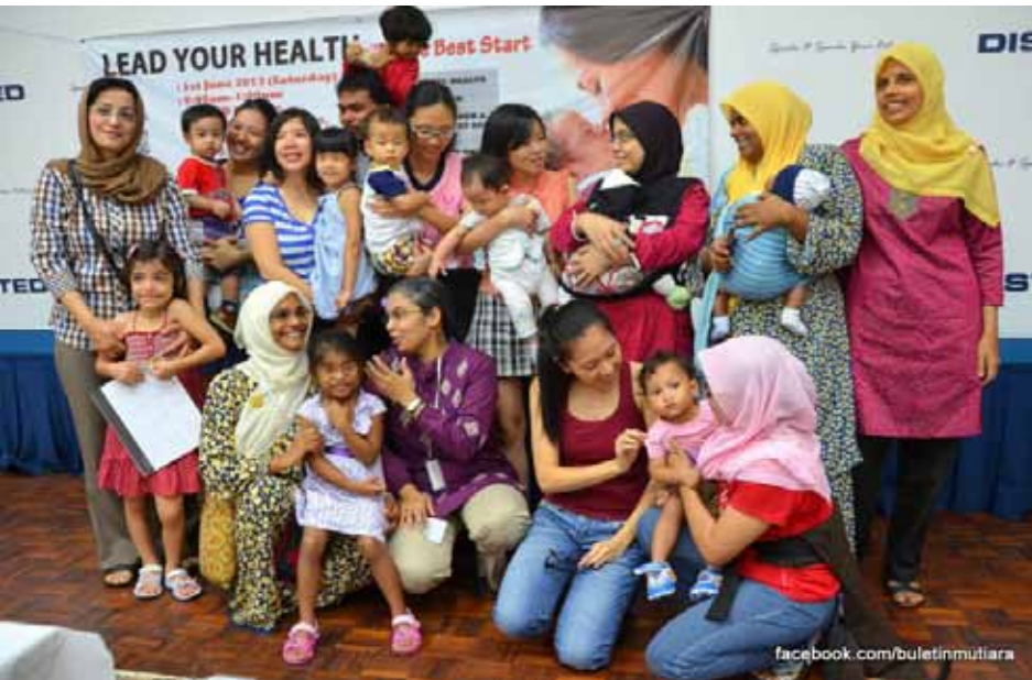
BARISAN penganjur dan peserta meraka mengambarkan kenangan bersempena penganjuran seminar Local NGO Establishes Powerful International Connection .