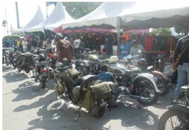
ANTARA motorsikal klasik yang dipamerkan pada Festival Motorsikal Klasik Antarabangsa ke-15 di sini baru-baru ini.

“Selepas itu, JKR sendiri akan menentukan kaedah terbaik yang bakal digunakan bagi menyelesaikan masalah berbangkit kerana mereka (JKR) lebih mempunyai kepakaran dalam hal ini,” ujarnya.