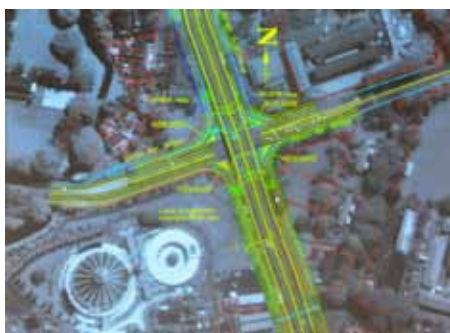
LAKARAN grafik jalan-jalan yang terlibat dalam usaha menaiktaraf di sini.

“Kerja-kerja lain adalah seperti pembersihan,