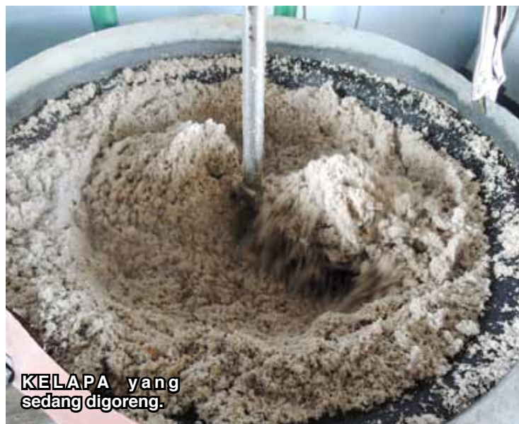
KELAPA yang sedang digoreng.

INFO : ASIAH FOOD ENTERPRISE 1391 MK 4, Kampung Pertama, 13500 Permatang Pauh. Tel. : 04 - 398 7301 / 019 - 428 8312