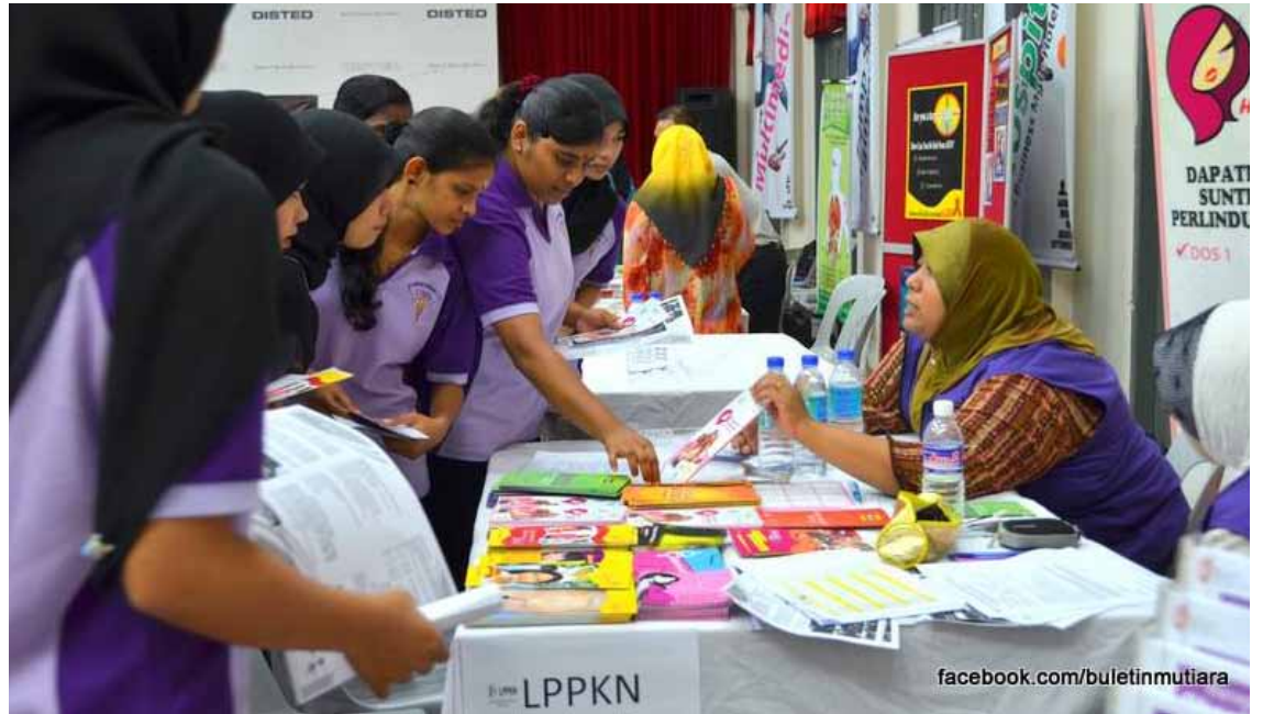
PELAJAR -pelajar Kolej Kejururawatan Pulau Pinang mendapatkan risalah-risalah kesihatan bersempena penganjuran Forum Lead Your Health With The Best Start di sini baru-baru ini.

seperti kesihatan mata, oral dan tekanan darah turut dijalankan secara percuma selain ceramah oleh doktor pakar mengenai kesihatan.