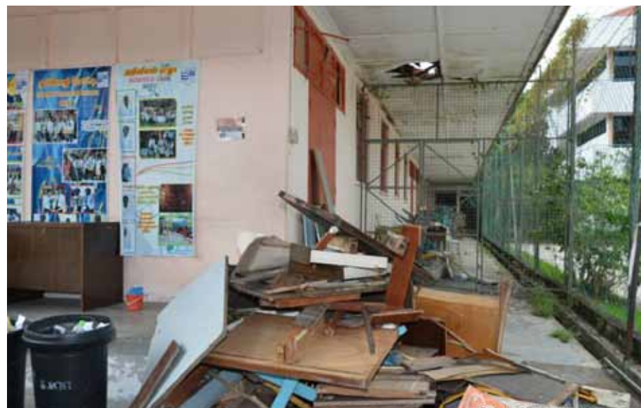
KEADAAN bumbung dan bangunan sekolah yang mengalami kerosakan dan mampu mendatangkan bahaya kepada pelajar.

“Tujuannya adalah untuk ‘mengingatkan’ kembali tentang pembinaan yang telah dijanjikan.