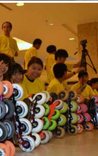
SEBAHAGIAN peserta yang mengambil bahagian dalam pertandingan Malaysia Shalom Series - Penang International Freestyle Skating Championship 2013.