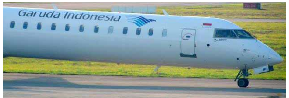
PESAWAT Garuda Indonesia yang memulakan semula operasi penerbangan dua kali sehari Pulau Pinang - Medan.

juga bakal memberi saingan kepada syarikat-syarikat sedia ada seperti Air Asia , Firefly , Sriwijaya dan Wings Air .