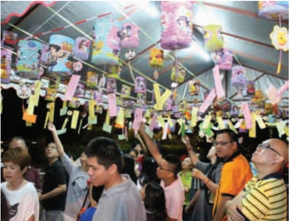
民众在双溪槟榔区主办的中秋节晚上猜灯谜乐。