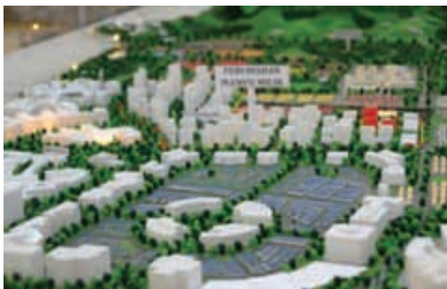
位于公巴的可负担房屋计划由将建立在由州政府拨出的10.4英亩土地上，计划有两栋高楼，第一栋有348单位，每单位850平方尺，26层包括1层商业设施，3层室内停车场；第二栋为346单位，每单位700平方尺，25层包括2层室内停车场。

他补充，一般较为小型的房屋计划都只需耗时3至5年，而较大城市型的就必须至少10年以上。