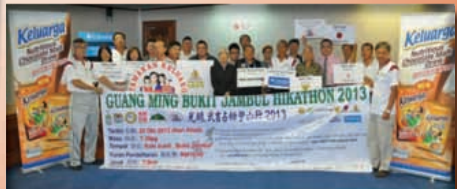
புக்கிட் ஜாம்புல் 'ஹிக்காதுன்' போட்டிப் பதாகையை ஏற்பாட்டுக் குழுவினர் காண்பிக்கின்றனர்.