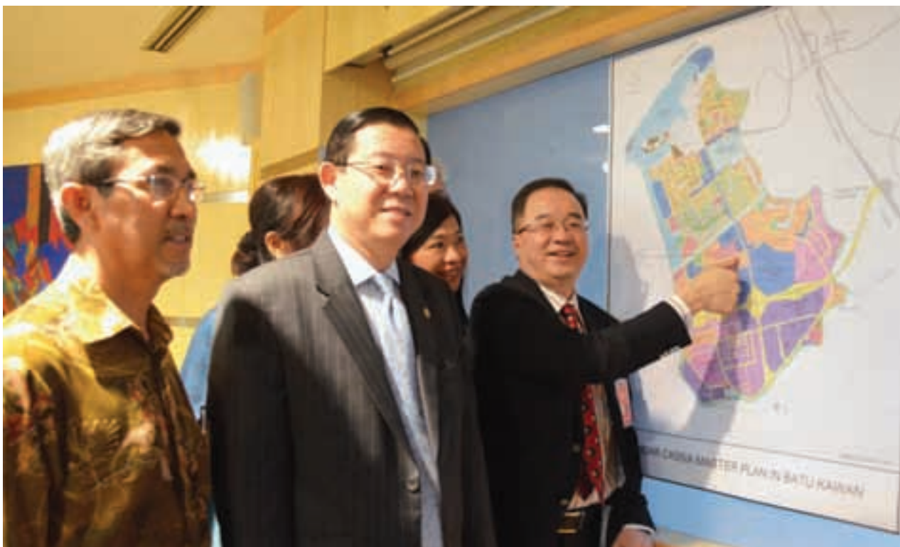
百乐园首席执行官拿督张昌炯（右）向槟州首长林冠英（中）及槟州第一副首长拿督莫哈末拉昔讲解马来西亚伯乐大学学院在峇都加湾的所在地。