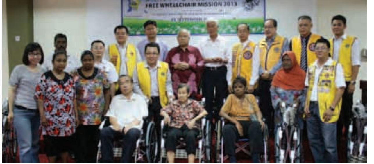
இலவச சக்கர நாற்காலி பெற்றோருடன் பிளாங்கு ஆளுநர் மற்றும் சட்டமன்ற உறுப்பினர்கள்.

இந்நிகழ்வின் முக்கிய நோக்கமானது ஏழை மற்றும் உடல் ஊனமுற்றோருக்கு உதவி கரம் நீட்டுவதாகும். இந்த உதவியை மொழி, பால் பாராமல் பிளாங்கு வாழ் குடிமக்களுக்குச் சரிசமமாக அளித்தனர். இலவச சக்கர நாற்காலி உடல் ஊனமுற்ற அனைத்து பள்ளிக்கூடம் செல்லும் சிறுவர்கள், வேலைக்குச் செல்லும் இளையோர்கள் மற்றும் மூத்த குடிமக்கள் என அனைவருக்கும் இலவசமாக வழங்குவதை கனவாக கொண்டுள்ளதாக ஏற்பாட்டுக் குழுவின் தெரிவித்தனர். இதன் மூலம், இவர்கள் மற்றவர்களைப் போல் இயல்பான வாழ்க்கையினை வாழ வித்திடுகிறது. இத்தொண்டைத் தொடர்ந்து ஒவ்வொரு ஆண்டும் வழங்கவிருப்பதாக மேலும் கூறினர்.