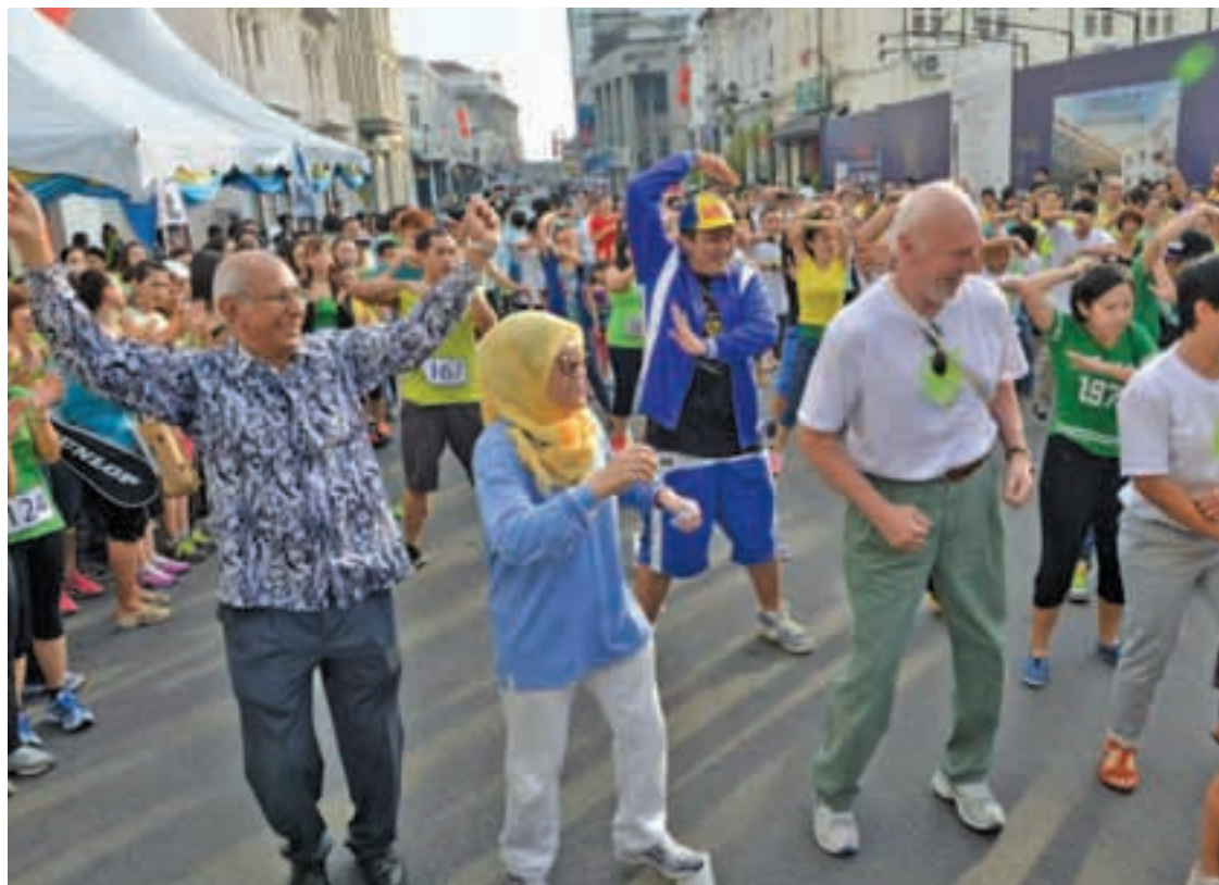
艾力布里顿（中）在槟岛市政局主席拿督芭达雅（左2）及叶舒惠（左）陪同下，出席「世界无车日」活动。

槟城要成为一座怎样的城市，选择权在市民手中；「无车日之父」艾力布里顿促请槟城子民以“无车日”概念作为出发点，勾勒槟城的未来面貌。