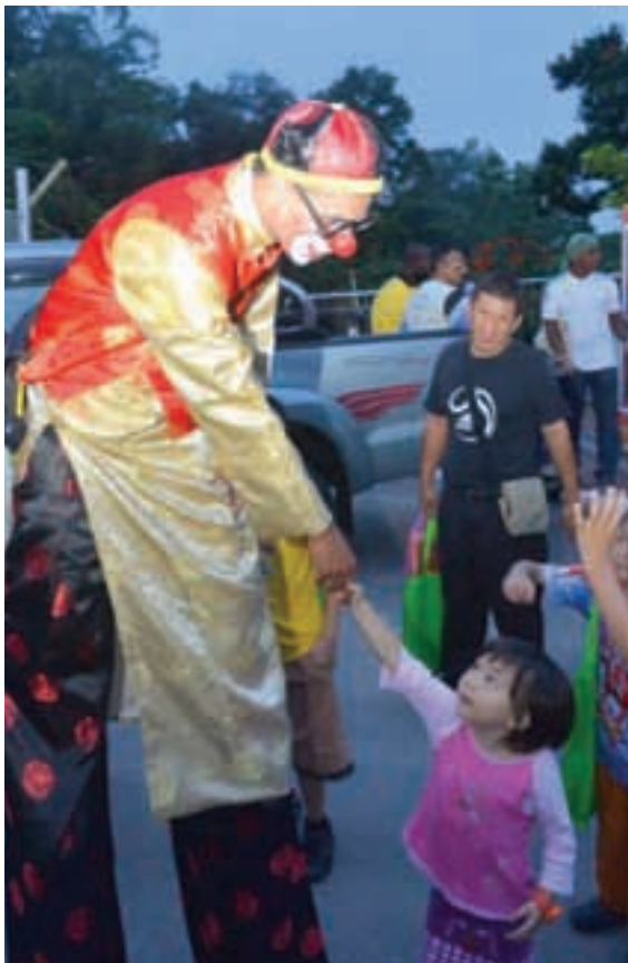
由檳城升旗山机构主办的中秋节庆典，在活动上出现的高跷人逗乐小孩。