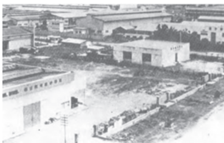
20世纪60年代，华人制造业在威省北海麦曼珍工业区逐步发展起来。

然而，在1969年513种族冲突事件发生后，政府实施“新经济政策”。这项政策主要通过实施扶助马来人及马来人优先的措施，以及政府直接参与经济的措施，如成立国营公司，收购英资公司等，来达到重组社会结构和消除贫穷的目的。由于政策有利于马来商人经济的扩张，华商经济的发展直接受到影响，打击了他们在国