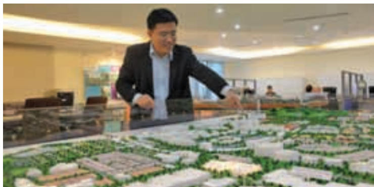
Wong explaining to members of the media the township in Batu Kawan.

"Now, we want to go back to construction of affordable homes for the people. With this project in Teluk Kumbar, affordable homes in Jalan SP Chelliah and the huge township in Batu Kawan, PDC is going in the right direction," Wong said.