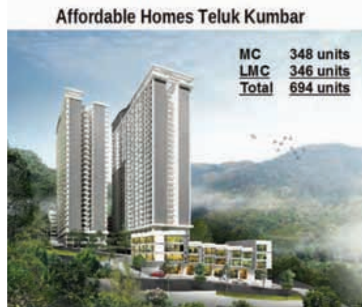
An artist's impression of the two blocks of medium-cost and low-medium cost homes in Teluk Kumbar.