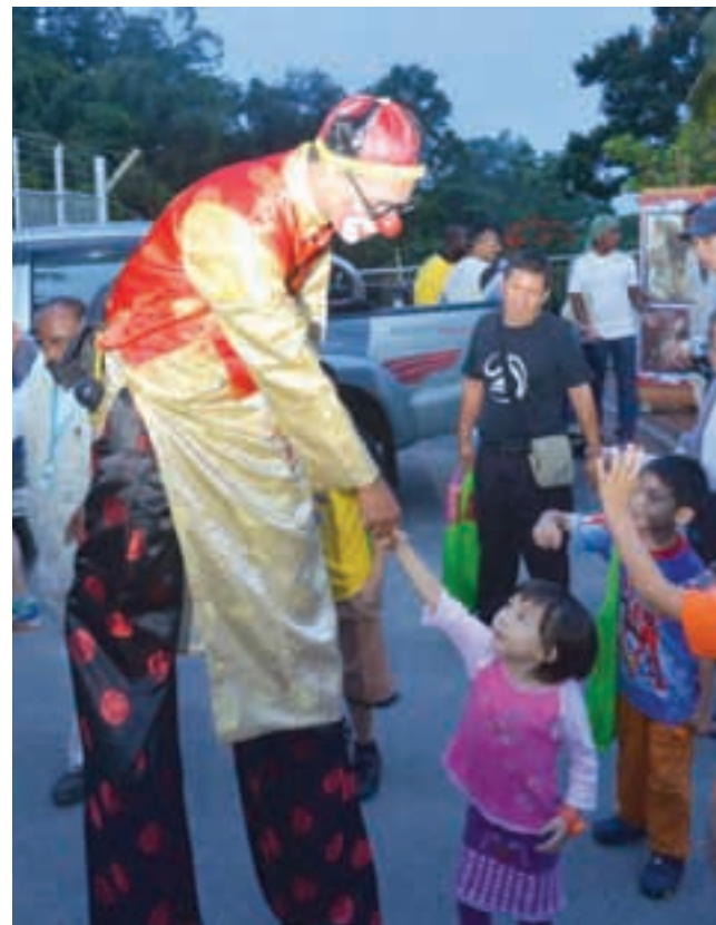
A little girl is amused by the clown dressed in traditional Chinese costume.

The night ended with taekwondo, Indian dance and line dancing performances.