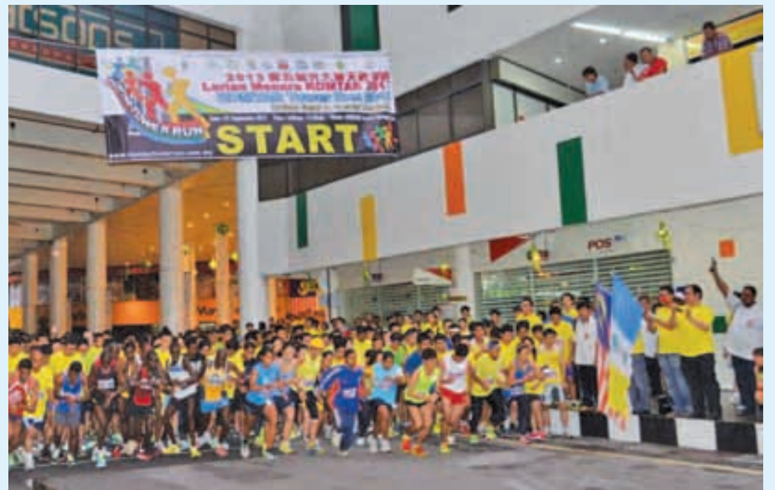
Ng (second right) flagging off the Komtar Tower Run 2013.

upcoming Penang Bridge International Marathon in November," she commented.