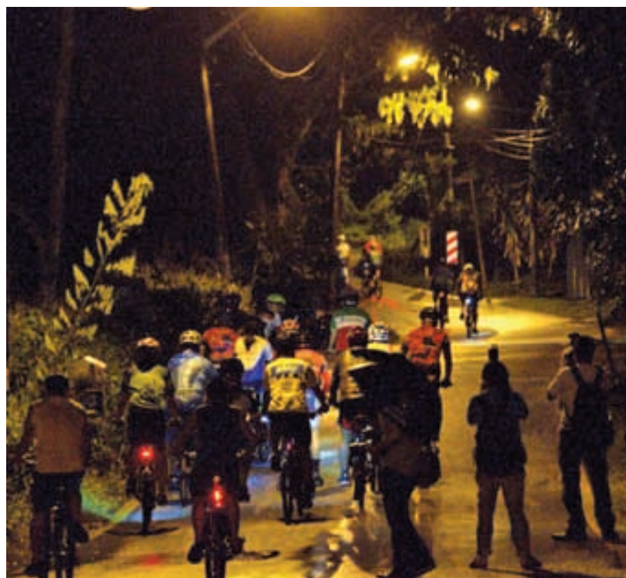
Cyclists riding up Air Itam Dam after the streetlights costing RM185,700 were launched for their safety.

Also present at the event was Member of Parliament for Bukit Bendera, Zairil Khir Johari.