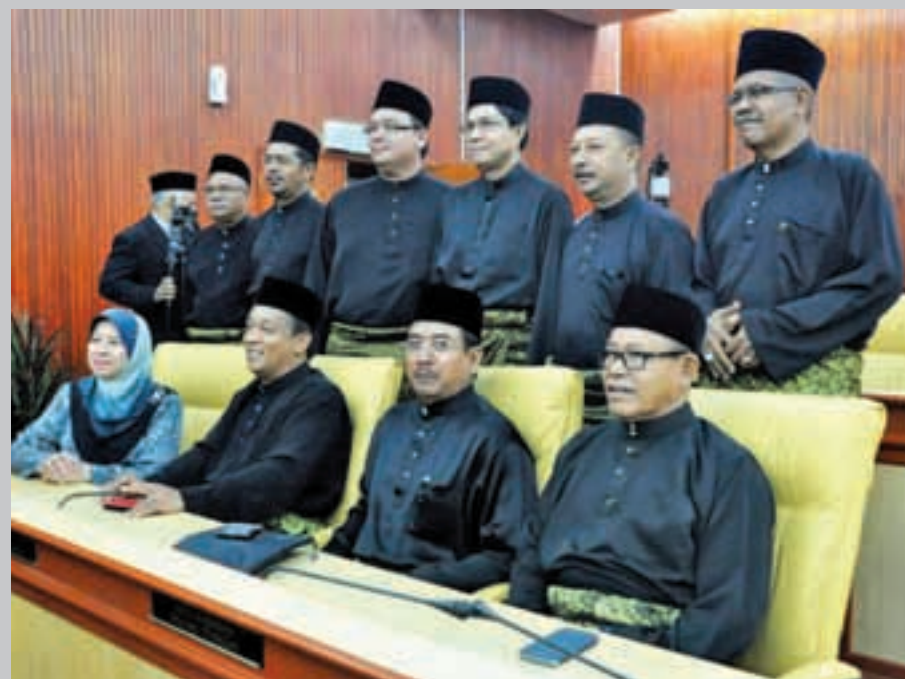
A file pic of the state assemblymembers from UMNO in the Penang State Legislative Building during the swearing-in ceremony in June this year.