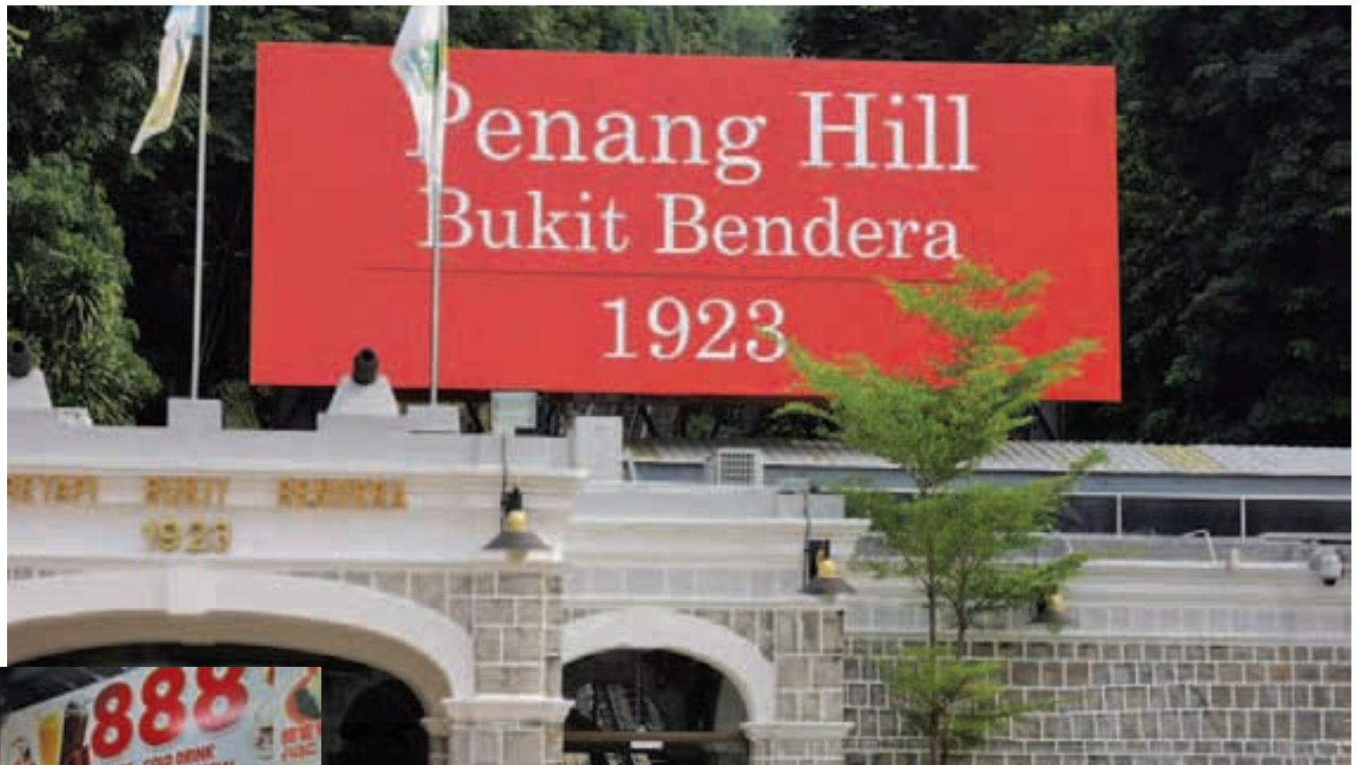
Penang Hill is truly on the way to becoming one of Malaysia's leading tourist attractions.

Gone are the days of the long train ride to the summit without the pres-