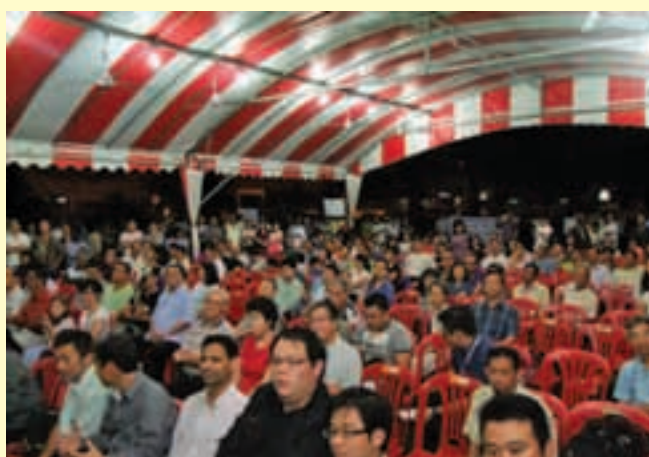
超过500名民众出席对话会，民众也向市政局提出了对改善改道计划的26项建议。

曹观友表示，在聆听民众所面对问题后，市政局与市政局工程师将把所有意见带回仔细探讨，并且从中检讨及改善改道计划。