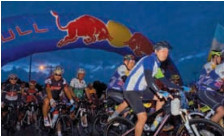
Part of the 3,200 cyclists who are campaigning for a bicycle lane.

Both events were officiated by Chief Minister Lim Guan Eng who's always shown his support for a healthy and clean lifestyle.