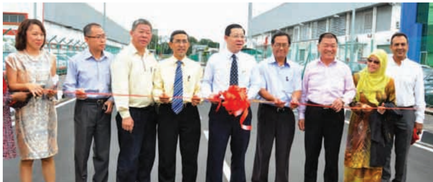
Managers from various companies in the Prai Industrial Park giving the new road access a big thumbs up with Lim (5th from right).

Chief Minister Lim Guan Eng was present to officiate the opening of the road access on Sept 9 and explained that the newly-constructed road will have direct entry into Bandar Seberang Jaya and the Penang Bridge and that not only