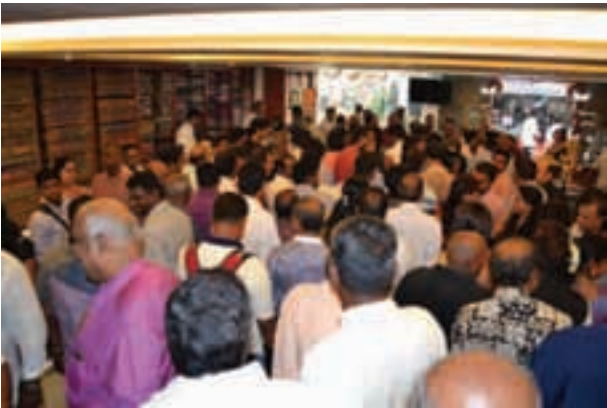
அலையெனத் திரண்ட பொது மக்களின் கூட்டம்