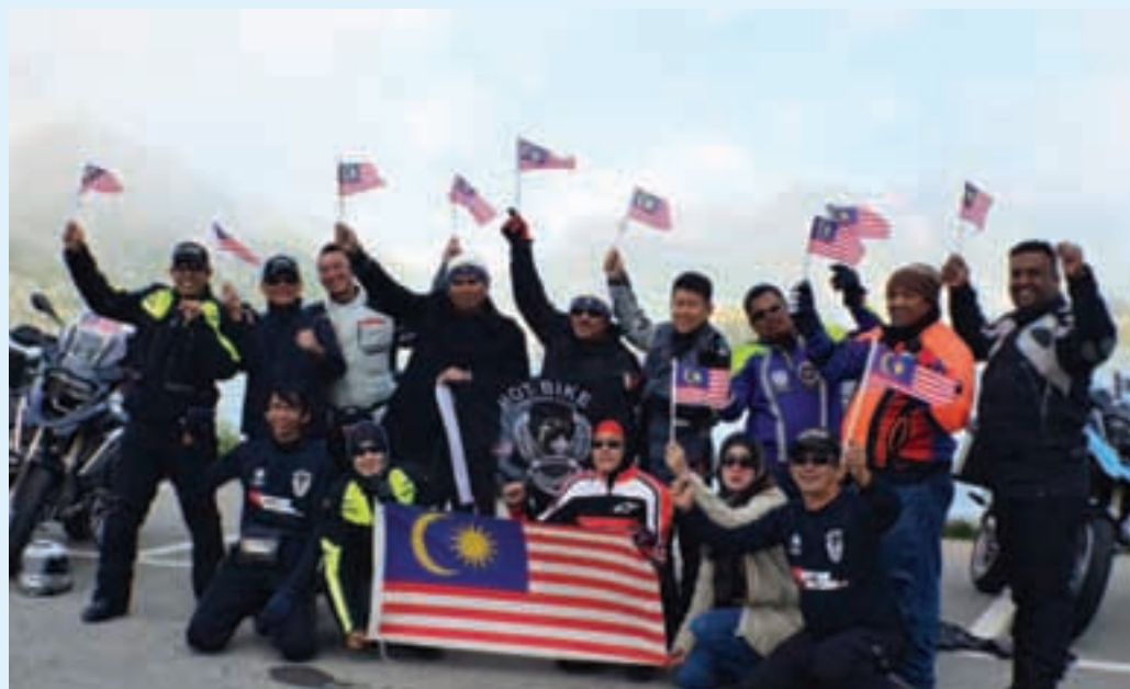
Members of Hot Bike coming together for a group photograph at the foot of the Swiss Alps.

They flew back from Italy to Kuala Lumpur on Sept 13.