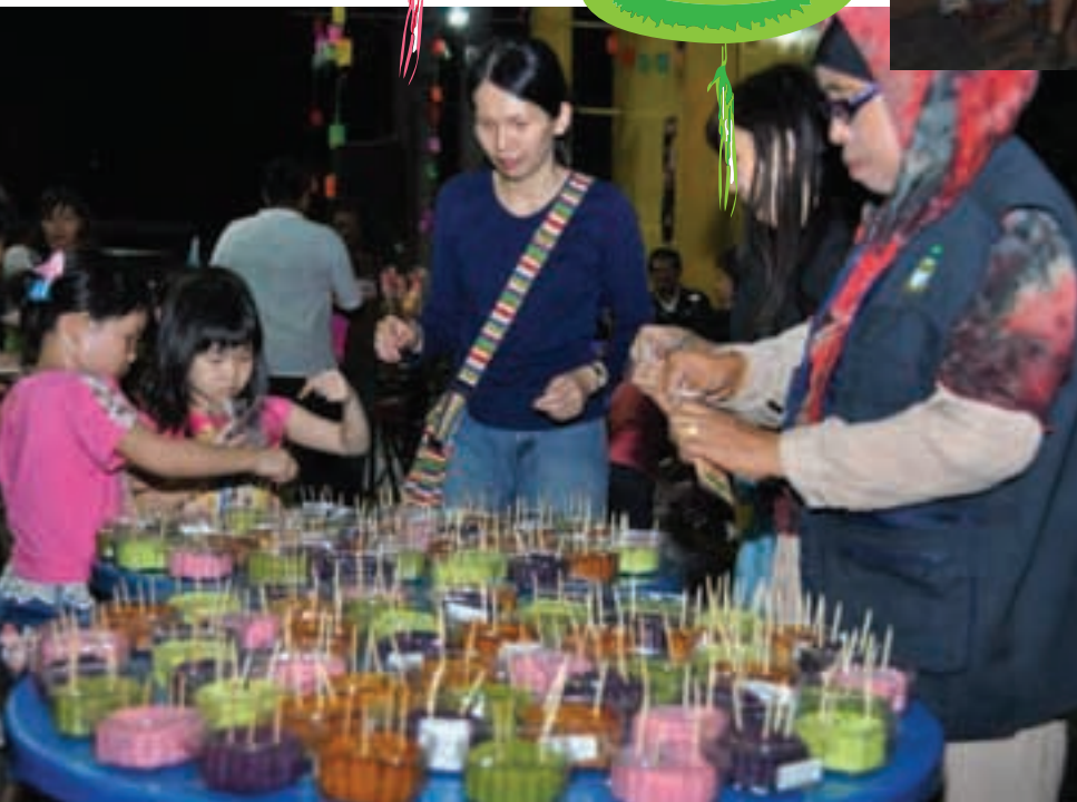
多种口味的中秋月饼，供民众品尝。