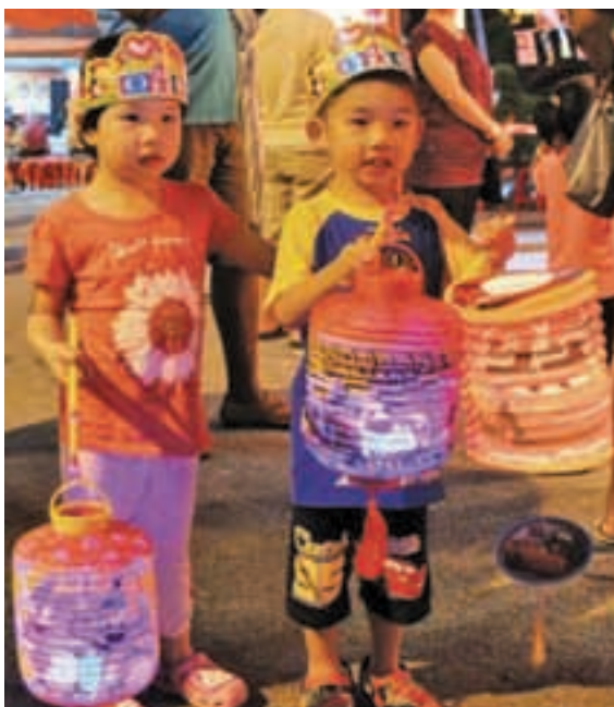
提灯笼游行，似乎是小孩在中秋节不可或缺的活动之一。