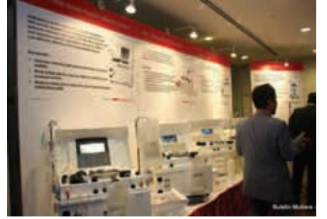
அமெனிடிக் நிறுவனத் தயாரிப்பில் மருத்துவ சாதனங்கள்

இந்நிகழ்வைத் தொடர்ந்து இகோதோரியல் தங்கும் விடுதியில் நடைபெற்ற விருந்து உபசரிப்பில் கலந்து கொண்டு மாநில முதல்வர் வரவேற்புரையாற்றினார்.