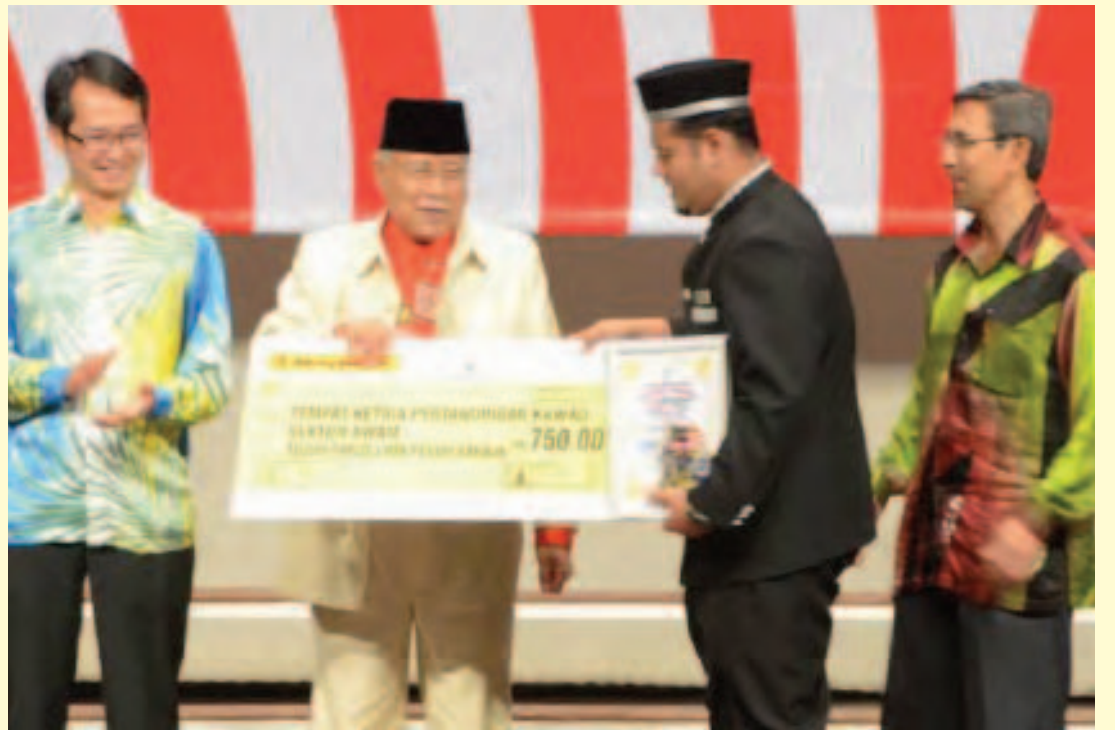
மாநில ஆளுநர் அணிவகுப்பில் முன்றாவது நிலையில் வெற்றிப் பெற்ற பொது துறையினருக்கு மாதிரி காசோலை வழங்கினார்.