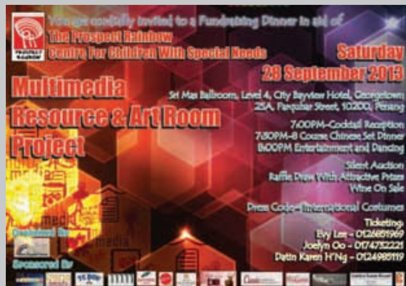
The poster for Prospect Rainbow’s fundraiser dinner.

For more information regarding fundraiser tickets or Prospect Rainbow, visit http://prospectrainbow.com/ or send an email to Prosbow@hotmail.com .