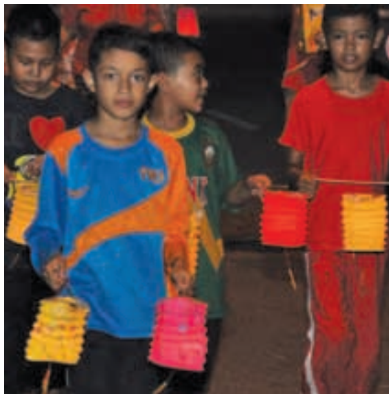
马来同胞小孩也来参与提灯游行。