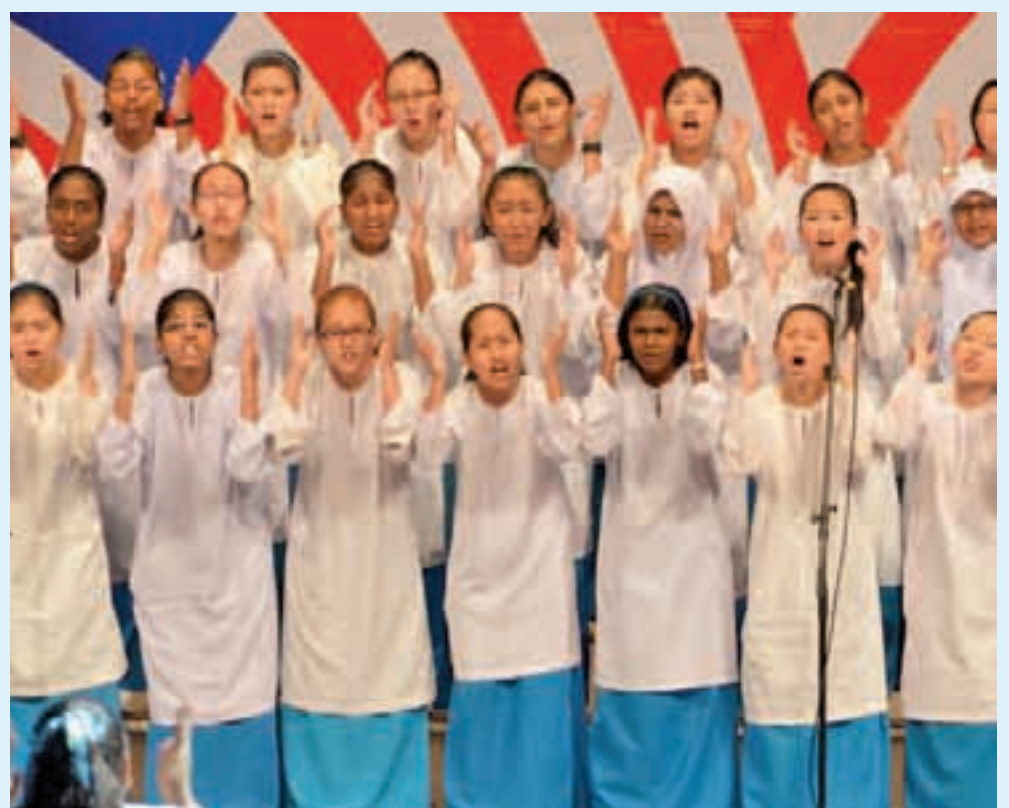
This vibrant performance by the CLS girls caught the attention of the guests.

Among dignitaries at the event was Governor Tun Abdul Rahman Abbas who gave away the prizes to winners of the marchpast competition.