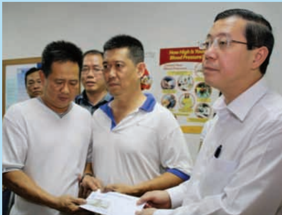
槟州首长林冠英（右）探望遭匪徒致伤的浮罗山背榴梿园老园主妻子，并移交2000令吉抚恤金给其家属。