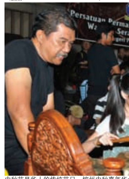
中秋节是华人的传统节日，槟州中秋嘉年华除了能够参与各族间的传统节日之余，也