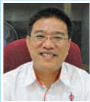
黄汉伟 亚依淡区州议员

我以政治人的身份告诉媒体，我是博物馆里唯一的政治人物但我让画廊委员会天马行空的定题，而从来干涉题目，谁得奖，或那一副画可不可在