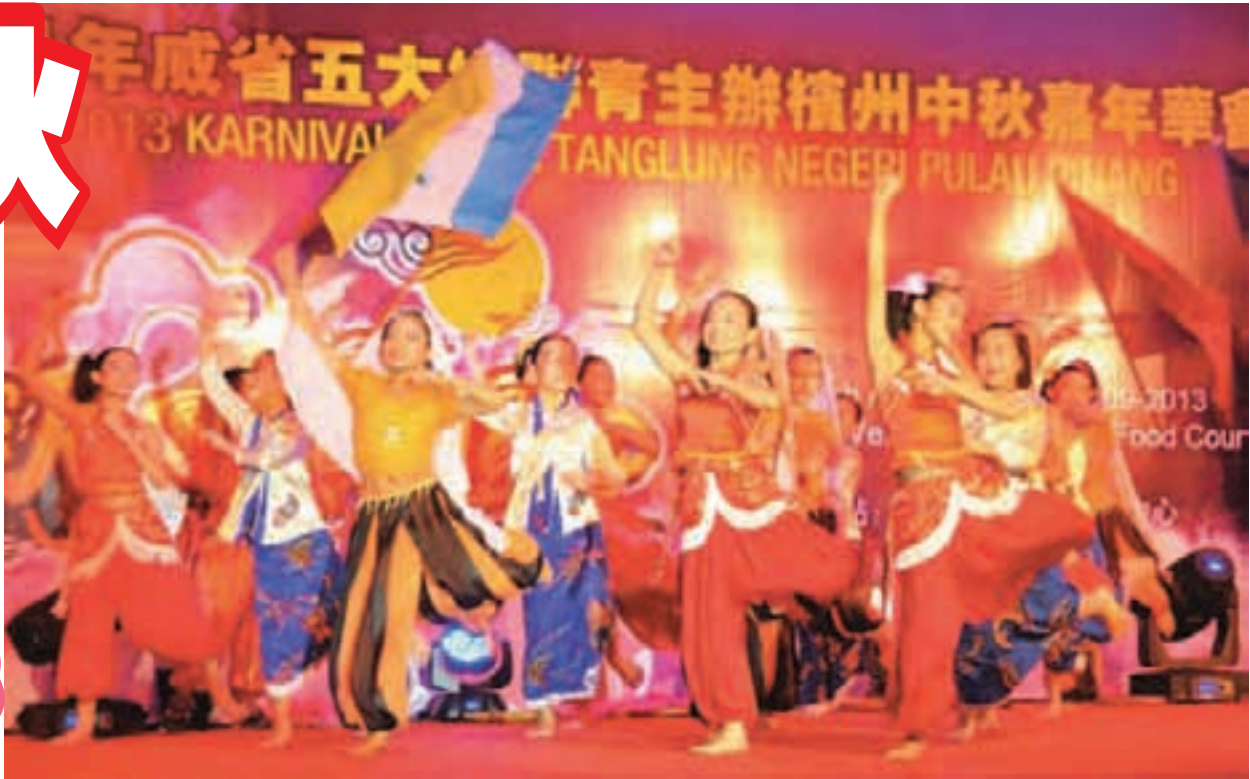
槟州中秋嘉年华会上的精彩各族舞蹈表演。