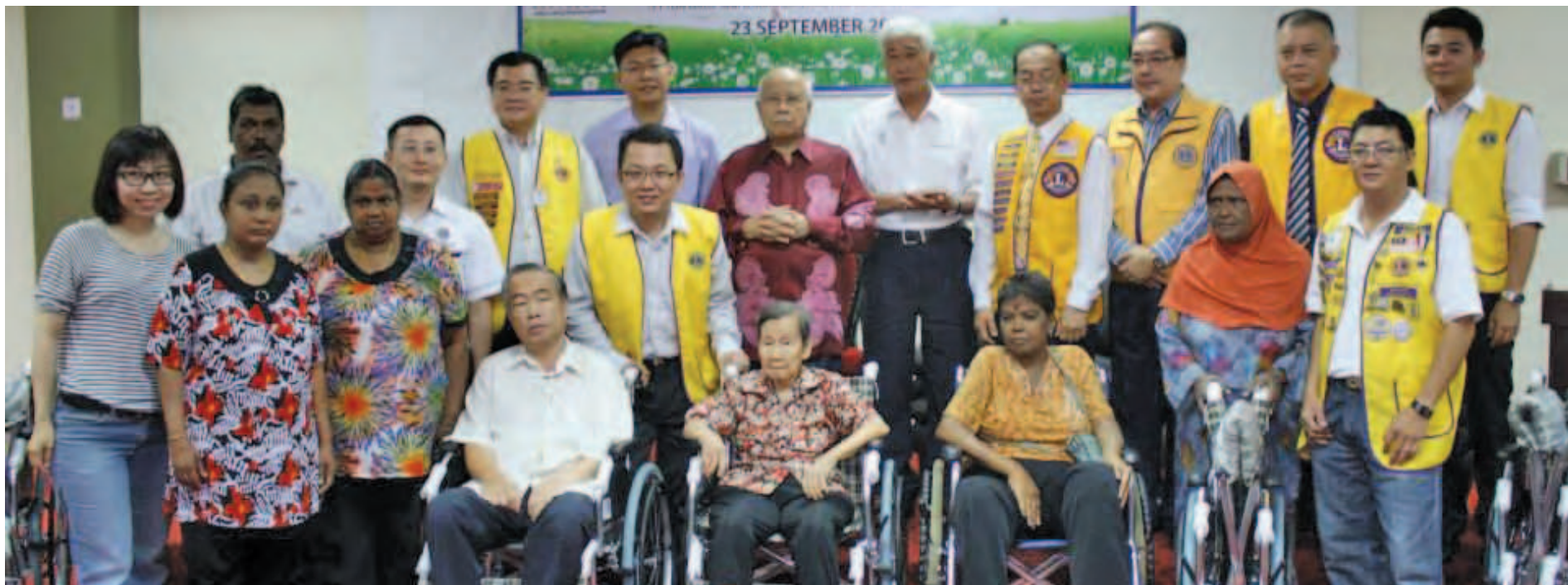
槟州元首敦阿都拉曼阿巴斯（后排中）及彭文宝（右5）等人移交轮椅给需要轮椅的人士。

槟州福利、爱心社会及环境委员会主席彭文宝行政议员指出，槟州政府将依照联邦政府的规定，明年把赤贫家庭的收入提高至830令吉。