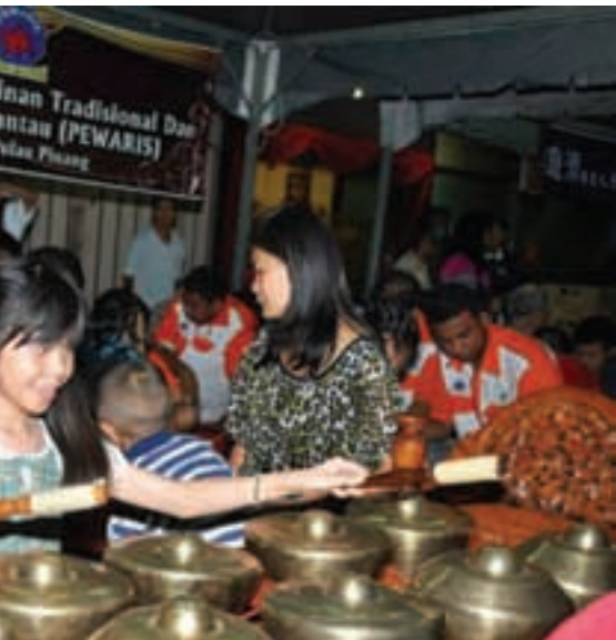
会主办单位也准备马来同胞的传统音乐器具展览，让各族同让彼此学习及认识不同的传统文化。