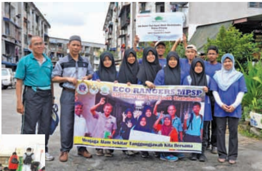
The line-up of advisers and student members of the SMK STSSS Eco Rangers holding up their banner.

In light of this, a few other initiatives