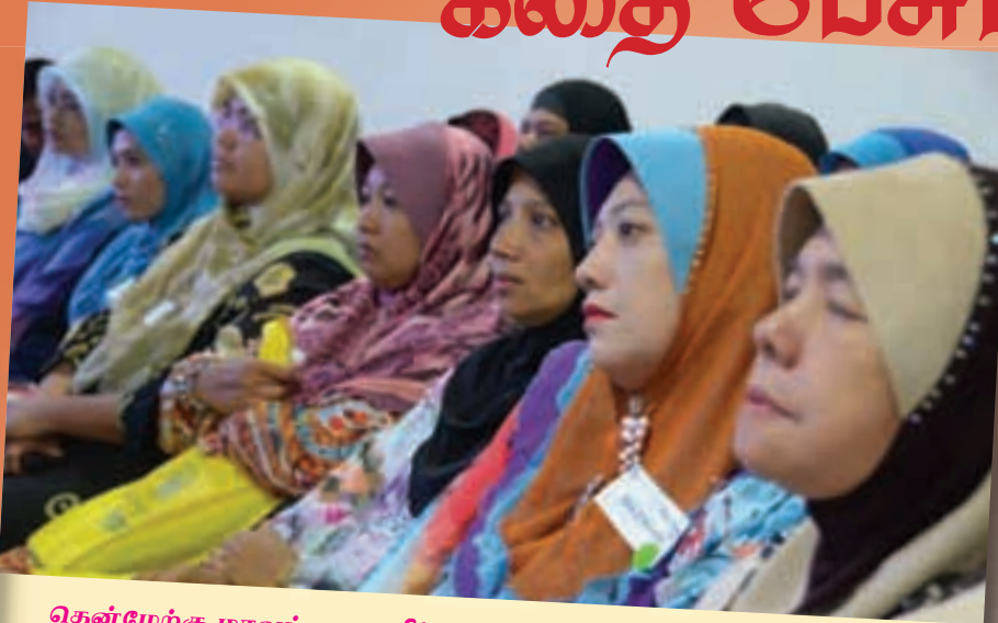
தென்மேற்கு மாவட்ட மகளிர் படைத் துண்டல் பயிற்சியில் கலந்து கொண்ட பொது மக்கள்