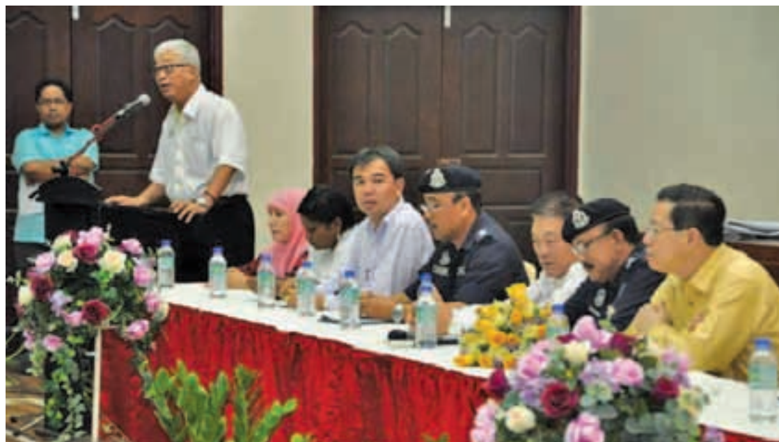
File photo of a recent dialogue with the police held in Sungai Bakap in August where the people get to meet the police for a dialogue session.

"These meetings serve a useful joint anti-crime effort that has succeeded in making Penang one of the safest cities in Malaysia with the highest reduction in crime index for five years consecutively since