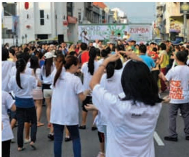
「无车日之父」艾力布里顿认为，槟城要成为一座怎样的城市，选择权在市民手中。