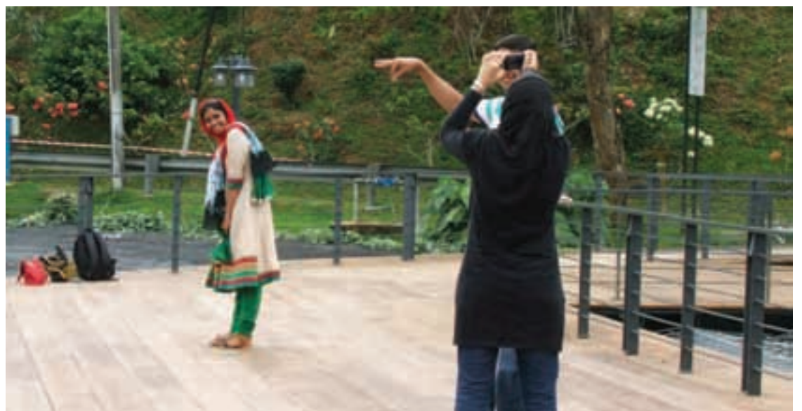
Tourists taking shots at the viewing deck.