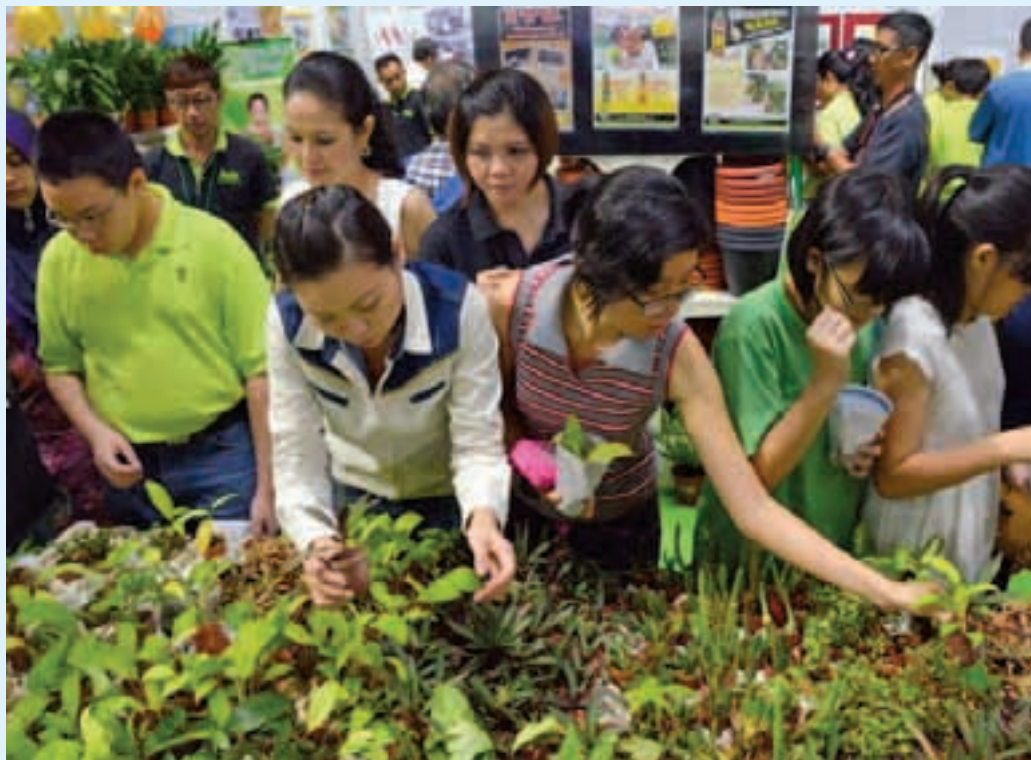
Visitors were given free saplings to take home from Sunshine Garden.

Meanwhile, Lim urged Penangites to conserve water as the state per capita consumption has reached 302 l/c/d compared to the national average of 210 l/c/d. "I will penalise those who waste water by hiking the water conservation surcharge," said Lim.