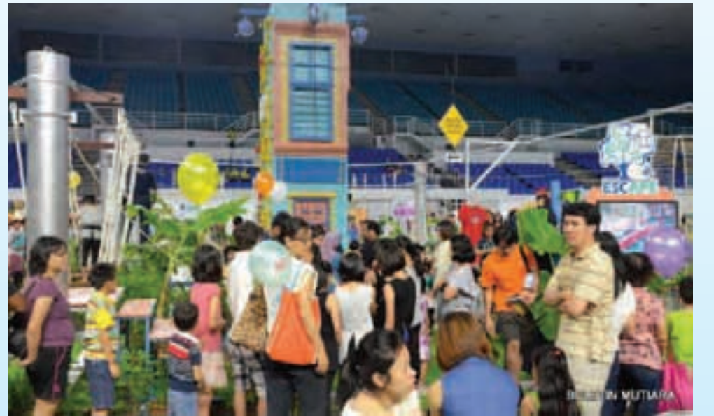
படம்: பிளாங்கு பசுமை கண்காட்சியில் திரண்ட மக்கள் கூட்டம்.