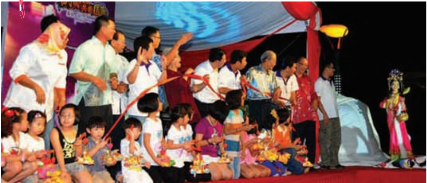
槟州中秋嘉年华会主办单位准备了惊喜，那就是在嘉宾剪彩后，嫦娥出现在打开的大气球内，让在场者眼前一亮。