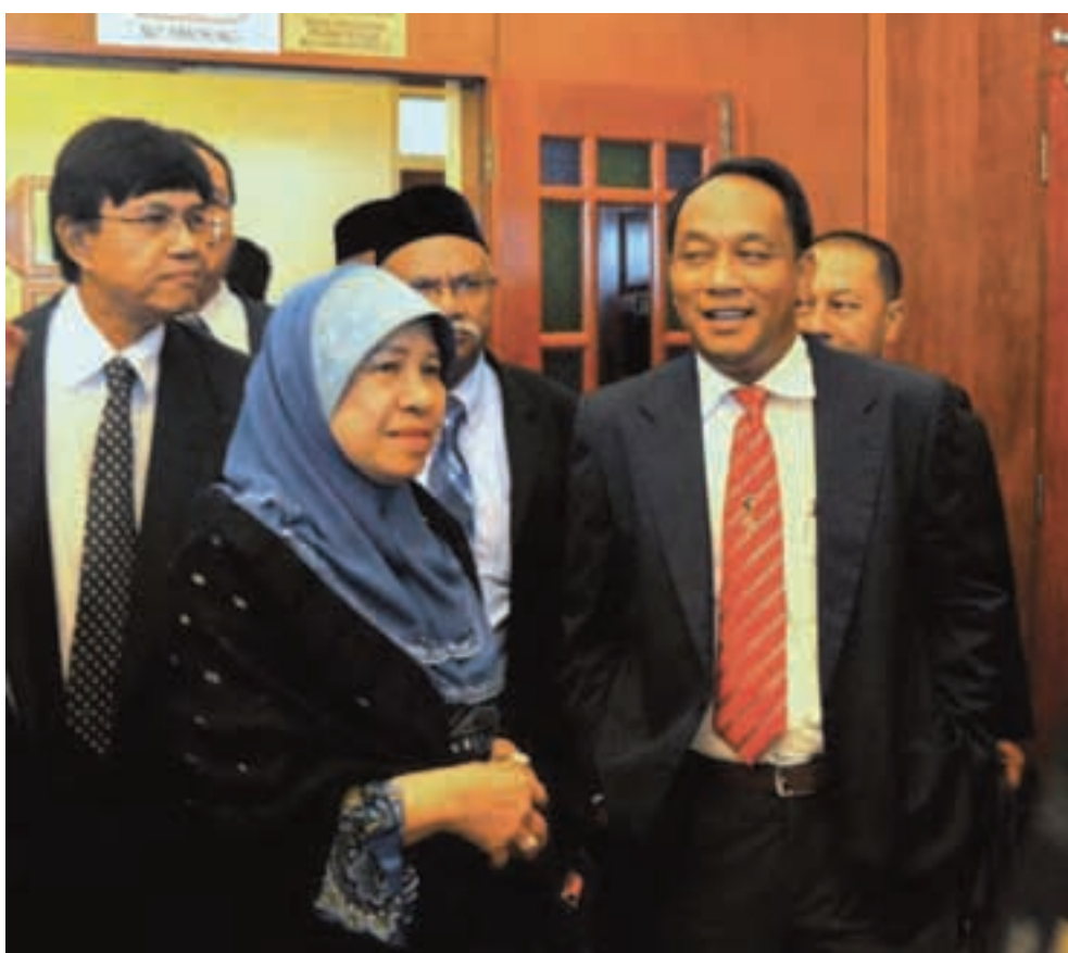
槟州10名巫统反对党州议员自2014年起将获得每年4万令吉拨款充作小型发展计划用途。

“因此，有别于国阵的对抗，民联接受采取国家和解的应有作为，槟州行政议会决定自2014年起根据严格的机制，每年拨款4万令吉予槟城的10名巫统反对党州议员以充作小型发展计划之用。”