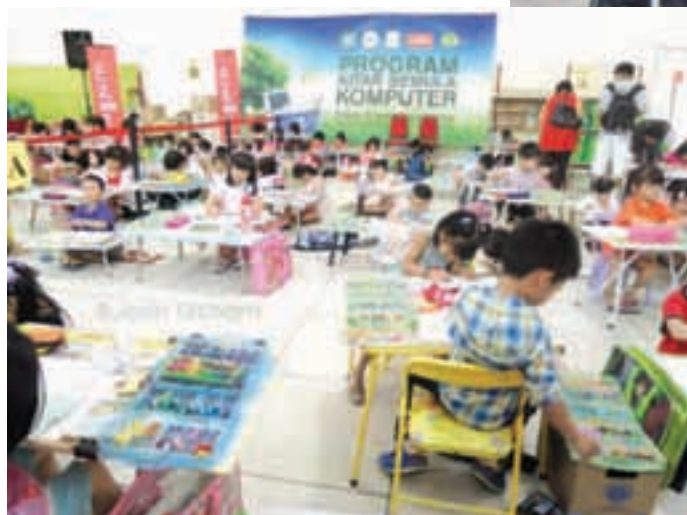
Children at the Computer Recycling Carnival 2013 taking part in a recycling themed colouring competition.