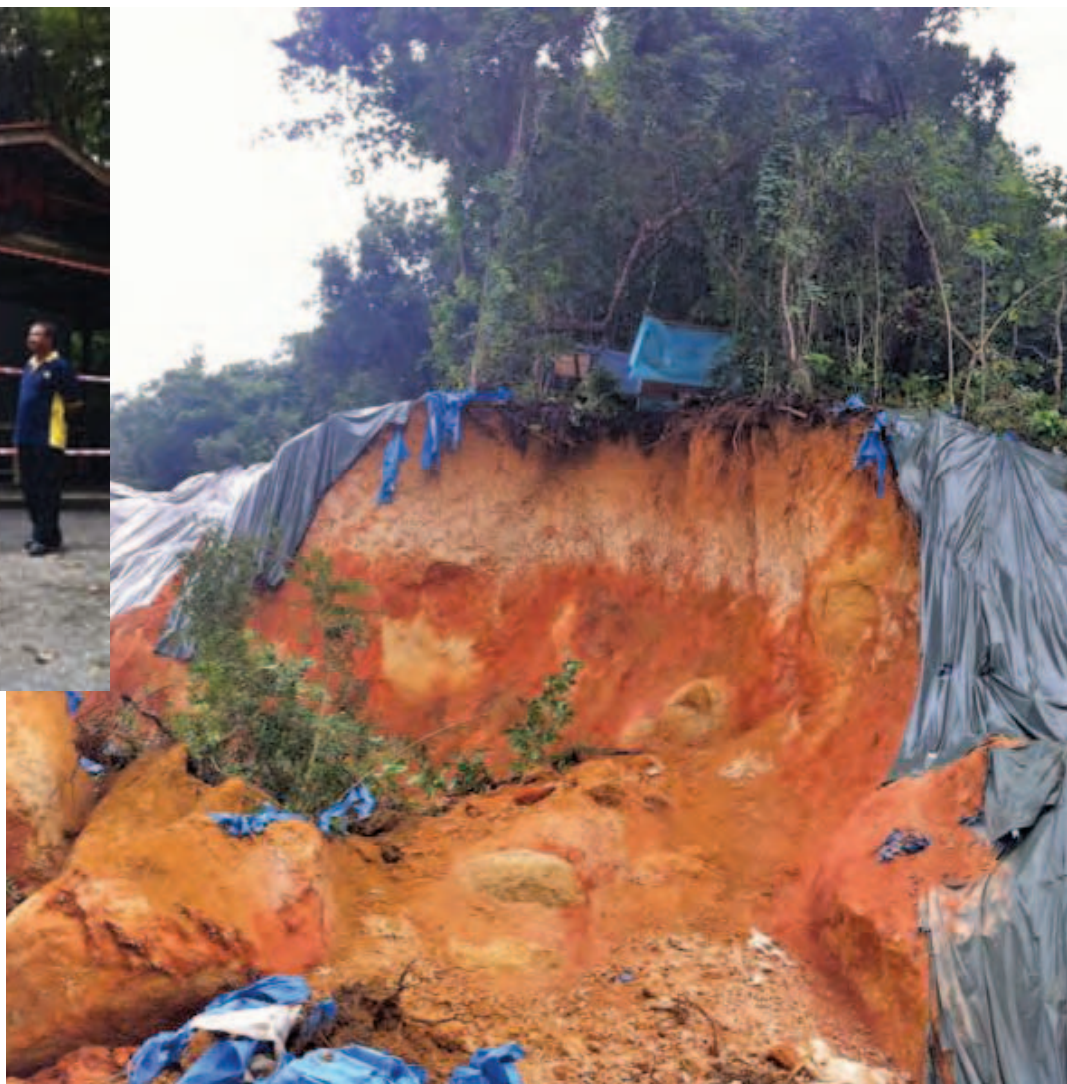
Bare earth exposed after a landslide occurred near Solok Tanjung Bungah.

This remedial work is to prevent further landslips which can be a danger to the residents nearby.