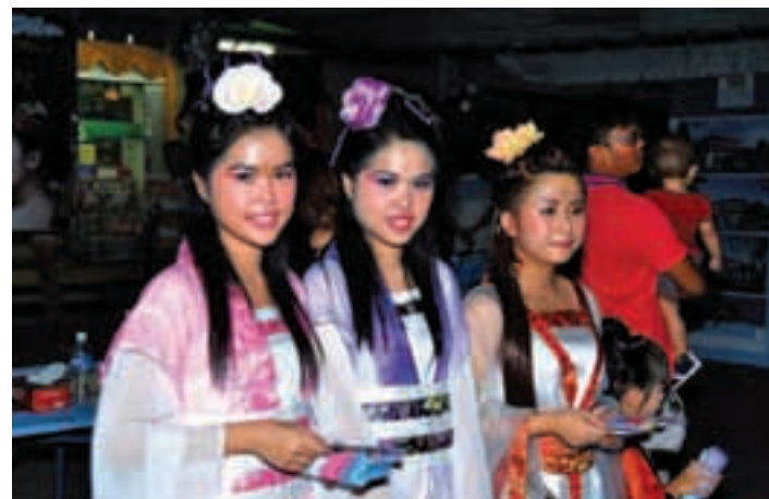
Three pretty lasses dressed like fairies to celebrate Mid-Autumn Festival.