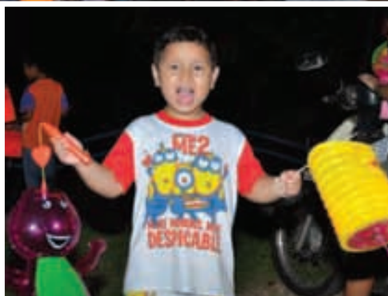
Joy is painted on this little boy's face as he plays with lanterns at the Seberang Jaya lantern festival.

Although the Mid-Autumn Festival is a Chinese traditional celebration, people from all races participated and various traditional performances entertained the crowd that night.