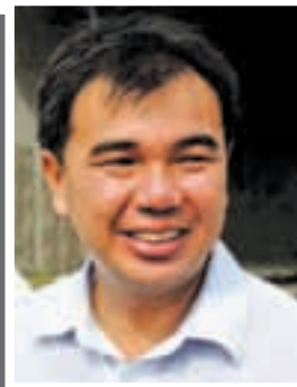
孙意志 爪夷区州议员

我们坚持反对《2013-2025教育大蓝图》，只因为为了许孩子一个干净明亮的明天。