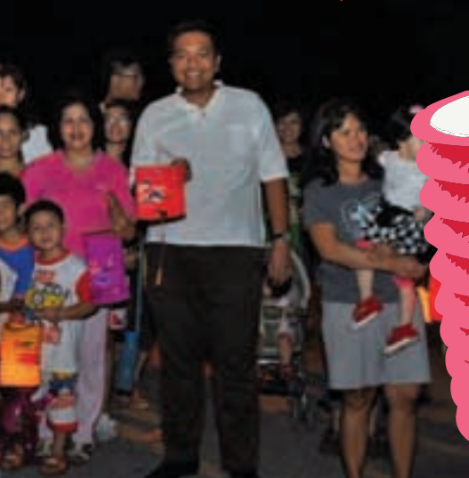
中心举办的中秋节晚上，与当地民众一起提灯度中秋。