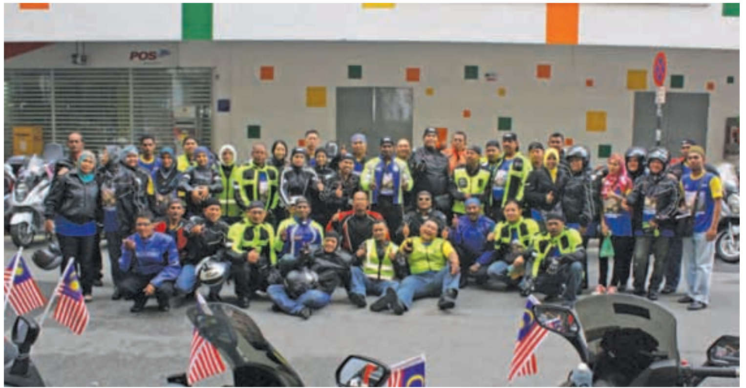
A group photo before the scooter club began the Malaysia Day Ride 2013

Before State Exco of Religious Affairs, Domestic Trade and Consumer Affairs,