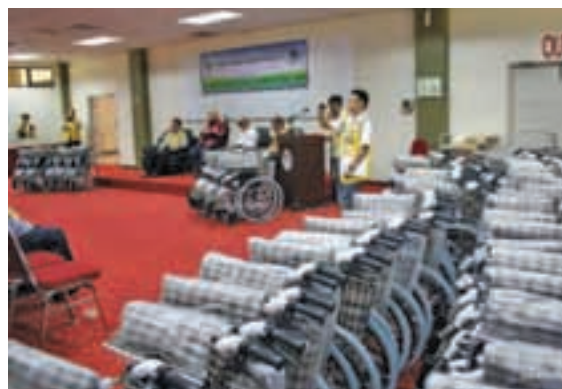
《免费轮椅任务》慈善活动是槟城光大狮子会首次举办的活动，该会成功在一个月內募集超过2万令吉，并且捐赠72轮椅给12慈善团体及13个人。

该项活动同时也邀得槟州元首敦阿都拉曼阿巴斯、光大区州议员郑来兴，以及狮子会308B2区总监李文和等人，出席见证在爱心大厦举行的轮椅移交仪式。