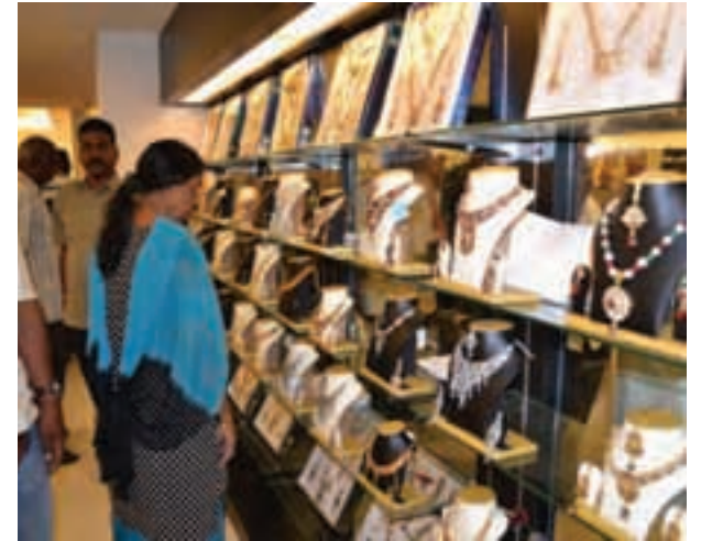
தங்க நகை போல் மினுக்கும் கவரிங் நகைகள்