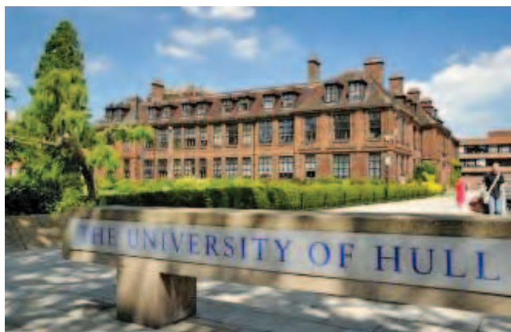
英国著名赫尔大学（University of Hull）将在槟城开工程、商学、法学、物流及会计等多项课程，而这计划更巩固了槟州作为教育中心的目标；预计该项工程将在2014年动工，并预料可在2017年底开课。

他希望The Ship Campus学院的课程出现得正是时候，因为跨国公司在槟城需要熟练的技术员工，而发展服务行业及商务外包中心将需要大量高科技培训的本地员工而不是外国劳工。