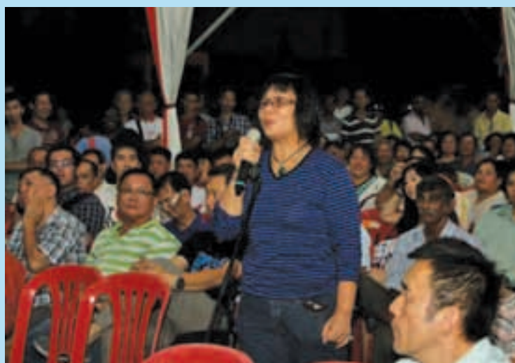
Part of the crowd that attended the dialogue session.

Among the feedback from the residents included a hawker who was close to tears as she related how her sales had dipped from RM4,000 monthly to RM700 after the one-way traffic system was implemented.