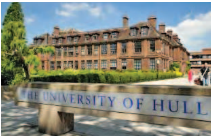
A screen shot of the University of Hull's campus in the United Kingdom.

This would directly benefit Penang as the courses offered at "The Ship Campus" go hand in hand with the high demand of existing industries in Penang like electrical and electronics engineering, business studies, logistic studies,