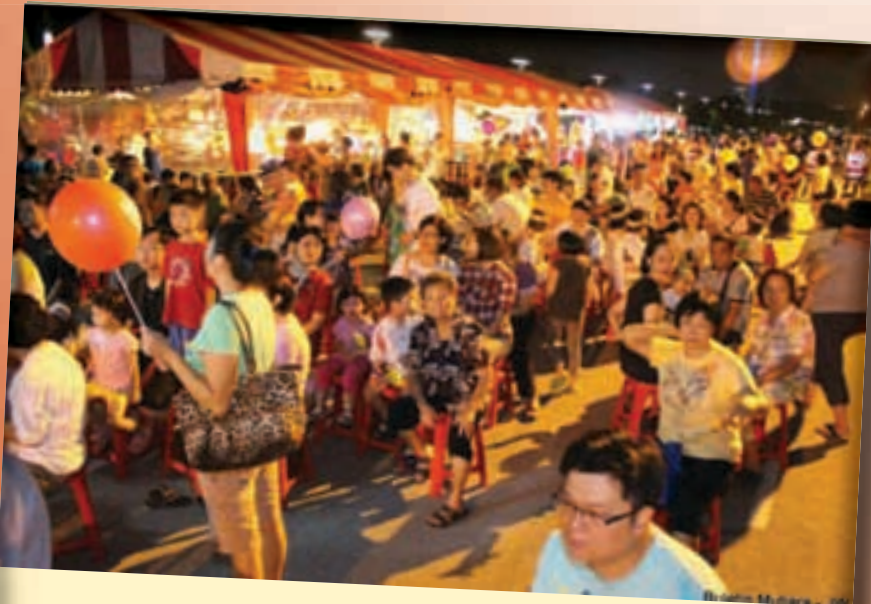
சுங்கை ரினாங்கில் நடைபெற்ற மெழுகுவர்த்தி கலாச்சார இரவில் மக்கள் திரளாக திரண்டனர்.