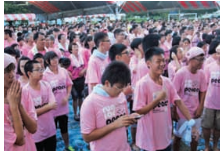
Runners dressed in pink raring to go for the Peace Run.

message of peace in the community, creating a culture of peaceful living, in line with the objectives of Soka Gakkai.