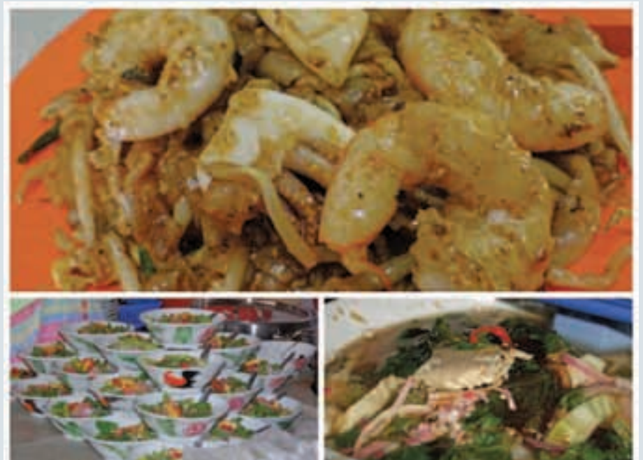
A collage of Balik Pulau laksa and Pulau Tikus char koay teow.

Penang laksa, my favorite dish, has a fish-based broth made from poached mackerel stewed for hours with chili