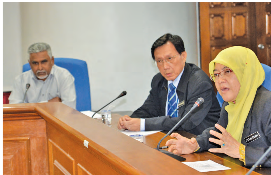
Patahiyah is not mincing her words when she warned that if the company failed to provide sufficient parking coupons, then the public is not required to display them.

“We have printed a new batch and hope to resolve this matter within two weeks from Jan 16. Some 300,000 coupon booklets will be available soon,”