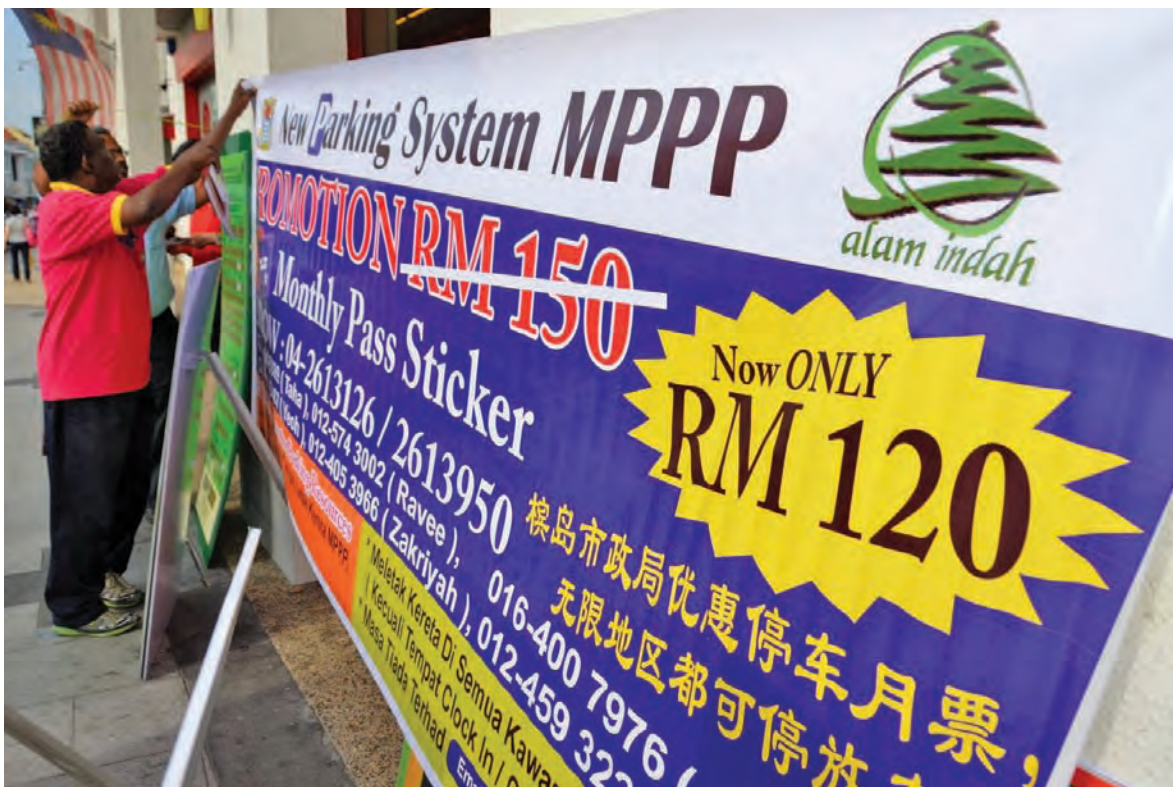
槟岛市政局宣布，基于停车固本短缺，槟岛市政局决定暂时冻结停车收费，公众人士在这段期间在槟岛将获得免费停车的优惠，直至另行通知为止。（档案照）

“州政府已在去年十月决定延迟实行这项新制度，把实行日期从2013年11月4日展延至2014年1月1日，以允许槟岛市政局和有关特许经营权公司有更多的时间来解决当时面对的问题。”