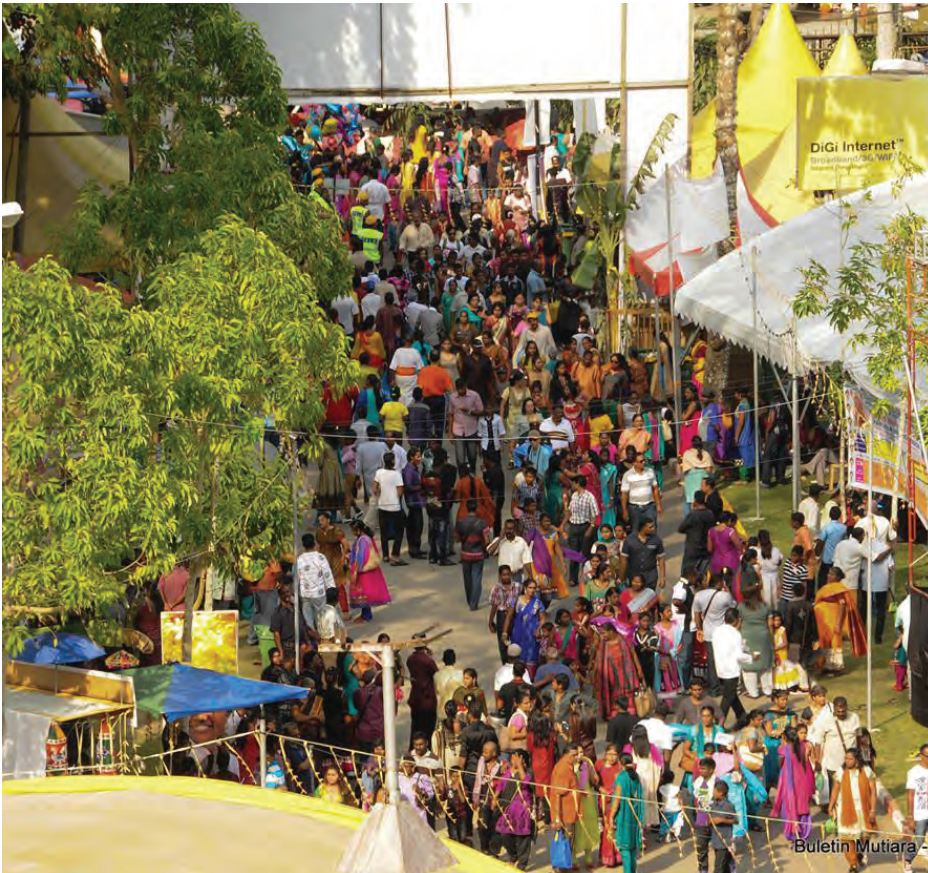
தைப்பூசத்திற்கு வருகைபுரிந்த பக்தர்கள்

தைப்பூசத் திருவிழாவின் போது சிறுத் தொழில் புரியும் பொது மக்களுக்கு உதவும் வகையில் ஆலய நிர்வாகம் 130 வியாபாரிகளுக்கு இடம் வழங்கப்பட்டுள்ளன. இதன் மூலம் பக்தர்கள் தங்களுக்குத் தேவையானப் பொருட்களையும் பெற்றுக் கொள்ள முடிகிறது. இவ்வாண்டு பிளாங்கு தைப்பூசத் திருவிழா மிகப் பிரமாண்டமாகவும் பல இலட்சக்கணக்கான மக்கள் ஒன்று திரண்ட ஒரு வரலாற்றுப் பூர்வமான திருவிழாவாகவும் அமைந்தது என்றால் அது மிகையாகாது. இவ்வாண்டு ஏறக்குறைய 1.5 மில்லியன் மக்கள் ஒன்று திரண்டனர் என்பது வெள்ளிடைமலையாகும்.