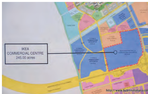
A detailed development plan for the Ikea site situated in Batu Kawan, showing its close proximity to the soon-to-be-opened second Penang Bridge.

This 245-acre development project will include 30 acres for the development of the Ikea store and phase 1 of the shopping mall, 45 acres for the development of phase 2 of the shopping mall and 170 acres for mixed development purposes.