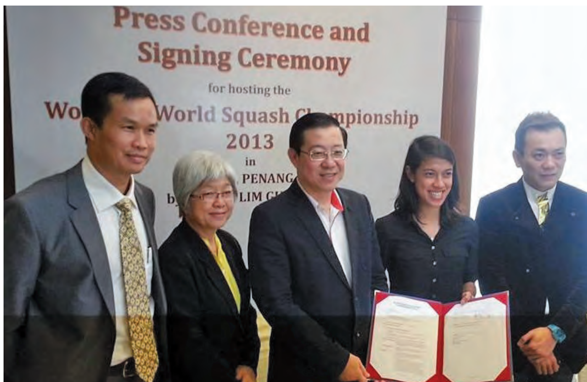
槟州首长林冠英（中）在拿督妮科大卫（右2）陪同下宣布，槟城将于2014年3月14至21日在槟城湖内国际体育馆主办2013年第30届世界女子壁球大赛。

槟城将于2014年3月14至21日在槟城湖内国际体育馆主办2013年第30届世界女子壁球大赛。