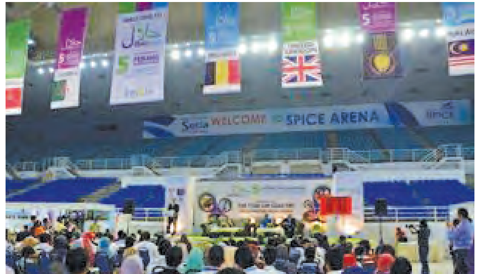
A shot of the crowd that gathered for the opening ceremony of the Penang International Halal Expo and Conference at SPICE on Jan 17.

He said that since the first expo and conference in 2008, there has been a