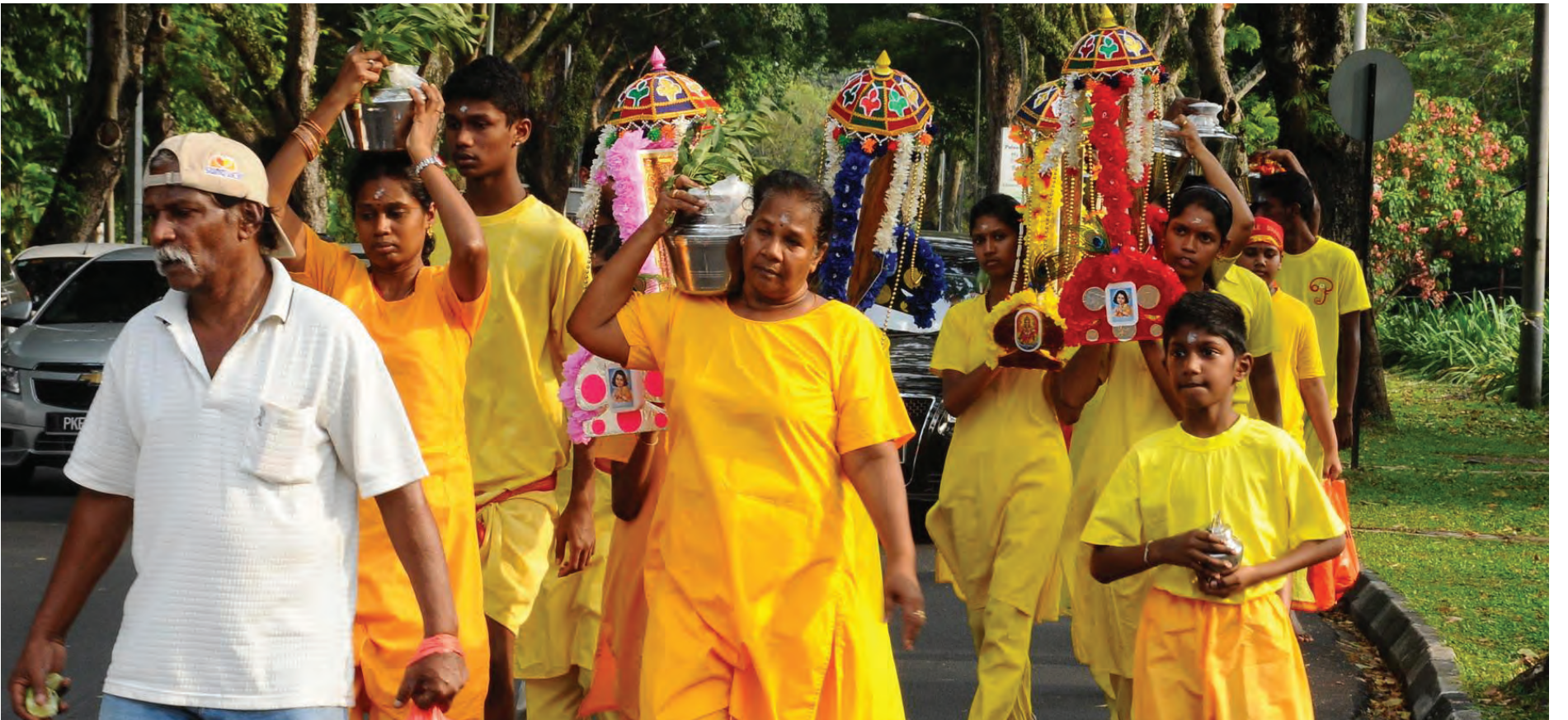
முருகப்பெருமானுக்கு நேர்த்திக்கடன் செலுத்தும் பக்தர்கள்

பிளாங்கு தைப்பூசத்தின் சிறப்பு அம்சமாகச் சாலை ஓரங்களில் அமைக்கப்பட்டிருக்கும் தண்ணீர் பந்தல்கள் திகழ்வது குறிப்பிடத்தக்கது. அரசுத் துறைகள், தனியார் நிறுவனங்கள், பொது இயக்கங்கள்