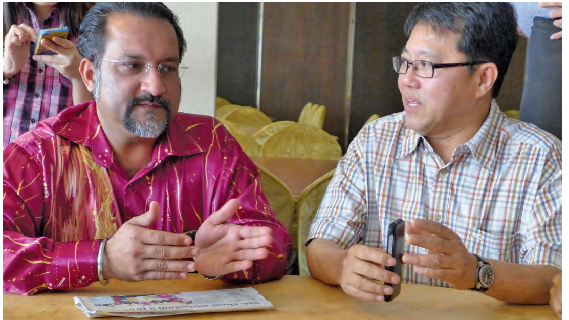
The net is cast wider by the Selection Process Enhancement Committee (SPEC) to ensure only qualified and deserving applicants get the low cost and low medium-cost homes.

received by the Penang State Housing Department.