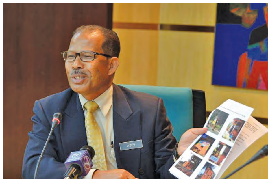
Azizi showing members of the media photos of the demolition and also the original building which remains on the island.

c. Organise the Chinese temples into a structure with certain religious authority to impart advice to the relevant authorities without taking over or affecting the existing management and operations of Chinese temples.