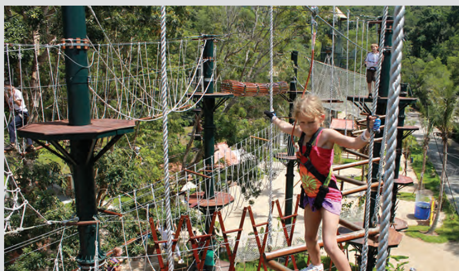
Challenge your balancing skills and learn to climb like a ‘monkey’ in Monkey Business.

banas, thrilling activities include the slide at Tubby Racer, swing like a monkey at Monkey Business, leap through the air at Atan’s Leap and be a human gecko at Gecko Tower.