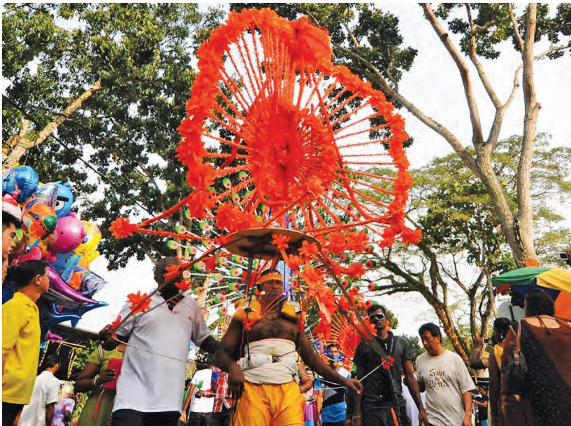
在大宝森节庆典中，信徒扛着卡瓦迪上山还愿。