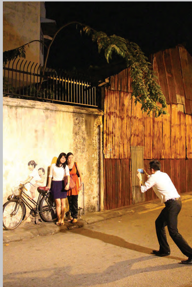
为避免壁画过於泛滥进而影响市容，同时有效管理乔治市古蹟区内的壁画与各项人文艺术创作，槟州政府议决通过乔治市世遗机构成立一个特别的艺术委员会，负责管理在古迹区内进行的壁画等人文艺术创作。

任何人如有疑问，可联络乔治市世遗机构寻求协助，电话为：04-261 6606，地址：116 & 118, Lebuh Acheh, 10200 George Town, Penang, Malaysia.。