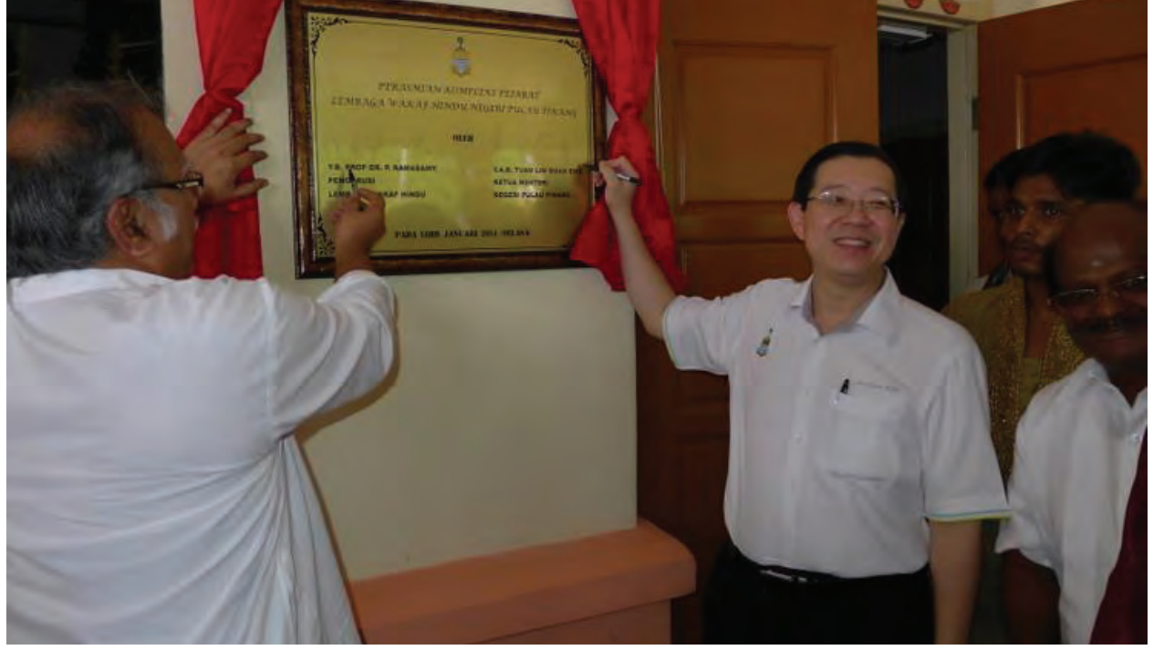
பினாங்கு மாநில முதல்வர் மேதகு லிம் குவான் எங் மற்றும் மாநில இரண்டாம் துணை முதல்வர் பேராசிரியர் ப. இராமசாமி இணைந்து இந்து அறப்பணி வாரியக் கட்டடத்தை அதிகாரப்பூர்வமாகத் திறந்து வைத்தனர்.

மூன்று கரும்புகள் பிரமிட் வடிவில் கட்டப்பட்டு, அதற்கு நடுவில் விறகுகளுக்கு அடுக்கி வைக்கப்பட்ட செங்கற்களின் மேல் அலங்கரிக்கப்பட்ட மண் சட்டி வைக்கப்பட்டிருந்தது. ஒவ்வொரு மண்சட்டிக்கு முற்புறம் வண்ண அரிசி மாவில் கோலங்கள் இடப்பட்டு அவ்விடமே வண்ணமயமாகக் காட்சியளித்தது. மாவிலை, தோரணங்கள்