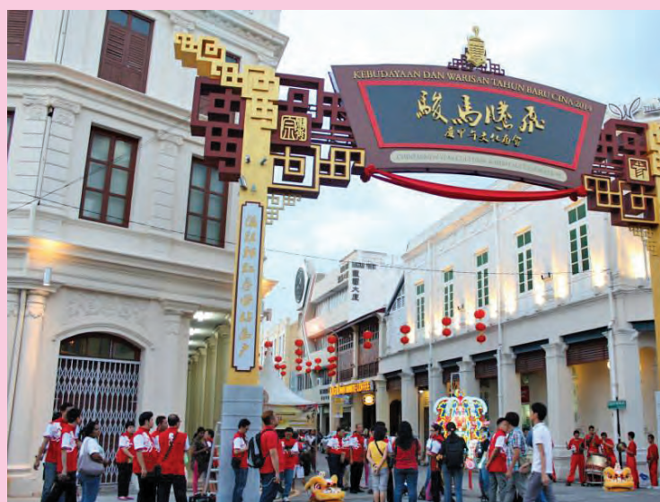
《骏马腾飞庆甲午文化庙会2014》今年将打破传统，除了提前在年初三举办，以让回来槟城过年的游子们能够参与之外，更是首度从本头公巷一带移师至义兴街、漆木街、唐人街和大伯公街一带进行。

他说，筹获35万令吉能够让工作团队可以更顺利地举办2014文化庙会，而丽星邮轮槟城营运助理副总裁盛锦龙也对2014年文化庙会的新地点土库街感兴趣。