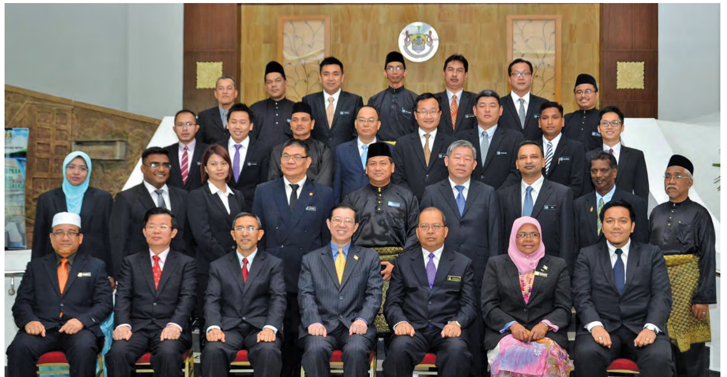
The councillors in a group photograph after the swearing-in ceremony.

"I am extremely excited with the appointment as I've always wanted to render my services to the community,"