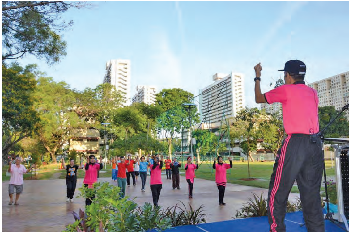
Residents from Macallum flats join the morning aerobics exercise at the new Community Park.