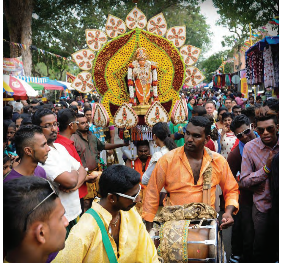
உறுமிமேள இசையுடன் பவனி வரும் முருகப்பெருமான் காவடி

பக்தர்கள் மயில் இறகுகள், மலர், மற்றும் பல வித அழகுப் பொருட்களைப் பயன்படுத்தி காவடிகளை ஏந்தி வந்தனர். மயில் காவடி, பால் காவடி, பண்ணீர் காவடி, புஷ்ப காவடி ஆகிய பல விதமானக் காவடிகளை இந்தியர்கள் மட்டுமின்றி சீனர்களும் பக்தி மேன்மையுடன் ஏந்தி வருவதைக் காண்பதற்குச் சிறப்பாக அமைந்தது. இந்த ஆண்டு 10000-க்கும் மேற்பட்ட பக்தர்கள் பாலதண்டாயுதபாணிக்கு மொட்டையடித்து முடிகாளிக்கை செலுத்தினர். மலை அடிவாரத்தில் அஸ்ட்ரோ செயற்கைகோள் தொலைக்காட்சியின் மூலம் பிளாங்கு தைப்பூச விழா உலக மக்களின் பார்வைக்கு நேரடி ஒளிப்பரப்புச் செய்யப்பட்டது. பொது மக்களின் பாதுகாப்பை உறுதிப்படுத்தும் வகையில் பிளாங்கு மாநில காவல்துறை உதவித்தலைவர் டத்தோ தெய்வீகன் தலைமையில் பலத்த பாதுகாப்பு வழங்கப்பட்டன.