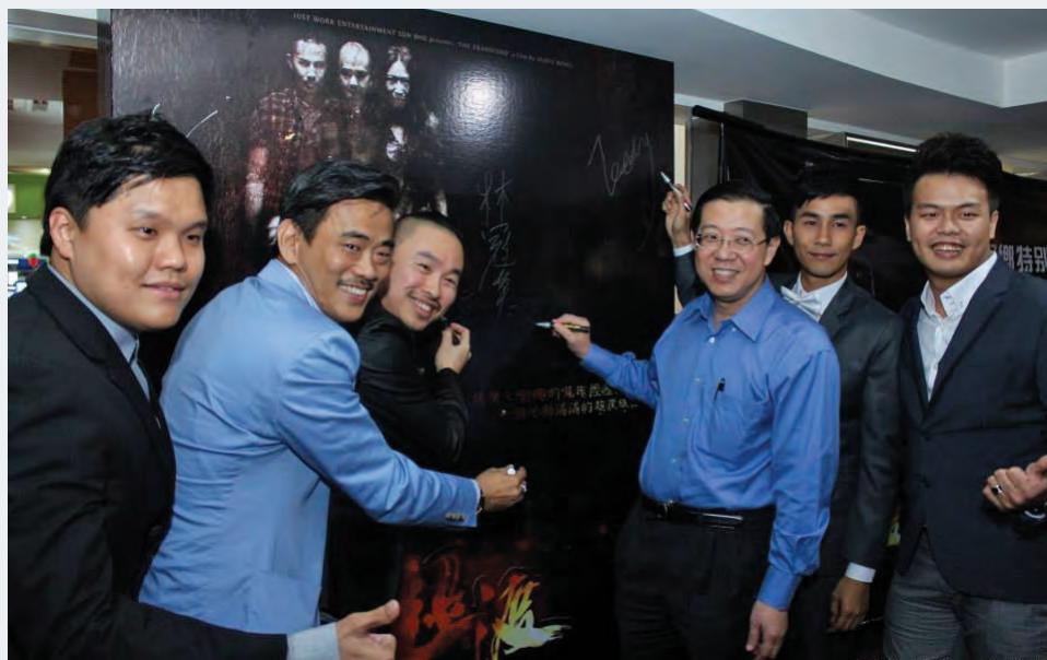
槟州首长林冠英（右3）在出席电影《超渡》回乡特别放映会后，呼吁国内外的槟城艺术家像李勇昌（左3）一样，一定要“回家”做展演，让所有槟城人都有机会看到属于槟城人的出色作品。

据了解，李勇昌的下一部作品《老槟城的情书》，将会是100%在槟城取景，这部由槟城导演在槟城拍摄的电影，到时在槟城上映时，相