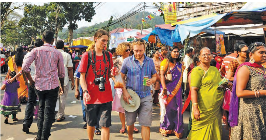
大宝森节庆典也吸引外国游客参与其盛。