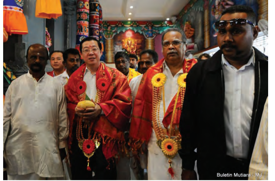
தைப்பூசத்திற்கு வருகையளித்த முதல்வர் மேதகு லீம் குவான் எங் அவர்களுக்குச் சிறப்பு செய்யப்பட்டது (உடன் இரண்டாம் துணை முதல்வர்)

பிளாங்கு அருள்மிகு பாலதண்டாயுதபாணி ஆலயத்திற்கு நாடு முழுவதிலிருந்தும் பக்த கோடி பெருமக்கள் தங்கள் காணிக்கைகளைச் செலுத்த புற்றீசல் போல் திரண்டனர். பிளாங்கில் செட்டிப் பூசம் என்றழைக்கப்படும் தைப்பூச முதல் நாள் வெள்ளி இரத ஊர்வலம் அதிகாலை 6.30 மணிக்கு பிளாங்கு வீதியில் அமையப்பெற்றுள்ள கோயில் வீட்டிலிருந்து நகரத்தார் ஆலயத்தை நோக்கிப் புறப்பட்டது. சிறப்பான முறையில் அலங்கரிக்கப்பட்ட தங்க முருகன் சிலை மிகவும் பிரமாண்டமாகக் காட்சியளித்தது. சாலையெங்கும் தேங்காய்கள் குழுமியிருக்க பக்தர்கள் கூட்டம் புடை சூழ வெள்ளி இரதம் பவனி வந்தது. இந்தியர்கள் மட்டுமன்றி சீனர்களும் இலட்சக்கணக்கான தேங்காய்களை உடைத்து முருகனுக்குத் தங்கள் காணிக்கைகளைச் செலுத்தினர்.