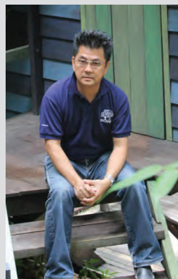
Sim is glad his dream came true.

Now, with ESCAPE, he is ready to bring back the good old days when children enjoyed themselves actively climbing trees, running around outdoors and creating games