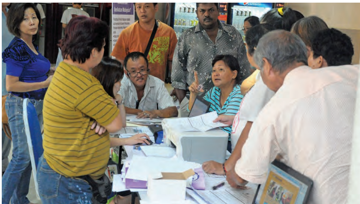
Hawkers crowding around the counter to register at Level 3, Komtar.