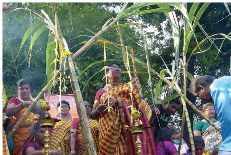
Malaysia Hindu Sangam Butterworth Council members busy cooking the sweet porridge.

Pretty Indian girls dressed in traditional costumes helped the elderly women in adding rice, nuts, brown