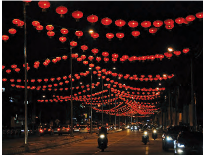
拉惹乌达区的街道已挂满大红灯笼，新年气氛非常浓厚。