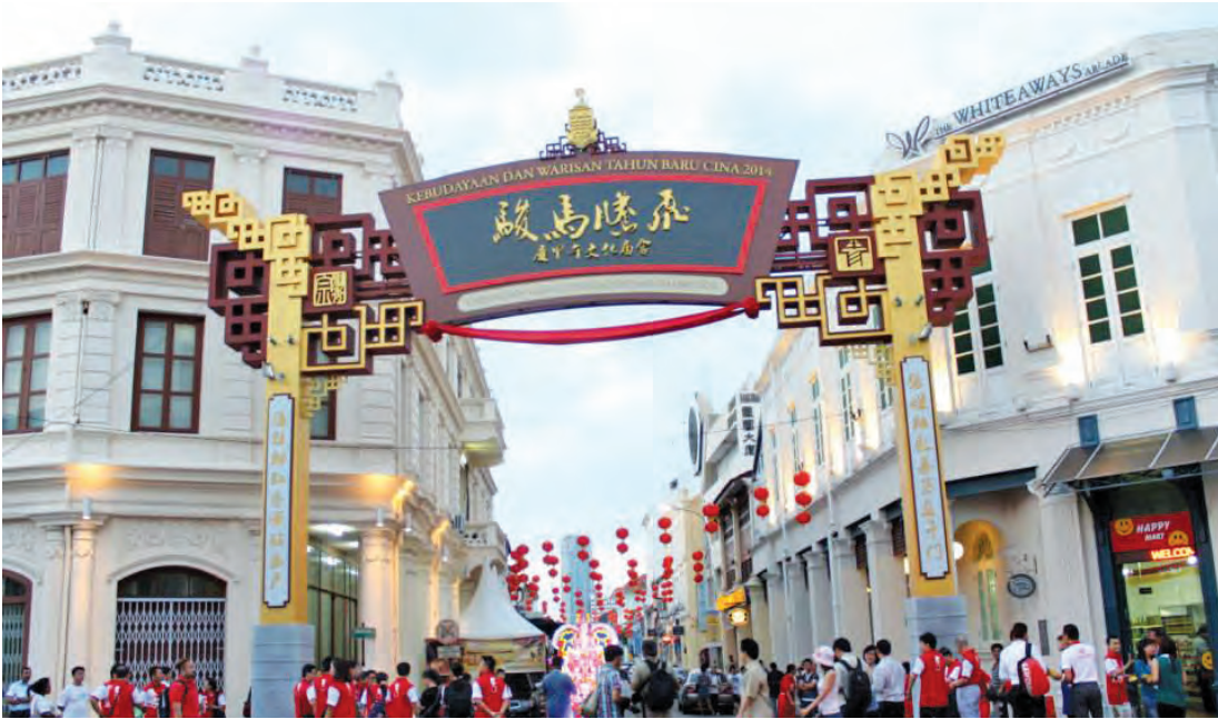
即将在大年初三举办的《骏马腾飞庆甲午文化庙会2014》。