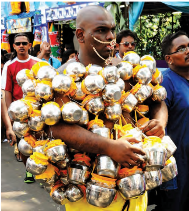
A sign of devotion and worship towards Lord Muruga demonstrated by a Hindu man accepting suffering and pain affliction as a mark of faith.

Boasting of colours, sights, sounds and smells amidst grand processions, it is not uncommon to see