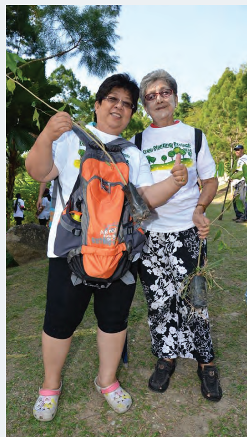
槟州子民为槟城绿化环境尽一份力。

当天由槟岛市政局、槟州森林局、狮子会等多个非政府组织在槟岛市政局公园种植450棵沉香树，参与者达200多名来自的非政府组织成员。