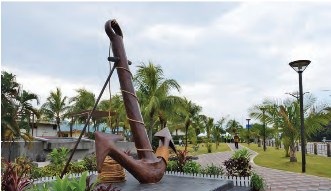
A replica model of a wooden anchor which depicts the origin of Anjung Bagan as a place for traders in the 1960's.