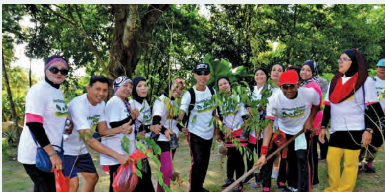
由槟岛市政局、槟州森林局、狮子会等多个非政府组织在槟岛市政局公园种植450棵沉香树，参与者达200多名来自的非政府组织成员。