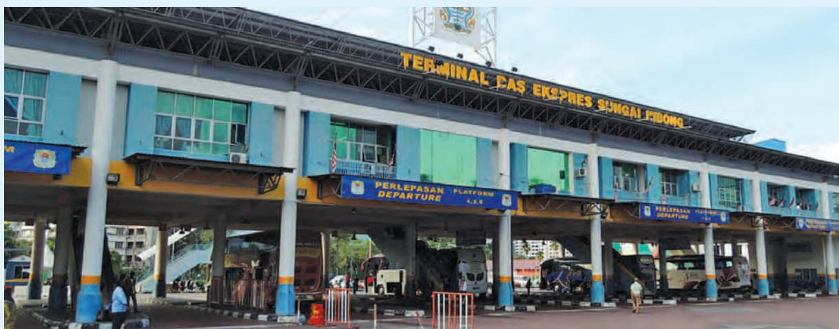
An overview of the terminal which is the point where people board buses to other states.

Meanwhile, the cafeteria has been rented out