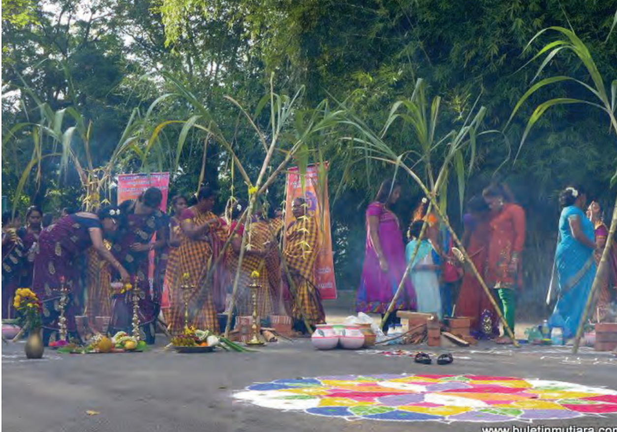
பொங்கல் நிகழ்வில் கலந்து கொண்ட மகளிர்கள்