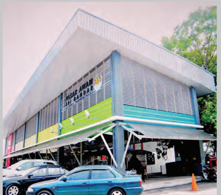
The Sri Bandar Market after the upgrade.

"Markets and food complexes which receive Grade A will be announced in July in conjunction with MPSP Quality Day," she added.