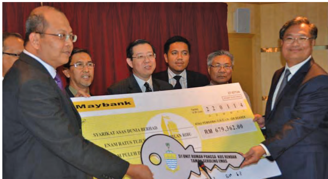
Farizan handing over a mock cheque to a Syarikat Asas Dunia representative after the signing ceremony.

Meanwhile, Penang state secretary Dato' Farizan Darus said the Selection Process Enhancement Committee (SPEC) will ensure the distribution of these houses is done equitably.