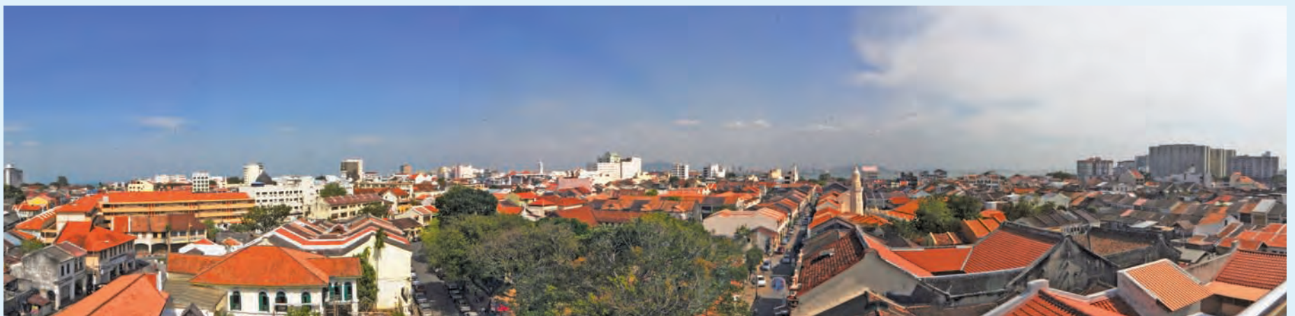
VISITORS will be able to enjoy the unobstructed view of George Town atop the newly opened Armenian Street Heritage Hotel.

For more information on the Armenian Street Heritage Hotel and to make reservations, visit www.armenianstreetheritagehotel.com