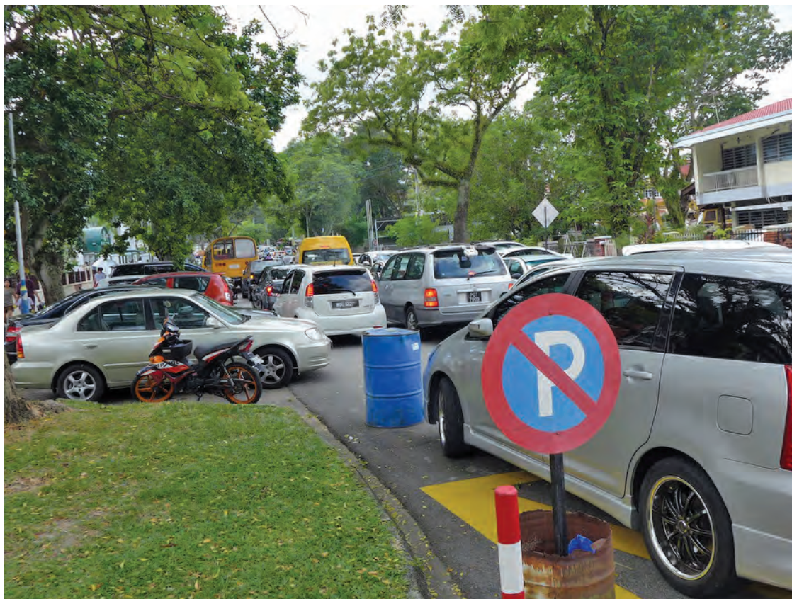
Road users and especially parents have resigned themselves to horrendous jams during school hours but MPPP is looking into their woes.

Pengarah Kejuruteraan Jabatan Kejuruteraan, MPPP, Tingkat 13, Komtar, 10000 Penang or email zainuddin@mppp.gov.my or call 259 2202/258 2015