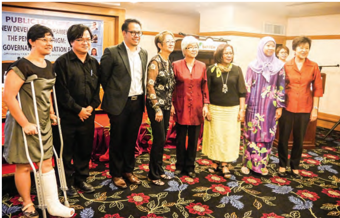
文：槟州妇女发展机构 (PWDC)

槟州妇女发展机构 (PWDC) 在槟城研究院 (PI) 的配合下，於去年12月19日主办一项题为《新发展架构与槟城思维：性别、施政与建国进程》的公众讲座，3位主讲者分享了他们在各自领域多年经验累积之心得。