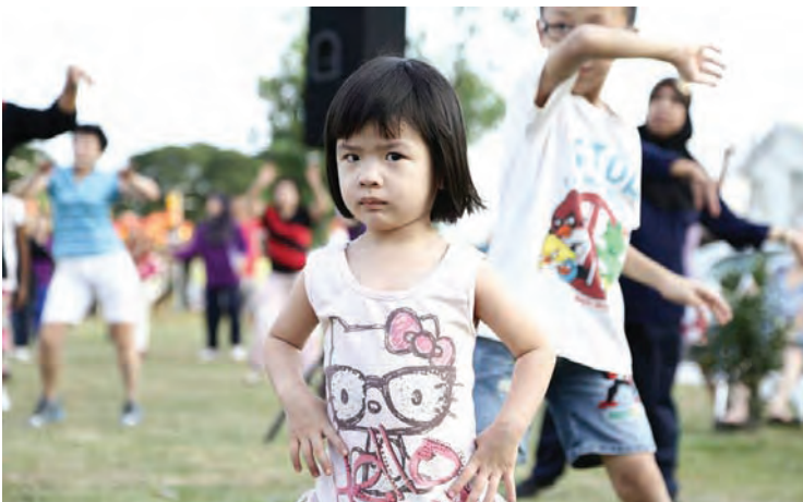
Start 'em young. A young girl joining her parents in aerobics in Seberang Perai.