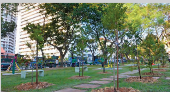
槟岛市政局积极建设口袋公园及社区公园，以绿化全槟，再计划将槟城打造成为公园中的城市。

树，计划将槟城打造成为公园中的城市。因此，五条路居民要积极配合市局保护及善用这公园，让它成为全槟最好的公园典范。”