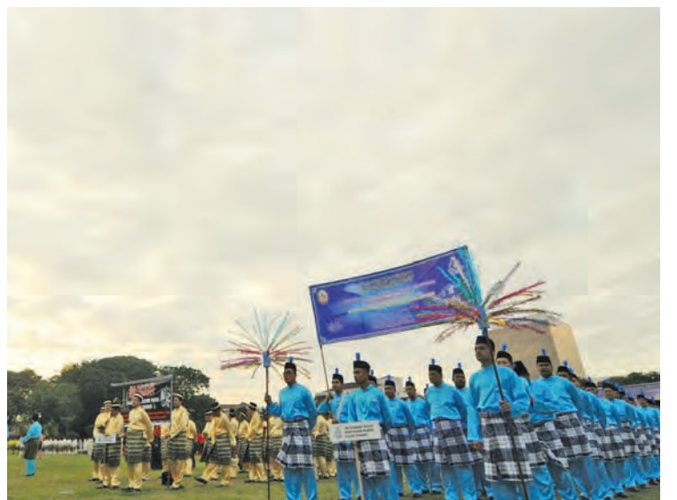
由槟州政府举办的回教先知穆罕默德诞辰游行。