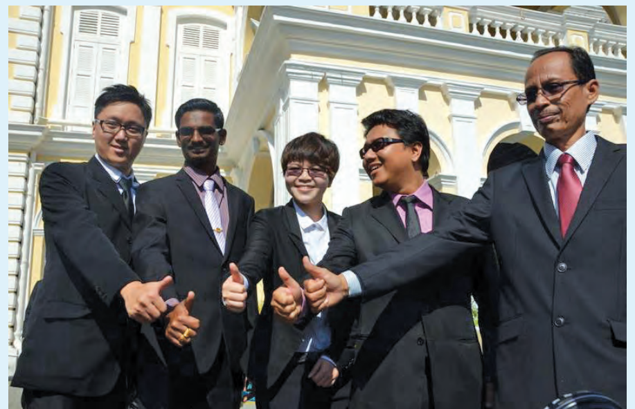
Thumbs-up for new councilors.

Meanwhile, Lim urged Penangites to cultivate the habit of giving up their seats in buses to pregnant women,