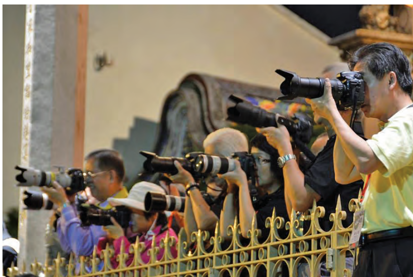
Photographers taking in the shots provided by the entertainment groups.