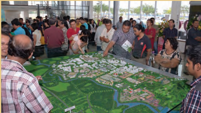
பத்து காவான் பண்டார் காசியா புதிய வீடமைப்பு கண்காட்சியில் மாதிரி வரைப்படத்தை பொதுமக்கள் பார்வையிடுகின்றனர்.