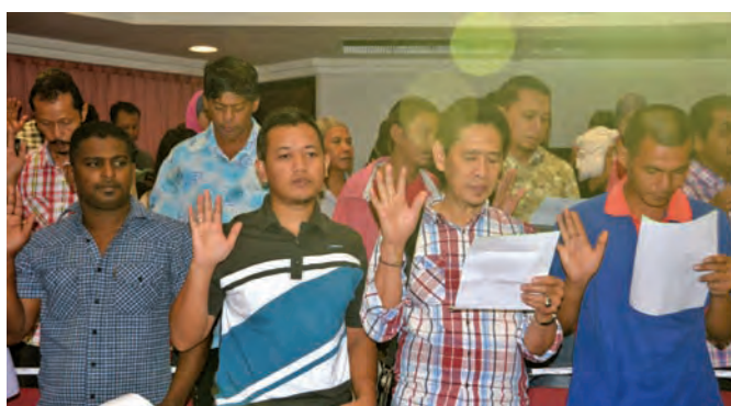
The recipients of the micro-credit loan scheme pledging to pay on time.