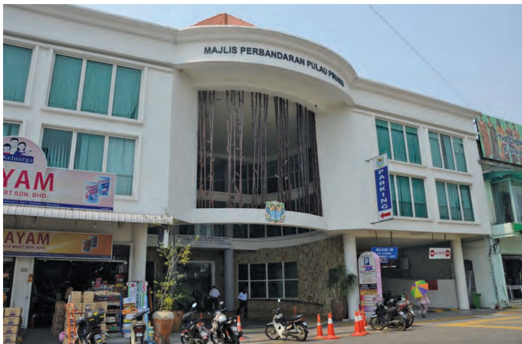
为吸引更多驾车人士使用土库街多层停车场，以减少土库街的非法停车行为，槟岛市政局已提升设施及改善停车场内灯光，同时也提供首半小时免费停车优惠。