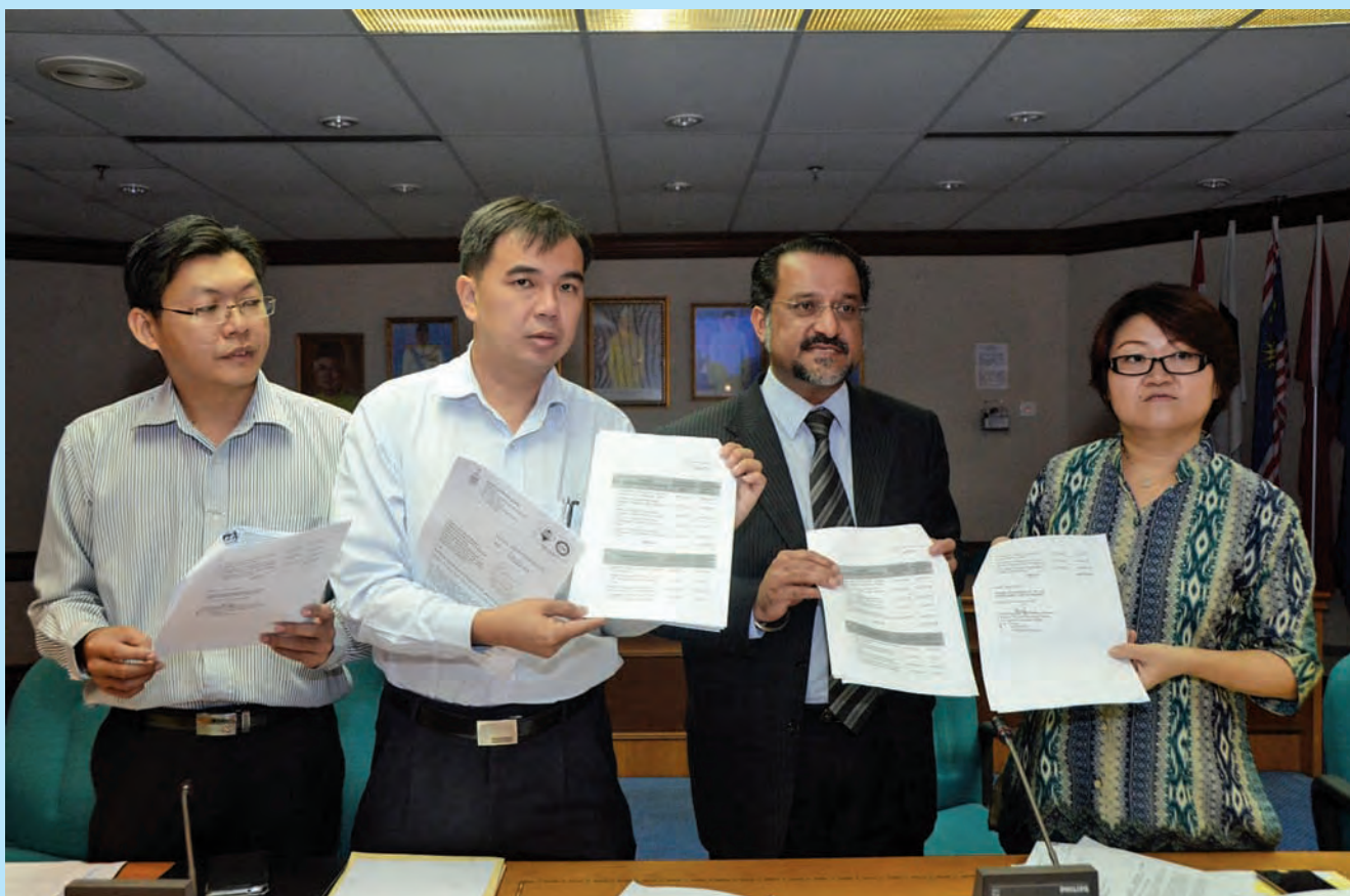
佳日星(右2)在光大州区议员郑来兴(左起)、爪夷州区议员孙意志及双溪槟榔州区议员林秀琴及陪同下,宣布州政府展开“屋”可能计划。

他也说,槟州政府承诺确保加速廉价、中廉价及可负担房屋遴选的程序,而自从槟州房屋强化遴选程序委员会于去年8月成立后,该委员会去年已遴选1788名申请者,以及今年遴选3933名申请者。