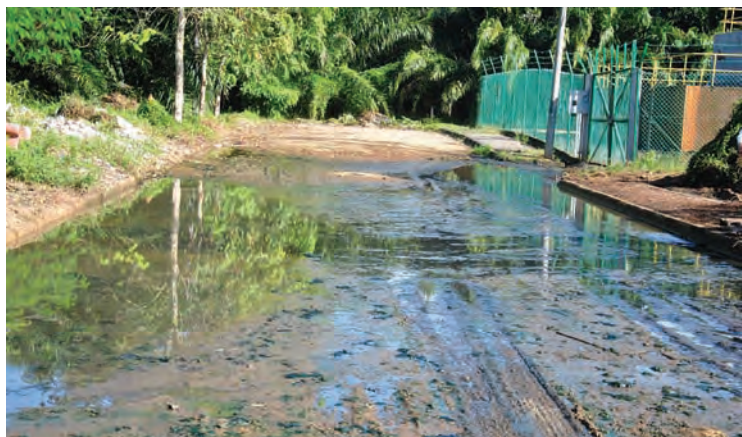
高渊礼园英达丽水过滤站附近空地沦为建筑废料垃圾堆,沙石阻塞沟渠,导致污水排流受阻而溢出路面,恶臭影响家居环境。