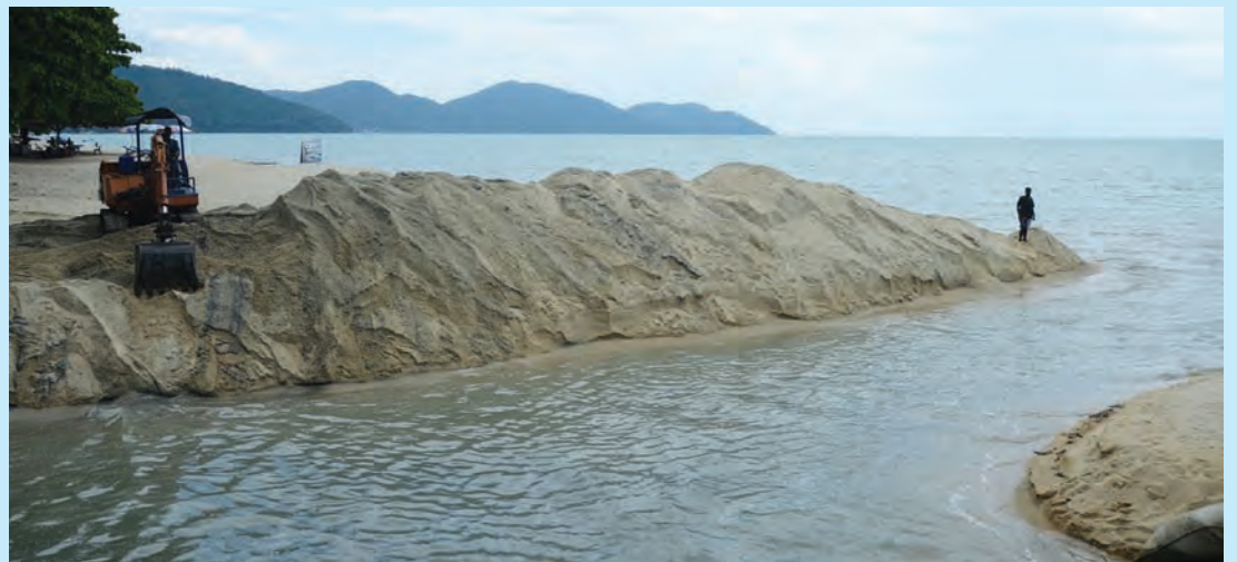
槟州水利灌溉局将分别在峇都丁宜及沙都河（Sungai Satu）打造长达120公尺的地下水管，以让污水直接排出大海解决峇都丁宜海边污染问题。