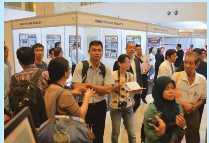
Crowd through the MASPEX at Berjaya Times Square.

"Beginning June 25, all real estate negotiators will be required to use identification tags with QR (quick response) code. So far, 19,800 agents have attended