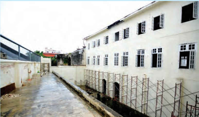
The 3-storey former warehouse will be transformed into a CAT hub.

COME the first quarter of 2015, Penang will have its Creative Animation Triggers (CAT) hub in heritage George Town after the Penang Development Corporation (PDC) signed the lease agreement with Wawasan