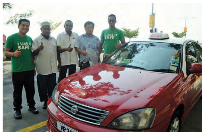
A few taxi drivers here in Penang who are currently using the MyTeksi app.

As for the issue of safety, since all users and drivers would be registered on the app and with today's level of mapping and tracking technology via the mobile phone's GPS component, users of the app will be able to SMS, email or share on any