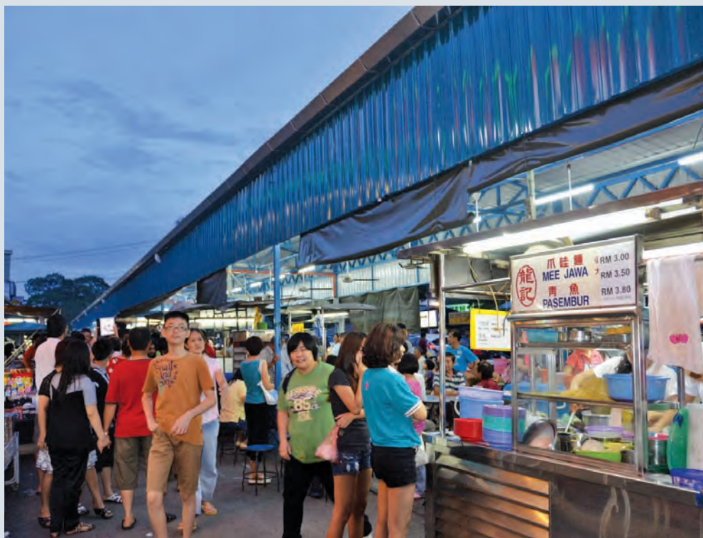
Hawkers will have to pay higher rentals, with hikes ranging from RM5 to RM120. File pic of Apollo Market hawkers.

Meanwhile, the Class 4 group will see an increase of 20%, which is as low as RM5. These are hawkers in Bukit Panchor, Taman Pekaka, Seri Delima and Permatang Tinggi.