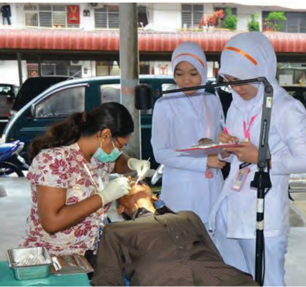
சுகாதார முகாமில் பல் பரிசோதனைச் செய்து கொண்ட பொது மக்கள்