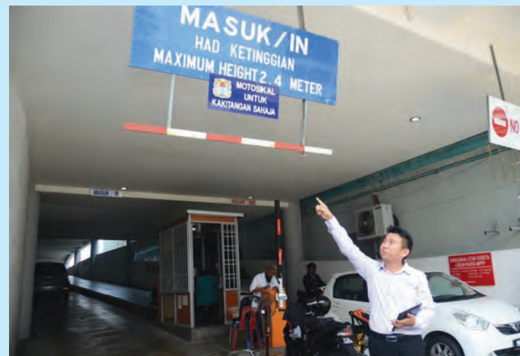
Ng at the entrance of the multilevel carpark.

WITH more parking space available at Lebuh Pantai, there is no reason to park haphazardly along the street.