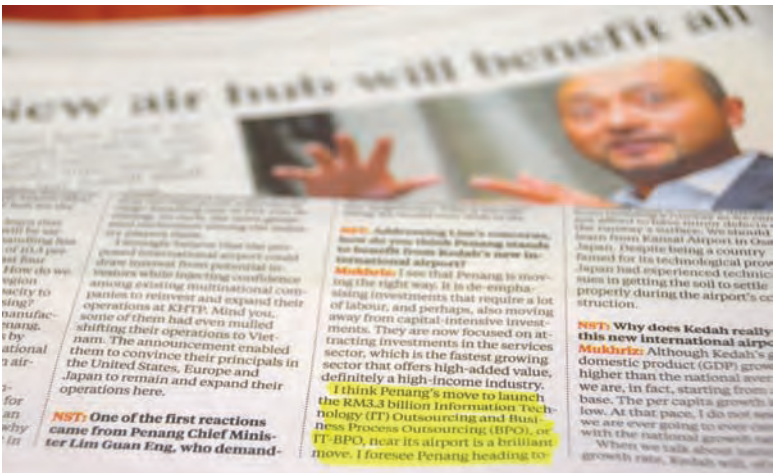
The report that said the IT-BPO was a “Brilliant idea”.