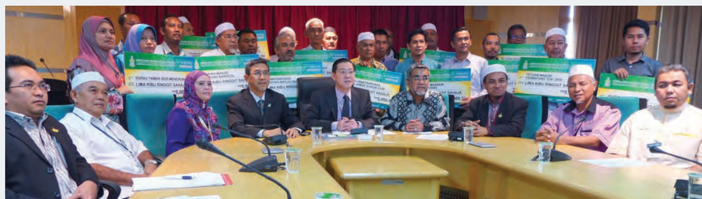
Ten PPK and their representatives together with mosque and surau leaders received RM5,000 each to prepare bubur lambuk for the people in their community.

On June 25, a mock cheque presentation was held at the Chief Minister’s office in Komtar where 13 mosques and