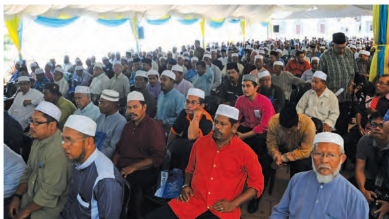
Mosques and surau leaders at the Ihya Ramadan contribution ceremony in Tanjung Bungah mosque on June 22.