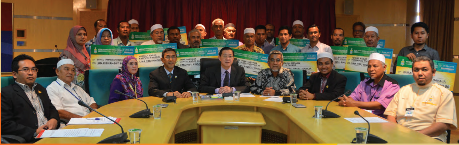
நோன்புப் பெருநாளை முன்னிட்டு பிளாங்கில் உள்ள மகுதிகளுக்கு மானியங்கள் எடுத்து வழங்கினார் மாநில முதல்வர் மேதகு லின் குவான் எங் அவர்கள்.