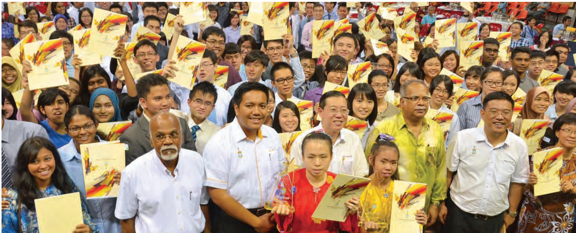
槟州首长林冠英（第二排右4）代表槟州政府颁发奖励金给2013年大马教育文凭考试颁发优越学生。

槟州政府颁发奖励金给2013年大马教育文凭考试颁发优越学生；槟州首长林冠英声称，马来西亚教育素质逐年下滑，加上槟州缺乏天然资源，因此州政府注重培育科学数学领域人才，成立槟州科学理事会，把槟城打造成学术中心。