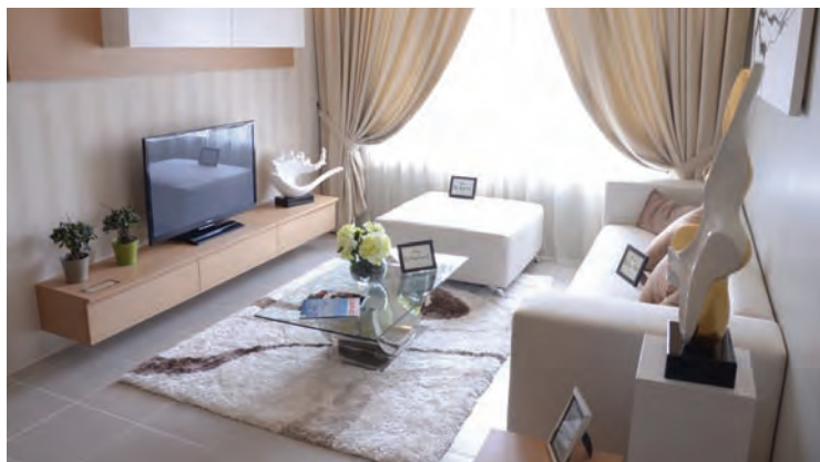
One of the three show units on display for public viewing.

For more information, call 04-5050001 or visit www.pmm.gov.my .