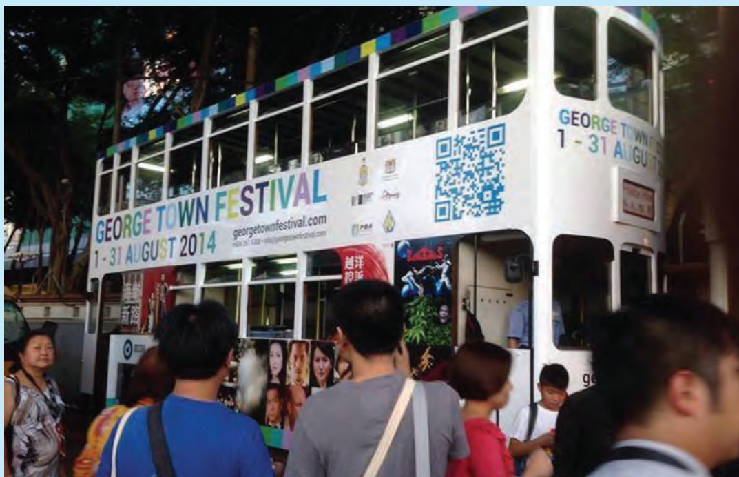
Trams plying the streets in Hong Kong will carry the advertisement for George Town festival.

Recently, Dragon Air increased its flight frequency to 10 flights a week and Hong Kong Express also entered the Penang sector by introducing seven weekly flights since November 2013.