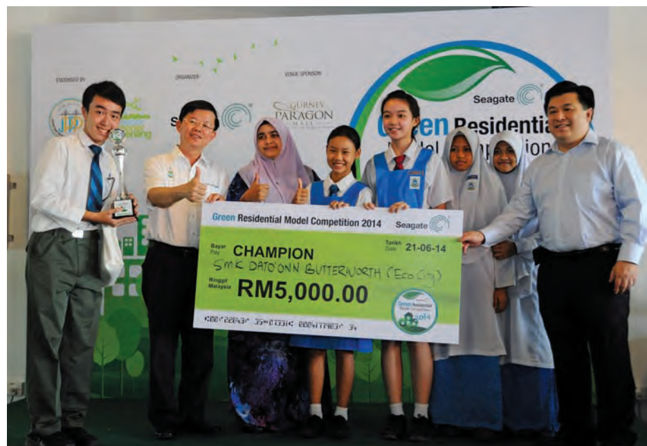
Eco City takes home a hefty RM5,000 after being named champion of the GRMC 2014.

Eco City also impressed the crowd, especially the panel of judges from Universiti Sains Malaysia, the Penang Island Municipal Council Development Planning Department and Penang Seagate Environmental, Health and Safety (EHS) during their engaging three-minute video presentation.