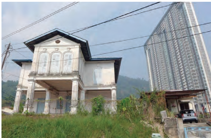
The bungalow on Jalan Evergreen was built for Lim Leng Cheak, a prominent rice miller tycoon in the late 1800s.