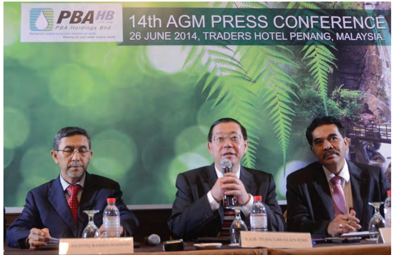
பினாங்கு நீர் விநியோக வாரியத்தின் ஆண்டு கூட்டத்தில் செய்தியாளர் சந்திப்பில் உரையாற்றினார் பினாங்கு மாநில முதல்வர் மேதகு லிம் குவான் எங். உடன் முதலாம் துணை முதல்வர் மற்றும் பினாங்கு நீர் விநியோக வாரியத்தின் தலைமை நிர்வாக இயக்குநர்

இந்நீர் கட்டண உயர்வு பினாங்கு மாநிலம் நீர் பங்கீட்டு தவிர்ப்பதற்கு என செய்தியாளர் சந்திப்பில் முதல்வர் கூறினார். தேசிய அளவினைக் காட்டிலும் பினாங்கு மாநிலம் நீர் பயன்பாட்டில் முதலிடம் வகிக்கின்றது என்பது குறிப்பிடத்தக்கது. 2013-ஆம் ஆண்டு 1.5% (295.1 பில்லியன் லிட்டர்) நீர் பயன்பாடு 2012-ஆம் ஆண்டை காட்டிலும் ஏற்றம் கண்டுள்ளது. இருப்பினும், பினாங்கு நீர் விநியோக வாரியத்தின் சிறந்த சேவைகளின் மூலம் சிலாங்கூர், பேராக் மற்ற மாநிலங்களைப் போன்று நீர் பங்கீட்டு முறை பினாங்கில் ஏற்படவில்லை என பினாங்கு நீர்