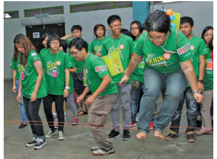
Participants enjoying the games.

Those interested may look up for many DIY camps or join the upcoming Famime programme on July 20 in Stadium Putra, Bukit Jalil, Kuala Lumpur.