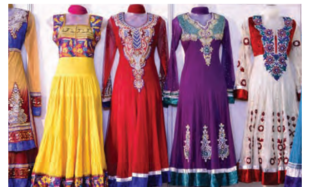
வண்ண மயமான பஞ்சாபி ஆடைகள்