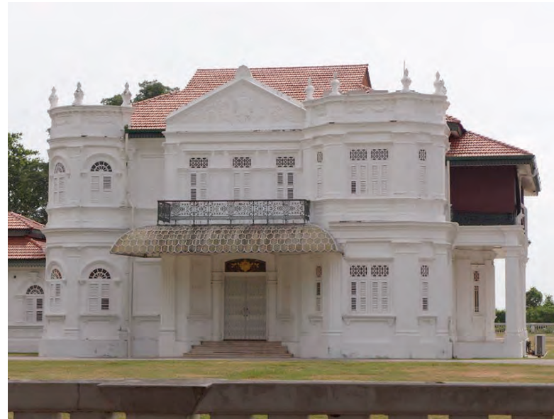
A shot of the Soonstead Mansion, with origins dating back to the early 1900s.