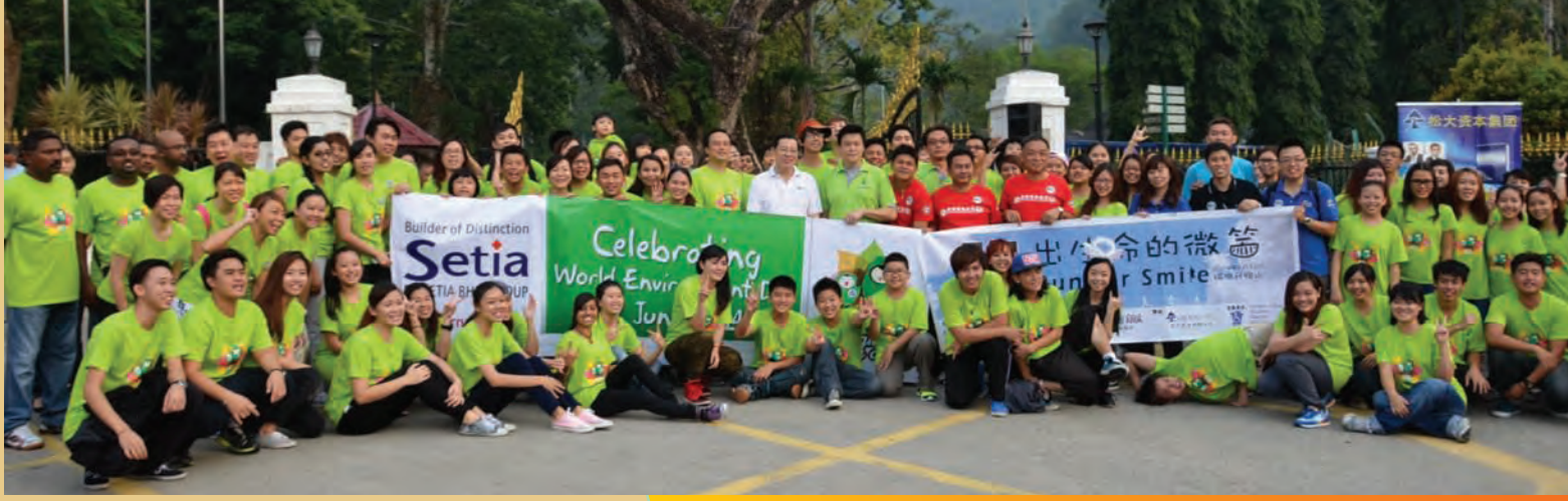
உலக சுற்றுச்சூழல் தின கொண்டாட்டத்தில் கலந்து கொண்டார் பிளாங்கு மாநில முதல்வர் மேதகு லின் குவான் எங் அவர்கள்.