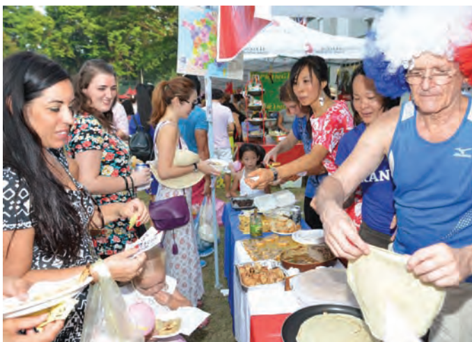
Parents busy buying foods of all kinds at the anniversary celebration.

Lim added that a strong academic foundation is a building block of a child’s educational future.