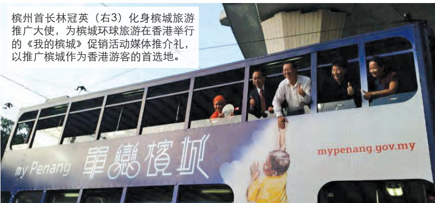
槟州首长林冠英（右3）化身槟城旅游推广大使，为槟城环球旅游在香港举行的《我的槟城》促销活动媒体推介礼，以推广槟城作为香港游客的首选地。

入境游客市场，香港的港龙航空及香港快运航空（Hong Kong Express）也因此增加其航班至每周共17班次。最近，港龙航空将其航班增加至每周10趟，而香港快运航空则自2013年11月开发槟城直飞航线后，每周有7趟直飞槟城班机。 首长林冠英也会在此次的行程中，礼貌拜会香港特别行政区政务司长林郑月娥。首长也将对香港旅游业者发表演说，以让当地旅游业同仁更了解香港出境旅客对到槟城旅游的各项需求。