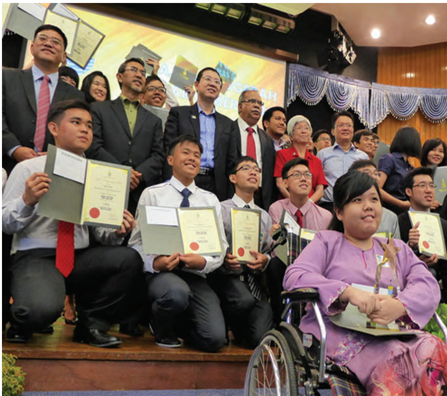
File pix of STPM students who received their excellent award certificate in April. Wong (back row, left) and other state leaders posing for a photo with some of the students.

WONG Hon Wai, political secretary to the Chief Minister, issued a press statement on June 5 inviting Penangites to apply for study loans for higher learning institutions. Application can be made online at http://epp.penang.gov.my till July 31.