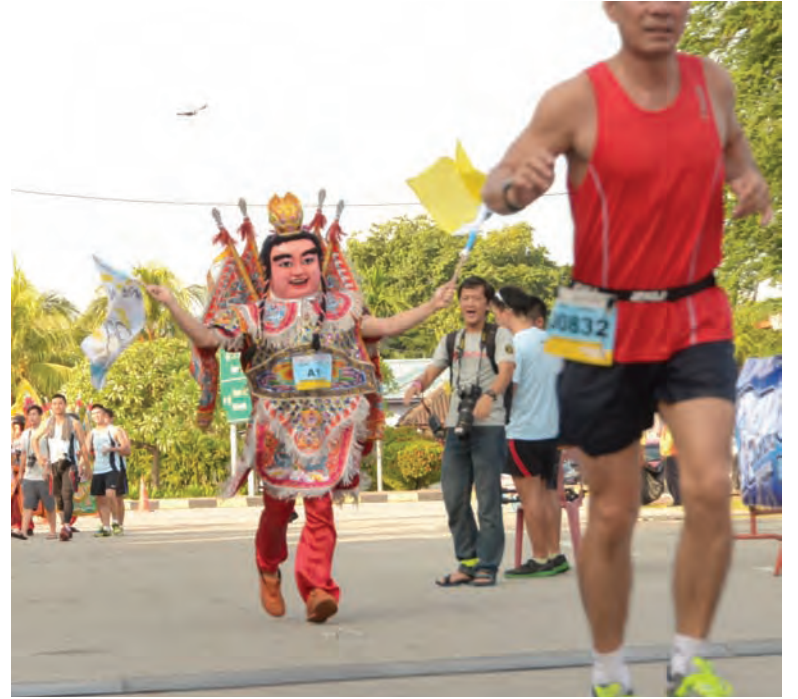
The Penang Run taking place at Butterworth has a special runner - a Chinese mythical figure in the race.