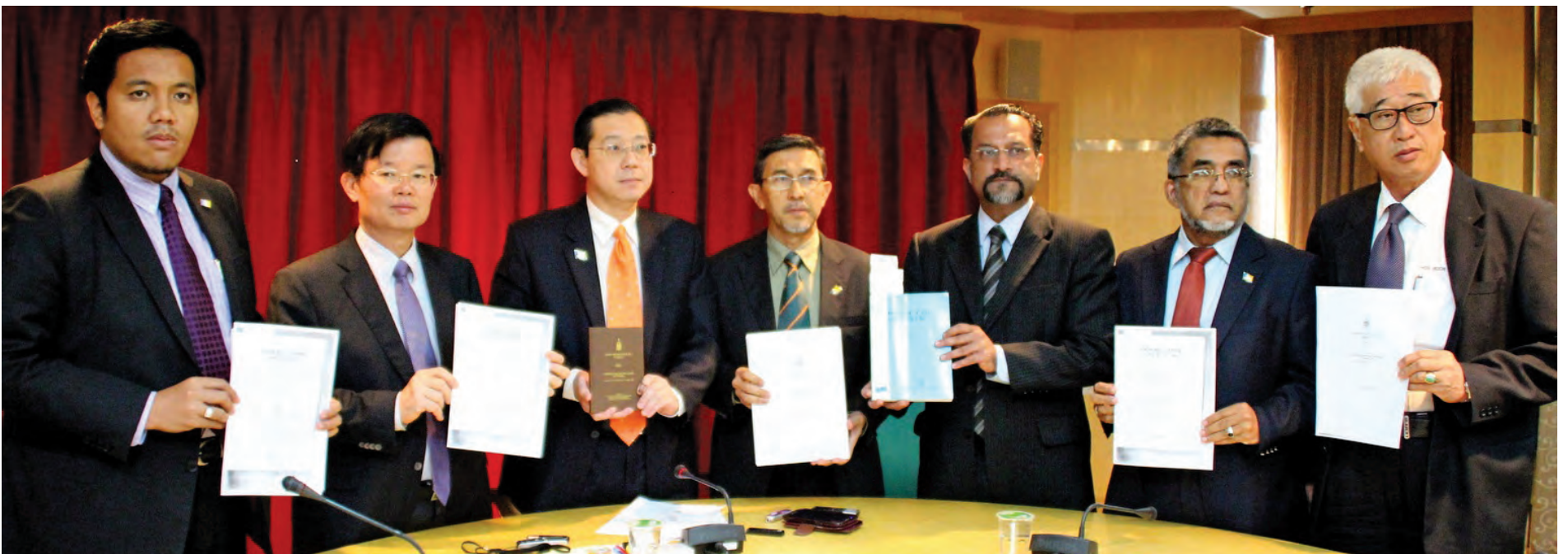
槟州行政议会一致通过议决，将致函警方及总检长，要求将使用刑事法典第121 (b) 条文对付闯入侵占州议会的滋事者，最高刑罚终生监禁。