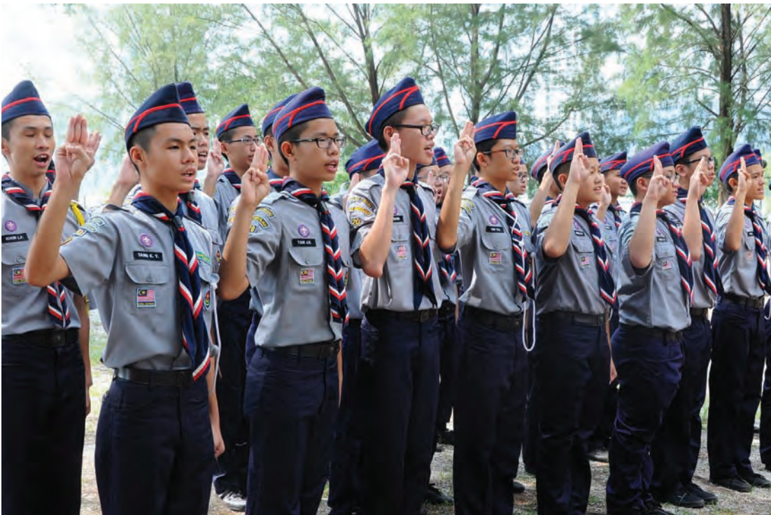
Scouts taking their pledge at the launch of the Special Scouts Agoonoree.