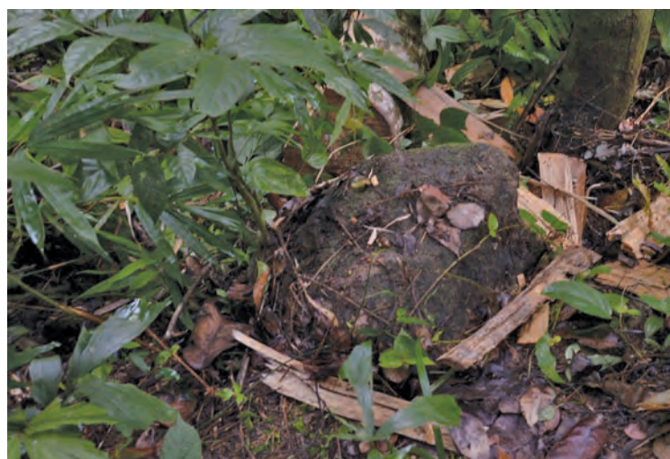
大山脚卓坤山沉香树遭非法砍伐的案件无法杜绝，国家森林局已展开“追踪沉香行动”，包括监督沉香树林，以及也会派员驻守森林内。

此外，也在威南山区逮捕7人，以及檳岛三区逮捕2人，多数是越南人，但也有柬埔寨人、泰国人及本地人。