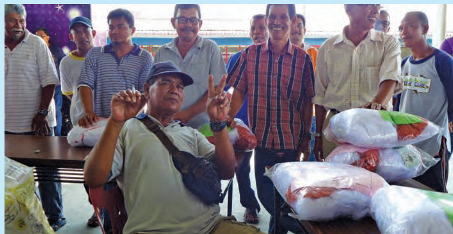
The fishermen from Batu Uban happily posing for Buletin Mutiara after getting their nets.

help them, they said: “We are appealing for help to repair the pontoon where our sampans are