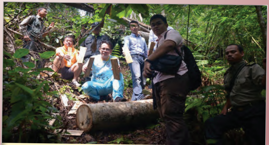
பினாங்கு மாநிலத்தில் சட்டவிரோத மரங்களை எதிர்க்கும் திட்டம் அமலுக்கு வருகின்றது.