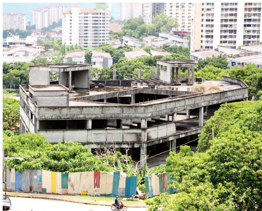
An overview of the abandoned project.

With the revived project at Majestic Heights, the closure of the foul-odour rubber factory and this new market, Paya Terubong is set to be a bustling township in future.