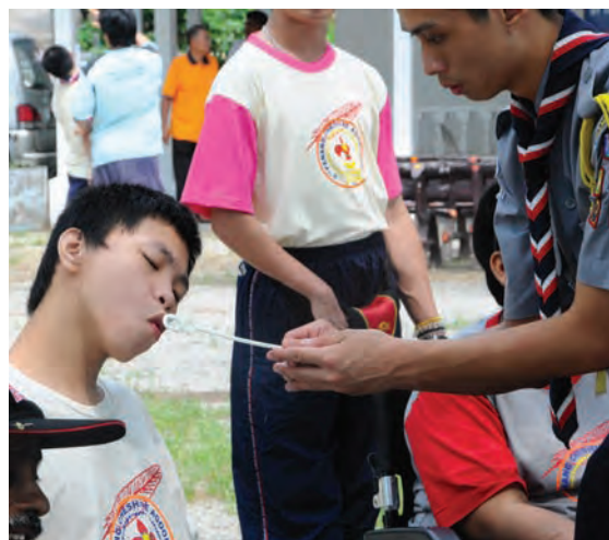
A scout from SMK Jalan Damai helping another scout member from the Cheshire Home blow some bubbles during the first day of the agooneree.

"Through this, we hope that our scouts learn to become self-reliant and to experience the world around us just like anyone else would. The agooneree also gives a chance for scouts present to interact with one another in the spirit of scouting,"