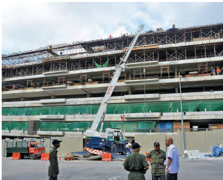
升旗山山脚多层停车场因地底巨石阻碍而拖延工程进度，该工程目前已完成65%，只剩下细节及顶部装修工程，预料可在8月31日前竣工并进行移交仪式。

他指出，升旗山山脚多层停车场外观设计独特，建筑建构上看起来并不像是一座停车场，可说