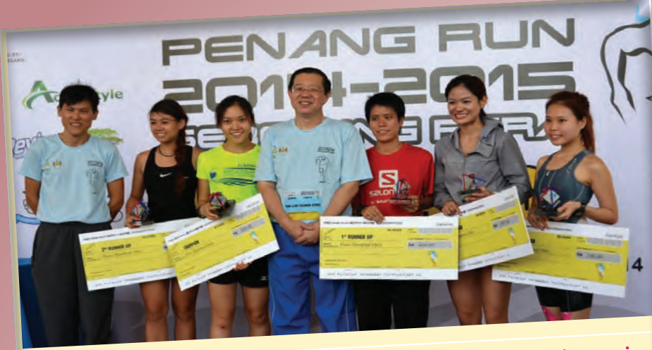
2014- 2015-ஆம் ஆண்டுக்கான பினாங்கு ஓட்டம் வெற்றியாளர்களுடன் பினாங்கு மாநில முதல்வர் மேதகு லிம் குவான் எங்.