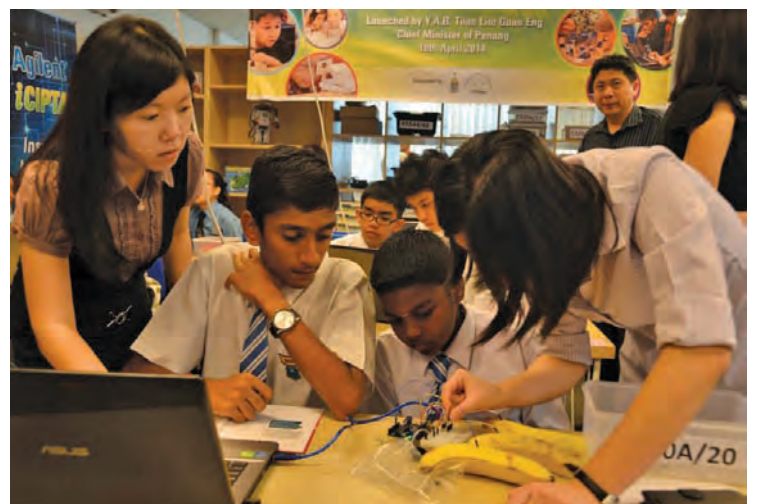
州政府已经采取三管齐下，栽培人才，每年拨款给学校，吸引世界级大学、与工业合作推广技职教育，以及学习中心及科学咖啡馆来强调理科、科技、数理及英文教学。（档案照）

“为了留住人才，槟城致力打造净、绿、安、康的宜居城市。槟州未来基础基金是另一项留住人才的努力，不只是槟城的人才也包括其它州的人才。州政府正多槟城州内外筹集资金。我们将在所有的法律及技术问题解决后公布详情。”