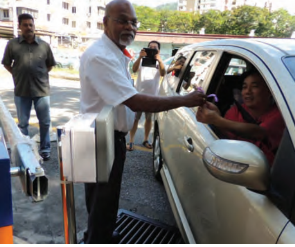
தாமான் ஜுப்லி பகுதி 2 குடிமக்களுக்கு Touch & Go வழங்கினார்

தாமான் ஜுப்லி பகுதி 2 நடுத்தர அடுக்குமாடி குடிமக்களுக்கு Touch & Go என்ற விரைவு அட்டை வழங்கப்பட்டுள்ளன. இந்த அடுக்குமடியில் 179 யூனிட் வீடுகள் உள்ளன. இந்தக் குடியிருப்பு வளாகத்தில் வாகனங்கள் நிறுத்துவதற்கு Touch & Go என்ற விரைவு அட்டையைப் பயன்படுத்தி உள்ளே நுழைய வேண்டும். எனவே இந்த அட்டைப் பயன்பாட்டிற்கு ஏறக்குறைய ரிம17,000 செலவிடப்பட்டுள்ளது. பொது மக்களின்