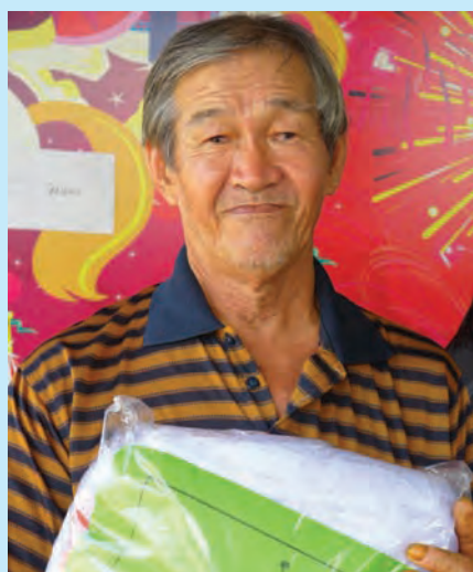
Loo said fishing is harder as the number of fishes have reduced in the last 10 years.

When asked if they have any requests from the state government to