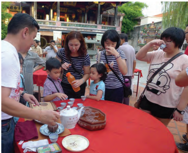
槟州茶艺文化协会亦现场让众人免费品茶。