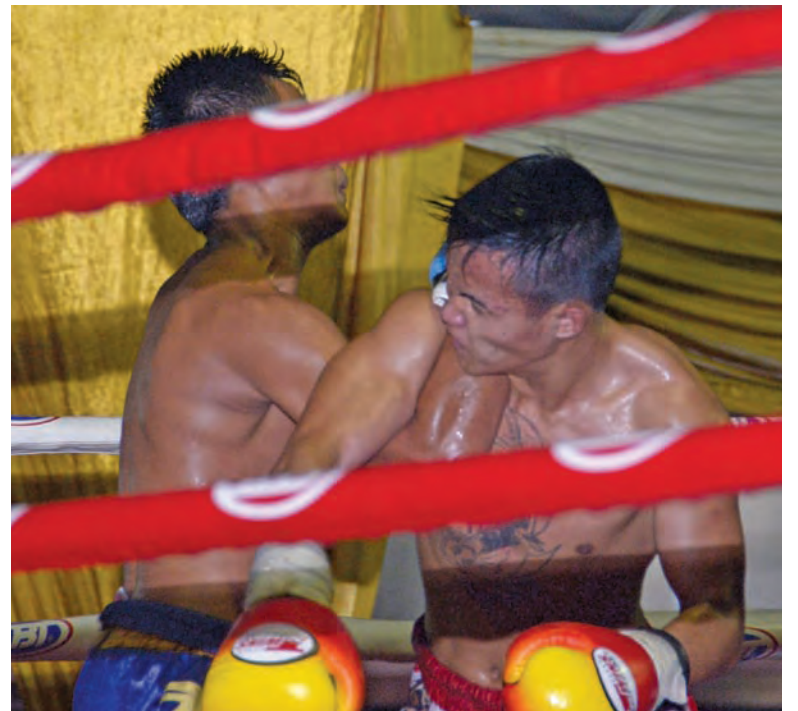
Muay Thai or Thai Boxing is held in Seberang Jaya and provides a lot of excitement for the people.