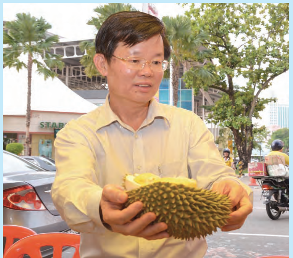
Chow showing off one of Penang's best delicacies - the durian.

Let's be part of the craze and surprised ourselves in how many different flavours and textures durian can come. Enjoy the local popular fruit as it satiates your cravings for this exotic fruit.