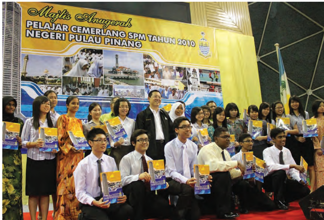
槟州行政议会已经批准成立槟州未来基础基金，并由私人捐献者或机构资助，以提供全额奖学金给所有聪明的马来西亚学生，留住人才。

人才，否则他们不会被外国公司接受。不幸地是，他们被500万个来自孟加拉、印尼、缅甸及越南的非技术劳工取代，外劳不只造成社会问题，也导致巨额外汇流失。”