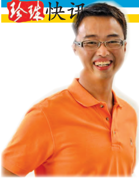
李凯伦 玛章武莫区州议员