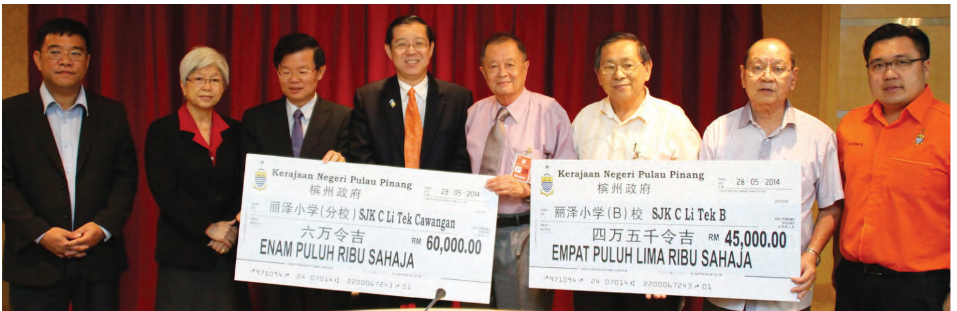
林冠英（左4）移交支票给丽泽B校及丽泽分校，并由丽泽学校董事主席潘俊明（右4）代表接领。

槟州首长林冠英指出，教育需要系统民主化，需要制度化拨款，而非有政治目的的季节性拨款，这样才能营造有教无类的教育制度、有绩效和卓越文化的教育水准。