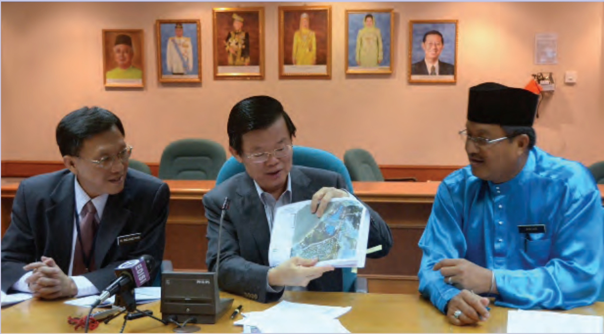
நீர் தூய்மைகேட்டுக்கு இலக்கான ஆறுகளைக் காண்பிக்கின்றார் ஆட்சிக்குழு உறுப்பினர் மதிப்பிற்குரிய சாவ் கொன் யாவ்.

பிணாங்கு மாநில மக்கள் கூட்டணி அரசாங்கம் நீர் தூய்மைகேட்டை நிவர்த்திச் செய்யும் வகையில் பல அரிய திட்டங்களை அமல்படுத்துகிறது. இத்திட்டம் கடந்த 28 மே 2014ஆம் நாள் மாநில ஆட்சிக்குழு கூட்டத்தில் விவாதிக்கப்பட்டது. பிணாங்கு மாநிலத்தில் சுமார் 164 ஆறுகள் உள்ளன. அதில் 8 ஆறுகள் மிக மோசமான நீர் தூய்மைகேடு ஏற்பட்டிருக்கிறது. அந்த 8 ஆறுகளும் தூய்மை செய்வதற்கு மாநில