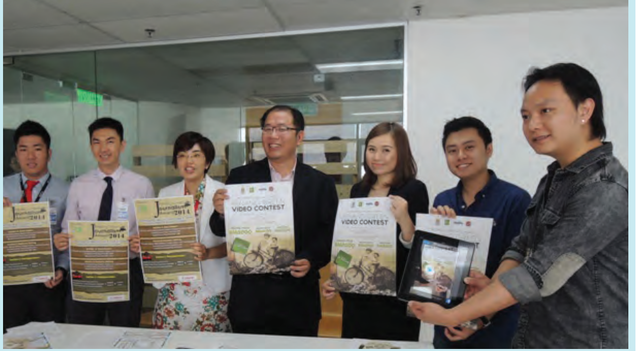
ஊடகவியல் விருது & பினாங்கு பசுமை வீடியோ போட்டி 2014 ஏற்பாட்டுக் குழுவினருடன் தஞ்சோங் நாடாளுமன்ற உறுப்பினர் ங் வேய் அய்க் (நடுவில்) புகைப்பட போட்டியின் துண்டுப்பிரசுரங்களைக் காண்பிக்கின்றனர்.

இந்த வருடத்திற்கானக் கருப்பொருளாக “Be the salution, ACCT now!” என்பதாகும். இந்த ஆண்டு ஊடகவியல் போட்டியில் புதியதாக புகைப்படம் ஊடகவியல் போட்டி இணைக்கப்பட்டுள்ளது. ஊடகவியல் போட்டியில் 3 பிரிவுகள் உள்ளன. முதல் பிரிவு செய்தி தயாரிப்பில், இரண்டாவது பிரிவு கட்டுரை எழுதுதல் மற்றும் மூன்றாவது பிரிவு புகைப்படம் ஊடகவியல் போட்டி ஆகும். முதல் இரண்டு பிரிவுகளில் மலாய் மொழி, ஆங்கில மொழி,