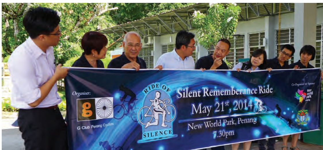
Sim (fourth from left) is a strong advocate of cycling in Penang.

RIDE of Silence is a global movement to increase awareness to share the roads with cyclists.