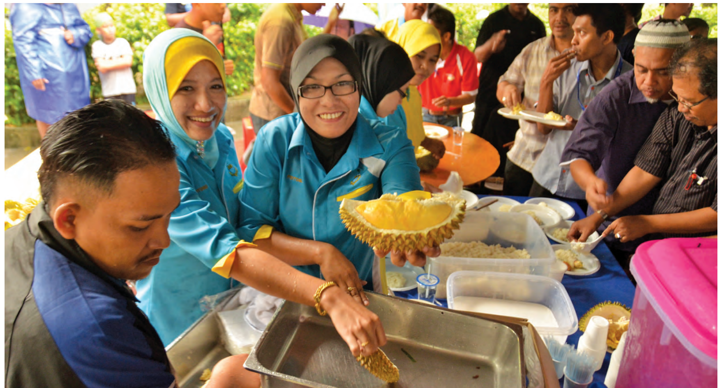
Durian lovers enjoying a feast at the Pesta Durian.