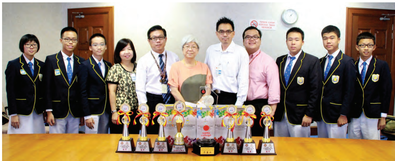
北海钟灵中学辩论队代表槟州出征砂拉越古晋第16届福联青全国中学生华语辩论赛勇夺冠军，槟州青年及体育委员会主席章瑛行政议员（左6）代表州政府颁发奖励金给辩论队，以示鼓励及表扬。

此外，他也非常感谢州政府及章瑛拨给他们的经费，因为有了这笔经费，让他们可以没有后顾之忧地去参赛。