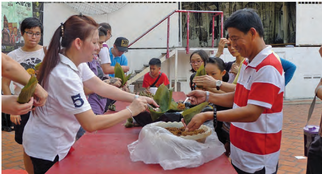
文艺达人巷首办端午节裹粽活动，短短两小时内既完成又送出150粒粽子。

文艺达人巷首办端午节裹粽活动，吸引多国游客前来尝试新体验，一晚既完成又送出150粒粽子。