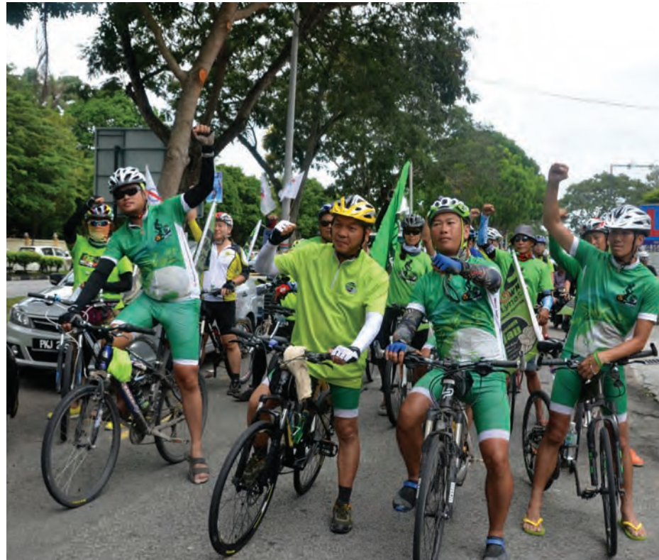
Activists from NGO group Himpunan Hijau are riding around Malaysia to spread awareness on 'Shutdown Lynas'.

"Under the terms of the issuance, as recommended by the International Atomic Energy Agency (IAEA) report, Lynas is required to submit the plan for the PDF (Permanent Deposit Facility)