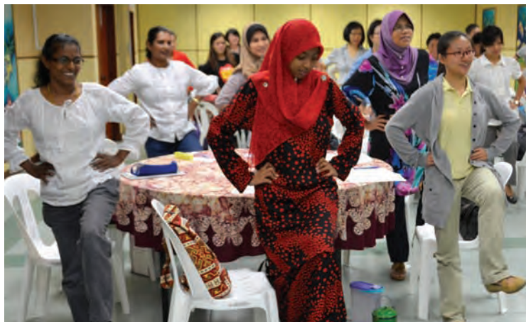
槟州妇女发展机构主办家庭式托儿所培训课程，以通过该课程在家庭、私人、公共和社区增加有素质的保姆，继而让更多女性可以投入职场。

“高昂的托儿所费用也成为女性无法在事业上取得更进一步的成就，这是一个全球化的现象。在檳城甚至是全马，我们面对高昂的消费也面对着很多女性被迫离职的