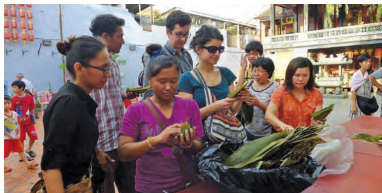
文艺达人巷裹粽活动吸引多国游客前来体验裹粽过程。

这项裹粽活动源于一项名为“亲子裹粽大作战”的比赛，由于主办当局所收到的参赛人数不理想，所以决定更换形式进行，所幸依然获得热烈响应，150粒粽子在两个小时内即完成并送出。