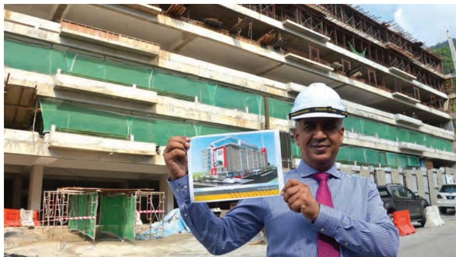
依斯甘达表示，升旗山山脚多层停车场已完成65%工程，相信在8月31日前能够把细节及顶部工程完成。