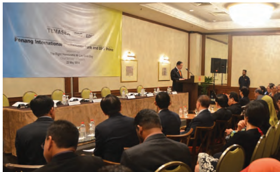
Lim (background) delivering his speech during the MOU signing ceremony.

"Penang International Technology Park (PITP) and BPO Prime with a size of 206.8 acres will be completed over the next five to 10 years," Chief Minister Lim Guan Eng said in his speech during the Memorandum of Understanding signing between Penang Development Corporation (PDC), Temasek Holding and Economic Development Innovations Singapore Pte Ltd (EDIS) held at George Town re-