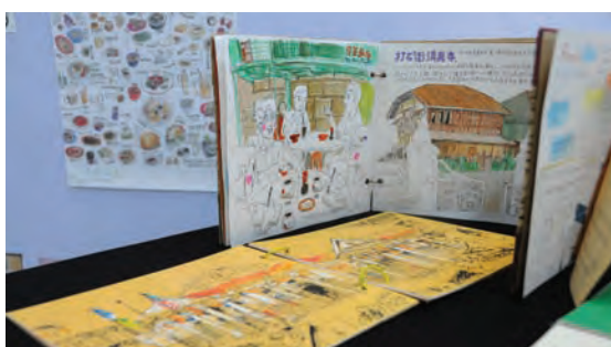
From postcards to booklets, artworks from the six Taiwanese and Hong Kong artists can be found at the "Sketches of Memories - Penang" Exhibition.

"Through the Hong Kong and Taiwan artists' sketches, we can observe that the things they sketched seem familiar to us; what used to be