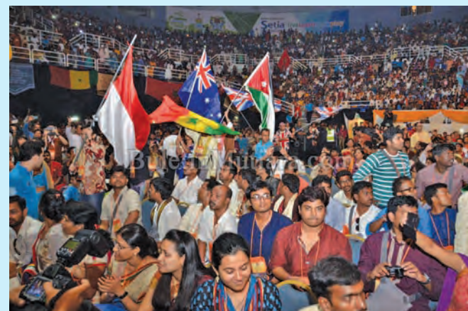
Some of the entrepreneurs who gathered at the convention held in SPICE.