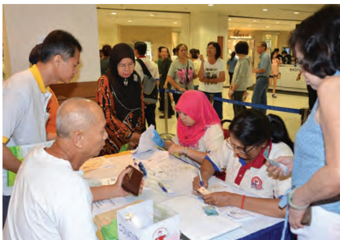
Penangites queue up for a blood screening for hepatitis A,B & C.

"To succeed, we need a strong and dynamic