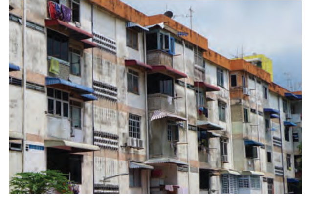
பொழிவுற்ற தாமான் துன் சர்டோன்