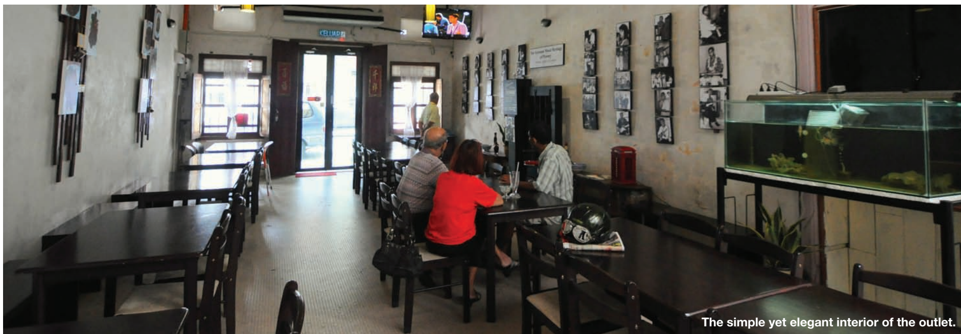
The simple yet elegant interior of the outlet.