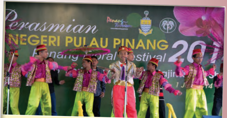
பினாங்கு மாநில பூக்கள் கொண்டாட்டம் திறப்பு விழாவில் பள்ளி மாணவர்கள் வரவேற்பு நடனம் ஆடினர்.