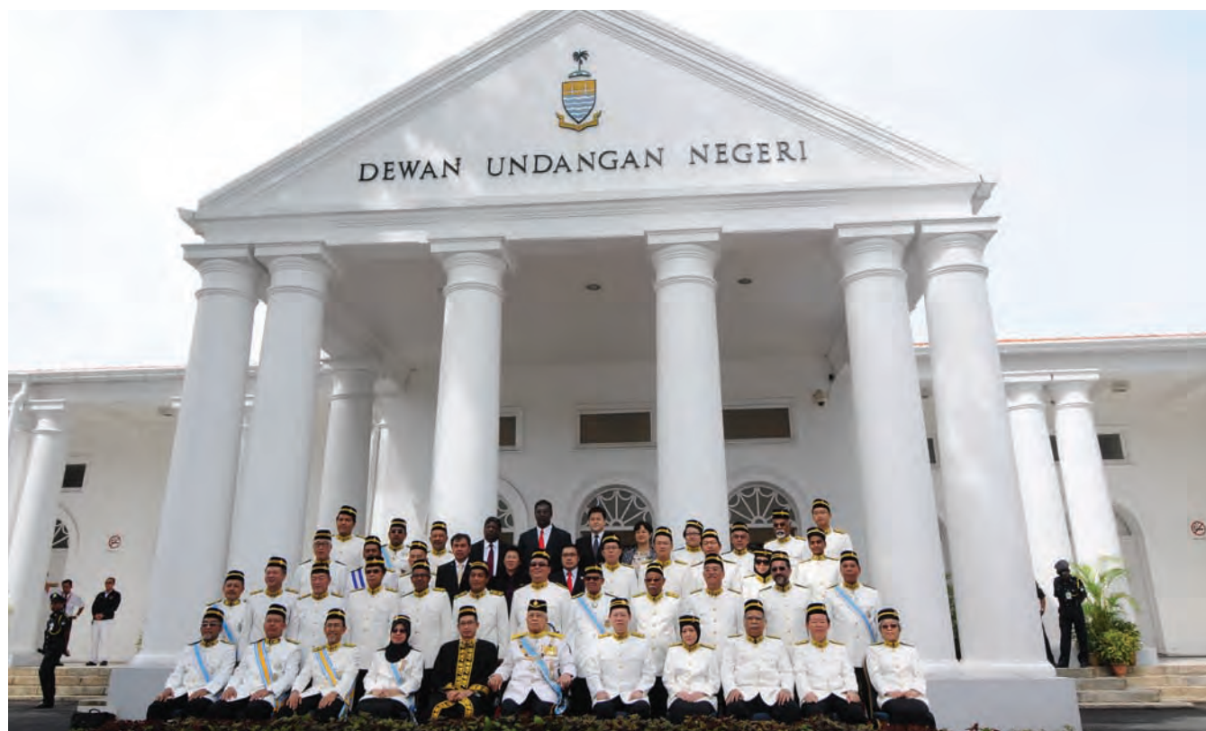
The Penang Government exco members and assembly members posing for a group photograph before the start of the 13th Penang State Assembly sitting.

A few highlights include the successful opening of the Sultan Abdul Halim Mu'adzam Shah Bridge (second Penang bridge), the increase of foreign investments in Penang from 2010 and 2013, the growing tourism industry sector and the state government's efforts to start its own light rail transit (LRT) system.