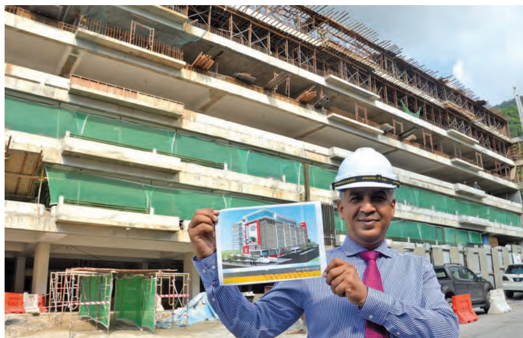
Iskandar speaking to reporters about the project.

After the press conference, he took reporters on a tour of the car park.