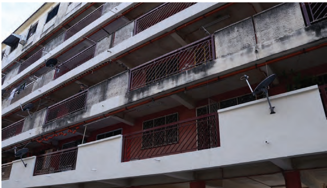
槟州政府将会拨出9万令吉，全面粉刷第五座组屋的外部，该粉刷工程预料会在3个月完成。