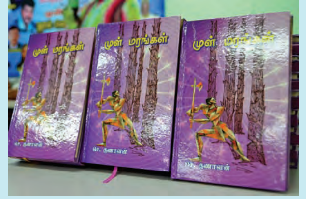
"முள் மரங்கள்" நூல்