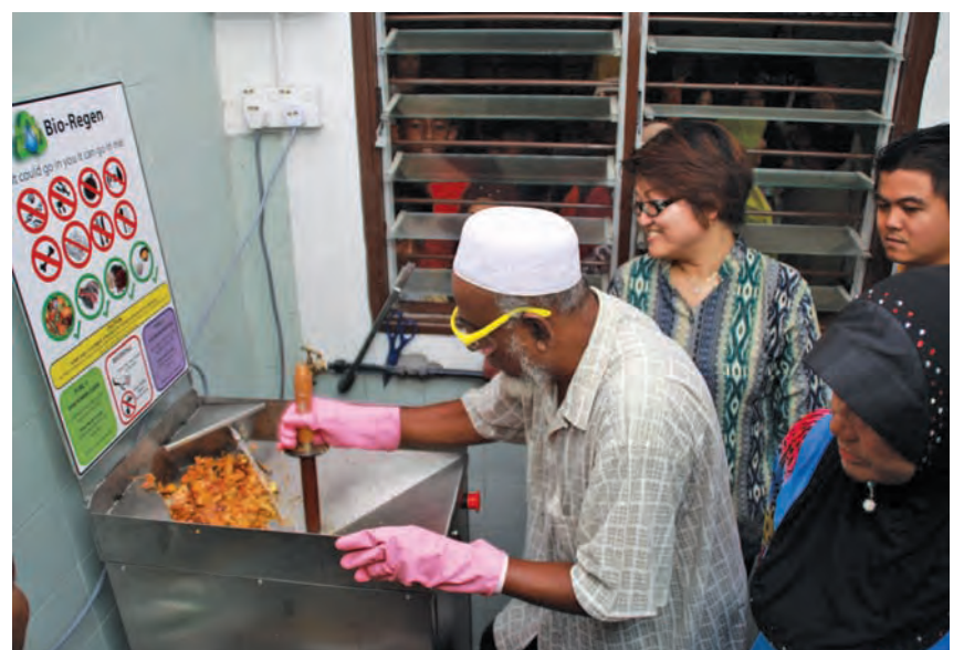
A resident of River Road low-cost flats showing assemblymember for Sungai Pinang Lim Siew Khim (second from left) how he turns food waste into fertiliser using the Bio-Regen machine.

Currently, the state government is developing incentive schemes to further encourage waste minimisa-