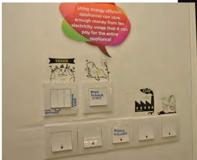
槟州绿色机构办公室的建筑概念，通过安装节能的电气设备装置来节能、采用自然透光及安装零氟氯烃的冷气机，来实践节能概念。

“为减低发展对环境带来的影响，槟州向往成为全马首个绿色州属落实绿色措施，例如成为全国唯一实行“无免费塑胶袋”行动、禁用保丽龙器具及土库街无车日的州属。我们以平均30%的再循环率（2013年9月）成为全国再循环率最高的州属。这些努力是为了减少温室气体和碳足迹并使槟城成为更加宜居和可持续发展城市的目标而实践的。”