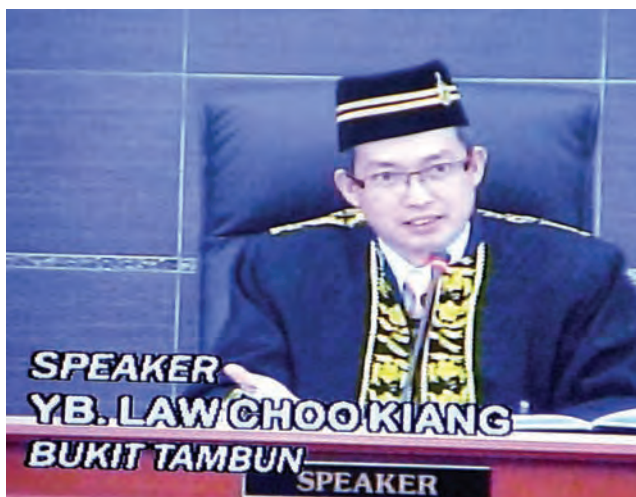
Law says he acted in accordance with the Standing Order.

"Stop treating the honourable assembly as a children's playground! I want to assert that neither the police nor the AG, without the agreement of the Speaker, can act against any state