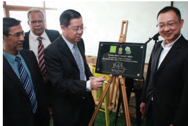
பினாங்கு பசுமை கழகத்தின் புதிய அலுவலகம் திறந்து வைத்தார் மாநில முதல்வர் மேதகு லிம் குவான் எங் அவர்கள். (அருகில் பினாங்கு மாநில முதலாம் மற்றும் இரண்டாம் துணை முதல்வர்கள்)

தொடங்கப்பட்டதையும் சுட்டிக் காட்டினார். பினாங்கு பசுமை கழகம் பல சவால்களைச் சந்தித்து வெற்றிகரமாக மலேசியாவில் முதல் பைலட் திட்டத்தை அமல்படுத்தி அதற்காக தங்க சான்றிதழ் பெற்றிருப்பதை மதிப்பிற்குரிய மாநில முதல்வர் பாராட்டினார்.