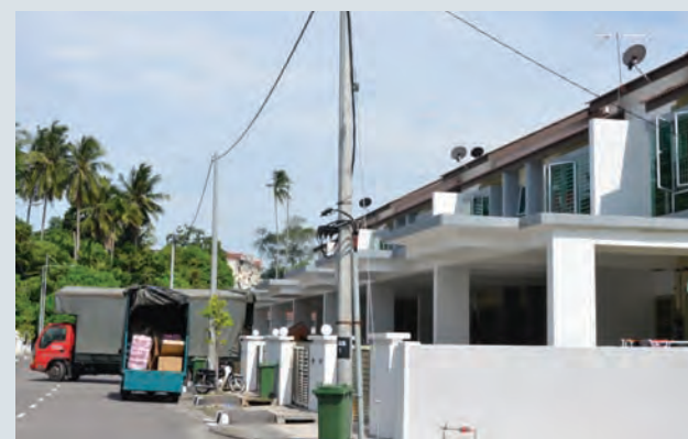
Some of the houses rented out to foreigners.

He added that he had lodged three police