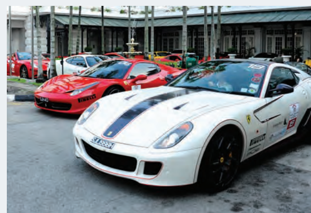
A shot of some of the Ferraris before the flag off, bound for Krabi.

IF you happened to be driving on the North-South Expressway on June 20 and caught a glimpse of fast moving luxury cars, overtaking you at top speed while remaining within the speed limit, you probably witnessed the Ferrari Owner's Club on their annual drive.