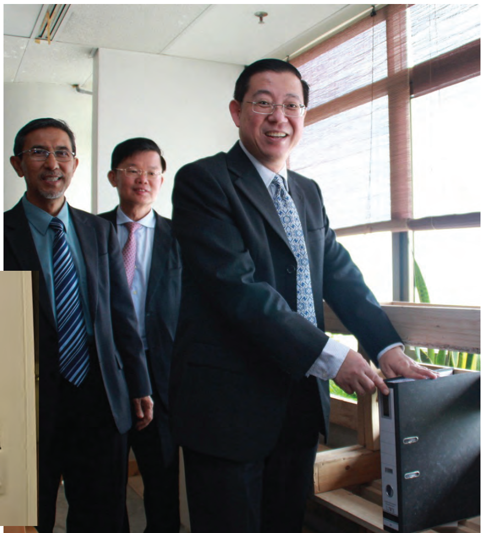
槟州首长林冠英（右）试用书架。旁为槟州第一副首长拿督莫哈末拉昔（左）及槟州地方政府委员会主席曹观友行政议员。