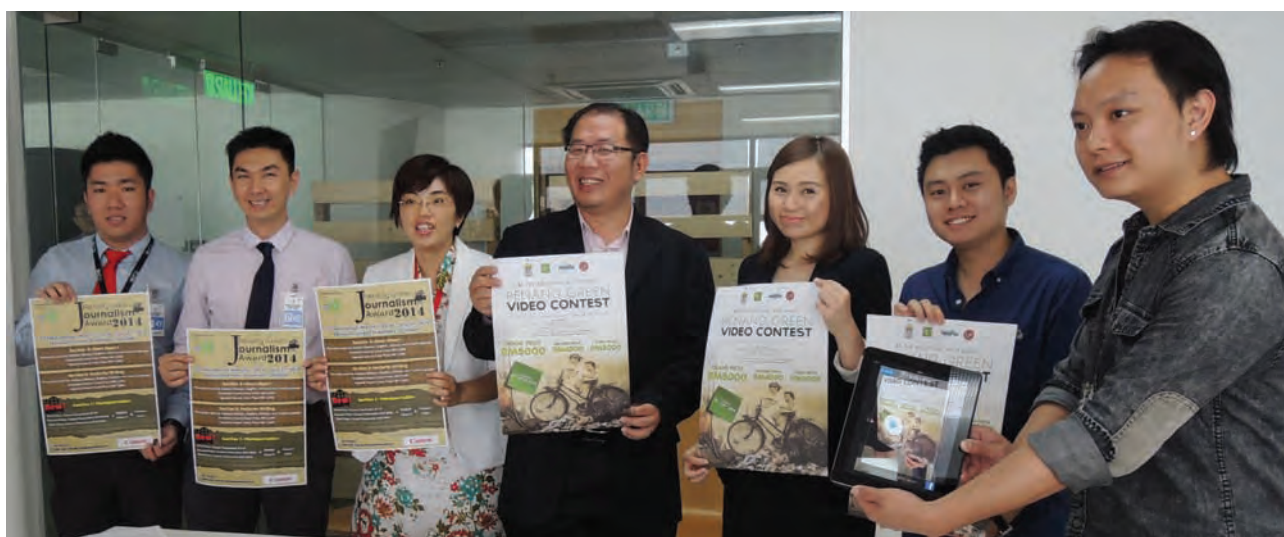
Ng(centre) and the team ready to give their best in making the contests a success.

In 2013, PGC received 19 entries for the Journalism Award and 27 videos for the Video Contest.