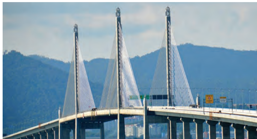
File pix of the Jambatan Sultan Abdul Halim Mu'adzam Shah (SAHM).