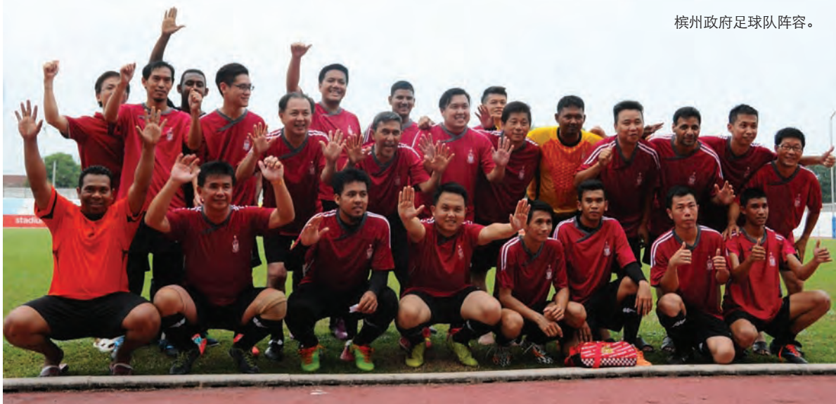
槟州政府足球队阵容。