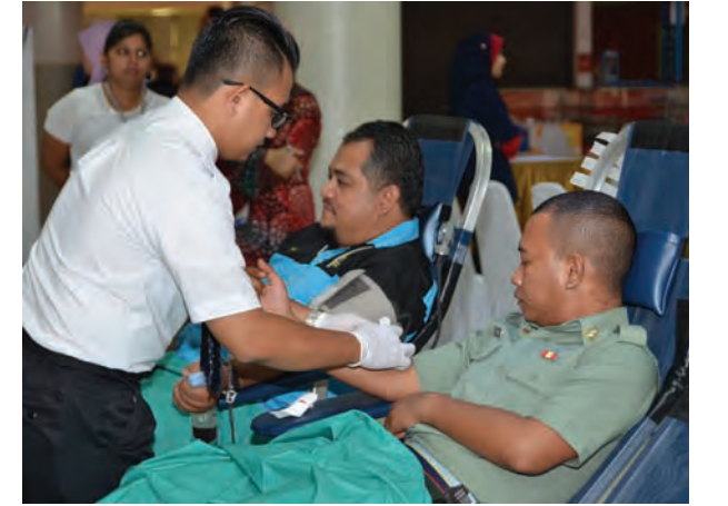
ரத்த தானம் முகாமில் கலந்து கொண்ட பொதுமக்கள்