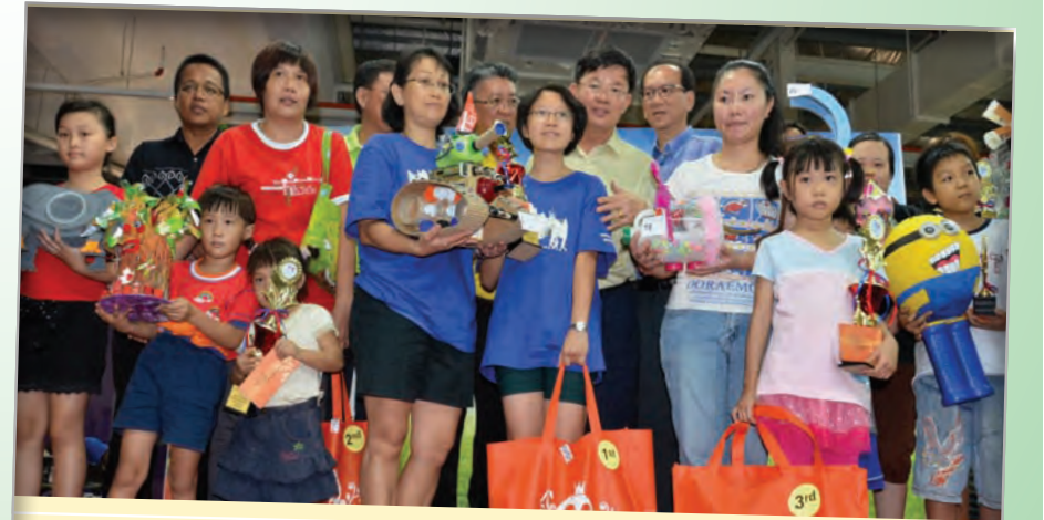
மறுசுழற்சி கண்காட்சியில் பொதுமக்கள் கலந்து கொண்டு படைப்புகள் உருவாக்கினர்.