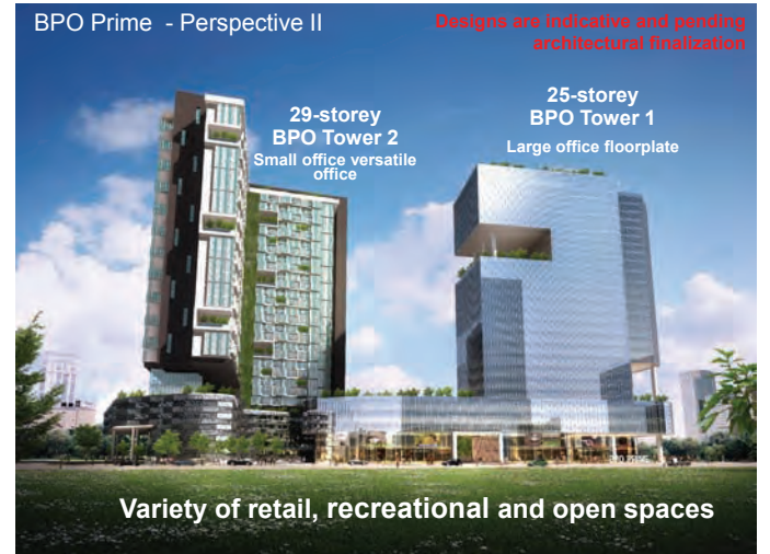
商业流程首要外包中心设计图。

面积的一半土地，其余皆为空地，网球场或苗圃。这项业务流程外包计划将充分利用土地，作为居家办公室(SOHO)及办公大楼。”