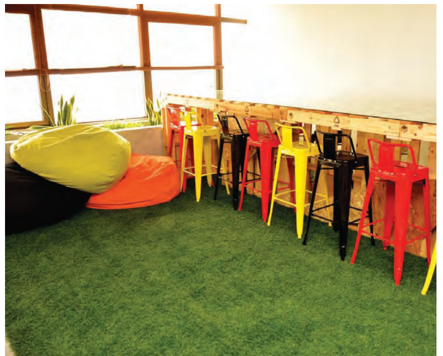
获得绿色建筑指标室内评分工具金级认证的槟州绿色机构办公室，成为全马首个根据绿色建筑指标，来规划及建造的绿色办公室先锋。