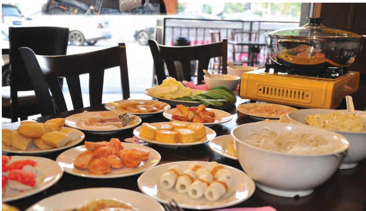
Variety of platters that could tantalise your taste buds.