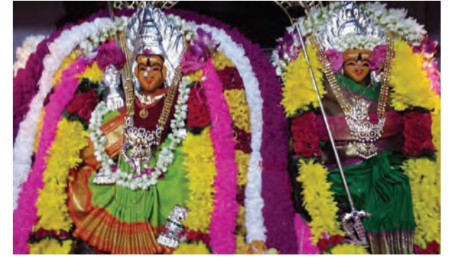
மூலஸ்தானத்தில் அமர்ந்து பக்தர்களுக்கு இரட்டிப்பு மகிழ்ச்சியையும் அருளையும் வழங்கும் ஸ்ரீ காளியம்மனின் அருள்மிகுந்த திருவுருவ விக்ரகங்கள்

வழங்கப்பட்டன. வண்ண இரதத்தில் பவனி வந்த ஆத்தாவிற்குப் பக்த கோடிகள் தேங்காய்கள் உடைத்தும் தீபாராதனை எடுத்தும் அவரின் திருவருளைப் பெற்று மகிழ்ந்தனர். இரவு 9 மணியளவில் இரதம் கோவிலை வந்தடைந்ததும், பக்தர்கள் அம்மன் முன்னிலையில் தீ மீதித்தும் பால் குடங்களை ஏந்தி தீக்குழியைச் சுற்றி வந்தும் தங்கள் வேண்டுகளை நிறைவேற்றினர். சிறப்புப் பூஜைகளுக்கும் அர்ச்சனைகளுக்கும் பிறகு கோவிலில் அன்னதானமும் வழங்கப்பட்டது. ஸ்ரீ காளியம்மன் கோவிலின் திருவிழா மிகவும் கோலாகலமாக நடைபெற்று இனிதே முடிவுற்றது.