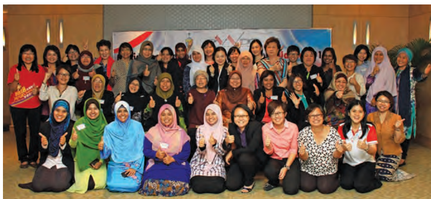
Participants at the conference agree that equality for women is progress for all.

It is important to raise the awareness of women and men on the gender gaps, the norms and stereotypes that perpetuate women's subordinate status and the benefits that a more equal balance of power will bring to the nation as a whole.