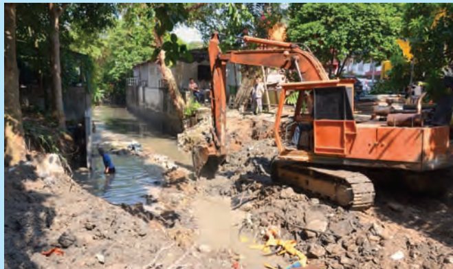
日落洞河在晶城公寓盖建时因水利灌溉局给予承包商错误的规格，因此州政府下令水利灌溉局展开修正及提升工程预期6个月内完成工程。

他提及，修正及提升工程竣工后，将有助于舒缓该区雨季时河水高涨所面临的闪电水灾。日落洞下游河是与双溪槟榔河连接，而槟州治水委员会主席曹观友行政议员也向联邦政府致函双溪槟榔河流第2期治水计划工程，希望得到联邦政府正面回应。