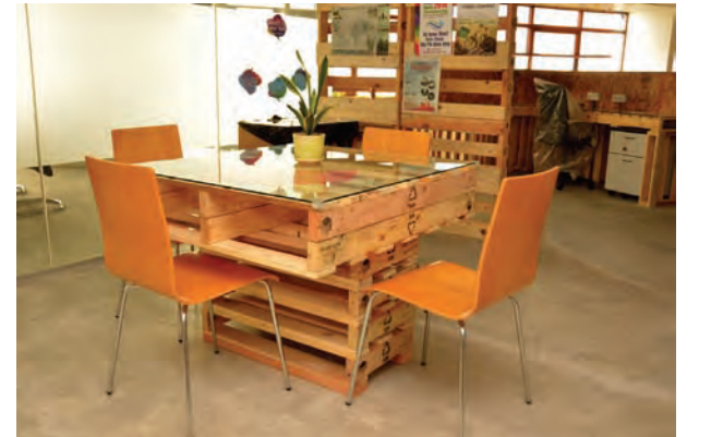
படம் 2: மறுசுழற்சி மர பலகைகளால் நிறுவப்பட்ட மேசைகள்.

இந்த அலுவலகம் இயற்கை வளங்களை பயன்பாட்டுடன் கான்கிரீட் தளங்கள், மர பலகைகள் கொண்ட சுவர் மற்றும் மறுசுழற்சி பலகையால் செய்யப்பட்ட மேசைகள் போன்றவற்றுடன் நிறுவப்பட்டுள்ளது. அதோடு, இந்த அலுவலகம் குறைவான எரிசக்தி பயன்பாட்டுடன் அதனை சேமிக்கும் வகையில் வடிவமைக்கப்பட்டுள்ளது. மாநில முதல்வர் பொது மக்களும் விழிப்புணர்வுடன் சுற்றுச்சூழலில் குறிப்பிடத்தக்க மாற்றங்களை கொண்டுவர வேண்டும் என வலியுறுத்தினார். இந்நிகழ்வில் பினாங்கு மாநில ஆட்சிக்குழு உறுப்பினர், சட்டமன்ற உறுப்பினர்கள் மற்றும் பலர் கலந்து சிறப்பித்தனர்.