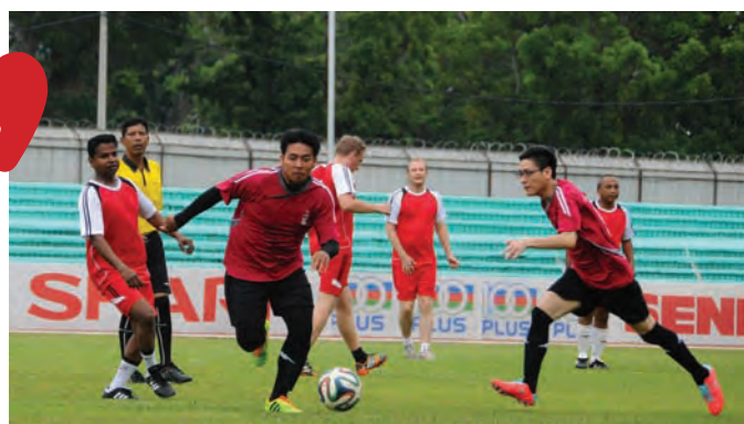
升旗山国会议员再里尔（右1）卯足全力，只为“一分都不能少”。