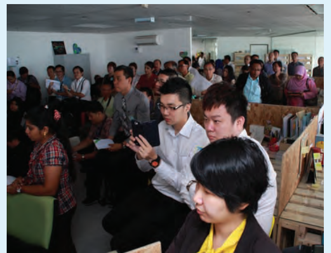
A shot of the crowd that gathered for the PGC office opening on the 46th floor of Komtar.

The office is also equipped with motion sensor lighting and energy as well as water-saving appliances, in