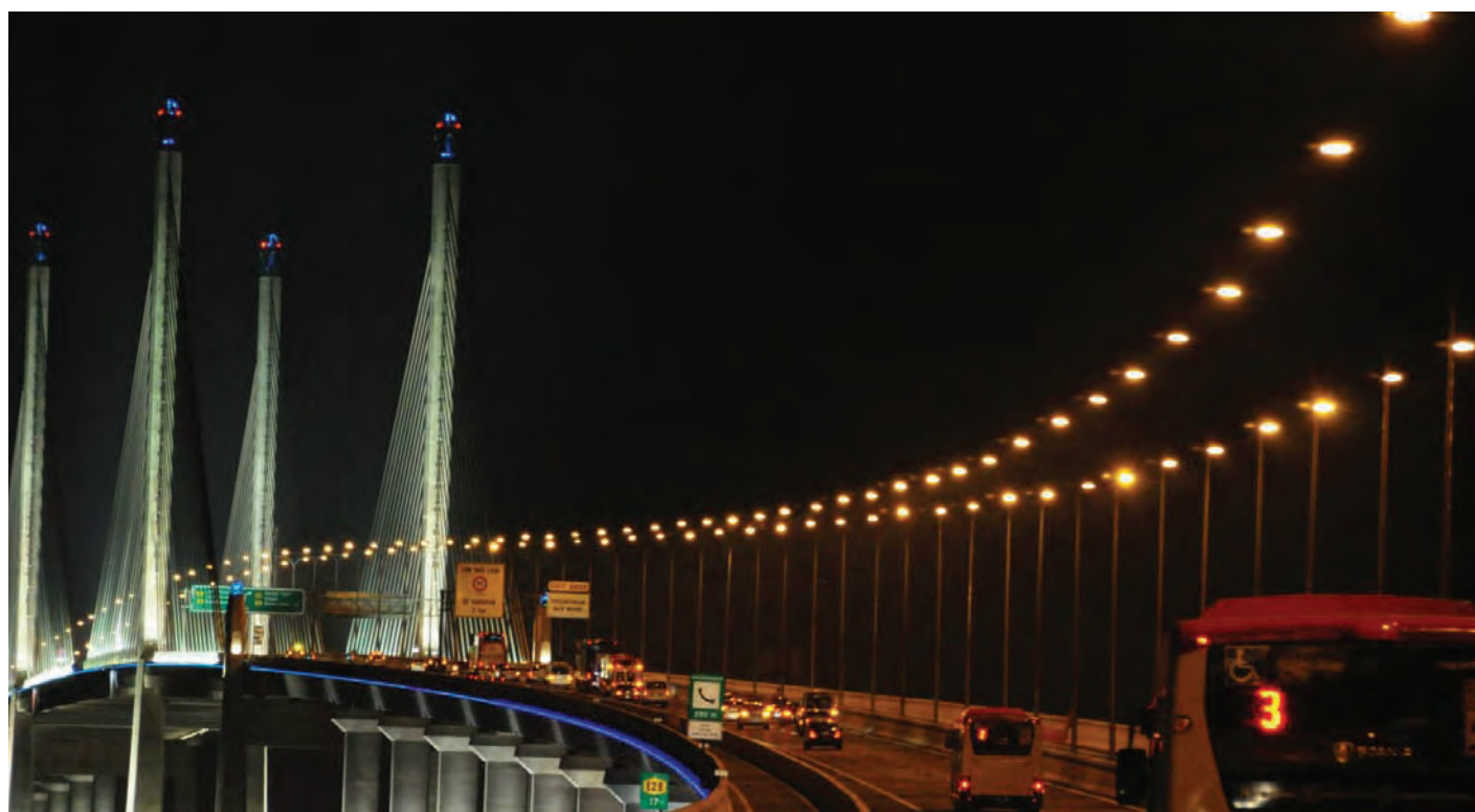
槟州首长林冠英提问，如果苏丹阿都哈林慕阿占沙大桥不像第一大桥，让槟城的“一触即通”卡持有人享有20%折扣优惠，国阵政府要如何声称他们是以民为本？（档案照）

“再说，在苏丹阿都哈林慕阿占沙大桥，电单车的过桥费为1令吉70仙，较第一大桥的1令吉40仙还要高。在第一大桥，槟城的“一触即通”卡持有人还享有20%折扣，也即是电单车只需给1令吉12仙，汽车则是5令吉60仙（若没有槟城的“一触即通”卡则7令吉）。两座大桥之间差异太大的过桥费，将无助于减缓在槟城第一大桥的交通阻塞。”