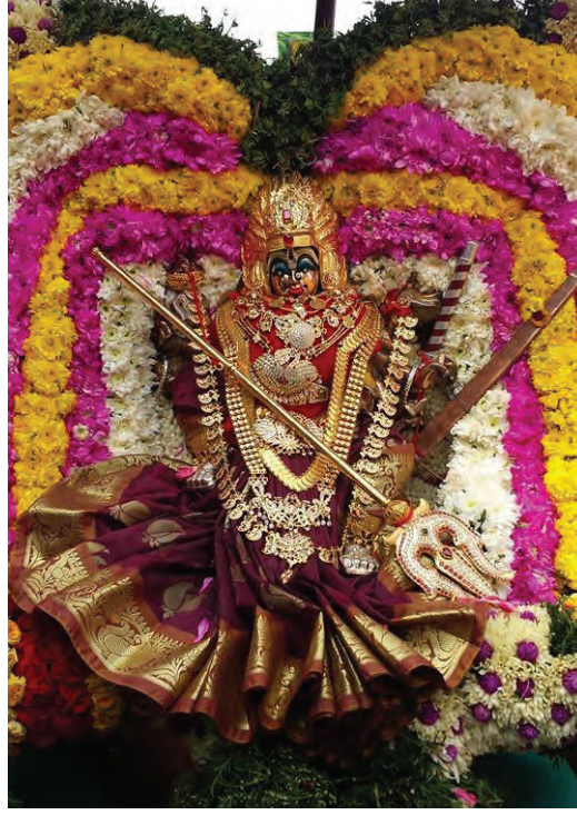
உபய நாளில் அம்சமாக அலங்கரிக்கப்பட்ட காளியம்மனின் அழகிய திருவுருவம்.

தீமீதித் திருவிழா நாளன்று அதிகாலை 1.00 மணி முதல் பக்தகோடிகள், பால்குடம், பால்செம்பு, காவடி, தீச்சட்டி ஏந்தியும் அங்கப்பிரதச்சனை செய்தும் தங்கள் நேர்த்தி கடன்களைச் செலுத்தினர். அம்மனுக்கு அபிஷேகம் முடிவடைந்ததும் யாகங்களுடன் சிறப்புப் பூஜைகள் நடைபெற்றன. கோவில் கரகப் பூசாரி சிறப்புப் பிரார்த்தனை, பூஜைகளை மேற்கொண்ட பின், விறகு கட்டைகளை எரித்துத் தீக்குழியைத் தயார் செய்தார். அதன் பின் வீதி ஊர்வலமாகச் சென்று பக்தர்களுக்கு அருள் புரிய அம்மாவின் வண்ணமயமான இரத ஊர்வலம் காலை 11.30 மணியளவில் கோவிலைவிட்டுப் புறப்பட்டது.