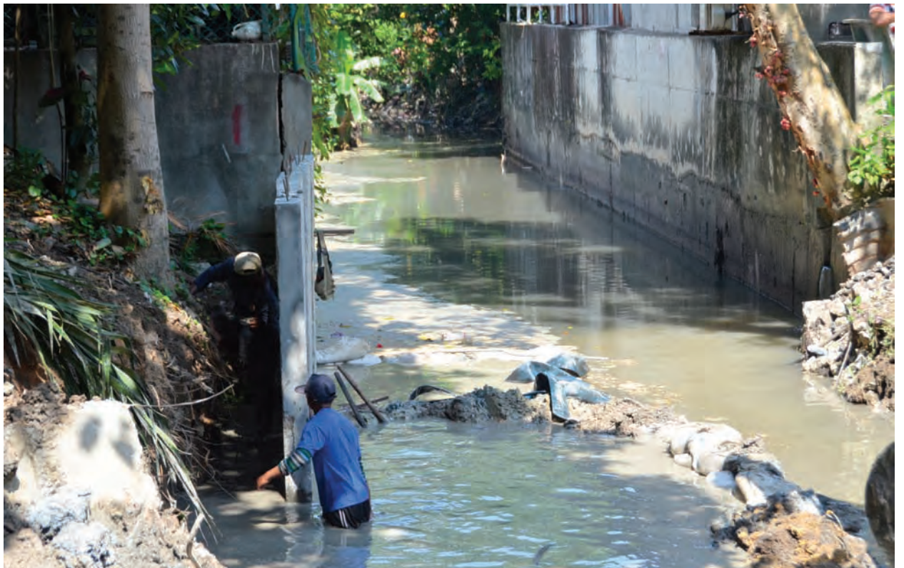
Flood mitigation works being carried out and expected to be completed by November.

“Under the Flood Mitigation Project Phase II