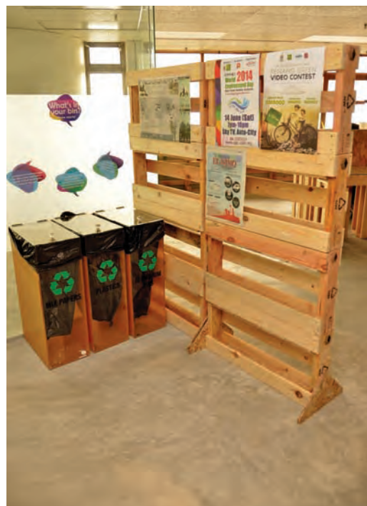
槟州绿色机构办公室采用的家具也是再循环家具，而办公桌则是采用再循环使用的运输托板。