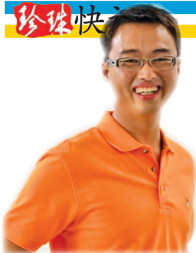
李凯伦 玛章武莫区州议员