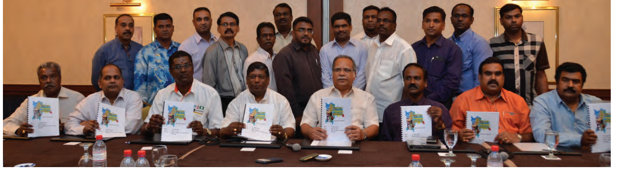
படம் 1: பினாங்கு அனைத்துலக தமிழ் மாநாடு சந்திப்புக் கூட்டத்தில் கலந்து கொண்ட அரசியல் தலைவர்கள் மற்றும் பிரமுகர்கள்

பினாங்கு தமிழர் முன்னேற்ற இயக்கம் ஏற்பாட்டில் உலகத் தமிழர்களைப் பற்றிய அனைத்துலக மாநாடு “அடையாளத்தைத் தேடி” என்ற கருப்பொருளில் எதிர்வரும் 7,8 மற்றும் 9 நவம்பர் 2014 ஆகிய நாட்களில், பினாங்கு ஜோர்ச்டவுனில் அமைந்துள்ள பேய்வியூ தங்கும் விடுதியில் நடைபெறவுள்ளது. இந்த மாநாட்டில் அடையாளம், அமைதி, நீதி மற்றும் ஜனநாயகம் ஆகிய விவகாரங்களில் உலகத்தமிழர்கள் தற்காலத்தில் எதிர்கொள்ளும் பல்வேறு சவால்களை விவாதிப்பதே