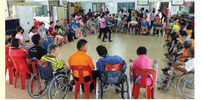
படம் 2: சேஷையர் கருணை இல்லத்தினர் விளையாட்டுகளில் கலந்து கொண்டு அகம் மகிழ்ந்தனர்