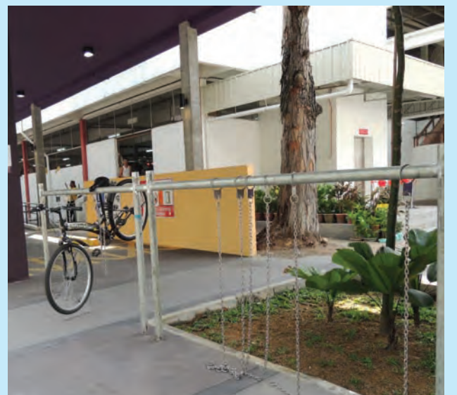
槟岛市政局耗资126万令吉进行峇都兰樟巴刹提升工程，以符合各阶层人士的使用需求。

檳島市政局通过公开招标，由承包商UBAHAN SELERA有限公司以79万9999令吉为峇都兰樟巴刹增设2架升降机。该升降机是前后门运作，方便各阶层使用者；Naz Infra工程有限公