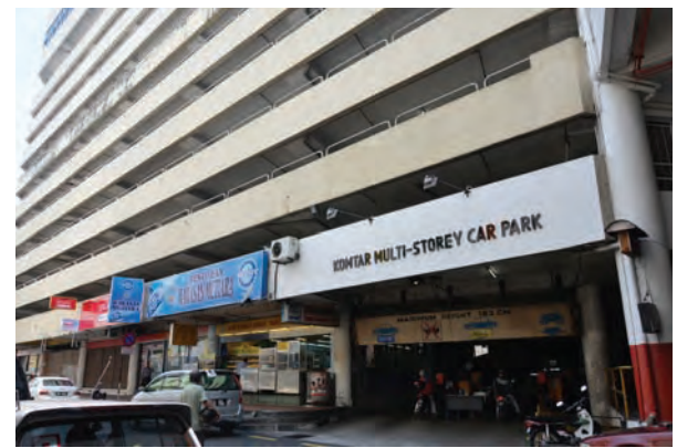
படம்: கொம்தார் பல மாடி கார் நிறுத்துமிடம்

கொம்தார் கார் நிறுத்துமிடம் காலை மணி 7.00 தொடங்கி இரவு மணி 10.30 வரை பொதுமக்கள் வசதிக்காகத் திறந்திருக்கும். இக்கட்டடத்தில் தலா 580 மோட்டார் சைக்கிள்களும் 288 கார்களும் நிறுத்தமுடியும். மேலும் இந்தப் பகுதியில் ஒரு மாடி கூடுதலாகக் கட்டப்படவுள்ளது. இதில் உணவகங்கள் வியாபார கடைகள் அமைக்கப்படும். பினாங்கு மாநில அரசு மக்களின் அன்றாட செலவீனங்களைக் குறைக்கும் பொருட்டு இந்த நடவடிக்கை மேற்கொள்ளப்பட்டது. கீழ்க்காணும் அட்டவணை வாகனக் கட்டணத்தில் ஏற்பட்டுள்ள மாறுதல்களைச் சித்தரிக்கிறது.