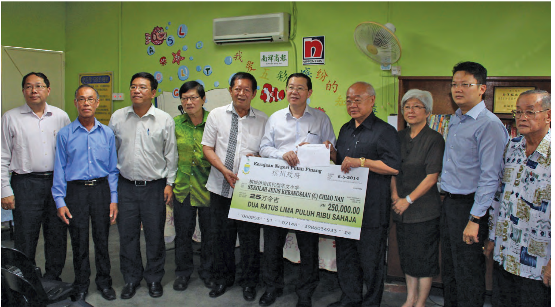
林冠英（右5）移交拨款模拟支票给林玉唐（右4）。

亚依淡侨南小学的校舍使用超过50年，因悠久历史而陈旧不堪，而且学生活动空间也受到限制，因此，槟州政府拨款25万令吉给该校重建新校舍，兴建5栋3层楼建筑物。