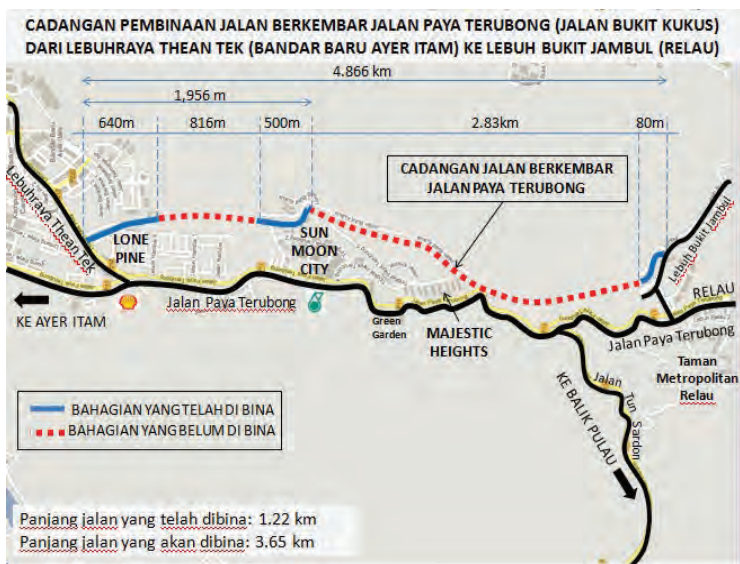
暂时命名为米桶山路的平行公路的衔接路线

他说，计划路程长4.87公里，其中1.22公里已竣工，至于建议中的新路仍有816公尺未兴建。