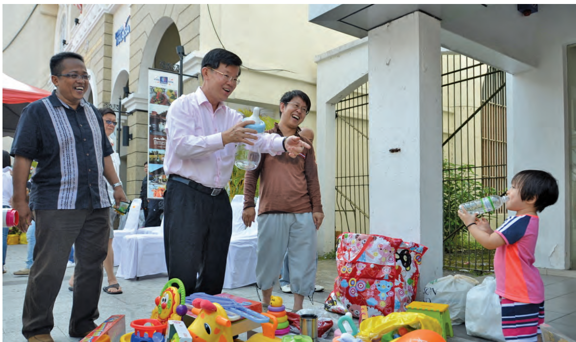
Chow exchanging pleasantries with this very young barter trade participant.

THE recent Earth Day Barter Trade 2014 celebration held in Lebuh Pantai Penang on April 27 was the third organised by Penang Green Council (PGC).