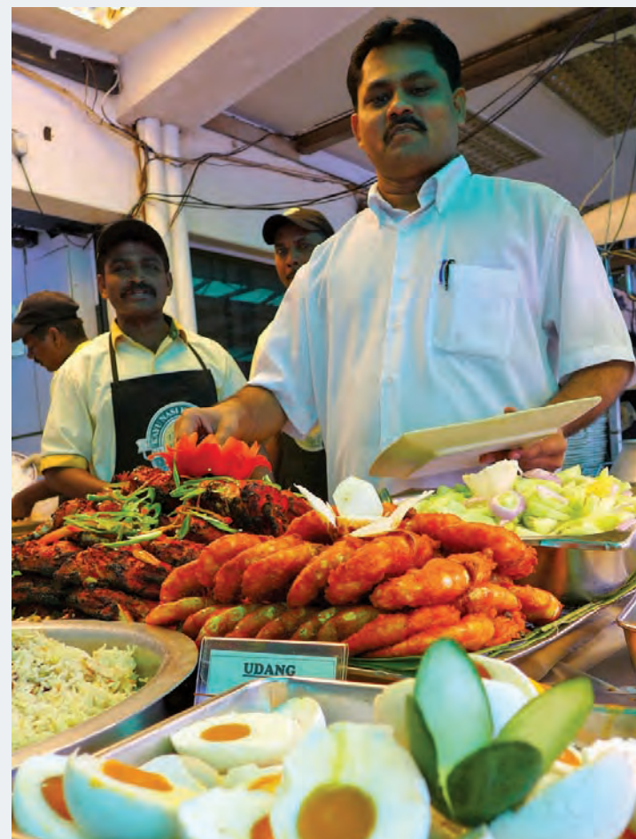
Nasi kandar from Kayu is on the ‘Must Eat’ foods in Penang and now halal certification has enhanced the famous shop.

that all these have been taken care of in a proper way.”