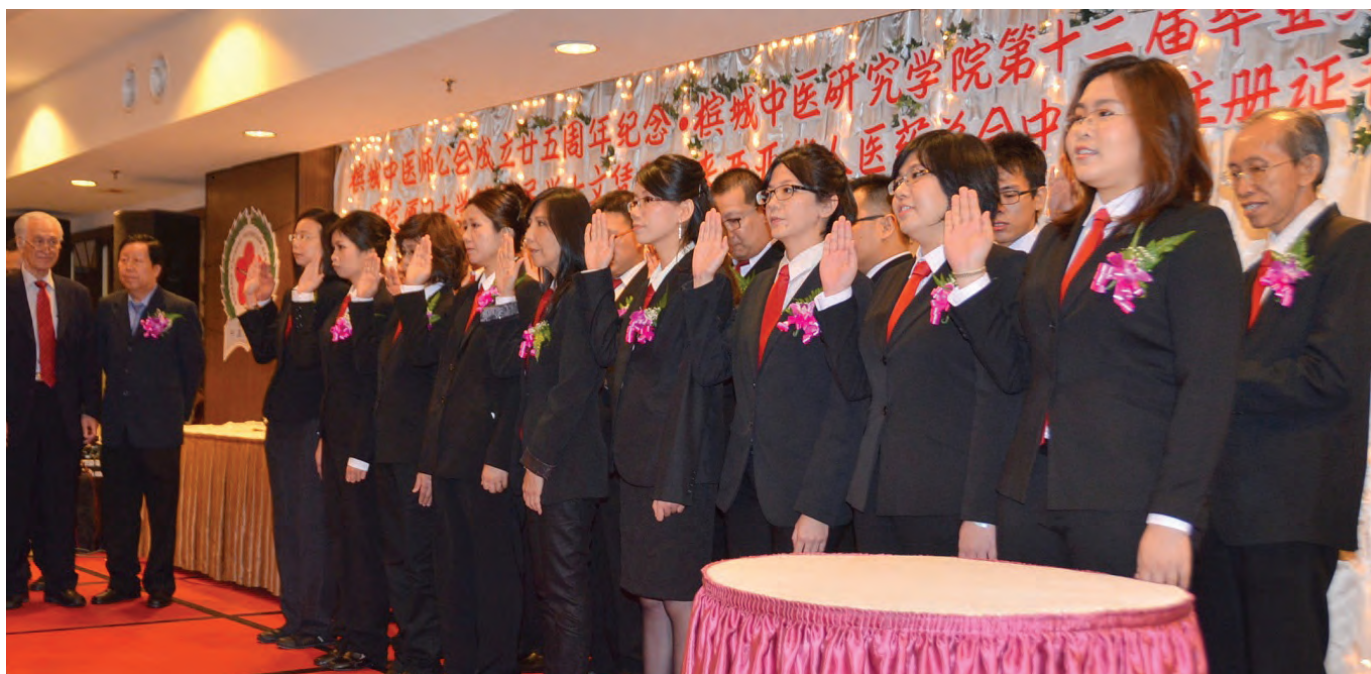
槟城中医医师公会在庆祝第25周年纪念的同时，也是中医研究学院第12届学员毕业典礼。

最终被曹操杀死，曹操把华佗杀掉，也造成中国比西方早千多年的外科手术失传了。所以我们不能像曹操一样，我们要珍惜人才，不然一不小心我们可能会让一门人类重要的技术消失在地球上。”