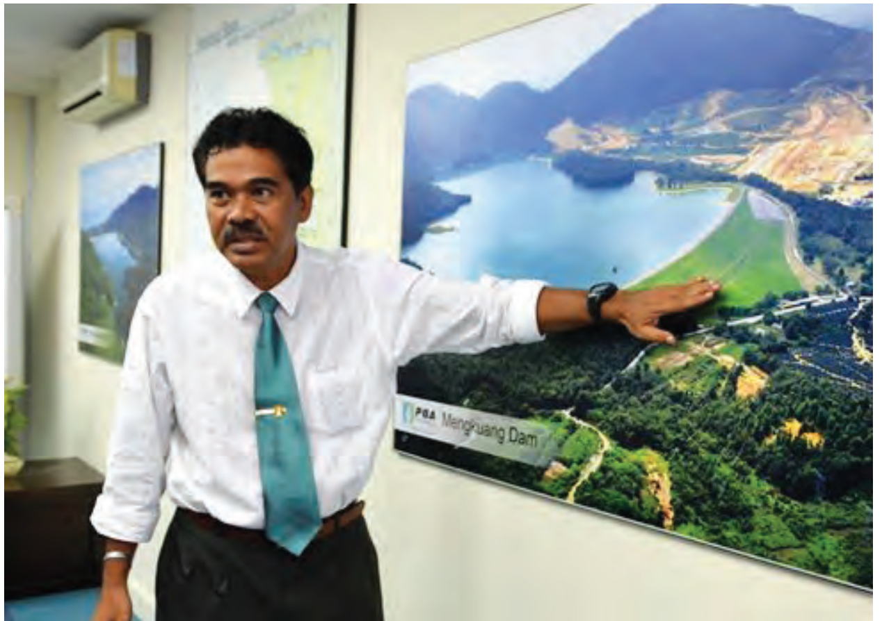
查瑟尼强调，槟州供水机构调整水费的主要目的是为了提醒槟州人民减少用水，以确保槟州可持续供水至2050年，同时不会造成低收入一族的负担。

他强调，这是配合州政府“勿造成低收入一族或勿惩罚谨慎用水的消费者”指示。20立方米至40立方米的涨幅是9.5%，家庭用水用户中，使用超