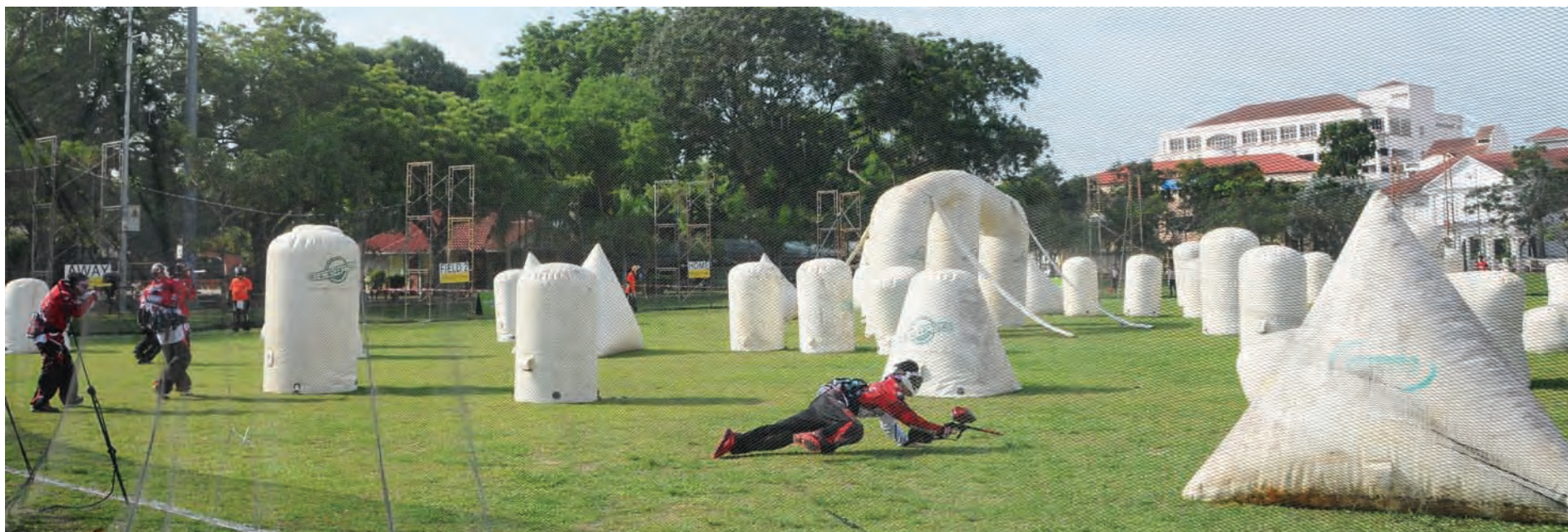
It was great action as 44 Paintball teams from near and far came to Padang Kota Lama to compete in the second YDP Paintball Cup.