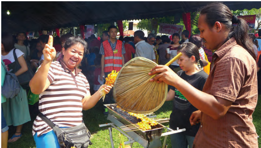
The fragrance of satay grilling on charcoal fire filling the air at the Eden Handicap Food Fair.

Over 3,000 turned up and the money they spent on the food will go towards helping Eden to provide free service to people with disabilities