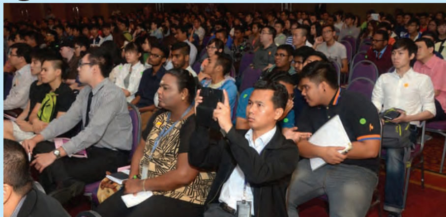
Young people listening intently to the Chief Minister’s inspiring speech at the conference.

Lim also touched on the “Tale of Two Cities”, highlighting how Penang gave artistic people the freedom to express and unleash their creativity