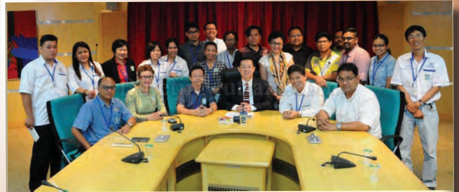
ஆசியான் பத்திரிகையாளர்கள் கூட்டமைப்பு (CAJ) மற்றும் தேசிய ஊடகவியலாளர்கள் ஒன்றியம் (NUJ) இணைந்து மலேசியா, லாவுஸ், சிங்கப்பூர், பிஹின்ஸ், இந்தோனேசியா மற்றும் கம்போடியா நாடுகளில் இருந்து பினாங்கிற்கு நட்புறவு வருகையளித்தனர்