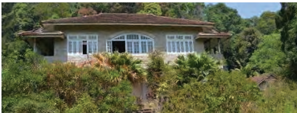
Woodside别墅还未被整理前。