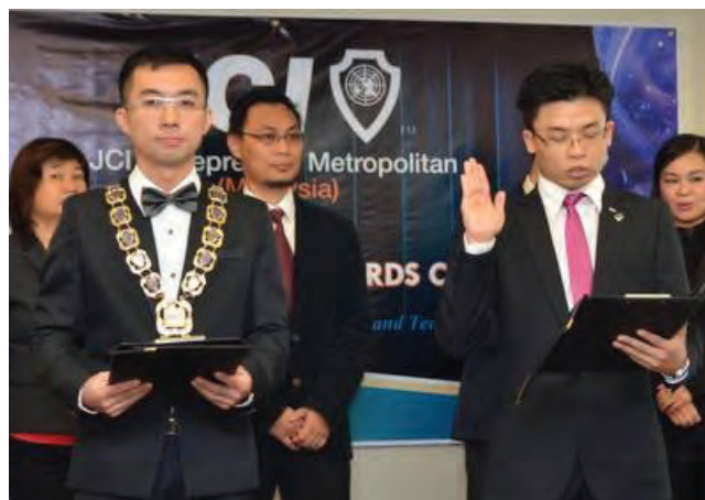
Choo (right) taking his oath of office during the installation ceremony.

"I am sure JCI E-Metro together with Hearts for Hope