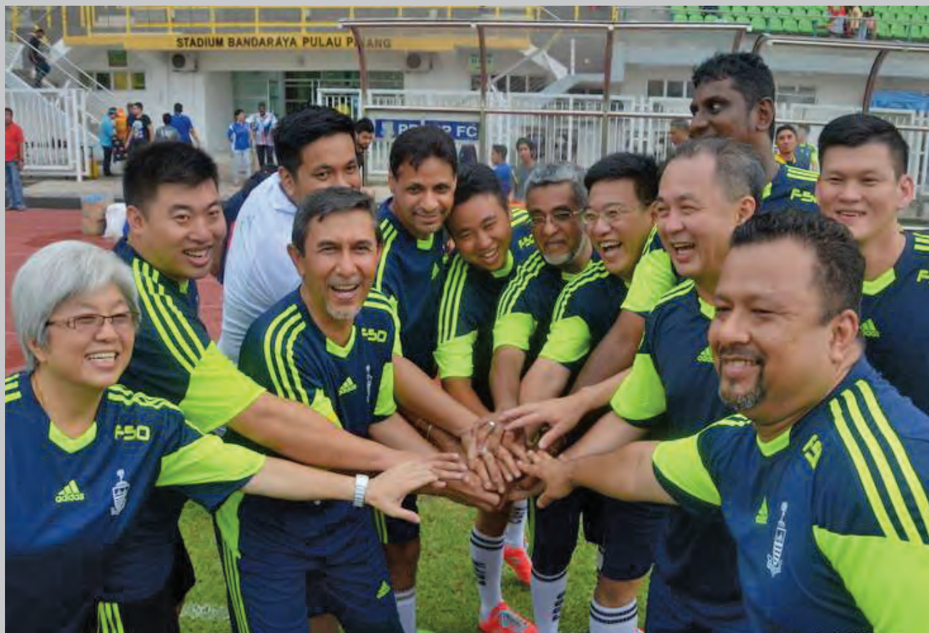
The host team issuing the battle cry before the start of the match.

A FRIENDLY football match at the City Stadium between a state assembly representative side, the host team, and Jelutong village development and security committee team saw the state assembly team losing 4-2.