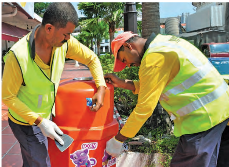
Council workers taking off the stickers on MPPP bins along Jalan Penang.