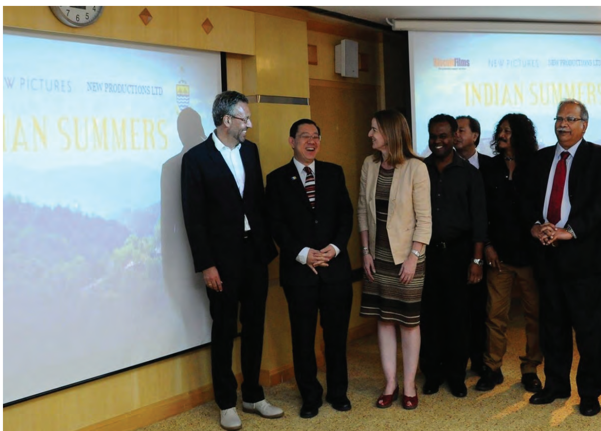
槟州首长林冠英(左2)欢迎查理柏丁森(左1)选则在升旗山取景拍摄《印度之夏》，同时希望藉着这部剧开拓开拓英国、美国及其他西方国家的旅游市场。

他说，在拍摄2年后，如果电视剧获得良好反应，该剧制作团队将继续拍摄，到时会将再签署新合约，而他也希望，自香港无线电视剧《单恋双城》吸引华人游客来槟后，《印度之夏》则可开拓英国、美国及其他西方国家市场，促进槟州旅游业。