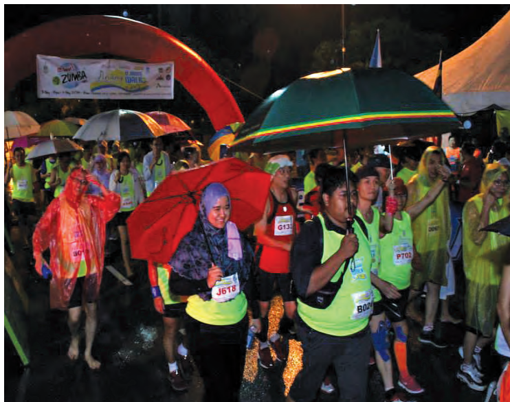
滂沱大雨无阻槟州第7届国际12小时竞走赛参赛者坚持完成赛事！

“槟州国际12小时竞走赛参赛者不只是来自国内，而是从亚美尼亚、加拿大、新加坡、香港、美国及菲律宾等277位参赛者一同挑战。竞走赛从市政厅前的旧关仔角开始出发，环绕大草场1.078公