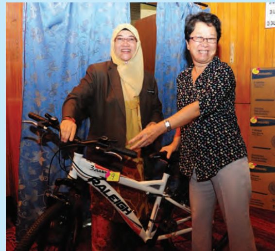
Patahiyah handing a bicycle to one of the lucky prize winners.

In future, ratepayers will stand a chance to win bigger and better prizes in many similar pro-