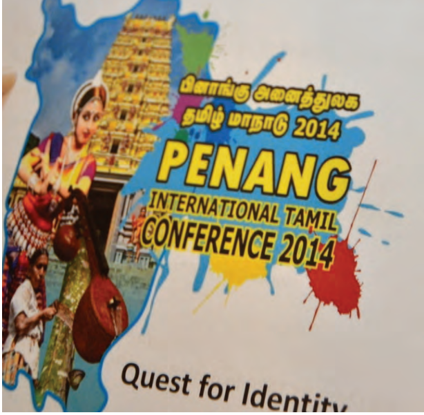
பினாங்கில் அனைத்துலக தமிழ் மாநாடு 2014

இம்மாநாட்டின் முக்கிய நோக்கமாகும். மலேசியா, மியான்மார், மொரிஷியஸ், ரீயூனியன் தீவு, தென்னாப்பிரிக்கா, இந்தியா, தமிழீழம் மற்றும் தமிழ்நாடு ஆகிய நாடுகளின் ஆய்வுக்கட்டுரைகளும் இம்மாநாட்டில் விவாதிக்கப்படும்.