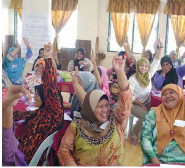
பங்கேற்பாளர்கள் தெலொக் கூம்பாரில் நடைபெற்ற குழந்தை பராமரிப்பு பயிற்சியில் கலந்து கொண்டனர்.

இதற்கிடையில் மாநில குழந்தை பராமரிப்பு சேவைகளை மேம்படுத்தும் முயற்சிகள் வேகமாக நடைபெற்றுக் கொண்டிருக்கின்றன. இங்கே மீண்டும் பாதுகாப்பான, மலிவு மற்றும் தரமான குழந்தை பராமரிப்பு வழங்குவதன் மூலம் குழந்தைகளின் நல்வாழ்வு மற்றும் முழு வளர்ச்சியை உறுதிப்படுத்தலாம்.