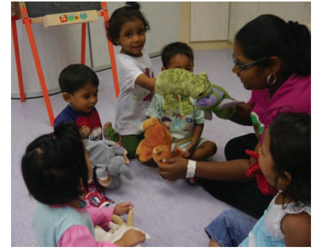
டி'கொம்தார் குழந்தை பராமரிப்பு மையத்தில் கைபொம்மையைப் பயன்படுத்தி விளையாடக் கற்று கொண்டனர்.

இதன் விளைவு, பணியிட குழந்தைப் பராமரிப்பு அதிரடி திட்டம் ஊக்கம் அளிக்கிறது. எடுத்துக்காட்டாக பிளாங்கு மாநில அரசு அனைத்து அரசு ஊழியர்களுக்காக “TASKA D' KOMTAR” கொம்தாரில் அமைக்கப்பட்டிருக்கிறது. “TASKA D' KOMTAR” காலை 7.00 முதல் மாலை 6.00வரை செயல்படும். மூன்று மாத குழந்தை முதல் நான்கு வயது குழந்தைகள் இங்கு சேர்க்கப்படுவர். மேலும் தகவலுக்கு இணையத்தளத்தை அனுகலாம் www.pwdc.org.my . பிளாங்கு மாநிலம் குழந்தைகளின் முழு வளர்ச்சிகாகவும் நலனுக்காகவும் பாடுபடுகிறது என்பதில் சந்தேகமில்லை.