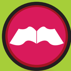
快乐学生 (小一及小四；中一及中四)