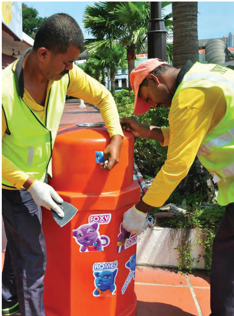
某电讯公司重蹈覆辙非法张贴广告贴纸，严重破坏市容，更是导致清洁员工耗时耗力地清除贴纸。