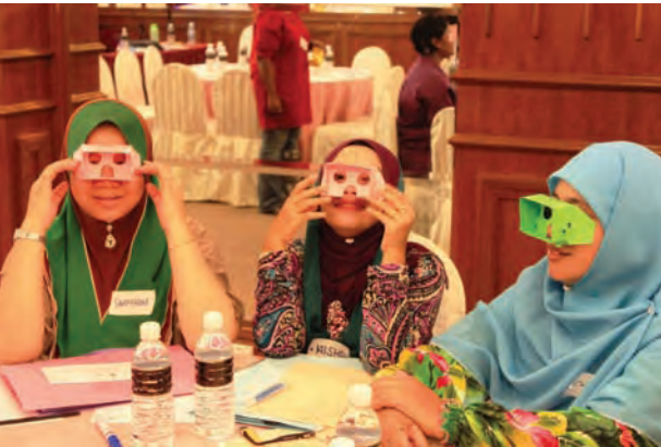
பங்கேற்பாளர்கள் தொலைநோக்கியைப் பயன்படுத்தி குழந்தைகளின் பார்வை ஆற்றலை ஆராய்கின்றனர்.

இலக்கு குழுவின் தெளிவான ஆய்வில், குழந்தைகளின் பாதிப்பு மற்றும் அவர்களின் பல தேவைகள் ஆவணமற்ற குழந்தைகள், குழந்தை திருமணங்கள் ஏழை நிறுவன பாதுகாப்பு, குழந்தைகளுக்கு எதிரான வன்முறை, குழந்தைகளின் சிறப்பு தேவைகள் அடங்கும். எங்களின் முதல் பணி தற்போதைய நிலை மற்றும் சூழ்நிலைகளைக் கொண்டு விரிவான மதிப்பீடு நடத்துவது. இந்த அடிப்படை நடவடிக்கை மற்றும் ஆய்வு மூலம் நிச்சயமாக ஒரு விரிவான முறைப்படுத்தலாம்.