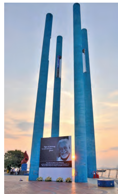
The state government has decided to rename a water-front promenade in Sungei Pinang as Karpal Singh Drive.

happen to us after our passing on, actually what we do today would determine the legacy that you are going to leave behind.