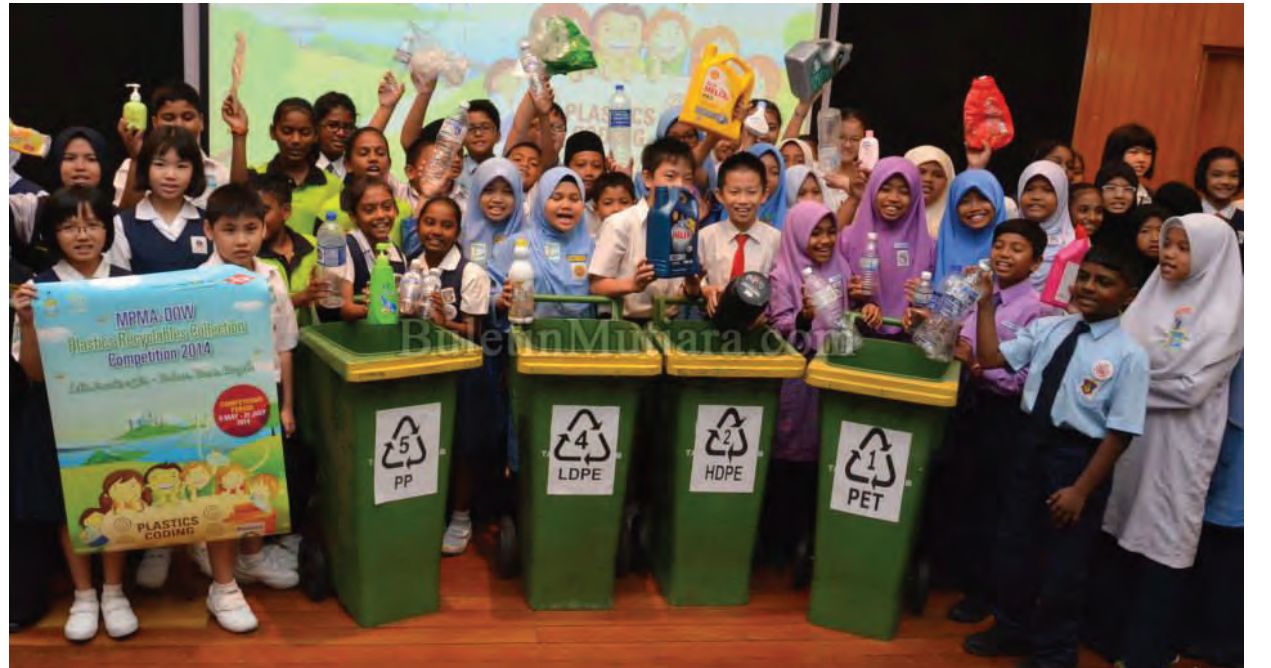
படம் 2: நெகிழிப்பை மறுசுழற்சி சேகரிப்பு போட்டி 2014 நிகழ்வில் கலந்து கொண்ட மாணவர்களில் சிலரை படத்தில் காணலாம்.

இப்போட்டி இரண்டாவது முறையாக பினாங்கு மாநில மக்கள் கூட்டணி மற்றும் பினாங்கு பசுமை கழகத்தின் ஆதரவோடு நடத்தப்படுவதாக பெருமையாகக் கூறினார் மலேசிய நெகிழிப்பை உற்பத்தியாளர் கழகம் தலைவர் தன் வீ மிங் அவர்கள். தொடர்ந்து, நிகழ்வில் உரையாற்றிய தன் வீ மிங் அவர்கள் இப்போட்டியின் முக்கிய நோக்கம் இளைய சமூகத்தினரிடையே அல்லது பள்ளிக்கூட மாணவர்களிடையே மறுசுழற்சி பற்றிய விழிப்புணர்வு மற்றும் சுற்றுச்சூழல், இயற்கை வளங்களின் பாதுகாப்பு தொடர்பான கல்வி திட்டங்களை உருவாக்குவது என மேலும் தெளிவுப்படுத்தினார். நெகிழிப்பை மறுசுழற்சி சேகரிப்பு போட்டி 2014-க்கு டாவ் நிர்வாகத்தின் நிரந்தர இயக்குநர் பால் லூ ரிம 100,000.00-மானியமாக வழங்கினார்.