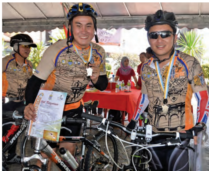
Cyclists raring to ride around the island.

"A healthy society and community ultimately will increase the productivity