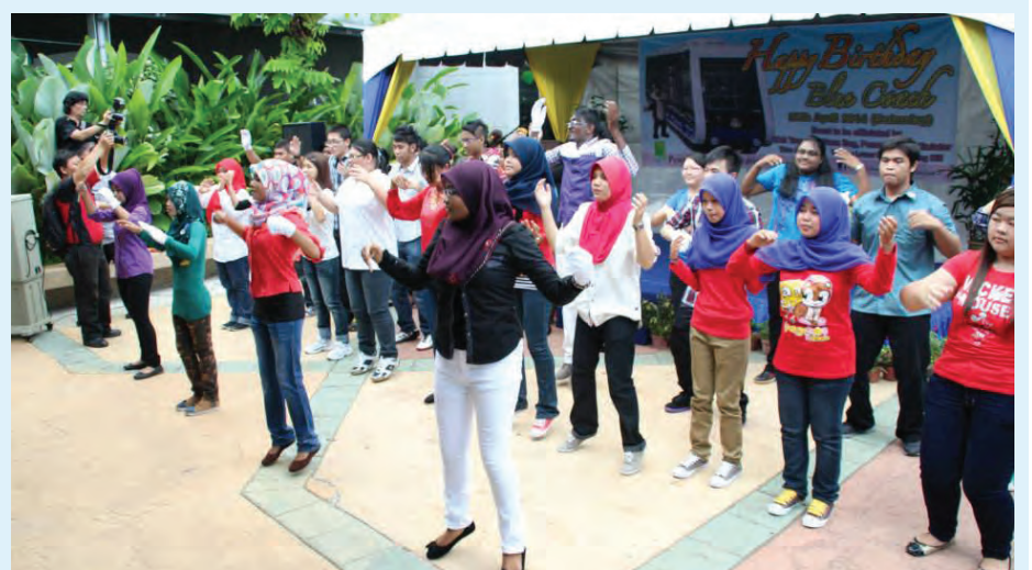
An entertainment programme for the crowd.

The PHC invited some 300 old folks and orphans from various charity homes to join in the anniversary cele-