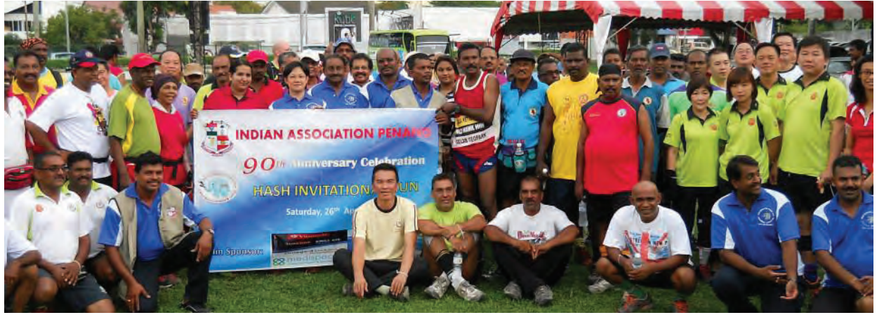
படம் 2: “Invitational Run” ஓட்டத்தில் கலந்து கொண்ட பிரமுகர்கள், பினாங்கு இந்தியர் சங்க நிர்வாகத்தினர் மற்றும் பங்கேற்பாளர்கள்