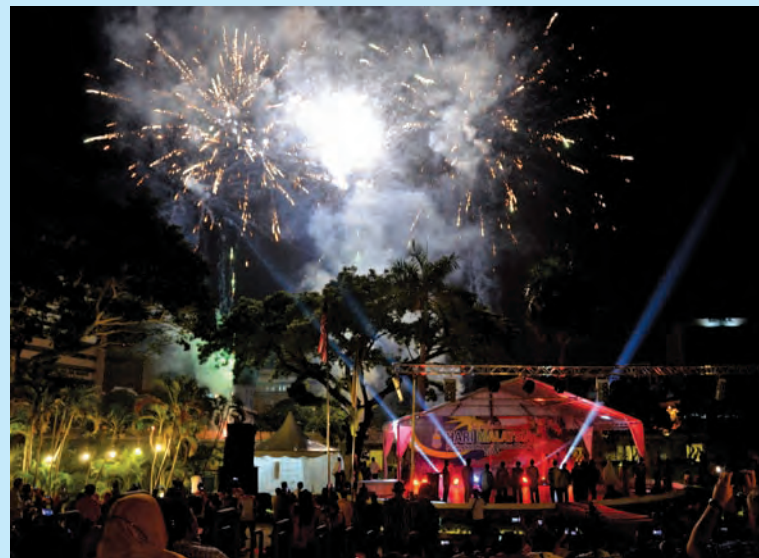
Ending the night with fireworks going off into the sky, wishing our country a very happy Malaysia Day.