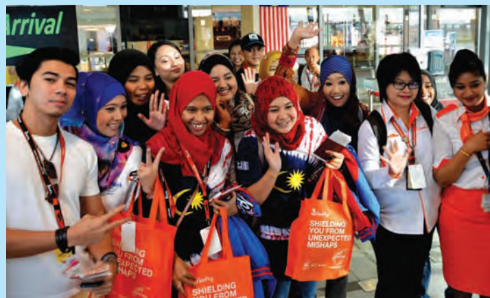
Some of the passengers waiting to board Firefly's inaugural flight from Penang to Krabi showing their appreciation before boarding the plane at Penang International Airport.

He said the Penang International Airport is the second largest and most busy airport in the country.