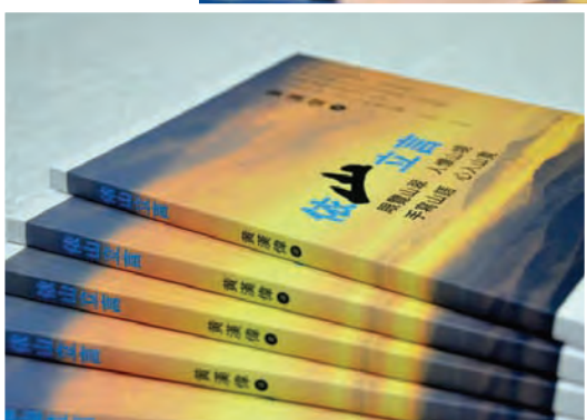
《依山立言》是黄汉伟从大学3年级，义务为在野行动党议员处理文书翻译工作，到响应历史召唤参选议员，2008年至今的议员历程。

说，《依山立言》大半记录他以本身的经历经验对工作岗位上的看法及思考，对他而言，一名议员不只是巡视巴刹，或是在公开宴会演讲，而最重要是提升其本身的问政素质，尤其是对本身的工作与使命，立法议员参与政治并非一份工作，不是一