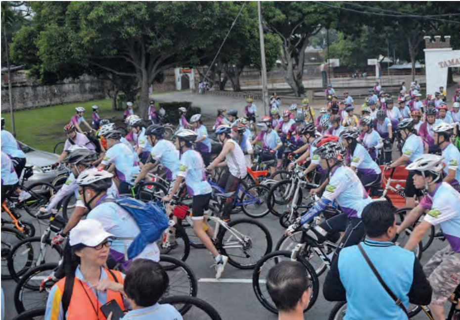
Cyclists on their 21.6km ride for charity.

OVER 2000 cyclists took part in the Journey for Hope Charity Fun Ride held on Sept 14 with the aim of raising RM50,000 for underprivileged students from 10 selected schools in Penang.