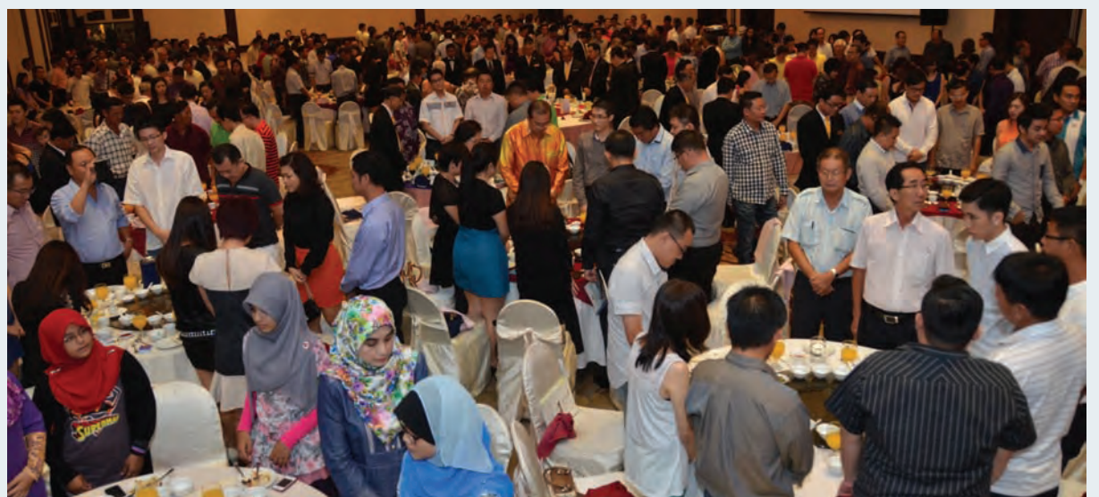
Part of the crowd at the Penang Master Builders & Building Materials Dealers Association 137th anniversary dinner.

"Simultaneously, we have announced the Penang Tunnel project with its related roads, and also work-