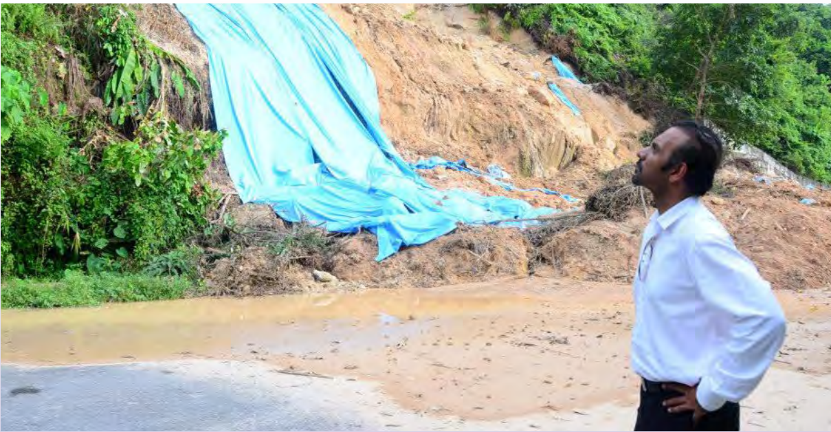
புக்கிட் அவானா பகுதியில் ஏற்பட்ட நிலச்சரிவைப் பார்வையிடுகிறார் புக்கிட் குளுகோர் நாடாளுமன்ற உறுப்பினர் மதிப்பிற்குரிய திரு ராம் கர்பால்

பாயா தெருபோங், புக்கிட் அவானா பகுதியில் ஏற்பட்ட நிலச்சரிவை புக்கிட் குளுகோர் நாடாளுமன்ற உறுப்பினர் மதிப்பிற்குரிய திரு ராம் கர்பால் அவர்கள்