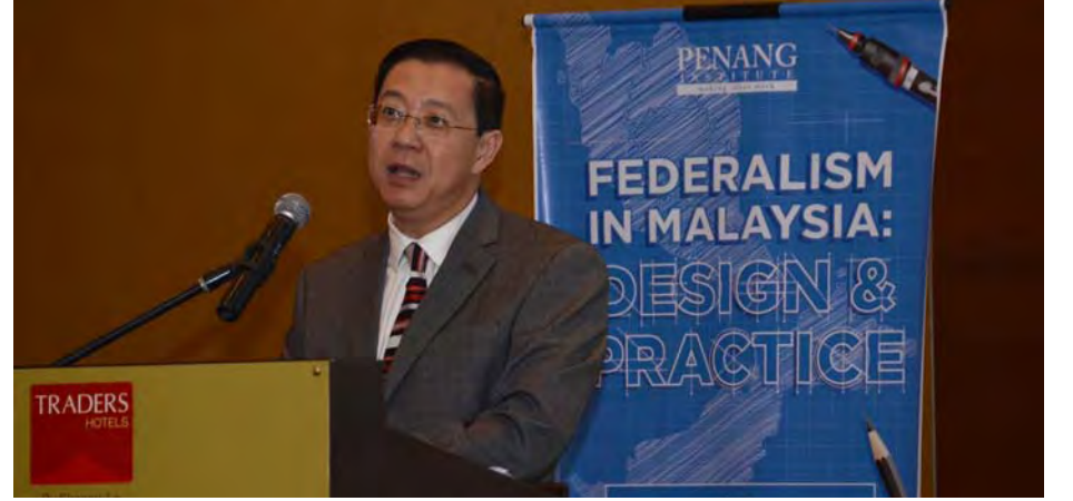
மலேசியாவில் கூட்டமைப்பு : வடிவமைப்பு மற்றும் நடைமுறை மாநாட்டில் அதிகாரப்பூர்வ உரையாற்றினார் மாநில முதல்வர் மேதகு லிம் குவான் எங்.

மலேசிய தினத்தை முன்னிட்டு 17 நிபுணர்கள் மலேசிய கூட்டமைப்புப் பற்றி கலந்துரையாடுவதோடு அதனை மேம்படுத்தும் பல வழிமுறைகளைக் குறிப்பிட்டனர். இந்நிகழ்வில் 100-க்கும் மேற்பட்ட அரசாங்கம், தனியார் மற்றும் சமூக இயக்க உறுப்பினர்கள் கலந்து சிறப்பித்தனர். கல்வி, சுகாதாரம், போக்குவரத்து, பாதுகாப்பு படை ஆகிய துறைகளின் முழு அதிகாரம் கூட்டரசு அரசின் கீழ் இருப்பது அனைவரும் அறிந்ததே. இத்துறைகளின் பொறுப்புகள் மற்றும் அதிகாரங்கள் மாநில அரசிடமும் வழங்கப்பட வேண்டும் எனப் பல நிபுணர்கள் விவாதம் செய்தனர். மேலும், மாநில அரசிற்கு அதிகாரம் வழங்குவதன் மூலம்