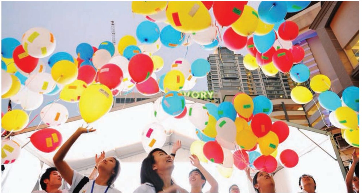
Some of the 300 balloons which were released into the sky, carrying the hopes and wishes for Malaysia written by some of her children from Penang.