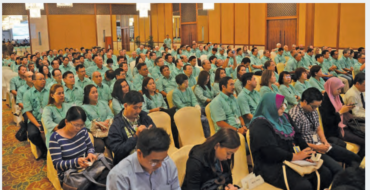
A shot of some of the 262 delegates who attended the 38th ASEAN Glass Conference.

"We in Penang share the same ideals with this year's conference. Our vision of being the very first green state in Malaysia can only be achieved if we practise sustainable development in utilising scarce