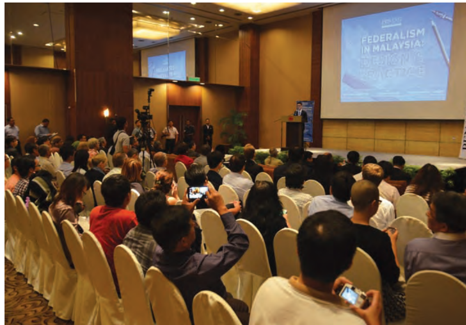
Some of the participants at the 'Federalism in Malaysia: Design and Practice' Conference.

laysia the various benefits of federalism, like inter-state competition, collaboration and innovation.