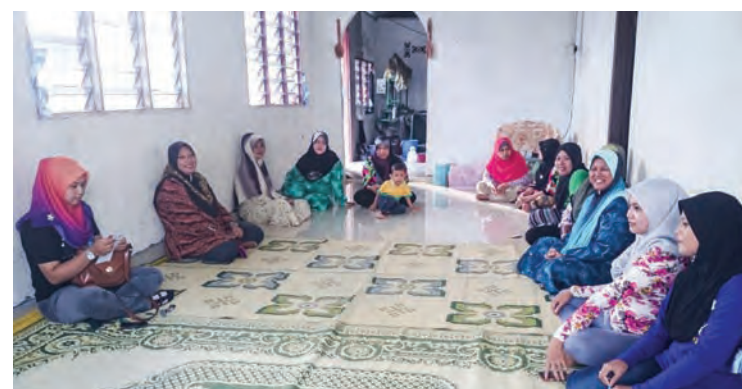
Focus Group Discussion with Women aged 19-30.

The views and suggestions of Kampung Sungai Chenaam residents gathered from these Focus Group Discussions will be collected and then voted on in Stage 3 (Voting on Priorities and Budget) which has been slated for early Oct 2014.