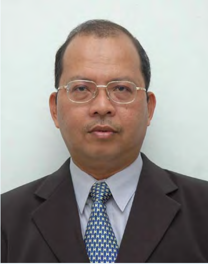
டத்தோ பாரிசான் பின் டாருஸ்

இந்த விருதளிப்பு நிகழ்வில் மொத்தம் 1156 பிரமுகர்கள் விருதுகள் பெறும் வேளையில் 65 பிரமுகர்கள் D.J.N விருதும், P.K.T 160 விருதுகளும், P.J.K விருது 442 பிரமுகர்களும், P.J.M 310 பிரமுகர்களும் மற்றும் பலர் D.C.N, P.B.S ஆகிய விருதுகள் பலர் பெற்றனர்.