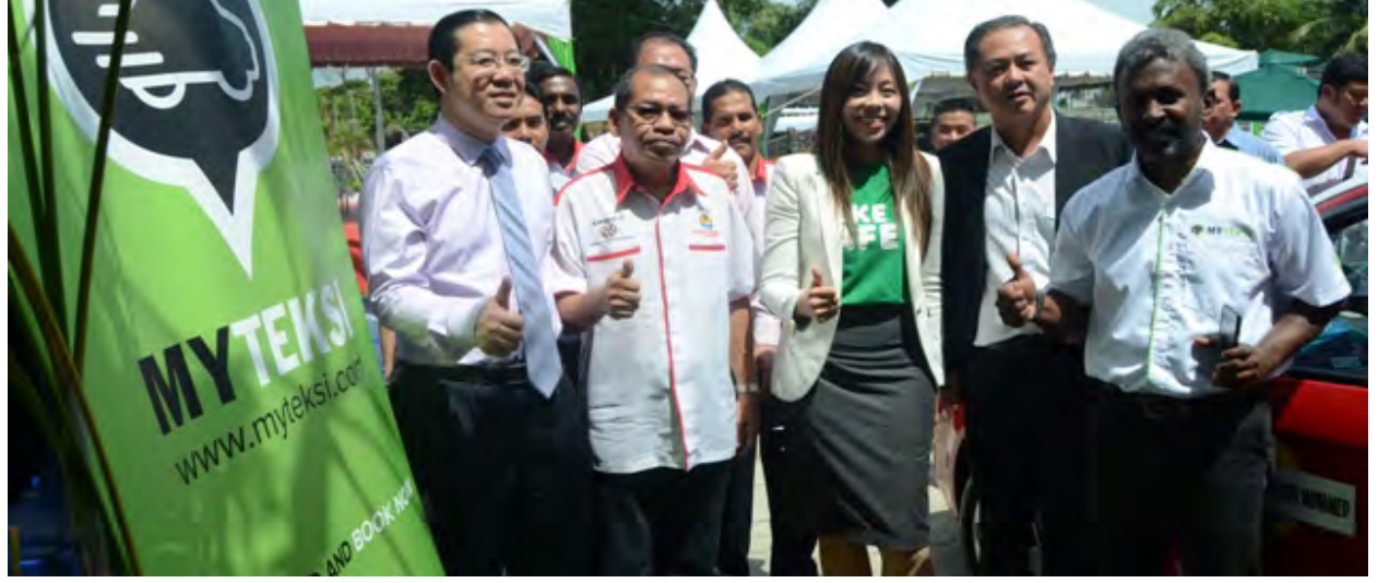
“என் வாடகைக் கார்”(My Teksi) திட்டத்தை அதிகாரப்பூர்வமாகத் துவக்கி வைத்தார் பினாங்கு மாநில முதல்வர் மேதகு லிம் குவான் எங்

நிகழ்வை துவக்கி வைத்து சிறப்புரையாற்றிய மாநில முதல்வர் அவர்கள் இத்திட்டம் பினாங்கு மாநில பொது போக்குவரத்து உருமாற்று திட்டத்திற்கு பெரும் உறுதுணையாக அமையும் என்றார். ஏப்ரல் மாதத்தில் அறிமுகப்படுத்தப்பட்ட இத்திட்டத்திற்கு இன்று 500% நல்ல வரவேற்பு கிடைத்திருப்பது பாராட்டக்குறியதாகும். My Teksi திட்டம் உள்நாட்டவர் மட்டுமின்றி சுற்றுப்பயணிகளும் இலகுவாகக் குறைந்த விலையில் ஓரிடத்திலிருந்து மற்றொரு இடத்திற்குப் பயணிக்க உதவுகிறது. வாடகைக் கார் ஓட்டுனர்களின் தினசரி வருமானம் இத்திட்டத்தின் வழி அதிகரிப்பதற்கு வாய்ப்பு உள்ளது என மேலும் விவரித்தார் மேதகு லிம் குவான் எங்.