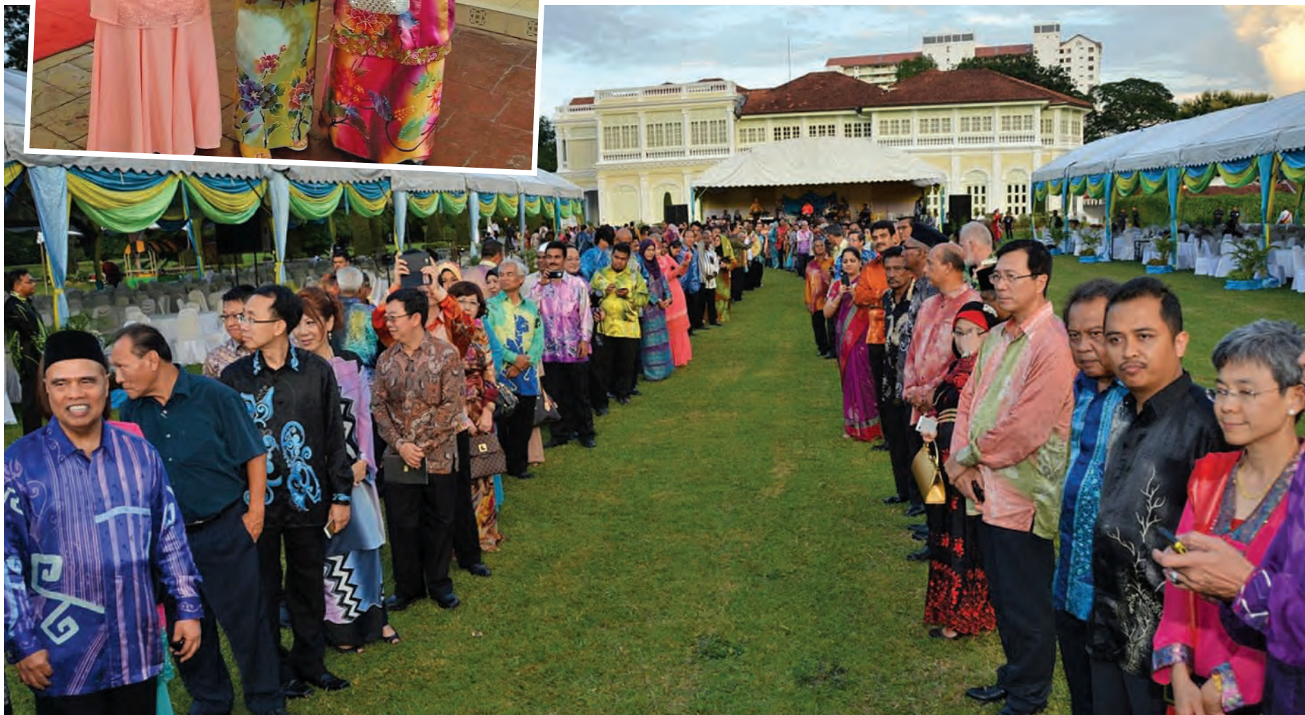
Guests at the Governor's birthday awaiting his arrival.