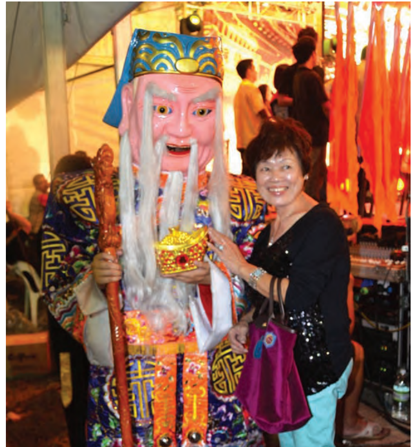
宝福社首次举办马来西亚大伯公节及国际福德文化节，让来自海内外的大伯公信徒来到檳城体验檳州各族及各大文化宗教的和睦相处。