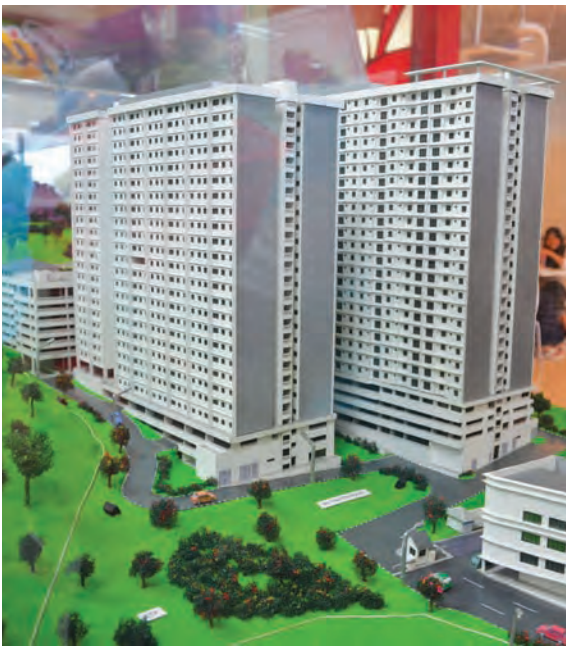
“拥屋计划”巡回展来到峇央峇鲁站。