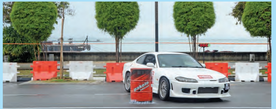
A racer burning some rubber during the gymkhana event at the Pakelo Lubricants Autofest 2014- Street Challenge.

IT was the sound of engines revving and smell of burning rubber as some 30 racers from the local and international racing circuit thrilled and wowed circuit race enthusiasts at the Pakelo Lubricants Autofest 2014- Street Challenge held at the newly named Karpal Singh Drive.