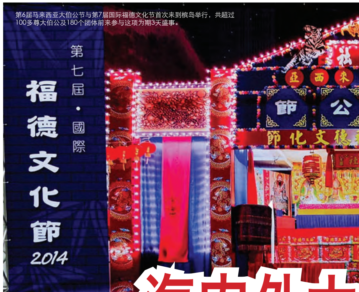
第6届马来西亚大伯公节与第7届国际福德文化节首次来到檳岛举行，共超过100多尊大伯公及180个团体前来参与这项为期3天盛事。