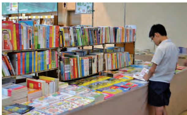
一个城市的文化资源、文化氛围和文化发展水平，在一定程度上体现出城市的竞争力，决定着城市的未来，因此，一个城市发展的高度并不是由楼房的高低或大小来衡量的，而是居民的知识水平与文化层次。

他说，今年图书博览会回到SPICE举办第四届槟城图书博览会，也获得槟州政府及槟州首长的支持。期待槟城读者给予的温度，让国际图书博览会有更大的信心思考未来；通过书本，传递知识及文化，为建设一个文化城市献出我们的一份力。