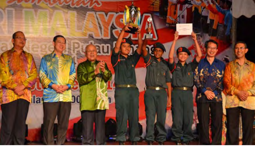
சுதந்திர தின சிறந்த அணிவகுப்புக் குழுவான புக்கிட் ஜம்புல் இடைநிலைப் பள்ளி மாணவர்களுக்கு மாநில முதல்வர் பரசுக் கோப்பை வழங்கினார். (உடன் மாநில செயலாளர், மாநில ஆளுநர், மாநில முதலாம் துணை முதல்வர் மற்றும் மாநில சபாநாயகர்)

பினாங்கு மாநில அளவிலான மலேசிய தினம் கடந்த 16/9/2014-ஆம் நாள் மிக சிறப்பாக கொண்டாடப்பட்டது. 51-வது முறையாகக் கொண்டாடப்படும் இவ்விழா பினாங்கு மாநில பாடாங் கோத்தாவில் நடைபெற்றது. மலாயா நாடாக திகழ்ந்த இந்நாடு சபா, சரவாக் மாநில இணைப்புடன் மலேசியாவாக உருமாற்றம் கண்டது. இன்று பல இன மக்கள் ஒற்றுமையுடன் வாழும் திருநாடாகத் திகழ்கிறது என்றால் மிகையாது.