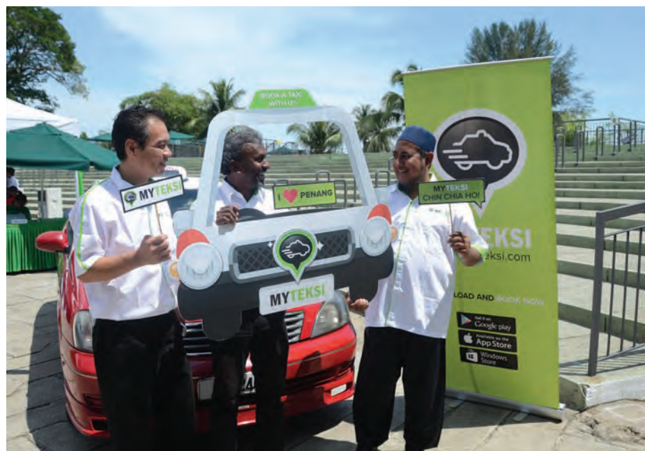
Taxi drivers posing with a cut-out of MyTeksi icon after the event.

"People only need to download the mobile app on their smart phones, and from there, place a destination. Then, a whole list of taxis using the MyTeksi app