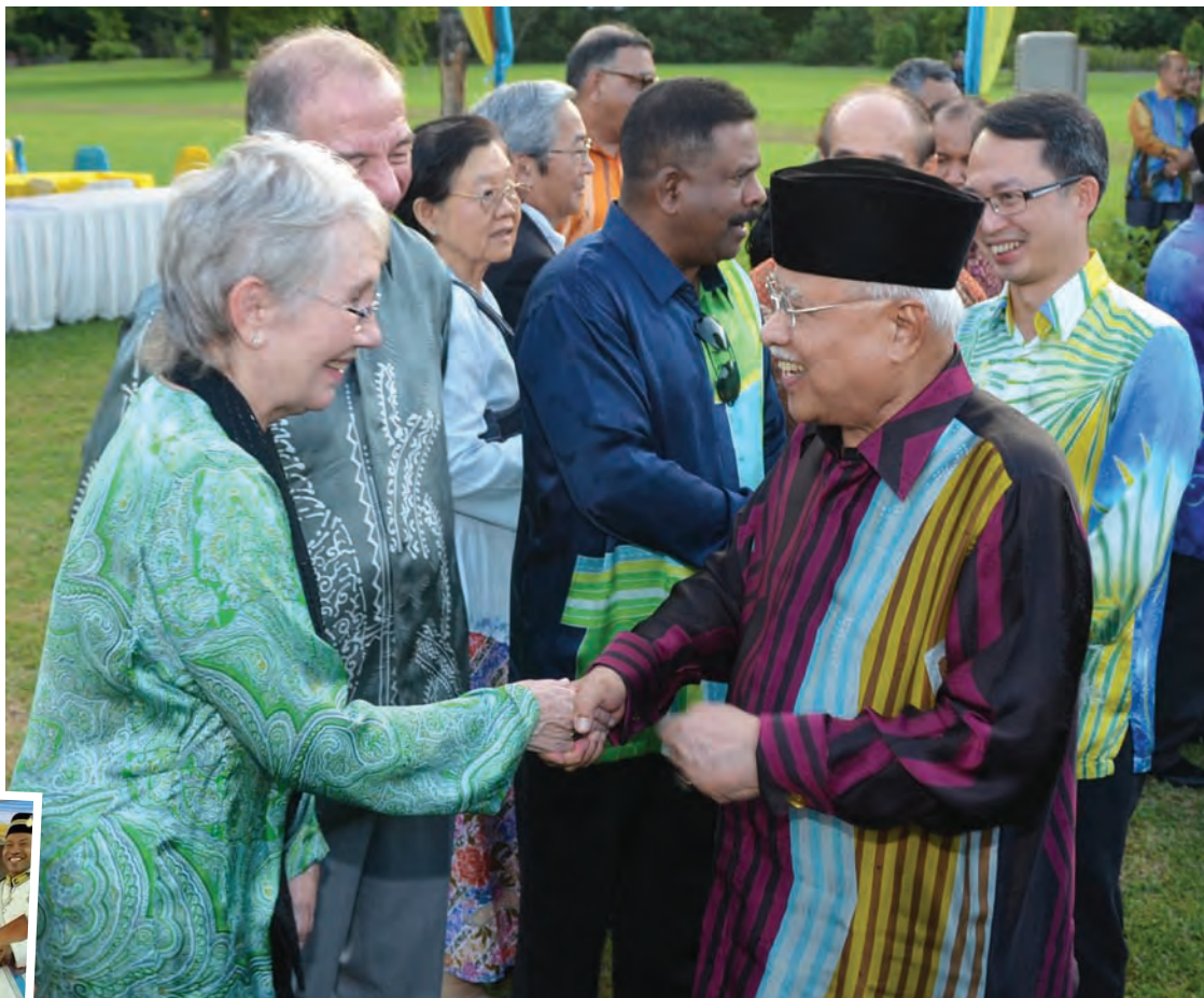
Man of the hour, Penang Governor Tun Abdul Rahman Abbas greeting a few of his guests at his birthday celebration.