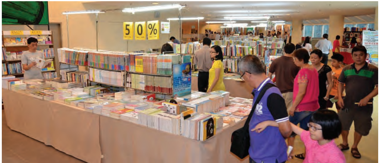
槟州政府除了提供工作方便、生活舒适，环境优美、安全稳定的物质环境，也尽力提供居民安静和谐、活泼快乐、礼让互助、精神高尚的文化环境。