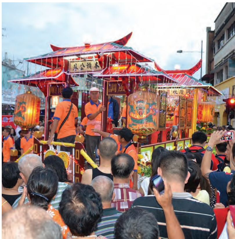
民众竞相参与难得一见的大伯公游行。