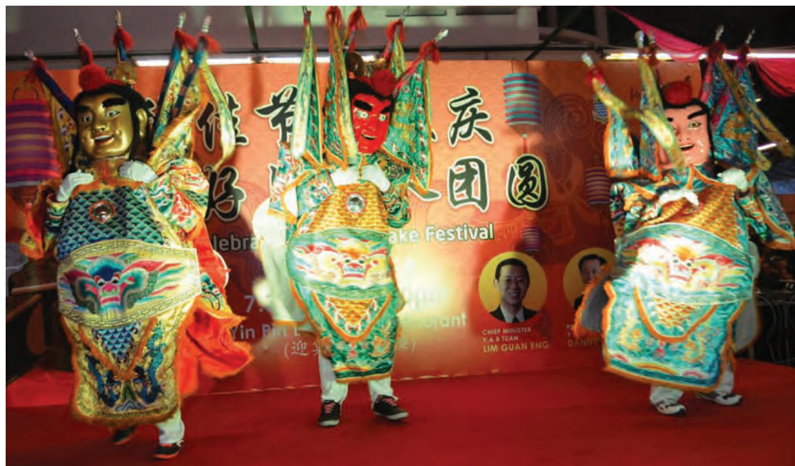
Cultural performance to entertain the crowd.

"It is important too for Penangites to enjoy the beautiful seafront scenery while having their food at the various restaurants and food stalls in the area," said Yap, who allocated