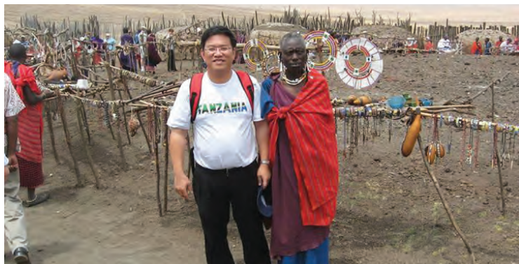
《依》文章当中也包含他代表槟州议会到南非约翰尼斯堡之旅，除了涉及各项议案及对话会，里面也谈论当地历史及他所闻所思的事实问题。

“功过千秋自有定论。我只能用书写出来，让后人来评我这一代从政者追求民主平权梦的功过。”