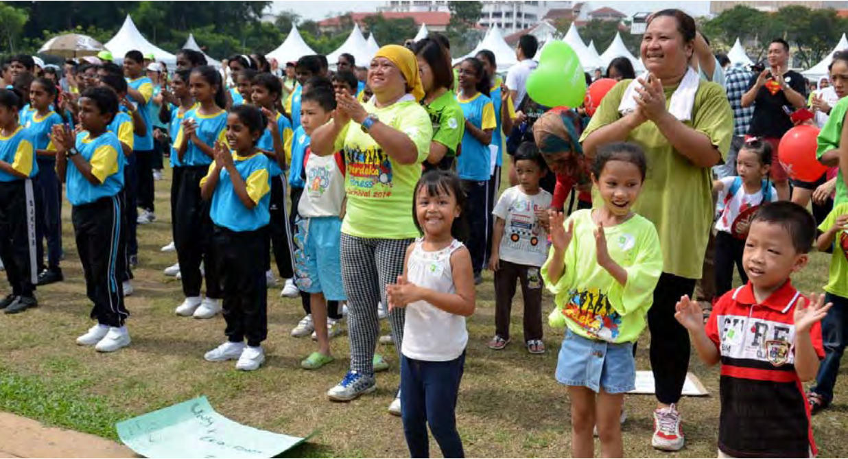
பசுமை விழாவில் கலந்து கொண்ட பொது மக்கள்

இந்த அனைத்துலக பசுமை விழாவிற்கு 90-க்கும் கூடுதலான உள்ளூர், அனைத்துலக நிறுவனங்கள் மற்றும் சுற்றுச்சூழல் அமைப்புகள் கலந்து கொண்டனர். இவ்விழா கடந்த 13/9/2014-14/9/2014 வரை பினாங்கு மாநில எக்ஸ்பிலனேட் எனும் தளத்தில் இனிதே நடைபெற்றது. இந்நிகழ்வினை மாநில முதல்வர்