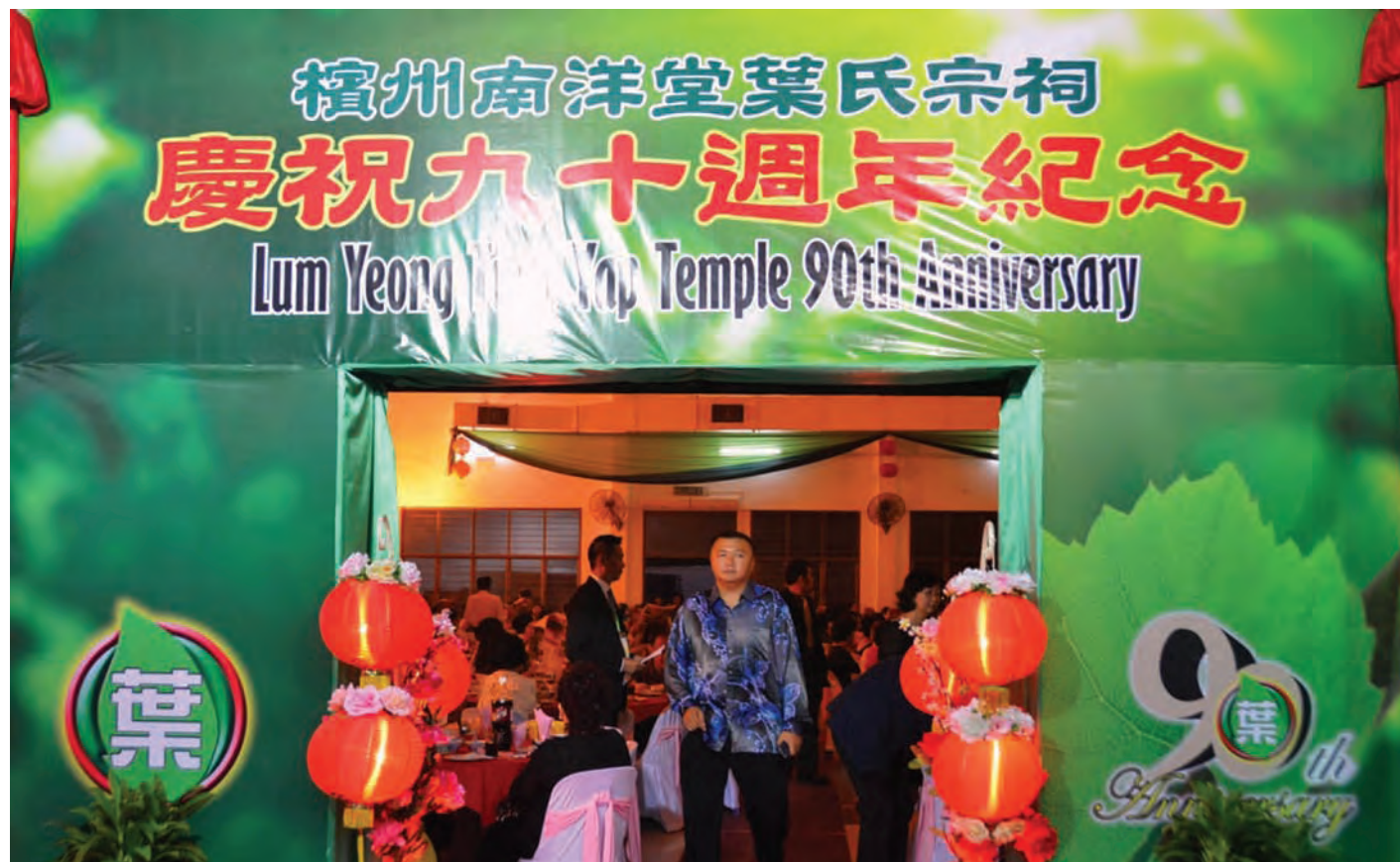
南阳堂叶氏宗祠庆祝九十周年纪念。

时说，通过先教育年轻人关于爱护环境的知识和概念，年轻人接受了之后，他们会去说服他们的家长、爸爸妈妈、公公婆婆等长辈，这样一来，从年轻的、中年的到老人人家，都接受无塑料袋，才能够成功落实这项政策。槟城也变得更清洁、更干净、更绿化了。