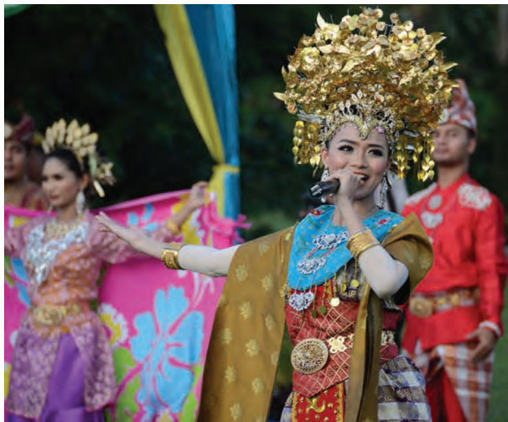
Some of the festivities at the Penang Governor's birthday celebration, in conjunction with the Penang State Awards Ceremony.