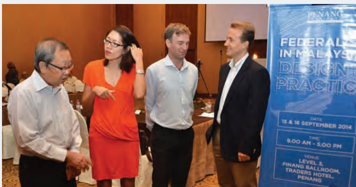
《大马的联邦制：设计与实践》研讨会。

“财政联邦化也不利于民主，属于反对党管辖的州属，都会受到联邦政府拒绝给予适当的资源。如由反对党管辖的槟州及雪州，作为全国最都市化及工业化的州属，两州都提