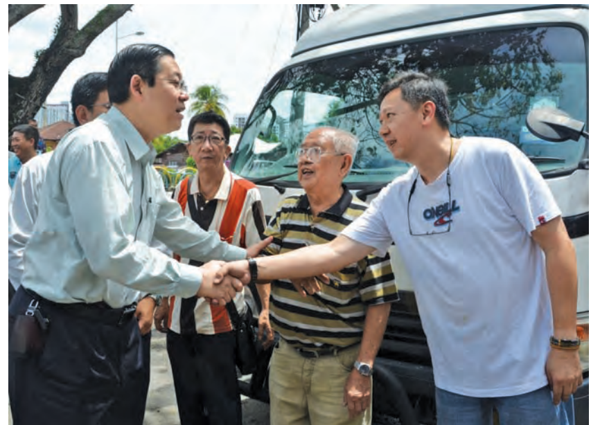
Chief Minister Lim Guan Eng on Sept 10 visited the fire victims of three shoplots in Jalan Air Itam whose premises were razed by a fire the day earlier.