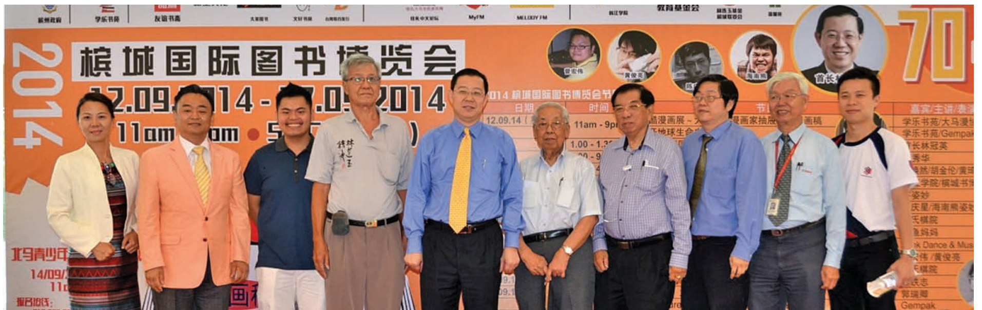
槟州首长林冠英（左5）为国际图书博览会主持开幕。