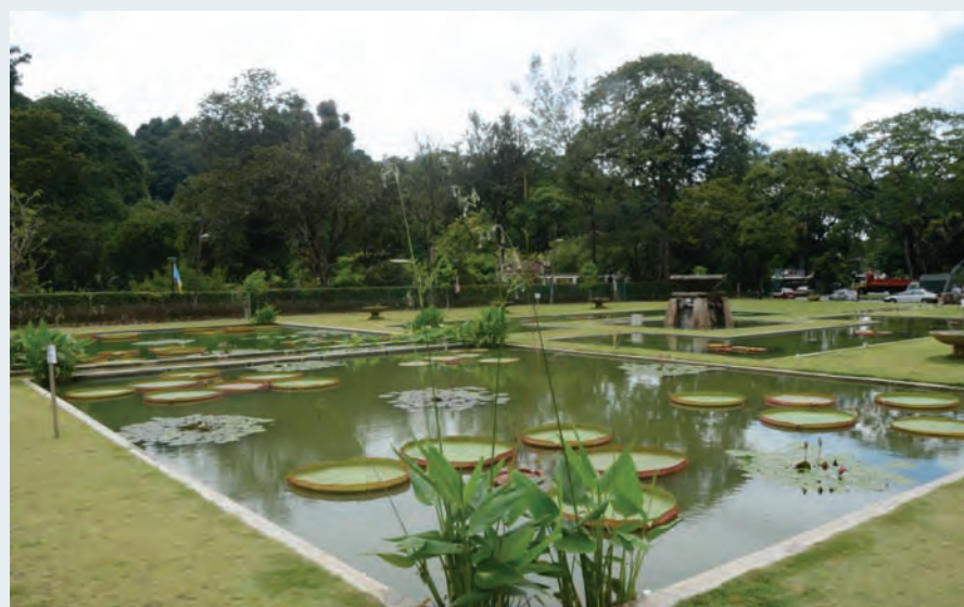
The Penang Botanical Gardens Department held a press conference to directly address the issues raised in regards to the "poor upkeep" at the gardens.

"The Victoria Amazonica is an annual flower, but here in Penang with its