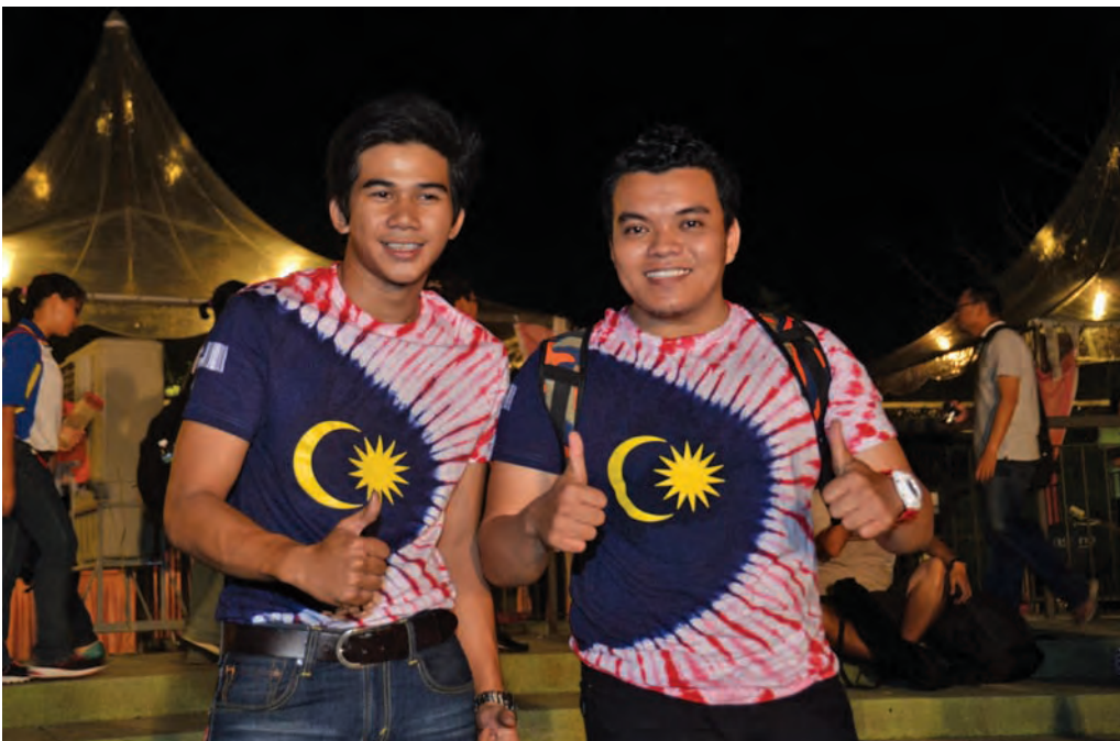
Malaysians loving Malaysia during the recent Malaysia Day celebration.