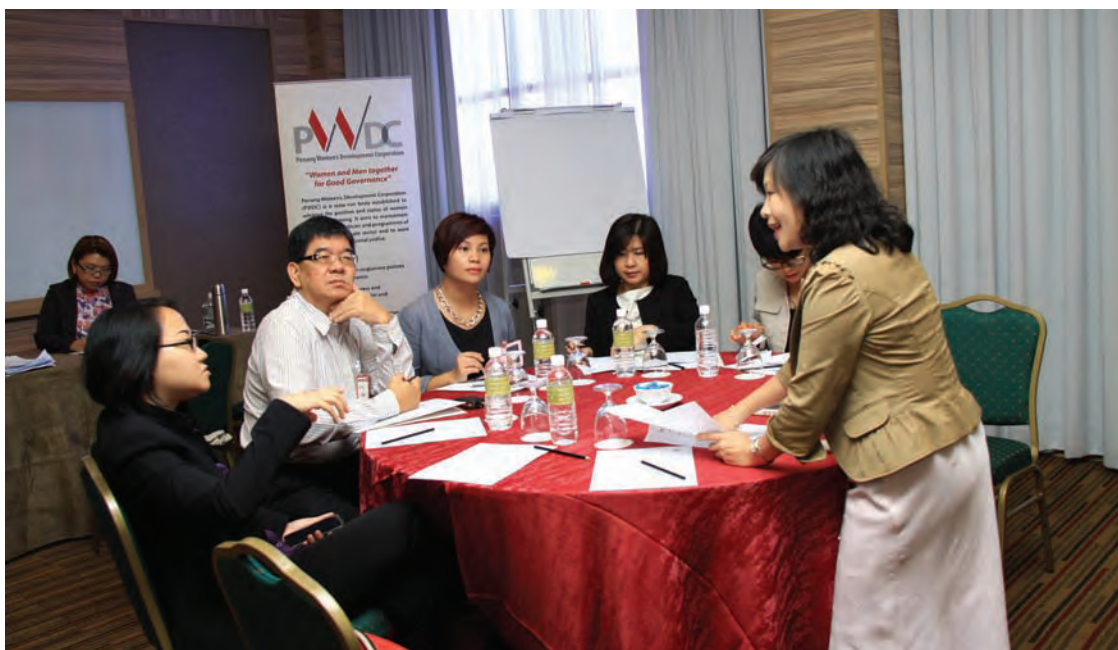
槟城“挺身而出”工作坊协调员。

她说：“在对性别刻板的社会来说，女性结婚并没有加分因为原本从洗自己的衣服甚至不用洗衣因为妈妈帮忙洗。到你结婚了，你要洗你自己