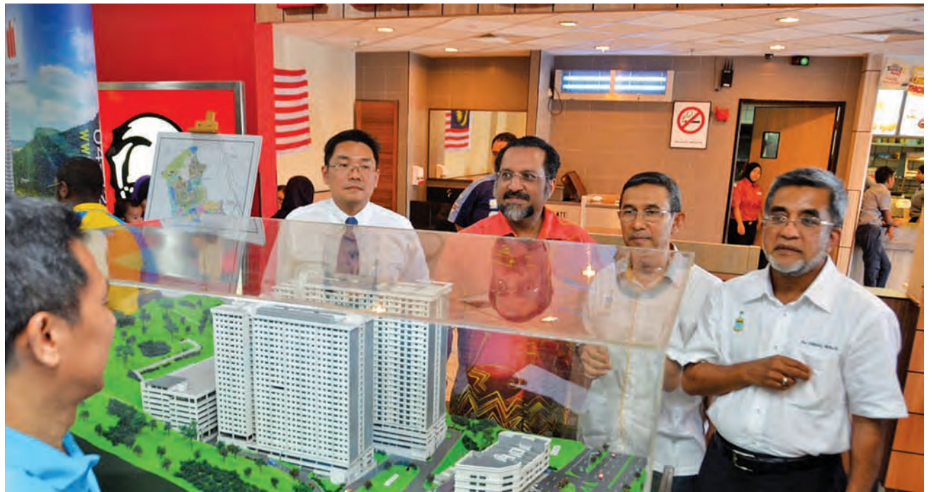
峇央峇鲁区国会议员沈志勤（左起）、槟州房屋委员会主席佳日星、槟州第一副首长拿督莫哈末拉昔及峇都茅区州议员拿督阿都玛烈主持“拥屋计划”巡回展峇央峇鲁站推介仪式。

槟州房屋委员会主席佳日星行政议员要求联邦政府给槟州政府一个交待，证明联邦政府有哪些房屋发展计划，是可提供1万个可负担房屋单位。