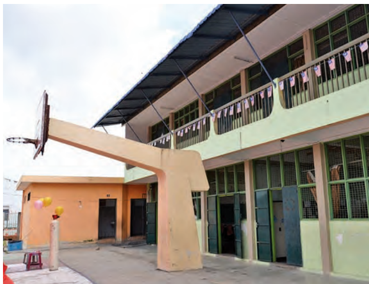
创校已82年的高渊港口毓英小学，基于学生人数与年俱增，导致目前的课室已不敷应用。

他宣布，使用首长特别拨款拨出7万令吉予毓英小学建委会，让学生们在软硬体设备更完善和更舒适地环境下上课。