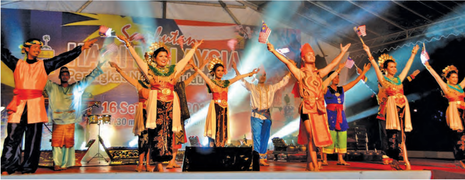
A shot of some of the performances during Malaysia Day, held at Fort Cornwallis.