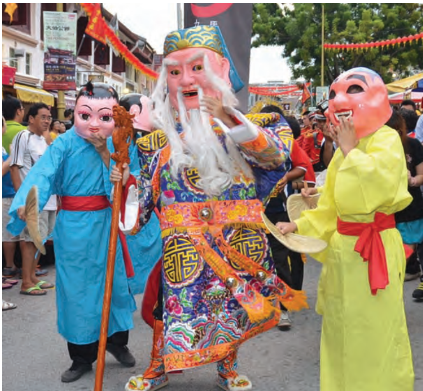
第6届马来西亚大伯公节与第7届国际福德文化节共有100尊大伯公金身首次选择在西马半岛的檳城举行，并聚集了海内外共180多团体参与，可说是人与人的联谊，神与神的聚会。