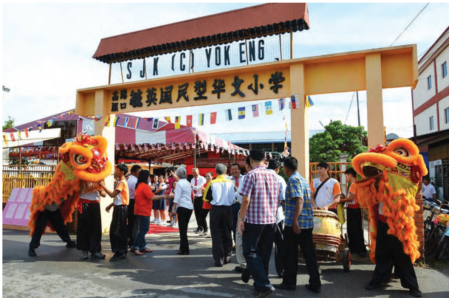
高渊港口毓英小学建委会计划在原校旁的地段增建一栋4层楼18间课室的建筑物。

他补充，槟州民联政府每一年的制度化拨款，不分政治背景及政党背景，虽然学校董事会成员很多都是马华领袖，但是州政府仍然照样拨款给每一所学校，一切按照需求来衡量，不忽略、不剥夺，一所也