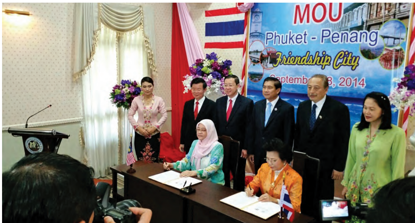
在槟州首长林冠英（后排左3）及槟州地方政府委员会主席曹观友行政议员（后排左2）见证下，槟岛市政局主席拿督芭堤雅与泰国普吉岛市长许得意签署友好城的谅解备忘录。

他说，2016年东盟自由贸易区的开放，将是东盟区域6亿人口在贸易、投资、旅游、经济及发展合作上的新篇章。槟城-普吉岛的友好城市地位，将能够借普吉岛在旅游方面的专业知识，与槟城的科技知识作专业交换，标志着两地迈入专业知识交换、互惠互利的新篇章。