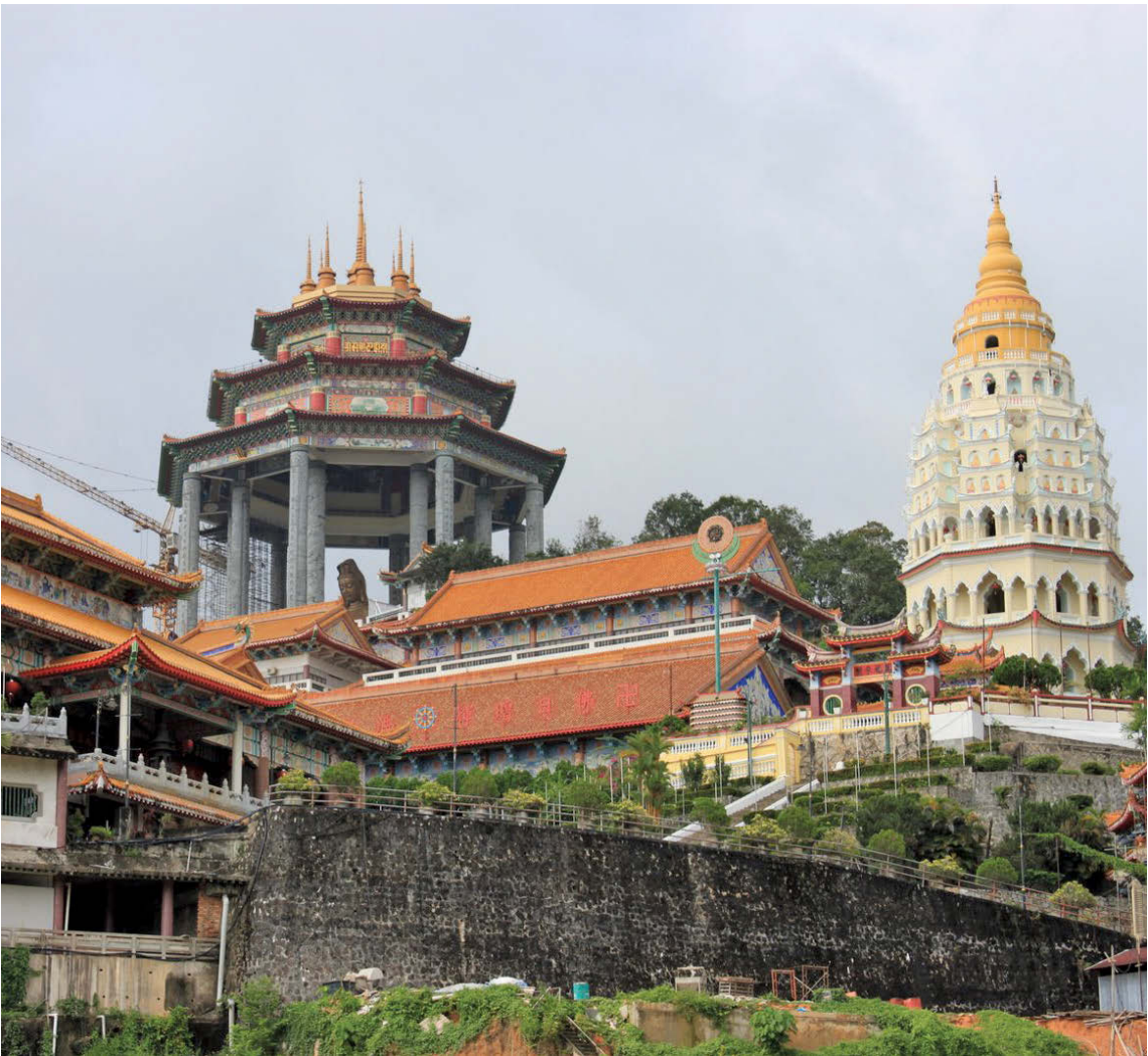
槟州政府将会退还额外征收的临时租赁准证费用给全槟的宗教场所，而这退款也符合2013年获批准、2014年3月生效的槟城土地条例修正案的要求，该修正案开始于2015年5日执法。

槟州首长林冠英宣布，州政府将会退还额外征收的临时租赁准证费用给全槟的宗教场所，而这退款也符合2013年获批准、2014年3月生效的槟城土地条例修正案的要求，该修正案开始于2015年5日执法。 林冠英表示，州政府进行这项修正，是因为根据2013年槟城土地条例修正案，临时租赁准证的费用太高。 “城区的计算法为每100平方公尺500令吉，郊区为每100平方公尺150令吉。这项收费比2005年槟城土地条例高出3倍，当时的收费为城区每100平方公尺150令吉，郊区为每100平方公尺50令吉。” “做为关注民生的政府，州政府决定修改临时租赁准证的费用，是基于相关组织属于非盈利组织，而是宗教场所、为公众进行宗教仪式的地方。同时，我们在2015年5月推行新的收费。新的城区临时租赁准证费用为首100平方公尺为110令吉，接下来每100平方公尺20令吉。至于郊区，首100平方公尺为45令吉，接下来每100平方公尺达10令吉。” 林冠英于9月9日召开记者会会见多个宗教团体代表时表示，根据重新修正的费用计算法，州政府同意退还向东北区12个宗教场所多征收的1万955令吉。 获得退款的12个宗教场所为： 1) 极乐寺住持 2) 斯里马力亚曼兴都庙 3) 西马教区教会(Synod Diocese Malaysia Barat) 4) 斯里阿鲁米古兴都庙 5) 斯里穆尼斯瓦拉兴都庙 6) Masjid At-Taqwa清真寺 7) 萨迪维纳亚加兴都庙 8) Chip Hock Tong Sam神庙主席 9) 姓林桥阴阳殿 10) 槟城玄天上帝 ‘Khay Thean Keong’ 11) Lim Kah Soo 12) Yeoh Ah Tai