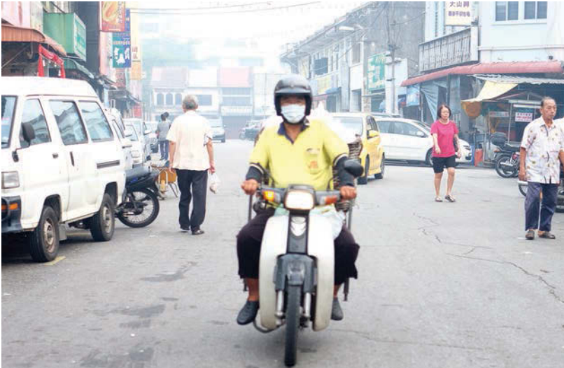
A motorcyclist in Bukit Mertajam taking precautions by wearing a mask.