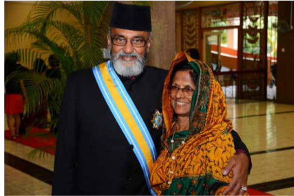
டத்தோ ஹஜி தஸ்லிம்