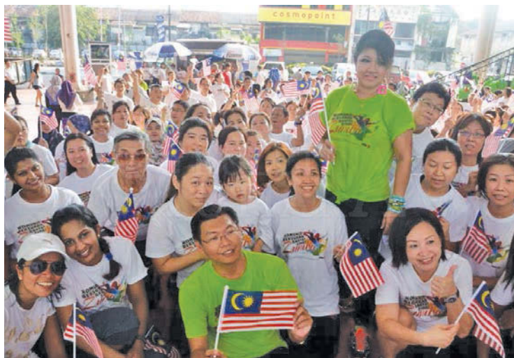
Teh (front row, centre), Mary (standing) and the participants cooling down after the 90-minute zumba session.

“It is commendable that you have successfully organised several events in the past including flowers for Mother’s Day, aprons giveaway for hawkers, flying the Jalur Gemilang and at the end of September, a mooncake and lantern festival.