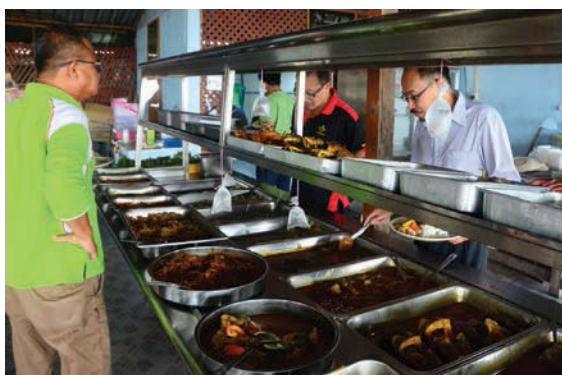
There's a wide array of home-cooked Malay dishes available for hungry customers.