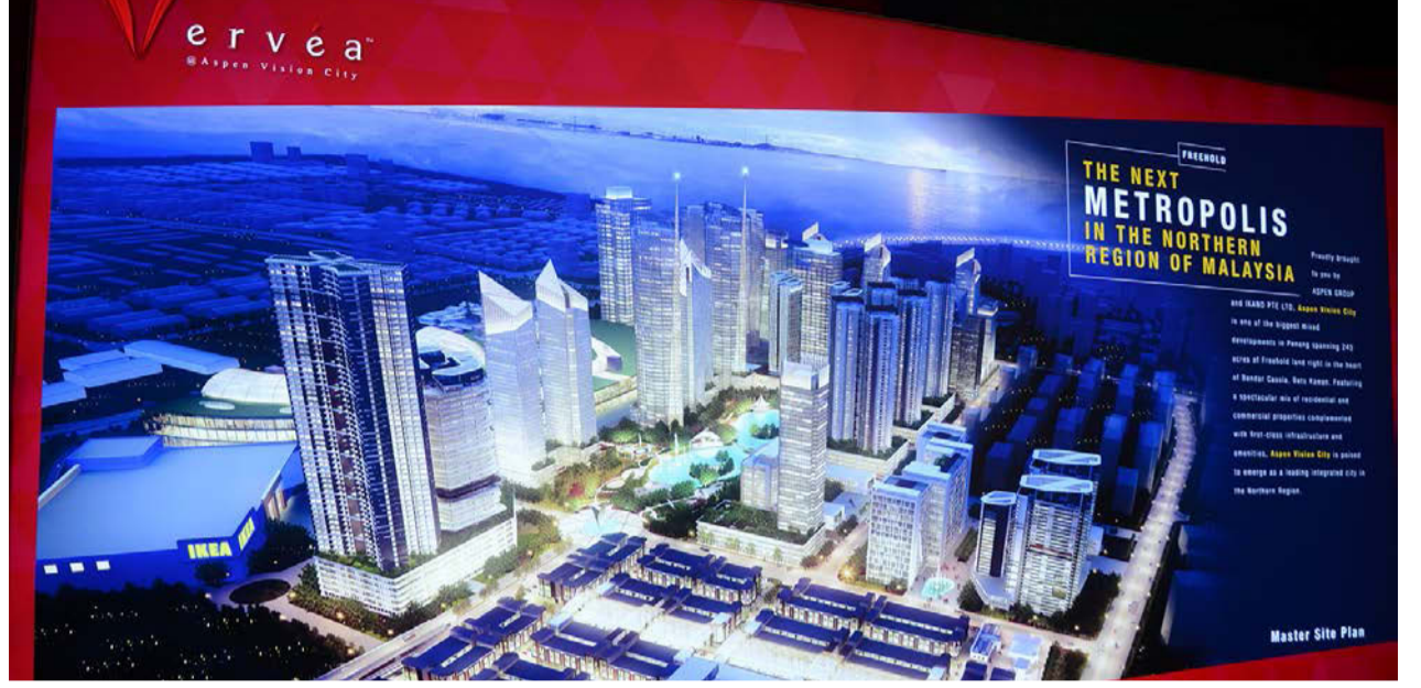
எஸ்பேன் விஷன் சிட்டியின் மாதிரி வரைப்படம்

இத்திட்டத்தில் கோலாம்பியா ஆசியா தனியார் மருத்துவமனை, உயர்கல்வி மையம் மற்றும் நட்சத்திர தங்கும்விடுதி என பல்வேறு அமைப்புகள் நிறுவப்படவுள்ளதாக மேலும் அவர் விவரித்தார். இம்மாதிரியான மேம்பாடுகளின் வழி பத்து காவான் நகரத்தை அனைத்துலக மற்றும் அறிவார்ந்த நகரமாக பிரகடனப்படுத்த முடியும் என்பது குறிப்பிடத்தக்கதாகும்.