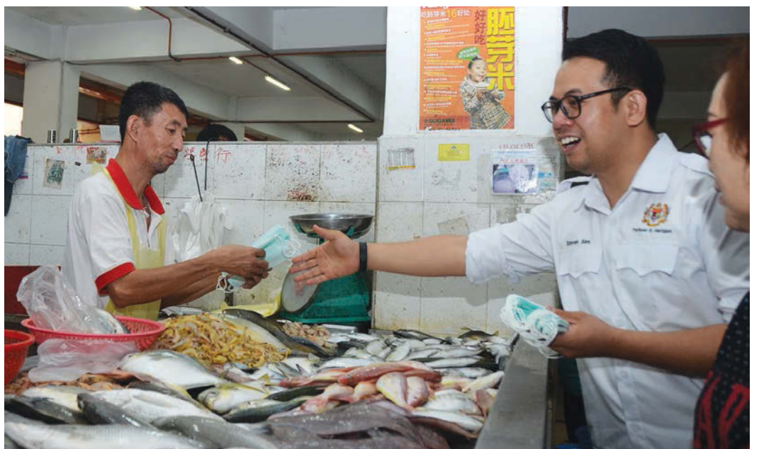
Bukit Mertajam MP Steven Sim busy distributing face masks to traders at the market.