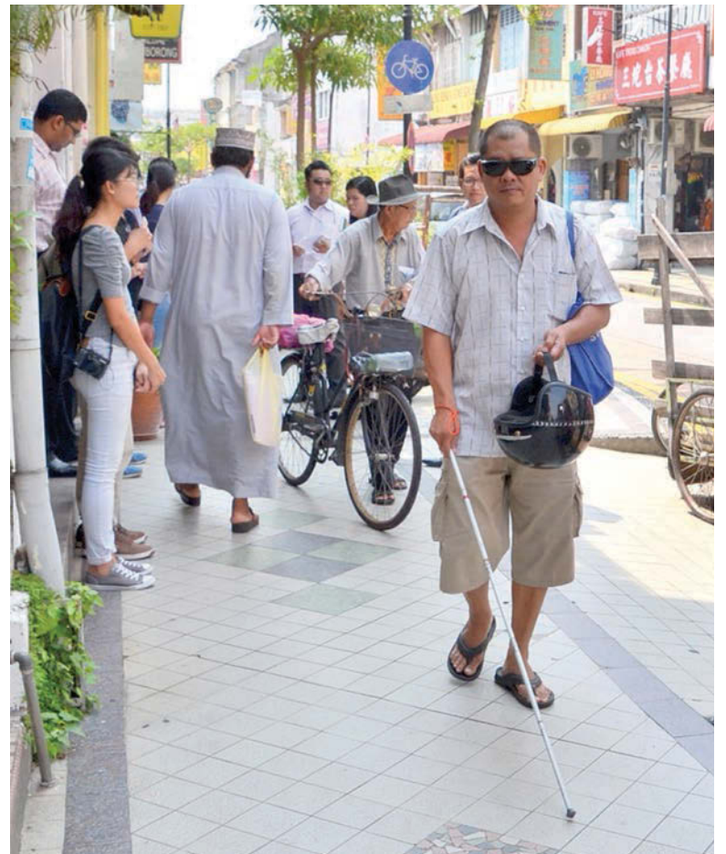
基于许多民众也投诉新街路段的现有停车位不足，因此在施工后，有关路段的停车位也将从53个增加至80个，并有3个能力差异人士停车位以及3个卸货区。