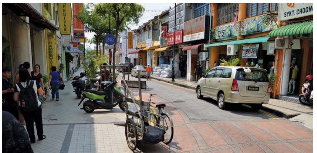
新街“拉直”工程涉及的路段全长700公尺，出了将道路“拉直”以外，更将路面的宽度由原来的5公尺，增加2.5公尺至7.5公尺。