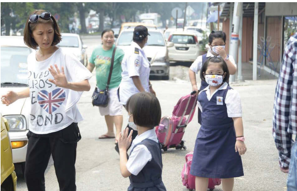
Paya Terubong was shrouded in haze and parents ensured their children were protected with face masks.