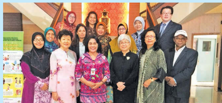
The delegates with the Director and staff of BP3AKB.