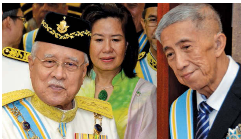
The Governor greeting Ooi (right) after the investiture ceremony.

He became a teacher in Li Tek Chinese school before joining the