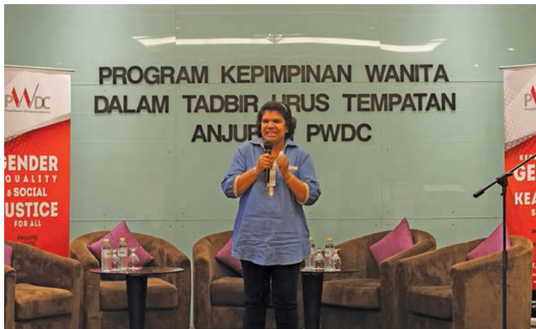
参与者在练习如何演讲的环节中发挥的淋漓尽致。