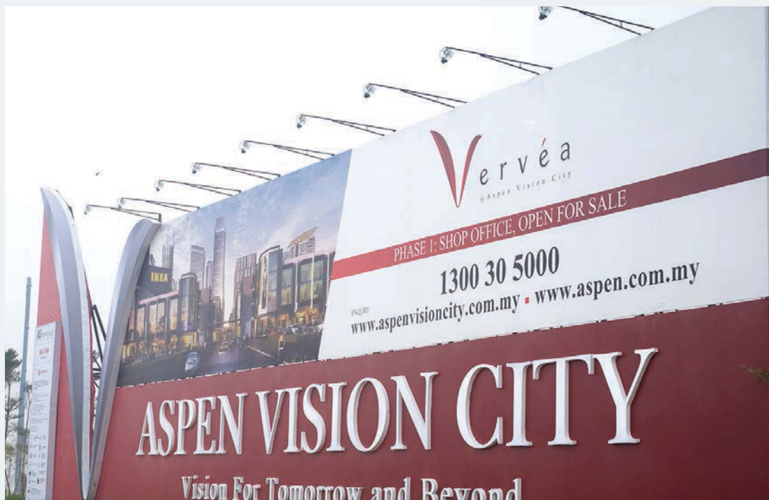
峇都加湾Aspen Vision City发展计划正式动土；槟州政府将把峇都加湾及毗邻的地区规划成新颖先进的卫星市，而民众将有机会在网上发表意见为新卫星市命名！