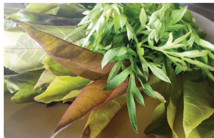
Ulam or raw green herbs and vegetables are fresh, healthy and tasty with sambal belacan or sambal cinalok.

Story by Chan Lilian