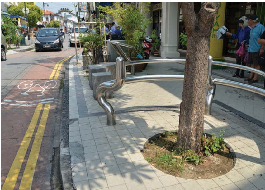
新街“拉直”工程将于9月底开始，施工时间为晚上10时至清晨5时，预计将在年底竣工。