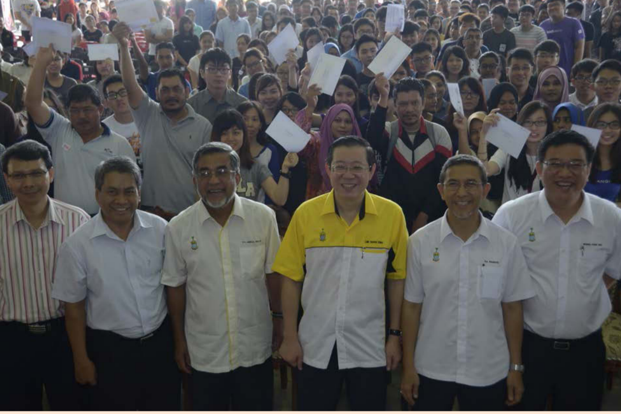
ஊக்கத்தொகை பெற்றுக்கொண்ட மாணவர்களுடன் மாநில முதல்வர் மேதகு லிம் குவான் எங் மற்றும் அரசியல் தலைவர்கள்

பினாங்கு மாநில அரசு கடந்த 2008 முதல் 2013 வரை கூடுதல் வருமானமாக ரிம453 லட்சம் பெற்றுள்ளதால் தொடர்ந்து உயர்கல்வி மையங்களில் வாய்ப்பு கிடைக்கப்பெற்ற மாணவர்களுக்கு ரிம1,000 ஊக்கத்தொகையாக வழங்குகிறது. மாநில அரசு கடந்த 5 ஆண்டுகளிலே ரிம453 லட்சம் கூடுதல் வருமானம் கிடைக்கப்பெற்ற வேளையில் கடந்த 50 ஆண்டுகளில் தேசிய முன்னணி ஆட்சியில் ரிம373 லட்சம் மட்டுமே பெறப்பட்டுள்ளது எனச் சுட்டிக்காட்டினார் மாநில முதல்வர் மேதகு லிம் குவான் எங்.