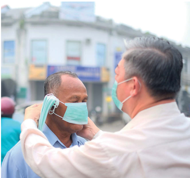
州内烟霾情况恶劣，民众纷纷带上口罩以防烟霾危害健康。