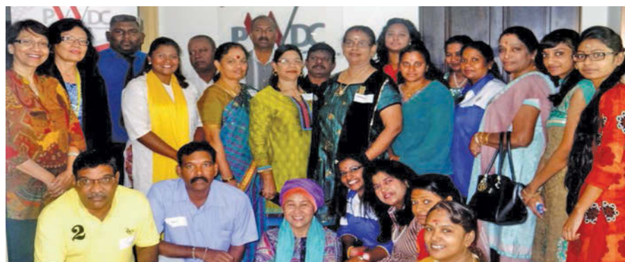
Participants from 7 different NGOs.

logue between YB Kasthuri and NGO representatives from a total of 7 organisations. This particular dialogue was specifically targeted at Tamil-speaking communities. Similar dialogues are planned in the future to reach out to different communities, and to engage in partnerships with different NGOs to work towards a more inclusive and gender-friendly Penang.