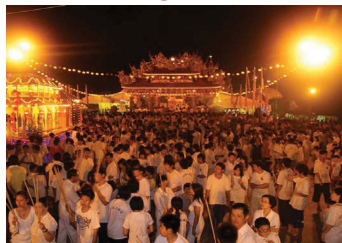
13st - 21st Oct Nine Emperor Gods Festival

Tingkat 47, Komtar, 10503 Penang Phone : 04-650 5468 I Fax : 04-261 5923 Email: buletinmutiara.bpkn@gmail.com