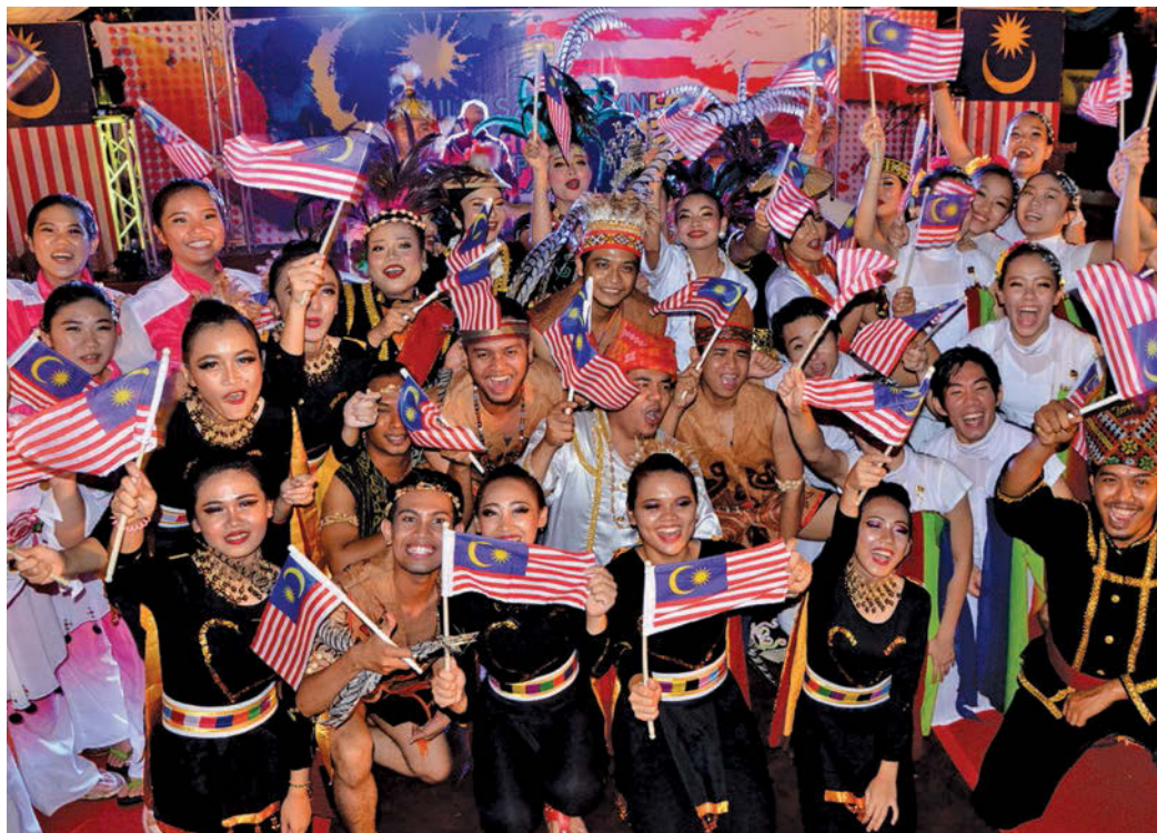
The dance teams celebrating Malaysia Day

The celebration ended with everyone singing along to "Saya Anak Malaysia" – culminating in a beautiful night of unity of race and religion for everyone.