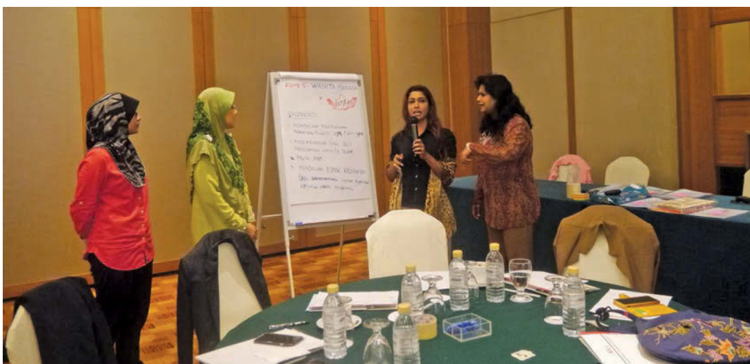
小组呈现讨论的结果