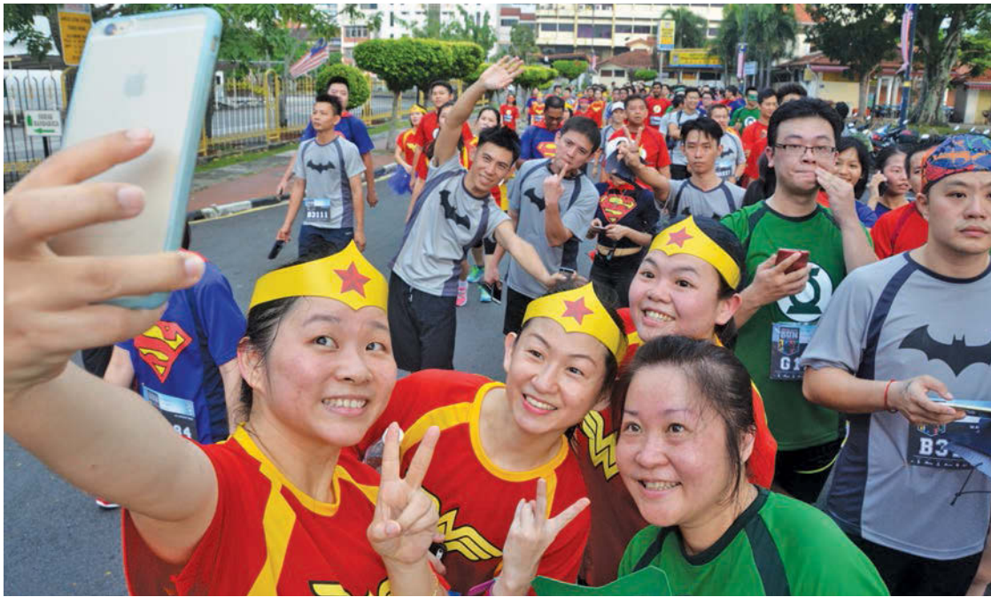
Wonderwomen do not only race against the clock but they also find time to take selfies along the scenic routes while Batmen and Supermen caught up with them.

Story by Chan Lilian