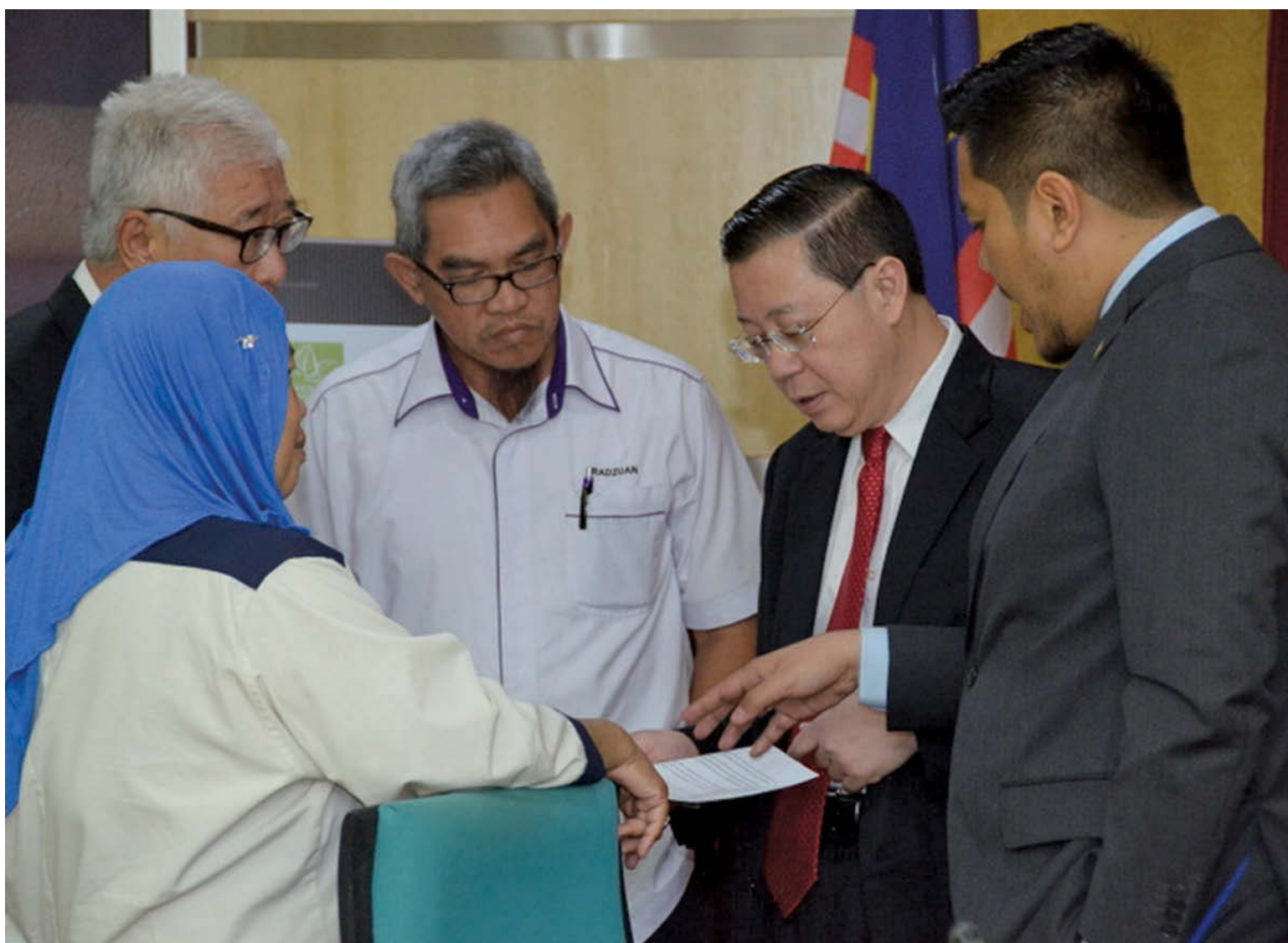
下放指示让执法单位捕杀野狗以抑制疯狗症疫情蔓延是一项艰难的决定，但槟州政府为了全槟人民的安全及健康着想，在听取医疗专家的劝告后唯有做出这抉择。

他重申，州政府必须保障人民的健康及安全，绝对不能够等到有人因染上疯狗症而逝世后才采取行动。