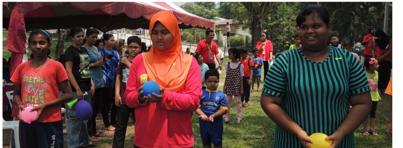
போட்டி விளையாட்டில் கலந்து கொண்ட சிறுவர்கள்