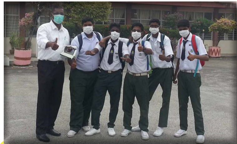
புகை மூட்டடப்பிரச்சனையில் அவதிப்படும் மாணவர்களுக்கு முக கவசம் (mask) வழங்கினார் ஸ்ரீ டெலிமா சட்டமன்ற உறுப்பினர் நேதாஜி இராயர்