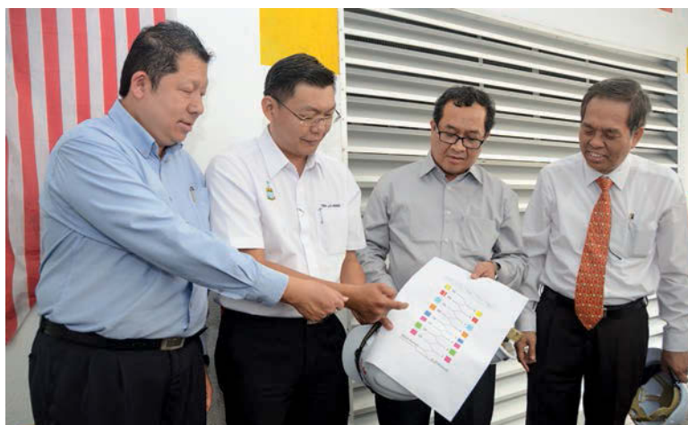
(From left) Cheong, Teh, Rosli and Ang discussing the upgrading works for Komtar multi-storey car park.

Season parking rates for cars will also remain at RM100 per month and for motorcycles, RM 20 for two months.