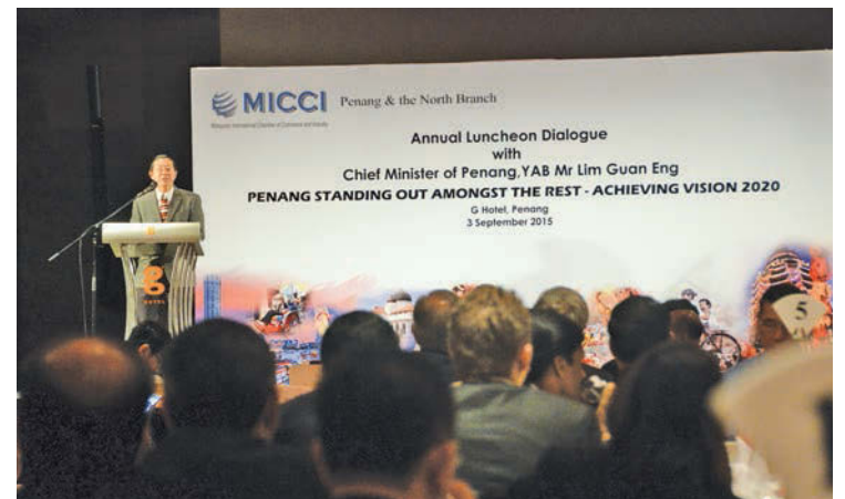
Captains of industry listen attentively while Lim briefs them on the country's current economic scenario.

Lim also advised the federal government to focus on reducing waste and eliminating corruption during the tabling of the Federal Budget in October and more importantly to emulate Penang's