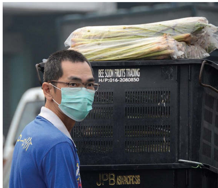
州内烟霾情况恶劣，民众纷纷带上口罩以防烟霾危害健康。