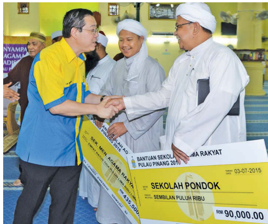
Lim (left) congratulating the representatives from the Islamic institutions after they received the financial aid.

An additional bonus for the Raya celebrations, amounting to between RM200 to RM300 per person, for 1,975 religious teachers and all teaching staff in these Islamic institutions has also been announced by the state which will