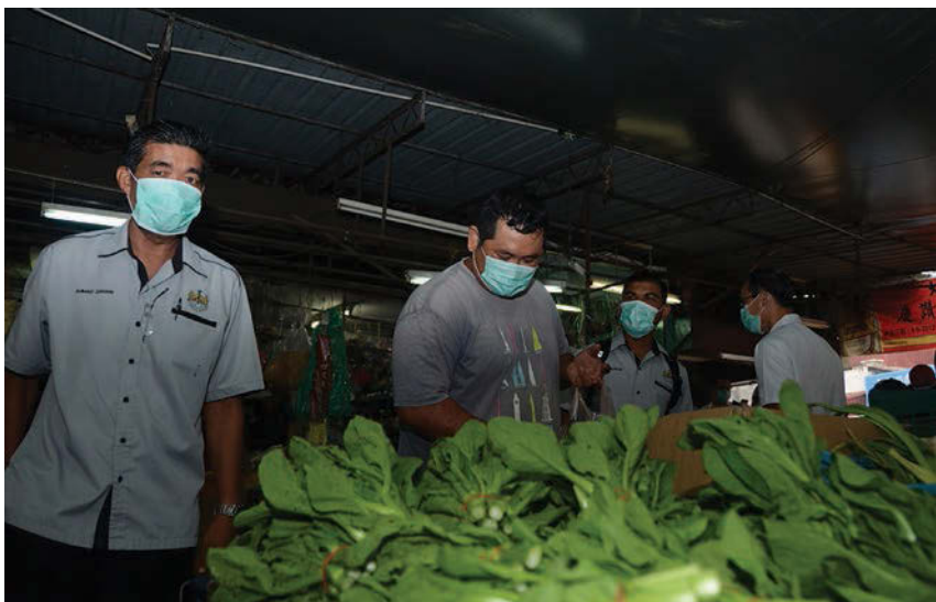
州内烟霾情况恶劣，民众纷纷带上口罩以防烟霾危害健康。