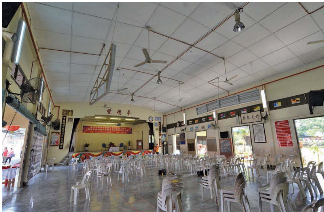
槟州首长林冠英宣布拨款10万令吉给威北甲抛峇底培育小学以进行礼堂重建计划。