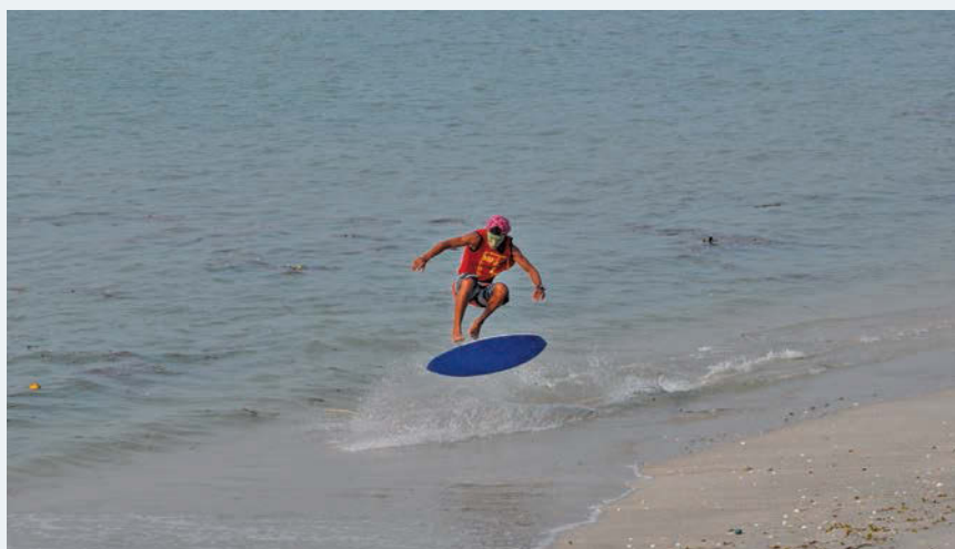
Sonny from the Philippines in action.

It was an interesting sight as the athletes