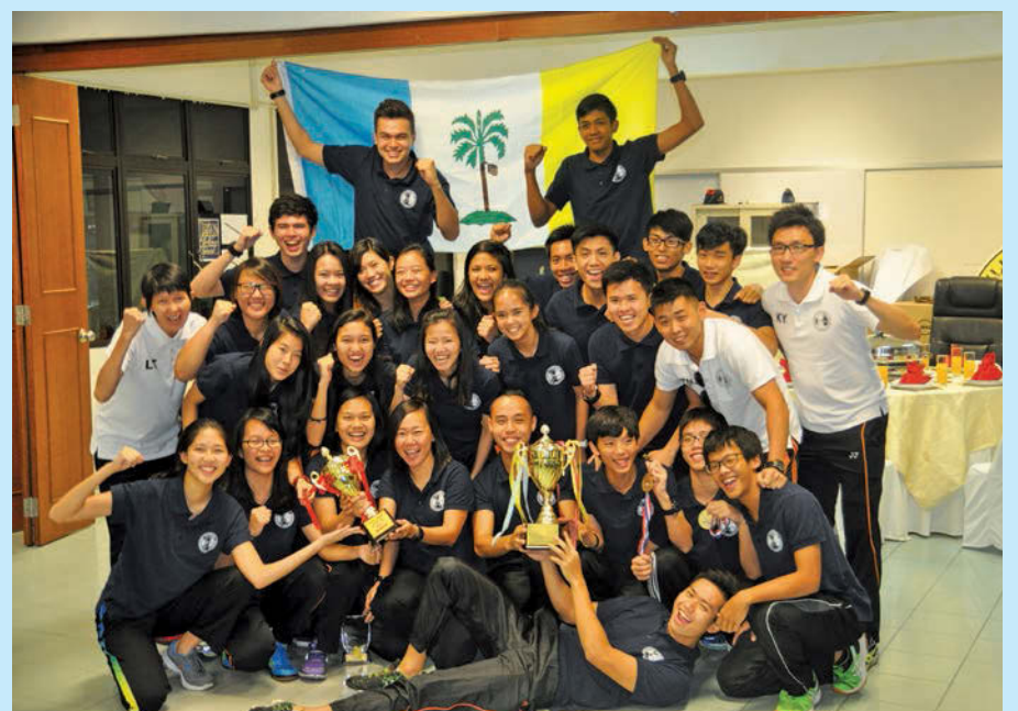
The Penang floorball team celebrating their success.