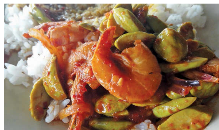
Who can resist prawn petai sambal with hot white rice?

End your meal with a bowl of ais kacang or cendol by the seaside, watching fishing boats bobbing in the seas.