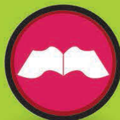
快乐学生 (小一及小四；中一及中四)