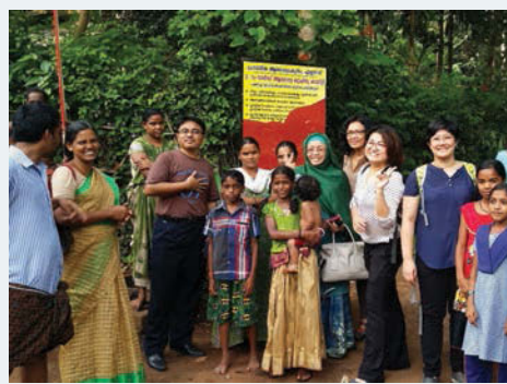
Delegation and residents of the Pazhanur Panchayat during a working visit to a women-run home-based enterprise.

FROM 17 till 21 August 2015, the Office of the EXCO for Women, Family and Community Development together with Majlis Perbandaran Seberang Perai (MPSP) and the Penang Women's Development Corporation (PWDC) conducted a working visit to the Kerala Institute of Local Administration (KILA) in Kerala.