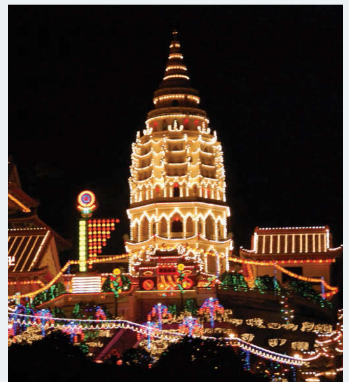
File photo of Kek Lok Si temple which is a tourist destination in Penang and also a house of worship for many.

The Penganut Tokong Sun Hai Yim Yeong received the highest refund of RM2,310, followed by Pertubuhan Swamimalai Sri Muniswarar which got RM1,830.