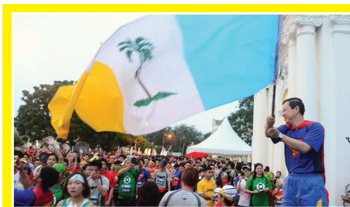
SUPERHERO RUN... Despite his hectic schedule and the serious nature of his job, Chief Minister Lim Guan Eng showed a lighter side as he attended an event in a Superman suit complete with with red cape. - See Pg 9 for full story.

Owners are to keep their dogs under effective control by either caging or putting a leash on the them. Any dog found within a rabies-infected area which is not under effective control may be put to sleep by any authorised veterinary