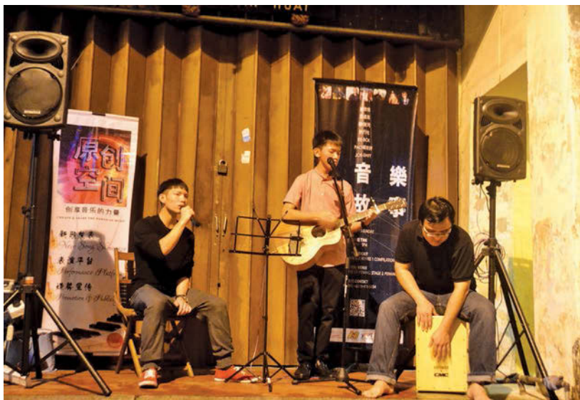
《原创空间》提供创作者一个发表和宣传作品的平台。