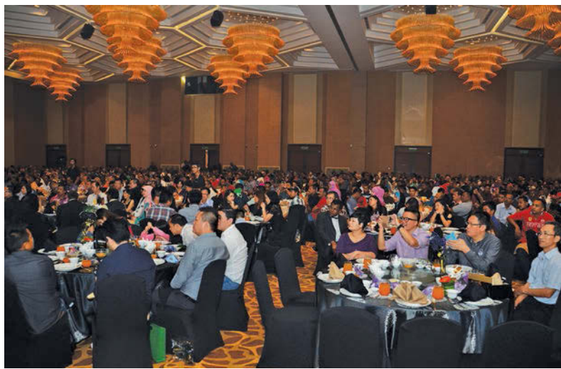
Staff of PBAPP enjoying themselves at the annual dinner.

PERBADANAN Bekalan Air Pulau Pinang (PBAPP) feted its staff to a glamorous appreciation dinner on Sept 12.