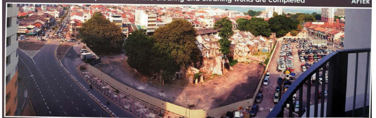
Aerial view of the shophouses after the clearing and cleaning works are completed