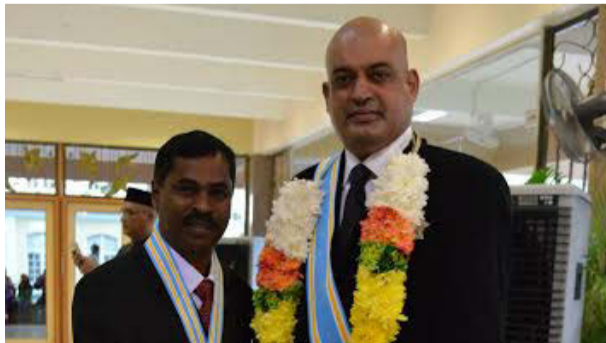
டத்தோ இராமநாதன் பிள்ளை

நிதியுதவி வழங்கியதோடு குழந்தை மற்றும் முதியவர் பாதுகாப்பு ஆசிரமத்திற்கு நில அன்பளிப்பு கொடுத்த கொடைவள்ளல் எனப் பறைச்சாற்றலாம்.