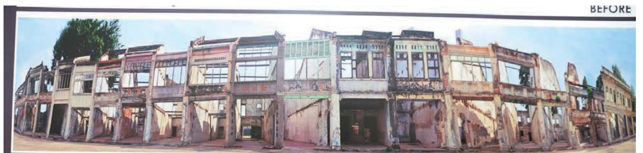
Panoramic view of the shophouses after the clearing and cleaning works are completed