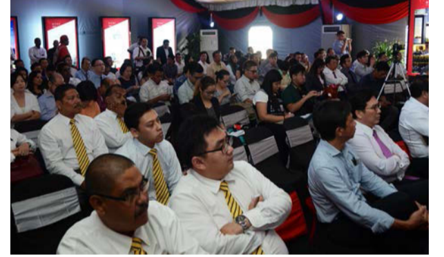
நிகழ்வில் கலந்து கொண்ட பிரமுகர்கள்

இத்திட்டத்தில் வர்த்தகம் மற்றும் குடியிருப்பு வசதி என பல்வேறு உள்ளடக்கியுள்ளது. சுமார் 200 ஹெக்டர் நிலப்பரப்பில் 11,800 மலிவுவிலை வீடுகள் இன்னும் 10 முதல் 15 ஆண்டுக்குள் கட்டப்படவிருப்பது பாராட்டக்குறியதாகும். அஸ்பேன் விஷன் சிட்டி அடிக்கல்நாட்டு விழாவில் பினாங்கு மாநில ஆட்சிக்குழு உறுப்பினர்கள், சட்டமன்ற உறுப்பினர்கள், முக்கிய பிரமுகர்கள் என அதிகமானோர் கலந்து சிறப்பித்தனர்.