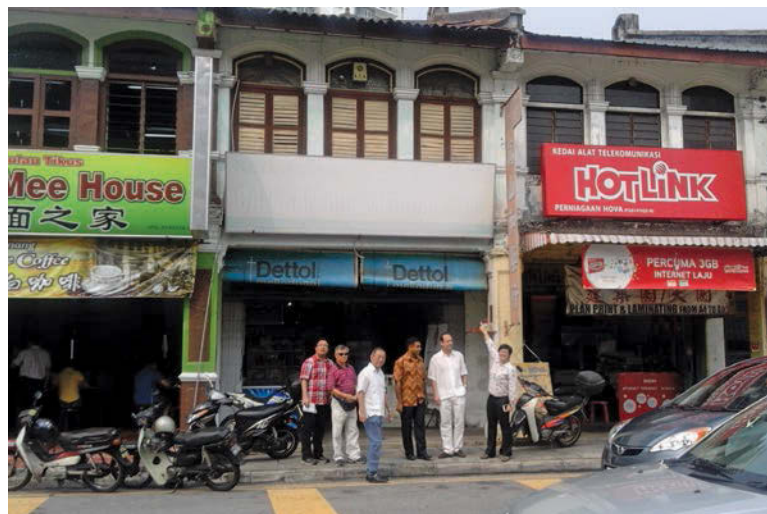
Yap (right) together with the landlord's representatives and Hamdan (third from right) viewing the exact specifics that need to be done to restore the shophouses.

The cost of the restoration work will be shared among Think City, the landlord and Yap's office.