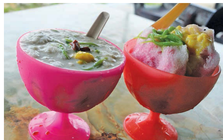
After a spicy curry lunch, cendol and ais kacang are the perfect dessert.