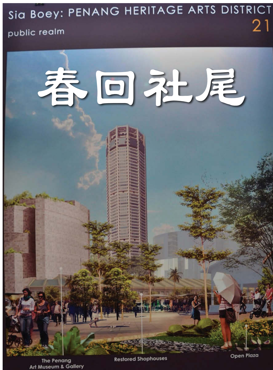
The Penang Art Museum & Gallery