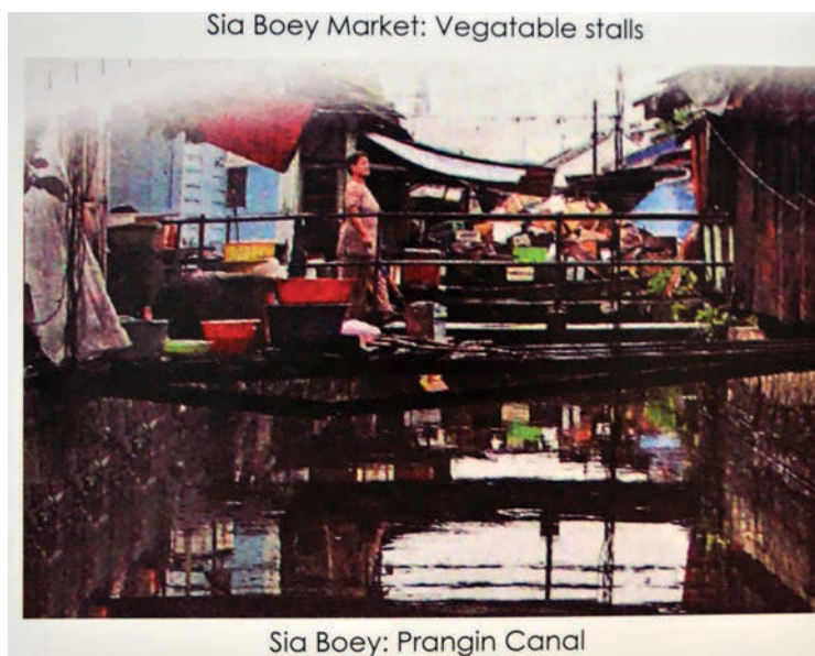
Sia Boey Market: Vegetable stalls