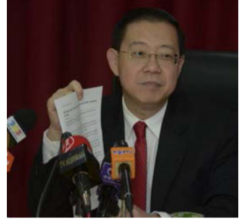
மாநில முதல்வர் ராபிஸ் தொற்றுநோய் பற்றிய சுகாதாரத் துறை அறிக்கையைக் காண்பிக்கிறார்.

அரசு சாரா இயக்கங்கள் மாநில அரசின் இந்நடவடிக்கைக்கு எதிர்ப்புத் தெரிவித்த போதிலும் மக்களின் சுகாதாரத்தை கருத்தில் கொண்டு மாநில அரசு தொடர்ந்து வெறிப்பிடித்த நாய்கள் ஒழிக்கும் செயலில் ஈடுபடும் என முதல்வர் திட்டவட்டமாகக் குறிப்பிட்டார்.