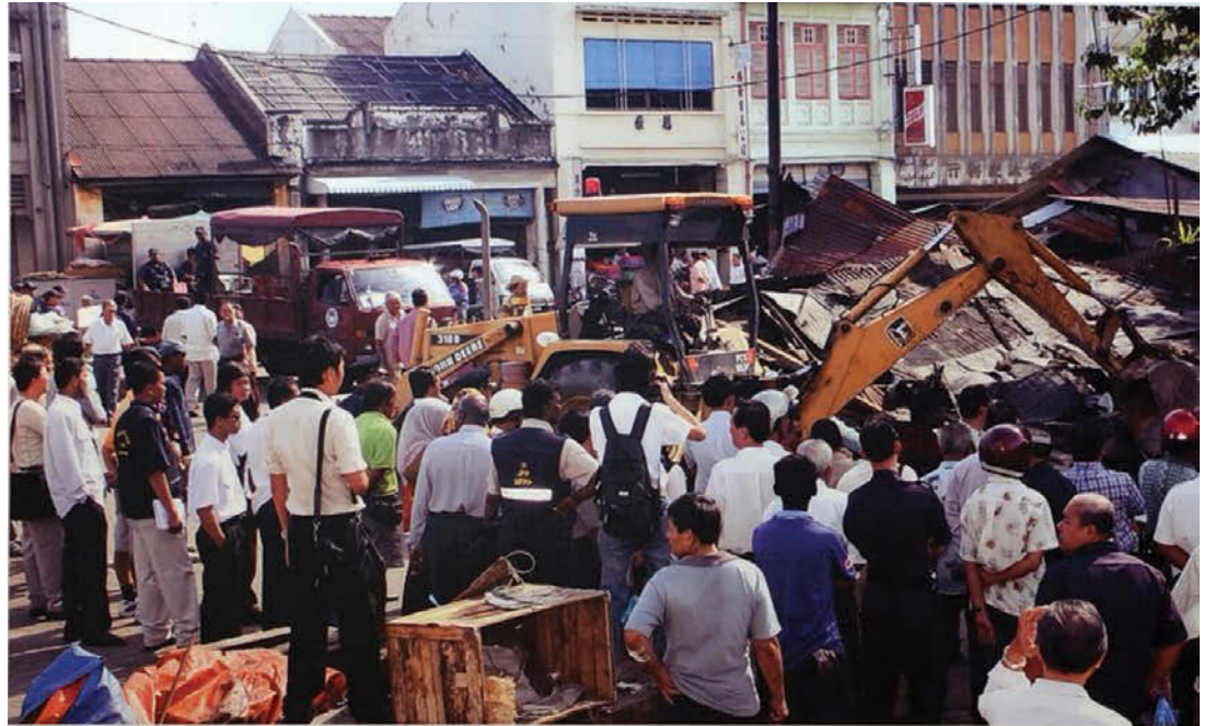
Sia Boey Market: Demolition works. Most of the vendors have moved out in 2004