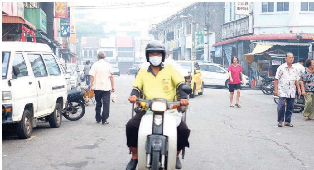
州内烟霾情况恶劣，民众纷纷带上口罩以防烟霾危害健康。