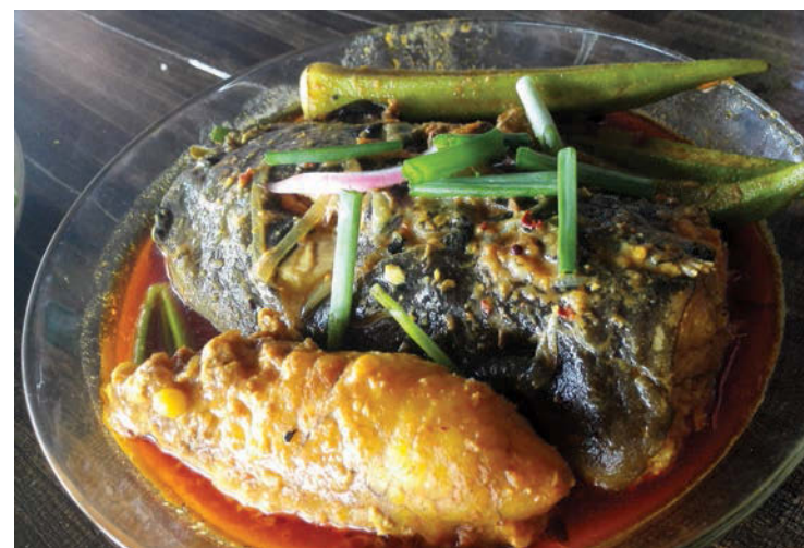
The ikan sembilang sells out very fast but the huge head is even more delicious. Seen here are the fish roe, head and okras.