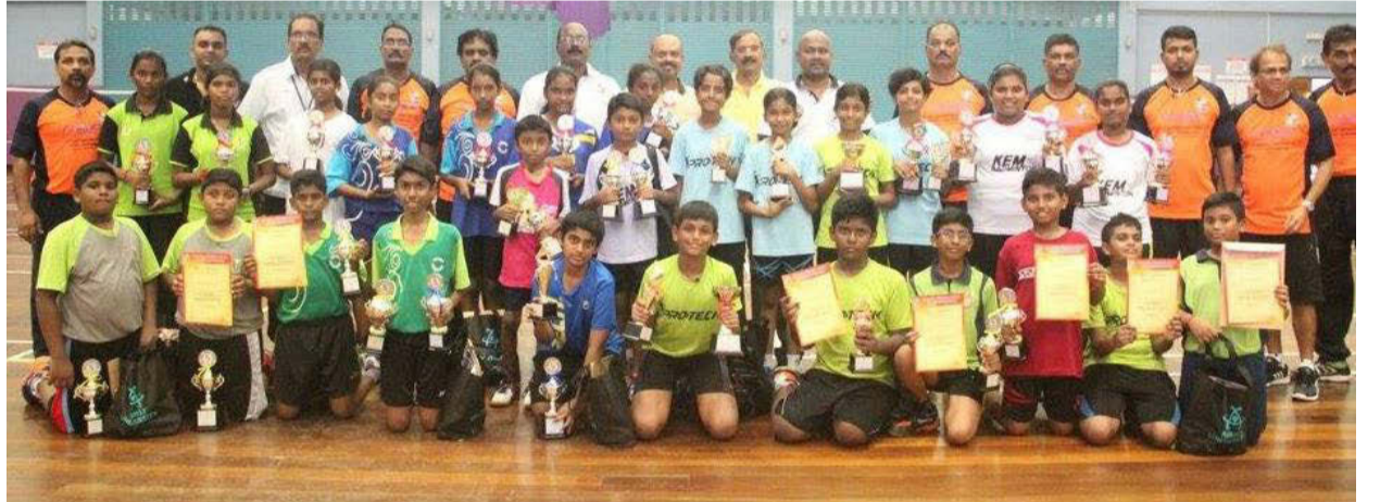
வெற்றி பெற்ற மாணவர்களுடன் ஏற்பாட்டு குழுவினர்

இந்திய மாணவர்களுக்குப் போட்டி விளையாட்டின் முக்கியத்துவத்தையும் அதனை கையாளும் விதத்தைப் பற்றிய விழிப்புணர்வை மேலோங்கும் அம்சமாக இவ்விளையாட்டு போட்டி அமைந்தது என்று இதன் ஏற்பாட்டு