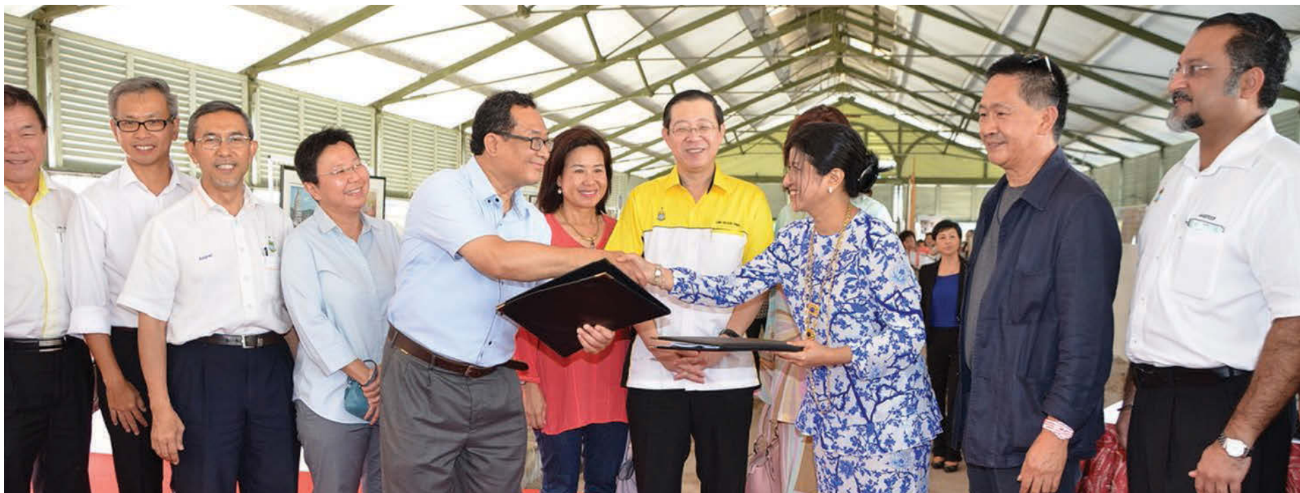
槟州首长林冠英（右5）见证槟州发展机构及哈芝再努丁基金会双方在乔治市兴建新的标志性槟城灵感艺术馆（Ilham Penang）合作签署仪式。

槟州发展机构已经允许将建议中5.5英亩的槟城古迹艺术专区其中的1.5英亩土地，以30 + 30年的方式出租给哈芝再努丁基金会，特别用来兴建标志性的槟城灵感艺术馆。