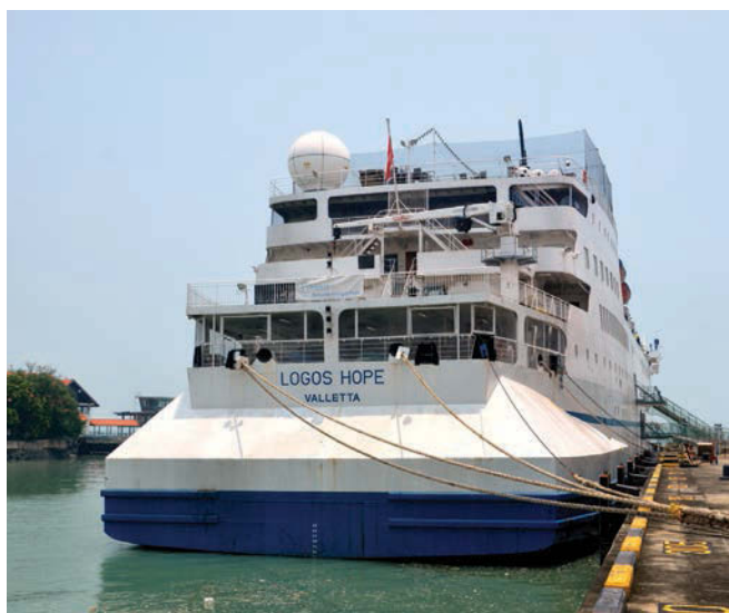
Logos Hope docked at the Swettenham Pier Cruise Terminal.

Tickets for the Family Fun Day are free of charge but it is on a first come, first served basis.