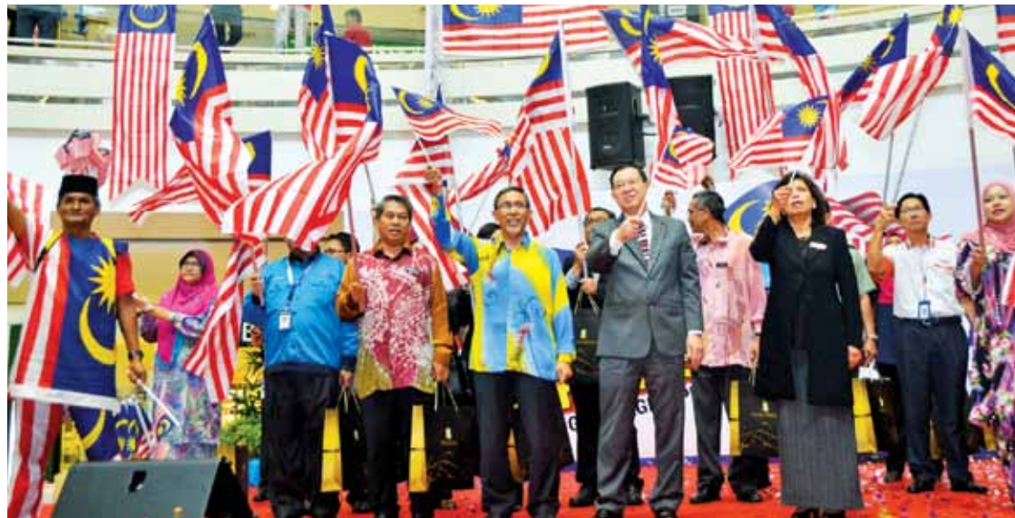
The Jalur Gemilang is waved in the spirit of Merdeka.

Various programmes such as boria performances, coloring