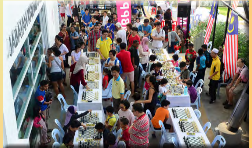
பிளாங்கு மாநகர கழகத்தின் ஏற்பாட்டில் நடைபெற்ற சதுரங்க போட்டியில் சிறுவர்கள் அதிகமானோர் கலந்து கொண்டனர்.