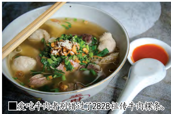
■爱吃牛肉者别错过了2828祖传牛肉粿条。