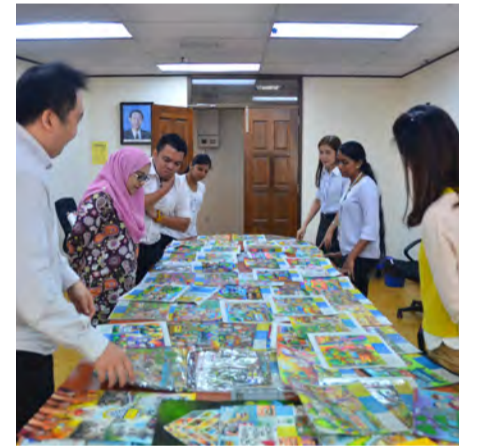
முத்துச் செய்திகள் நாளிதழின் வர்ணம் தீட்டும் போட்டி 2017-இல் கிடைக்கப்பெற்ற படைப்புகள்

சிறுவர்களுக்கான வர்ணம் தீட்டும் போட்டி 2017-ன் முதல், இரண்டாம் மற்றும் மூன்றாம் நிலை வெற்றியாளருக்கு தத்தம் ரிம 400, ரிம250, ரிம150 என ரொக்கப்பணம் வெற்றியாளர்களுக்கு பரிசாக வழங்கப்படவுள்ளன. இம்முறை வர்ணம் தீட்டும் போட்டியின் கருப்பொருள் "நான் நேசிக்கும் பினாங்கு" என்பதாகும். இதன்வழி, மாணவர்களிடையே மாநிலத்தின் மீது அன்பும் பற்றும் மேலோங்க இப்போட்டி வழிவகுக்கும் என நம்பப்படுகிறது.