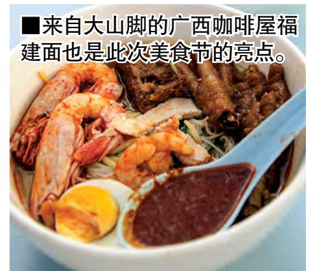
■来自大山脚的广西咖啡屋福建面也是此次美食节的亮点。