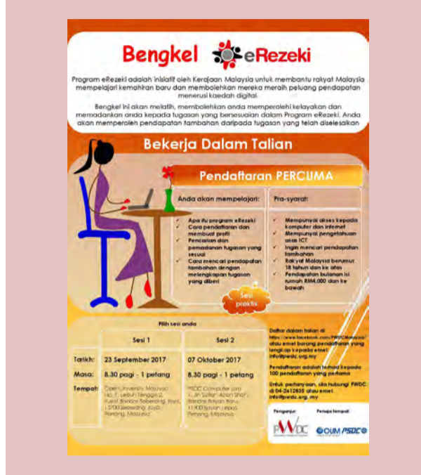
இணையம்வழி வருமானம் பெறும் திட்டப் பிரச்சுரம்

பினாங்கு மேம்பாட்டுக் கழகம் பெண்கள் மற்றும் ஆண்கள் பாகுபாடு, நல்ல ஆட்சி மற்றும் சமூக நீதி ஆகியவற்றில் சமத்துவமின்மையின் துடைத்தொழிக்கும் அடிப்படைக் கொள்கைகளின் மூலம் பினாங்கில் அதிகமான பெண்களுக்கு பொருளாதார நடவடிக்கைகளில் ஈடுபடுவதற்கு