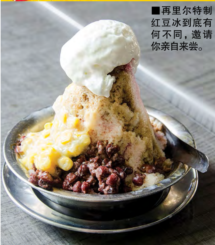
■再里尔特制红豆冰到底有何不同，邀请你亲自来尝。