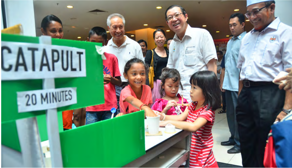
செபராங் ஜெயாவில் நடைபெற்ற ஸ்தேம் திறப்பு விழாவில் அறிவியல் படைப்புகளை பார்வையிட்டார் மாநில முதல்வர் மேதகு லிம் குவான் எங்.

பிளாங்கு மாநில அரசாங்கம் அறிவார்ந்த சமூகத்தை உருவாக்கும் நோக்கில் பல அரிய முயற்சிகளை மேற்கொண்டு வருகிறது. அதன் மற்றொரு முயற்சியாக அறிவியல், தொழில்நுட்பம், பொறியியல், கணிதம் (STEM 4.0) என்ற திட்டத்தை அண்மையில் பெருநிலத்திலும் தீவுப்பகுதியிலும் பிளாங்கு மாநில முதல்வர் மேதகு லிம் குவான் எங்