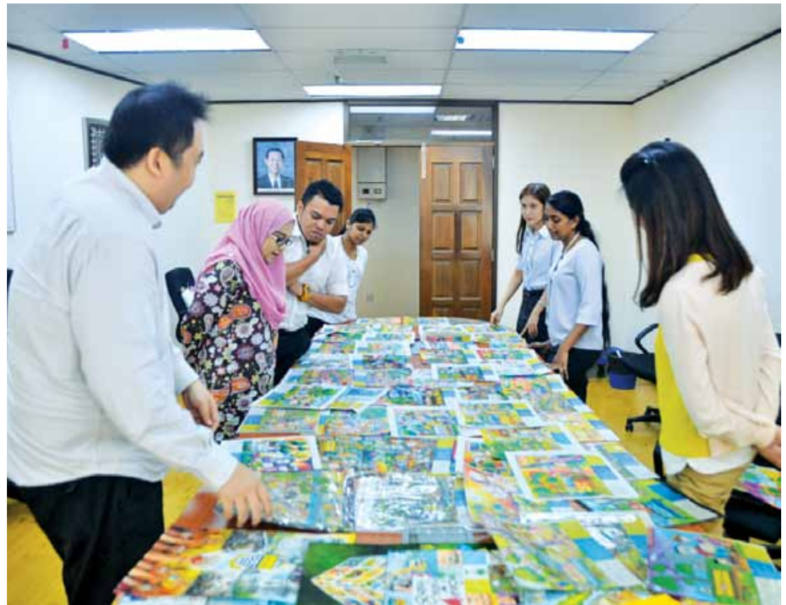
Merely sorting out the entries is a daunting task, not to mention the selection of the top three winners of each category.

The winners of the ‘I Love Penang’ category will be receiving