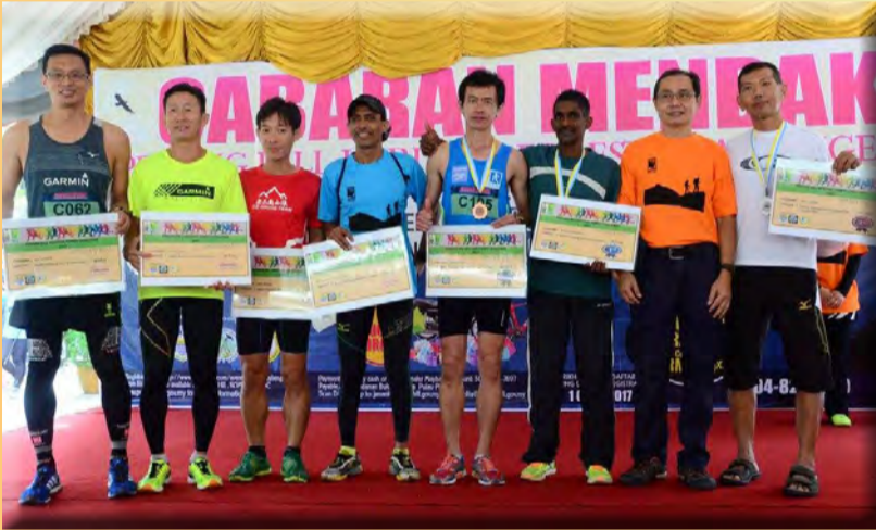
பிளாங்கு கொடிமலை மலை ஏறும் போட்டியில் வெற்றிப்பெற்ற வெற்றியாளர்கள்