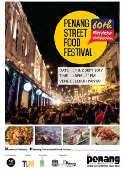
'பிளாங்கு அனைத்துலக உணவு விழா' பிரச்சுரம்

கடந்த ஏப்ரல் மாதம் நடைப்பெற்ற அனைத்துலக உணவு விழாவில் வருகையாளர்களிடமிருந்து அதிகமான வரவேற்பு பெற்றதை