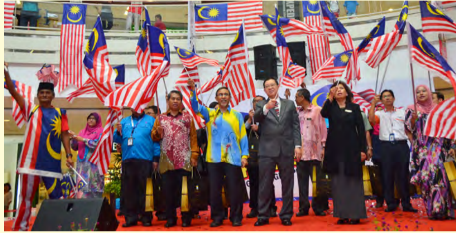
சுதந்திர மாதக் கொண்டாட்ட தொடக்க விழாவில் கலந்து கொண்ட மாநில முதல்வர் மற்றும் அரசு தலைவர்கள் .

மாநில முதல்வர் தமது உரையில் பினாங்கு வாழ் மக்கள் ஒருவருக்கொருவர் சண்டையிடாமல் ஒற்றுமையுடன் செயல்படுவதோடு சுதந்திர தின