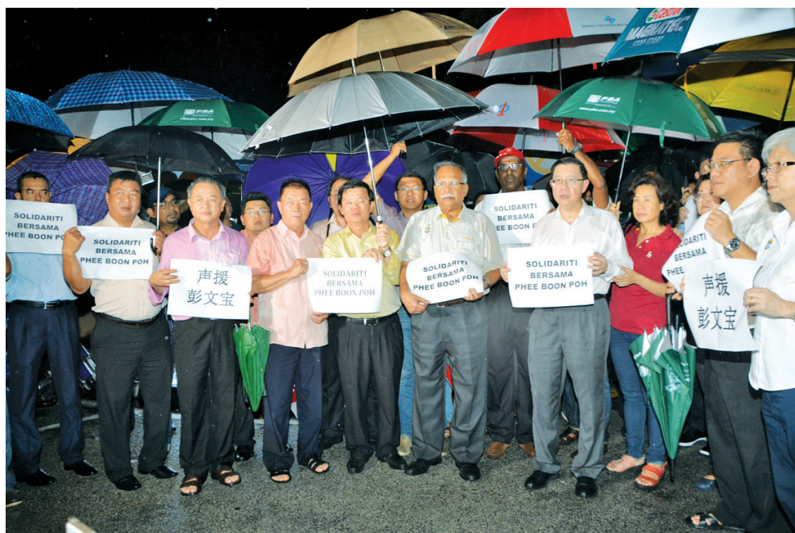
Phee's colleagues turned up in full force at night to show solidarity with him.