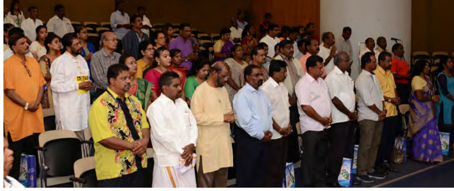
நிகழ்வில் கலந்து கொண்ட பொது மக்கள் மற்றும் பிரமுகர்கள்

இந்நாட்டின் பல ஆலயங்களில் அர்ச்சகர்கள் பற்றாக்குறை ஏற்படுகிறது. எனவே, எதிர்காலத்தில் அர்ச்சகர்கள் பற்றாக்குறை பிரச்சனையைக் களைய இந்து அறப்பணி வாரியம் "சமயக்கல்வி மையம்" அமைக்க எண்ணம் கொண்டுள்ளது. எனவே இந்த பட்டறையில் கலந்து கொள்ளும் ஆலய