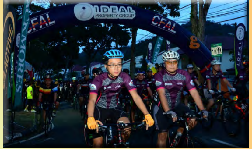
பிளாங்கு மாநகர கழகத்தின் ஏற்பாட்டில் நடைபெற்ற மிதிவண்டி ஓட்டத்தில் கலந்து கொண்ட பங்கேற்பாளர்கள்