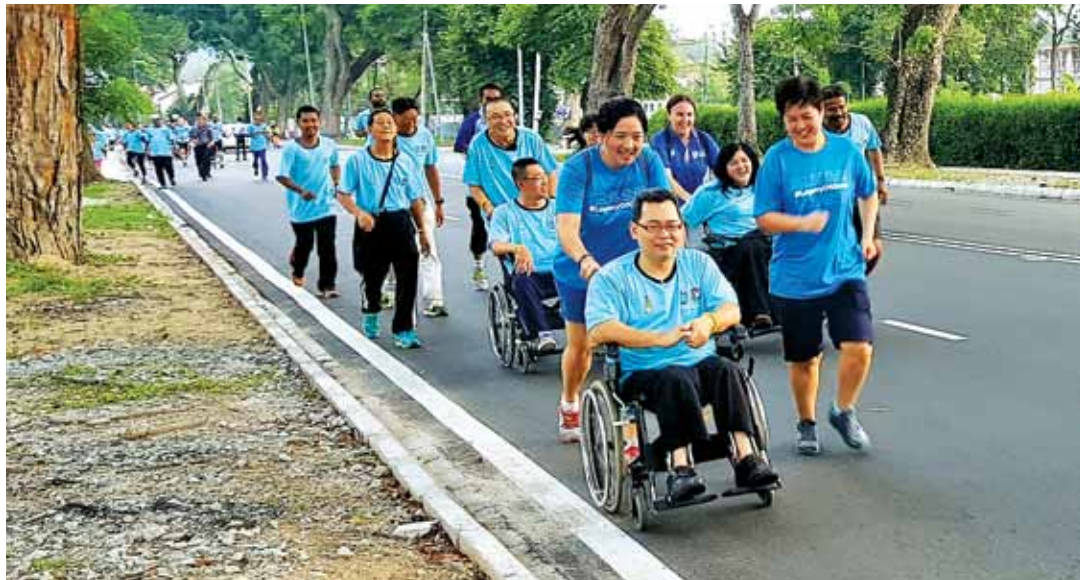
Participants are all gung-ho as they enjoy the run.

Story by Tanushalini Moroter