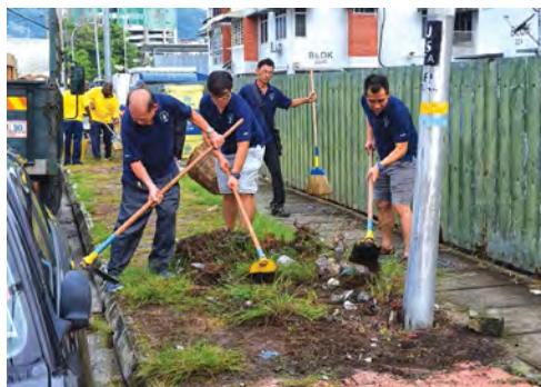
■居民们协力清理垃圾，一同改善区内的卫生环境。

双溪槟榔区州议员林秀琴说，民众在雨季来临期间需更注意住家环境卫生，避免沟渠及花盆等物件出现积水，以杜绝黑斑蚊滋生，防止骨痛热症。