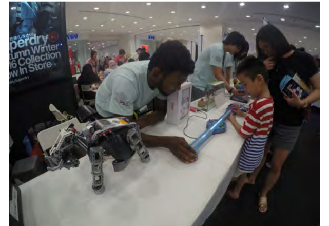
அறிவியல் மற்றும் தொழில்நுட்ப புத்தாக படைப்புகள்

இத்திட்டத்தின் வழி சிறுவர்களிடையே புத்தாக சிந்தனையும் பகுத்தறிவும் மேலோங்கச் செய்ய சிறந்த தூண்டுகோலாக அமையும் என நம்பிக்கை தெரிவித்தார். நகரம் மட்டுமின்றி கிராமப்புறங்களிலும் இத்திட்டம் அமல்படுத்தப்படும் என மேலும் தெரிவித்தார். இதன்வழி அறிவார்ந்த சமுதாயத்தை உருவாக்க முடியும் என்பது வெள்ளிடைமலை. பிளாங்கு மாநிலத்தை அனைத்துலக ரீதியில் அறிவார்ந்த மாநிலமாக பிரகடனப்படுத்த இத்திட்டங்கள் மையக்கல்லாக அமையும் என்பது குறிப்பிடத்தக்கதாகும்.