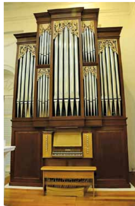
The new bicentenary pipe organ.

After four years of planning, the new pipe organ was designed and built by Mander Organs of London, who are known for their celebrated 68-stop organ at St Ignatius Loyola Church, New