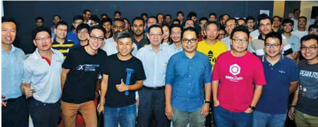
Lim (centre) with the enthusiastic speakers and participants who are eager to share and reap their success in the Industrial Revolution 4.0.

The event, already into its second year, is also a platform and launch pad in bringing the tech-startup community under one roof with the provision of necessary support and