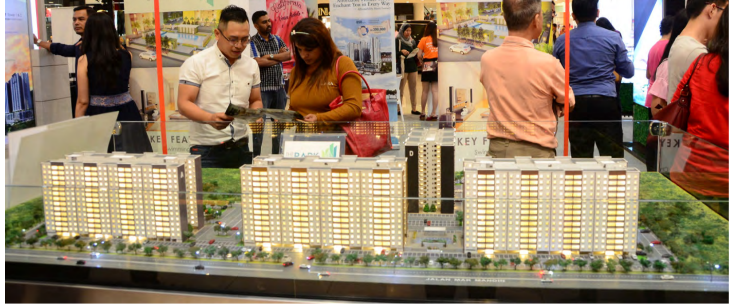
வீடமைப்புக் கண்காட்சியில் கலந்து கொண்ட பொது மக்கள்

நம்பிக்கை கூட்டணி அரசு 2008 முதல் மே மாதம் 2017-ஆம் ஆண்டு வரை 21,535 யூனிட் குறைந்த மற்றும் நடுத்தர மலிவு விலை வீடுகள் கட்டிய வேளையில் முன்னாள் அரசு 1999 முதல் 2007-ஆண்டு வரை 5,154