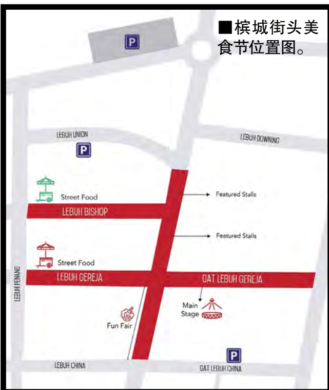
■槟城街头美食节位置图。

槟城街头美食的超强魅力，使得今年4月举行的槟城国际美食节之街头美食节获得巨大回响，配合60周年国庆日，街头美食节将在9月1日及2日，以70年代怀旧氛围重返槟城，并为民众带来更多惊喜。