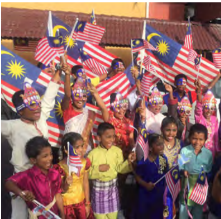
மாக் மண்டின் தமிழ்ப்பள்ளி மாணவர்கள் சுதந்திர தின அணிவகுப்பில் கலந்து கொண்டனர்

நமது நாட்டின் 60-வது சுதந்திர தினத்தை முன்னிட்டு மாக் மண்டின் தமிழ்ப்பள்ளியில் மலேசிய இந்து தர்ம மாமன்றத்தின் துணையுடன் சுதந்திர மாதப் பிரச்சார கொண்டாட்டம் மிக விமரிசையாகக் கொண்டாடப்பட்டது.