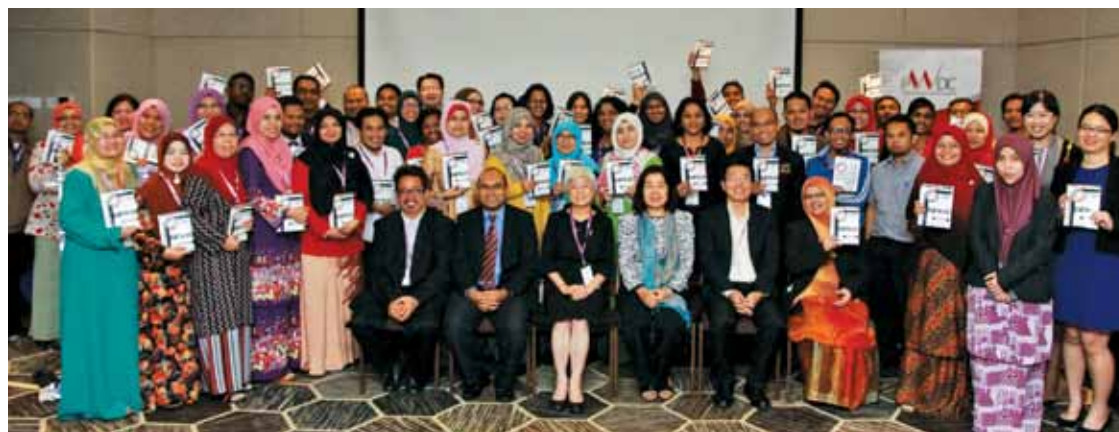
Participants coming from MBPP, MPSP, state agencies, and NGO.