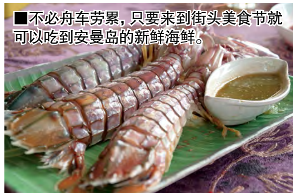
■不必舟车劳累，只要来到街头美食节就可以吃到安曼岛的新鲜海鲜。