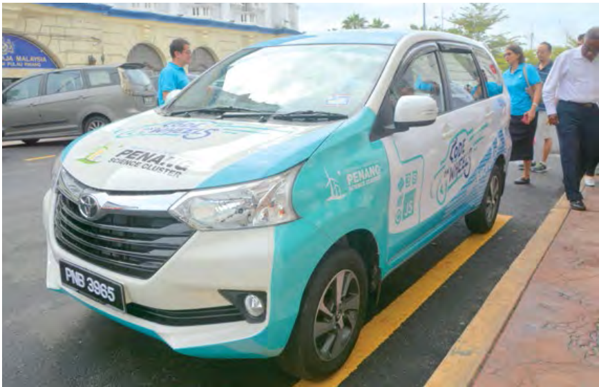
■ “流动编码”车子将携40架笔电到槟州40间中小学，为学生提供编码教程。

槟州首席部长林冠英于2017年8月20日在乔治市光大发表文告指出，根据国家总稽查司报告显示，槟州政府旗下的部门机关一如前年般，在问责指标上表现卓越，位居全马首位。 他说，“去年，国家稽核局以问责指标为基础，对州政府旗下的10个部门机关进行财政管理审计。整体而言，州内的部门机关在管理财政上皆有所提升。2016年，共有8个（或80%）政府部门机关延续2015年的卓越表现。另外2个（或20%）的政府部门机关处于良好水平，相对于2015年，有一成的政府部门机关表现不甚满意。这显示出政府部门机关采取积极行动，以提高各自的财政管理表现，从欠佳或是良好的水平，提升至满意或是卓越水平。” 数据会说话，相较全国各州，槟城再一次脱颖而出成为全国冠军。这显示出槟州政府自2008年以来秉持能干、可靠与透明的执政方针，是实际有效，以致得以维持财政管理的优良表现。以每年的财政预算盈余数字为例，储备金以倍数增长、州内债务锐减90%，以及连续8年（2008-2015）预算盈余总值高达5.74亿令吉，相较于1957-2007年的50年间，预算盈余不过总值3.73亿令吉。 他说，槟州政府恭贺州内各个部门机关，并希望这项振奋人心的成绩能够鼓励大家继续努力，让所有部门机关都能取得5星级的卓越表现。