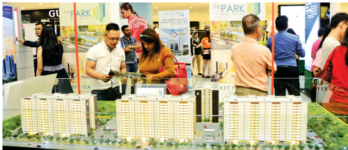
Eager house buyers visiting the expo.