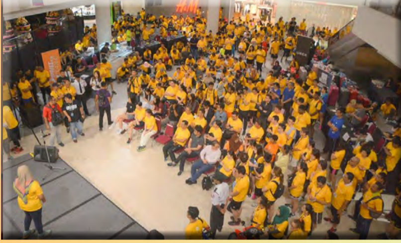
"நான் நேசிக்கும் ஜார்ஜ் டுவன்" நெடுவாட்டத்தில் கலந்து கொண்ட பங்கேற்பாளர்கள்