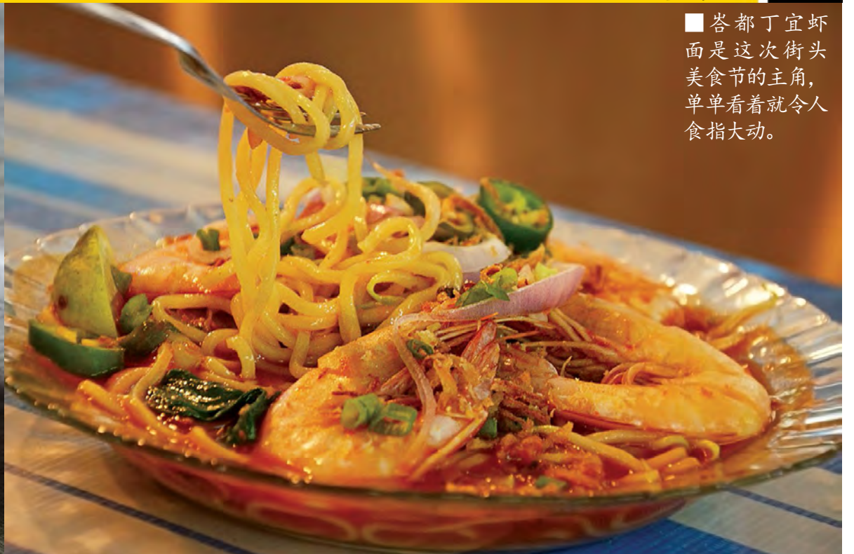
■峇都丁宜虾面是这次街头美食节的主角，单单看着就令人食指大动。