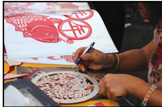
■ 在庙会寻找传统手工艺的踪迹。