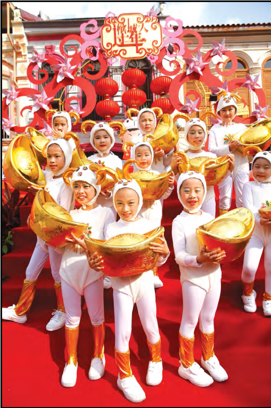
■ 喜气洋洋的演出舞出新春气息。