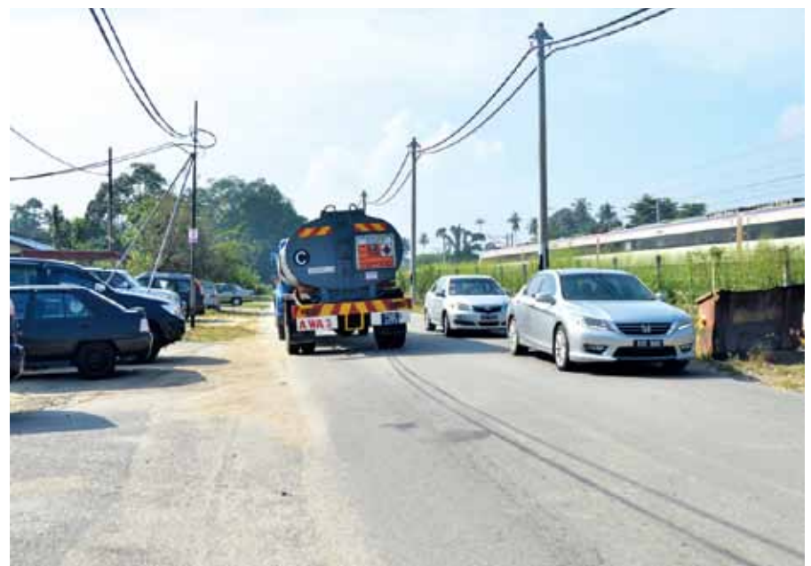
Despite not being a main road, heavy vehicles still use this road at Jalan Kampung Besar.