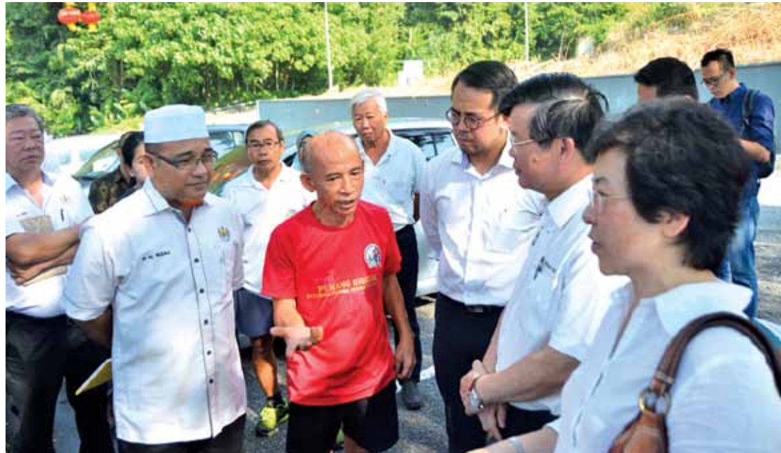
Ong (right), Chow, Sim and Rozali listening attentively to the grouses of a local resident on what's wrong in his area.

More importantly, reporters were told that Taman Sentosa, for instance, is an area where landslides often took place and because of that, objections against development projects were common among the people