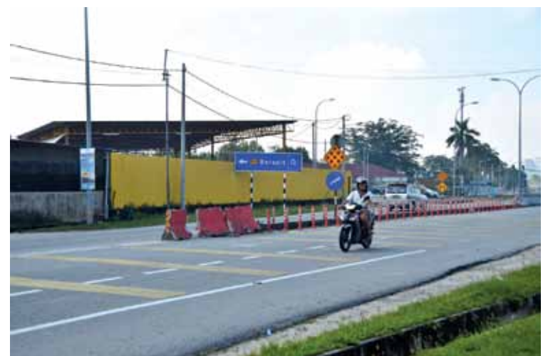
At peak hours, this road is very congested.