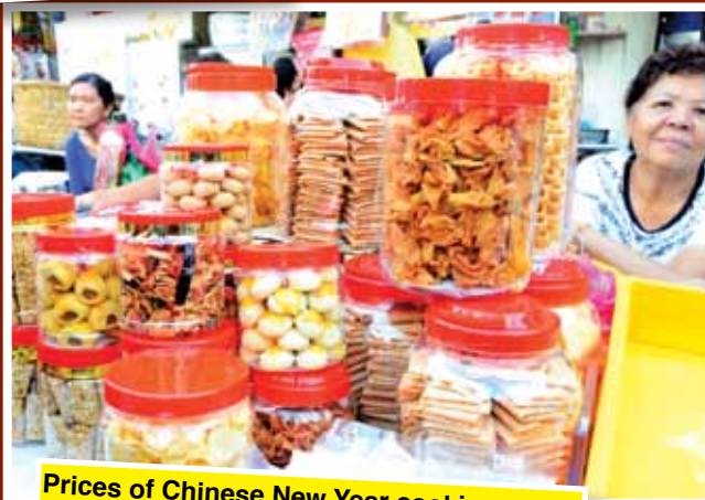
Prices of Chinese New Year cookies are noticeably more expensive this year.