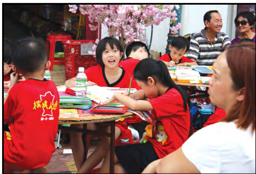
■ 把孩子带进檳城庙会感受传统节日的传承意义。

欲知更多详情，请浏览丁酉年檳城庙会官方脸书： https://www.facebook.com/pgcny/