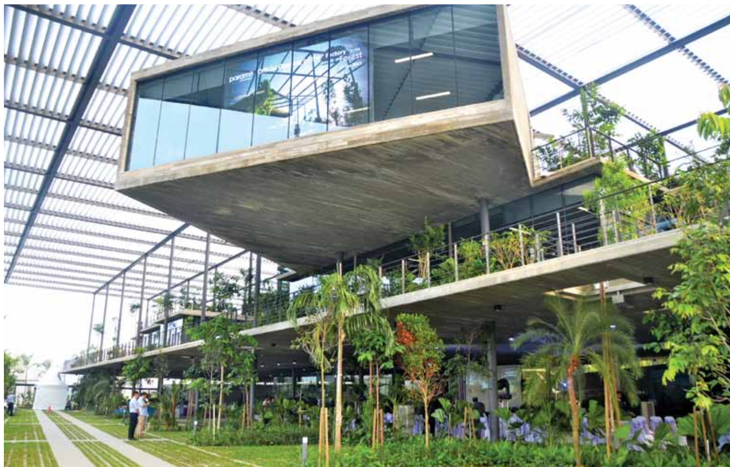
With an interior like this, Paramit is encouraging the culture where manufacturing plants can be equally green as well in terms of the environment.

"The total investment of Paramit in Penang of around