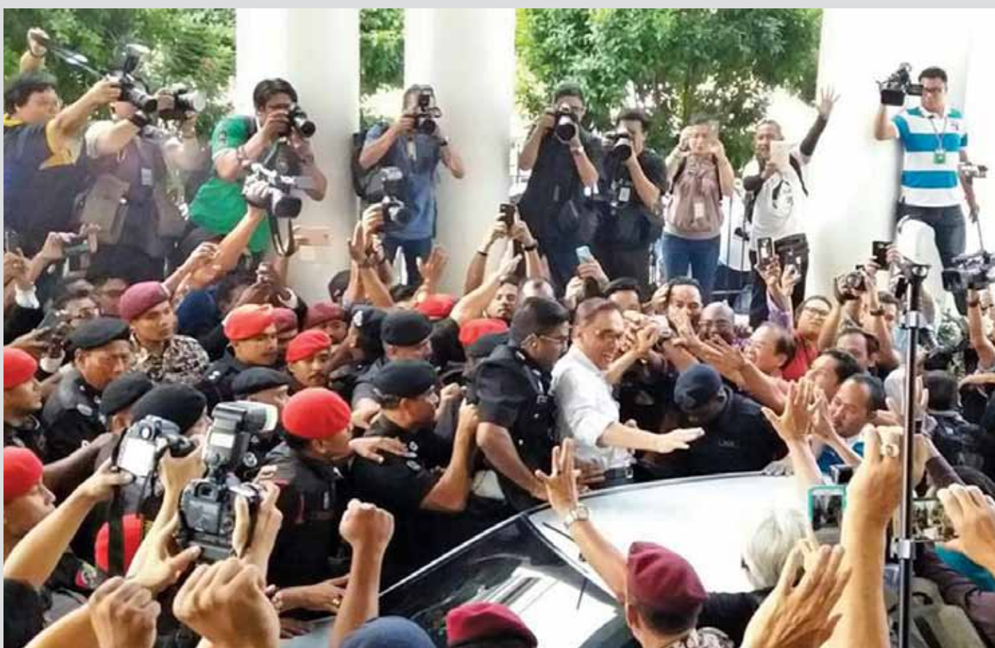
Anwar arriving in court under heavy security.