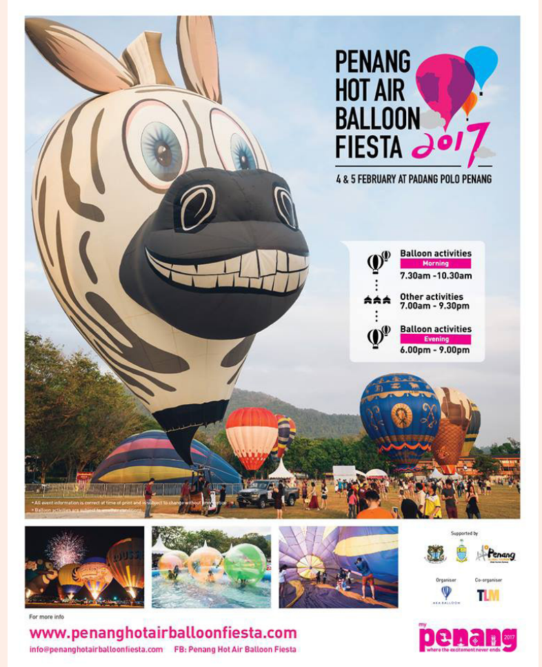
வண்ணமயமான காற்றழுத்த பலூன்

இதனிடையே, இந்த காற்றழுத்த பலூன் விழா கொண்டாட்டத்தில், குடும்ப நட்பு நடவடிக்கைகளான வேடிக்கை விளையாட்டுகள் இடம்பெறுகின்றன. பினாங்கு மாநிலத்தில் வெப்பக் காற்றை உள்ளடக்கிய மாபெரும் வடிவமைப்பைக் கொண்ட காற்றழுத்த பலூன்கள் பாடாங் போலோவிலிருந்து வானில் மிதந்து கொண்டு ஜொர்ச்டவுன் உலக பாரம்பரிய தளத்தை மற்றொரு கோணத்தில் காணப்படும். இப்பெரிய பலூன்களில் உலா வந்த பினாங்கு மக்கள் மட்டுமின்றி சுற்றுப்பயணிகளும் வித்தியாசமான அனுபவத்தால் பரவசமடைவர் என எதிர்பார்ப்புக்கொடுகிறது.