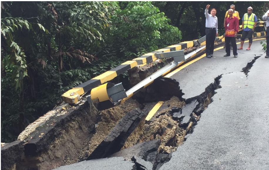
ஜாலான் மவுன் எர்ஸ்கின் - ஜாலான் லெம்பா பெர்மாய் சாலை பிளவை படம் சித்தரிக்கின்றது

இந்த மறுச்சீரமைப்புப் பணி ஆறு வாரம் என நிர்ணயிக்கப்பட்ட வேளையில் 3 மாதங்கள் ஆகியும் பணிகள் நிறைவுப் பெறவில்லை. எனவே, மாநில அரசு பொதுப்பணி துறைக்கும் குத்தகையாளருக்கும் 1 வார காலக்கெடு வழங்கியது. மேலும், சாலை மறுச்சீரமைப்பு பணிகளில் ஈடுபடும் குத்தகையாளர் மற்றும் பொதுப்பணி துறையும்