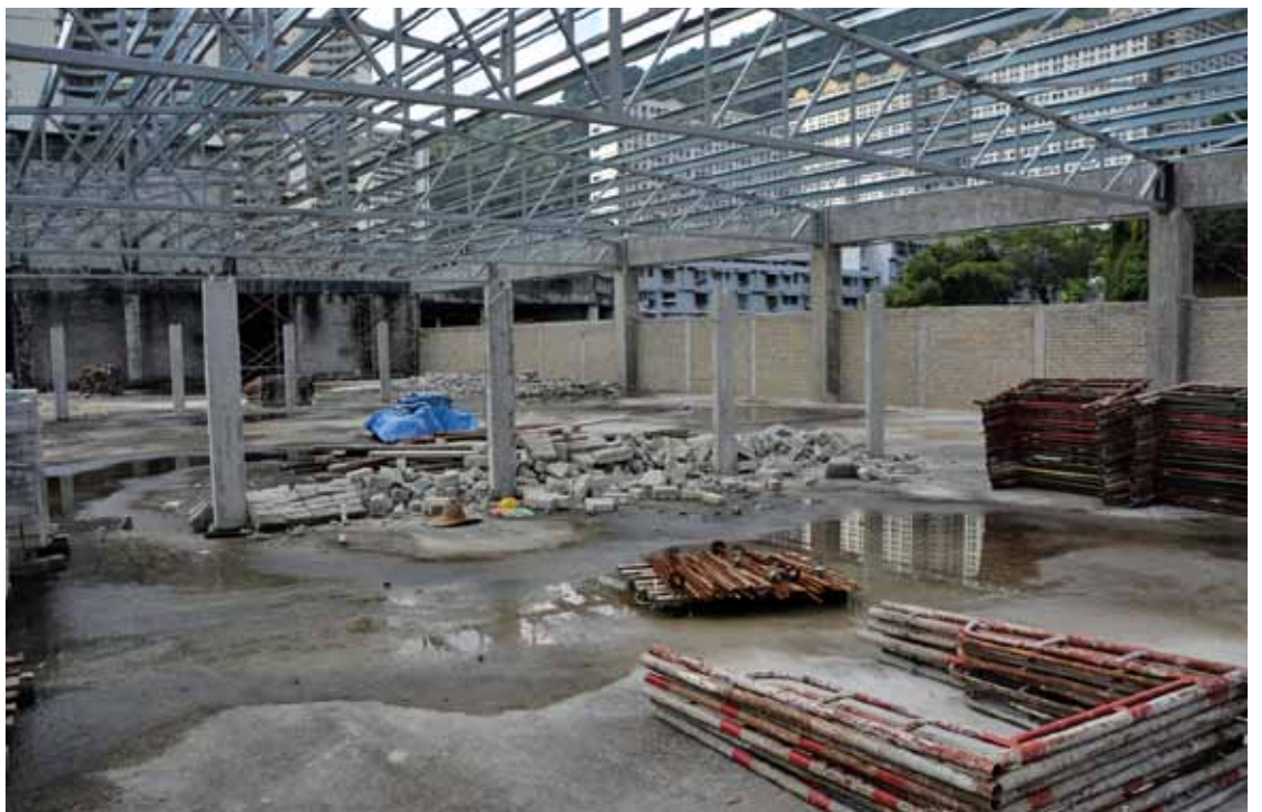
Paya Terubong Shopping Complex/ Food Court under construction.