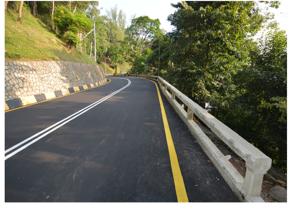
ஜாலான் மவுன் எர்ஸ்கின் - ஜாலான் லெம்பா பெர்மாய் சாலை

விரைந்து செயல்பட்டு கொடுக்கப்பட்ட குறுகிய காலத்தில் நிறைவுச்செய்ய வேண்டும் என மாநில முதல்வர் மேதகு லிம் குவான் எங் பரிந்துரைத்தார்.