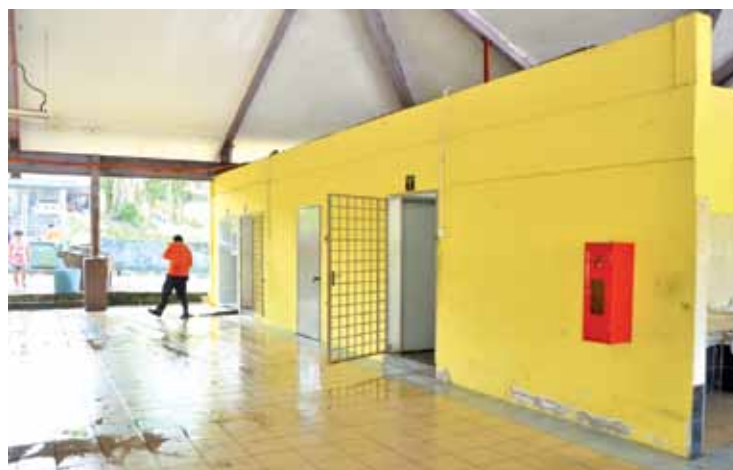
Public facilities at this market need to be upgraded to provide better services to the people.

"Listening to what the people had to say especially on the problems in the area affecting their everyday life is what we are trying to do now. It is best to take note of these matters and settle them as soon as possible," she said.