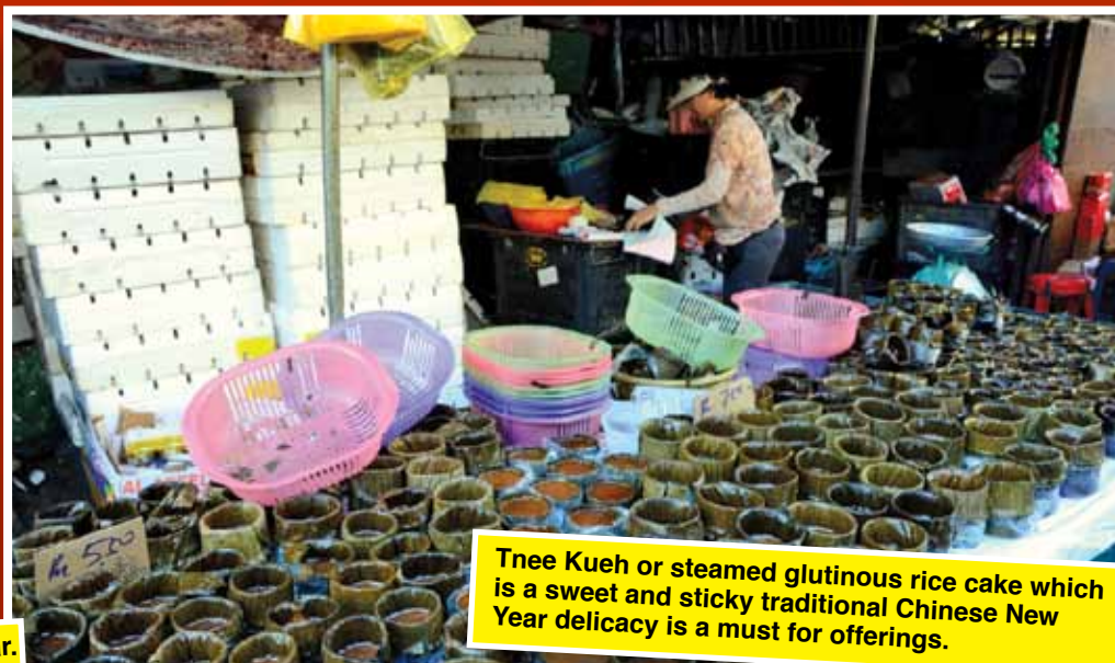
Tee Kueh or steamed glutinous rice cake which is a sweet and sticky traditional Chinese New Year delicacy is a must for offerings.