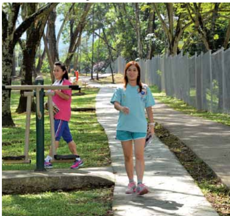
Residents spending time at the Farlim, Beriksa Neighbourhood Park.

hood park in Air Itam was also brought up.