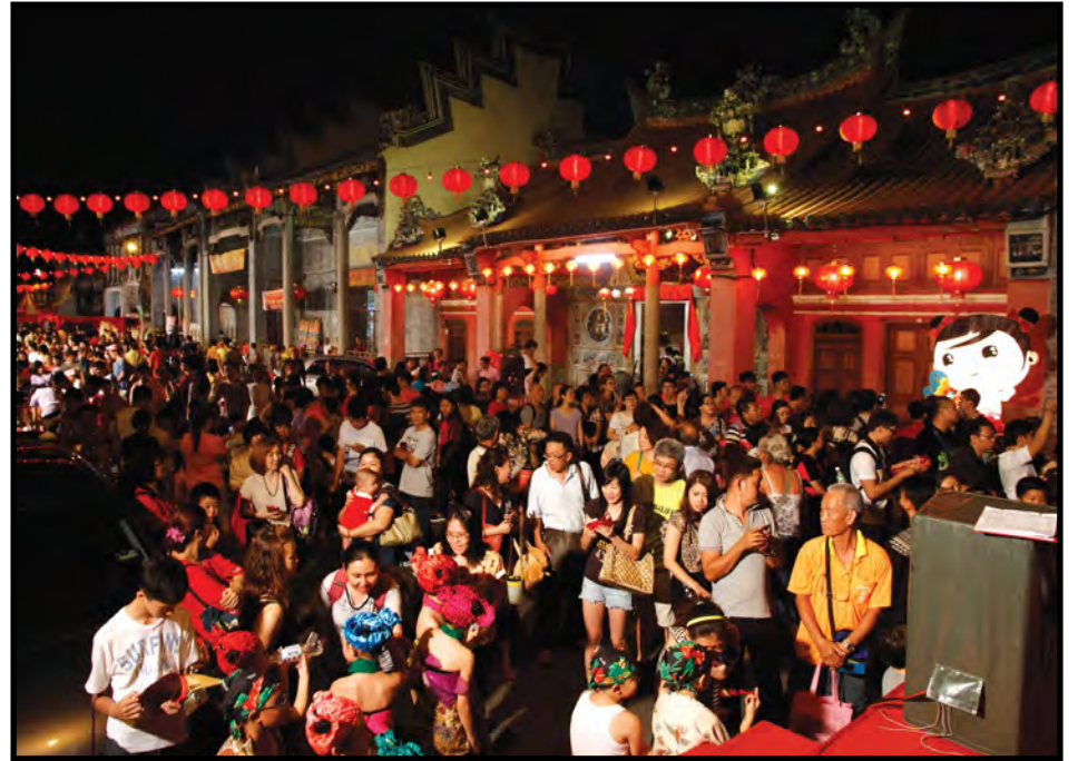
■ 今年将会有逾20家宗祠开放场地供演出以及公众参观之用。