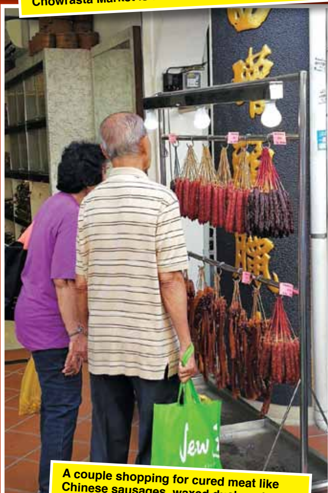
A couple shopping for cured meat like Chinese sausages, waxed duck and other exotic meats.