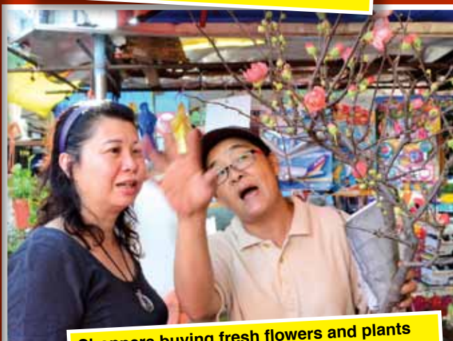
Shoppers buying fresh flowers and plants for the home to usher in the new year.