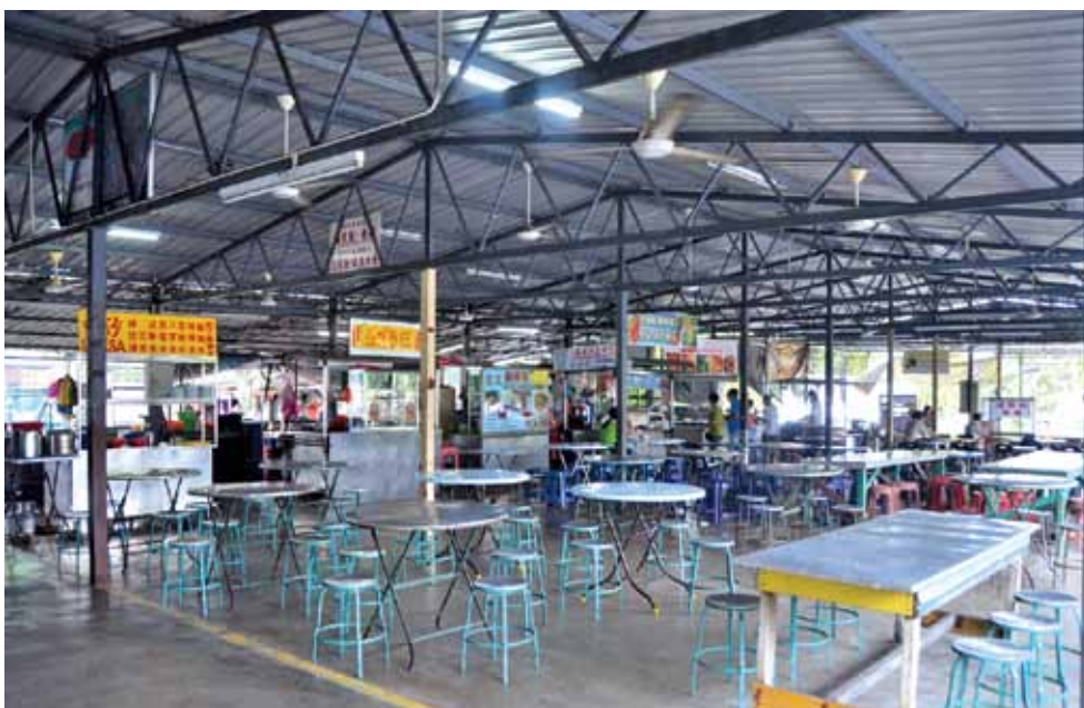
There were repeated calls to widen the food court with 16 stalls due to lack of space during meal times.