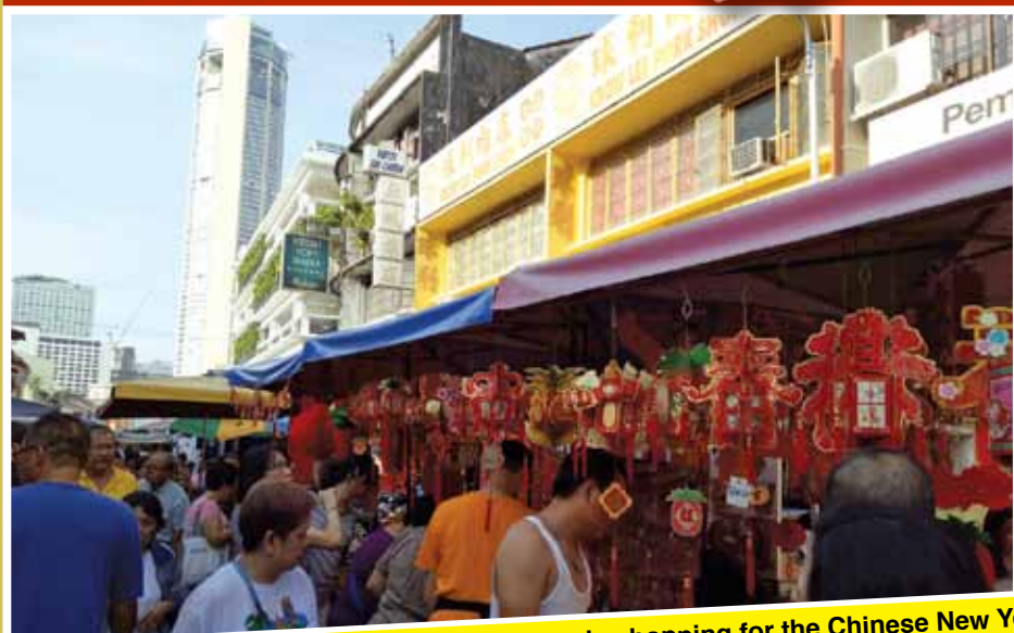
Chowrastra Market is abuzz with people shopping for the Chinese New Year.

WITH the Year of the Rooster banner, stalls are getting ready to welcome the new year. Buletin Mutiara showcases here how the market is preparing.