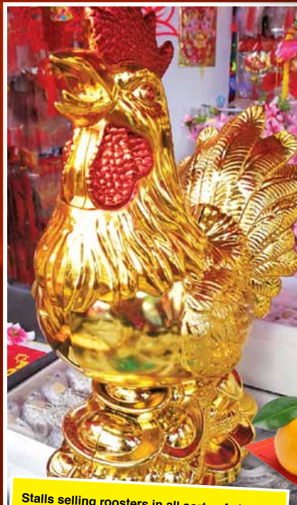
Stalls selling roosters in all sorts of shapes and sizes.