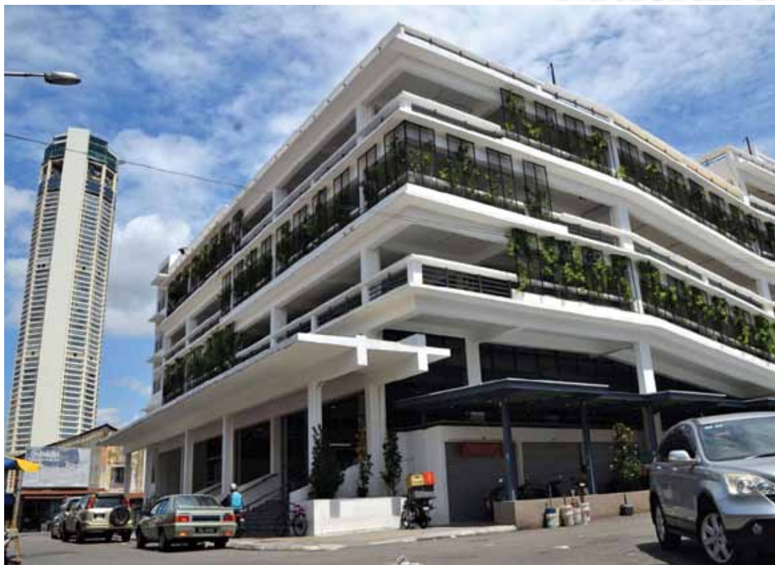
Chowrasta Market is Green Building Index (GBI) certified.

The newly upgraded market is airy, bright and comfortable for all.