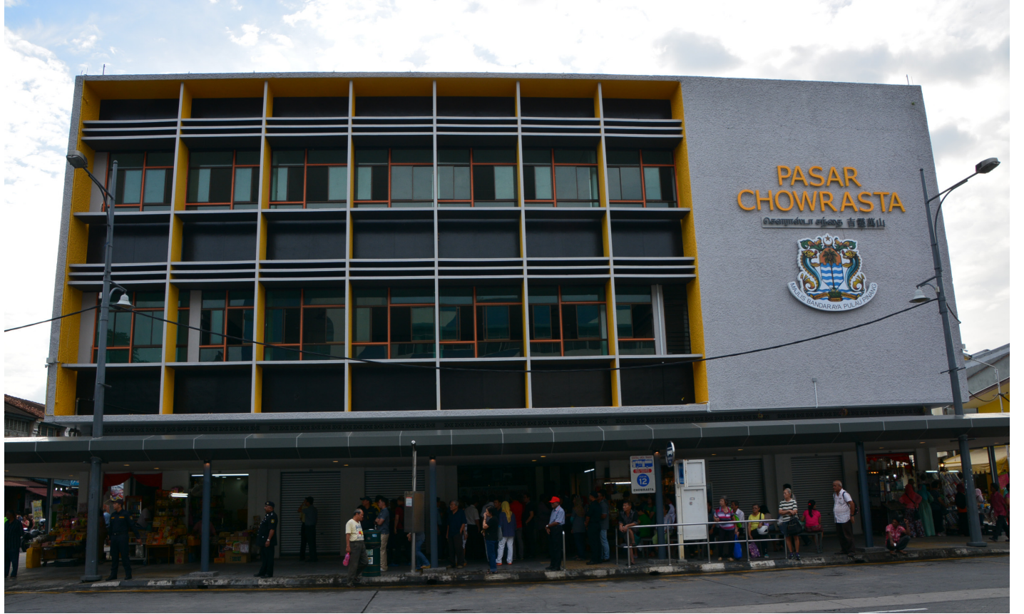
புதுப்பொழிவுடன் காட்சியளிக்கும் சௌராஸ்தா சந்தை

2009 - 2016 வரை 24 பொதுச் சந்தை மற்றும் உணவகங்கள் ரிம35,434,848.66 பொருட்செலவில் சீரமைக்கப்பட்டுள்ளது சாலச்சிறந்ததாகும். மேலும், இவ்வாண்டு லெபோக் கெம்பல் சந்தை, ஜாலான் என்சன் சந்தை என இரண்டின் மேம்பாட்டுப் பணிக்கும் மாநில அரசு