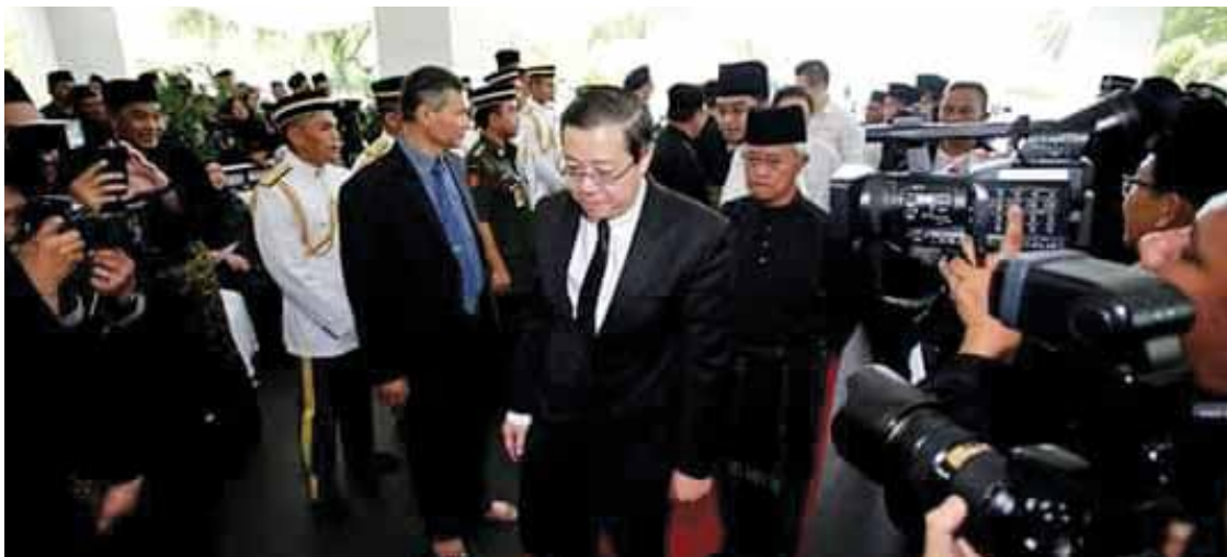
A sombre Lim arriving for the funeral on Jan 12.