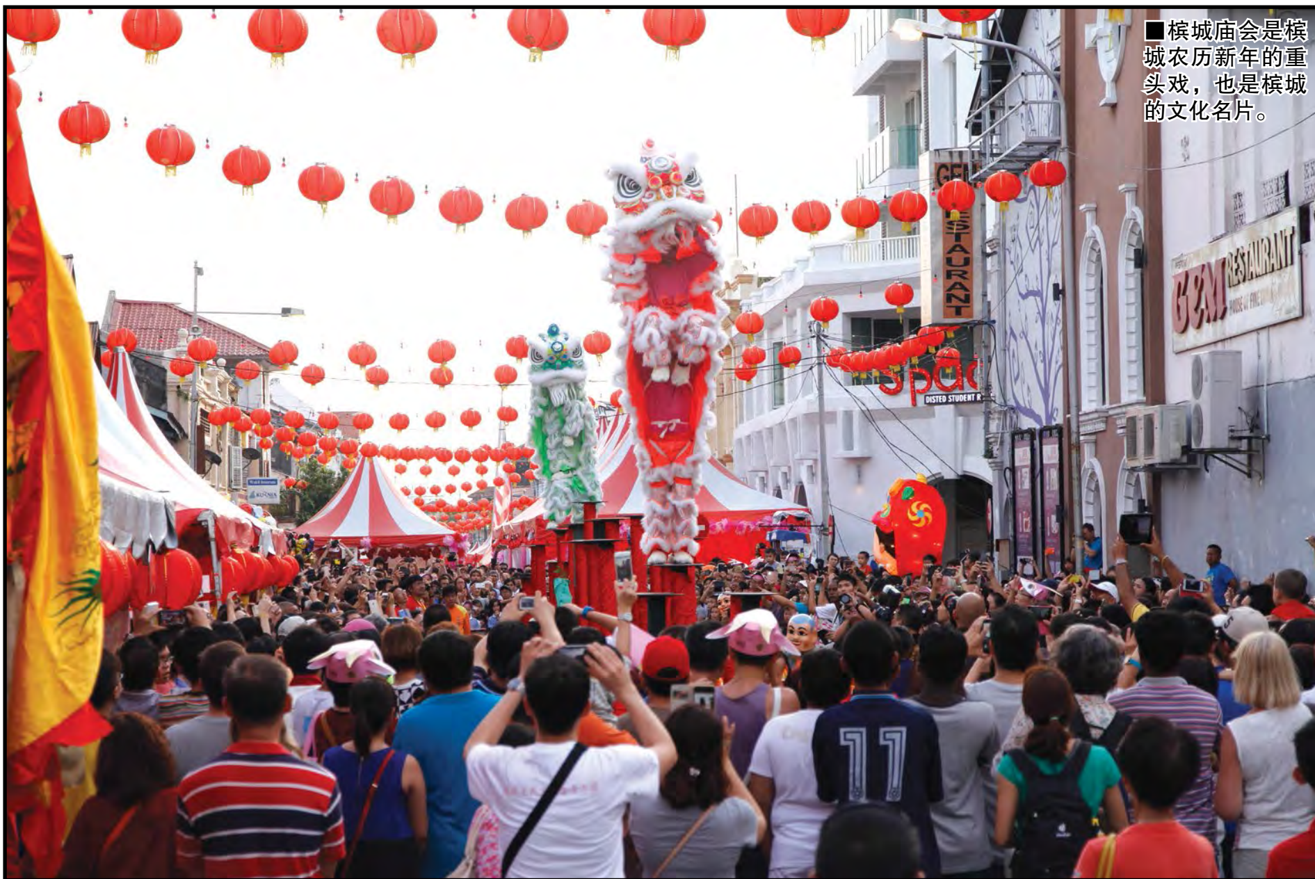
■ 檳城庙会是檳城农历新年的重头戏，也是檳城的文化名片。

丁酉年檳城庙会将于2017年2月3日， 下午4点至11点半， 在檳城乔治市隆重举办。 入场免费，大家别走宝！