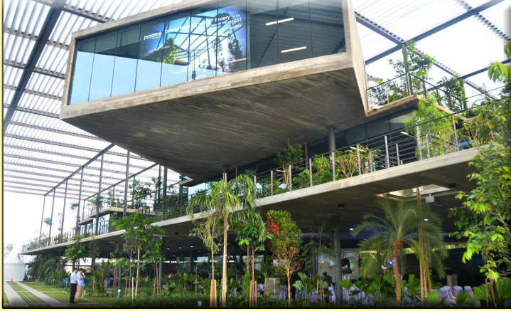
புக்கிட் மிஞ்சா தொழிற்பேட்டை திறக்கப்பட்டுள்ள பராமிட் தொழிற்சாலை மூலம் அதிகமான வேலை வாய்ப்புகள் வழங்கப்படும்.