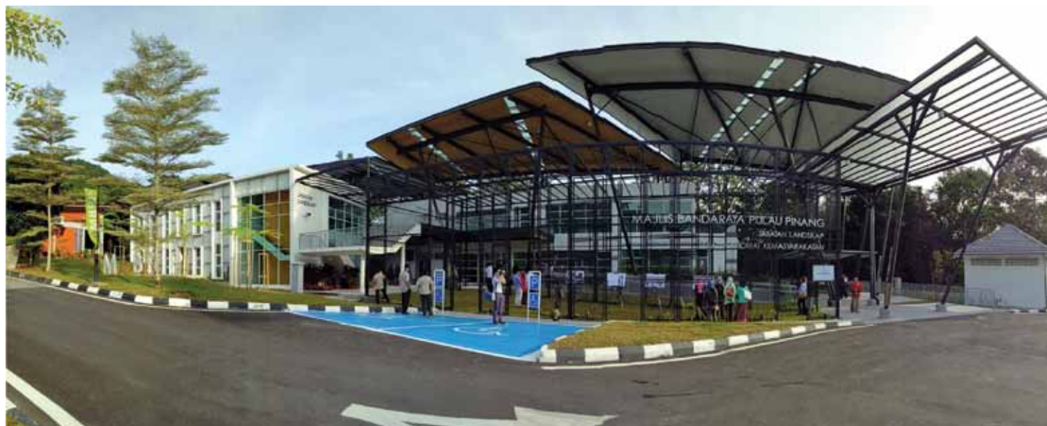
The impressive green building in the forest offers a modern, open concept office space.

"This office in the park is a GBI (green building index) rated green building which is disabled-friendly. We believe less is more and it is built on that concept. We want to go back to basics. The energy-saving design promotes less energy consumption and natural lighting and ventilation. There is less enclosed space and more open space. If you notice, we are able to set up this event without the use of lights, fans or