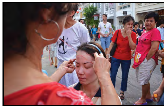
■ 不妨来庙会试试古早的挽面技术吧！