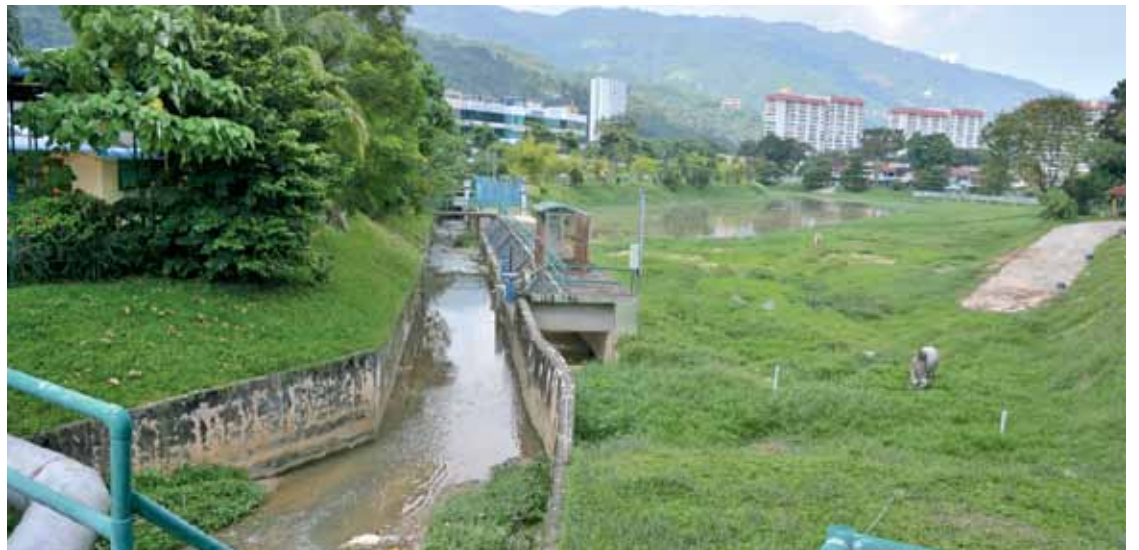
Paya Terubong / Lebuhraya Rambai drainage system, that needs upgrading.

The need to install more exercise equipment and build a toilet in the Taman Beriksa neighbour-