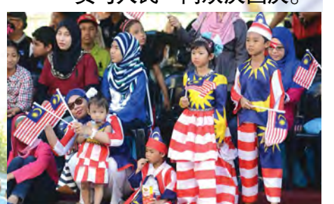
■孩童是国家的未来，我们要给我们的孩子一个干净明亮的未来。