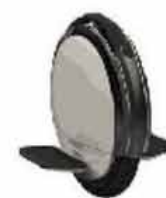
Ninebot One S2