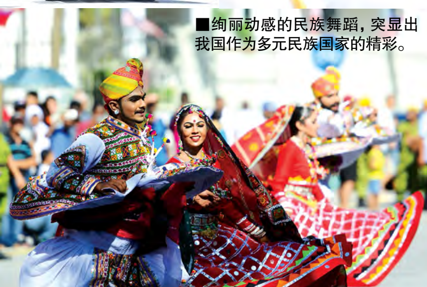
■绚丽动感的民族舞蹈，突显出我国作为多元民族国家的精彩。