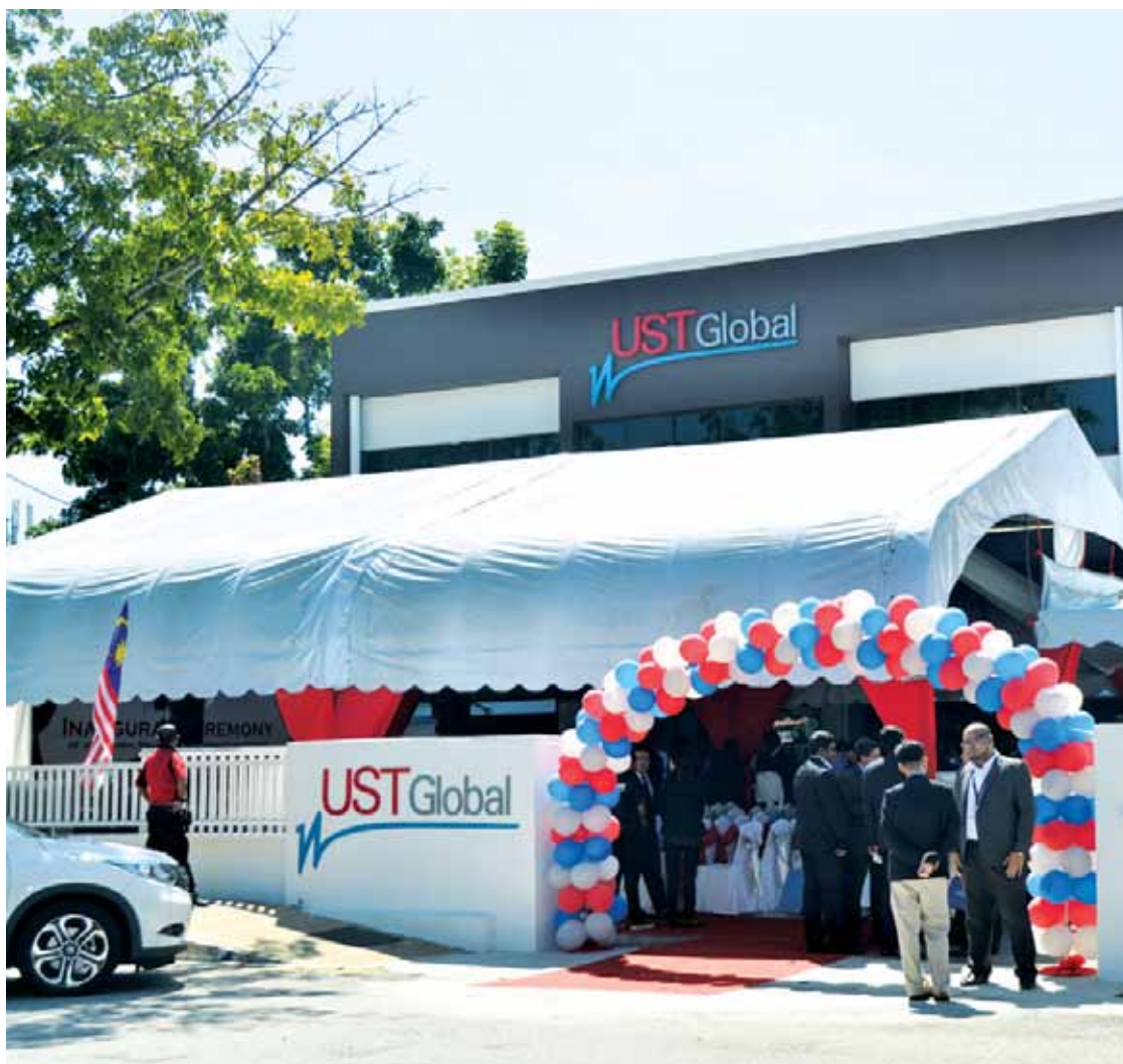
This USB Global facility is aiming to boost employment to 2,000 personnel in three years' time.