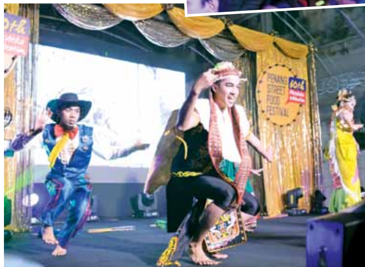
Cultural dance is a must-have for all occasions. The PSFF is no exception.

Accompanied by his wife Betty Chew, Lim was among those who witnessed the astonishing yet remarkable performance and he congratulated them for their record-breaking 1-minute performance.