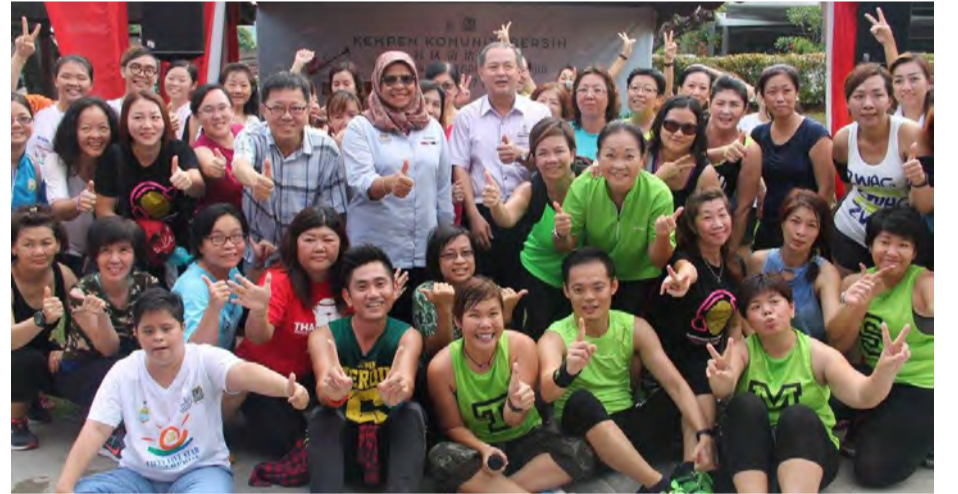
தூய்மையானச் சமூக பிரச்சாரத்தில் பிளாங்கு மாநில ஆட்சிக்குழு உறுப்பினர் டேனி லோ, மாநகர கழகத் தலைவர் டத்தோ மைமுனா முகமது சாரிப் மற்றும் ஏற்பாட்டு குழுவின் கலந்து கொண்டனர்.

பத்து லஞ்சாங் தாமான் கீ ஹியாங் சமூக மேம்பாடு மற்றும் முன்னேற்ற கழகம் ஏற்பாட்டில் அண்மையில் 'தூய்மையானச் சமூக பிரச்சாரம்' (CLEAN COMMUNITY CAMPAIGN) ஏற்பாடு செய்யப்பட்டிருந்தது. இதில் பிளாங்கு மாநகர கழகத் தலைவர் டத்தோ மைமுனா முகமது சாரிப் மற்றும் சுற்றுலாத்துறை மேம்பாடு மற்றும் கலாச்சாரம் ஆட்சிக்குழு உறுப்பினர் டேனி லோ ஆகியோர் கலந்து சிறப்பித்தனர்.