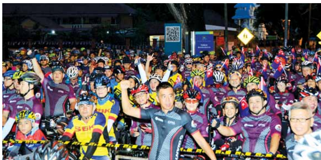
Some of the participants who took part in the CFAL event.