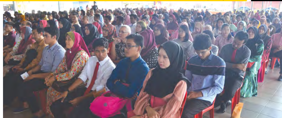
■共有808名学子获得槟州政府给予1000令吉大专入学援助金(iBITA)。