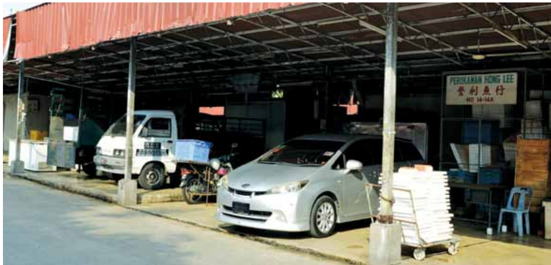
Lack of parking space has caused cars to be parked in areas meant for market stalls at the Lebuh Cecil Market.