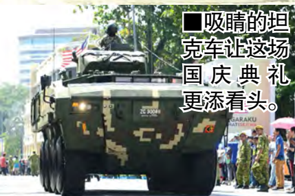
■吸睛的坦克车让这场国庆典礼更添看头。