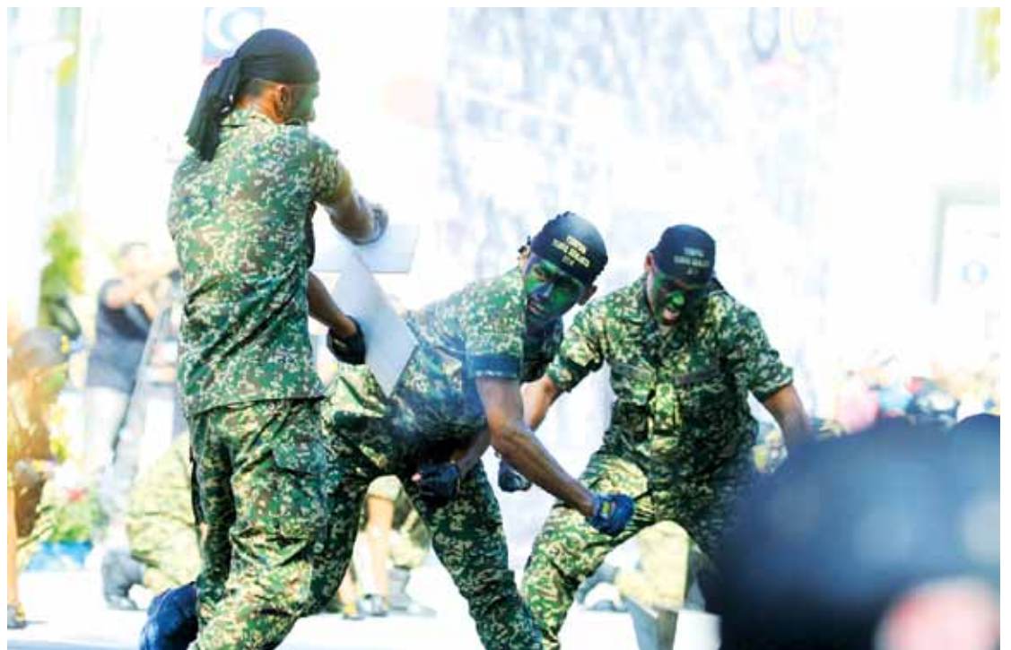
Armed forces personnel displaying their martial arts skills which captivated the crowd.