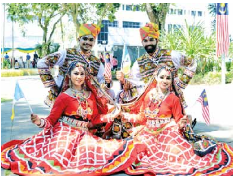
Their colourful attire resembled the mood of everyone who turned up for the National Day celebrations.