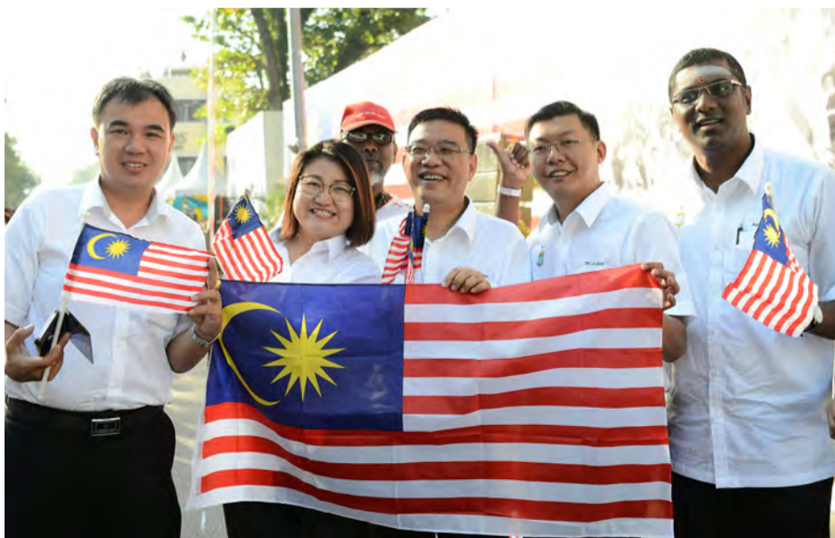
சுதந்திர தினக் கொண்டாட்டத்தில் கலந்து கொண்ட அரசியல் தலைவர்கள்