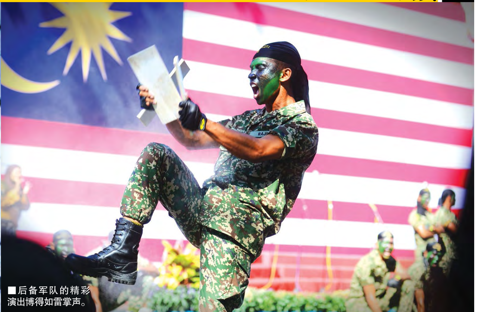
■后备军队的精彩演出博得如雷掌声。