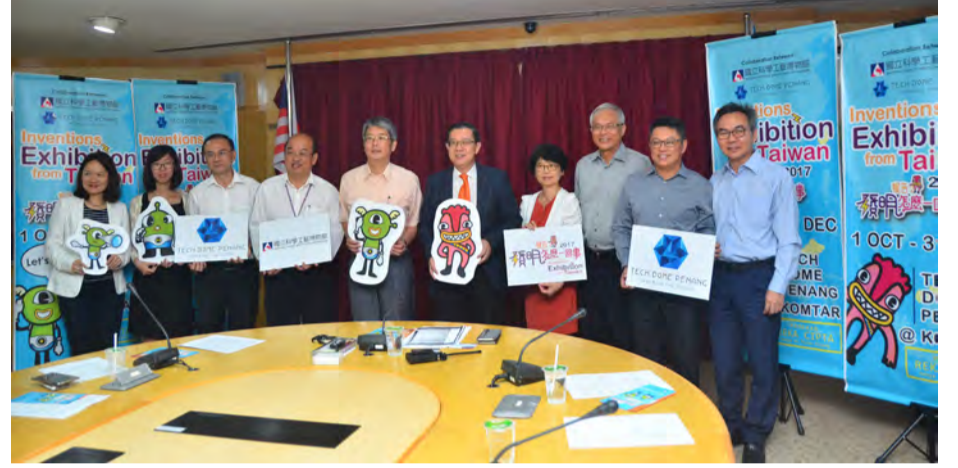
முதல்வர் மேதகு லிம் குவான் எங் மற்றும் ஏற்பாட்டு குழுவின் கண்காட்சி அறிமுக விழாவில் கலந்து கொண்டனர்.

இந்தக் கண்காட்சியில் மூன்று 'ஏலியன்' கதாபாத்திரம் உருவகம் செய்து அன்றாட வாழ்வில் உள்ளடங்கிய நவீன