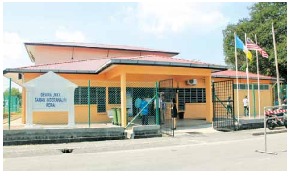
The upgraded hall in Taman Inderawasih, Butterworth will be of great use by the local community.

According to the information provided to the press, the state government had spent