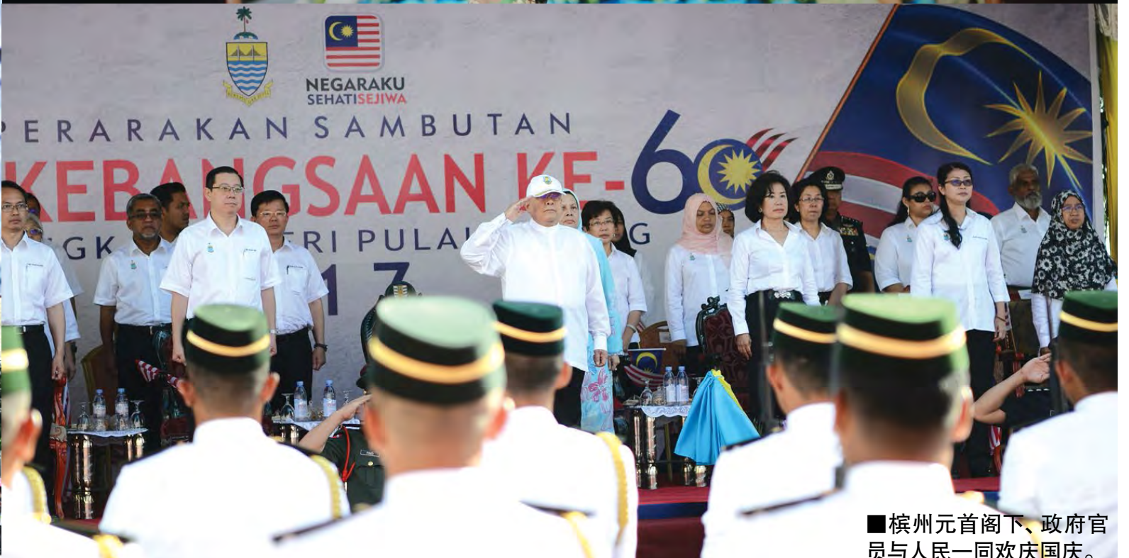
■槟州元首阁下、政府官员与人民一同欢庆国庆。