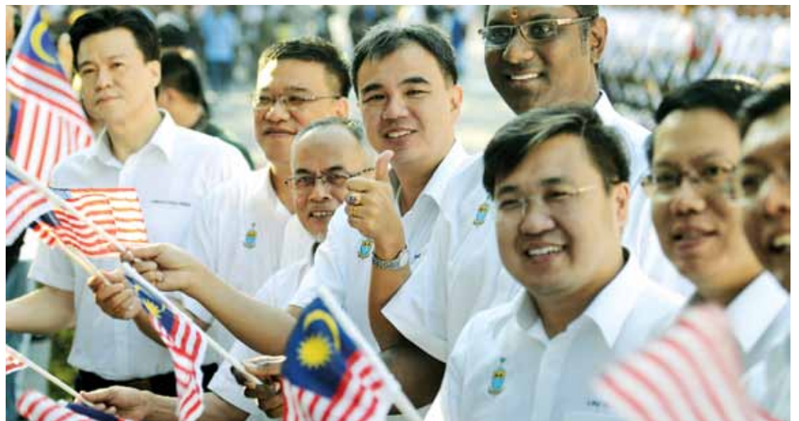
Elected representatives of the State Assembly having a fun time during the Merdeka celebrations.