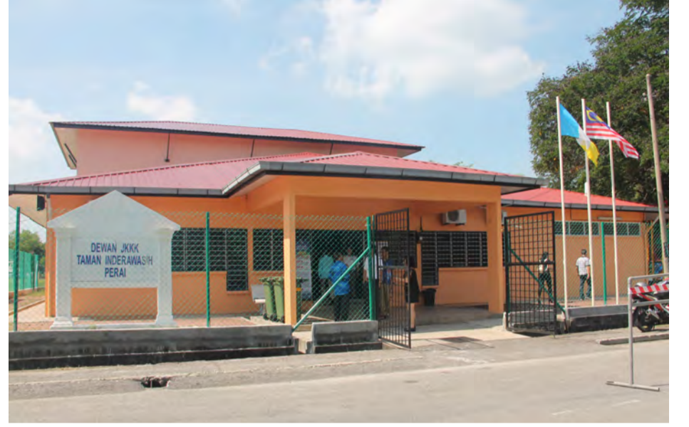
தாமான் இண்ராவாசே சமூக மேம்பாடு மற்றும் முன்னேற்ற கழக மண்டபம்

பிறை சட்டமன்ற தொகுதியின் வளர்ச்சிக்கு அதன் சட்டமன்ற உறுப்பினரும் மாநில இரண்டாம்