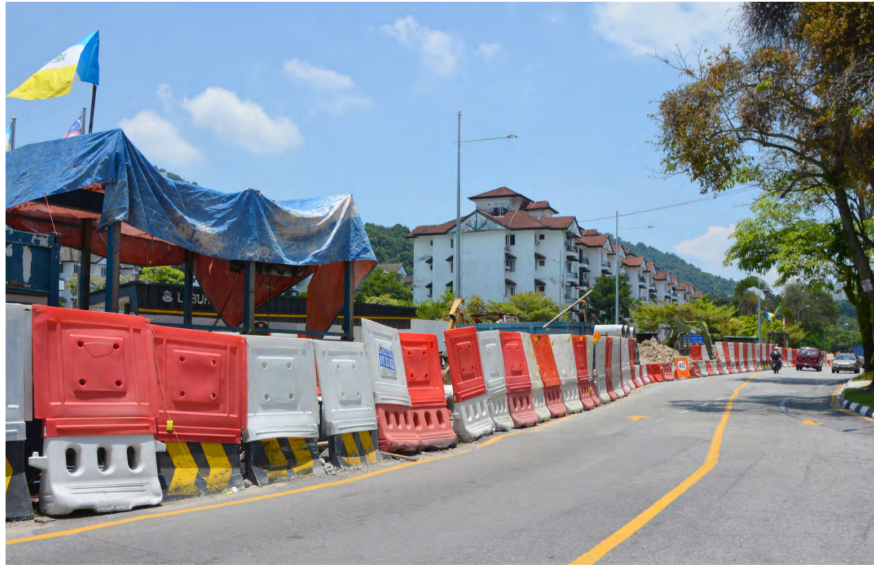
மத்திய அரசு மேற்கொள்ளும் கழிவுநீர் சேவை துறை மேம்பாட்டுத் திட்டம்