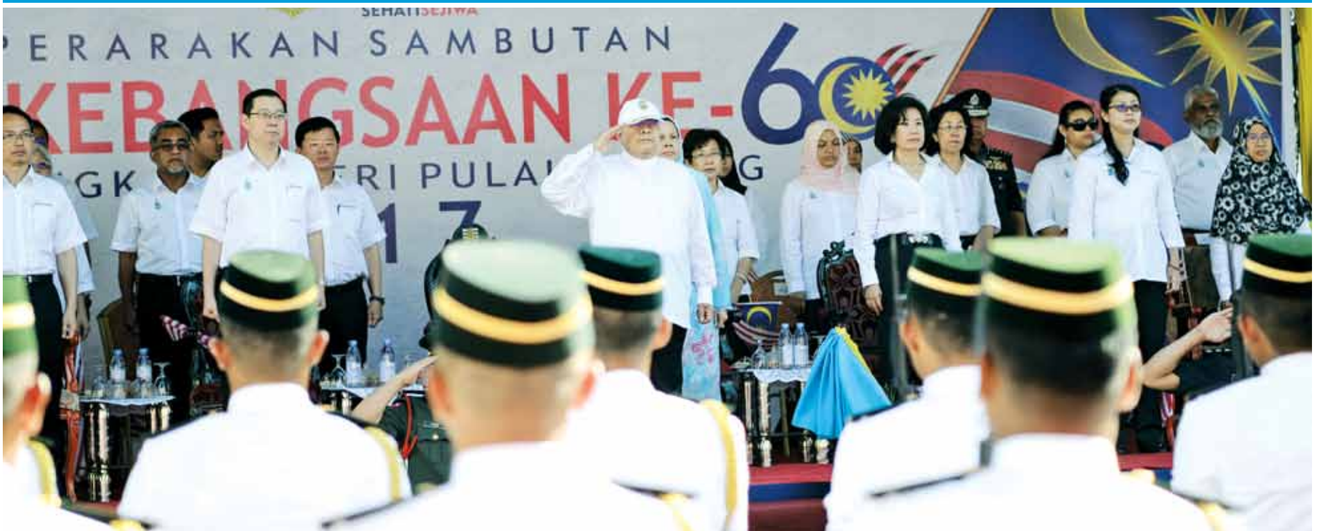
The Governor inspecting the guard-of-honour with members of the state government and their spouses by his side.

http://www.facebook.com/buletinmutiara http://www.facebook.com/cmlinguaneng