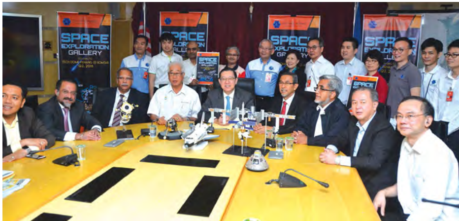
■林冠英推介太空探索馆计划后，与参与此计划的本地专才合影。

一直致力于推动州内科学教育的槟州政府，在光大圆顶科学馆开幕一周年后，为它及所有太空迷送来一份大礼，即州政府将耗资53万令吉，在该馆设立太空探索馆。