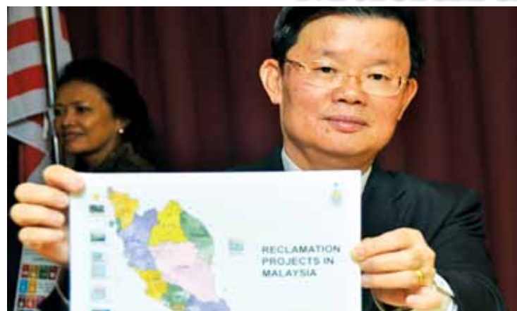
Chow holding a map which shows other reclamation projects currently taking place in Peninsular Malaysia.

Penang Green Council 46th Floor, KOMTAR, 10503 Penang. tel. +604 250 3322 fax. +604 250 3323 email. info@pgc.com.my website. www.pgc.com.my