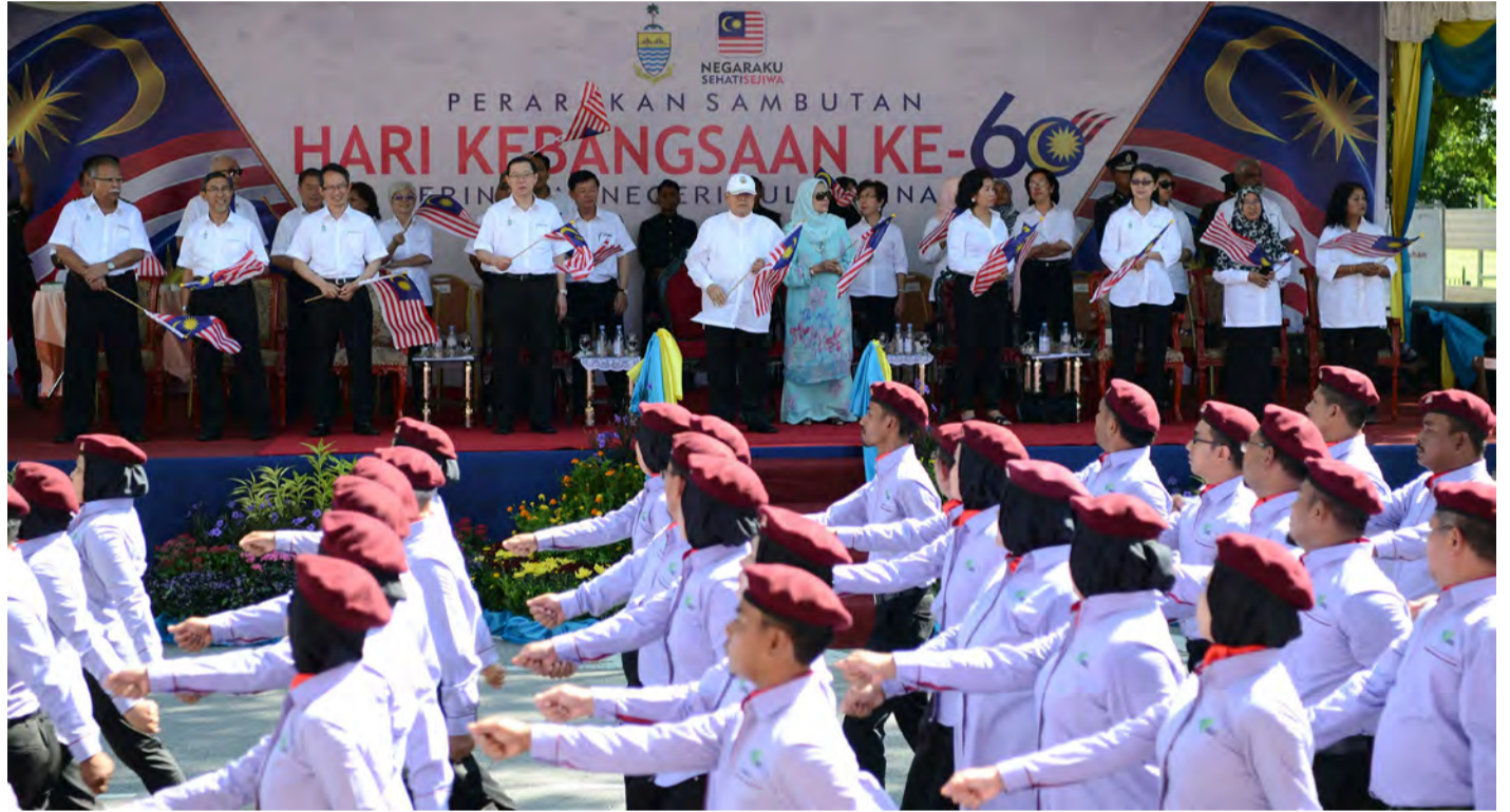
மாநில ஆளுநர், மாநில முதல்வர் மற்றும் அரசியல் தலைவர்கள் சுதந்திர தின அணிவகுப்பிற்கு மரியாதை செலுத்தினர்.

மாநில சுதந்திர தின அணிவகுப்பில் குழு முறையில் வலம் வந்த 5,700 பங்கேற்பாளர்கள் மாநில அரசு, தனியார் நிறுவனம், அரசு சாரா இயக்கம், உயர்க்கல்வி மையம், பள்ளி மாணவர்கள் மட்டுமின்றி 13 வகையான வாகன அணிவகுப்பும் இடம்பெற்றன. அணிவகுப்பில் கலந்து கொண்ட பங்கேற்பாளர்கள் தேசிய கொடி மற்றும் மாநில கொடியை கையில் ஏந்தி தங்களின் தேசப் பக்தியைச் சித்தரித்தனர். பினாங்கு மாநிலம் தூய்மையாகவும் பசுமையாகவும் காட்சியளிப்பதற்குத் துணைபுரியும் பினாங்கு செபராங் பிறை நகராண்மைக் கழகம் மற்றும் மாநகர் கழக ஊழியர்கள் மட்டுமின்றி அவர்கள் பயன்படுத்தும் வாகனங்களும் அணிவகுப்பில் இடம்பெற்றன.