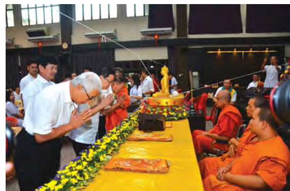
■林冠英赞扬佛教会努力不懈的发扬佛教所秉持的正能量。