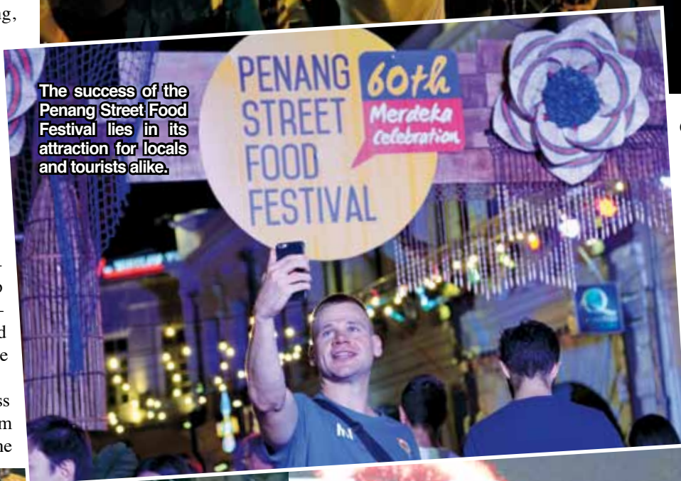
The success of the Penang Street Food Festival lies in its attraction for locals and tourists alike.

Guinness World Record. The married couple succeeded in their feat to break their own previous world record by having 24 outfits changed in just 60 seconds. Before this, they held the