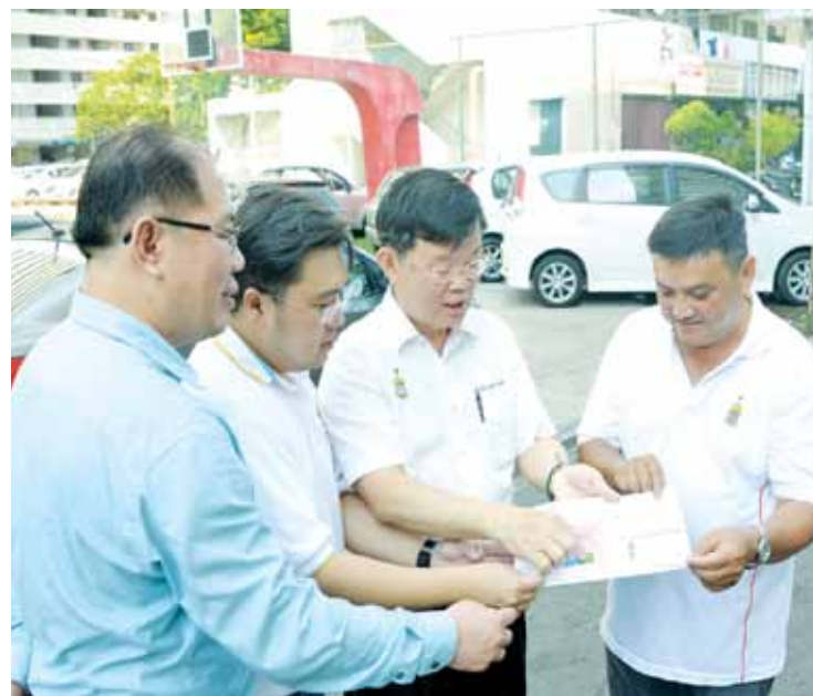
(From left) Ng, Lau and Chow viewing a map provided by the MBPP which shows details on the use of land for specific purposes at Gat Lebuh Macallum.

Story by Victor Seow