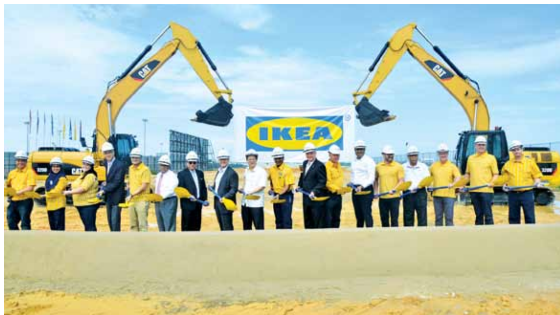
The groundbreaking ceremony was an exciting affair seen here with the participation of key decision-makers and state leaders.