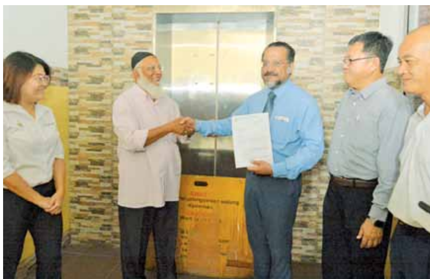
News of the lift is uplifting indeed