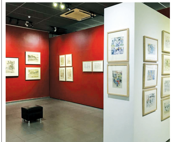
Paintings displayed at the exhibition.