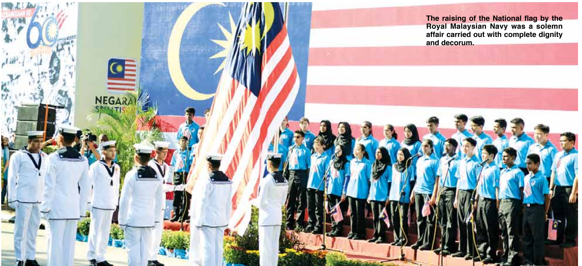
The raising of the National flag by the Royal Malaysian Navy was a solemn affair carried out with complete dignity and decorum.