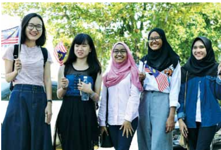
Malaysians irrespective of race and faith share a common love for the country.