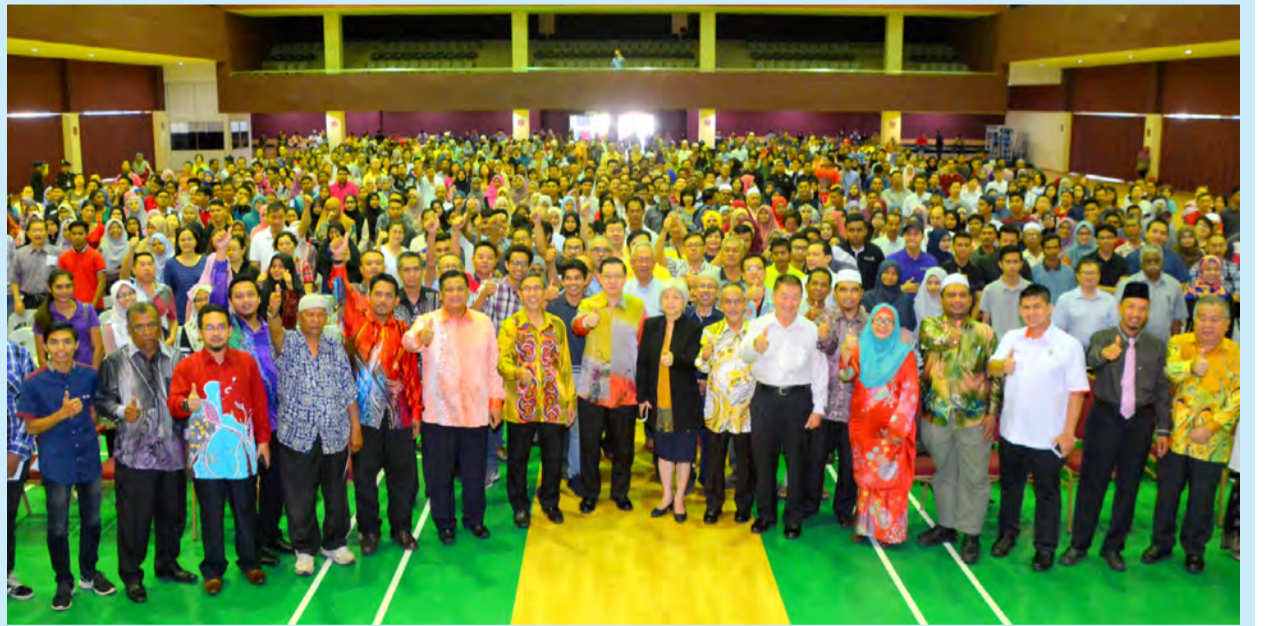
ஊக்கத்தொகை பெற்றுக்கொண்ட மாணவர்களுடன் மாநில முதல்வர் மற்றும் அரசியல் தலைவர்கள்

10-வது ஆண்டாக வழங்கப்படும் இந்த ஊக்கத்தொகை மலேசியாவில் அமைந்துள்ள அனைத்து அரசு உயர்க்கல்வி மையங்கள்