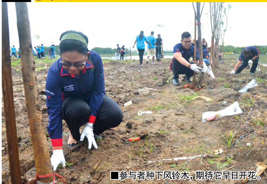
■参与者种下风铃木,期待它早日开花。