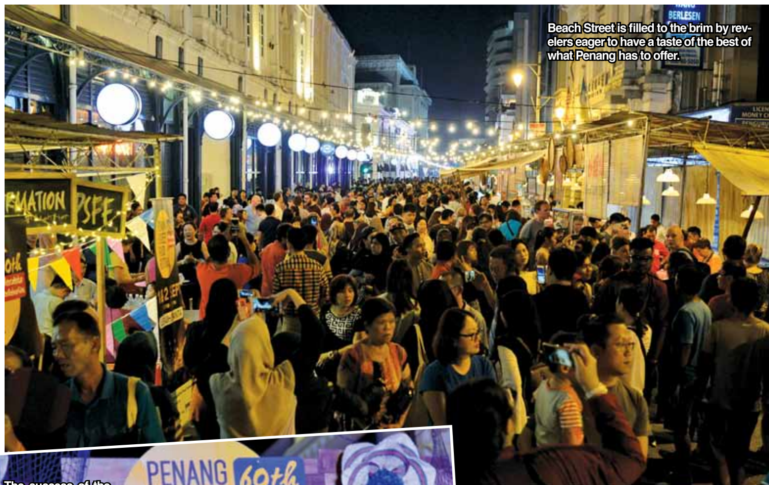
Beach Street is filled to the brim by revellers eager to have a taste of the best of what Penang has to offer.