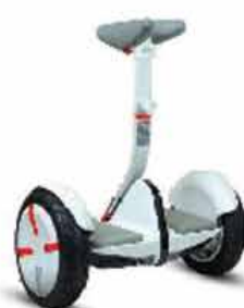
Ninebot Mini Pro