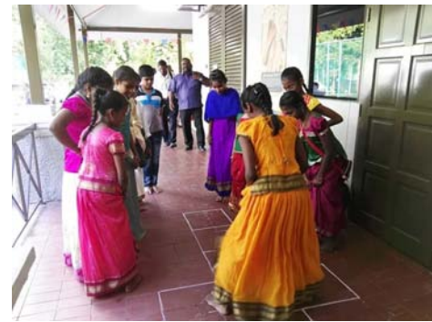
தமிழ்ப்பள்ளி மாணவர்கள் இந்திய பாரம்பரிய விளையாட்டை விளையாடி மகிழ்ந்தனர்