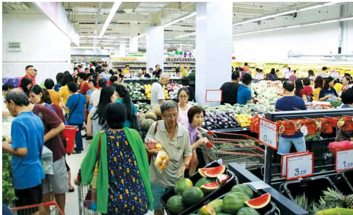
Shoppers throng the supermarket after it was launched by the Chief Minister.

To celebrate its first venture in Penang, HeroMarket is now offering free membership card application until Dec 31.