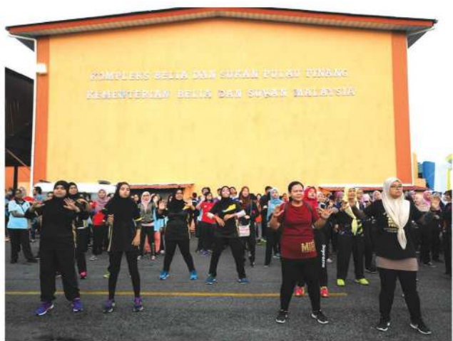
来来来! 大家一起做运动!