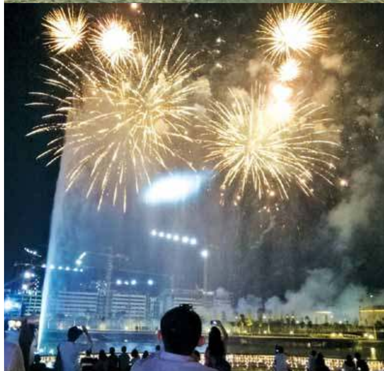
The water jet and fireworks display at the end of the event.

We have planted more trees than buildings," Murly said.