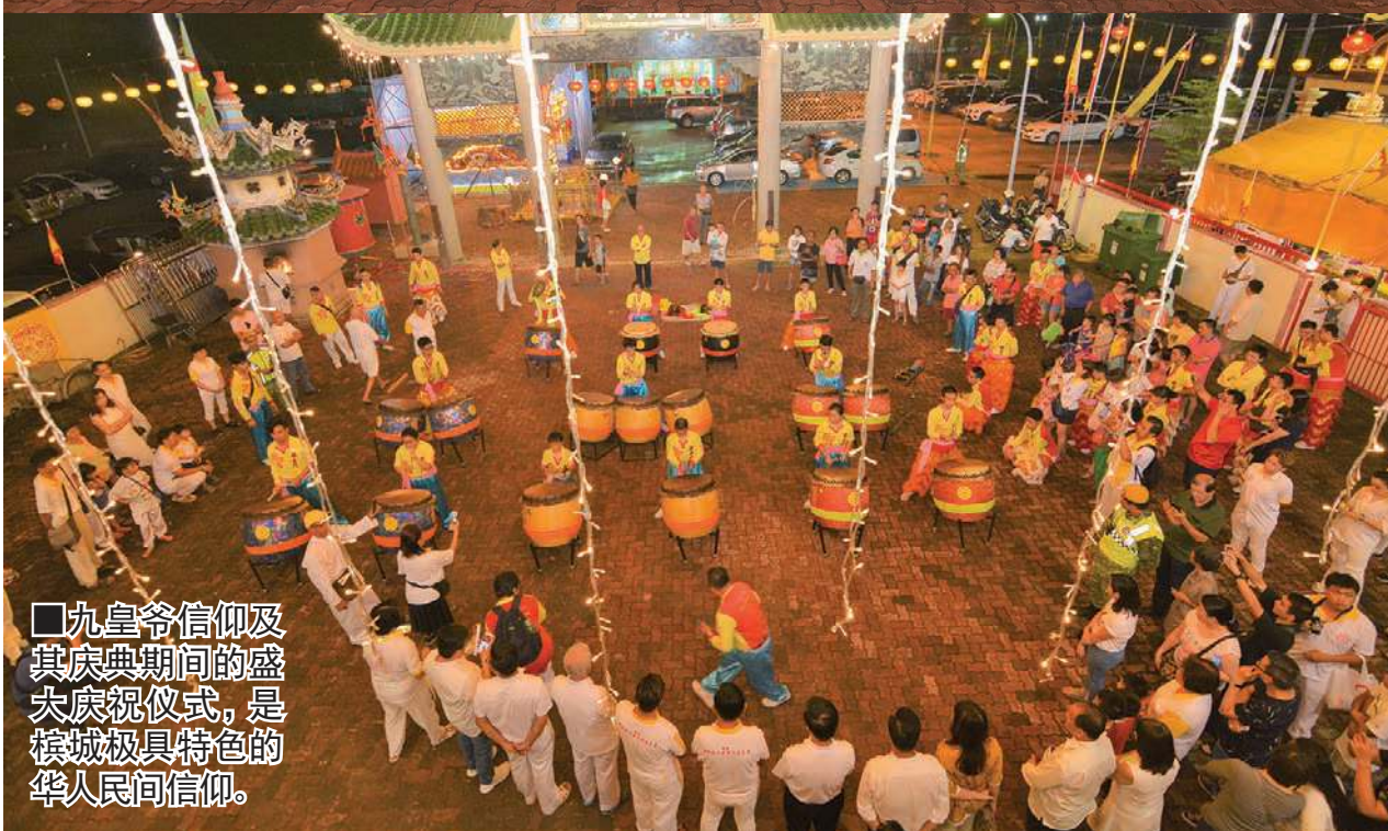
■九皇爷信仰及其庆典期间的盛大庆祝仪式，是槟城极具特色的华人民间信仰。

九皇爷信仰及其庆典期间的盛大庆祝仪式，是槟城极具特色的华人民间信仰，广大的参与民众包括了居住在本地的泰国人、印度同胞以及慕名而来的外国游客等。