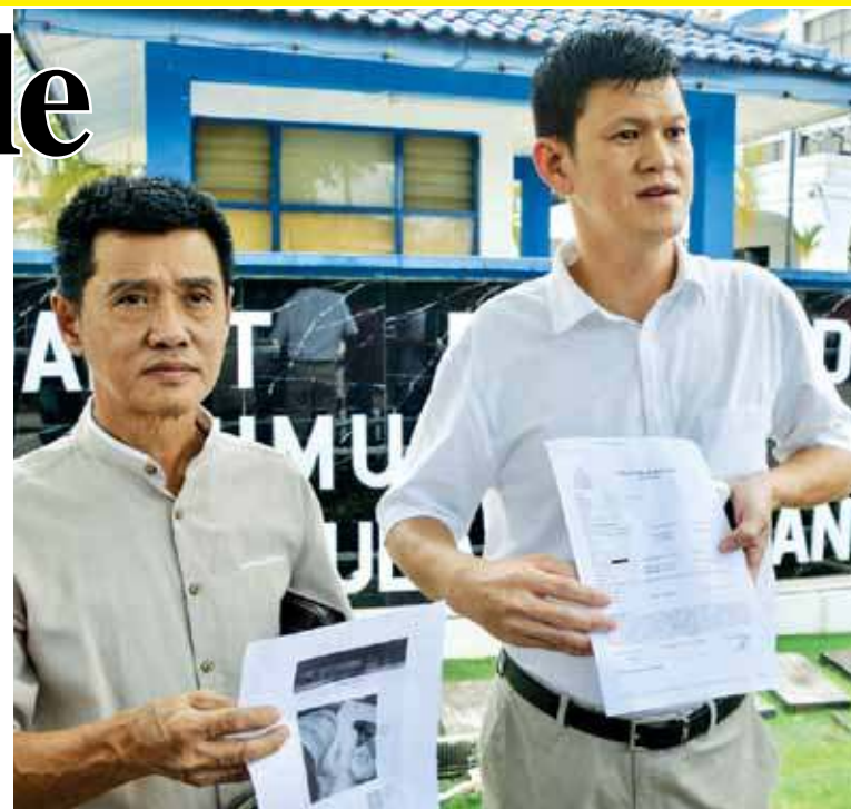
(From left) Chew and Ong showing the video clip and police report on the 'needle in banana' issue.

"I also lodged the report to stop the viral news from circulating and also to assist the hawkers concerned, to prevent their businesses from being affected," he added.