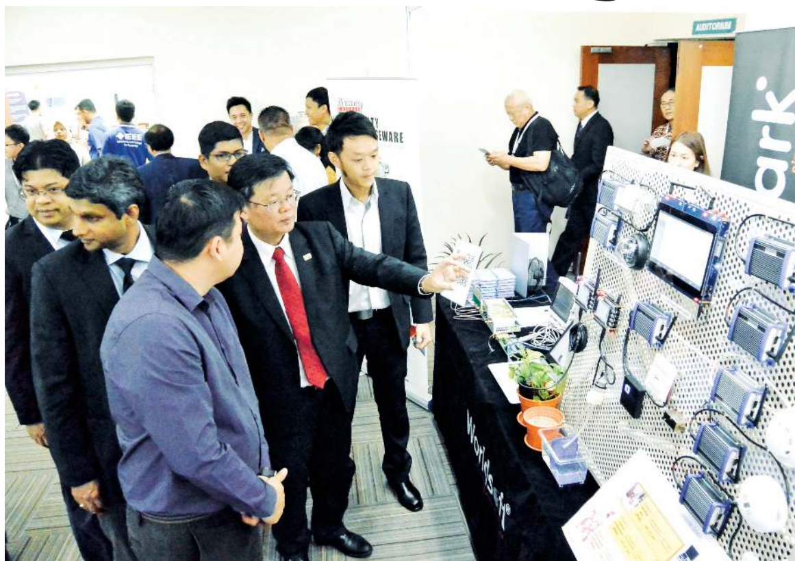
Chow visiting the booths during the annual IEEE International Microwave, Electron Devices and Solid-State Circuit Symposium (IMESS) 2018 at PSDC.

"Penang's manufacturing success has earned the state the name as the 'Silicon Valley of the East', but we have no technical university within the industry area.