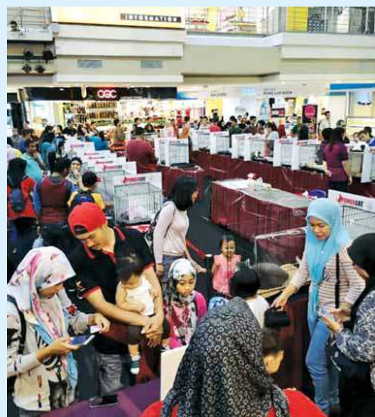
The crowd at the Penang Pet Lovers Fiesta 2018.