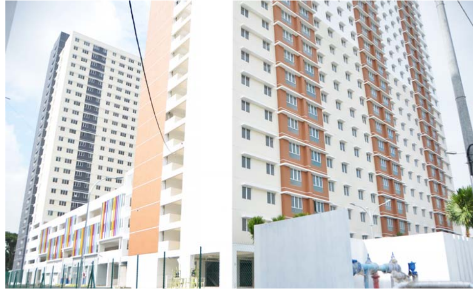
ஜீரான் ரெசிடன்சி மலிவு விலை வீடமைப்புத் திட்டம்

மேலும் மாநில அரசு நிர்மாணிக்கும் வீடமைப்புத் திட்டம் மட்டுமின்றி தனியார் மேம்பாட்டு நிறுவன வீடமைப்புத் திட்டங்களையும் திடீர் சோதனை மேற்கொள்வதன் மூலம் கட்டும், கட்டப்படும் மற்றும் கட்டிக்கொண்டிருக்கும் 80,000 யூனிட் வாங்கும் வசதிக்கு உட்பட்ட வீடுகளின் தரம் நிலைநிறுத்தப்படும் என்றார்.