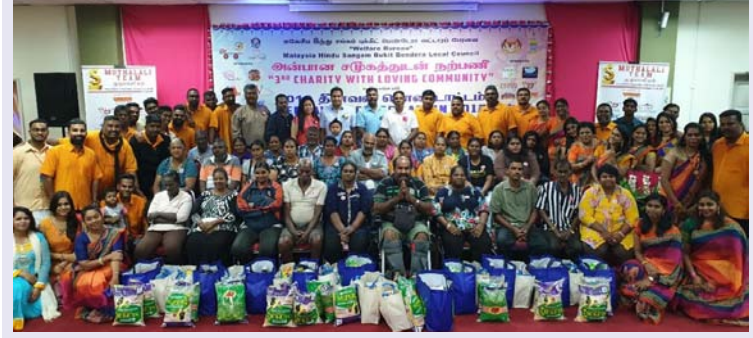
பரிசுக்கூடை பெற்றுக்கொண்ட பொது மக்களுடன் மலேசிய இந்து சங்க புக்கிட் பெண்டேரா வட்டாரப் பேரவை உறுப்பினர்கள்

ஆயர் ஈத்தாம் - ஒவ்வொரு ஆண்டும் இந்தியர்களால் தீபாவளி பண்டிகை இனிதே விமரிசையாகக் கொண்டாடப்படுகிறது. இந்தப் பண்டிகை தினத்தை முன்னிட்டு பல கொடைவள்ளல்கள் ஆண்டுத்தோறும் பல தொண்டுகள் வழங்கி வருகின்றனர். அவ்வகையில் மலேசிய இந்து சங்க புக்கிட் பெண்டேரா வட்டாரப் பேரவை ஏற்பாட்டில் மூன்றாவது முறையாக 'அன்பான சமூகத்துடன் நற்பணி' என்ற பெயரில் அன்பளிப்பு வழங்கப்பட்டன.