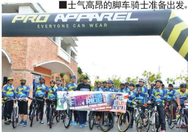
士气高昂的脚车骑士准备出发。