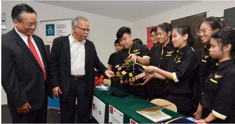
இரண்டாம் துணை முதல்வர் பேராசிரியர் ப.இராமசாமி கல்லூரி மாணவர்கள் தயாரித்த எந்திரமனிதனை (ROBOTICS) பார்வையிட்டார்.

குறுகிய காலத்தில் தனியார் கல்லூரி மையங்கள் மற்றும் பன்னாட்டு நிறுவனங்களுடனான