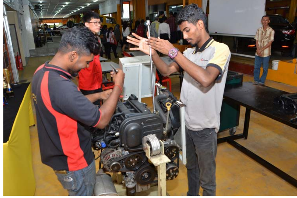
எஸ்.எல்.சி அவுட்டோமோடிவ் கற்றல் மையத்தில் பயிலும் இந்திய மாணவர்கள்

மனித மூலதனத்தை உருவாக்க கல்வி தகுதி மட்டுமின்றி ஆற்றலும் திறமையும் கொண்ட மாணவர்களைத் தேர்வு செய்வதை மாநில அரசு உறுதிச்செய்யும் என நம்பிக்கை தெரிவித்தார். இதன்மூலம், அந்நிய தொழிலாளர்களின் இறக்குமதியை வருங்காலங்களில் குறைக்க இம்மாதிரியான தொழில்திறன் மையங்கள் ஒரு மையகல்லாக அமையும் என்பது