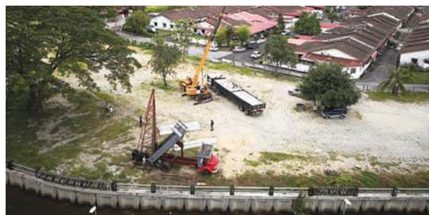
■明德绿化公园如火如荼动工。