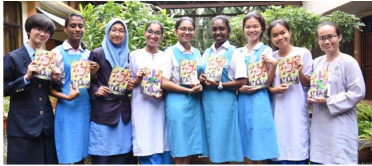
வரலாற்றுப் பயிற்சி புத்தகங்கள் பெற்றுக் கொண்ட மாணவர்கள்

எனவே, மலேசியர்கள் தாய்நாட்டின் வரலாற்றை நன்கு அறிபவர்களாவும் நேசிப்பவர்களாவும் இருப்பதன் வாயிலாக உலகின் வரைப்படத்தில் மலேசிய என்றும் என வரலாற்று பயிற்சி