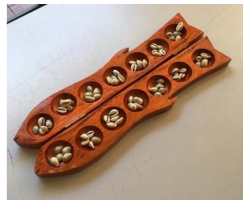
பாரம்பரிய விளையாட்டு கருவி