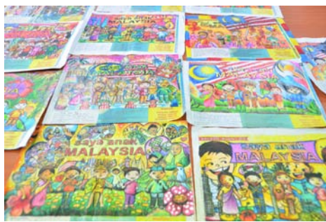
வர்ணம் தீட்டும் போட்டியில் வெற்றிப் பெற்ற படைப்புகள்

சிறுவருக்கான வர்ணம் தீட்டும் போட்டி 1/2018-யின் முதல், இரண்டாம் மற்றும் மூன்றாம் நிலை வெற்றியாளருக்கு தத்தம் ரிம250, ரிம150, ரிம100 என ரொக்கப்பணம் மற்றும் 10 ஆறுதல் பரிசுகளும் வழங்கப்படவுள்ளன. இம்முறை வர்ணம் தீட்டும் போட்டியின் கருப்பொருள் "நான் மலேசிய குடிமகன்" ஆகும். விரைவில் கொண்டாடப்படவிருக்கும் 61-வது சுதந்திர தினத்தை முன்னிட்டு பள்ளி மாணவர்களிடையே தேசப்பற்றினை மேலோங்கும் நோக்கில் இப்போட்டி வரையறுக்கப்பட்டுள்ளது. ஒரு போட்டியாளர் ஒன்றுக்கும் மேற்பட்ட படைப்புகளை அனுப்ப வாய்ப்புகள் வழங்கப்பட்டுள்ளன. மாணவர்களின்