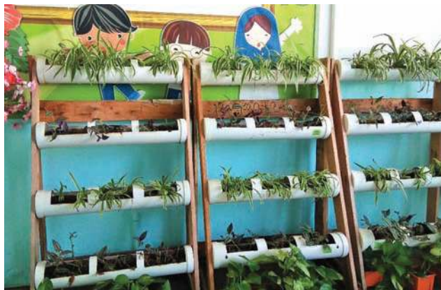
■校方化腐朽为神奇，以废弃水管种植花草。