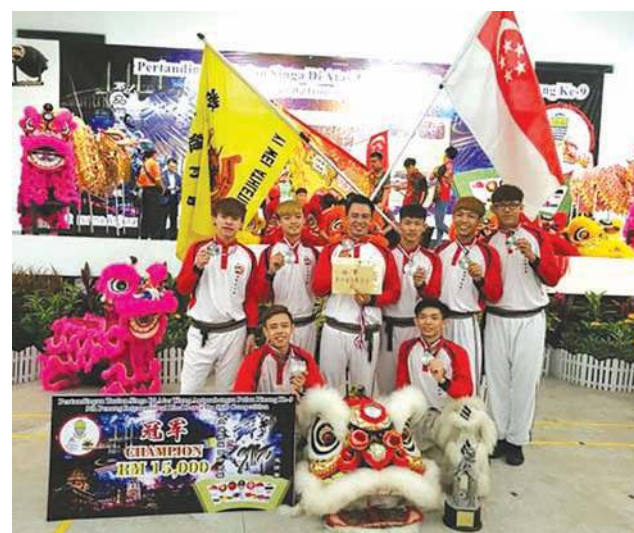
■新加坡艺威体育会登上狮王宝座。