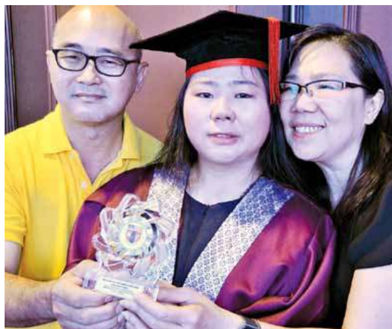
Chow’s parents sharing a joyful moment with their beloved daughter.

On what she is up to upon successfully completing her SPM studies, Chow said she plans to take up her Form Six studies in the same school.