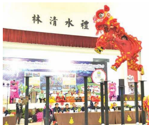
■狮队在高桩上卖力表演，让观众为他们捏一把冷汗。

此一年一度的盛事，共获得19支来自国内外的舞狮队伍参与，包括中国、越南、香港、新加坡、印尼、泰国等地。今年的总奖金增加至5万2500令吉，第4名至第8名获得1500令吉，余下的参赛队伍，则获得特优奖，奖金为1200令吉。