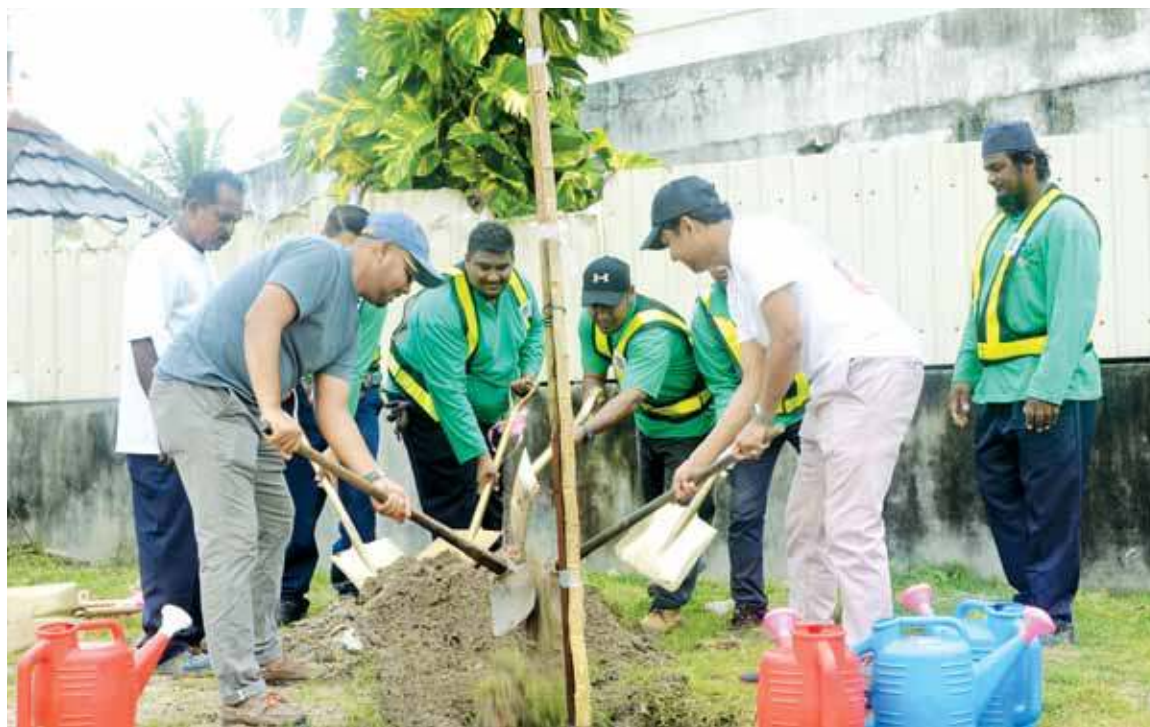
The MBPP squad also helped to plant the raintree saplings.

“The river banks normally have maintenance access for