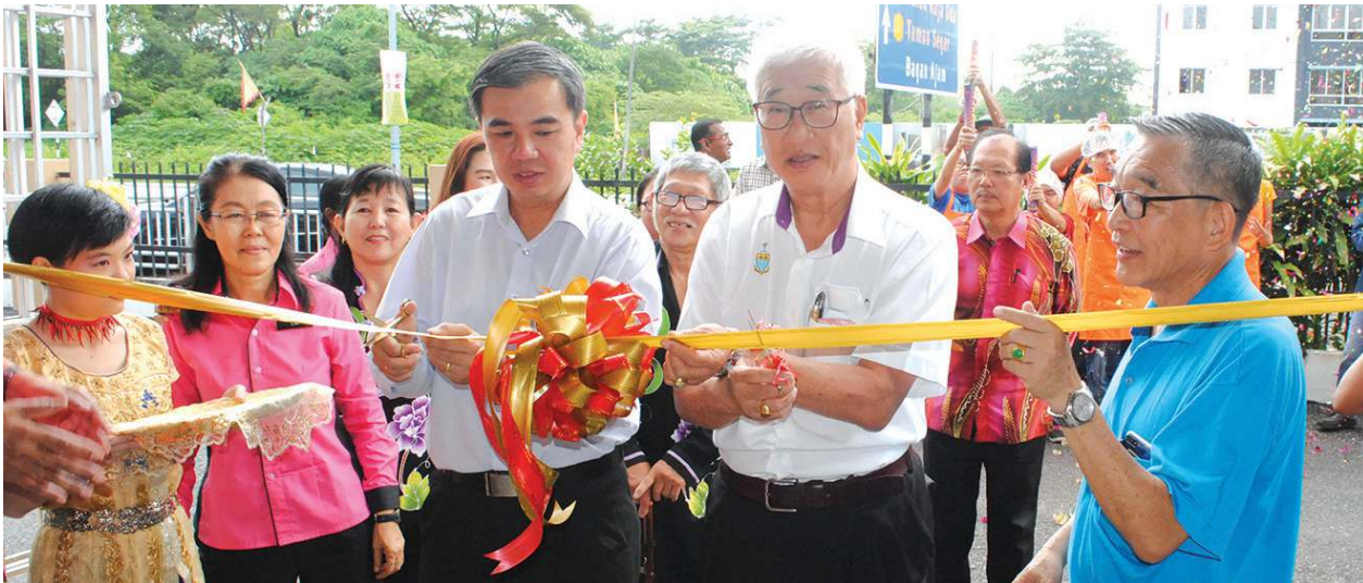
■彭文宝（右二）及孙意志为北海特殊智能工作坊主持开幕。

北海迟钝儿童中心每个月都入不敷出，槟州行政议员彭文宝承诺寻找方案，减轻该中心的负担。