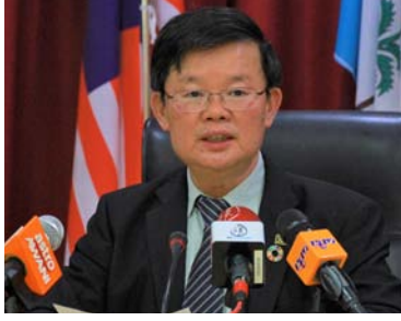
பினாங்கு மாநில முதல்வர் சாவ் கொன் யாவ்

மலேசிய காவல் துறை படை, தீ மற்றும் மீட்புத் துறை அதிகாரிகளும் ஒன்றிணைந்து அக்டோபர் 19 முதல் 23-ஆம் தேதி வரை அல்லும் பகலும் அயராது பாதிக்கப்பட்டவர்களை தேடல் மற்றும் மீட்புப்பணி