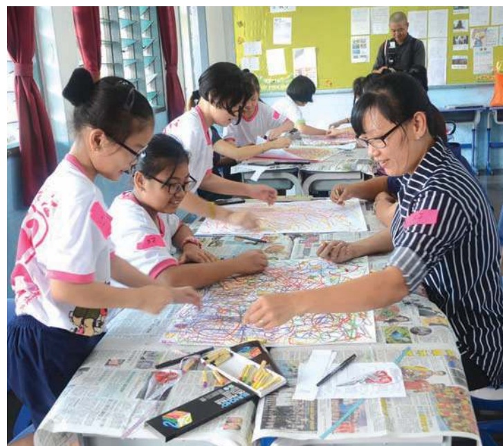
■父母与孩子通过绘画治疗以更了解彼此的想法。