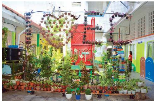
■颍川小学阅读角落旁的小花园。