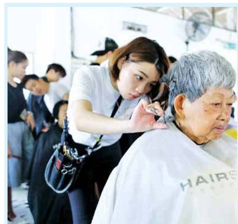
A volunteer hairdresser giving a nice haircut to a senior citizen.