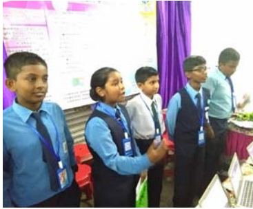
தகவல் தொழில்நுட்பங்கள் மற்றும் ரோபோ போட்டியில் கலந்து கொண்ட தமிழ்ப்பள்ளி மாணவர்கள்