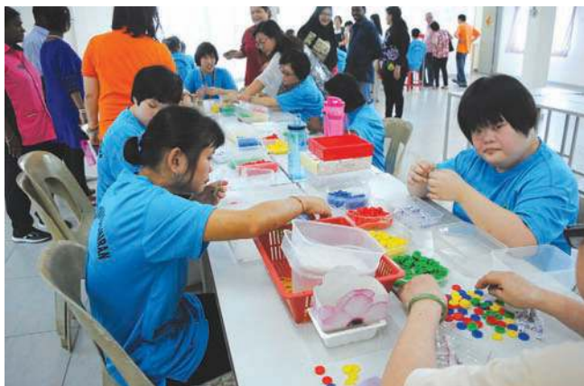
■特殊智能工作坊让特殊人士有机会投入工作。