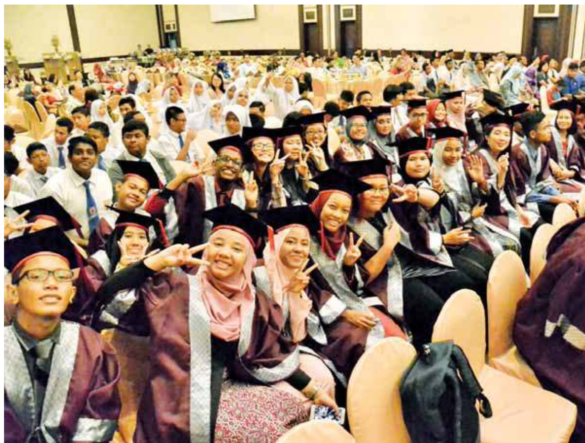
Happy moments for the graduates of SMKPKPPP.

students with special needs graduating (PMR, SPM and STPM).