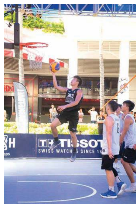
■国际性的篮球赛，可把人潮带进槟城。

因此，他希望未来州内将有更多类似活动，带动体育发展的同时，也成为州内的一大卖点，让更多人透过体育认识槟城。