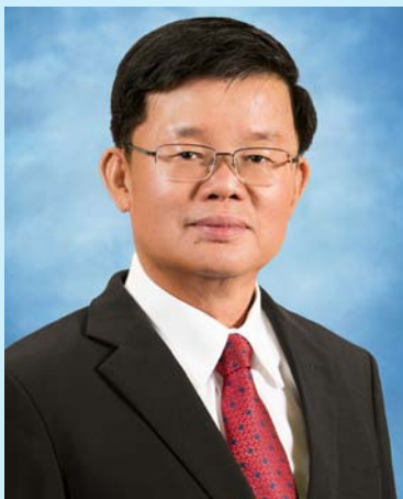
பிணங்கு மாநில முதல்வர் மேதகு சாவ் கொன் யாவ்.

பிணங்கு நம்பிக்கை கூட்டணி அரசின் 14-வது பொதுத்தேர்தல் அறிக்கையில்