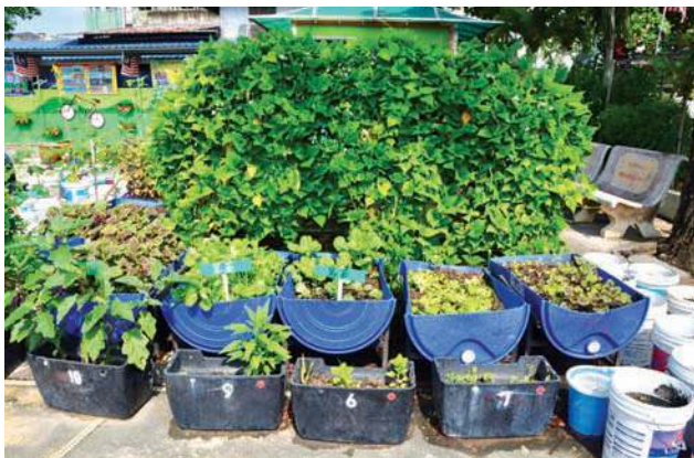
■师生在校园里种植了各式各样的蔬果。