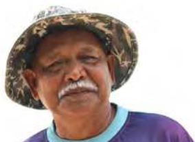
■伊斯迈指出，一名风帆健儿需具备力气、思考能力、判断能力和应变能力等条件。

说到这，他还特意唤来一名驾驶OP型帆船的学员，让对方示范翻船后如何重新将船扶正。场面虽然有点搞笑，但也让笔者更能体会风帆运动的艰辛。