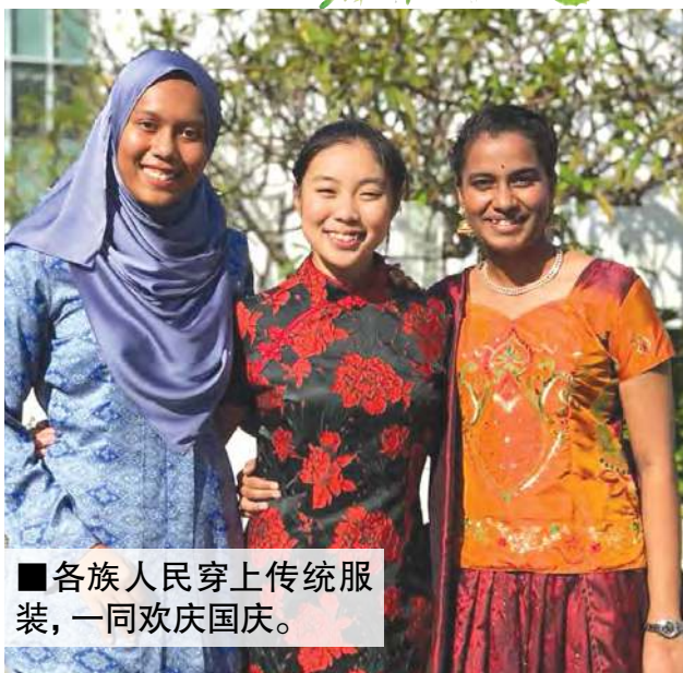
■各族人民穿上传统服装，一同欢庆国庆。

我国在今年大选实现自独立以来首次联邦政权政党轮替，使得今年的国庆日意义更为深远。而随着与联邦政府由同一阵营所执政，有更多的联邦政府部门参与今年的槟州国庆庆典大游行，使场面更热闹与盛大。