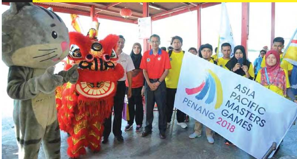
■灰猫和醒狮“相见欢”。