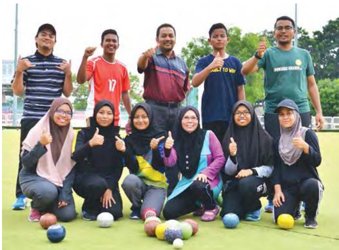
■草地滚球队准备在马运会斗智斗力。

她指出，草地滚球看似容易，但也必须掌握好技巧才能玩出一手好球，球员必须要考量滚球的角度、力道、赛场气候等方面，随时调整自己的策略，以获得最终胜利。