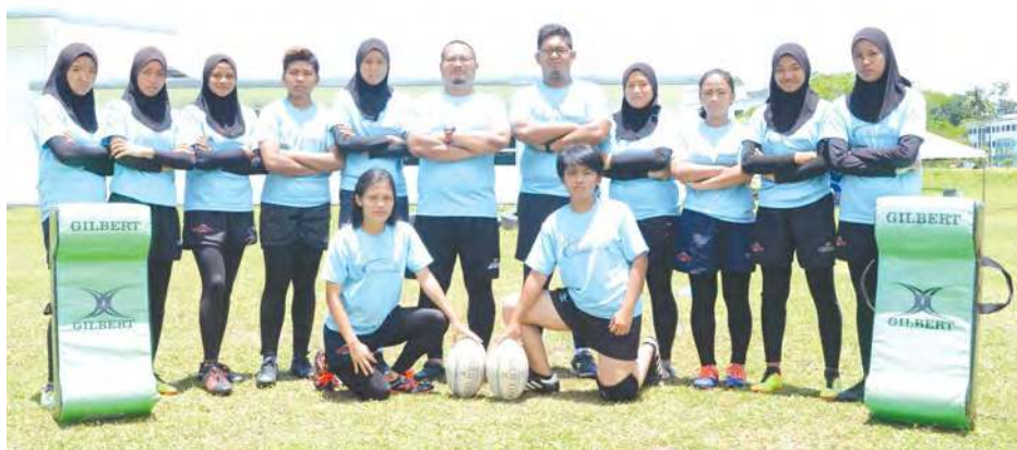
■槟州子女橄榄球队信心满满出击。

“父母亲看我那么努力认真锻炼，他们后来也渐渐接受我的爱好，并经常叮嘱我要好好照顾自己，不要在比赛时伤及身体。”