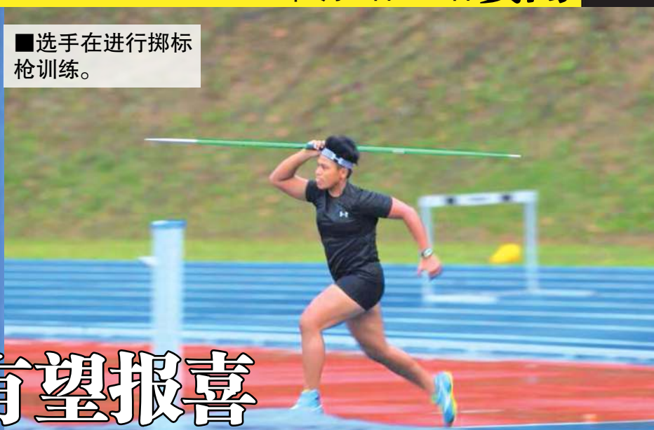
■选手在进行掷标枪训练。