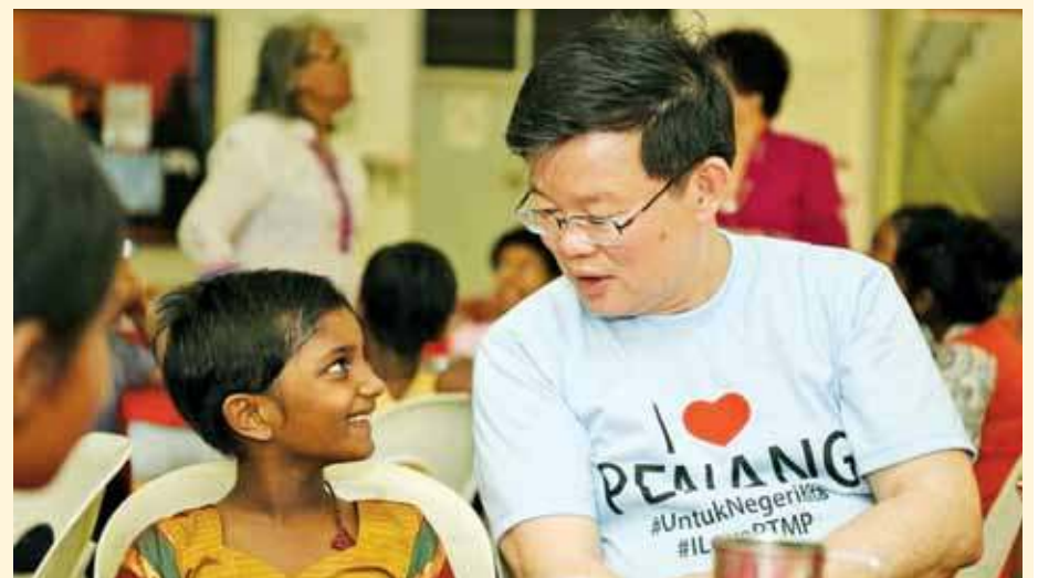
ALL WIDE-EYED... The 42 children of the St. Joseph Home were all excited on Sept 1 as they were expecting a special visitor - Chief Minister Chow Kon Yeow. A very relaxed Chow is seen here interacting with one of the eager children when he had morning tea with them.

"It was followed by the 4,900-guest Quantum of the Seas and Ovation of the Seas, currently the largest based in Asia.