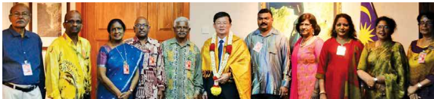
Chow with the Ramakrishna Ashrama delegation during the courtesy call.

“Ramakrishna Ashrama is an important institution in Penang catering not only to the