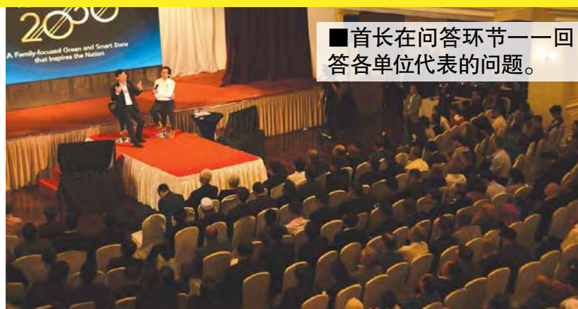
■ 首长在问答环节一一回答各单位代表的问题。