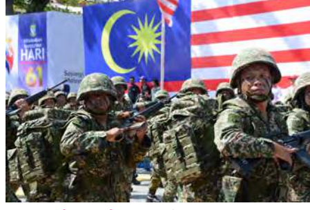
அணிவகுப்பில் இடம்பெற்ற இராணுவப் படையினர்