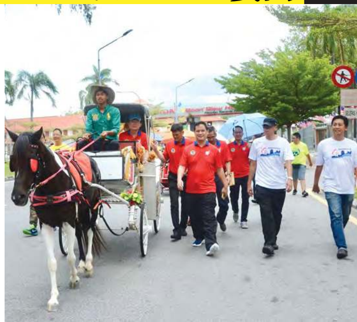
■首长曹观友坐上马车参与火炬传递。