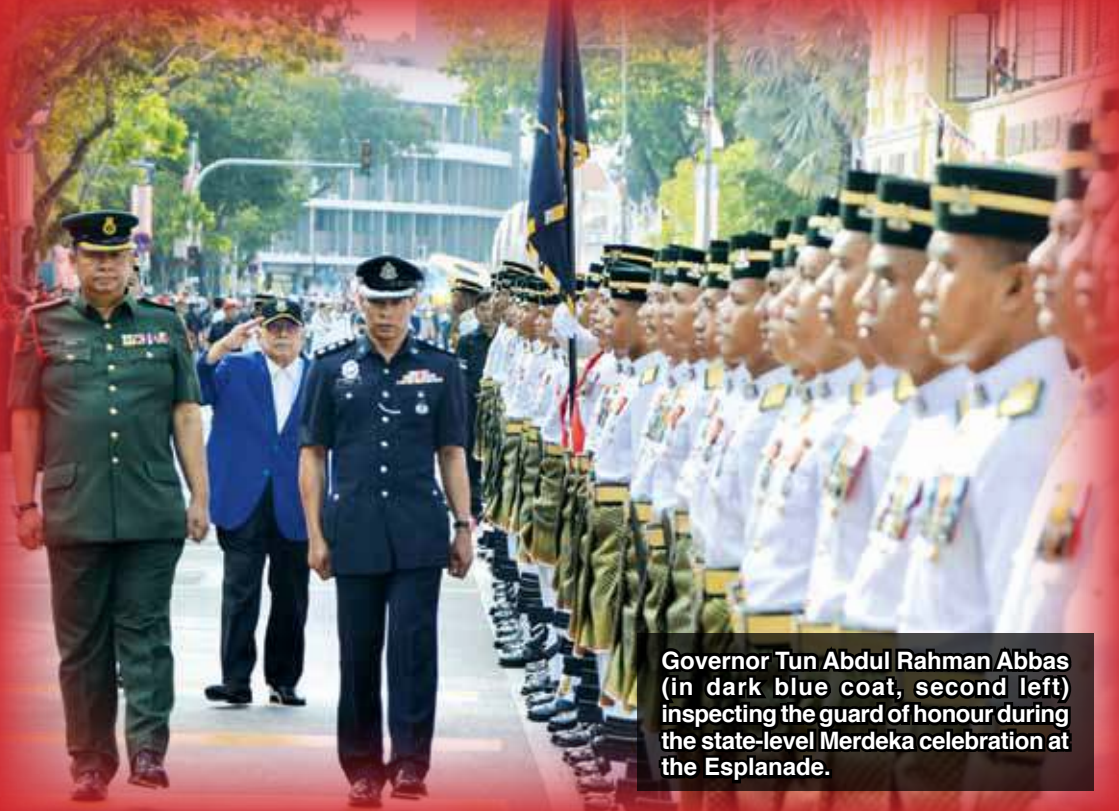
Governor Tun Abdul Rahman Abbas (in dark blue coat, second left) inspecting the guard of honour during the state-level Merdeka celebration at the Esplanade.

Among those present were Chief Minister Chow Kon Yeow, Deputy Chief Minister II Prof P. Ramasamy and State Speaker Datuk Law Choo Kiang, MPs and state assemblymen.