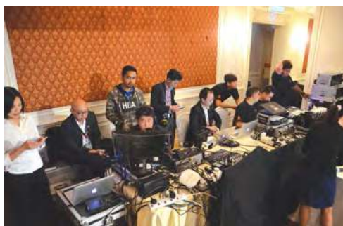
■ 舞台各类仪器控制人员是幕后功臣。