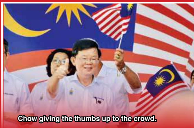
Chow giving the thumbs up to the crowd.