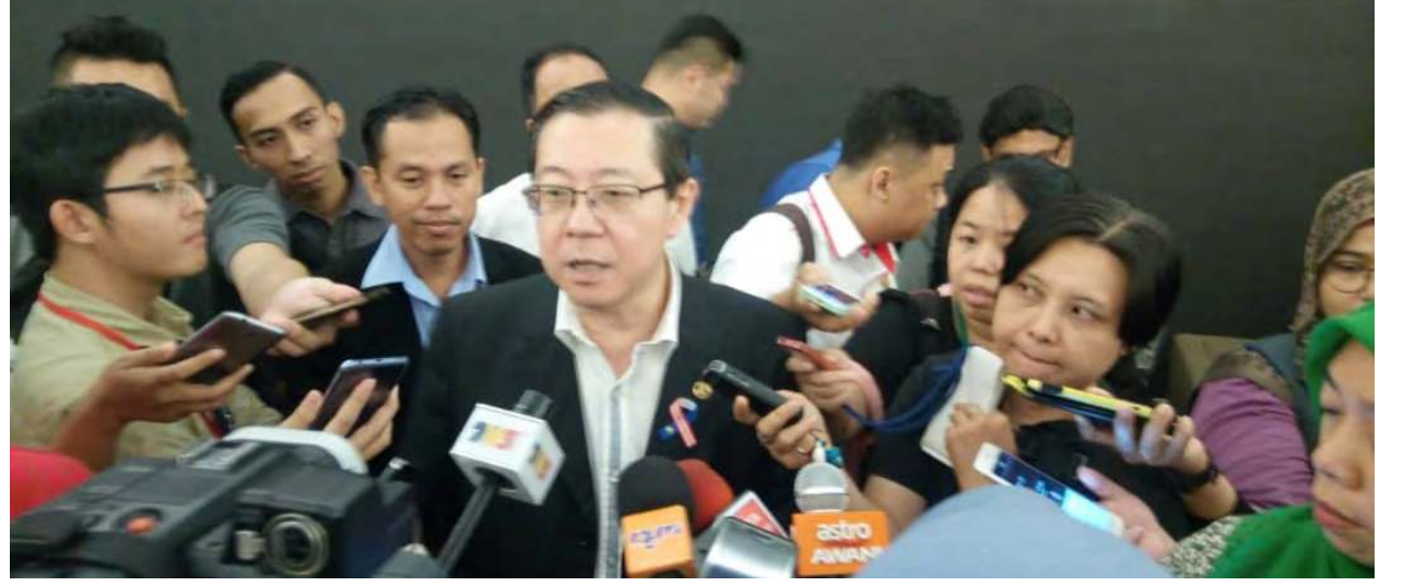
நிதி அமைச்சர் லிம் குவான் எங்

‘மேலும், ரிம1.5 மில்லியன் வரை வருமானம் பெறும் ‘நாசி கண்டார்’ உணவகங்கள் சேவை வரி 6% செலுத்துவது அவசியம் என எஸ்.எஸ்.தி செயல்பாடு குறித்த மாநாட்டில் கலந்து கொண்டு செய்தியாளர் சந்திப்பில் கூறினார். எனினும் ரிம1.5 மில்லியனுக்கு குறைவாக வருமானம் பெறும் உணவகங்களுக்கு சேவை வரி விதிக்கப்படாது. இந்த உணவகங்கள் முன்னேற்றம் அடையும் உணவகமாக கருதப்படும்.