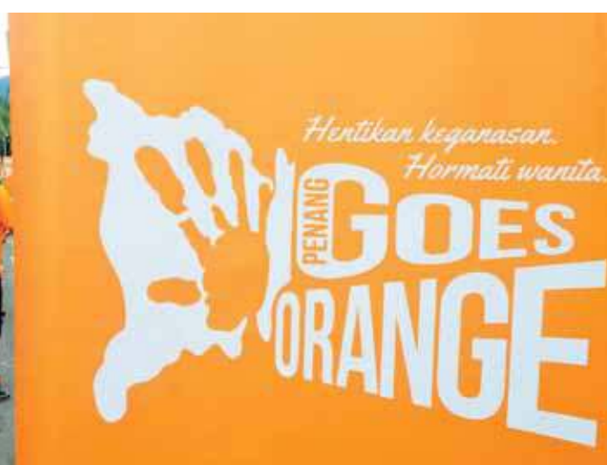
Participants at last year's Penang Goes Orange event giving The Orange Challenge a shot.

pants. It's a family-oriented fun and learning event with lots of goodies for everyone and attractive prizes for the winners.