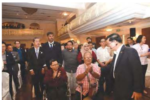
■ 首长欢迎障友出席说明会。