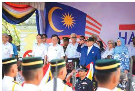
■一众州议员兴奋的展示国旗，喜迎国庆。