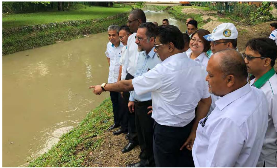
நீர், நில மற்றும் இயற்கை வள அமைச்சர் டாக்டர் சேவியர் ஜெயகுமார், பினாங்கு ஆட்சிக்குழு உறுப்பினர் ஜெக்டிப் மற்றும் முக்கிய பிரமுகர்கள் சுங்கை பினாங் ஆற்றை நேரில் சென்று பார்வையிட்டனர்.

சுங்கை பினாங் ஆறு 1.5 கிலோ மீட்டர் விரிவுப்படுத்தப்படவுள்ளது. இத்திட்டத்தின் மூலம் அவ்வட்டாரத்தில் வாழும் 150,000 குடியிருப்பாளர்கள்