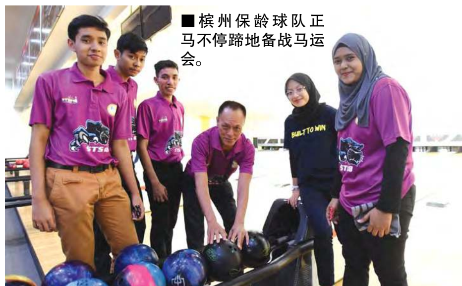
■槟州保龄球队正马不停蹄地备战马运会。