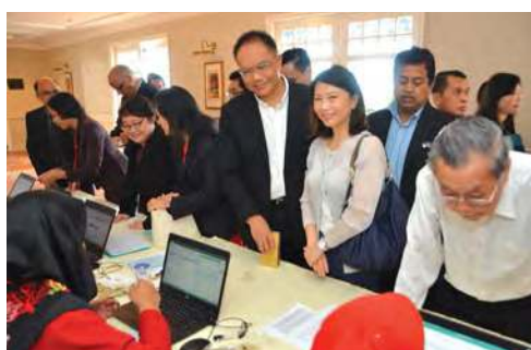
■ 出席者在接待处接受扫描后准备进场。