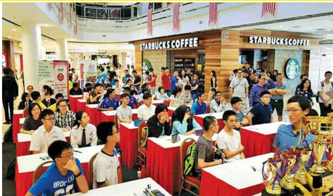
Students waiting anxiously to solve the problems during the Mind Game Challenge 2018 at Queensbay Mall.

Parents, teachers and even shoppers in Queensbay Mall were heard cheering and sup-