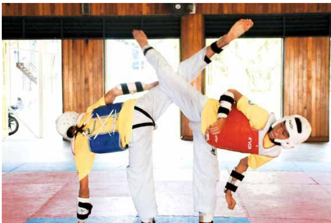
Taekwondo is an art of defence that uses the leg as the main attack.

“I am prepared and hope to win a medal,” the computer science graduate from Tunku Abdul Rahman College (TAR) said.