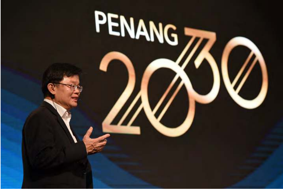
மாநில முதல்வர் சாவ் கொன் யாவ் 'பினாங்கு 2030' இலக்கு குறித்து விவரித்தார்.

ஜோர்ச்டவுன் - பினாங்கு மாநில அரசாங்கம் இன்று முதல் 12 ஆண்டுக்குள் பொது மக்கள் செழிப்பான வாழ்க்கை வாழ்வதை உறுதிப்படுத்துவதோடு பசுமை மிக்க மாநிலமாக உருவாக்க இலக்கு கொண்டுள்ளது. இந்தக் கனவை மெய்ப்பிக்கும் வகையில் மாநில முதல்வர் மேதகு சாவ் கொன் யாவ் மாநில வளர்ச்சி இலக்கை “பினாங்கு 2030” என அறிவித்தார். “பினாங்கு 2030” இலக்கு நான்கு முக்கிய கருப்பொருளைக் கொண்டுள்ளன.