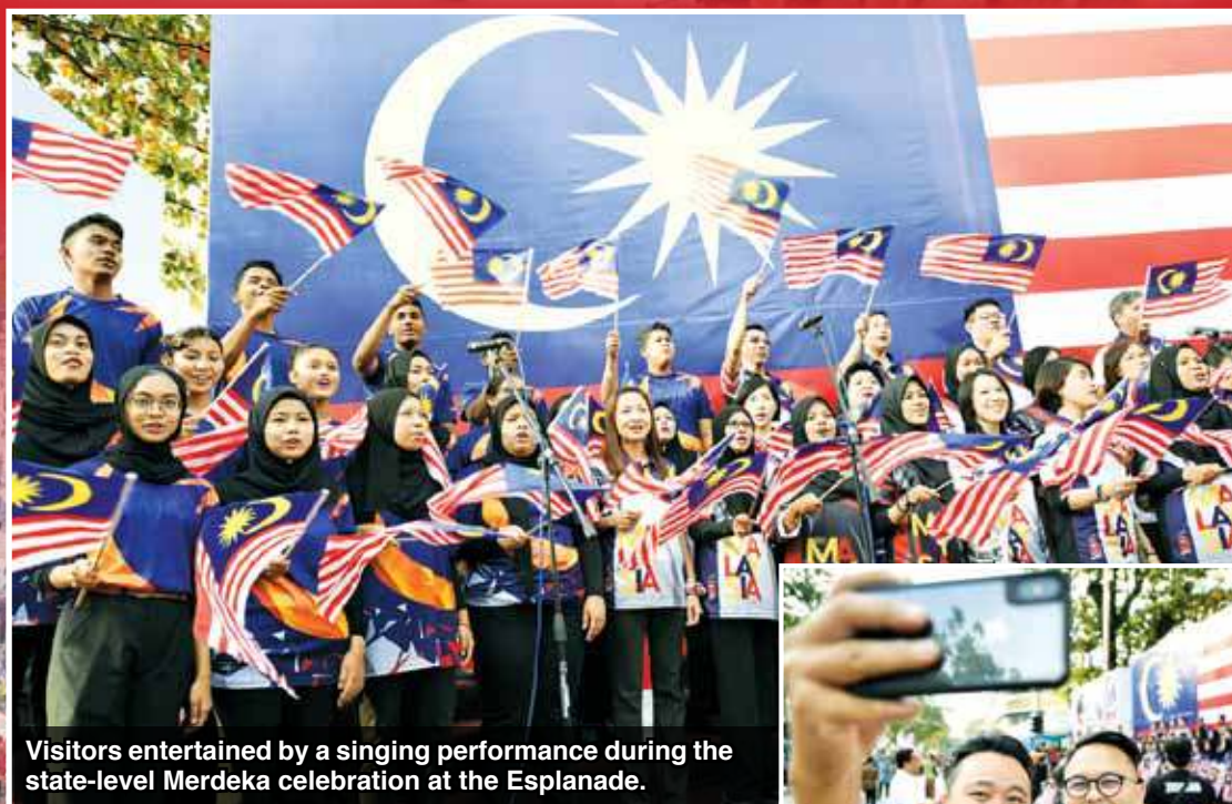
Visitors entertained by a singing performance during the state-level Merdeka celebration at the Esplanade.