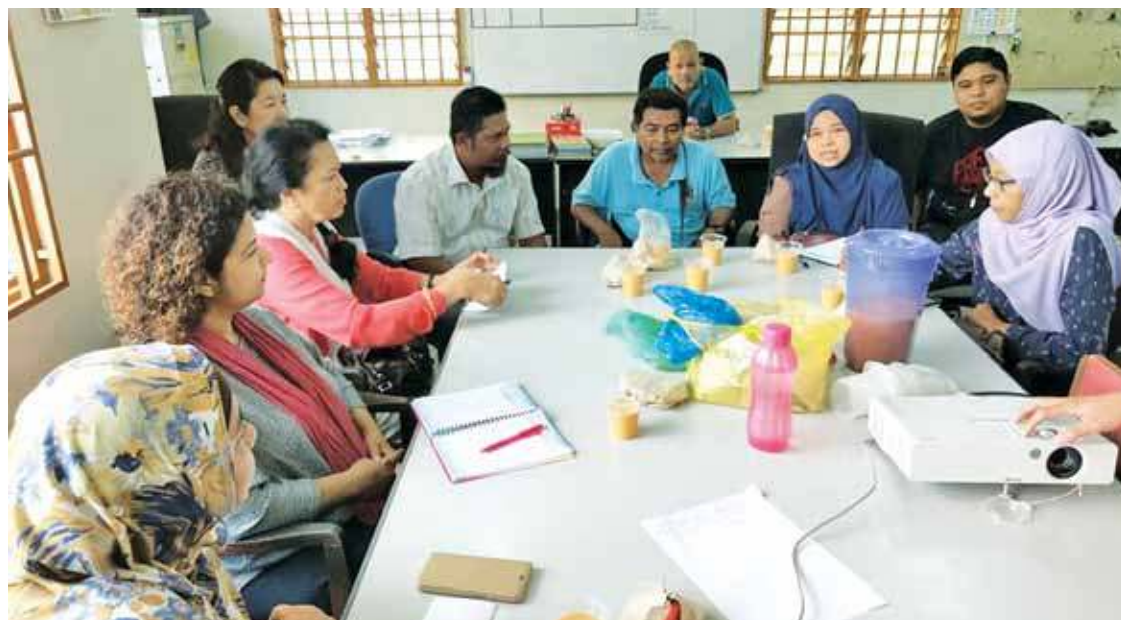
GRPB discussion with residents at Perumahan Kersani.

This program is the result of a pilot project that was held at Machang Bubuk KADUN in 2016. In this program, the State Assemblyman and MPKK became the champion in implementing the people's participation project in determining the needs of the residents in each JKKK/MPKK under their respective KADUN. As a result of the assessment of this requirement, the provisions of ADUN can be used effectively in accordance with the needs of its community.