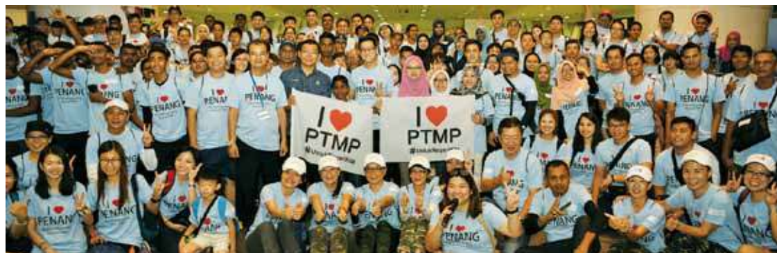
Jubilant participants of the I Love Penang Hunt are getting ready before being flagged off at Komtar.