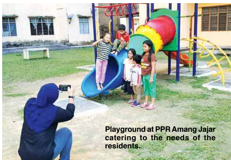
Playground at PPR Amang Jajar catering to the needs of the residents.