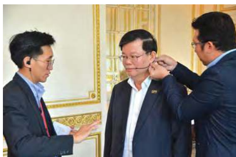
■ 工作人员为首长装上无线麦克风。