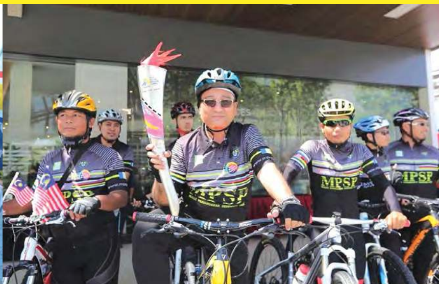
■踏脚车传火炬，健康又 有意义。