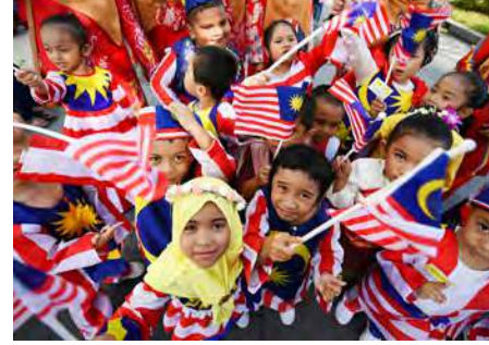
தேசிய தினக் கொண்டாட்டத்தில் கலந்து கொண்ட சிறுவர்கள்