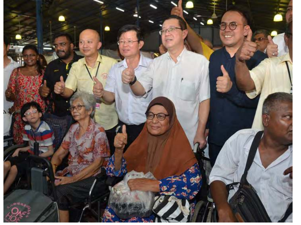
அன்பளிப்புப் பெற்றுக்கொண்ட பொது மக்களுடன் அரசியல் தலைவர்கள்