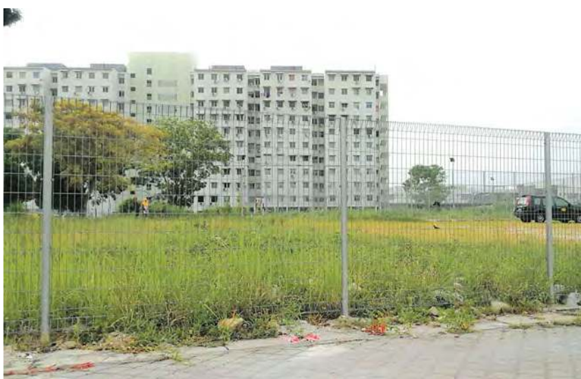
■海景公寓小贩中心对面的空地，将兴建一个篮球场供居民使用。