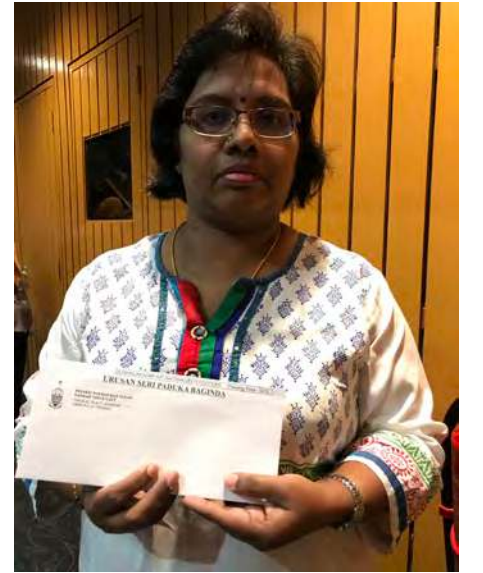
இந்திய மாணவியின் தாயார் ஊக்கத்தொகை பெற்றுக்கொண்டார்.

மாநில அரசு மாணவர்கள் பட்டம் பெற்ற பிறகும் பினாங்கு மாநிலத்தின் வளர்ச்சிக்கு தங்களின்