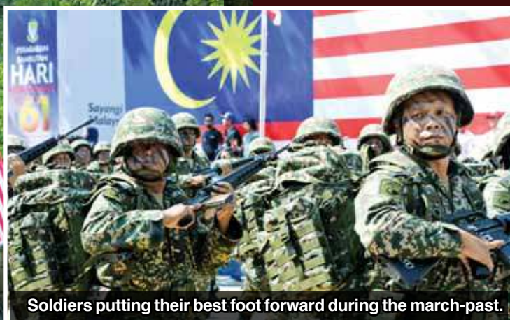
Soldiers putting their best foot forward during the march-past.