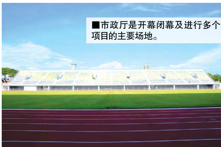
■市政厅是开幕闭幕及进行多个项目的主要场地。