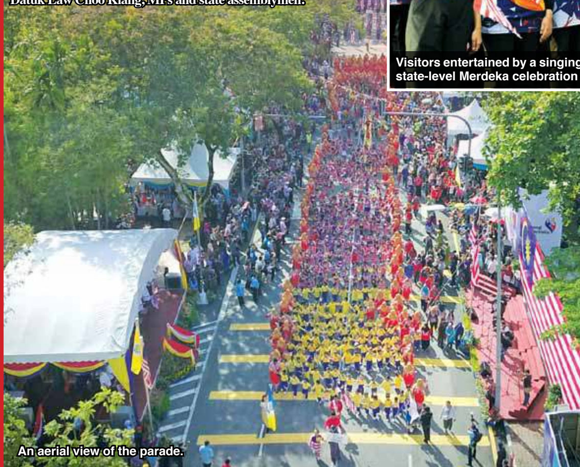
An aerial view of the parade.