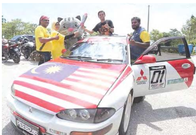
■国旗车队护送火炬。