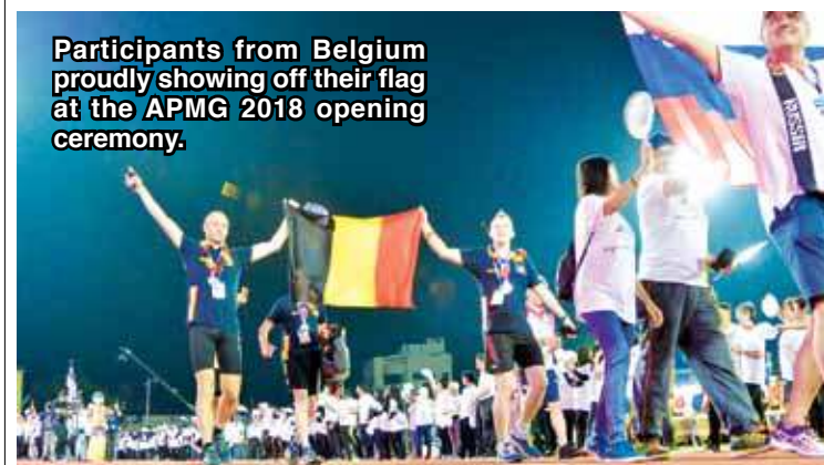
Participants from Belgium proudly showing off their flag at the APMG 2018 opening ceremony.

A splendid display of fireworks at the end of the show made the night more memorable, particularly for those at the newly-renovated City Stadium.