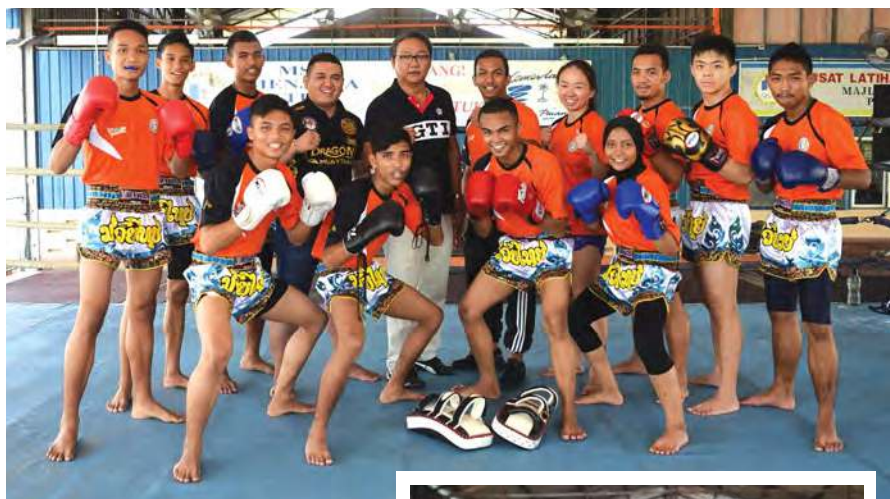
■泰拳队10位选手准备挥拳出击。

“泰拳训练中，能够让我锻炼体能和毅力，不断超越自己的极限，是我最享受这项运动的地方，我希望能够在马运会获得好成绩，为槟城争光。”