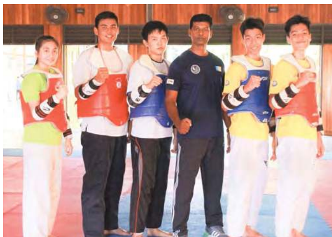
■槟州跆拳道选手们已做好准备，迎战马运会。