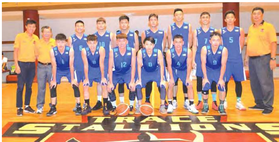
■ 槟州篮球队士气高昂，誓言要为槟州争金夺银。

为了备战马运会，槟州男子篮球队特地拉队到菲律宾进行特训，并与当地的篮球队切磋球技，从中累积更多实战经验。