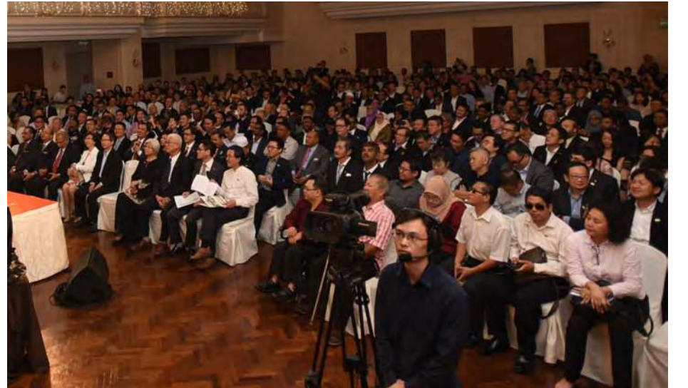
நிகழ்வில் கலந்து கொண்ட பிரமுகர்கள்

‘பினாங்கு 2030’ இலக்கில் குறிப்பிட்டுள்ள அனைத்துக் கொள்கைகளும் பினாங்கை பசுமை மற்றும் அறிவார்ந்த மாநிலமாகவும் பொருளாதார மேம்பாடு, சிவில் சமூகம் அமைக்க உணர்வுக்கோளாகத் திகழும்.