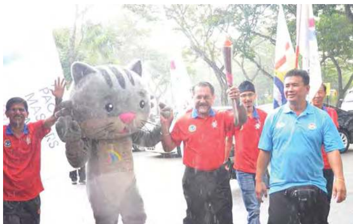
■虽然下着倾盆大雨，佳日星行政议员仍然奋力传递火炬。

槟州政府过去一周举办多场造势活动及公开翻新完成的槟岛市政厅体育场，9月7日至15日欢迎民众前往槟威两地赛场免费入场观赏健儿们的精彩比拼，详情可参考脸书：Penang Asia Pacific Masters Games 2018。