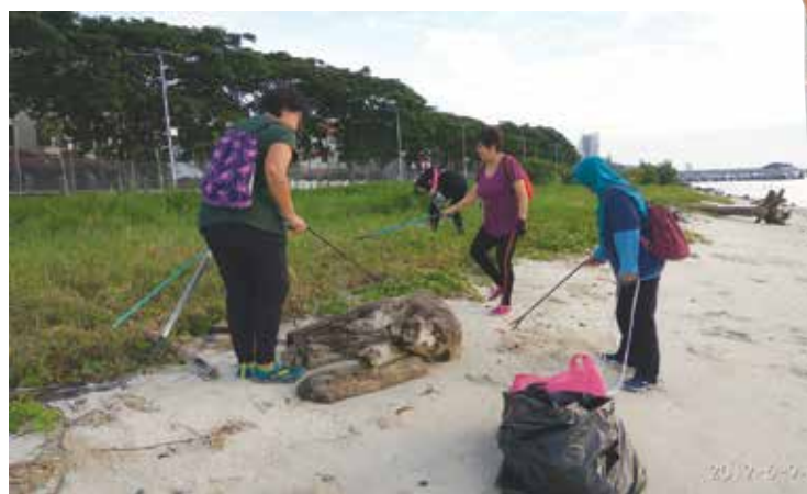
大家一起来清理海滩，还沙滩一个清洁的环境。