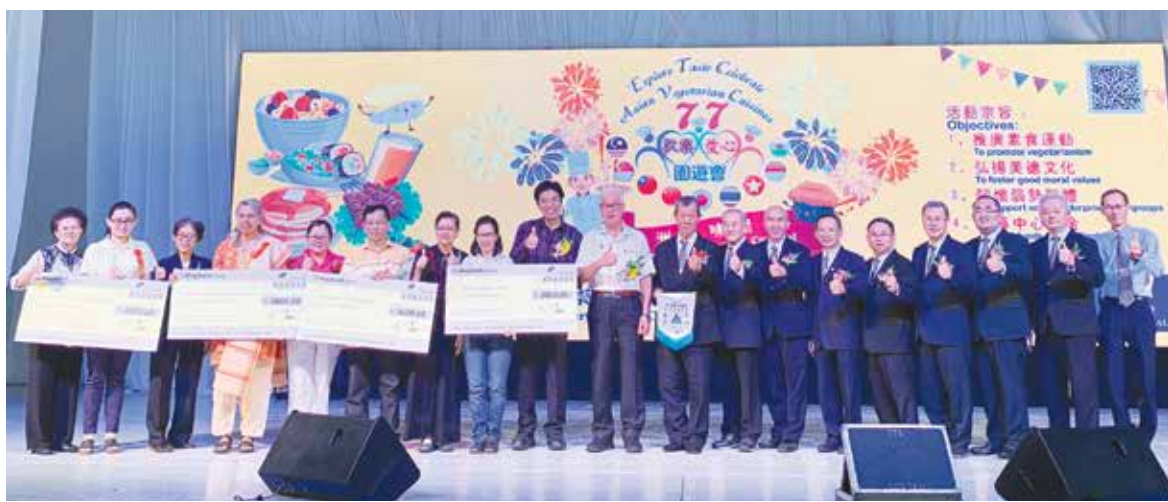
“亚洲美味素食77欢乐爱心园游会”全体嘉宾及受惠团体代表合影。