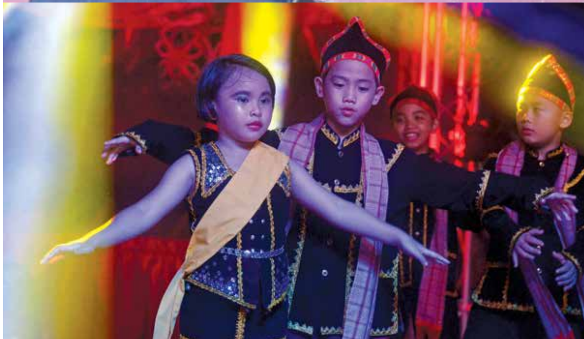
The young ones showing grace and confidence as they perform at the closing ceremony of the Penang Gawai and Kaamatan Festival.