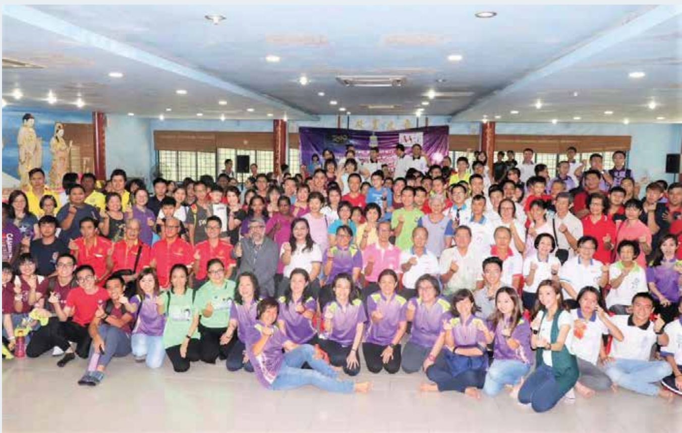
“一户一救生员”活动 出席者大合照。

她说，这项活动与本来预计的150名参与者超出许多，这是该团队的一大突破，同时，她也希望武拉必区内有更多类似的活动，让居民们能够在成长中学习。