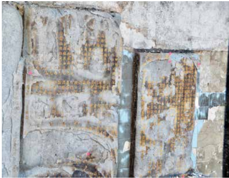
富有历史价值的珍贵纪念碑被烧毁，令人惋惜。

无论如何，由于世遗机构并没有结构专家，因此，他们并不会对庙宇结构做出评估，庙方需委托这方面的专家来做出检查，确保庙宇结构安全，并给予理事会维修建议。