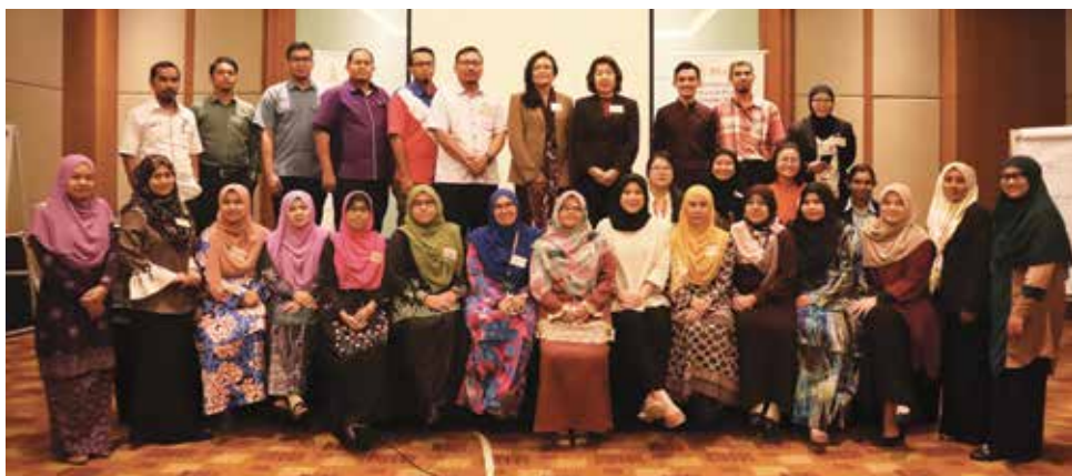
“性别反应及参与财政预算案”工作坊日前圆满进行。

了槟州五大县土地局所属办公室、槟州兽医局及檳城图书馆等，并由这七个部门拉响头炮，希望其他部门亦追随其脚步。