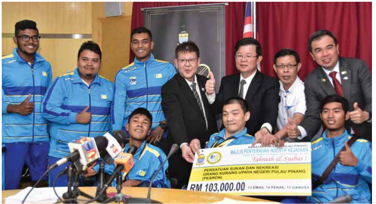
மாநில அரசின் ஸ்கிமாஸ் வெகுமதி பெற்றுக்கொண்ட விளையாட்டு வீரர்களுடன் மாநில முதல்வர் மற்றும் அரசியல் தலைவர்கள்

மேலும், கடந்த ஆண்டு அக்டோபர் மாதம் பேராக்கில் நடைபெற்ற 20-வது மலேசியா காது கேளாதோர் விளையாட்டுப் போட்டியில் (சொப்மா) பிணாங்கு மாநிலத்தை பிரதிநிதித்து சென்ற பிணாங்கு காது கேளாதோர் விளையாட்டு சங்க வீரர்கள் நான்கு தங்கப் பதக்கம், வெள்ளி(7) மற்றும் வெண்கலம்(6) வென்றதை முன்னிட்டு மாநில முதல்வர்