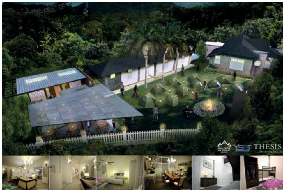
山坡别墅富英殖民地风味，欢迎前来共渡美好时光。

槟城首席部长兼升旗山机构主席曹观友说，升旗山的山坡别墅翻新工程完成后，预计10月杪开放给民众预订，这让游客和本地民众提供了更多样化的旅游选择。