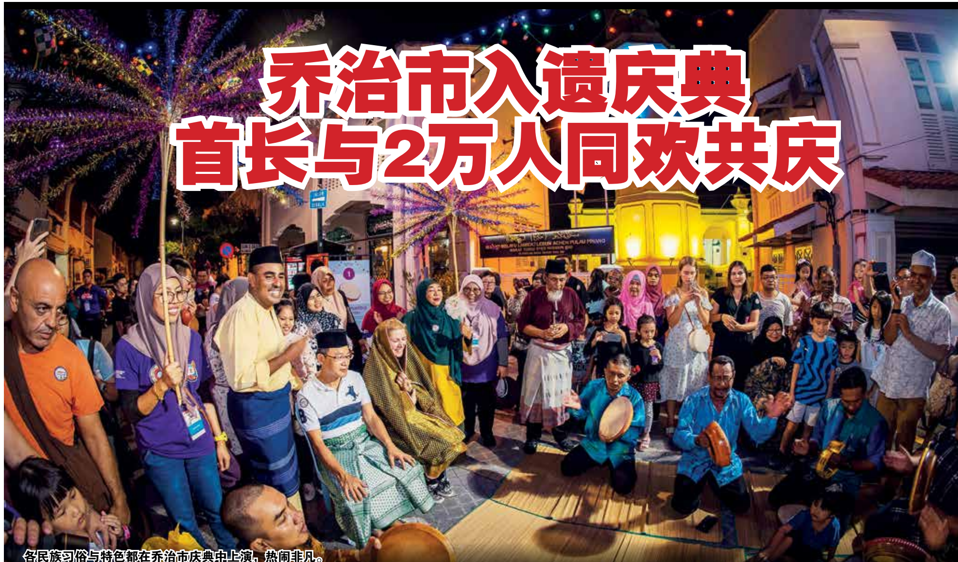
各民族习俗与特色都在乔治市庆典中上演，热闹非凡。

以“同欢共庆-仪式与节庆”(Rituals and Festive Events)为主题的乔治市入遗庆典日前在乔治市古迹区热闹掀开序幕，吸引约2万人共襄盛举，不同民族的节庆仪式及舞蹈轮番上演，使整个乔治市街道蜕变为热闹欢腾及盛大节庆现场。