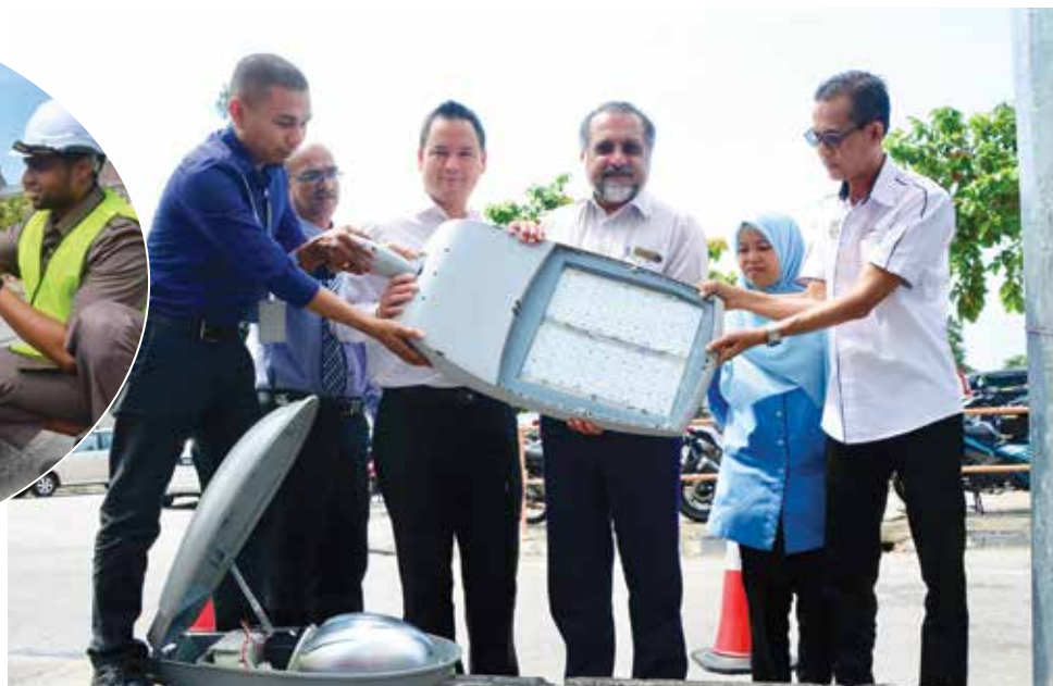
佳日星有信心槟州的街灯在2022年可全面更换为LED。

柏迪路威省市议会办事处、柏迪路体育中心、柏淡路体育中心安装太阳能伏电板。至于其他的建筑物则有待当局进行考量。