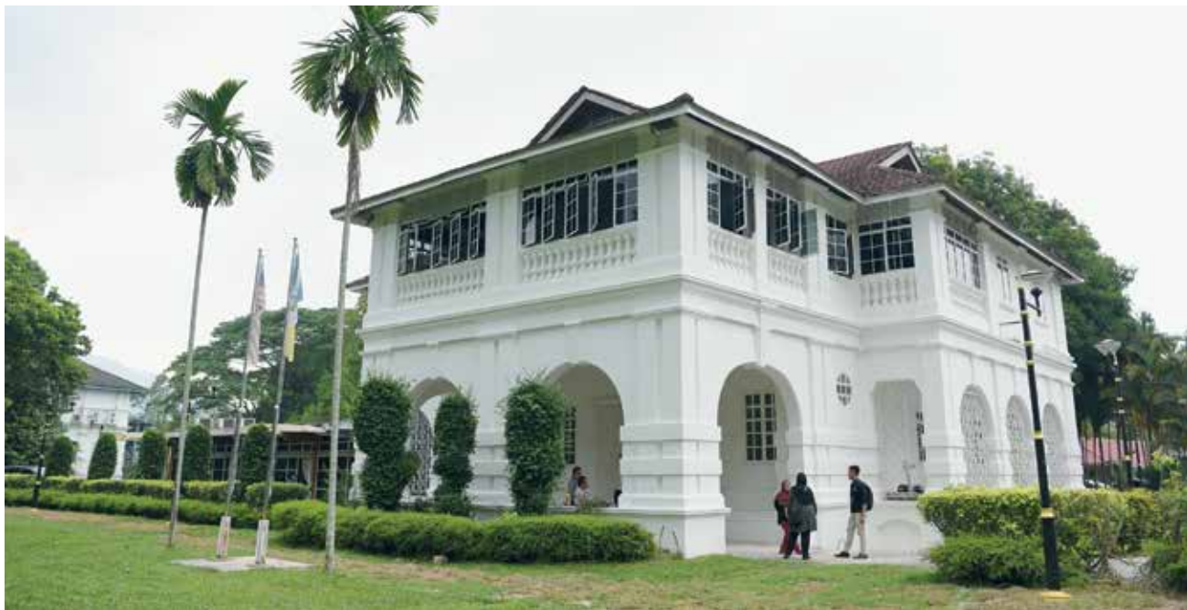
首长官邸“莲花苑”外观。