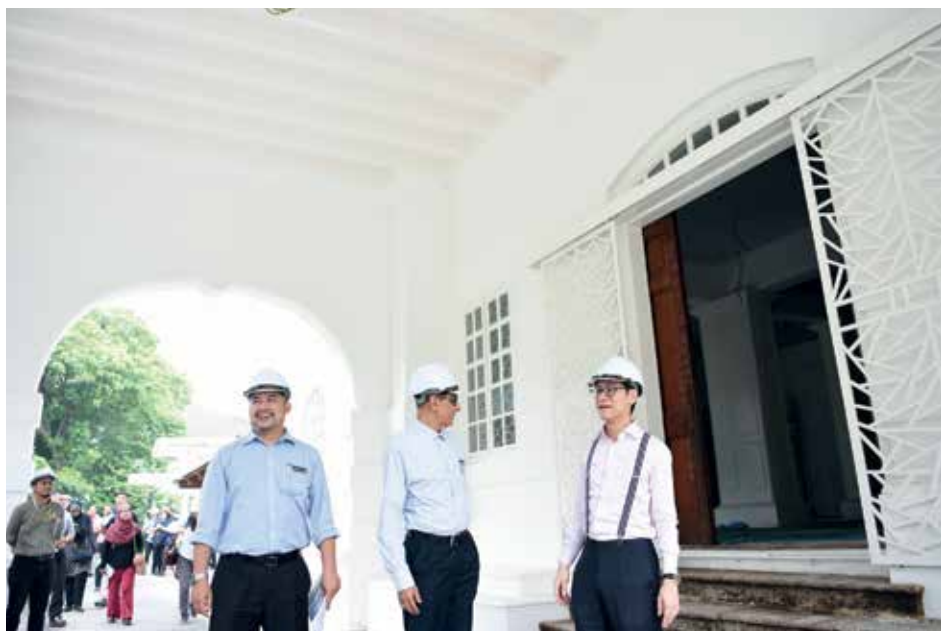
再里尔带领媒体视察首长官邸。

主建筑内共有4间卧室，并设有会议室、书房、客厅、厨房和饭厅等。有关建筑建于20世纪初，至今已有逾百年历史。