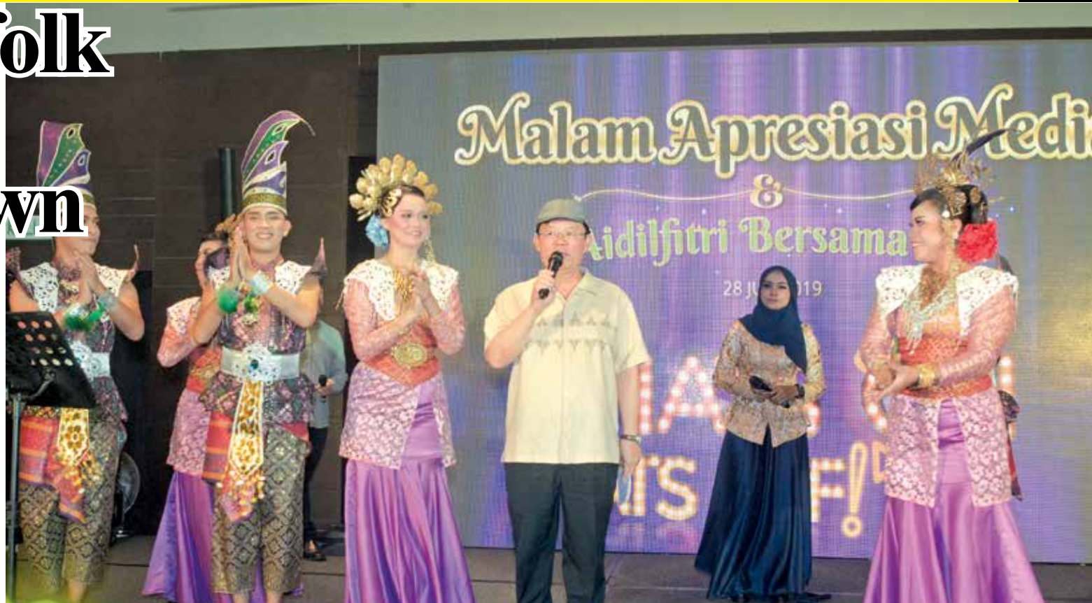
A sporting Chow joining some dancers as he sings a Malay number 'Seloka Hari Raya'.

walked away with lucky draw prizes which included two hotel stays, a television set, hotel buffet vouchers, luggage, a foldable bicycle and various electrical and electronic items.