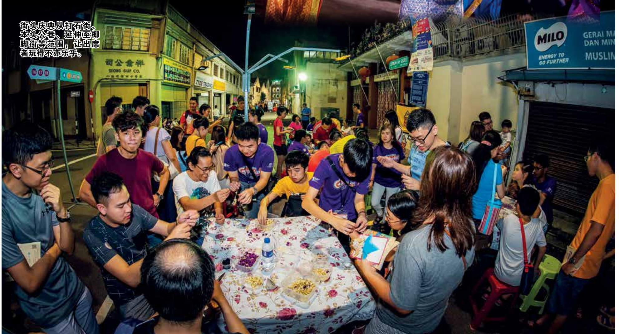
街头庆典从打石街、本头公巷、延伸至椰脚街等范围，让出席者玩得不亦乐乎。