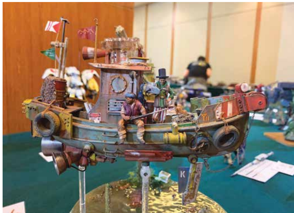
精致的模型，栩栩如生。