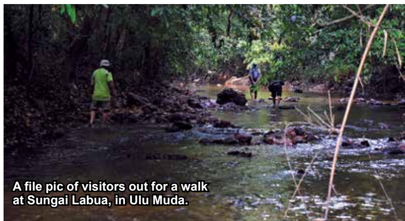
A file pic of visitors out for a walk at Sungai Labua, in Ulu Muda.

He quoted the online posts by WWF-Malaysia and Friends of Ulu Muda II as saying that the Ulu Muda Forest covered a total area of about 160,000 hectares.