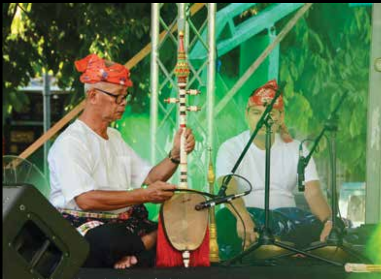
老伯伯全神贯注演奏马来传统乐器。