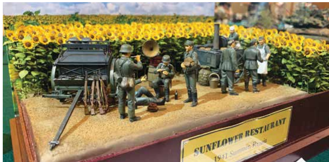
模型展里，共分为9个展览厅，而军事模型是其中一个类别。