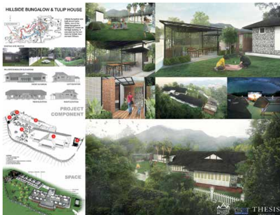
升旗山山坡别墅 预计10月杪开放给民众预订。

“升旗山上的别墅是英殖民风格的建筑，想要体验舒适清静的可以选择入住别墅客房，而若学生团即公司想要进行团队建设获得，以及更加探险旅程的话，可以选择露营地。”