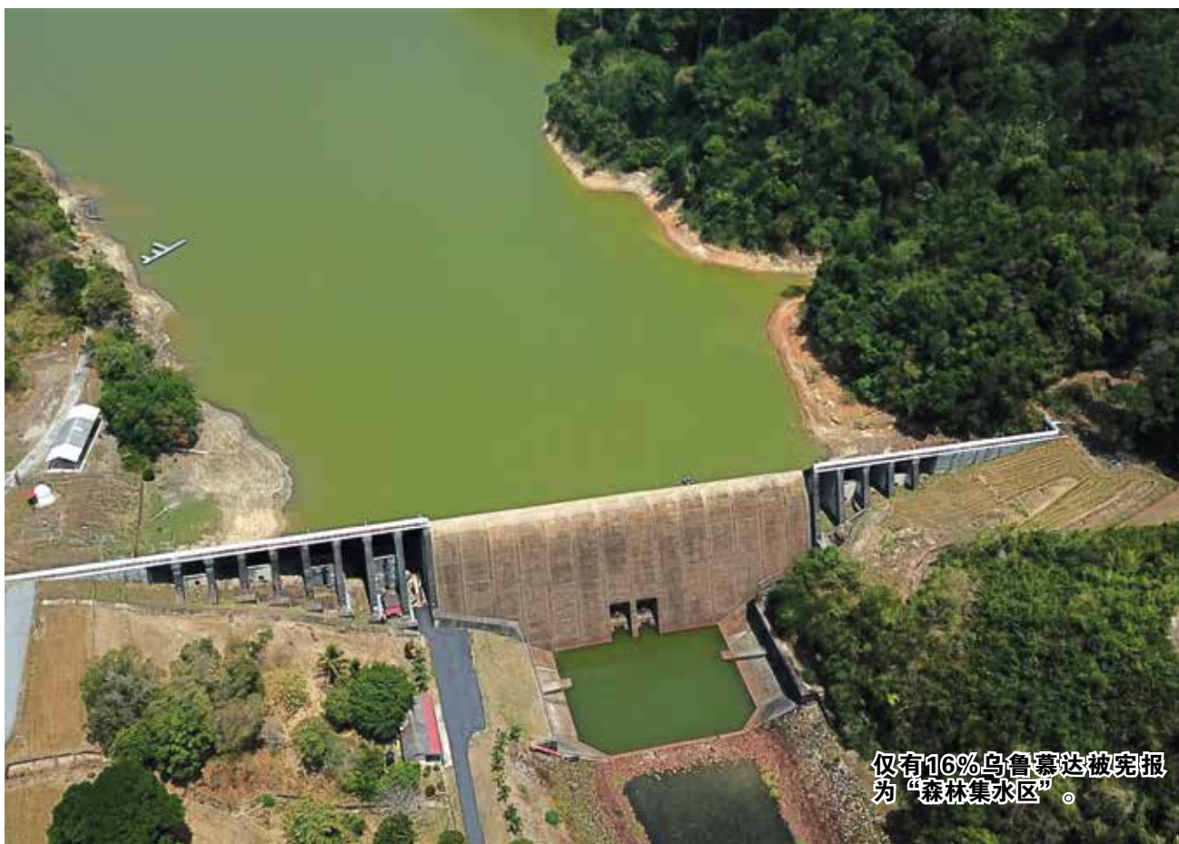
仅有16%乌鲁慕达被宪报为“森林集水区”。