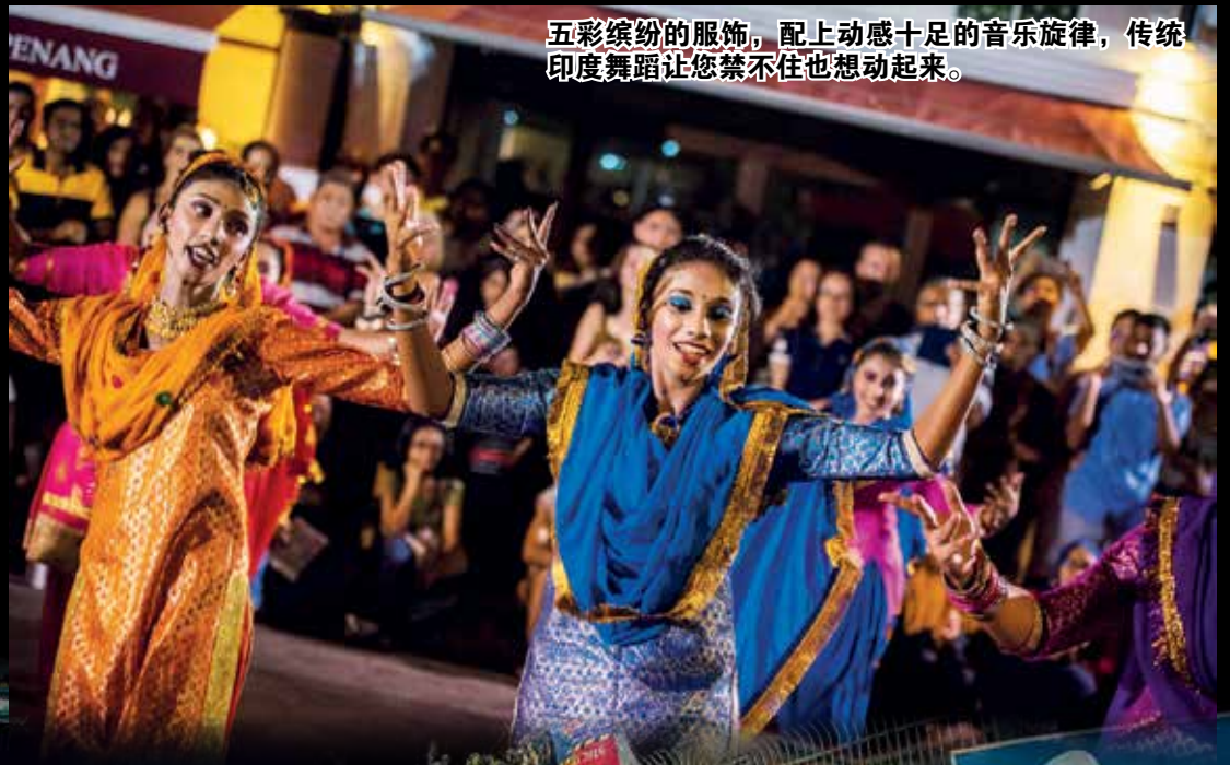
五彩缤纷的服饰，配上动感十足的音乐旋律，传统印度舞蹈让您禁不住也想动起来。