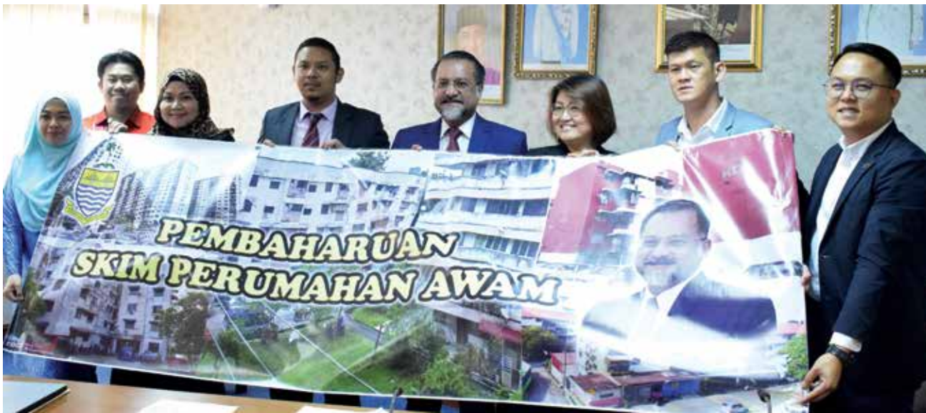
佳日星召开记者会宣布，玛苏里组屋将在年内重建。

他指出，目前玛苏里组屋共有6栋，其中一栋被列为危楼，居民早已撤出。因此工程进行时，将会先在空置地点重建，再通过“逐栋建好就迁入”的做