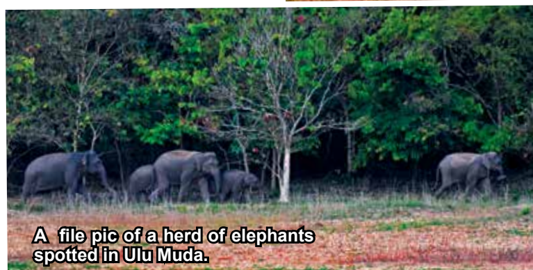
A file pic of a herd of elephants spotted in Ulu Muda.

“Has Kedah classified any areas in Ulu Muda as timber production forests under the NFA? If so, how