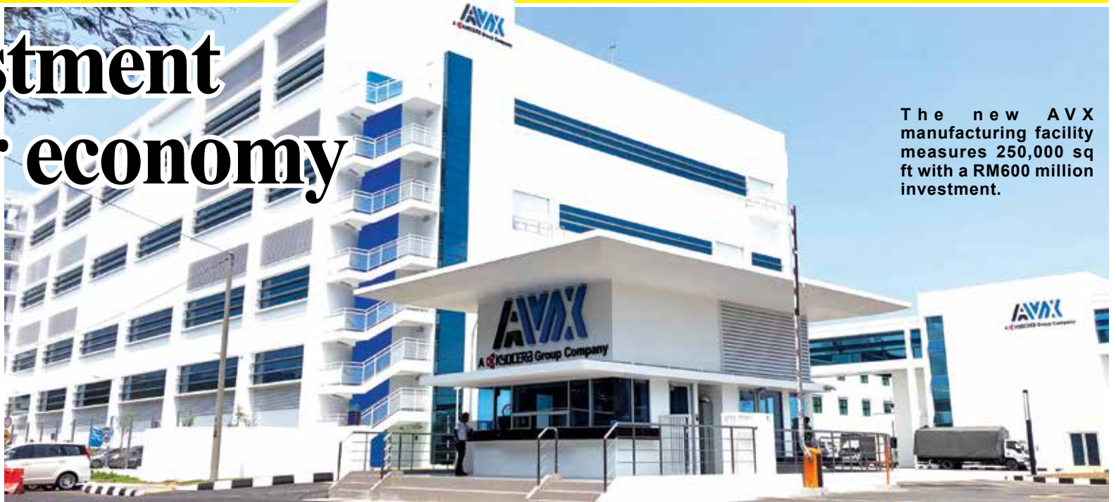
The new AVX manufacturing facility measures 250,000 sq ft with a RM600 million investment.

According to Chow, reinvestment is important for the economy as it brings new job opportunities