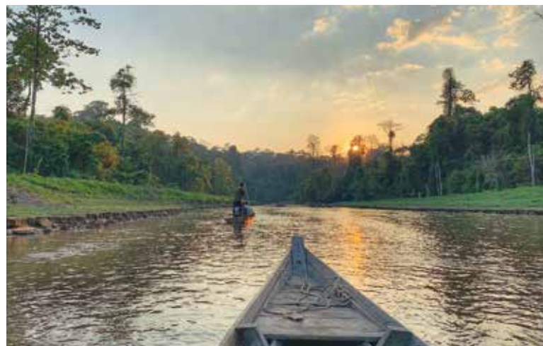
檳州供水机构指出，玻璃市、吉打和檳城高度依赖乌鲁慕达作为区域集水区。

*为了在法律上、现实中和永久性地永续保护乌鲁慕达，联邦政府必须以公平的方式补偿吉打。