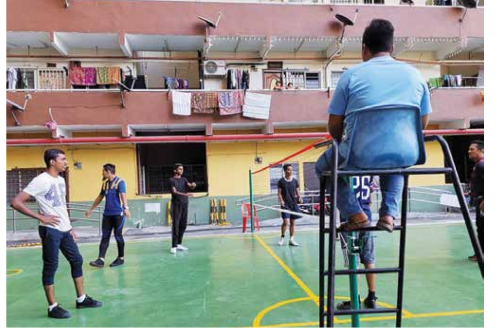
இளைஞர்கள் மேம்படுத்தப்பட்ட சேப்பாக் தக்ரா அரங்கத்தில் விளையாடத் தொடங்கினர்.

மேலும், ஜாலான் சுங்கை பிபிகே வாகனம் நிறுத்தும் இடத்தில் சாயம் பூசுவதற்கும் சீரமைப்பணி மேற்கொள்வதற்கும் சட்டமன்ற உறுப்பினர் லிம் சியூ கிம் நிதியுதவி கொடுத்தார்.