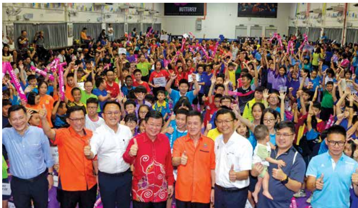
Chow (fourth from left) and other dignitaries present giving the thumbs-up while the participants show their excitement.

He also lauded the parents for encouraging their children