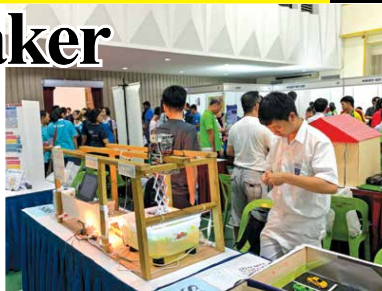
Students working on their projects to be displayed at the Maker Fair.

Besides visiting the booths set up by many different industry players like Intel, Mouser, SNS Network and Eclimo, and STEM-related associations like Penang Science Centre, Penang Math Platform,