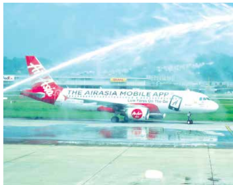
The Malacca-Penang AirAsia inaugural flight being greeted with a water cannon salute.

According to Yeoh, tourists who enjoy their stay here would always like to share their positive experiences on social media. This will generate further interest in Penang, especially in view of the country’s focus on Visit Malaysia 2020.