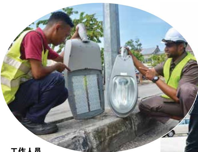
工作人员展示LED街灯(左)与旧有街灯的区别。

佳日星指出，槟岛地区更换LED街灯工程预计耗费4000万令吉，目前已经耗费1700万令吉；威省地区方面，则预计耗费3500万令吉，目前则已耗费300万令吉。