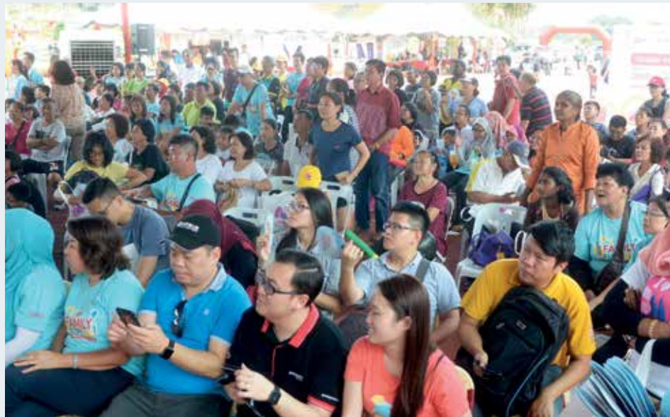
威省欢乐家庭日反应热烈，圆满举行。