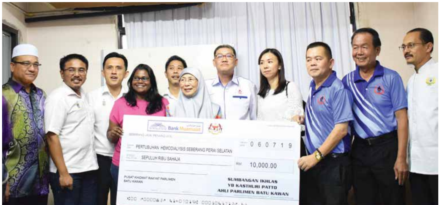
துணை பிரதமர் மற்றும் நாடாளுமன்ற உறுப்பினர் தென் செபராங் பிறை சிறுநீரக சுத்திகரிப்பு மைய நிர்வாகத்திடம் மாதிரி காசோலை எடுத்து வழங்கினர்.

"இதற்கு முன்பு சுத்திகரிப்பு மையத்தில் நிபுணர் இருப்பது அவசியம் இல்லை, இருப்பினும் தற்போது சில மையங்களில் விதிமுறைகளைப்