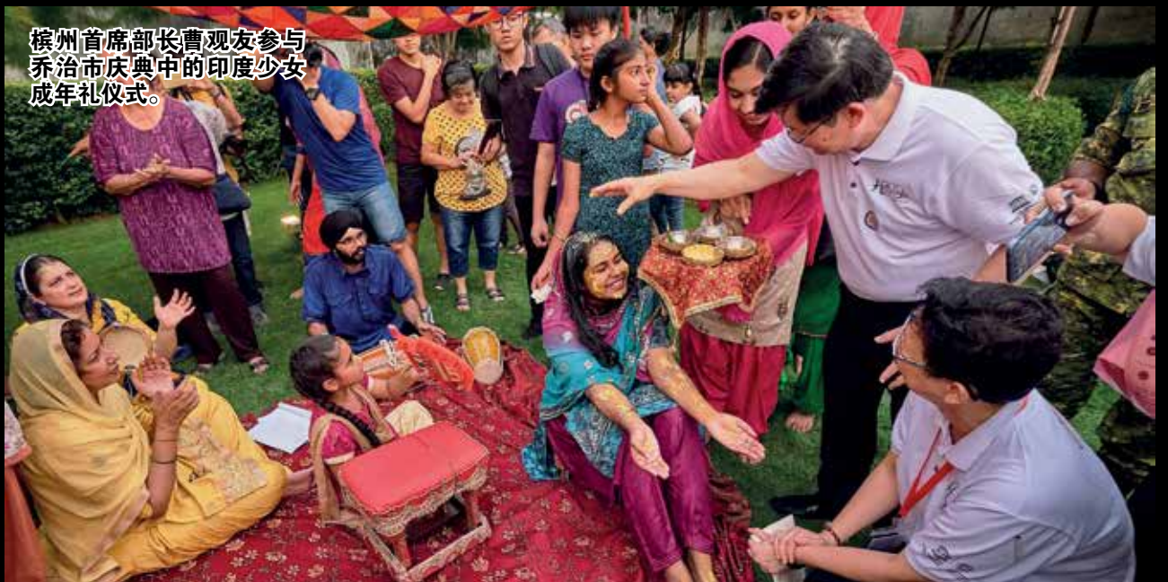
槟州首席部长曹观友参与乔治市庆典中的印度少女成年礼仪式。

此外，现场还有许多工作坊包括福建话教学，印度社群的彩绘艺术，欧亚裔族群的舞蹈等等，街头庆典从打石街、本头公巷、延伸至椰脚街等范围，让出席者玩得不亦乐乎。