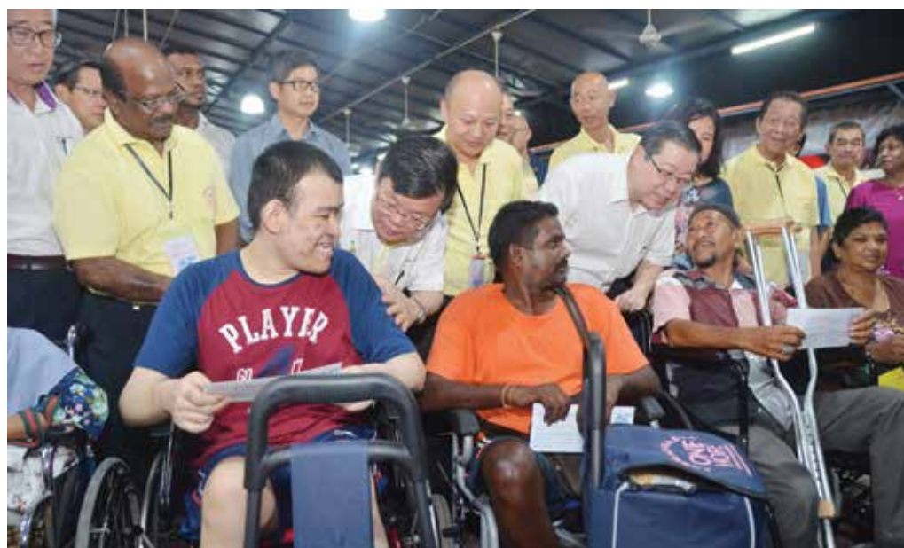
曹观友与林冠英在施赠贫户活动上与障友亲切交流。