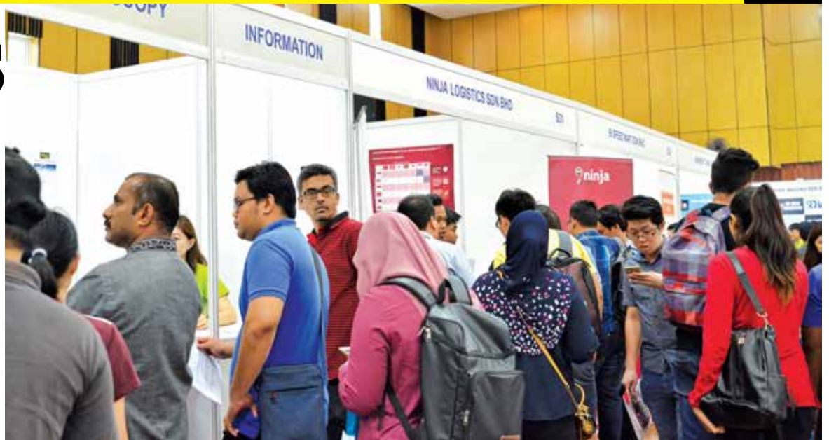
Job seekers visiting the Penang Career and Postgraduate Expo 2019, at SP Arena.