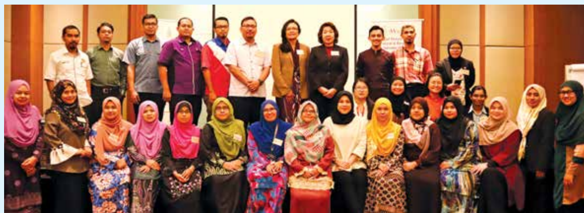
Group photo of the Gender Responsive and Participatory Budgeting Implementation Workshop.

The workshop has adopted a participatory and preparatory approach in line with the concept of GRPB, with inputs from respective departments and agencies. The workshop has recorded impressive participation whereby the turnout rate was more than 90% of invited