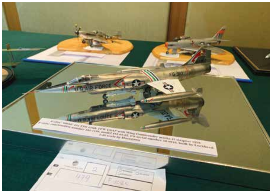
战斗机模型也在展览会里展出。