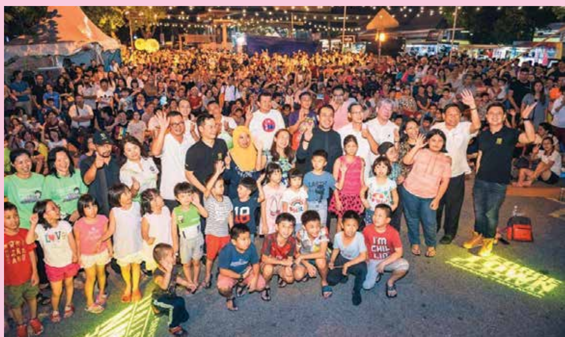
macam-macam Berapit 出席者开心大合照。

她也说，这项活动不仅有国际艺术家的精彩表演，更有本土文化参与，借着这个平台，本地艺术也能在大舞台上发光