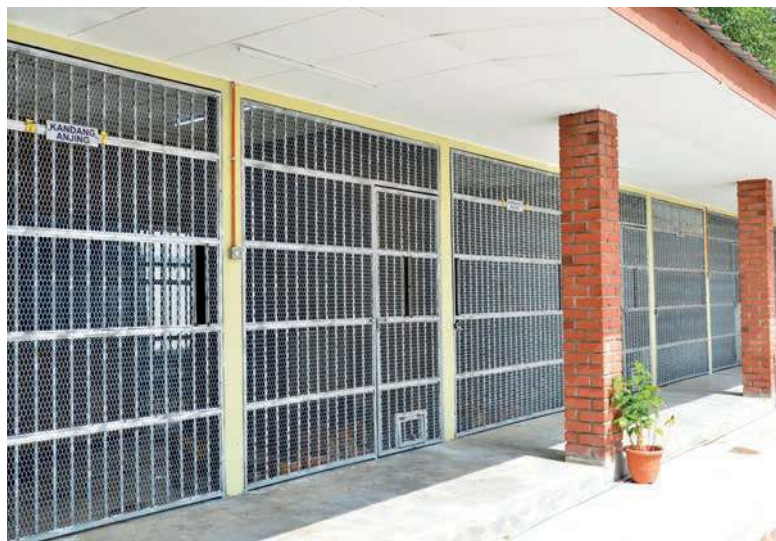
RUPA bentuk kurungan yang direka khas.

Berdasarkan matlamat tersebut, beliau menyatakan bahawa Paun Simpanan Haiwan telah dibina di atas tapak asal Kompleks Penjaja Taman Usahajaya pada 9 April 2018 dan siap sepenuhnya pada 27 Ogos 2018, dengan kos RM414,820.