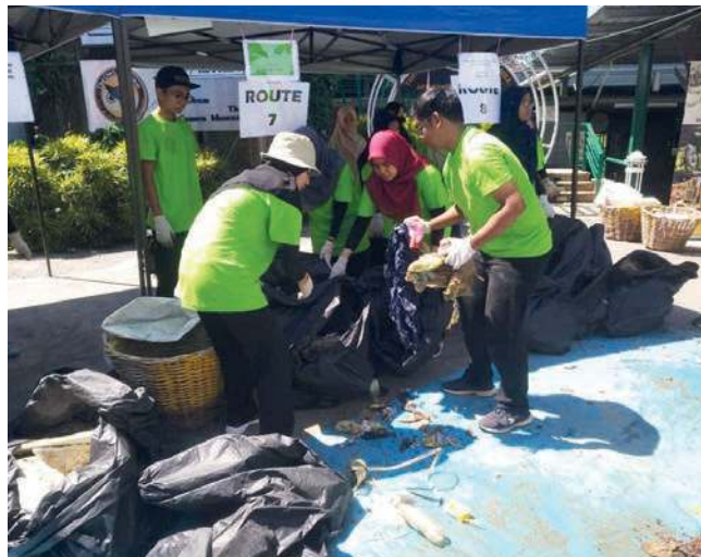
PARA sukarelawan mengasingkan sampah yang berjaya dikumpul.

"Sebagai rekod, penyertaan penganjuran tahun kedua ini adalah amat memberangsangkan kerana berjaya menarik lebih 1,000 sukarelawan berbanding jumlah 550 (sukarelawan) tahun lalu," ujarnya sambil memuji semangat semua