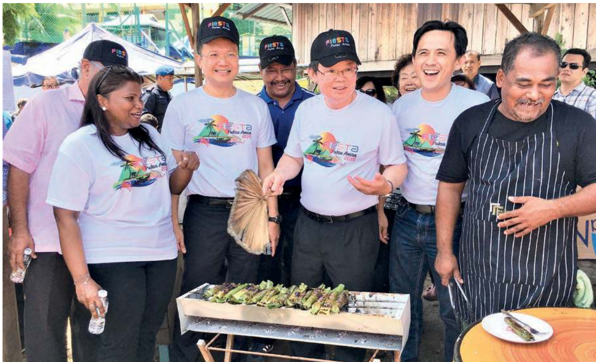
BARISAN kepimpinan Kerajaan Negeri dan penduduk setempat tercuat hati memerhatikan gelagat Ketua Menteri membakar pulut udang bersempena penganjuran Fiesta Pulau Aman di sini baru-baru ini.

“Oleh itu, sebuah mesin Economical Food Waste Composter (EFC) yang diusahakan oleh Majlis Bandaraya Seberang Perai (MBSP) dengan kerjasama USM telah ditempatkan di sini bagi memastikan kebersihan kawasan ini kekal terjaga,” jelasnya.