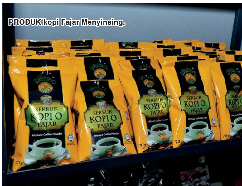
PRODUK kopi Fajar Menyinsing.

“Dengan bantuan ini dapatlah jimatkan perbelanjaan untuk membeli baja dalam tempoh setahun ini,” jelasnya.