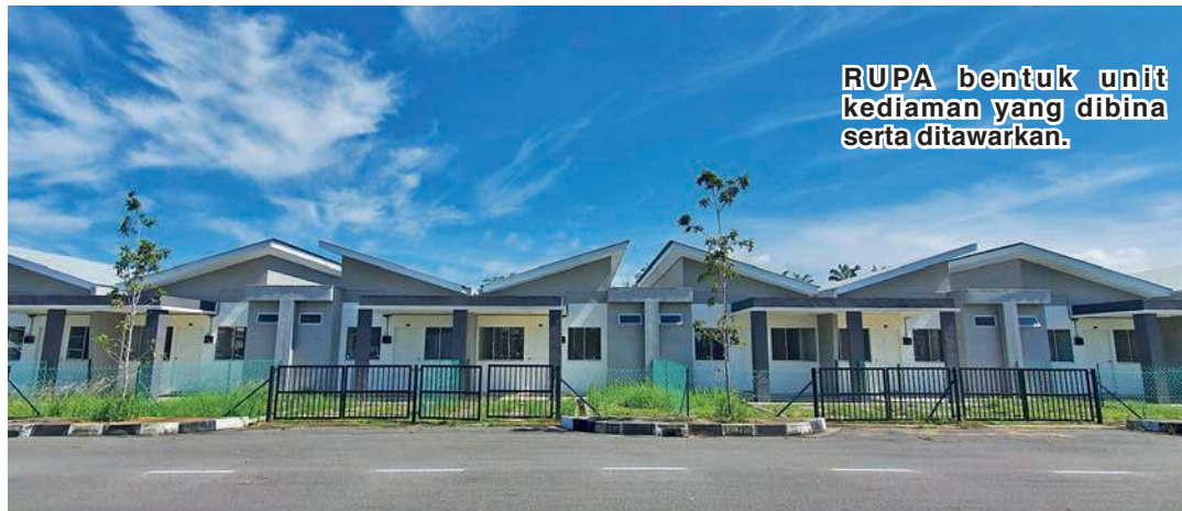
RUPA bentuk unit kediaman yang dibina serta ditawarkan.