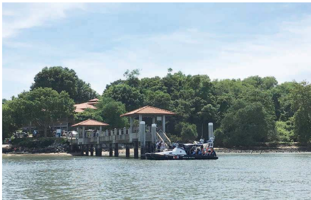
JETI Batu Musang yang menjadi perhentian bot-bot untuk ke Pulau Aman.