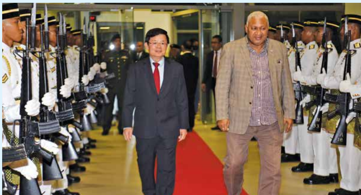
WELCOME TO PENANG... Fiji Prime Minister Josaia Voreqe Bainimarama being accompanied by Chief Minister Chow Kon Yeow as he inspects a guard-of-honour at the Penang International Airport upon his arrival on Oct 14 for the Asia Pacific Urban Forum (APUF-7).

For further info on #pinkforhope, visit Gurney Paragon Mall or Penang Adventist Hospital’s websites or Facebook pages.