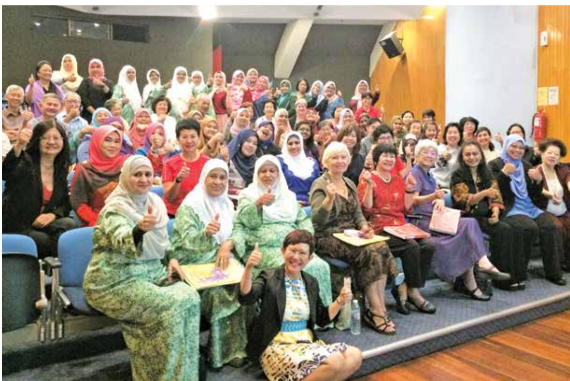
刚宣布的2020年财政预算案，让更多的女性受惠及拥有更多机会。

她也提及，马来西亚人才机构公司（Talent Corp）的研究还发现，对于欲重新投入劳动市场的93%女性，其中63%面对着重返工作岗位的种种阻碍。因此，她希望这些津贴措施能够促使雇主和雇员双方共同克