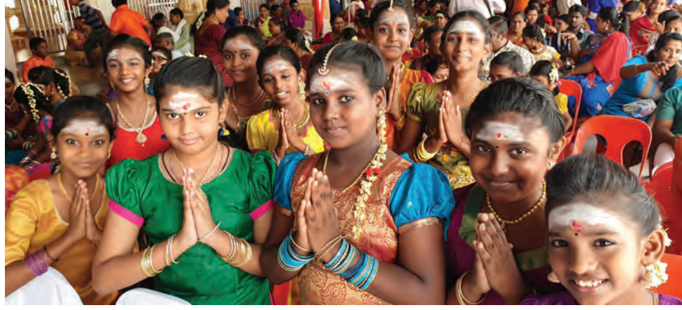
புக்கிட் பெண்டேரா வட்டாரப் பேரவையின் ஏற்பாட்டில் நடைபெற்ற திருமுறை ஓதும் போட்டியில் கலந்து கொண்ட மாணவர்கள்.

“இன்றைய இளைஞர்கள் நாளைய தலைவர்கள் என்பதற்கு இளைங்க இந்து சங்கம் போன்ற அரசு சாரா இயக்கங்களில் தலைமைத்துவப் பதவிகளில் இருக்கும் அனுபவமிக்க வயதில் முத்தோர்கள் இளைஞர்களுக்கு வழிவிட்டு ஆலோசகராகவும் உதவித் தலைவராகவும் இருந்து இளைஞர்கள் தொண்டு ஆற்ற துணைப்பரிய வேண்டும். இளைஞர்கள் இது போன்ற இயக்கங்களில் தலைமைத்துவம் பெற்று தீயச் செயல்களில் இருந்து விடுப்படுவதோடு சமூக நலத் தொண்டில் ஈடுபடுவர்.