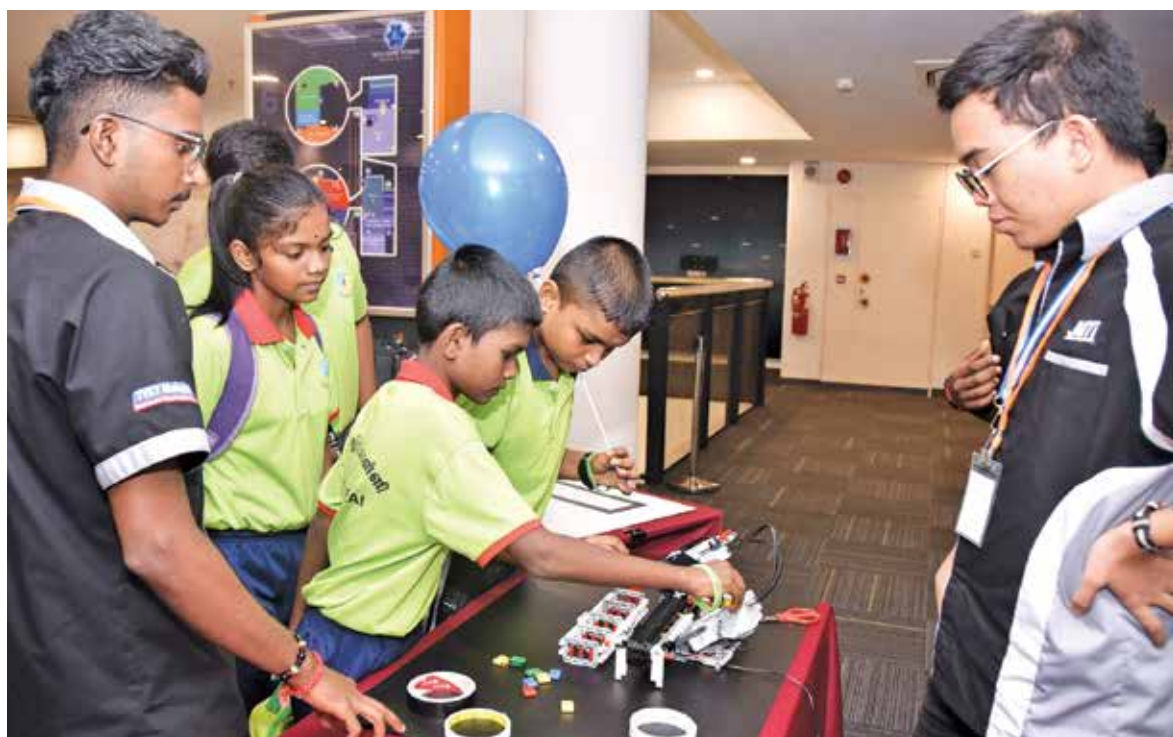
These students seem hooked on this activity at the event.

Chow also witnessed the dance presented by some of the home's children and then toured the stalls which sold a variety of food and delicacies.