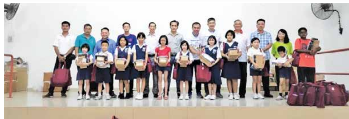
孙意志及热心商家赞助学生开学用品。

“没有什么能够贵得过以环境为代价, 如果说使用替代原料会导致成本上升, 那牺牲环境所付出的代价会更大。”