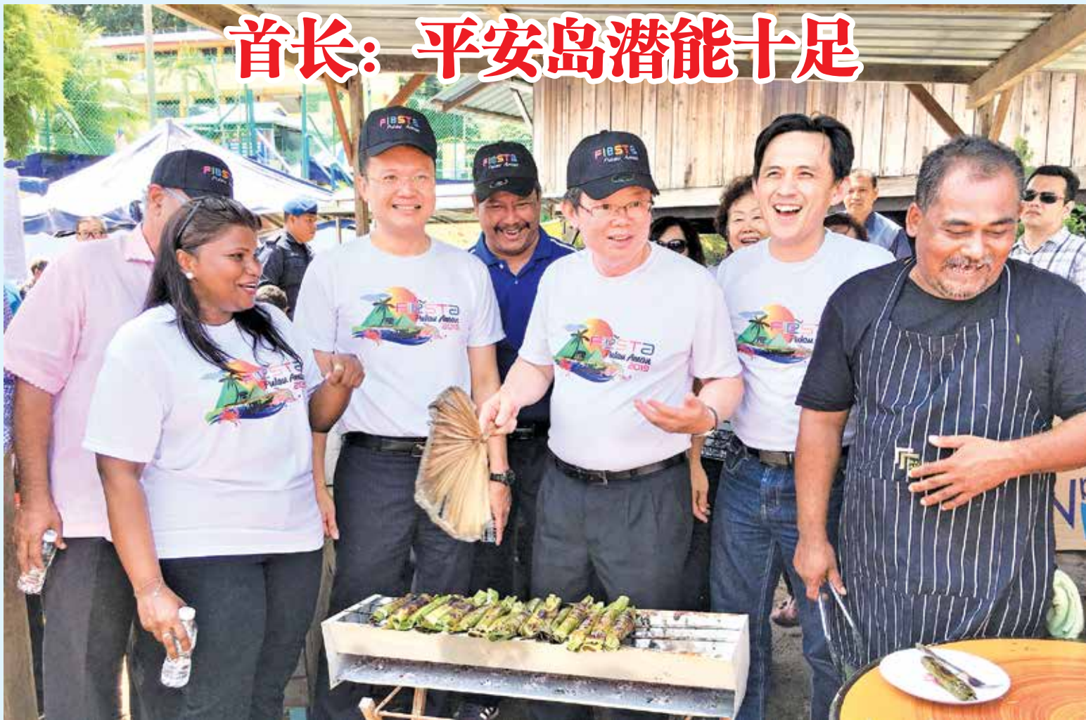
曹观友“客串”当糕点小贩，逗得杨顺兴、吴俊益、卡斯杜丽等人笑不拢嘴。

槟州首长曹观友指出，根据调查显示，旅槟人士平均在槟州停留4.86天，每一名旅客在旅游期间平均花费934令吉88仙，他希望能够在这基础上，更好地发展州内的旅游业。