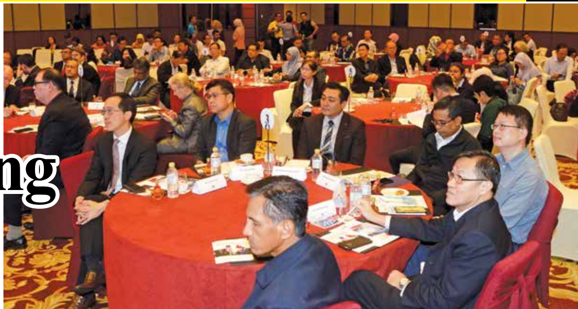
Some of the participants of the Penang Transport Forum 2019: Unlocking Mobility in Penang Through Rail at St Giles Wembley Hotel in George Town.

Chow said that the state plays a catalytic role in facilitating projects, while the private sector collaborates, operates, and bring in more tourists to Penang.