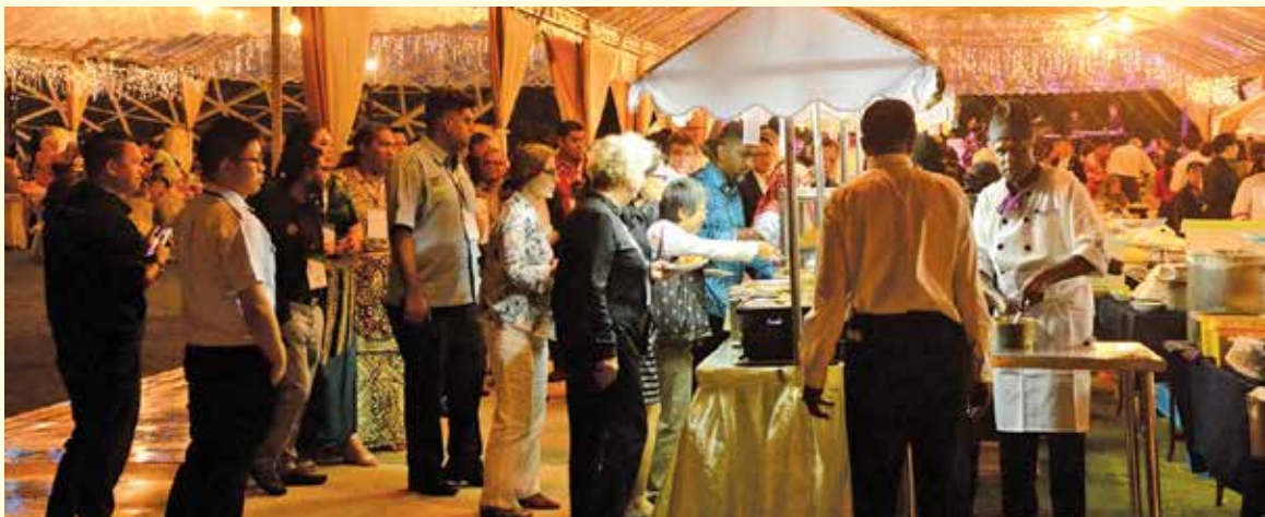
各国代表在欢迎宴上品尝享誉全球的槟城美食。

出席者有斐济总理巴依尼马拉马、房屋及地方政府部长祖莱达，以及联合国人居署执行总监拿督斯里麦慕娜等。