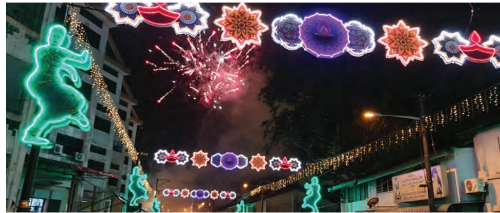
எழில்மிகு வண்ண விளக்குகளால் அலங்கரிக்கப்பட்ட ஜாலான் ஜெத்தி லாமா சாலை