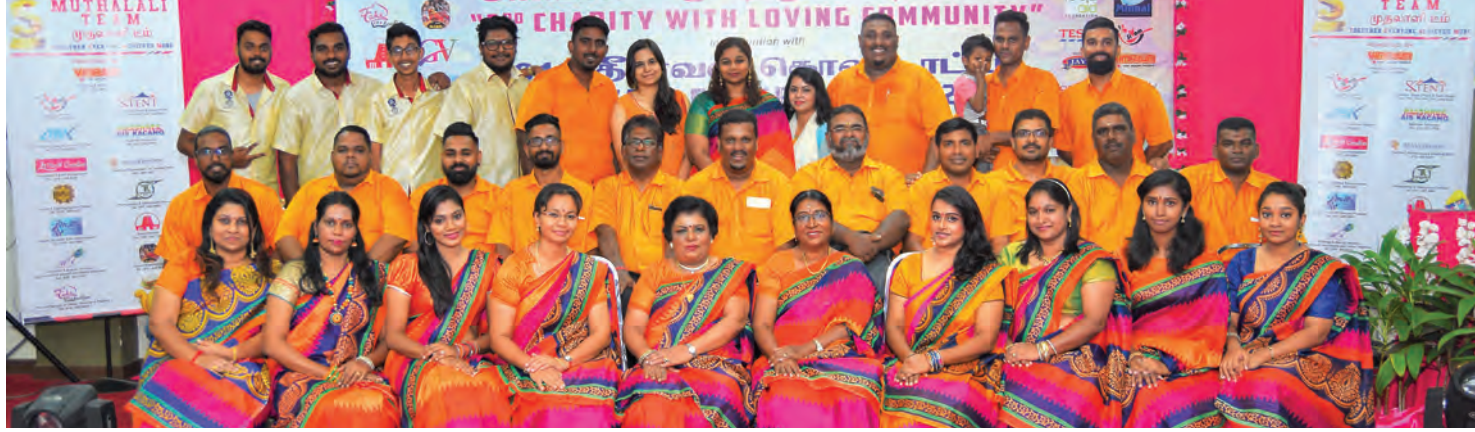
மலேசிய இந்து சங்கம் புக்கிட் பெண்டேரா வட்டாரம் செயலவை உறுப்பினர்கள்

இவ்வட்டாரத்தில் அமைந்திருக்கும் இராமகிருஷ்ணா தமிழ்ப்பள்ளியில் சமய வகுப்பு நடத்தப்படுகிறது. மாணவர்களிடையே தேசப்பற்றை ஊக்குவிக்கும்