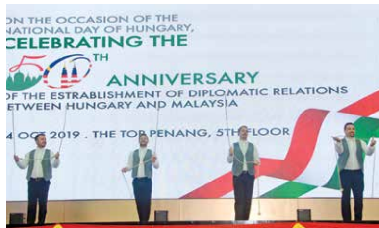
4 for Dance performing their synchronised and rhythmic Hungarian folk dance using ropes.

“I visited Hungary last month to seek a collaboration with the Hungarian government where I met a few of their government agencies. We had a fruitful meeting which helped to enhance the coop-