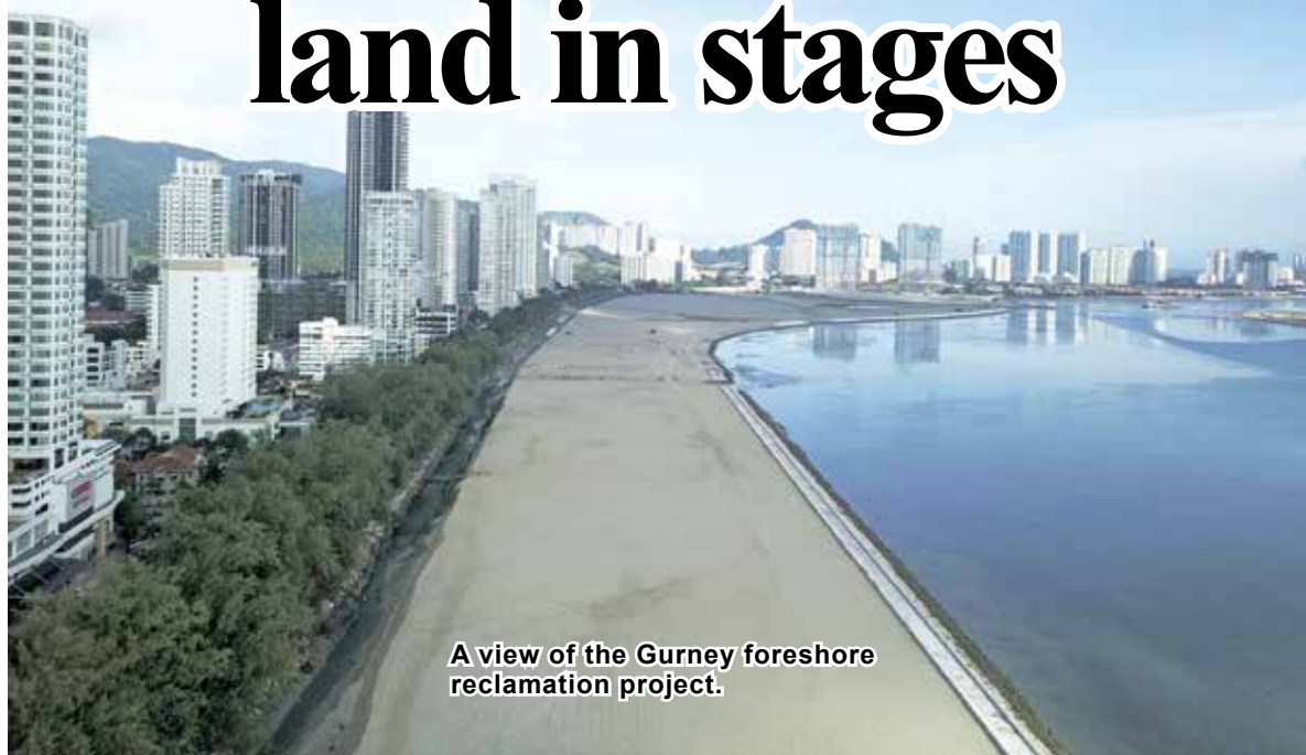
A view of the Gurney foreshore reclamation project.