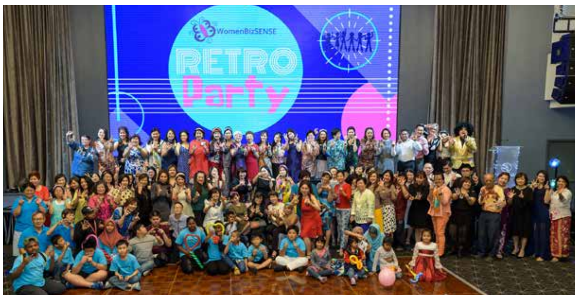
The attendees in a group picture with all the dignitaries present.

the nation’s population; hence, we hold equal responsibility in contributing towards Malay-