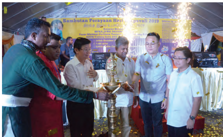
தீபத் திருநாள் கொண்டாட்டத்தை முன்னிட்டு மாநில முதல்வர் சாவ் கொன் யாவ் மற்றும் நிகழ்ச்சி ஏற்பாட்டாளர்கள் இணைந்து குத்து விளக்கு ஏற்றி சிறப்பித்தனர்.

ஜார்ச்டவுன் - மாநில முதல்வர் மேதகு சாவ் கொன் யாவ் பிணங்கு வாழ் மக்கள் அனைவரும் ஒன்றிணைந்து சில தரப்புகளால் எழுப்பப்படும் இன வாத அறிக்கைகளுக்கு எதிர்ப்பு தெரிவிக்க வேண்டும் என கேட்டுக்கொண்டார்.