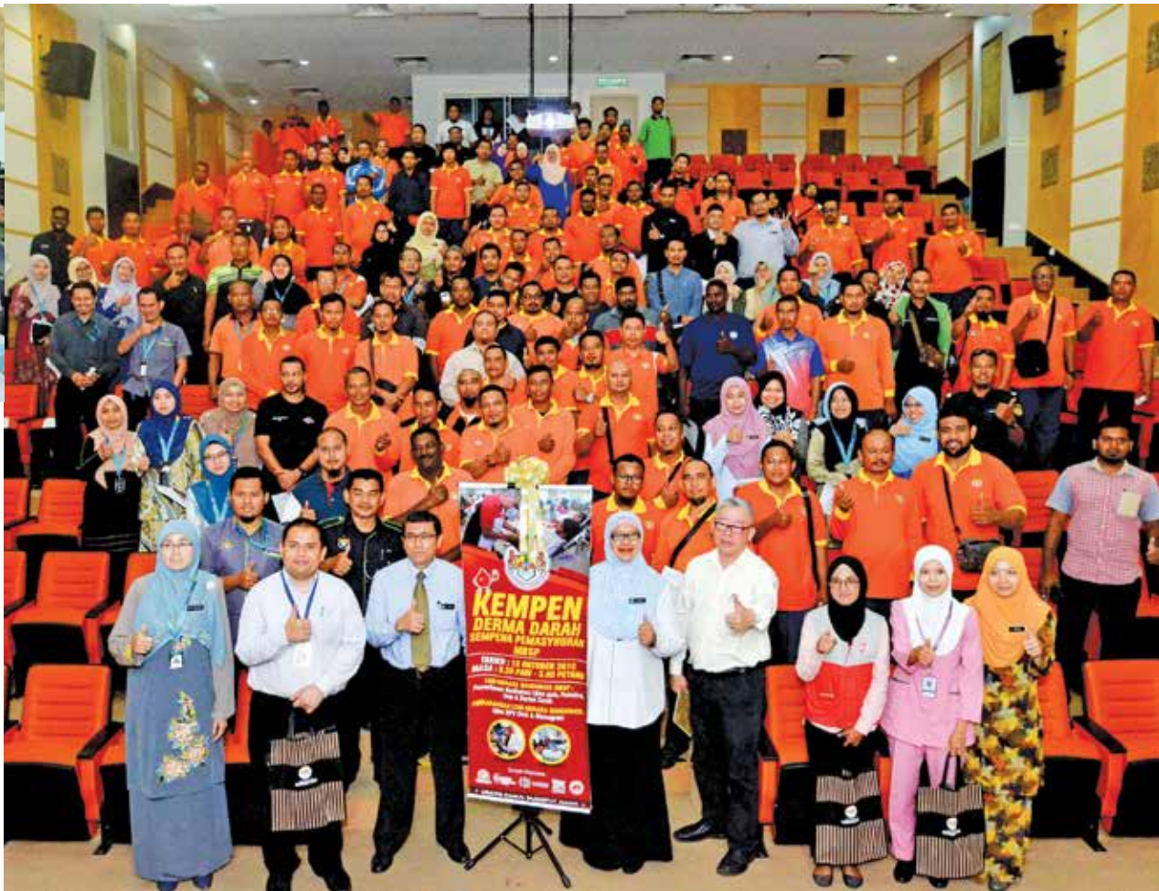
威省市厅捐血运动出席者大合照。