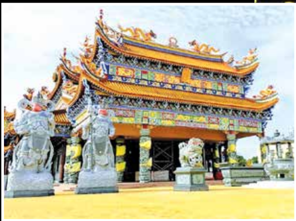
美轮美奂的北海新世观音亭斗母宫，成为北海标志性建筑物之一。

槟州首长曹观友赞扬九皇文化不仅鼓励善信向善向上，北海新世观音亭斗母宫更与时俱进，首度在九皇庆典中以花代香，致力于推动环保的努力让人赞赏。