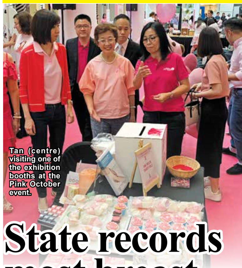
Tan (centre) visiting one of the exhibition booths at the Pink October event.