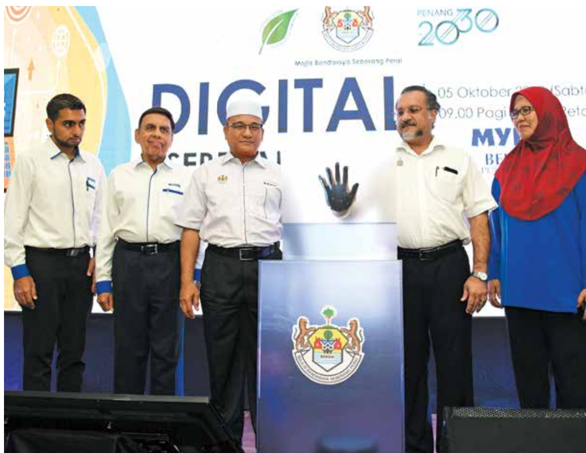
佳日星（右2起）和罗查里为威省市厅“网路柜台”（Cyber Counter）服务主持推介。

通讯与多媒体委员会早前宣布，我国8家通讯企业将于今年10月开始至明年3月，投资1亿1600万