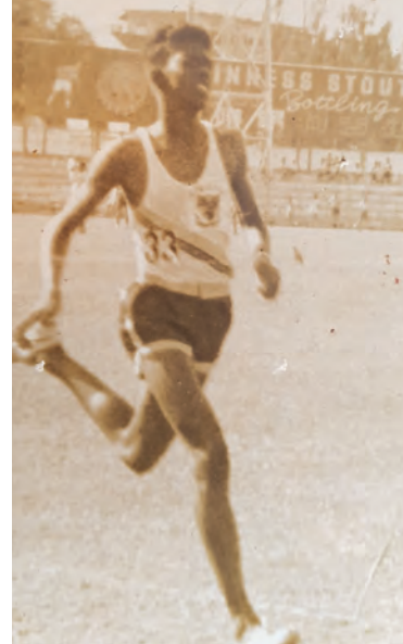
தொக்கியோ ஒலிம்பிக்கில் (1964) 200 மீட்டர் ஓட்டப்பந்தயப் போட்டியில் கலந்து கொண்டார்.