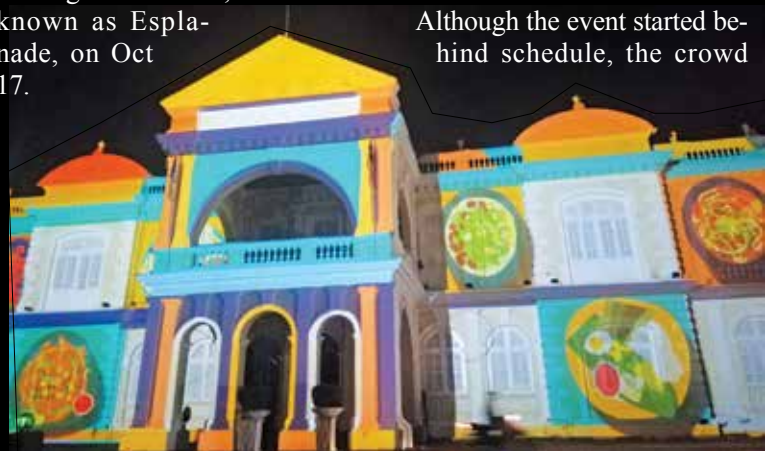
Penang’s authentic food being projected during the ‘building mapping’ show.

The APUF-7 was organised by the United Nations Economic and Social Commission for Asia and the Pacific (ESCAP) in partnership with Urbanice Malaysia and UN-Habitat.