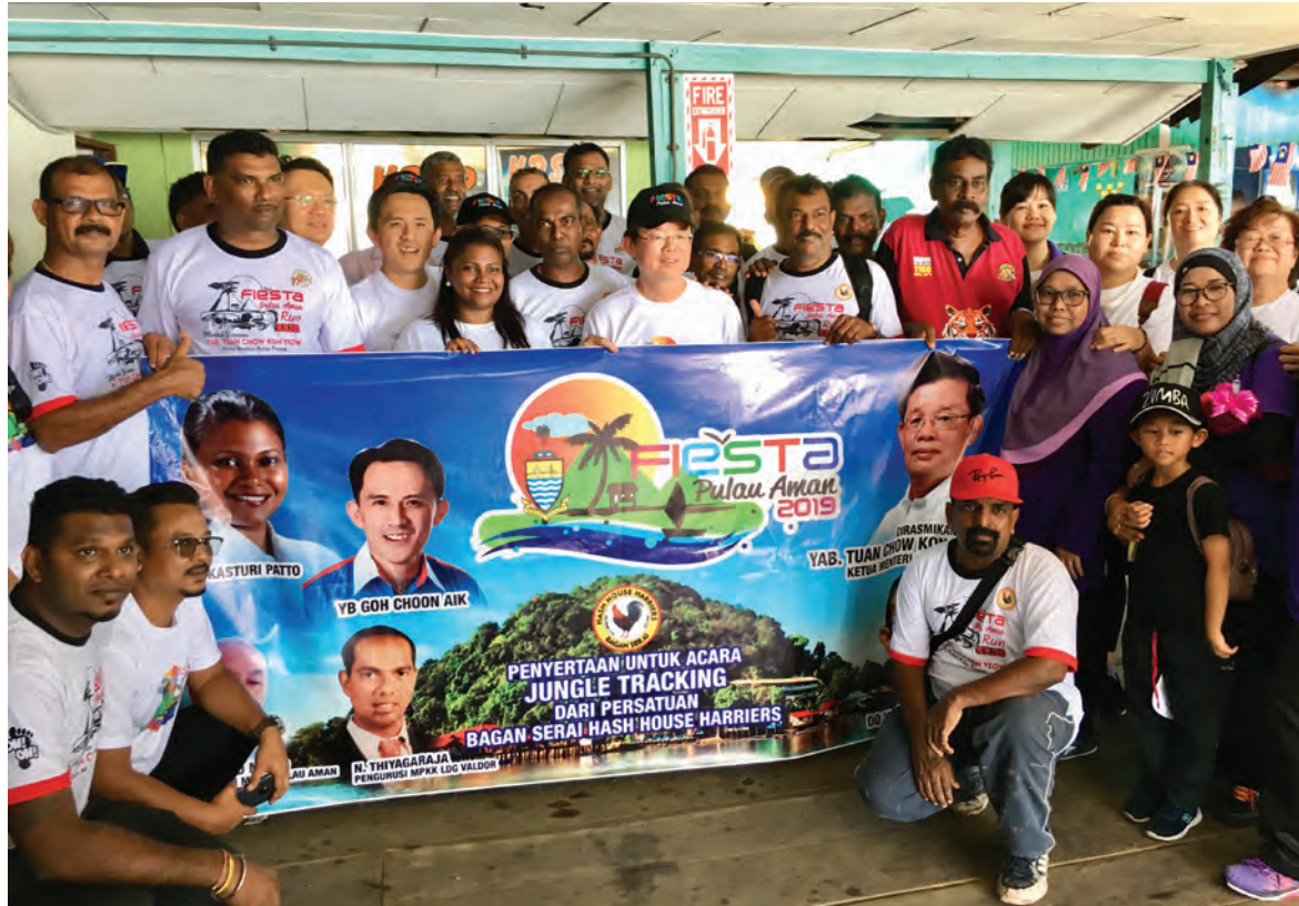
புலாவ் அமான் கொண்டாட்டத்தின் நிறைவு விழாவில் மாநில முதல்வர் மற்றும் அரசியல் தலைவர்கள் கலந்து கொண்டனர்.

இவ்விழாவில் கடல் மீட்பு நடவடிக்கைகள், மலை ஏறுதல், முகாம்(khemah), நாட்டுப்புற விளையாட்டு, அரசு நிறுவனங்களின் கண்காட்சிகள் என பல்வேறு