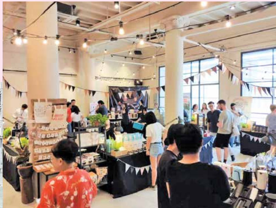
咖啡朗读节反应良好。

“这项活动为槟城咖啡工作者提供一个全新的平台，让他们的才华能被看到，同时也让国内外的咖啡爱好者，能体验槟城咖啡独特而多元的南洋风情。”