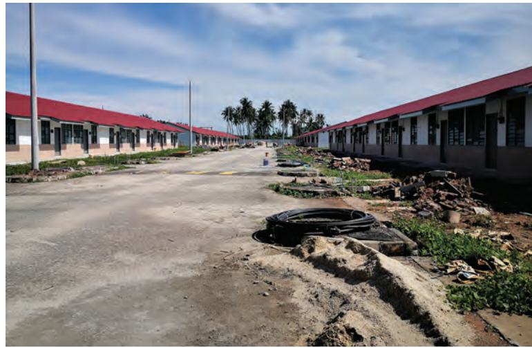
கைவிடப்பட்ட தாமான் ஸ்ரீ டேசா வீடமைப்புத் திட்டம்

இந்த வீடமைப்புத் திட்டம் வருகின்ற நவம்பர் மாதம் நிறைவுப்பெறும் என எதிர்பார்க்கப்படுகிறது. 249 வீடுகள் கொண்ட இத்திட்டத்தில் 64 வீடுகள் வாடகைக் கொள்முதல் மூலம் வழங்கப்படும்.