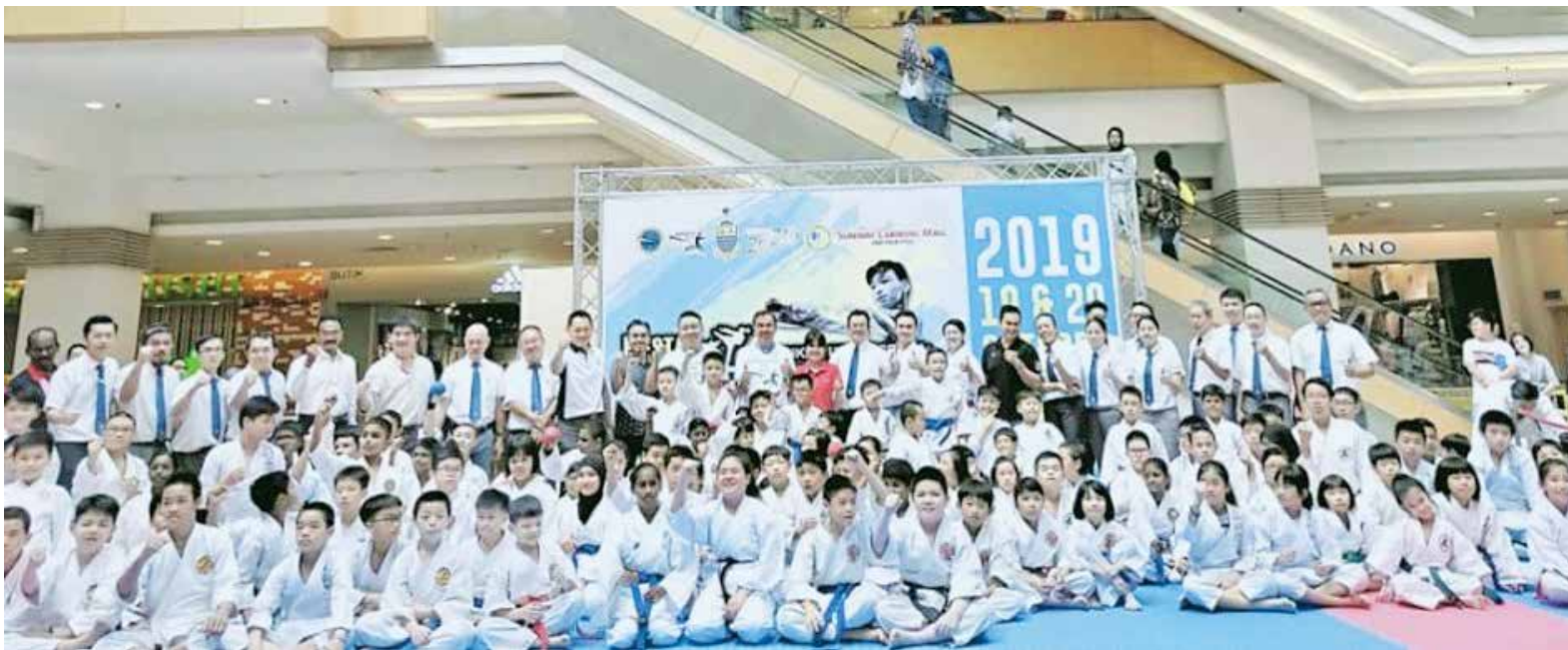
嘉宾们与全体参赛者大合照。

槟州青年及体育行政议员孙意志指出，运动发展必须从青苗培训着手，这样方能确保运动发展永续不断，培育出更多的杰出的运动员。