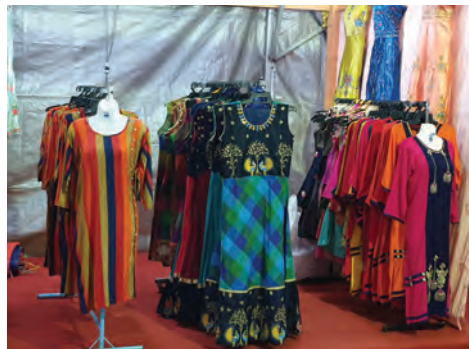
பட்டர்வொர்த் தீபாவளி சந்தையில் துணிமணிகள் மற்றும் பல்வகை பொருட்களும் மிக மலிவான விலையில் ஒருங்கே விற்கப்படுகின்றன.

அழகுச் சாதனப்பொருட்கள், பலகாரங்கள் என பல்வகை பொருட்களும் மிக மலிவான விலையில் ஒருங்கே விற்கப்படுகின்றன.