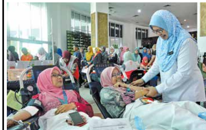
罗斯娜妮为捐血的姐妹们打气。