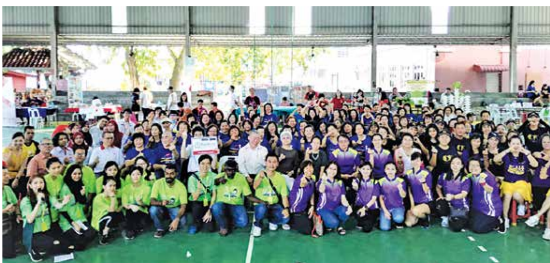
“长者凝聚家人的心”活动出席者大合照。

她认为，“长者凝聚家人的心”的趣味游戏不只拉近群众的距离，更可以打破年龄的隔阂，让年轻人也得以参与趣味游戏，并通过游戏让社会多了