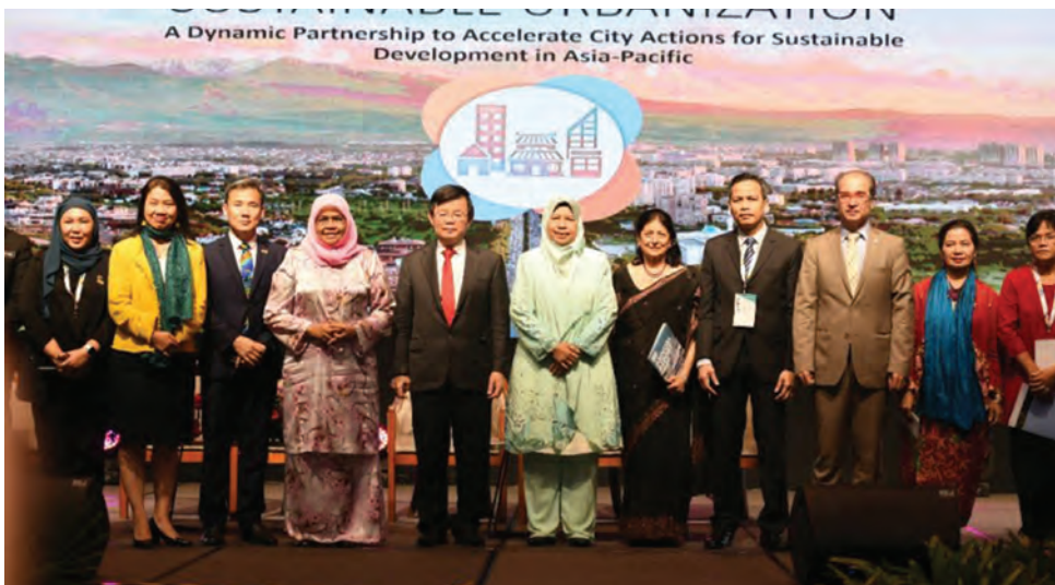
அக் 15 முதல் 17 வரை நாட்டில் முதன்முறையாக நடைபெற்ற ஏழாவது ஆசிய பசிபிக் நகர மன்றம் (APUF-7) நிறைவு விழாவில் அமைச்சர் சுராய்டா, முதல்வர் சாவ் கொன் யாவ் மற்றும் பிரமுகர்கள் கலந்து கொண்டனர்.