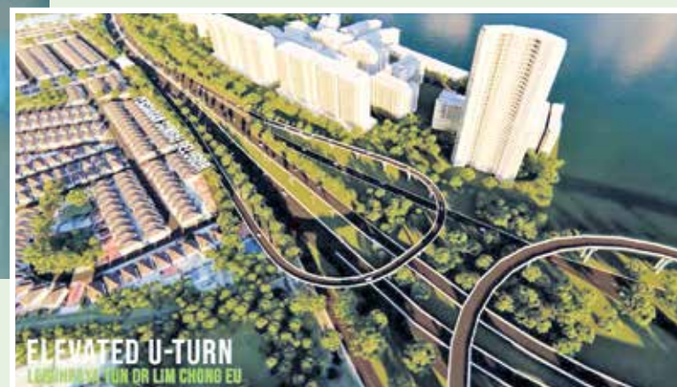
An artist's impression of the elevated U-turn in Tun Dr Lim Chong Eu Expressway.

Story by Christopher Tan