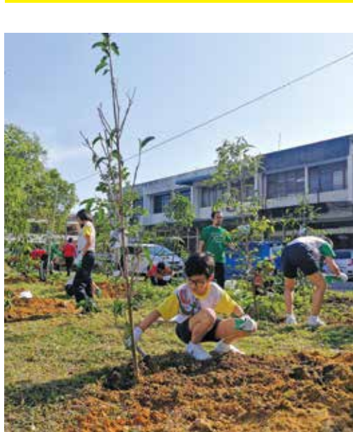
从小加强保护环境意识，长大后更会爱护环境。