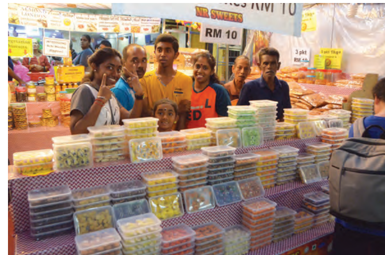
தீபத் திருநாள் கொண்டாட்டத்தை முன்னிட்டு லிட்டல் இந்தியா வளாகத்தில் பலகாரங்கள் விற்கப்படுகின்றது.

“எனவே, இன்றைய இளைஞர்களிடையே அதிகமான நிபுணத்துவமிக்க தொழிலாளர்களை உருவாக்குவதற்கு மாநில அரசு பல திட்டங்கள் மேற்கொண்டு வருகிறது,” என்று பாடாங் கோத்தா சட்டமன்ற உறுப்பினரும் தஞ்சோங் நாடாளுமன்ற உறுப்பினருமான சாவ் கொன் யாவ் கூறினார்.