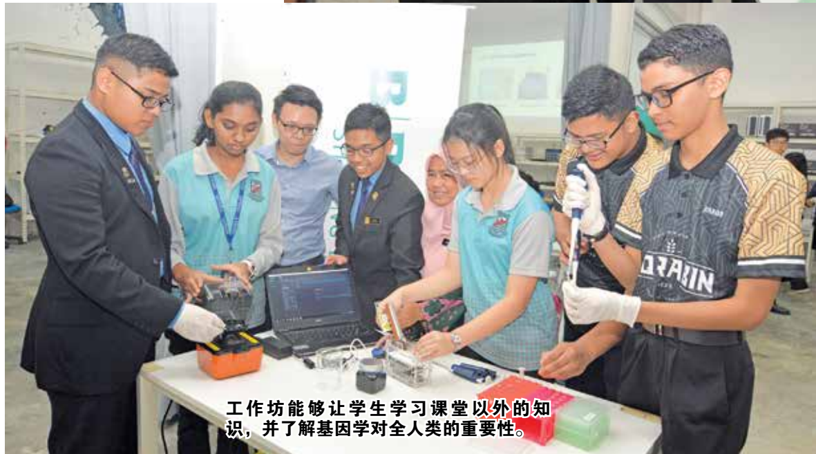
工作坊能够让学生学习课堂以外的知识，并了解基因学对全人类的重要性。