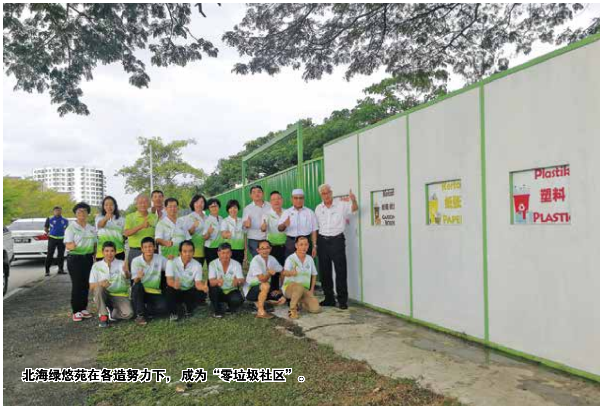
北海绿悠苑在各造努力下，成为“零垃圾社区”。