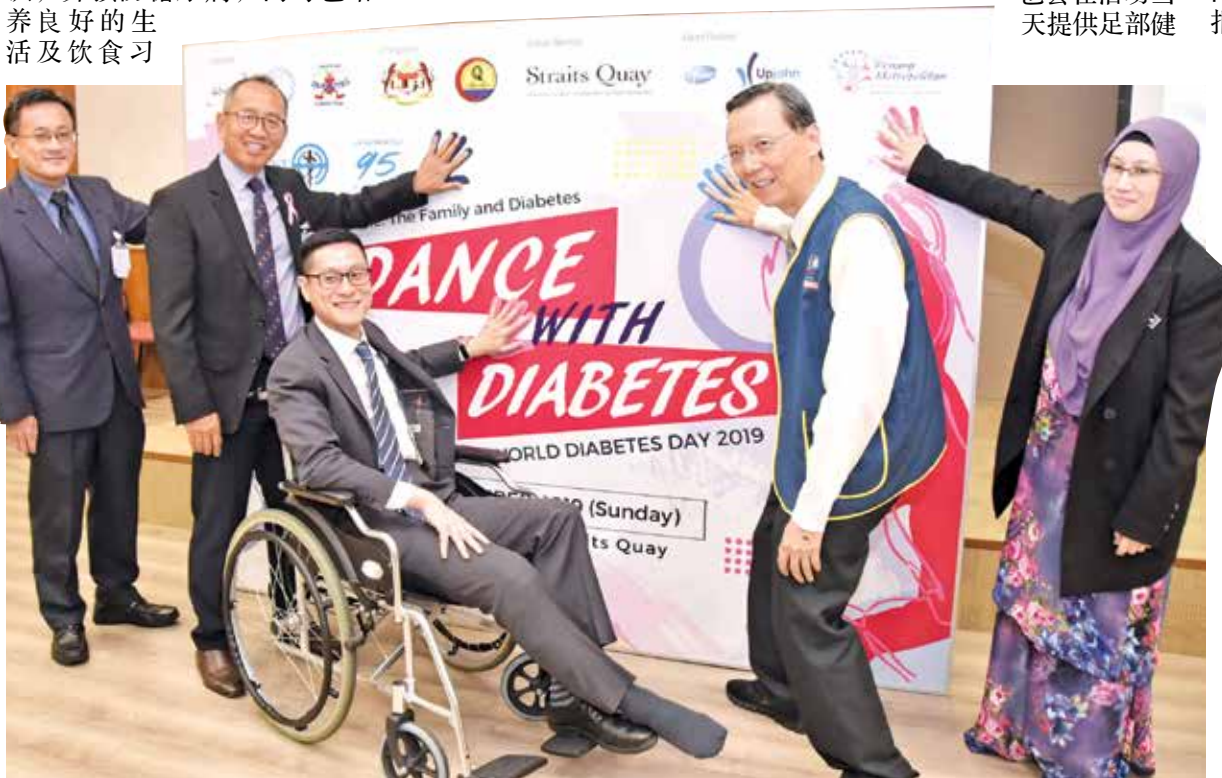
“与糖尿病共舞” 11月17日举行,再里尔等人欢迎民众参与。

最后，他不忘向“与糖尿病共舞”联办单位，檳州卫生局和马来西亚糖尿病协会檳城分会、地点赞助商，海峡岸广场以及活动合作伙伴Pfizer Upjohn和Leo Club of Penang Metropolitan致谢。