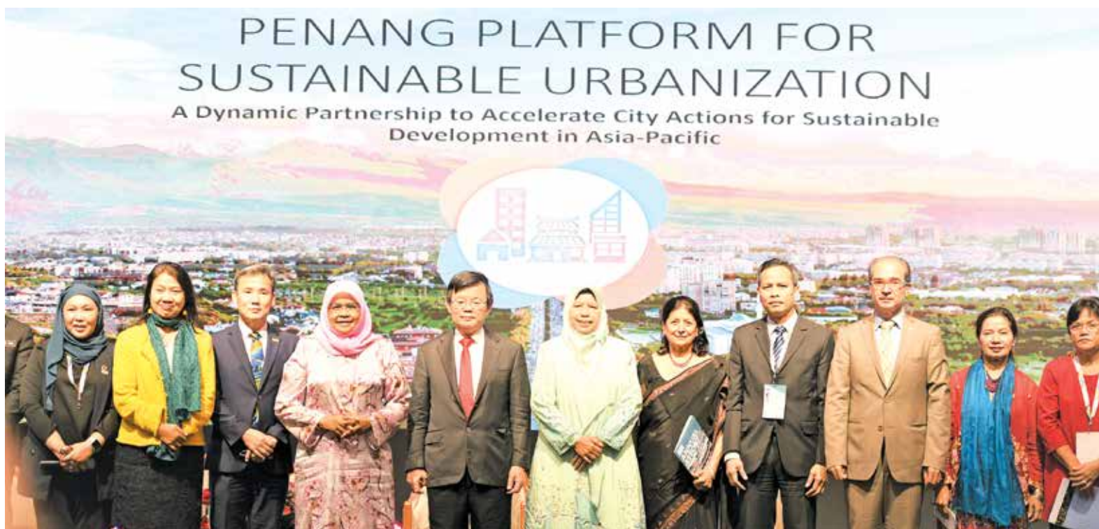
曹观友、祖莱达等嘉宾在亚太城市论坛闭幕礼上合影。