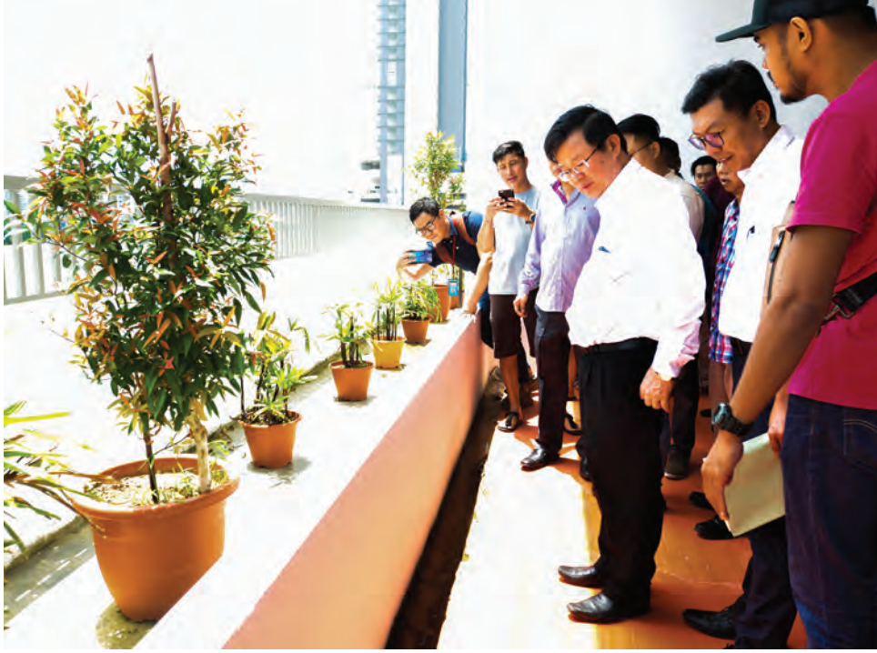
மாநில முதல்வர் மேதகு சாவ் கொன் யாவ் 'தி ராய்ஸ்' வீடமைப்புப் பகுதிக்கு நேரடியாகச் சென்று பார்வையிட்டார் (உடன் பி. டி. சி பிரதிநிதிகள், மாநில அரசு வீடமைப்புப் பிரிவு அதிகாரிகள்)

“எனவே, இந்த பொறுப்பை மேம்பாட்டாளர் நிறைவேற்ற வேண்டும், மேலும் திட்ட மேலாளரான பி.டி.சி மற்றும் மாநில வீடமைப்புப் பிரிவு மேம்பாட்டாளரால் பழுதுபார்க்க வேண்டிய பணிகளின்