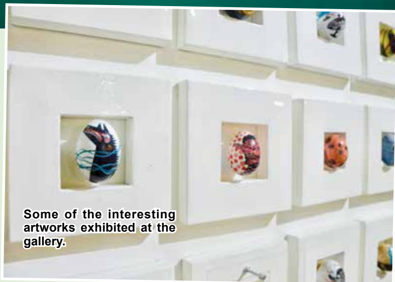
Some of the interesting artworks exhibited at the gallery.

The Penang State Art Gallery is open every day from 9am till 5pm except during public holidays.