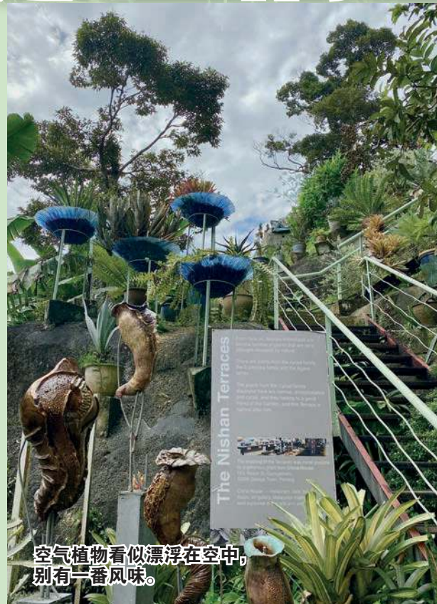
空气植物看似漂浮在空中，别有一番风味。

槟州旅游、创意经济委员会主席杨顺兴行政议员表示，Art and Garden 是州内少有的旅游景点，且拥有独特的旅游