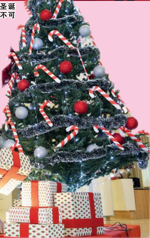
Ivory早在11月就开始筹备圣诞装置。