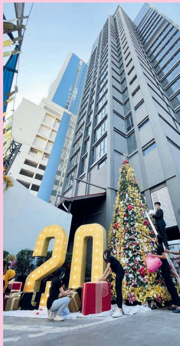
M Summit 欢庆20周年，在公司外布置环保圣诞树欢庆佳节。