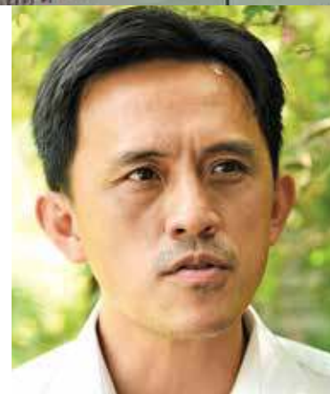
Goh says stingray breeders should be assisted.

does not know how to take care of it, then it can die within a year. The stingrays are very sensitive to the pH value and fresh water.