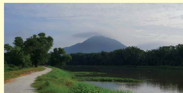
புக்கிட் மெர்தாஜாம், தாமான் ஸ்ரீ ரம்பாயில் இயற்கை அழகுடன் கூடிய 'டிராக் டேசா திதி பஞ்சாங்' எனும் நடைபாதை பொதுமக்களின் பயன்பாட்டிற்கு தொடங்கப்பட்டுள்ளது.