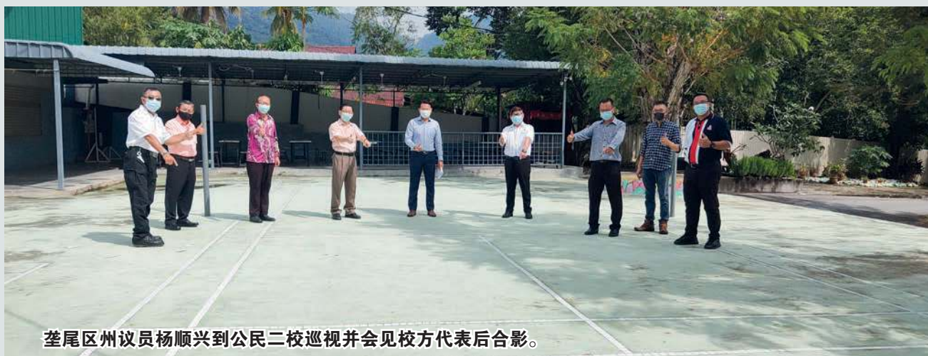
奎尾区州议员杨顺兴到公民二校巡视并会见校方代表后合影。

另外，杨顺兴也移交80份校服礼券给予该校来自清寒家庭的学生，及30套科学实验教育工具箱予校方，以帮助学生更好地理解课程，培养学生对于科学的兴趣。