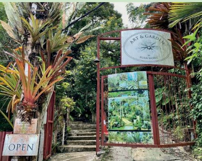
位于直落巴巷的 Art & Garden，其外观与其他旅游景点相比，显得特别低调，内里却有丰富的艺术宝藏。

他透露，为了平衡岛内的旅游发展，槟州政府未来也会多关注西南区的景点，比如浮罗山背等极具潜能的旅游景点，而不只是着重在乔治市的旅游景点。