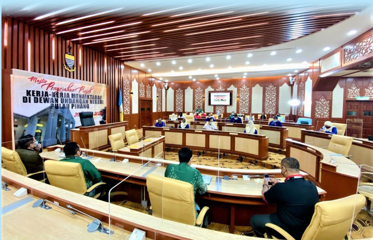
修复及提升后的议会厅，显得格格外明亮。