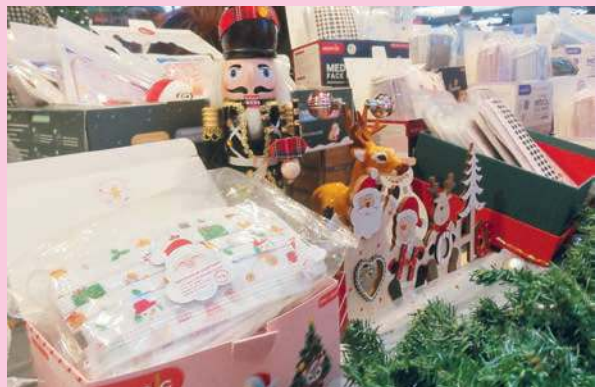
商家瞄准商机，推出的圣诞口罩受到热捧。