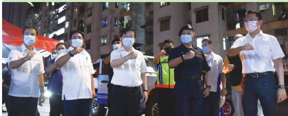
மாநில முதல்வர் மேதகு சாவ் கொன் யாவ் அமலாக்க அதிகாரிகளுடன் இணைந்து பி.கே.பி.டி இலக்கை அடைய உறுதிப்பாடு கொண்டனர்.

பாயா தெருபோங் - கடுமையாக்கப்பட்ட நடமாட்டக் கட்டுப்பாட்டு ஆணை (பி.கே.பி.டி) அமலாக்கத்தின் நோக்கத்தை அடைய அமலாக்க முகவர்கள் மற்றும் பொது மக்களிடையே ஒத்துழைப்பு நல்குவது அவசியம்.