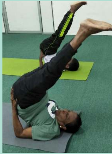
யோகா பயிற்சியில் பங்குபெறும் 80 வயது மூதாட்டி

ஒரே நேரத்தில் 10 பங்கேற்பாளர்கள் மட்டுமே ஸ்டூடியோவில் அனுமதிக்கப்படும் வேளையில், வெப்பநிலை பரிசோதனை, கை சுத்திகரிப்பு பயன்பாடு, பொதுவாக பயன்படுத்தப்படும் இடங்களை கிருமிநாசனி தெளித்தல் போன்ற