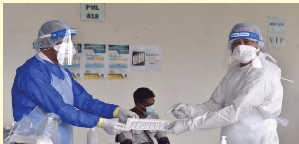
அண்மையில் பினாங்கு மாநிலத்தில் 6,100 அந்நிய தொழிலாளர்களுக்கு கோவிட்-19 திரையிடல் நடத்தப்பட்டது.