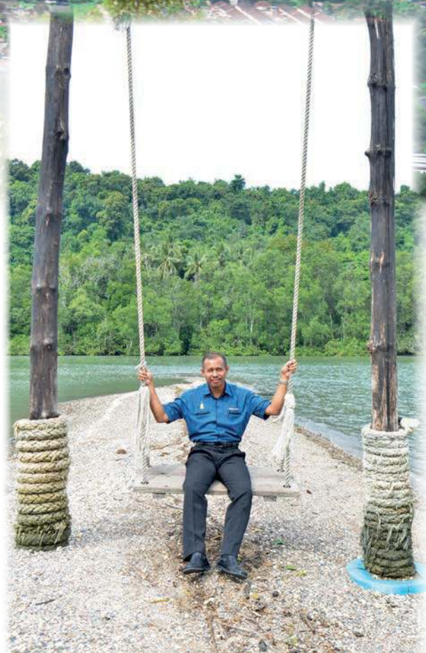
“梦幻秋千”是平安岛打卡热点。

“我已经申请了在一系列提升计划，如在岛屿的码头、太阳能充电站和协助渔民提升船只等。”