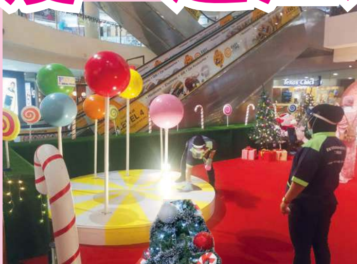
在疫情期间，圣诞装置的SOP必不可少。