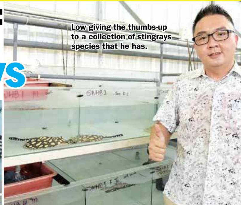
Low giving the thumbs-up to a collection of stingrays species that he has.

"The life span of a stingray is about 30 years but if the person