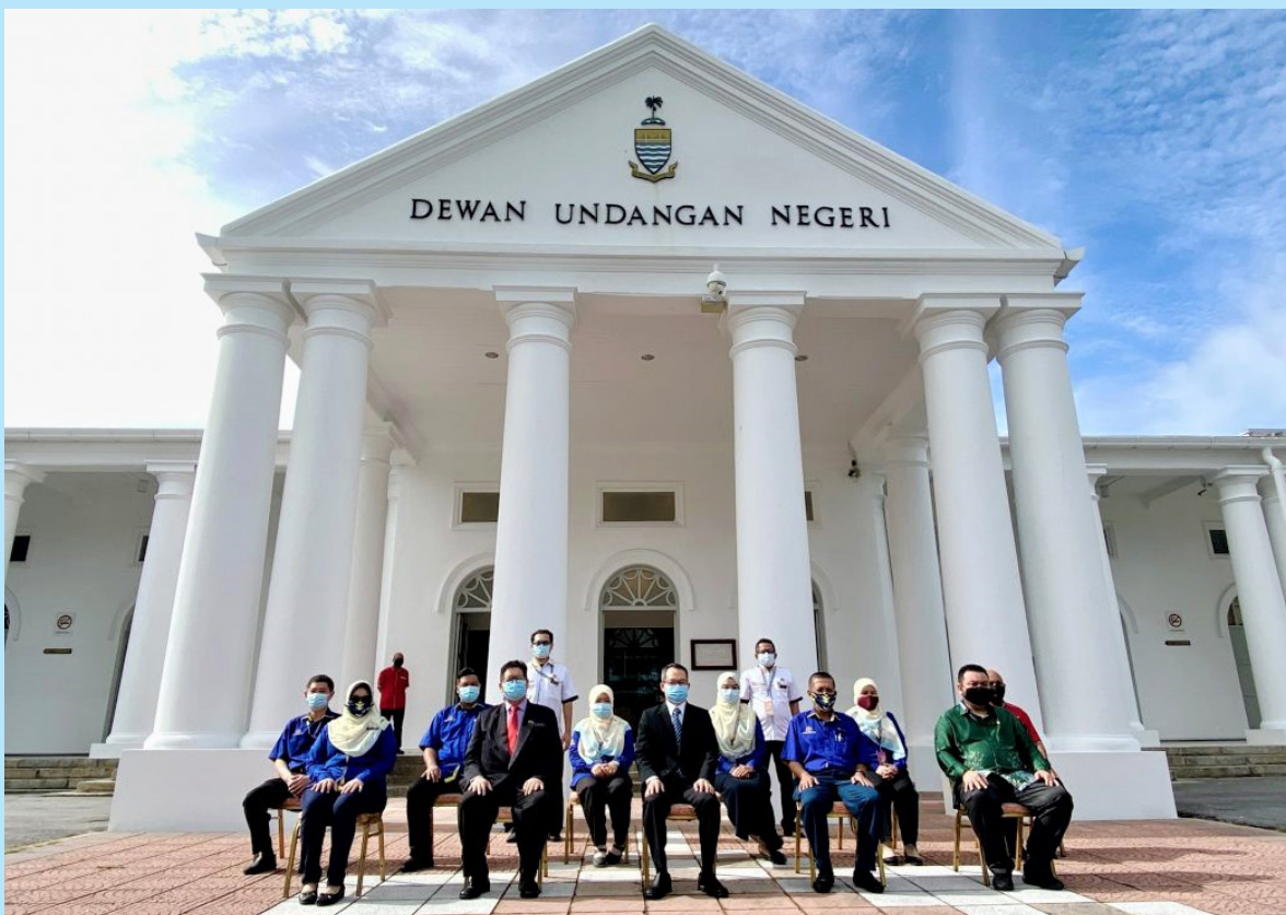
槟州议长拿督刘子健、槟州副州秘书阿末里扎、槟州公共工程局总监罗斯兰伊斯迈等人，在槟州议会大厦外合影。

他希望经过修复及提升后的议会大厦，能够带来全新的面貌，也冀望明年的州议会能够顺利在这大厦里进行。