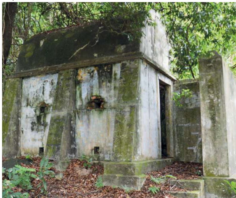
葛东岛上留有英治时期的弹头仓库。