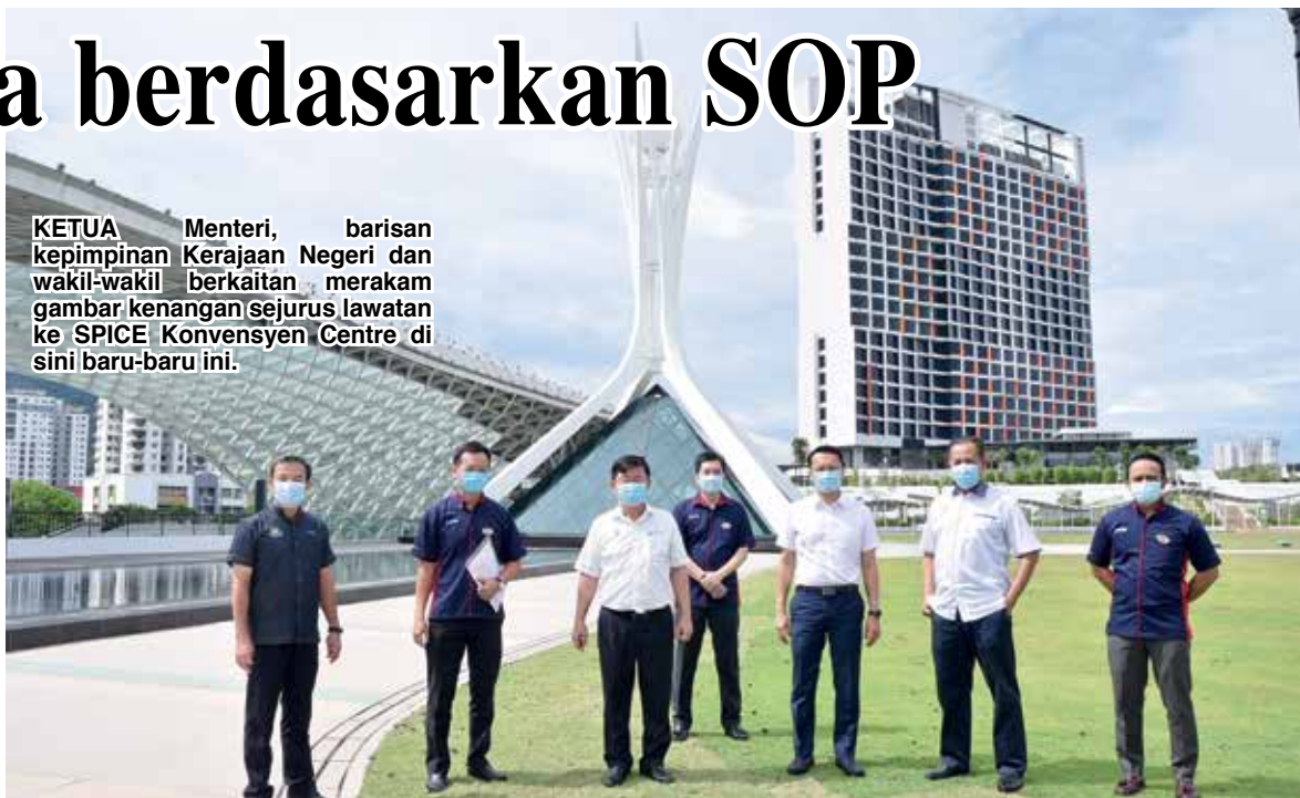
KETUA Menteri, barisan kepimpinan Kerajaan Negeri dan wakil-wakil berkaitan merakam gambar kenangan sejurus lawatan ke SPICE Konvensyen Centre di sini baru-baru ini.