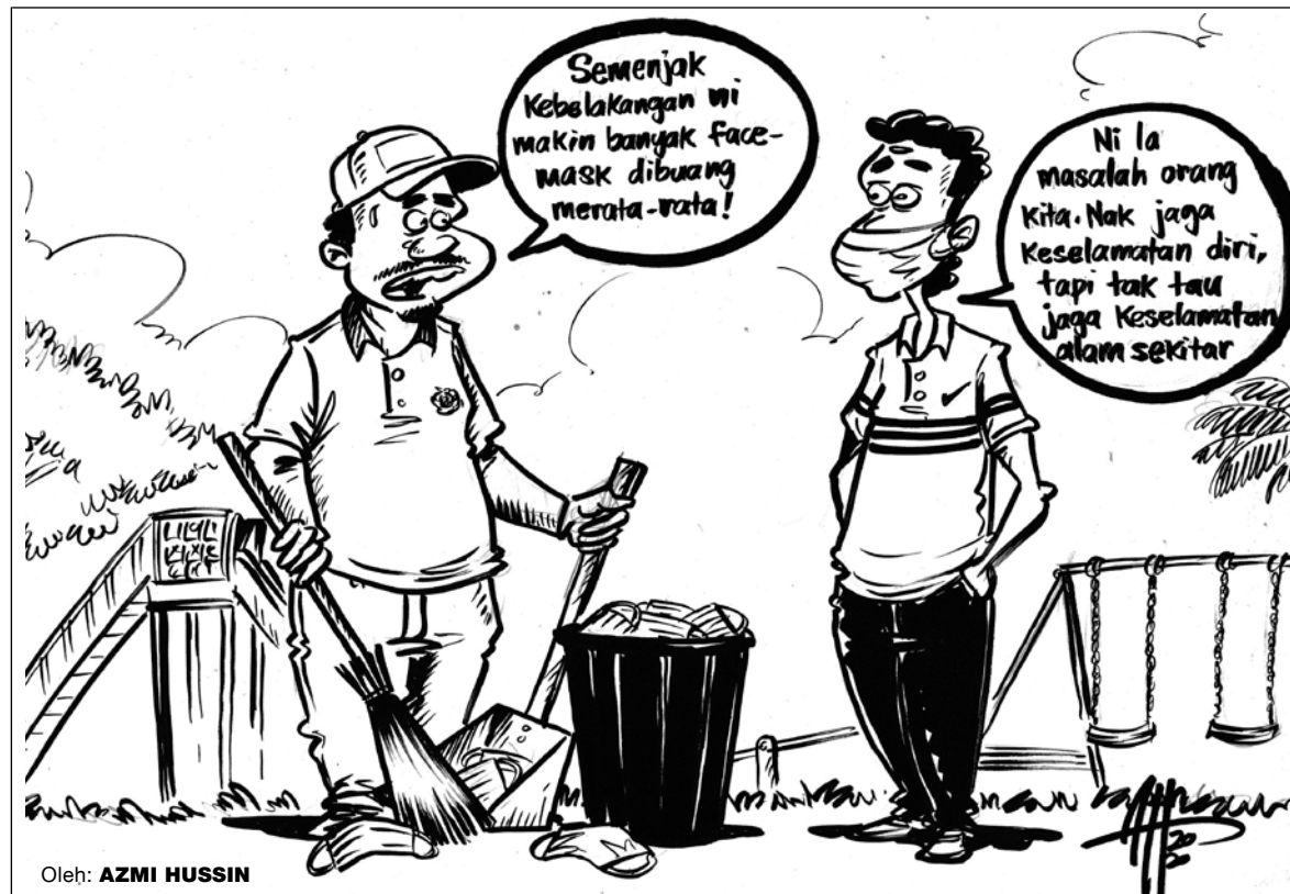
Oleh: AZMI HUSSIN