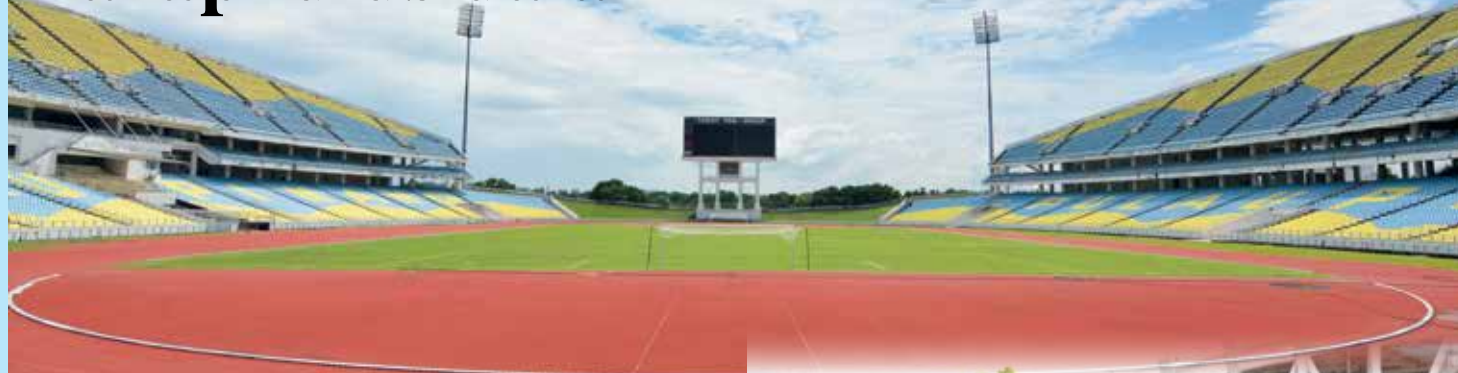
KEADAAN dalam Stadium Negeri Pulau Pinang, Batu Kawan kini.