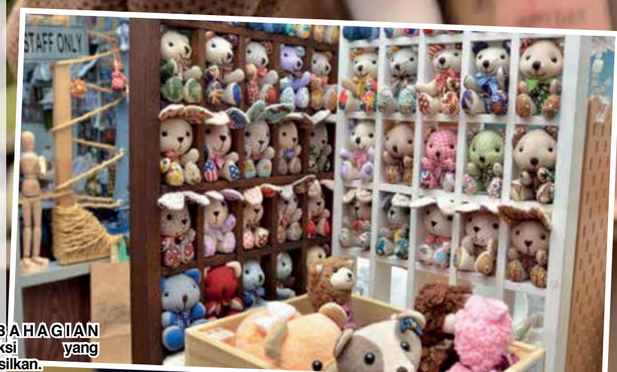
SEBAHAGIAN koleksi yang dihasilkan.

pameran patung beruang buatan tangan saya yang pertama dekat Batu Ferringhi dan diteruskan setiap tahun sehingga tahun 2016.