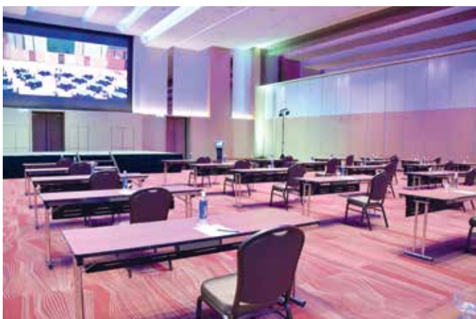
KEPATUHAN terhadap SOP ditetapkan di dewan-dewan persidangan.