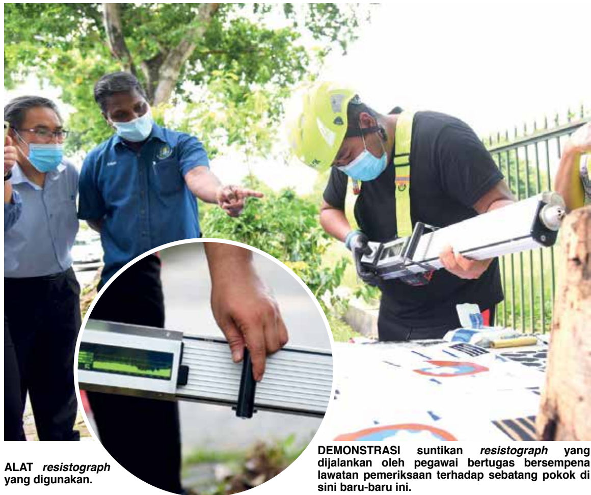
ALAT resistograph yang digunakan.

Dalam satu demonstrasi yang ditunjukkan, pihak kontraktor menyuntik jarum dari resistograph bagi mendapatkan bacaan kesihatan batang pokok tertentu dan daripada bacaan tersebut, langkah sewajarnya akan diambil dalam usaha pemuliharaan demi keselamatan awam.