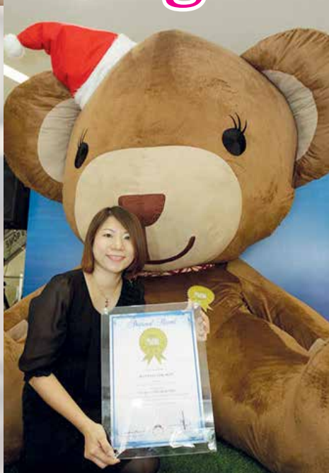
PATUNG beruang setinggi sembilan kaki yang diiktiraf MBOR pada tahun 2015.

Daripada sekadar hobi, Helen kemudiannya melangkah setapak lagi dengan