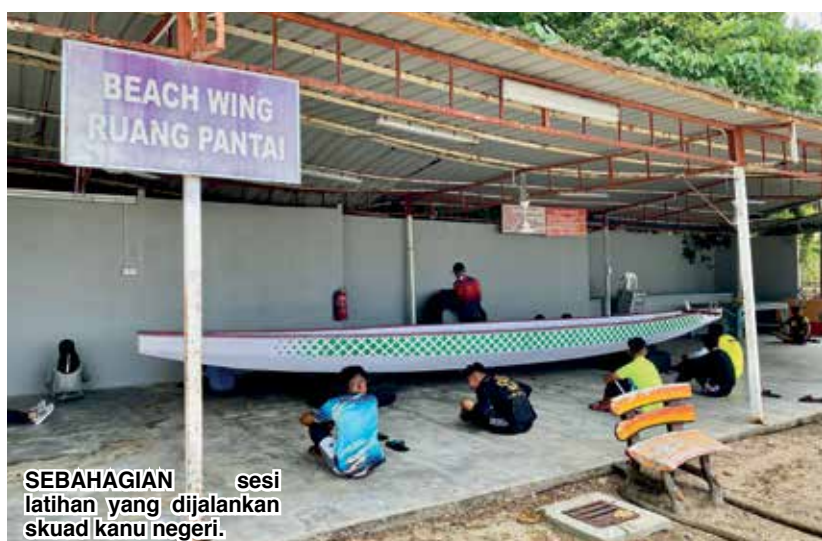
SEBAHAGIAN sesi latihan yang dijalankan skuad kanu negeri.