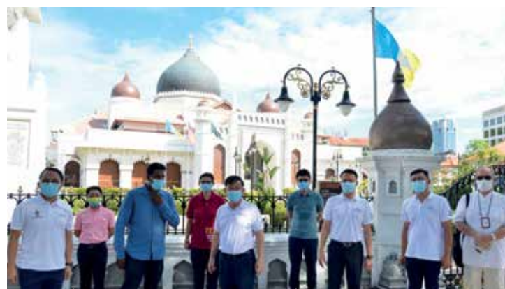
DELEGASI kepimpinan Kerajaan Negeri merakam gambar dengan berlatarbelakangkan Masjid Kapitan Keling pada sesi walkabout di sini baru-baru ini.

Pada lawatan sama, Kon Yeow bersama-sama rombongannya turut melawat operasi sektor-sektor lain berkaitan seperti pengayuh beca, premis makanan serta minuman, galeri dan kedai cenderahati yang turut menerima impak secara langsung kesan daripada penularan wabak