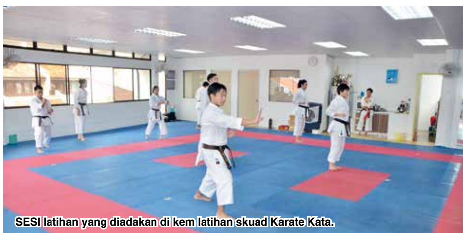
SESI latihan yang diadakan di kem latihan skuad Karate Kata.