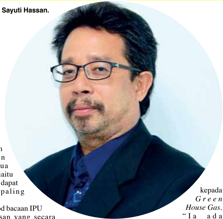
kepada Green House Gas. "Ia ada

P ELAKSANAAN Perintah Kawalan Pergerakan (PKP) susulan pandemik COVID-19 bukan sahaja membawa kepada kehidupan normal baharu kepada masyarakat dunia, tetapi turut memberikan 'nafas baharu' kepada alam sekitar dan iklim dunia ketika ini.