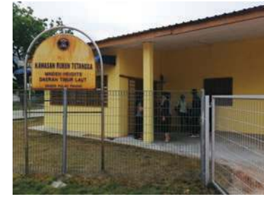
மிடன் ஹைட்ஸ் சமூக மண்டபம்