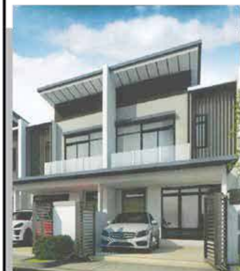
RUMAH TERES 2 TINGKAT Keluasan Rumah: 20 x 45 kps Keluasan Tanah: 1786 kps

Hakmilik Kekal 5% Diskaun untuk Bumiputera