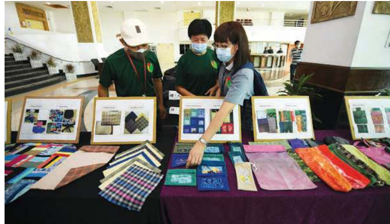
மீதமுள்ள துணிகளில் இருந்து தயாரிக்கப்பட்ட கைவினைப் பொருட்கள்

பேரங்காடியிலும் மாதத்தின் மூன்றாவது ஞாயிற்றுக்கிழமையில் இந்த கைவினைப் பொருட்களை விற்க அனுமதி வழங்கப்பட்டுள்ளது என மேயர் செய்தியாளர் சந்திப்பில் அறிவித்தார்.