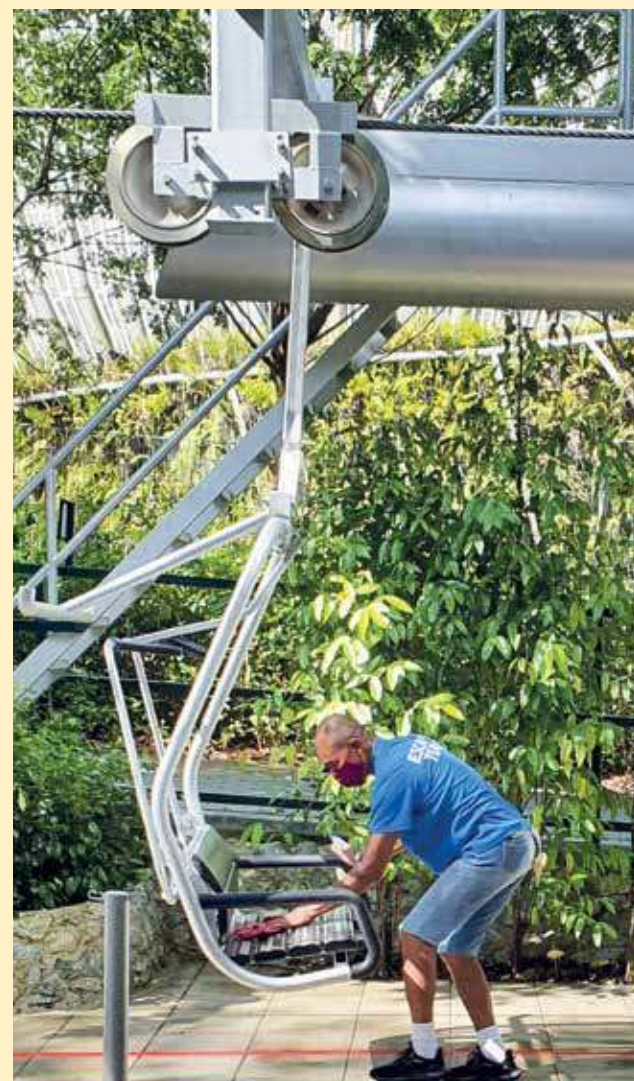
工作人员将会定时为园内的设施进行消毒，确保访客的安全。

他说：“据该生态公园管理层汇报，控制访客人数也是该园区其中的标准作业程序，以确保遵守保持安全社交距离防疫指南。”