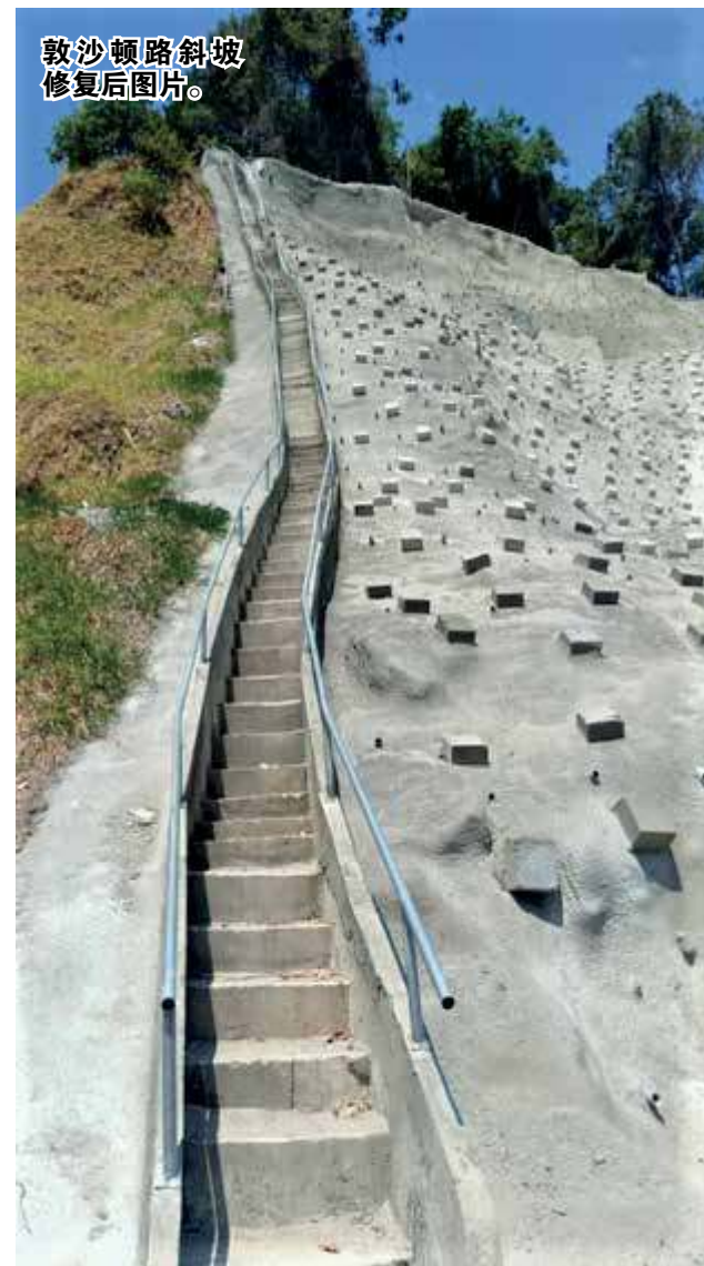
敦沙顿路斜坡 修复后图片。

这项斜坡修复计划，体现出对槟州政府人民的关怀，及时关注槟州基设发展，给槟州人与浮罗山背一带居民带来更多便利。