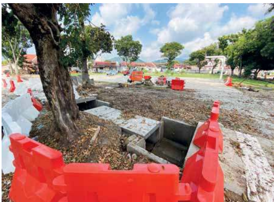
苏洛温伯勒排水系统提升计划预计年杪竣工。

为了缓解苏洛温伯勒（Solok Van Praagh）一带常年水患的问题，槟州政府拨款37万8000令吉在该区进行排水系统提升计划，预计年杪竣工。