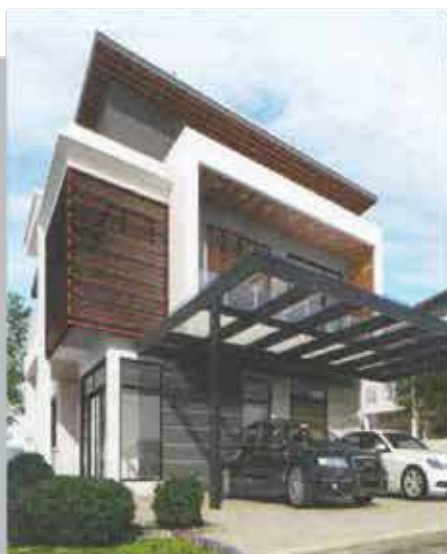
RUMAH BANGLO 2 TINGKAT Keluasan Rumah: 32.7 x 44.8 kps Keluasan Tanah: 2842 kps