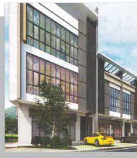
KEDAI / PEJABAT 2 & 3 TINGKAT Keluasan Tanah: 24x45 kps Keluasan Binaan: 2271 kps