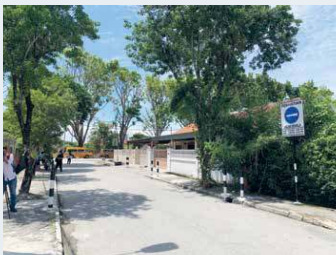
欲进入陈充恩花园路，必须从亚依淡路（经济米粉档前）入，然后从峇都兰樟路口出。

她也呼吁其他学校，若有遇到类似问题，可向槟州市政厅反映，以便该局能够前往了解，并协助解决问题。