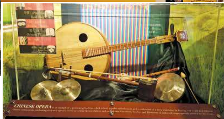
Musical instruments on display at the Penang House of Music.

When it is interactive, the place becomes more personal.