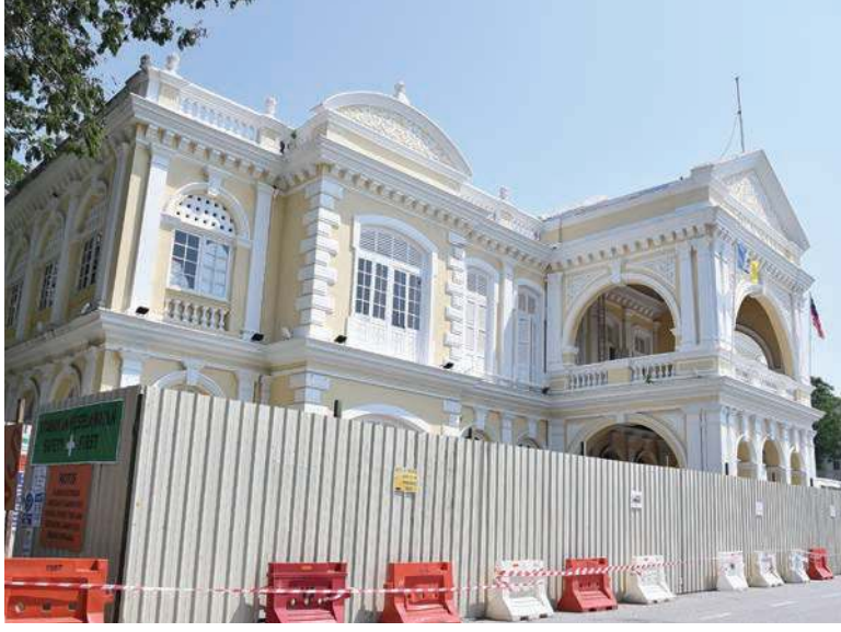
பினாங்கு டவுன்ஹால் கட்டிடத்தில் மறுசீரமைப்புப் பணிகள் மேற்கொள்ளப்படுகிறது

"இருப்பினும், இக்கட்டிடம் ஜார்ச்டவுன் யுனெஸ்கோ (ஐக்கிய நாடுகளின் கல்வி, அறிவியல் மற்றும் கலாச்சார அமைப்பு) உலக பாரம்பரிய