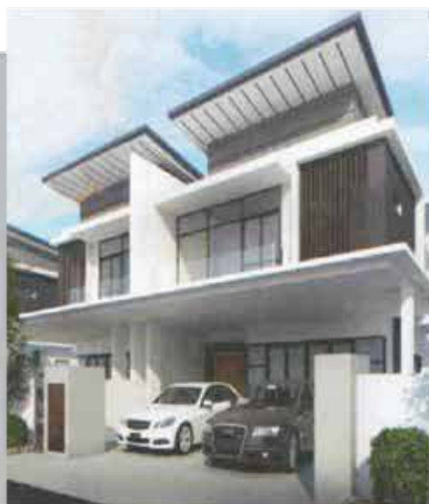
RUMAH BERKEMBAR 2 TINGKAT Keluasan Tanah: 24x45 kps Keluasan Binaan: 2271 kps