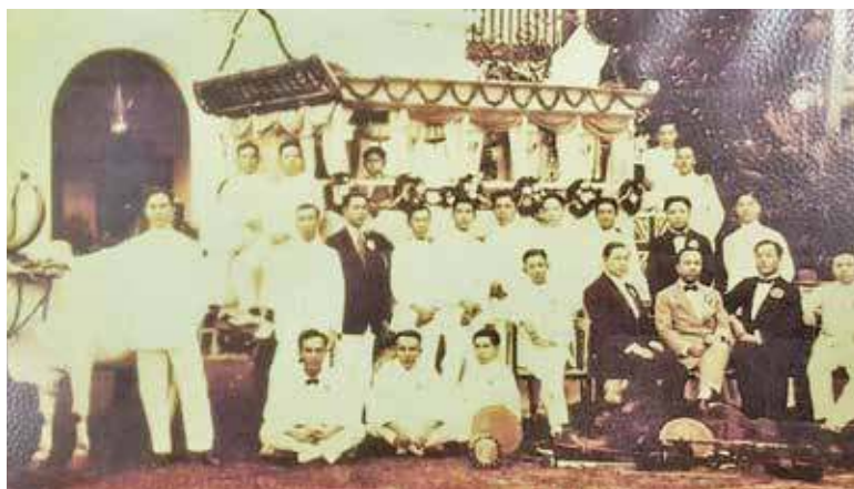
A 'dondang sayang' troupe called "Bintang Soeray" (Evening Star) posing with their decorated bullock cart in the 1920s.

"We not only show you things but allow you to test the things.