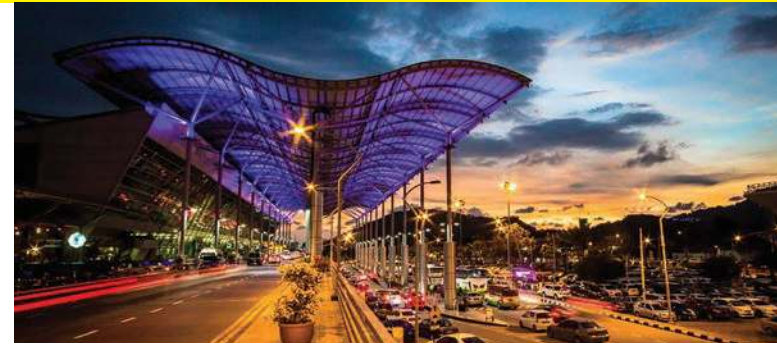
பினாங்கு அனைத்துலக விமான நிலையம்

அனுமதித்தது. “மீட்சிநிலை நடமாட்டக் கட்டுப்பாட்டு ஆணை (பி.கே.பி.பி) செயல்பாட்டின்போது, பிற அனைத்துலக நுழைவாயில்களும் (மாநில அளவில்) பினாங்கு மற்றும் குச்சிங் (சரவாக்) போன்ற இடங்களில்