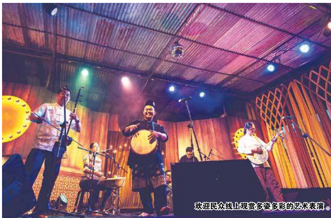
欢迎民众线上观赏多姿多彩的艺术表演。

槟州旅游、艺术、文化及遗产委员会主席杨顺兴行政议指出，配合“后新冠肺炎疫情新常态”大方向，今年乔治市艺术节移师云端，届时民众可透过网络观赏艺文表演。 “今年线上乔治市艺术节，将落在7月4日至19日，活动包括线上艺术表演、展览、分享会、工作坊等多达9项的精彩艺术活动。在此期间，民众可透过智慧型手机、电脑、平板电脑等观赏各类型艺术，包括视觉艺术、舞