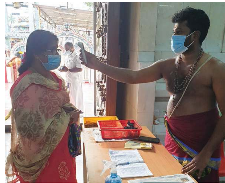
குருக்கள் ஆலயத்திற்கு வருகையளிக்கும் பக்தர்களின் உடல் வெப்பநிலையை பரிசோதனை செய்கிறார்

மேலும், பொது மக்கள் இந்த வழிகாட்டிகளைப் பின்பற்றுவதன் மூலம் கோவிட்-19 தொற்றுநோய்