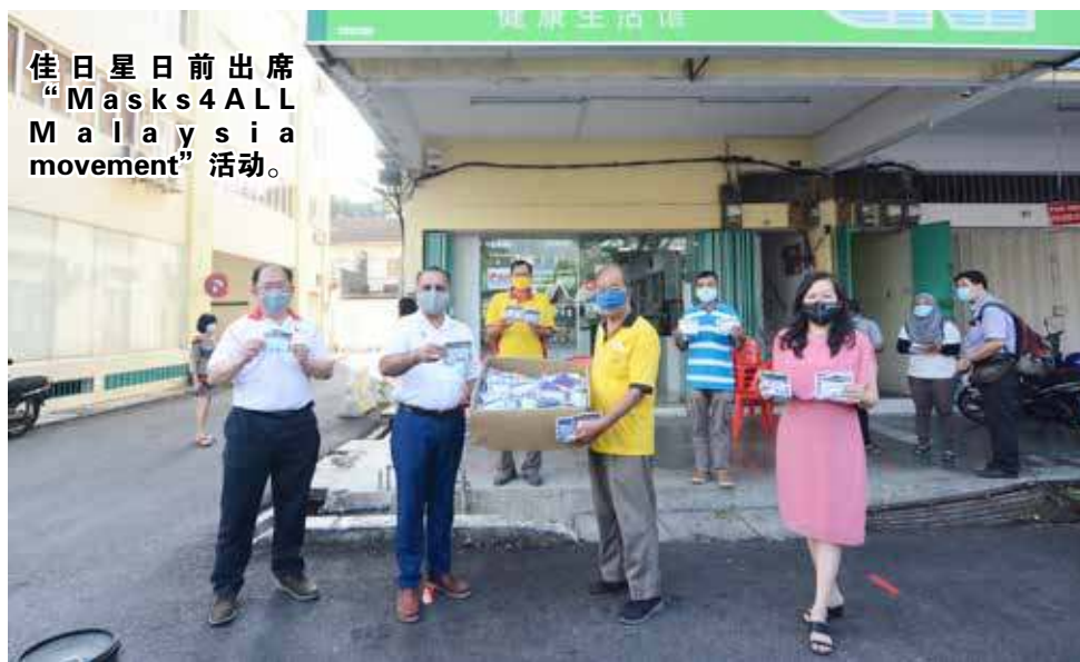
佳日星日前出席“Masks4ALL Malaysia movement”活动。