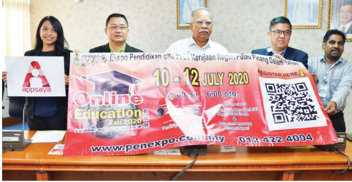
உயர்கல்வி வழிகாட்டி கண்காட்சி 2020 பிரச்சுரத்துடன் பிளாங்கு மாநில இரண்டாம் துணை முதல்வர் பேராசிரியர் ப.இராமசாமி மற்றும் ஏற்பாட்டு குழுவினர்.

மார்ச் மாதம் நடத்தப்பட வேண்டிய இக்கண்காட்சி நடமாட்டக் கட்டுப்பாட்டு ஆணையால் ஜூலை மாதம் ஒத்திவைக்கப்பட்டது. மீட்சிக்கான நடமாட்டக் கட்டுப்பாட்டு ஆணை அமலாக்கத்தில் இருக்கும் வேளையில் இம்முறை இக்கண்காட்சி மின்னியல் முறையில் அமல்படுத்தப்படுகிறது என பிளாங்கு எக்ஸ்போ தலைமை நிர்வாக அதிகாரி பிரான்சிஸ் வோங் செய்தியாளர் சந்திப்பில் விளக்கமளித்தார்.