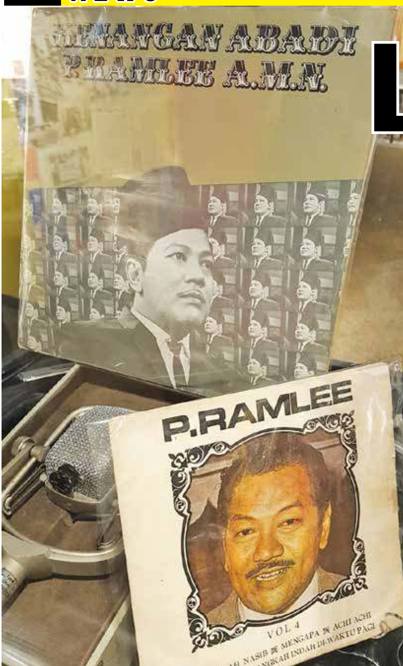
Records of the legendary P. Ramlee songs.

■ Story by K.H. Ong