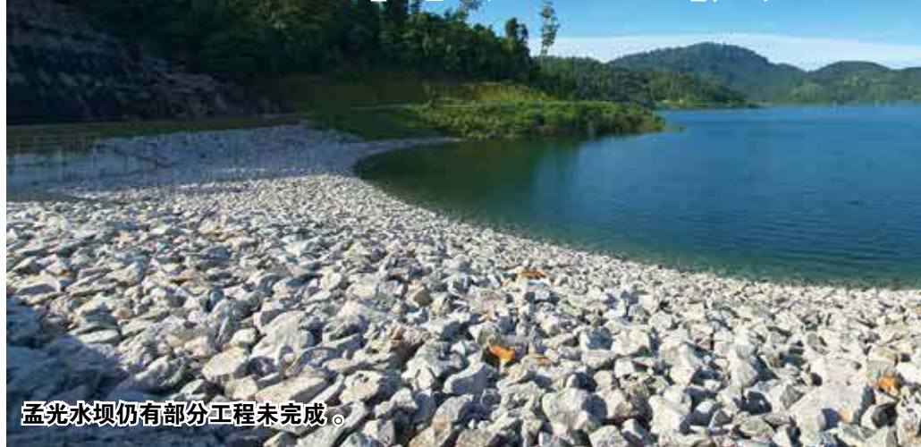
孟光水坝仍有部分工程未完成。