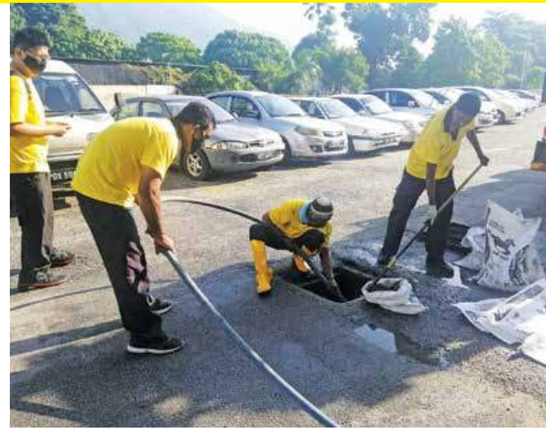
MBPP staff cleaning up the sewerage system during the gotong-royong.

Unit Pinjaman Penuntut, Seksyen Kewangan Pejabat Setiausaha Kerajaan Negeri Pulau Pinang 04-6505541 / 5165 / 5391 / 5627 / 5599