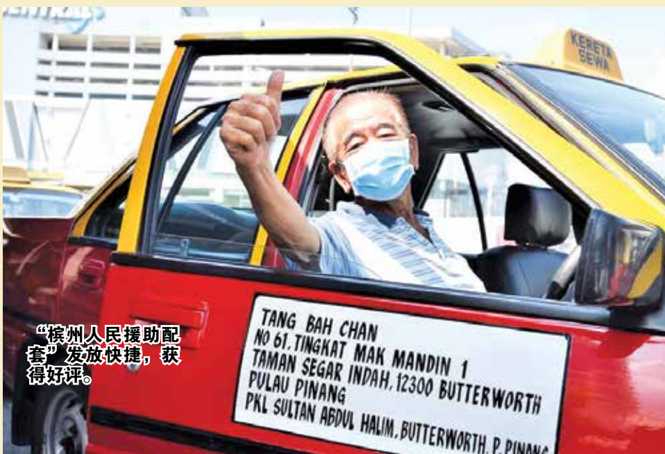
“槟州人民援助配套”发放快捷，获得好评。

“服务业方面，主要来自旅游领域。首长说，他早前到访数个旅游景点与业者交流时发现，尽管槟州旅游景点业者受到疫情影响，但业者们仍然持着逆境求存的坚韧精神，积极寻找对策来振兴旅游业。”