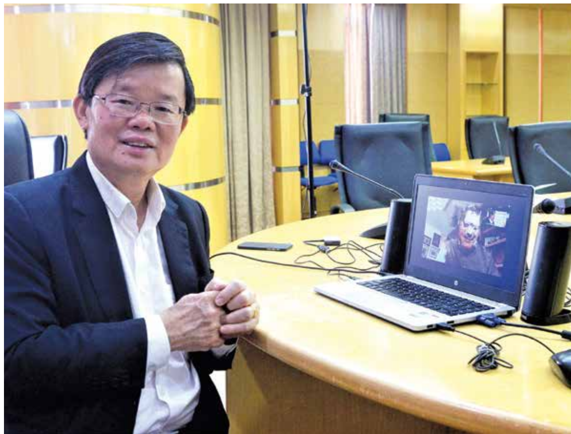
曹观友对槟城的投资情况保持正面感到欣慰。

划展延了两至三个月的时间，我们预计将在6月与工程交付伙伴签署合约，然后将会进行公开招标，相信复工后，工程进度将会逐步接轨。”