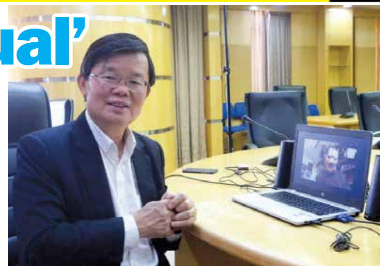
Chow and Hay had a fruitful talk during the virtual session.

On employment in the state, Chow said up to now, only two