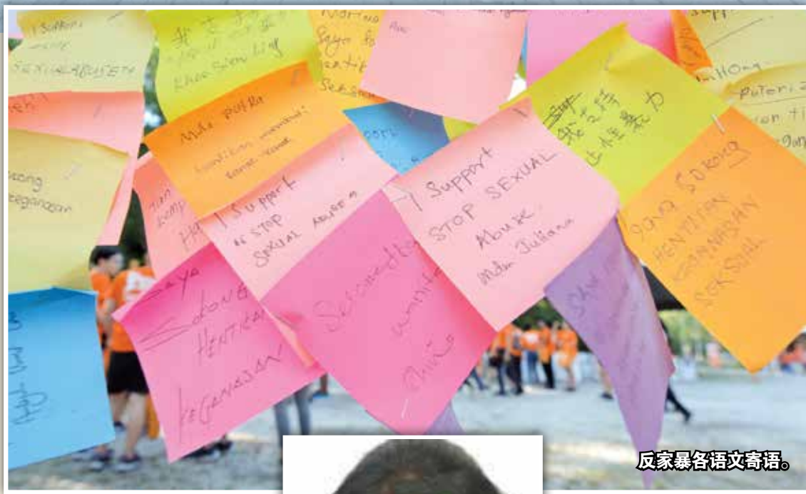
反家暴各语文寄语。