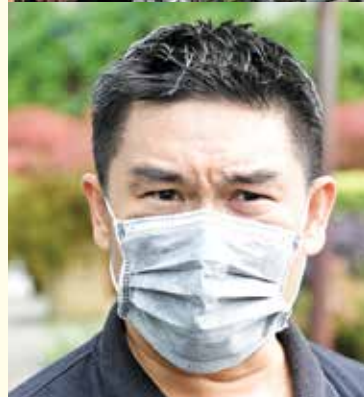
Tan: The Habitat complying with SOP.