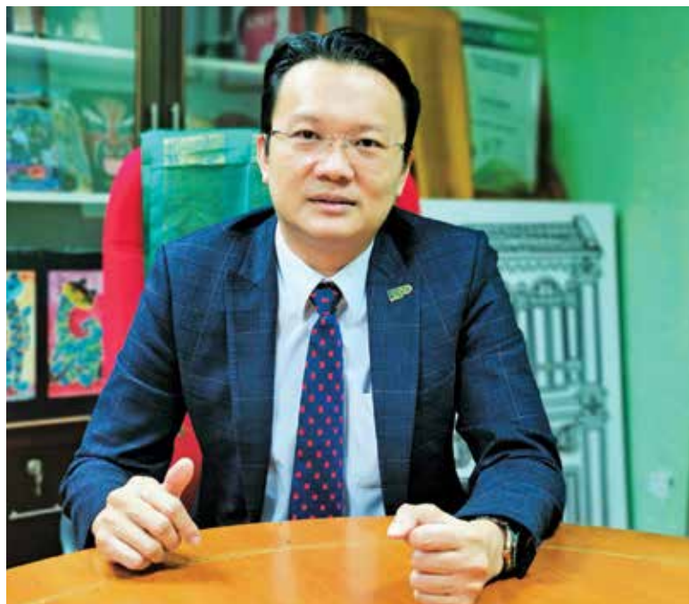
Yeoh calls on the public to be cautious in dealing with the pandemic.

This comes after the state partially reopened certain businesses and the traffic flow has