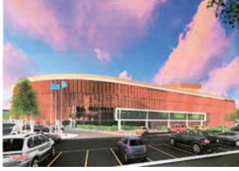
அம்பாங் ஜாஜார் பல்நோக்கு மண்டபத்தின் மாதிரி வரைபடம்

யோவ் மாநில முதல்வர் சாவ் கோன் யாவ் அம்மண்டபத்தை பார்வையிட வருகையளித்த போது இவ்வாறு குறிப்பிட்டார்.