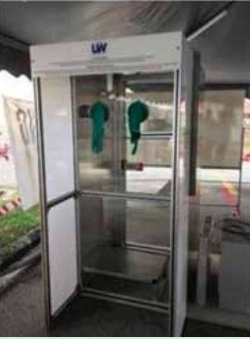
“கோவிட் டெஸ்ட் பூத்”

யு.டபிள்யூ ஹெல்த்கேர் “கோவிட் டெஸ்ட் பூத்” - யு.டபிள்யூ ஹெல்த்கேர் டெஸ்ட் சாவடியை அதன் நிறுவனத்திலே உருவாக்குகிறது, மேலும் இதன் ஒரு