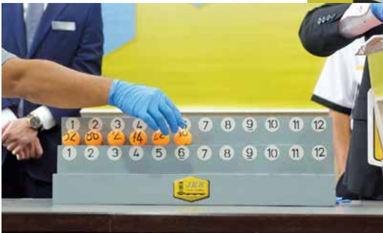
公共工程局是州内第一家在管制令期间，推出直播工程竞标的政府机构。

也负责州土地发展事务的曹观友表示，今天的公开竞投，是邀请在马来西亚建筑发展局（CIDB）及槟州政府采购系统（Sistem ePerolehan）下注册的承包商参与，有关承包商必须符合建筑发展局指定的专业要求。