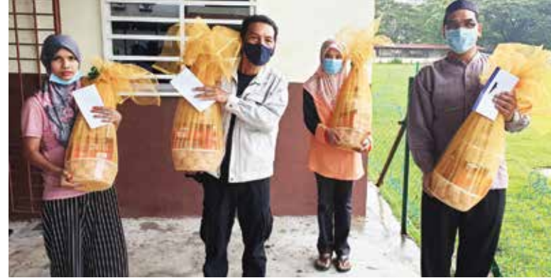
பரிசுக்கூடை மற்றும் பற்றுச்சீட்டு பெற்றுக்கொண்ட பொது மக்கள்

பேராசிரியர் நம்பிக்கைத் தெரிவித்தார். கோவிட்-19 தொற்றுநோய் பரவுவதைத் தடுக்கும் பொருட்டு முஸ்லிம் சமூகத்தினர் வழக்கம் போல் தங்கள் ஊர்களுக்கு (கம்போங்) செல்ல அனுமதி வழங்காதது வருத்தமளித்தாலும், சுகாதாரத்திற்கு முன்னுரிமை அளித்து அதன் அமலாக்கம் மிக அவசியமே என பேராசிரியர் விளக்கமளித்தார். ஒவ்வொரு ஆண்டும், பிறை தொகுதியில் நோன்புப்