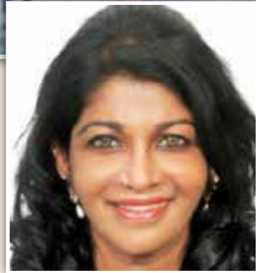
佛罗伦丝： 州政府的倡议值得赞赏。