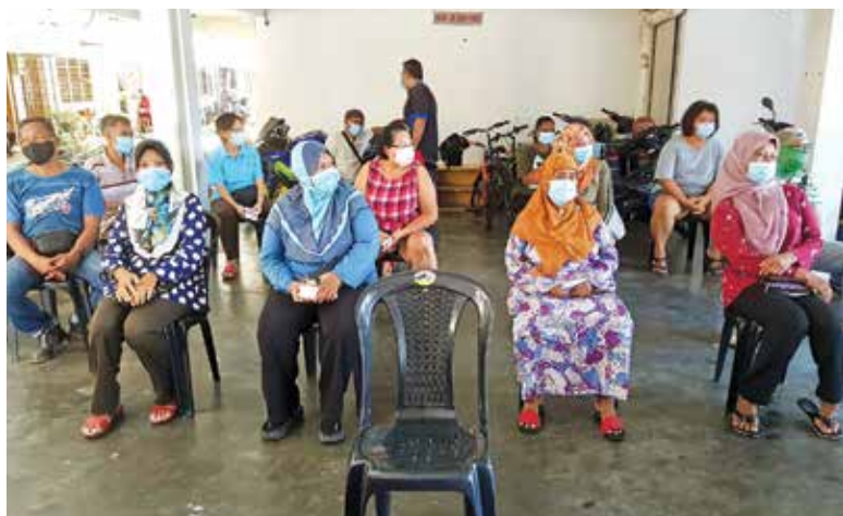
The recipients practise social distancing and wear face masks during the aid presentation programme.

"The state government has released two aid packages but they are not enough. Many NGOs and organisations have come forward to help the needy families."