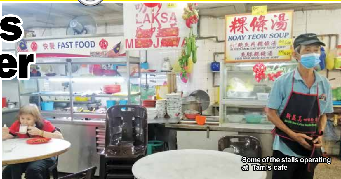
Some of the stalls operating at Tam's cafe

"The local councils together with the state executive council member and state Health Department will coordinate the guidelines that allow dine-ins at eateries," he told the public via Facebook Live on his Facebook page on May 15.