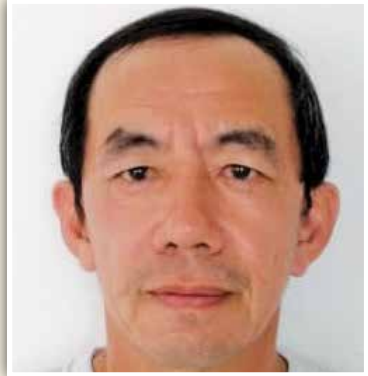
江轩达： 州政府和非政府组织直接相互合作，才能协助更多人。

达说，州政府拨款支持非政府组织，是一项非常好的举措，因为两者必须互相配合，才能更好的为有需要人士提供援助。