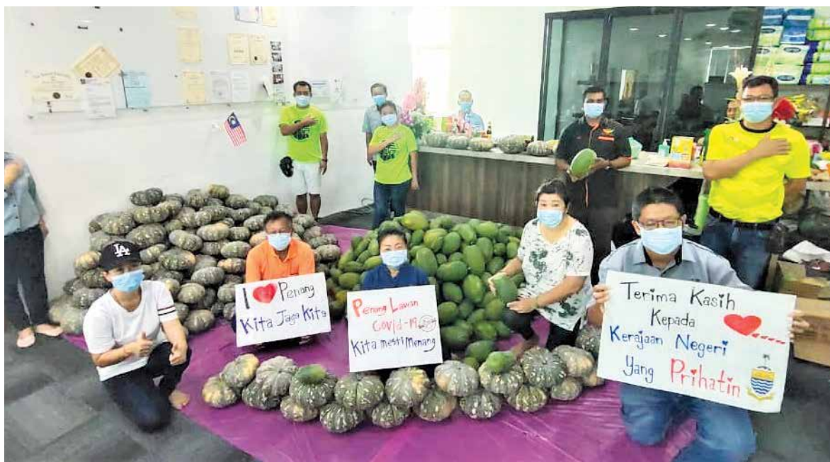
双溪槟榔乡村社区管理理事会收购各一吨的木瓜与金瓜后，在选区派发给基层家庭。