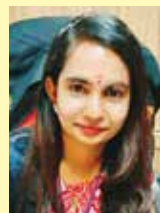
கோகேஸ்வரி, லெங்கோ பவா

கோவிட்-19 கிருமி பரவுவதைத் தடுக்க பொதுச் சந்தைகளில் சுகாதார வழிக்காட்டல்களைப் பின்பற்றப்படுவதை உறுதிச்செய்ய காவல்துறை மற்றும் மாநகர் ஊழியர்களுக்கு உதவுகின்ற முன்னணி உறுப்பினர்களில் எம்பி.கே.கே உறுப்பினர்களும் முக்கிய பங்கு வகிக்கின்றனர்.