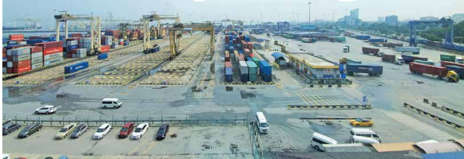
The view of the North Butterworth Container Terminal (NBCT) in Butterworth.

PENANG Port Sdn Bhd (PPSB) has identified several key recovery strategies to grow its business during the Covid-19 pandemic.