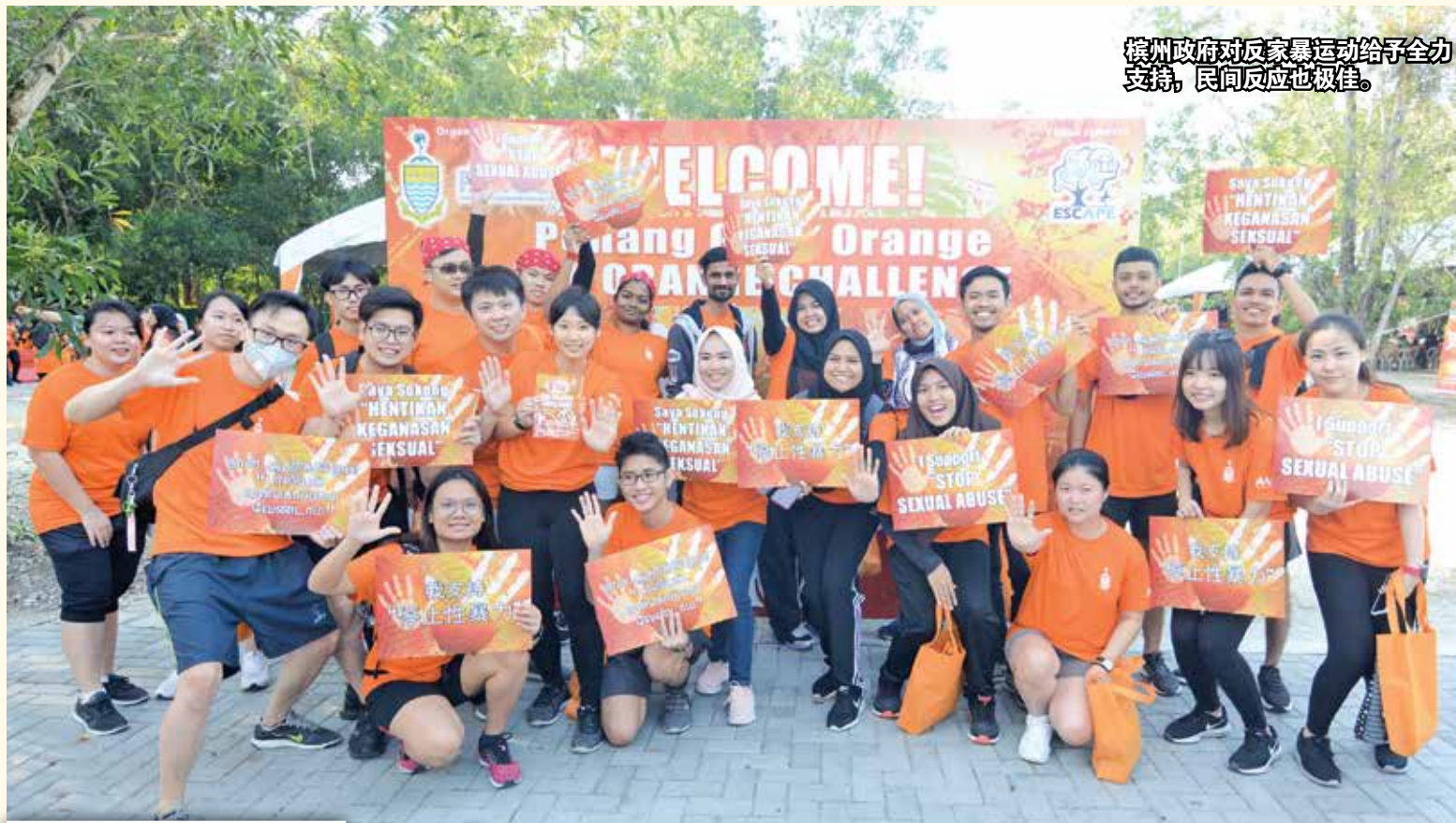
槟城政府对反家暴运动给予全力支持，民间反应也极佳。