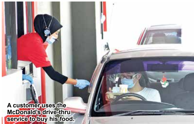
A customer uses the McDonald's drive-thru service to buy his food.

malls, hotels and the fast food franchises are allowed to pro-