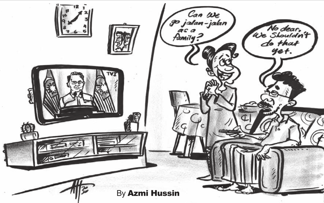
By Azmi Hussin

On the mainland, the threshold is set at RM1 million for landed property and RM500,000 for condominiums.