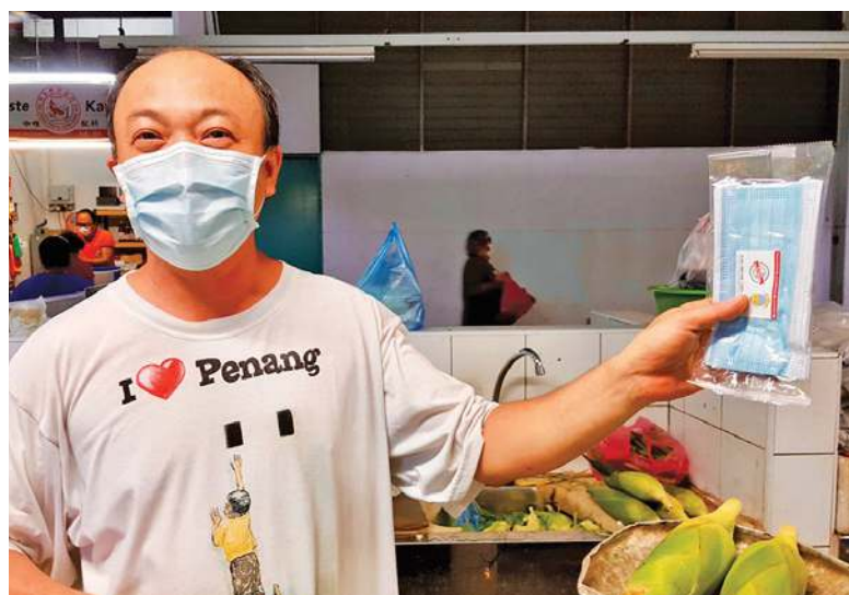
巴刹小贩身穿“我爱槟城”T恤，手中拿着首长派送的口罩，尽显槟州温情满满。