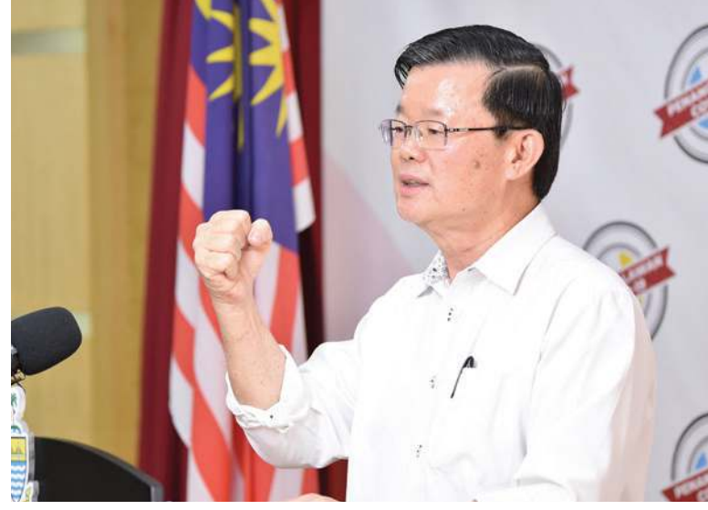
மாநில முதல்வர் மேதகு சாவ் கொன் யாவ் நடமாட்டக் கட்டுப்பாட்டு தளர்வு பற்றி விளக்கமளித்தார்.

இரண்டாம் பிரிவு: வருகின்ற மே மாதம் 8 முதல் 12-ஆம் தேதி வரை பி.கே.பி.பி-யின் கீழ்