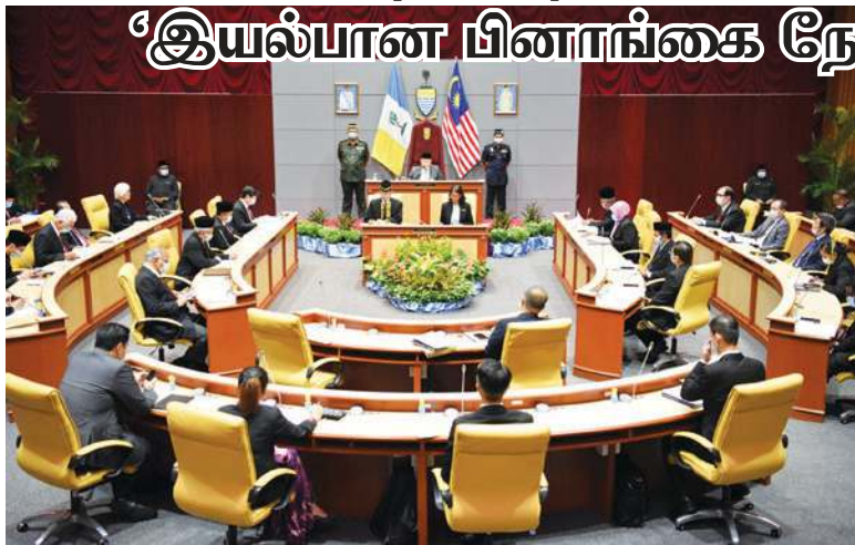
பினாங்கு மாநில சட்டமன்றம் கூட்டம் அதிகாரப்பூர்வமாகத் தொடங்கியது.

ஜார்ச்டவுன் – மாநில அரசு கோவிட்-19 போராட்டத்தில் உதவும் நோக்கில் உற்பத்தி துறையை மேம்படுத்த பினாங்கு மேம்பாட்டுக் கழகம் மற்றும் ‘இன்வெஸ் பினாங்கு’ துணை நிற்க வேண்டும்.