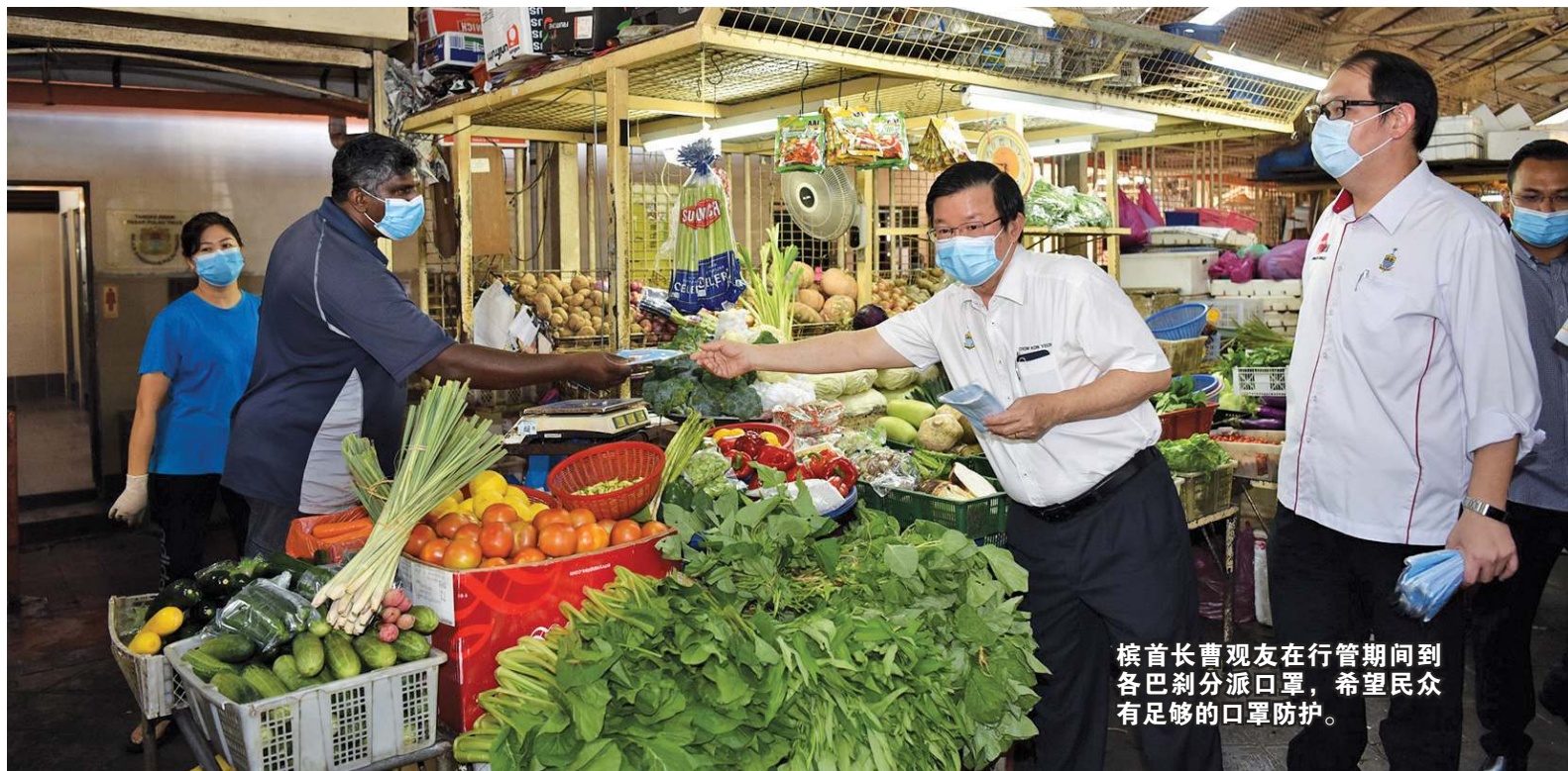
槟首长曹观友在行管期间到各巴刹分派口罩，希望民众有足够的口罩防护。