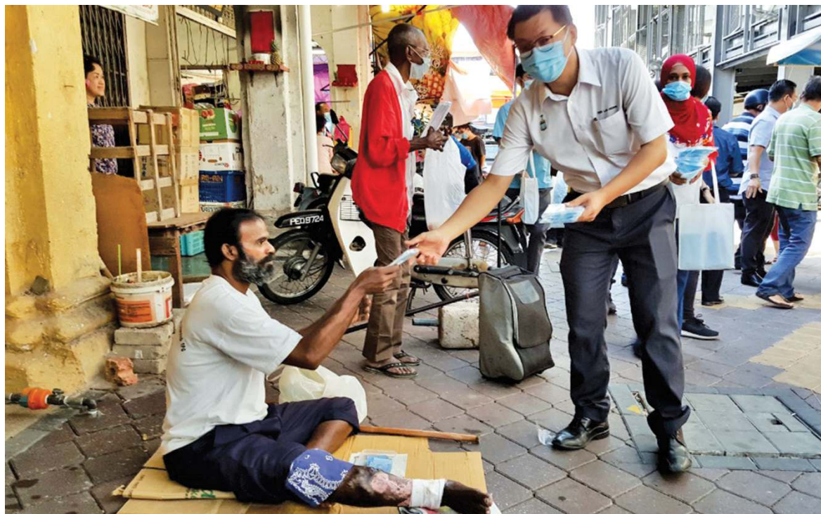
Teh giving out face masks to the public.