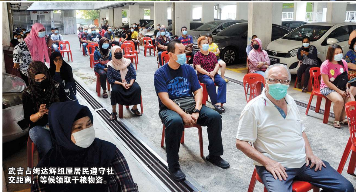
武吉占姆达辉组屋居民遵守社交距离，等候领取干粮物资。