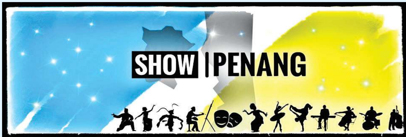
脸书专页“Show Penang”，提供官方平台，推广州内线上艺文活动。

“新冠肺炎肆虐，在行动管制令下，州内艺文团体无法举办实体活动。有鉴于此，槟州政府推出总值20万令吉的“槟州艺文活动补助方案”，鼓励州内艺文团体或个人形式的艺术工作者，举办线上艺文活动，包括艺术行销工作坊、表