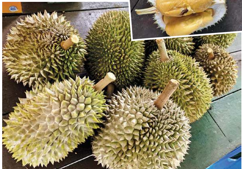
槟城出产的高品质榴莲，闻名遐迩，吸引了国内外游客到来品尝。