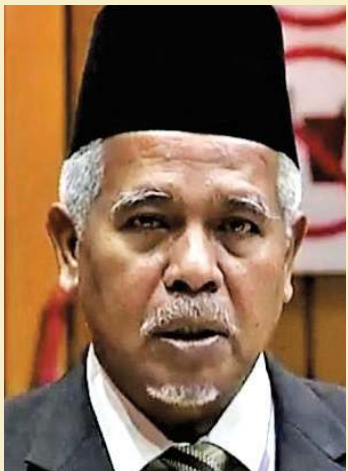
反对党领袖莫哈末尤索夫。

槟州首席部长曹观友在发表演词时说，“槟州重返正轨策略”（Strategi Next Normal Pulau Pinang）有三大任务：第一，巩固槟州的生态系统；第二，协调上述生态系统，以适应21世纪的变化；第三，建立弹性（resilience），以应对未来可能出现的任何危机。