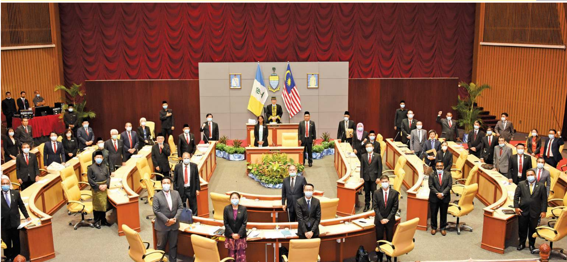
州立法议会在行管令期间如常召开，议员踊跃出席。