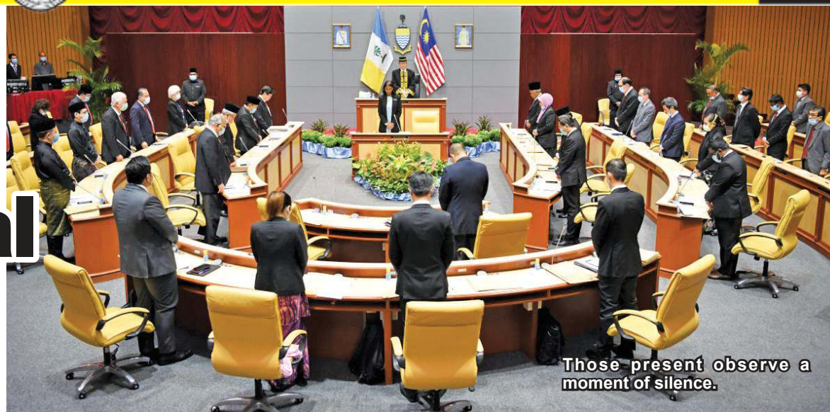
Those present observe a moment of silence.

"The Penang government is getting ready for the 'next normal' after the movement control order (MCO) period. We encourage the electrical and electronics (E&E)