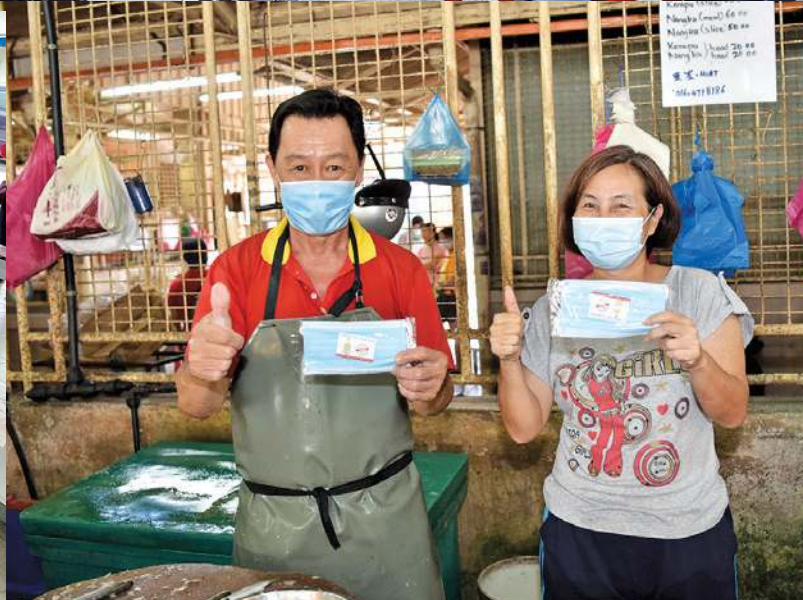
小贩们拿到槟州政府分派的口罩后，竖起拇指赞好。