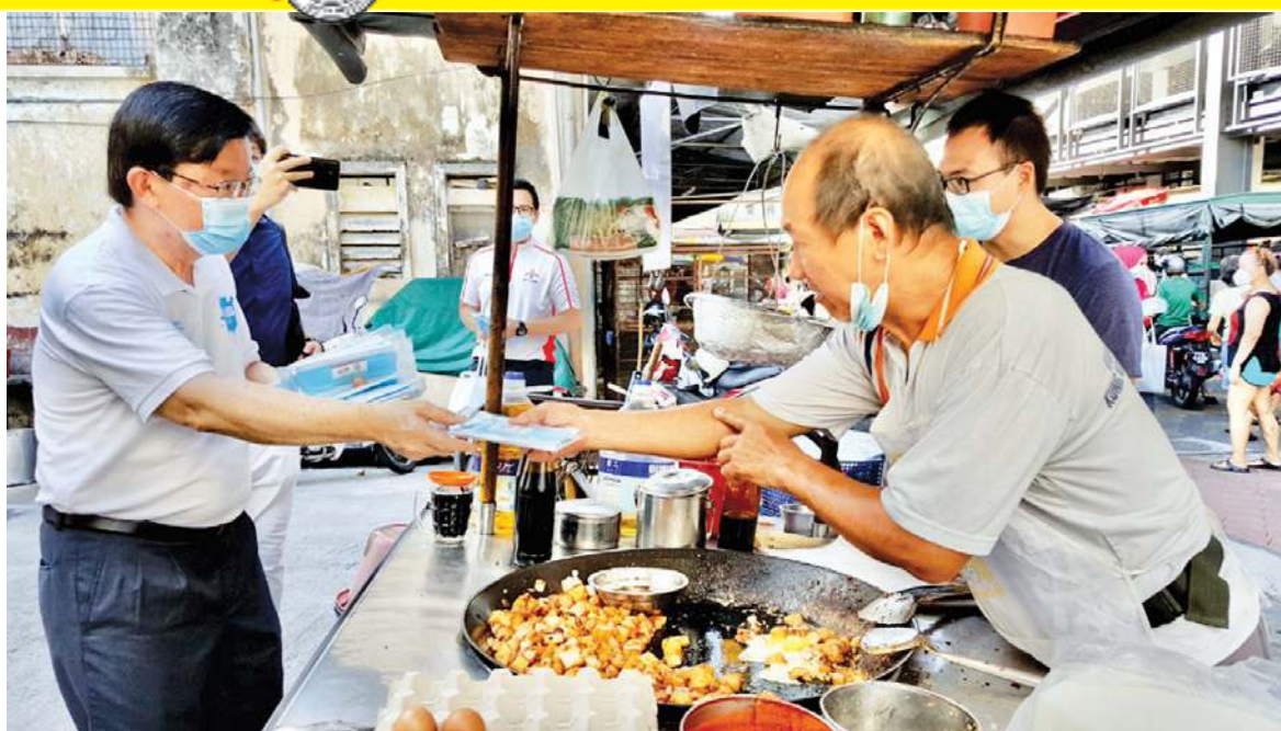
Chow distributing face masks to the traders.

The Penang government has unfolded its post-pandemic plan, the "Penang Next Normal Strategy", to ensure that the state's economy stays resilient.