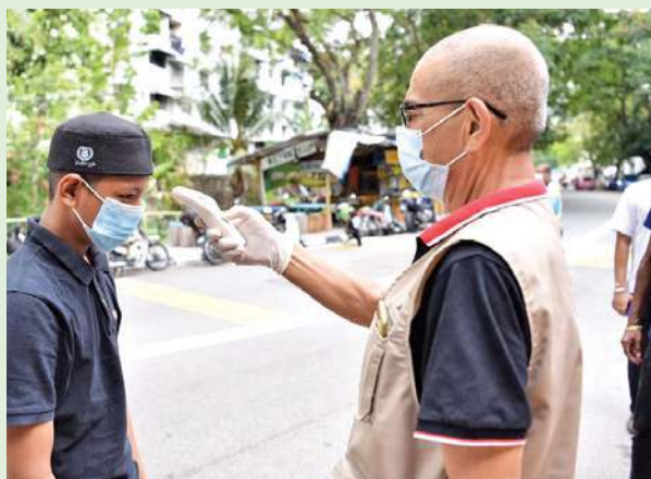
A volunteer checking the body temperature of a Bukit Gelugor resident at the lunch packet distribution at the Bukit Gelugor MPKK office in Taman Tun Sardon.