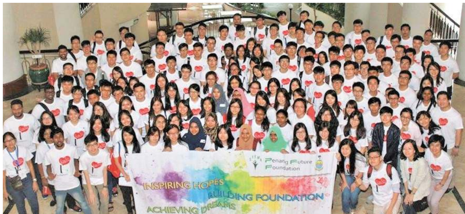
檳城未来基金会奖学金助学生完成梦想。

檳城未来基金会2020年奖学金将于6月1日至6月22日，开放让学生申请。有兴趣者，欢迎关注檳城未来基金会的官网www.penangfuturefoundation.my、《珍珠快讯》及社交媒体如面子书和推特，以获知最新资讯。