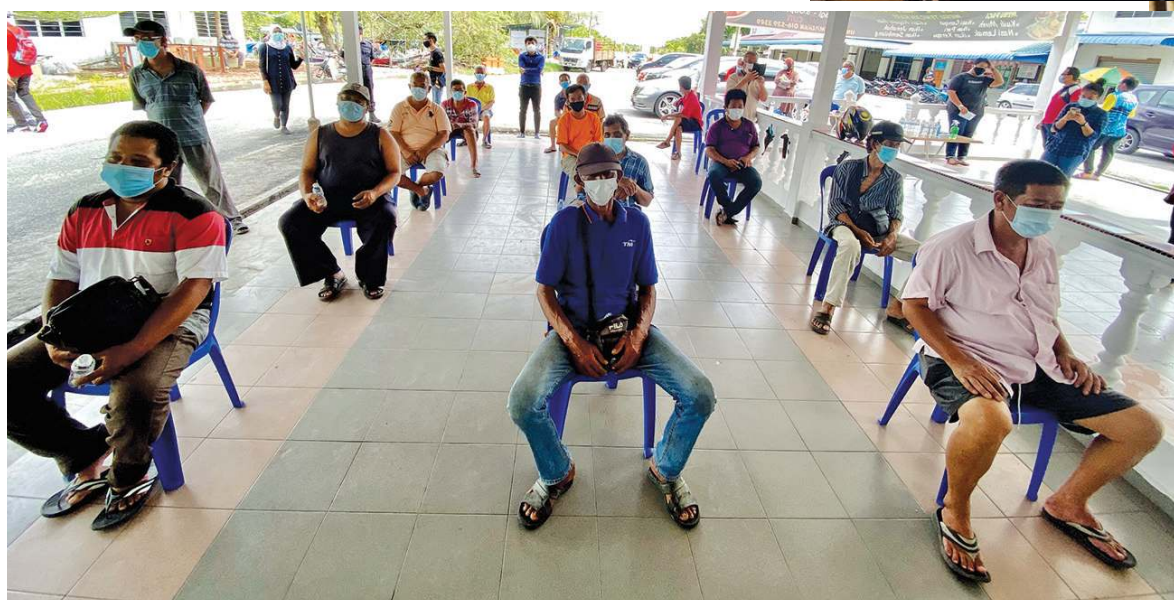
受惠的渔夫在等候接领州政府给予的物资时，遵守社交距离。