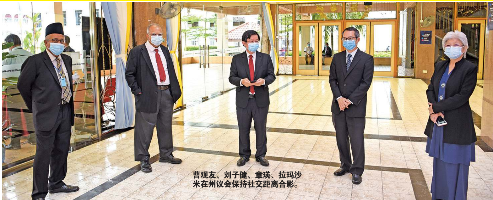
曹观友、刘子健、章瑛、拉玛沙米在州议会保持社交距离合影。

当然，我也不忘向其他的政府机构，像是州议员、国会议员、市议员、乡村社区管理委员会（MPKK）、非政府组织、私人团体和个人，感谢你们在州政府面对新