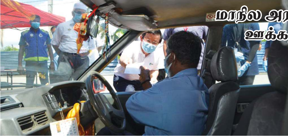
மாநில முதல்வர் 'டிரைவ் த்ரு' வாயிலாக வாடகைக்கார் ஓட்டுநர்களுக்கு ஊக்கத்தொகை வழங்கினார்.

பாகான் டாலாம் – பிணங்கு மாநில அரசு, பொருளாதாரத் திட்டமிடல் பிரிவின் மூலம், அண்மையில் வழங்கிய ஊக்கத்தொகை பெறுவதற்கான அனைத்து ஆவணங்கள் சமர்ப்பிக்கத் தவறிய வாடகைக்கார் ஓட்டுநர்கள் மற்றும் இ-ஹெயிலிங் ஓட்டுநர்களுக்கு ஊக்கத்தொகை வழங்கும் நிகழ்ச்சி நடத்தப்பட்டது.