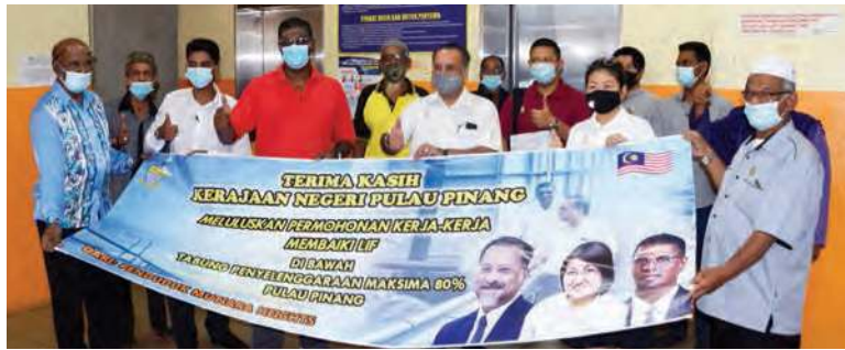
முத்தியாரா ஹைட் அடுக்குமாடி மின் தூக்கியை ஆட்சிக்குழு உறுப்பினர் ஜெக்டிப் சிங் டியோ நேரில் சென்று பார்வையிட்டார். (உடன் நாடாளுமன்ற உறுப்பினர் ஆர்.எஸ்.என் இராயர் மற்றும் முக்கிய பிரதிநிதிகள்)

பிளாங்கு பராமரிப்பு நிதியம் 80 (TPM80PP) திட்டத்தின் கீழ் இத்திட்டத்தை செயல்படுத்த மாநில அரசு ரிம248,000 நிதி ஒதுக்கீடு வழங்கியுள்ள வேளையில் எஞ்சிய 20 விழுக்காட்டை (ரிம 62,000) அக்குடியிருப்பு மக்கள் செலுத்துவர். இம்மின்தூக்கி பழுதுபார்க்கும் திட்டத்தில் ரிம310,000 நிதி செலவு ஏற்படும் என கணக்கிடப்பட்டுள்ளதாக