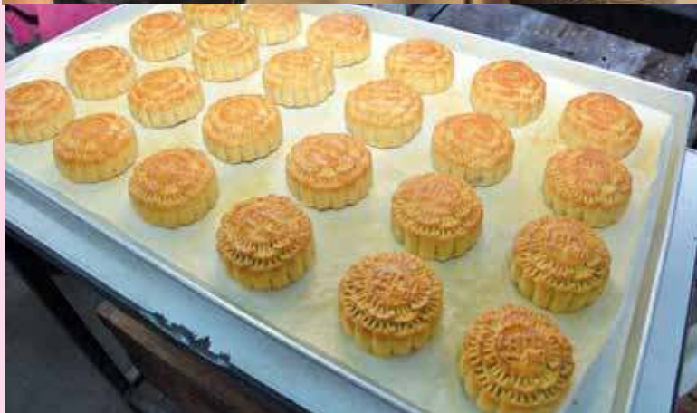
新鲜出炉的月饼，色香味俱全。