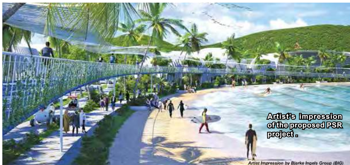
Artist's impression of the proposed PSR project.

Artist Impression by Bjarke Ingels Group (BIG)