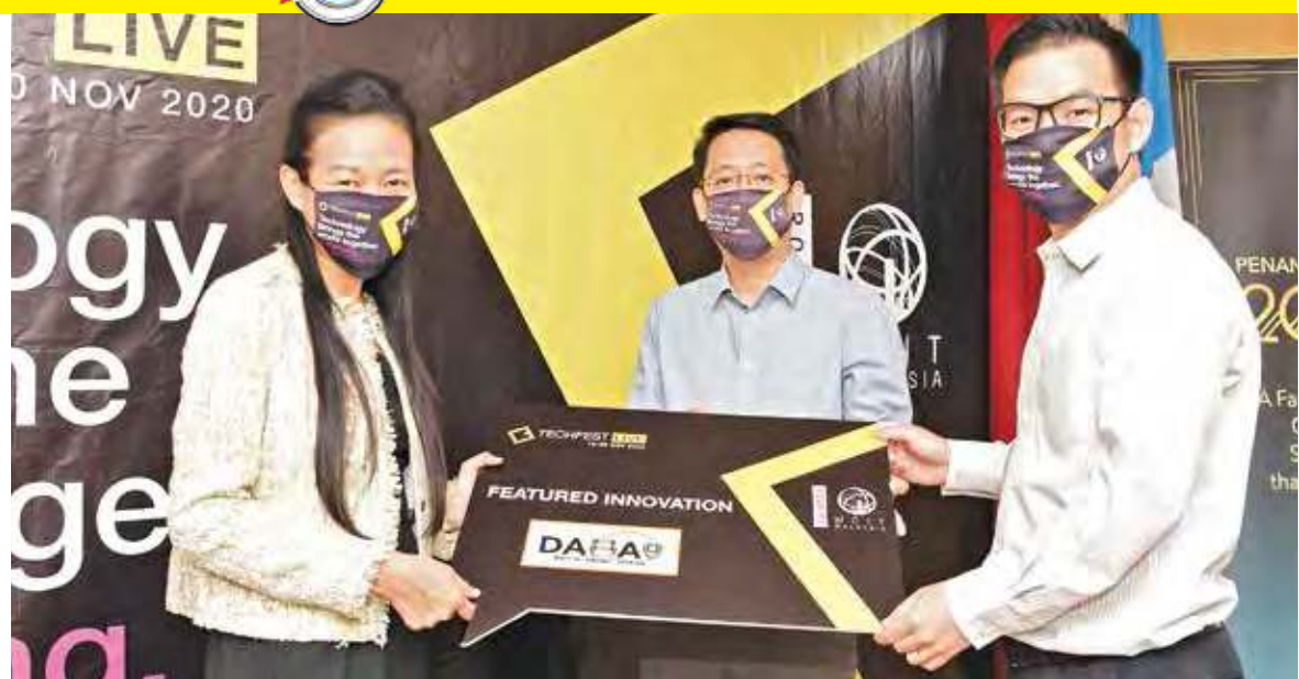
(From left) Low, Ooi and Kong holding up a poster that welcomes DABAO as one of the featured innovations at Penang TECHFEST Live.

For more information about the digital festival, check out http://techfest.my .