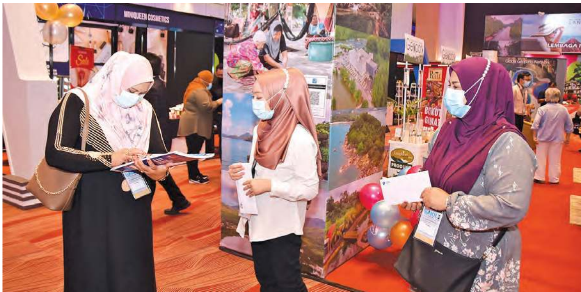
WHOLE Penang 展销会日前在槟城国际会展中心举行，不少民众前往了解资讯。

槟城首个双线会展活动（Hybrid Event）全球酒店、生活及娱乐展销会（WHOLE Penang）成功于槟城国际会展中心圆满举行，共超过100个参展单位，以及80多个线上单位参与。