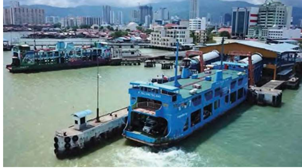
பிணங்கு மாநில பயணப் படகு துறைமுகம். (மூலம்: இணையதளம்)

ஜார்ச்டவுன் - மாநில அரசு புதிய பயணப் படகு சேவை மேம்படுத்துவதற்கும் இயக்குவதற்கும் ஒட்டுமொத்த திட்டமிடல் திட்டம் குறித்து போக்குவரத்து அமைச்சின் (எம்.ஒ.தி) முழு அறிக்கைக்காக இன்னும் காத்திருக்கிறது.