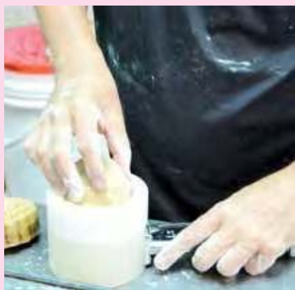
传统手工月饼，制作过程一点也不能马虎。