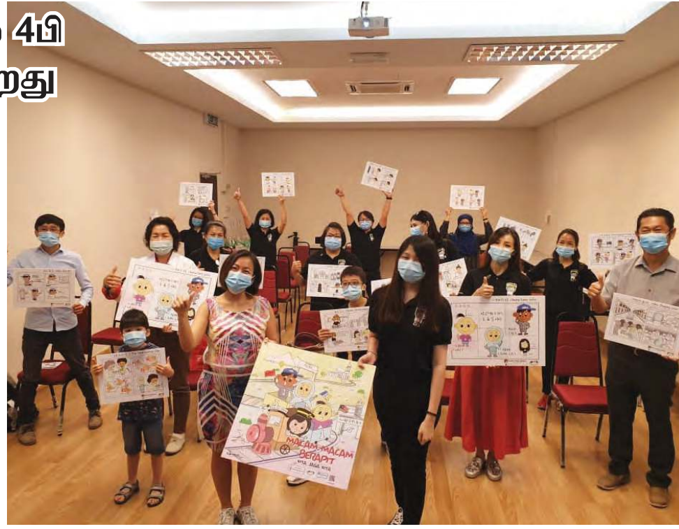
'பல விதமான பெராபிட்' எனும் கேலிச்சித்திர திட்டத்தின் ஓவியங்களை சட்டமன்ற உறுப்பினர் மற்றும் ஏற்பாட்டு குழுவினர் காண்பிக்கின்றனர்.

இந்த புதிய இயல்பு முறையில் பொது மக்கள் சமூக ஊடகங்கள் வாயிலாக நாட்டு நடப்புகளை அறிவதில் மிகுந்த ஆர்வம் காட்டிவருகின்றனர். இதனை களமாக கொண்டு பெராபிட் சட்டமன்றம் 'பல விதமான பெராபிட்'(macam - macam Berapit) என்ற கேலிச்சித்திரங்கள் துணை கொண்டு 4பி விதிகளை மக்களுக்கு இலகுவாக கொண்டு சேர்க்கிறது. மேலும், புதிய இயல்பில் நடைமுறை படுத்தப்பட்ட இணைய வழி