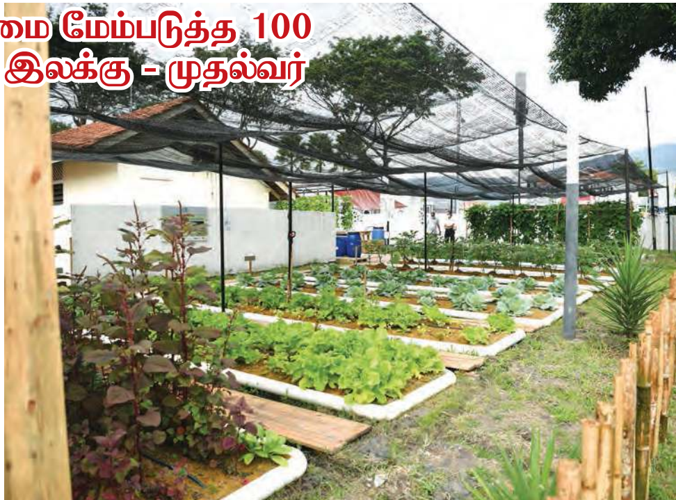
பினாங்கு டிஜிட்டல் நூலகத்தில் அமைக்கப்பட்டுள்ள சமுதாய வேளாண்மை தோட்டம்

இத்திட்டத்தின் நிபுணத்துவ சலுகைகளை வழங்கியுள்ளது.