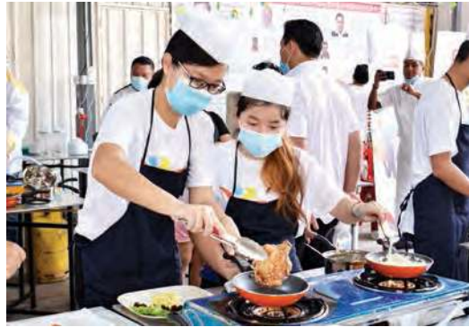
பங்கேற்பாளர்கள் சமையல் பட்டறையில் பல விதமான சமையல் செய்து சிறப்பித்தனர்.

கெபாலா பத்தாஸ் - இளைஞர்களிடையே சமையல் மீதான ஆர்வத்தை தூண்டும் முயற்சியில், பிளாங்கு இளைஞர் மேம்பாட்டுக் கழகம் (பி.ஓய்.டி.சி) இன்று ஒரு சமையல் பட்டறை ஏற்பாடு செய்துள்ளது.