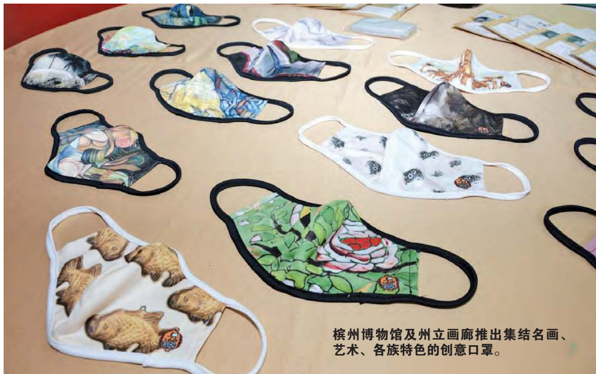
槟州博物馆及州立画廊推出集结名画、艺术、各族特色的创意口罩。

槟州州立博物馆与艺术画廊别出心裁，推出15种以国内名画，和深具各族特色及艺术风格的限量版客制化可换洗布口罩，让艺术贴近生活，与人民共同抗疫。