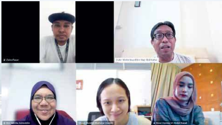
SESI wawancara yang diadakan secara dalam talian.

“Apabila Tun Abdullah Ahmad Badawi (Perdana Menteri Ke-5 Malaysia) menyempurnakan acara penanaman cerucuk (bagi projek jambatan kedua Pulau Pinang) sekitar tahun 1995, semasa itu beliau mengumumkan Batu Kawan akan menjadi sebuah bandar baharu yang dikenali sebagai Bandar Cassia, semasa itu benar-benar menggamit perhatian penduduk Pulau Pinang dan di luar negeri ini untuk datang (menghuni di Bandar Cassia Batu Kawan).