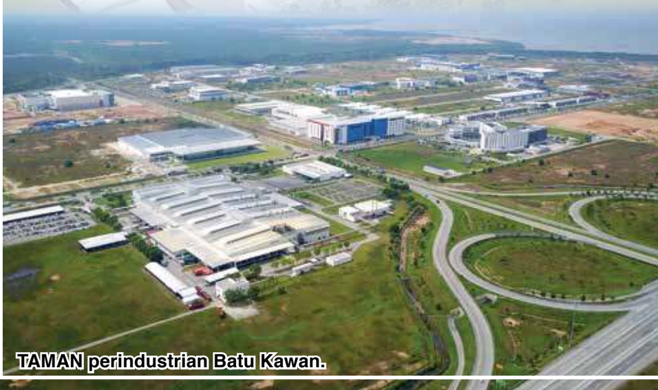
TAMAN perindustrian Batu Kawan.

“Mewakili PDC, saya sangat berharap Bandar Cassia Batu Kawan membangun sepenuhnya sebagai sebuah ‘Smart Eco-City’, sebuah bandar di negeri ini yang menjadi hab dan catalyst pembangunan ekonomi negeri ini dan model kepada pembangunan masa hadapan, mungkin dalam 30 hingga 50 tahun,” ulas beliau.