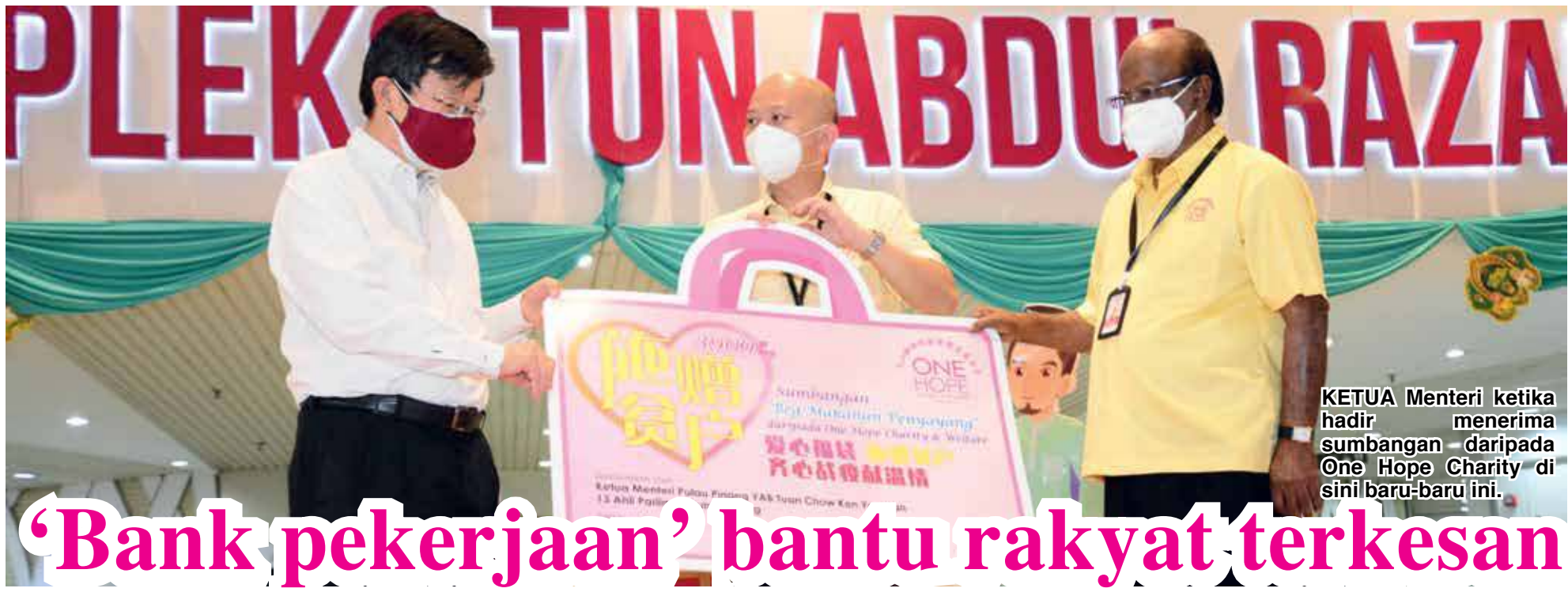
KETUA Menteri ketika hadir menerima sumbangan - daripada One Hope Charity di sini baru-baru ini.