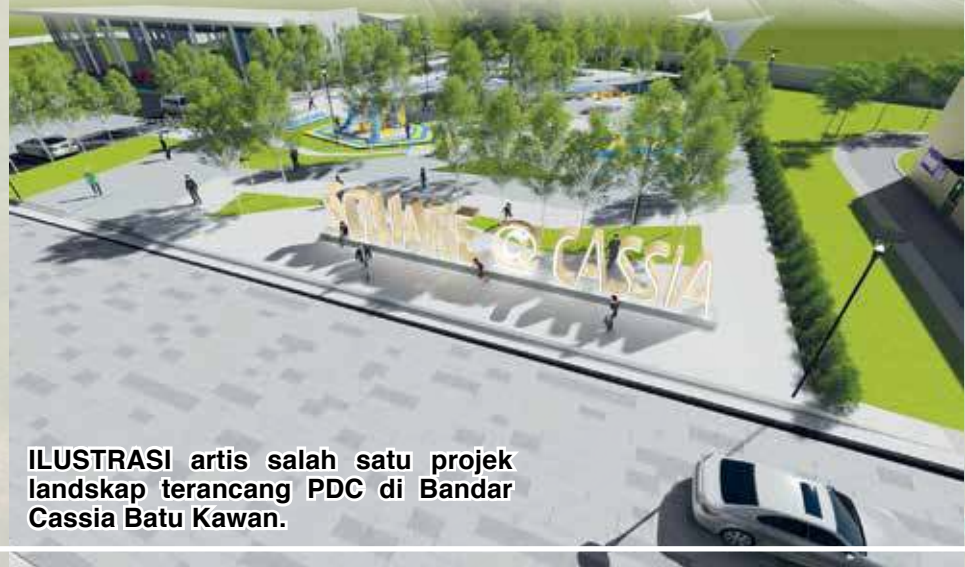
ILUSTRASI artis salah satu projek landskap terancang PDC di Bandar Cassia Batu Kawan.