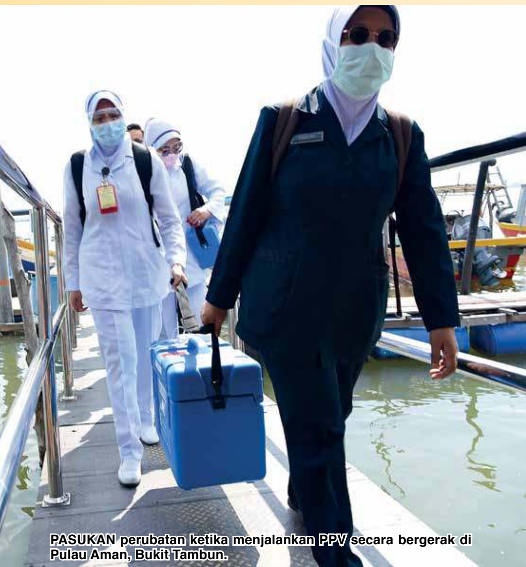
PASUKAN perubatan ketika menjalankan PPV secara bergerak di Pulau Aman, Bukit Tambun.