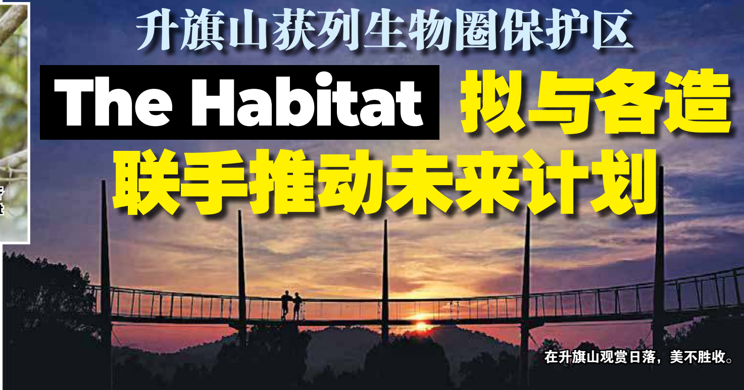
在升旗山观赏日落，美不胜收。

作为世界生物圈保护区网络的一员，他希望升旗山展现其积极、富有成效和建设性的一面，做好榜样，并