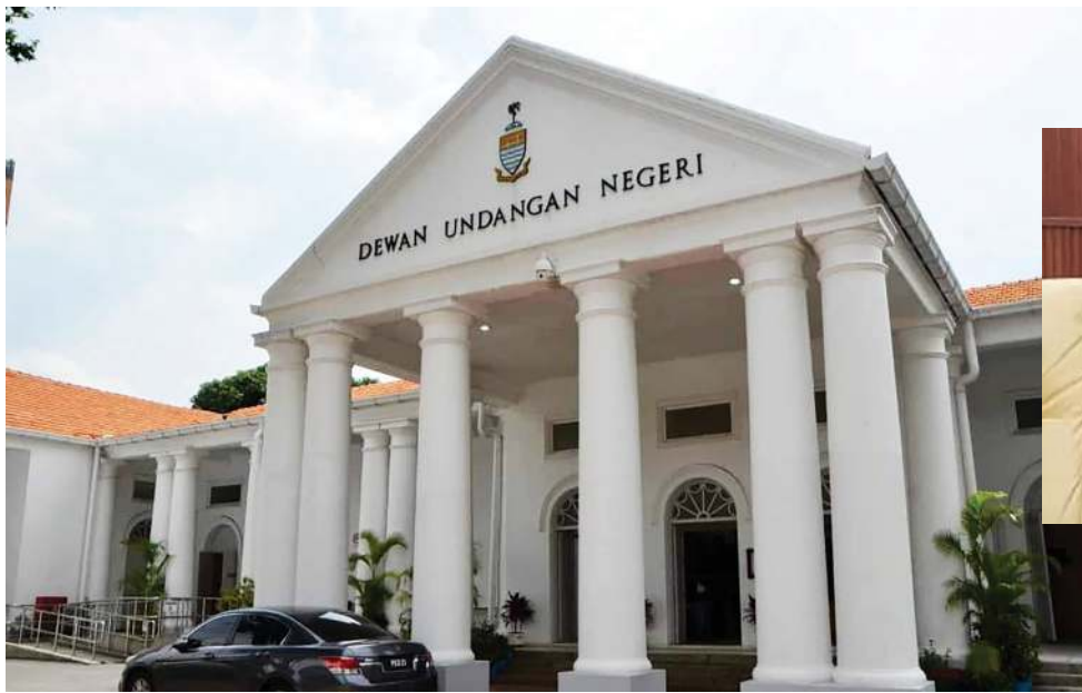
பிளாங்கு மாநில சட்டமன்றம்.

கோவிட்-19 தொற்றுநோய் தாக்கம் இன்னும் மக்களின் வாழ்வாதாரத்தைப் பாதித்து, பொது சுகாதாரத்திற்குப் பெரும் சவால்களை ஏற்படுத்துவதால், பிளாங்கு சட்டமன்ற உறுப்பினர்கள், பங்குதாரர்கள் மற்றும் பொது மக்கள் அடுத்த ஆண்டுக்கான வரவு செலவு திட்டம் 'நலமிக்க' திட்டமாக தாக்கல் செய்யப்படும் என எதிர்பார்க்கிறார்கள்.