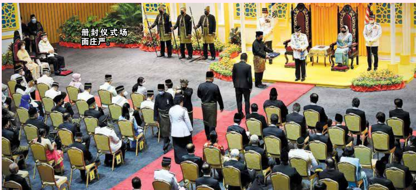
册封仪式场面庄严。