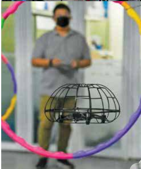
馆内设立了无人机训练场地，让有兴趣的民众体验操控无人机。