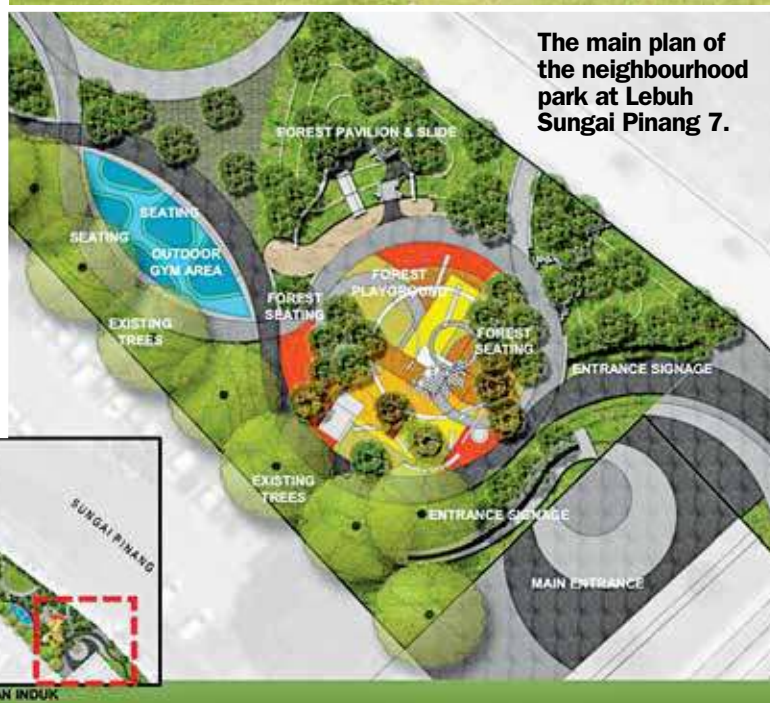
The main plan of the neighbourhood park at Lebuah Sungai Pinang 7.