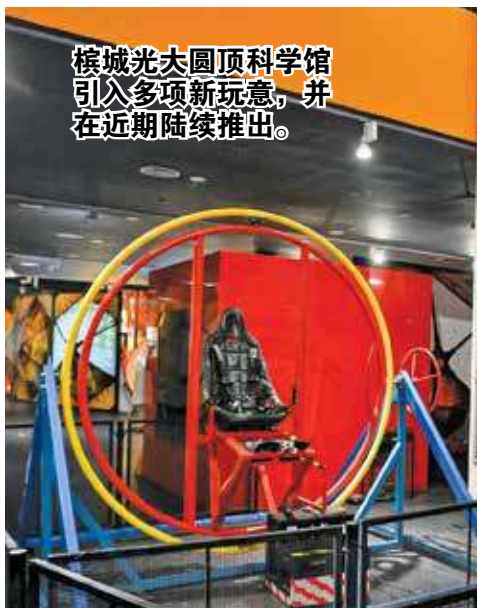
槟城光大圆顶科学馆引入多项新玩意，并在近期陆续推出。