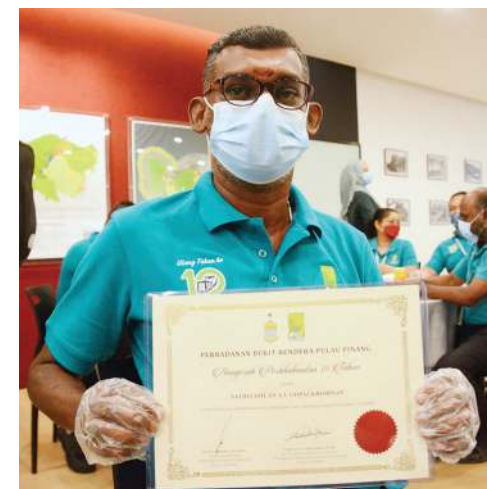
கொடிமலை ஊழியர் தனது விருதை காண்பிக்கிறார்.

இந்நிகழ்ச்சியில் 10 ஆண்டுகால சேவை விருதைத் தவிர, தொற்றுநோய் காலத்தில் பிளாங்கு மலை சீராக இயங்குவதை உறுதிசெய்வதில் சேவையாற்றிய பி.எச்.சி ஊழியர்களுக்கு சிறப்பு விருதுகளும் வழங்கப்பட்டன.