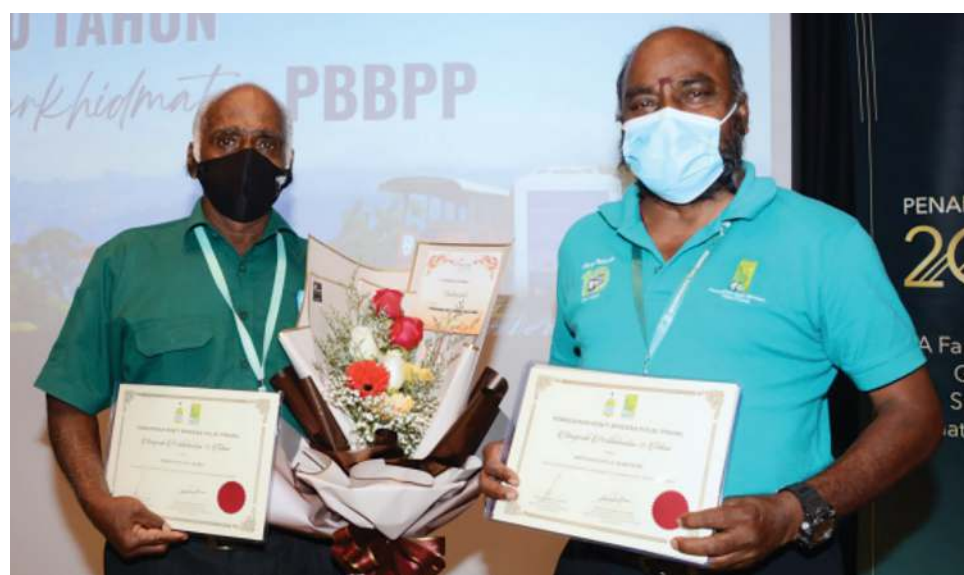
நீண்ட கால சேவைக்கு விருது பெற்ற கொடிமலை ஊழியர்கள் மகிழ்ச்சியுடன் காணப்படுகின்றனர்.