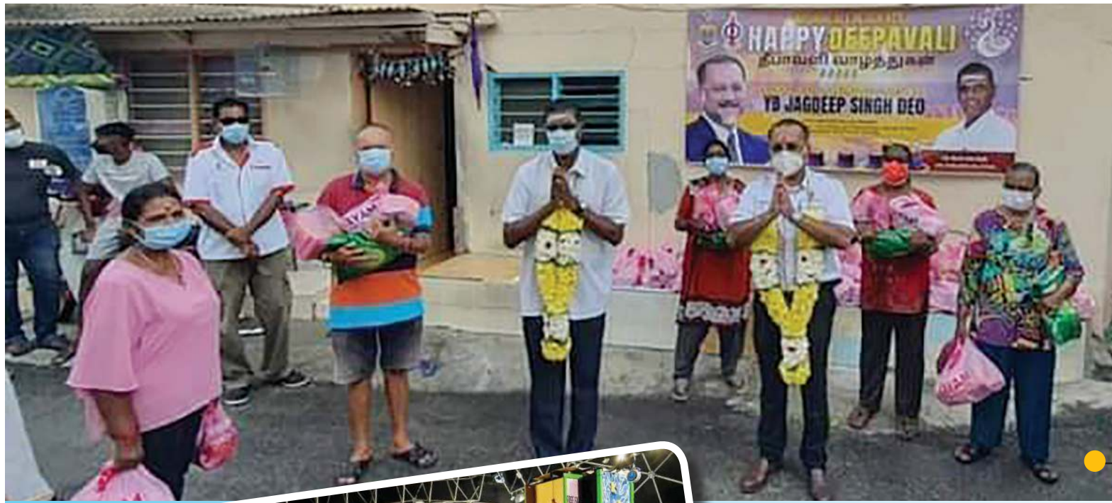
நாடாளுமன்ற உறுப்பினர் ஆர்.எஸ்.என் இராயர் மற்றும் ஆட்சிக்கு உறுப்பினர் ஜெகதீப் சிங் டியோ தீபாவளிக் கொண்டாட்டத்தை முன்னிட்டு ஜெலுத்தோங் வட்டார பொது மக்களுக்கு உணவுக்கூடைகள் வழங்கினர்.