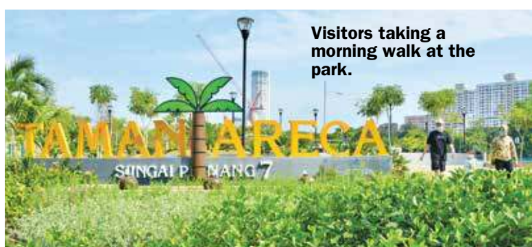
Visitors taking a morning walk at the park.

Other components include Silver Garden, Butterfly Garden, Family Square, Outdoor Fitness Station and Children Playground.