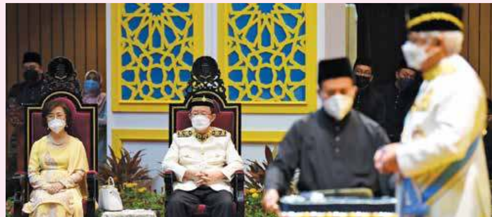
槟州首长曹观友与夫人陈莲枝出席观礼。