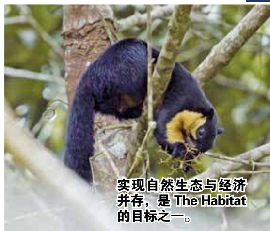
实现自然生态与经济并存，是The Habitat的目标之一。