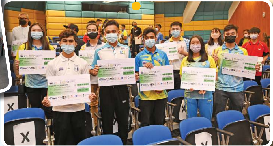
பிணங்கு தடகள தொழில் கல்வி (PACE) திட்டத்தின் மூலம், 62 மாநில விளையாட்டு வீரர்கள் மாதிரி காசோலையை பெற்றுக் கொண்டனர்.