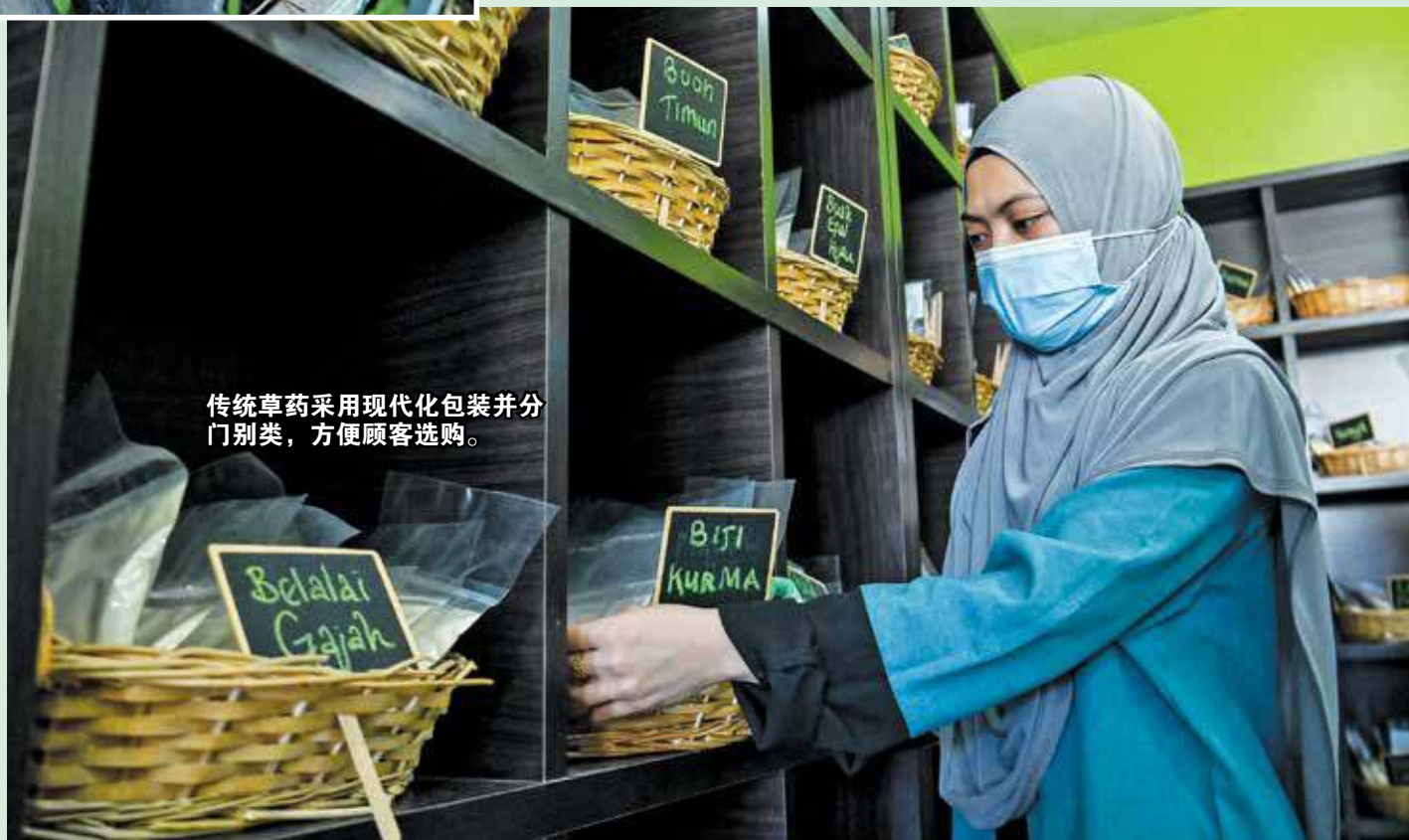
传统草药采用现代化包装并分门别类，方便顾客选购。

他说，其实威北区内有许多生态旅游景点可供发掘，该中心在整合这些旅游资源后，将通过网站及应用程序，为加入计划的商家进行推广。