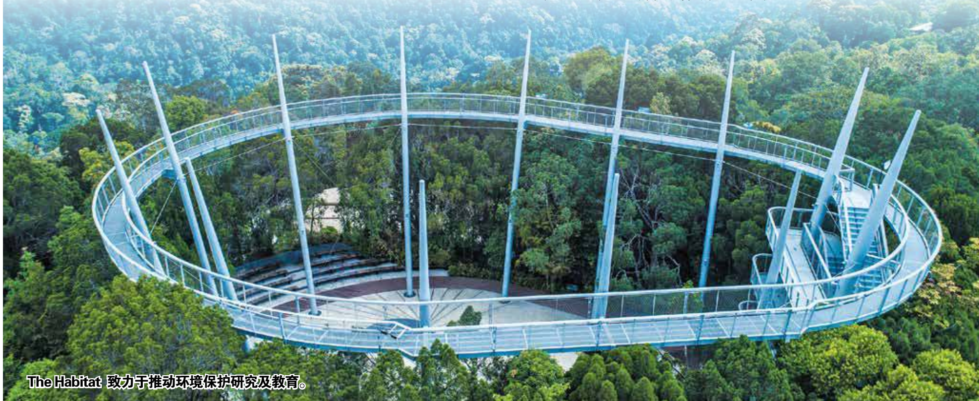
The Habitat 致力于推动环境保护研究及教育。

他补充，科克雷尔家族创办The Habitat是为回馈槟城及社区，致力于推动环境保护研究及教育，这也是The Habitat参与升旗山申请UNESCO生物圈保护区的初衷。