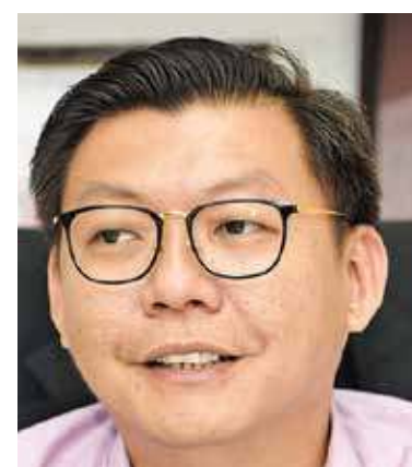
Teh: Request made for increased patrols.

"They are also aggressive towards other people, causing a nuisance especially to women who want to use the toilet. Some are also involved in vandalism and other undesirable activities.