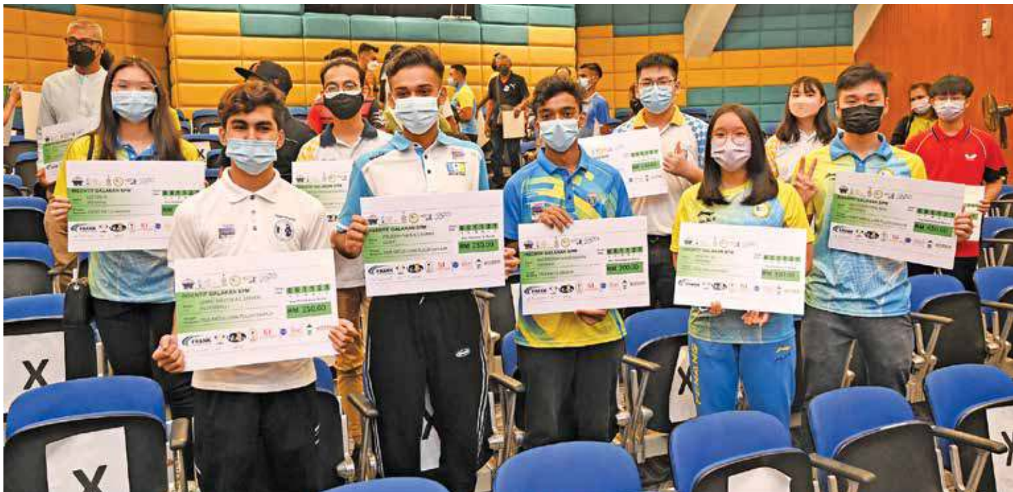
获得“激励奖掖”的学生持着模拟支票欣喜合照。

20名运动员获得一次性高等教育机构 (IPT) 教育奖励金, 总拨款为1万7100吉。因此, PACE 计划中的高等教育机构教育奖励金至今总共有46名运动员受惠。