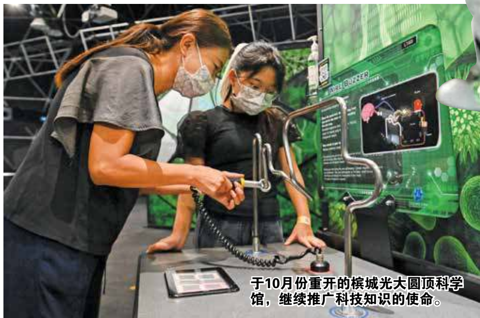
于10月份重开的槟城光大圆顶科学馆，继续推广科技知识的使命。