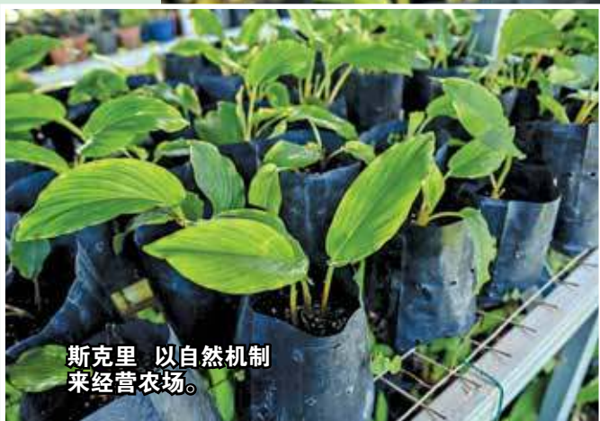
斯克里以自然机制来经营农场。