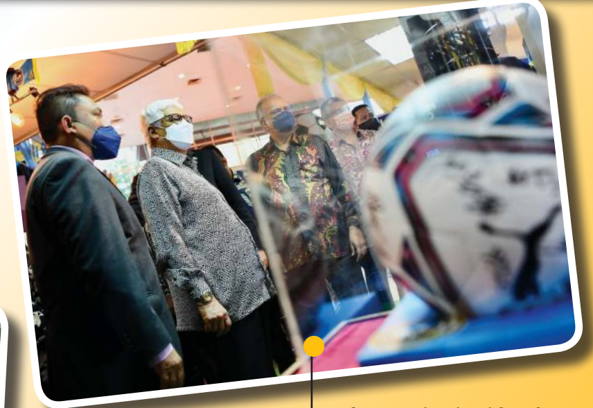
மாநில ஆளுநர் துன் டத்தோஸ் உத்தாமா துன் அஹ்மத் ஃபுஸி அப்துல் ரசாக் மற்றும் பேராசிரியர் ப.இராமசாமி ஆகியோர் பிணங்கு பொது நூலகக் கழகம் (PPAPP) மற்றும் பிணங்கு காற்பந்து சங்கம் (FAP) நிறுவப்பட்ட 100வது ஆண்டு விழாவை முன்னிட்டு நடத்தப்பட்ட கண்காட்சியில் கலந்து கொண்டனர்.