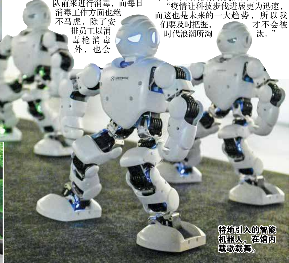
特地引入的智能机器人，在馆内载歌载舞。

“疫情让科技步伐进展更为迅速，而这也是未来的一大趋势，所以我们要及时把握，时代浪潮所淘汰。”