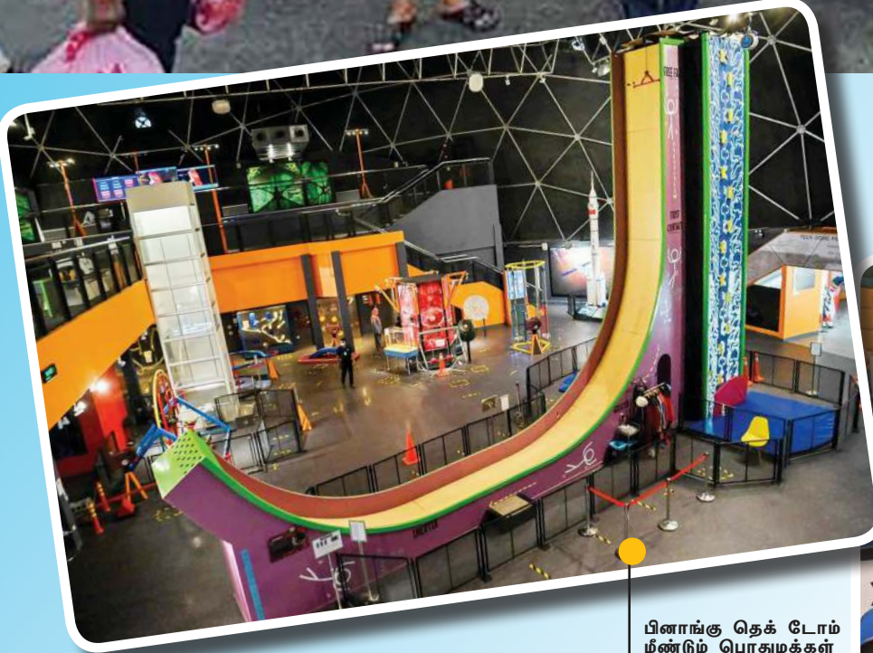
பிணங்கு தெக் டோம் மீண்டும் பொதுமக்கள் பயன்பாட்டுக்குத் திறக்கப்பட்டுள்ளது.