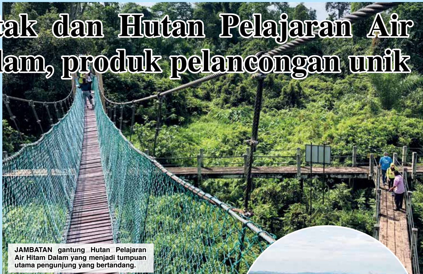
JAMBATAN gantung Hutan Pelajaran Air Hitam Dalam yang menjadi tumpuan utama pengunjung yang bertandang.