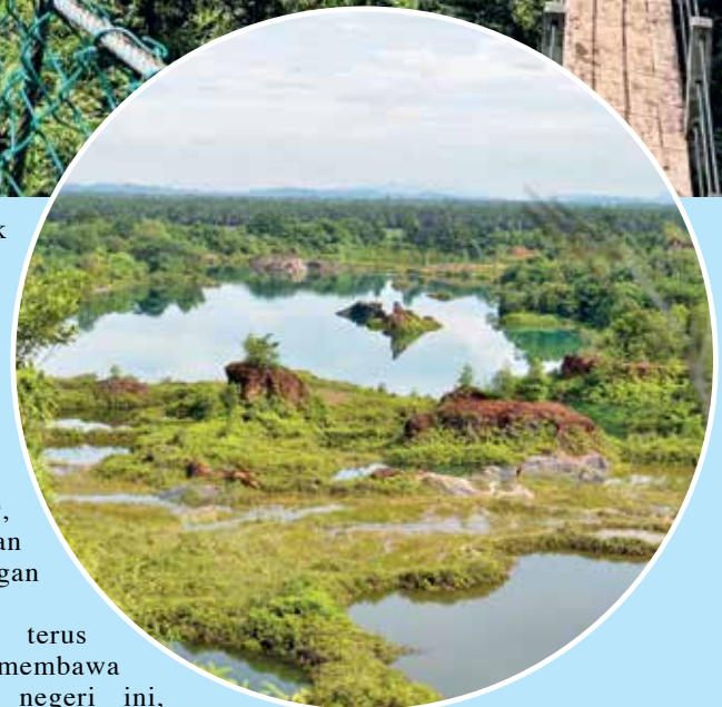
KEUNIKAN Bukit Katak yang sentiasa mencuri tumpuan pengunjung dari serata tempat.

"Oleh itu, kita akan terus memberi tumpuan untuk membawa pelancong domestik ke negeri ini, dengan mempromosikan lagi produk-produk pelancongan yang hanya ada di negeri ini sahaja.