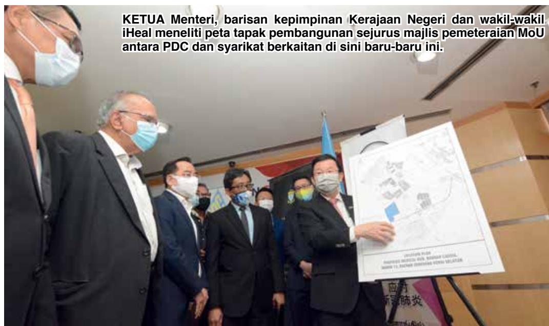
KETUA Menteri, barisan kepimpinan Kerajaan Negeri dan wakil-wakil iHeal meneliti peta tapak pembangunan sejurus majlis pemeteraian MoU antara PDC dan syarikat berkaitan di sini baru-baru ini.

dilakukan sebelum mereka (iHeal) memuktamadkan cadangan proposal akhir.