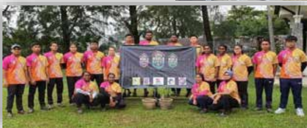
Barisan Pasukan Memanah Negeri Pulau Pinang