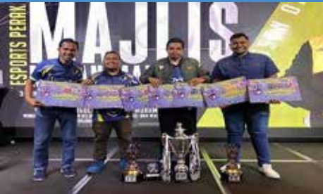
Pemenang-pemenang dari Pasukan Sukan Elektronik Pulau Pinang