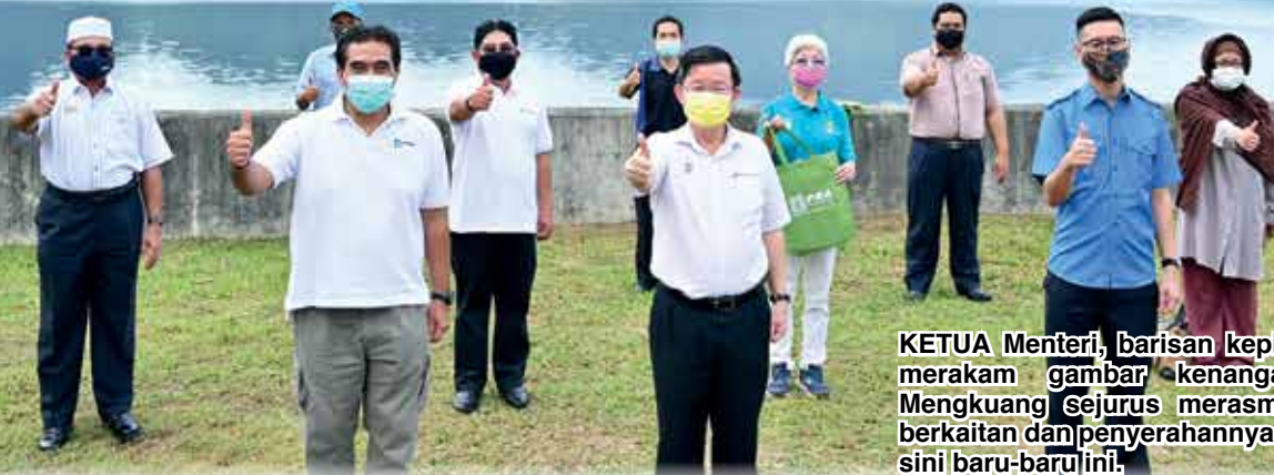
KETUA Menteri, barisan kepimpinan Kerajaan Negeri dan PBAPP merakam gambar kenangan berlatarbelakangkan Empangan Mengkuang sejurus merasmikan pembukaan semula empangan berkaitan dan penyerahannya kepada operator bertanggungjawab di sini baru-baru ini.

Oleh: SUNARTI YUSOFF