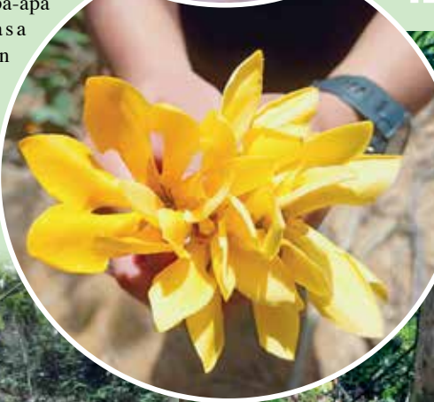
PELBAGAI jenis flora yang dapat dijejaki.