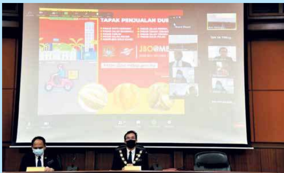
槟岛市长尤端祥（右）在市厅例常会议上宣布利民政策，左为槟州市厅秘书安南。

他也呼吁贩商们，在这疫情时刻，因随时做好准备将生意转为线上平台，接受与适应新常态，而不是只在档口前苦等客人上门。