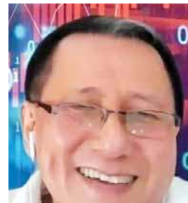
Yeoh: Hopes more people adopt cashless payments.

technologist, said the pandemic has changed the landscape of society.