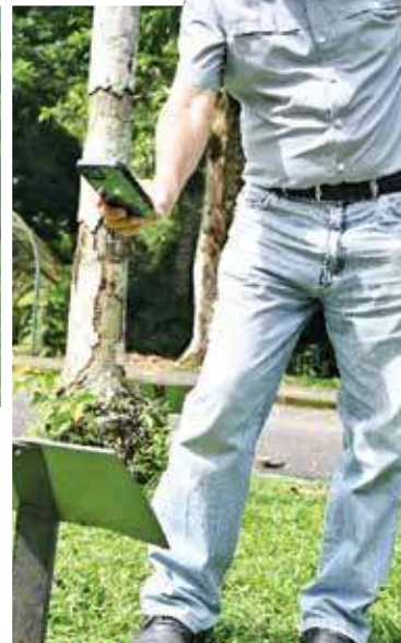
Saw scanning one of the QR code labels that would then flash information about that particular plant.

of the best natural amenities that even words wouldn't be able to describe the feeling.