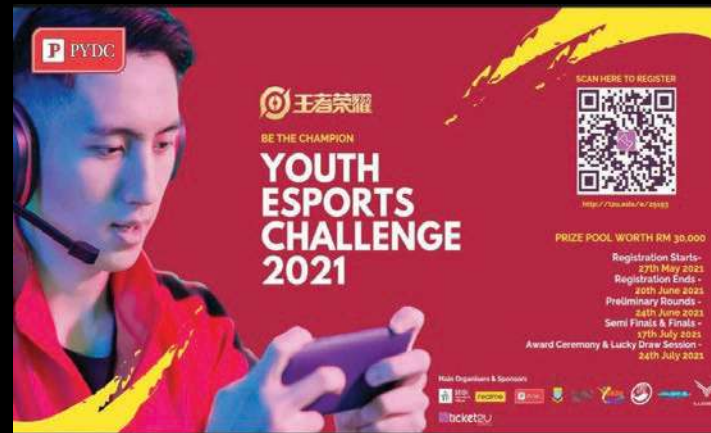
மின் விளையாட்டு போட்டி பிரச்சூரம்.