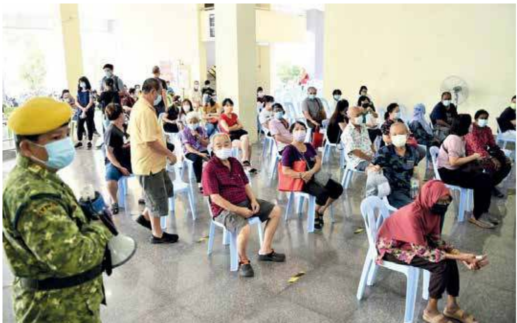
民众踊跃前往诗布朗再也SP Arena会展中心接种。

“我们目前每日可为民施打约1400剂疫苗，希望在7月杪可达到每日接种2000剂疫苗的目标。”