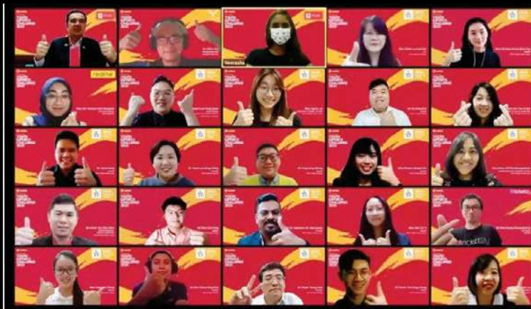
ஜூம் வழியாக நடைபெற்ற மெய்நிகர் வெளியீட்டு விழாவின் போது கலந்து கொண்ட பங்கேற்பாளர்கள்.

பிளாங்கு இளைஞர் மேம்பாட்டுக் கழகம் (பி.ஓய்.டி.சி) ஏற்பாட்டில் 2021 இளைஞர் மின் விளையாட்டு சவால் போட்டி அதிகாரப்பூர்வ துவக்க விழாக் கண்டது.