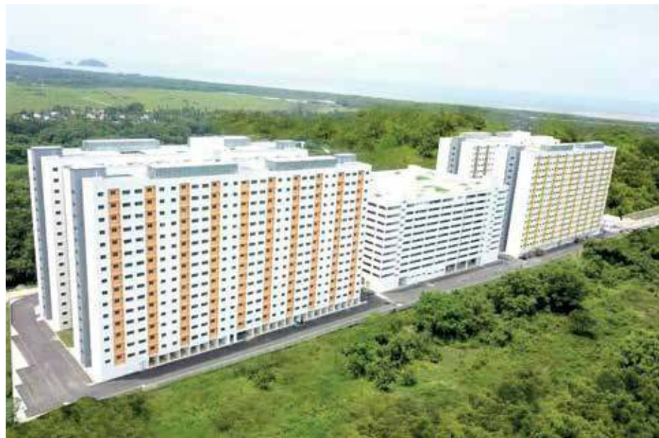
佳日星：尽管目前疫情严重，但州政府依然关注人民的房屋问题。