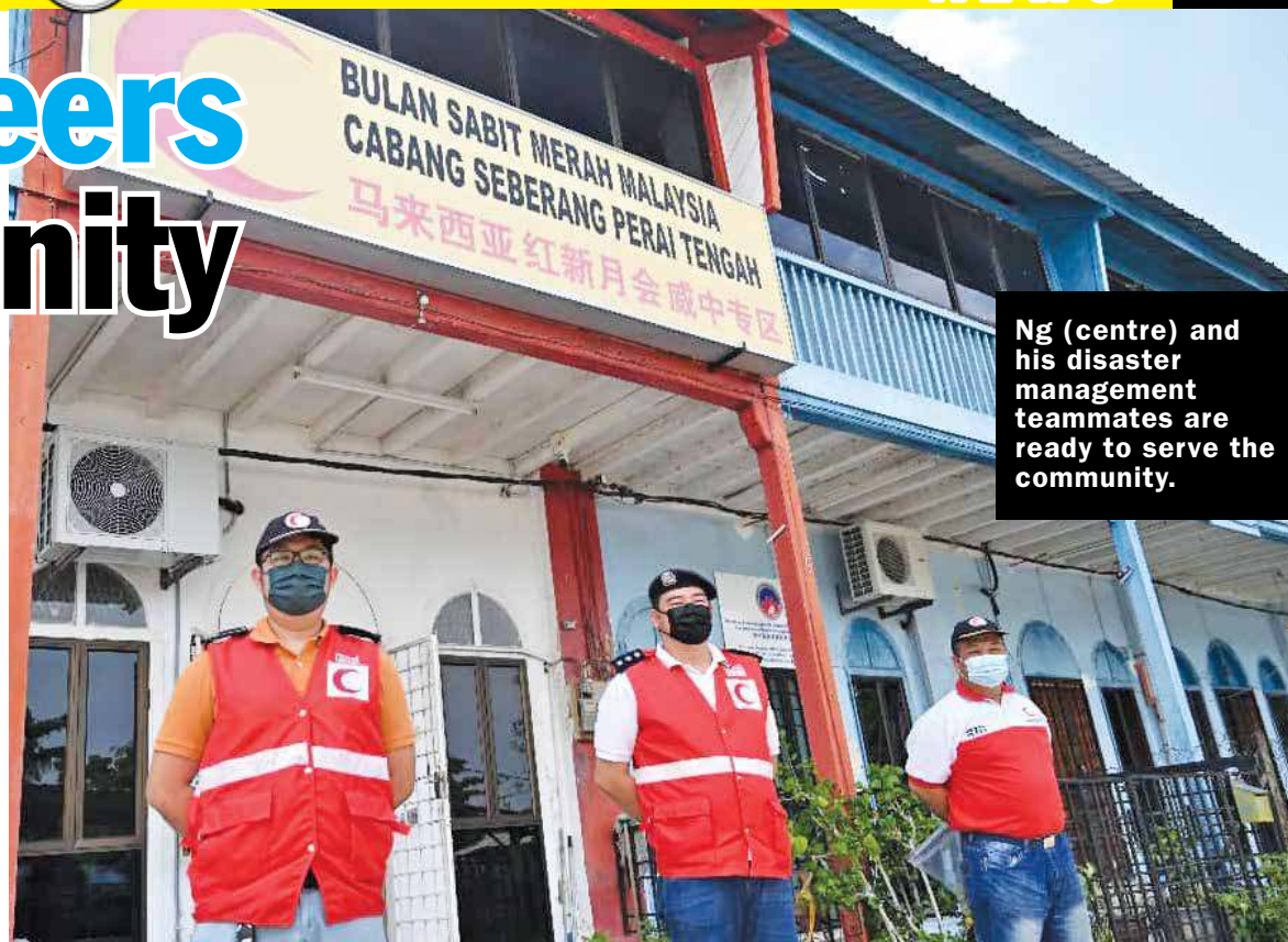
Ng (centre) and his disaster management teammates are ready to serve the community.

“Our team also frequently gets in touch with the state representatives and MPKKs to provide aid to the people in our