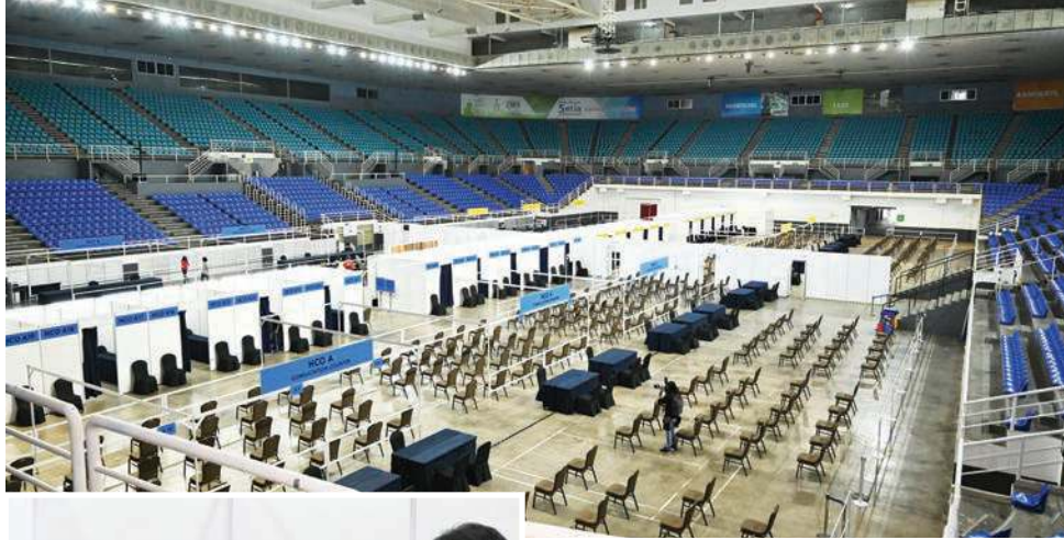
ஸ்பாய்ஸ் அரேனா தடுப்பூசி மையம்.

மேலும், பிணாங்கு மாநிலத்தில் வருகின்ற அக்டோபர் மாதத்திற்குள் சமூக நோய் எதிர்ப்பு சக்தி இலக்கை அடையும் நோக்கத்தில், கோவிட்-19 தேசிய தடுப்பூசி