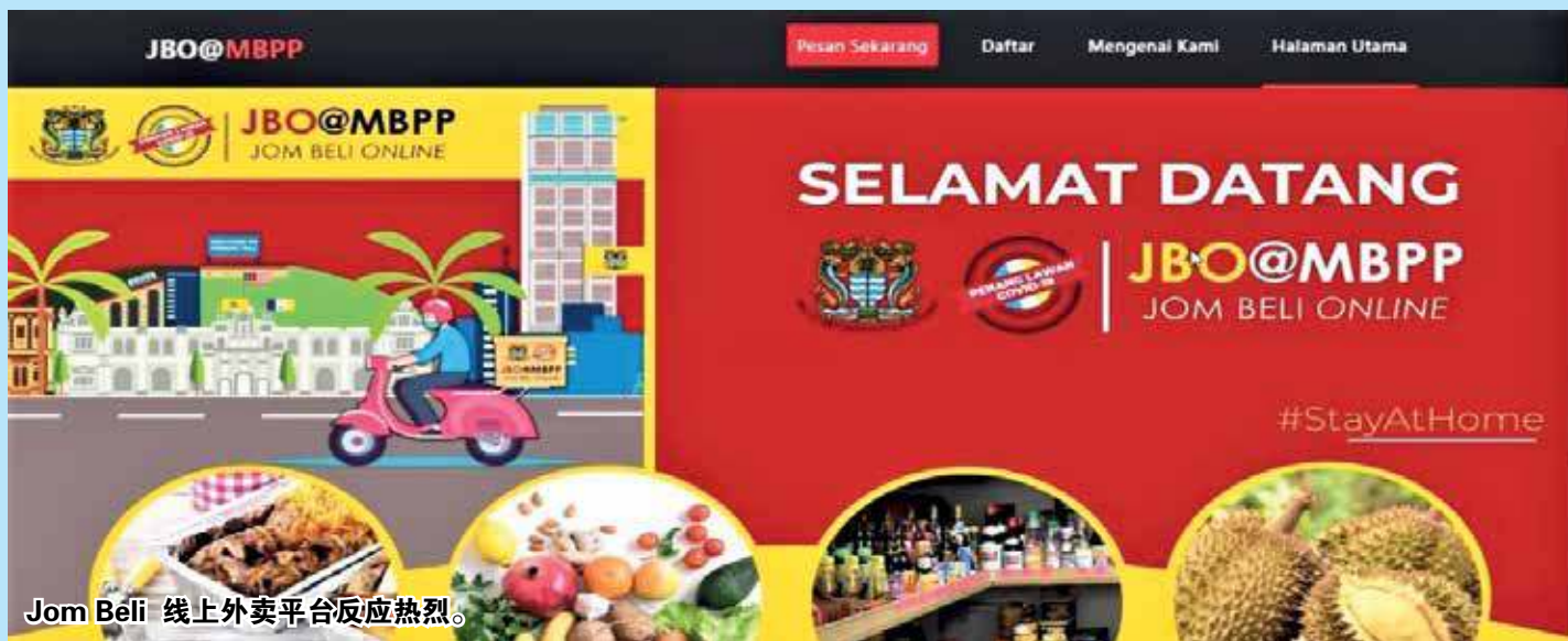
Jom Beli 线上外卖平台反应热烈。

“6月开始是榴莲季节的高峰期，贩商们的反应都很积极，他们都对线上外卖平台感到满意，一些产品甚至出