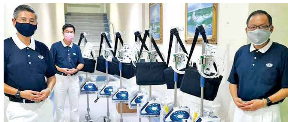
Khoo (left) and Tzu-Chi volunteers delivering the myAIRVO 2 units to the Penang Hospital.