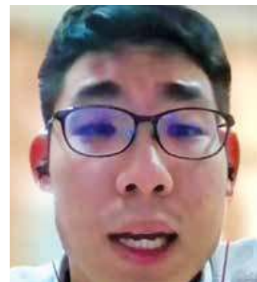
Choy: Lack of awareness among rural folk.