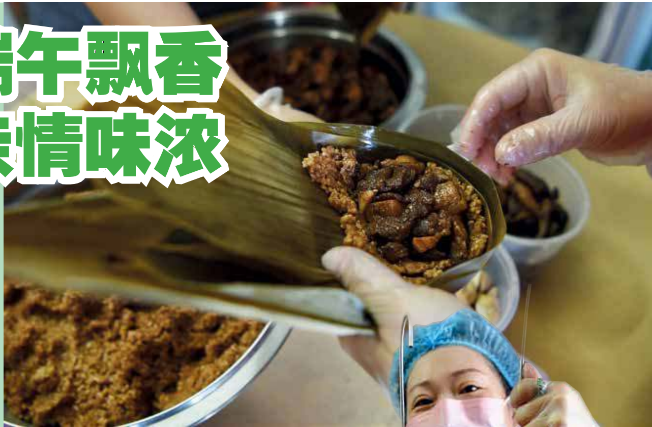
除了选材谨慎之外，肉粽的馅料比例亦拿捏好，务求每颗粽子都给足馅料。

“传统肉粽要做到好吃，就必须用心去做，除了选材谨慎之外，肉粽的馅料比例也必须拿捏好，每颗粽子都必须给足馅料。”