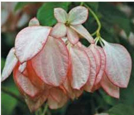
Mussaenda philippica 'Calcutta'.