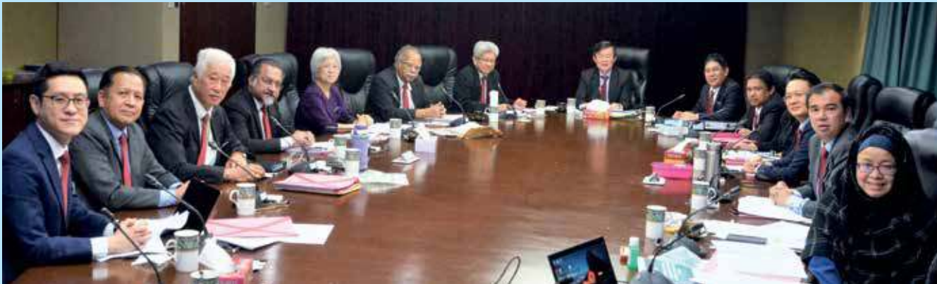
全体行政议员捐薪水抗疫！（档案照）