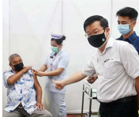
மாநில முதல்வர் மேதகு சாவ் கொன் யாவ் தடுப்பூசி பெறுநர்களை நேரில் சென்று பார்த்து ஊக்கமளித்தார்.