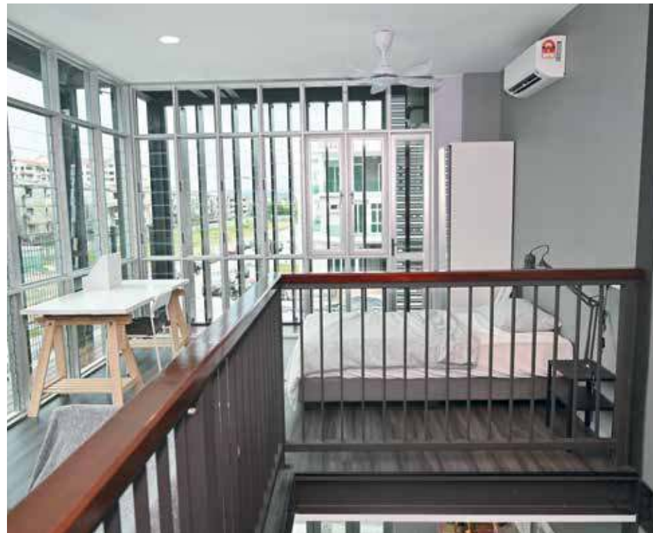
IBS系统能够有效缩短工期和减少工人支出，进而减低建筑成本。

使用现代化工业建筑系统（IBS），Slim Haus启动可负担房屋计划，三层式800平方尺的房屋最低只售25万令吉。