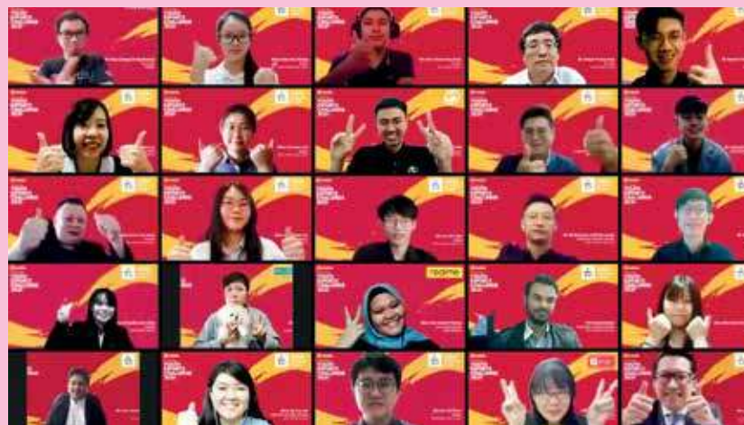
青年电子竞技挑战赛线上推展礼反应热烈。