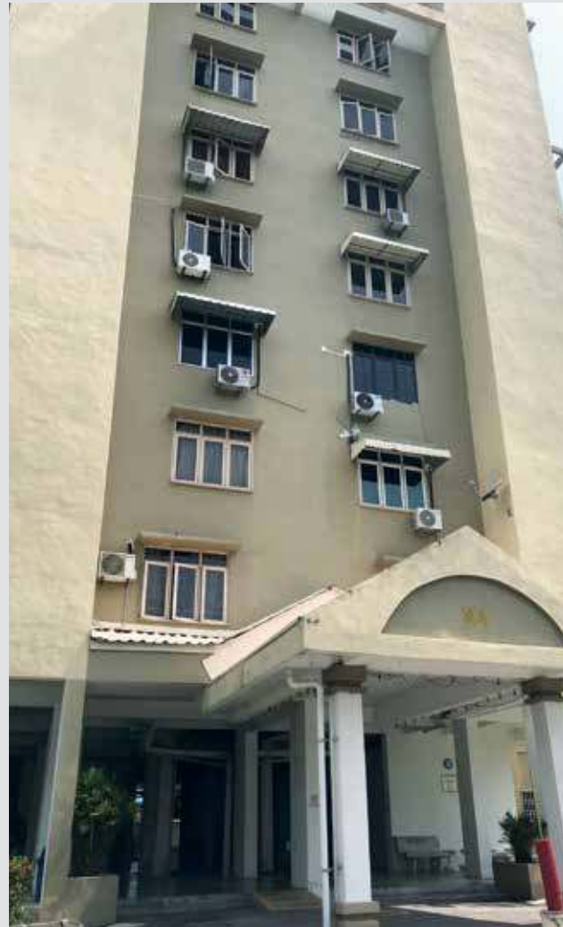
峇央峇鲁玛苏里组屋重建计划，将会是首个进行重建的项目。