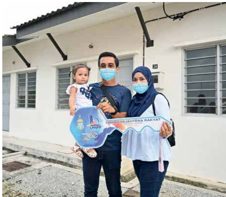
一家三口准备住进温馨家园。

位于威南的Taman Sejahtera Rakyat，共兴建了41个单层排屋单位，每个单位售价7万2500令吉，购屋者只需支付一个月300令吉租金，15年后有关单位将归后者所有。