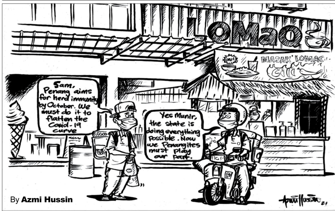
By Azmi Hussin

Separately, after having seen it all, 65-year-old Saw's next vision in life is not small, but truly ambitious as the Taiping boy has now set his sights on broadening his knowledge on palm trees and to conclude the study with a thorough documentation.