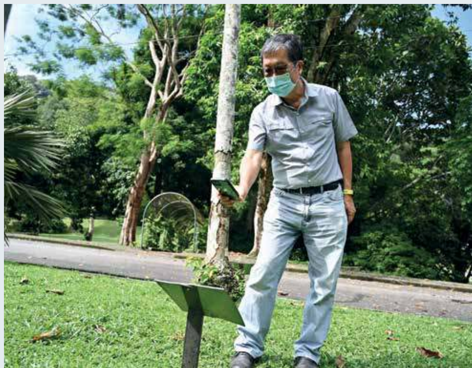
苏另源希望民众来到植物园时，可扫描二维码多了解植物。

提及植物园未来发展时，苏博士建议在园里的中心地段建“空中走道”及观景台，让人们可从高处欣赏植物园全景，相信可成为游客打