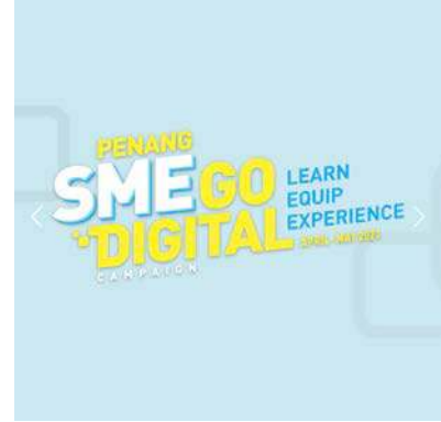
பிளாங்கு மாநில சிறு மற்றும் நடுத்தர நிறுவனங்களுக்காக ரொக்கமற்ற பரிவர்த்தனை பிரச்சூரம்.