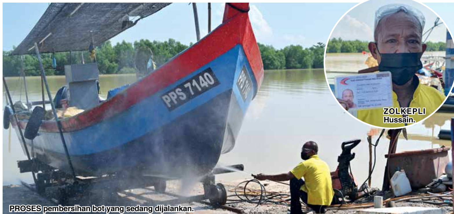
PROSES pembersihan bot yang sedang dijalankan.

“Saya juga mahu membeli pengukus elektrik bagi memudahkan pekerja kerana pengukus yang ada sekarang perlu dikendalikan secara manual dan memakan masa agak lama,” katanya yang dibantu oleh empat orang tenaga kerja.