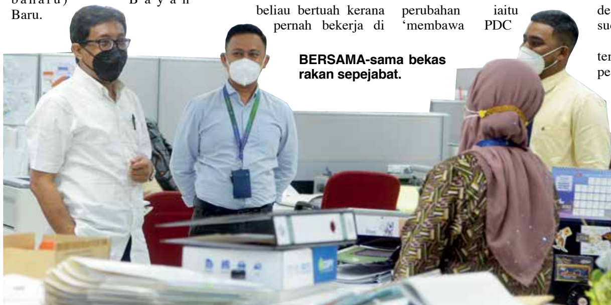
BERSAMA-sama bekas rakan sepejabat.