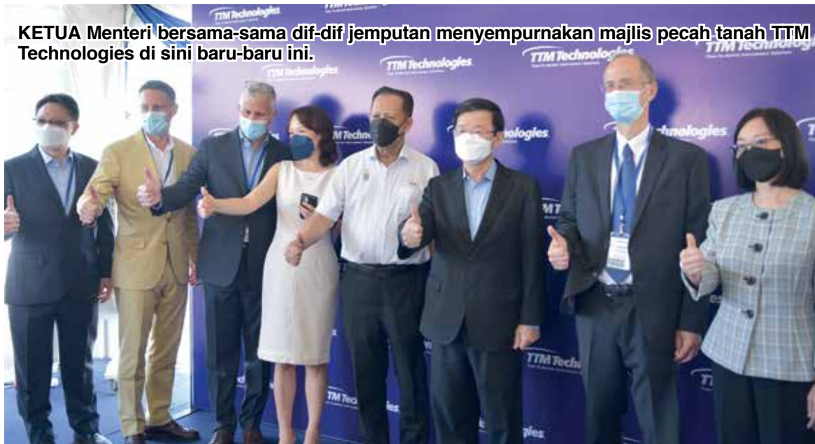
KETUA Menteri bersama-sama dif-dif jemputan menyempurnakan majlis pecah tanah TTM Technologies di sini baru-baru ini.

pada sidang media selepas majlis pecah tanah di Penang Science Park , Simpang Ampat dekat sini 25 April lalu.