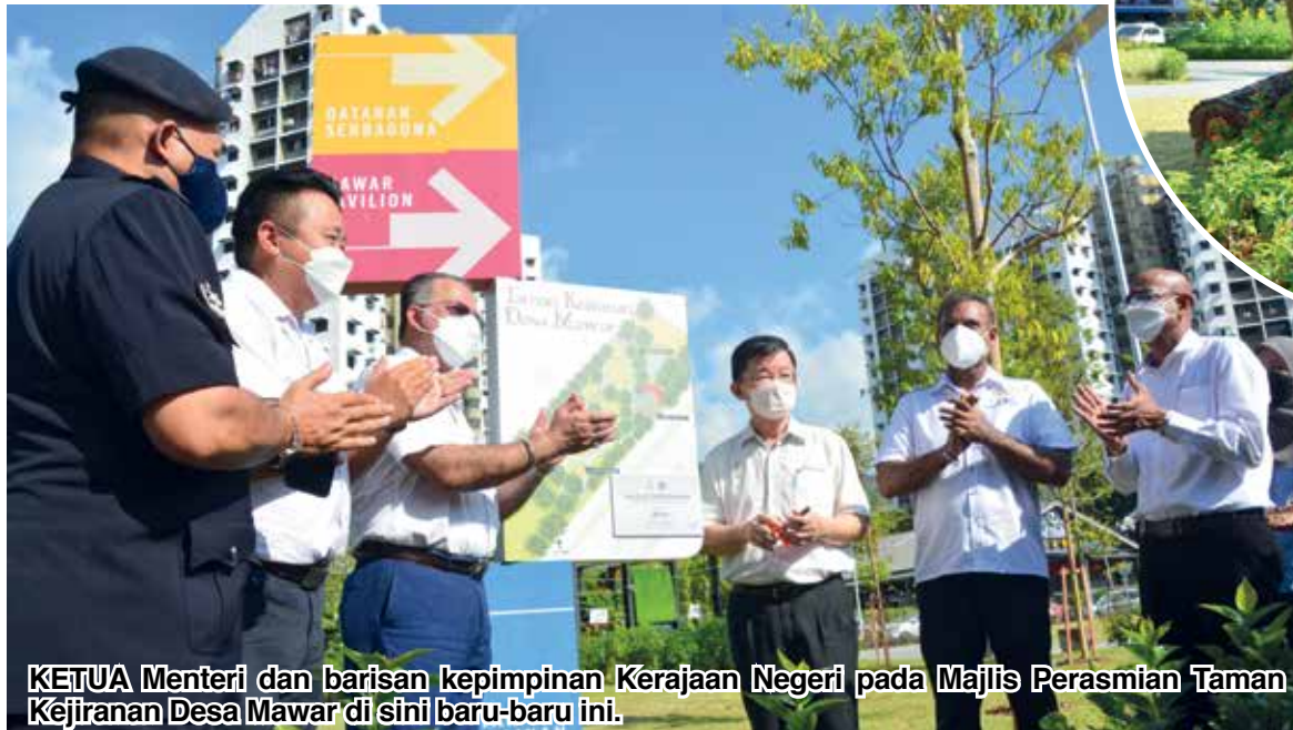
KETUA Menteri dan barisan kepimpinan Kerajaan Negeri pada Majlis Perasmian Taman Kejiranan Desa Mawar di sini baru-baru ini.

“Ini dibuktikan apabila jumlah keseluruhan pelaburan yang diluluskan ke Pulau Pinang pada tahun 2021 adalah