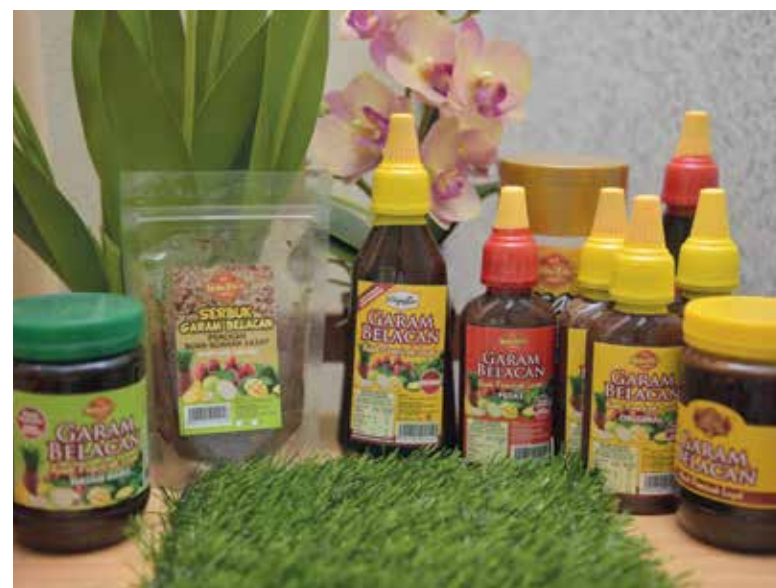
SEBAHAGIAN produk Mdm Zie’s.

Untuk maklumat lanjut boleh hubungi 016-507 7792 atau layari laman Facebook dan Instagram (Mdm Zie’s).