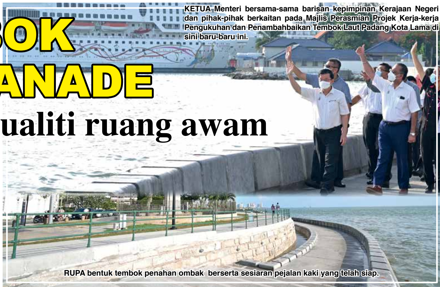
KETUA Menteri bersama-sama barisan kepimpinan Kerajaan Negeri dan pihak-pihak berkaitan pada Majlis Perasmian Projek Kerja-kerja Pengukuhan dan Penambahbaikan Tembok Laut Padang Kota Lama di sini baru-baru ini.

“Projek ini merupakan salah satu daripada 14 komponen projek di bawah Pelan Induk Pesisir Pantai Utara Pulau Pinang