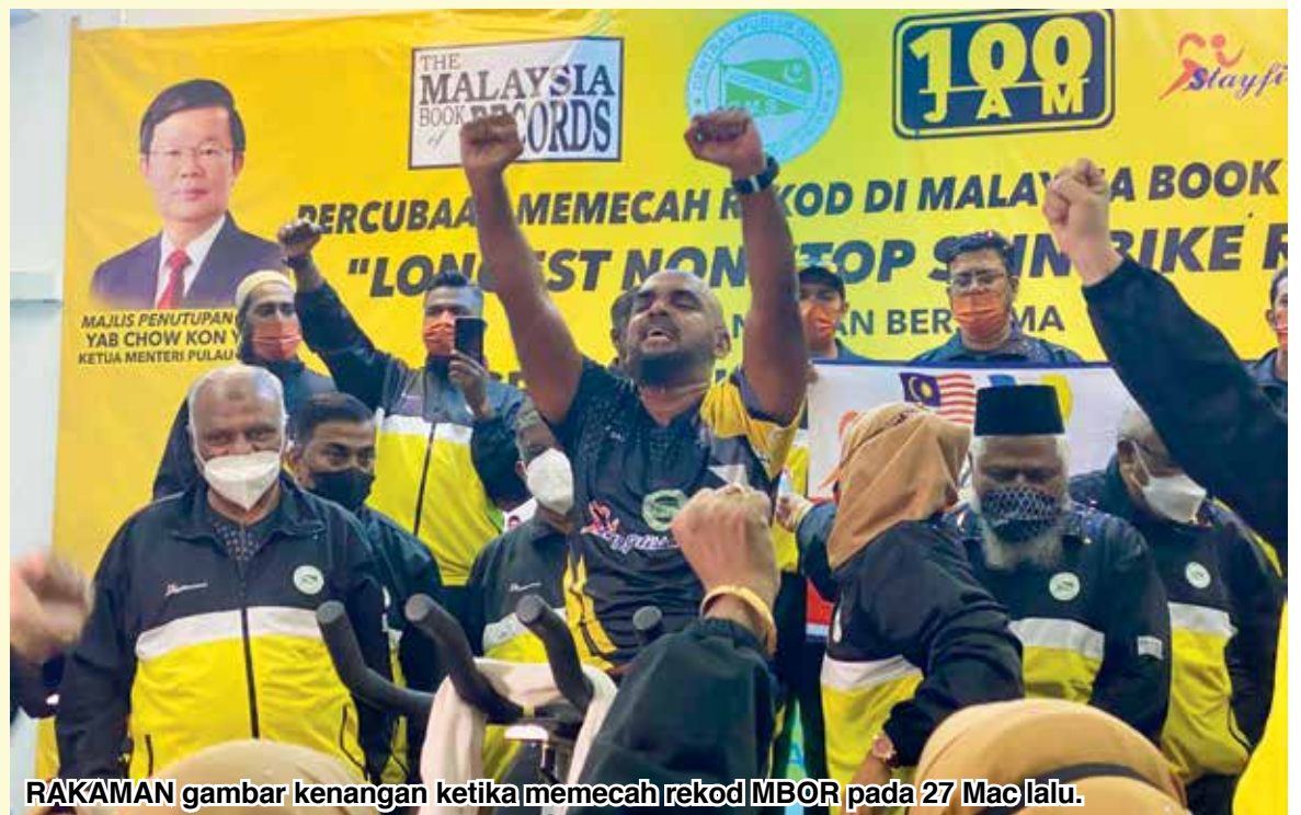
RAKAMAN gambar kenangan ketika memecah rekod MBOR pada 27 Mac lalu.

"Ia memang memematkan, tetapi kita dapat mencipta suasana yang terbaik untuk sihat di samping dapat mengikut amalan sunnah," tuturnya sambil menzahirkan ucapan terima kasih kepada semua pihak yang terlibat secara langsung dan tidak langsung.