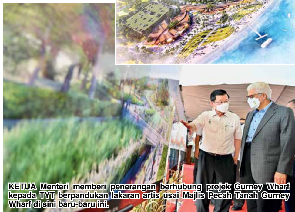
ILUSTRASI grafik projek pembangunan Gurney Wharf.

“Kedua-dua peringkat ini berjalan serentak dan dijangka siap sepenuhnya dalam tempoh 24 bulan selepas ini,” jelasnya yang berharap agar projek berkenaan dapat direalisasikan selepas