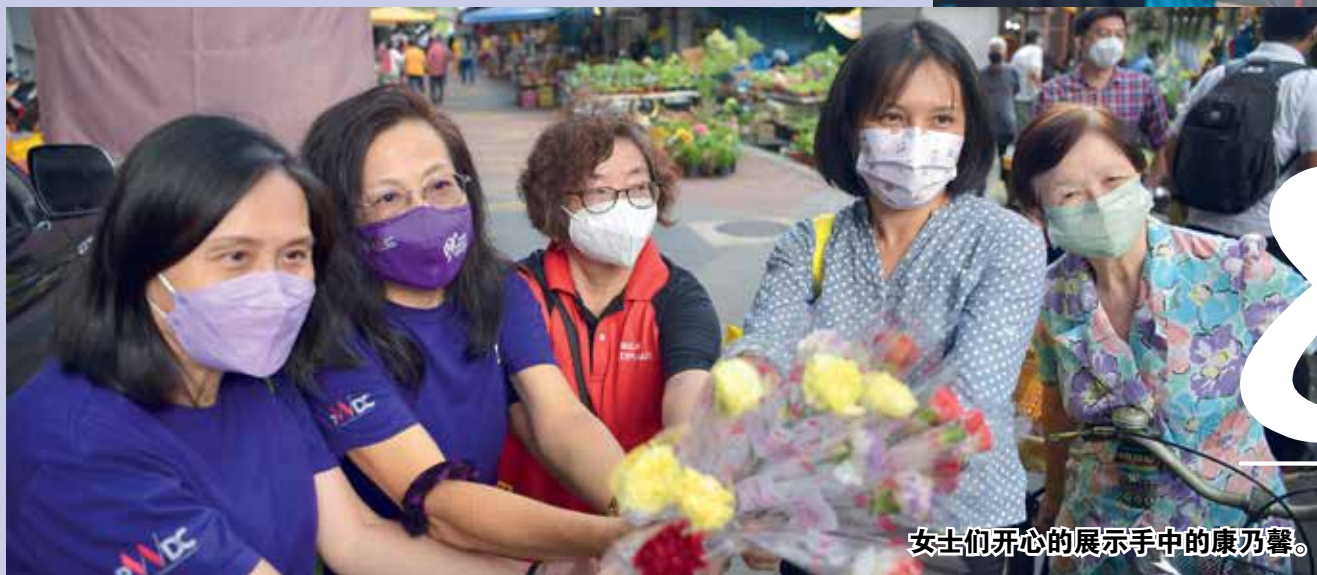
女士们开心的展示手中的康乃馨。