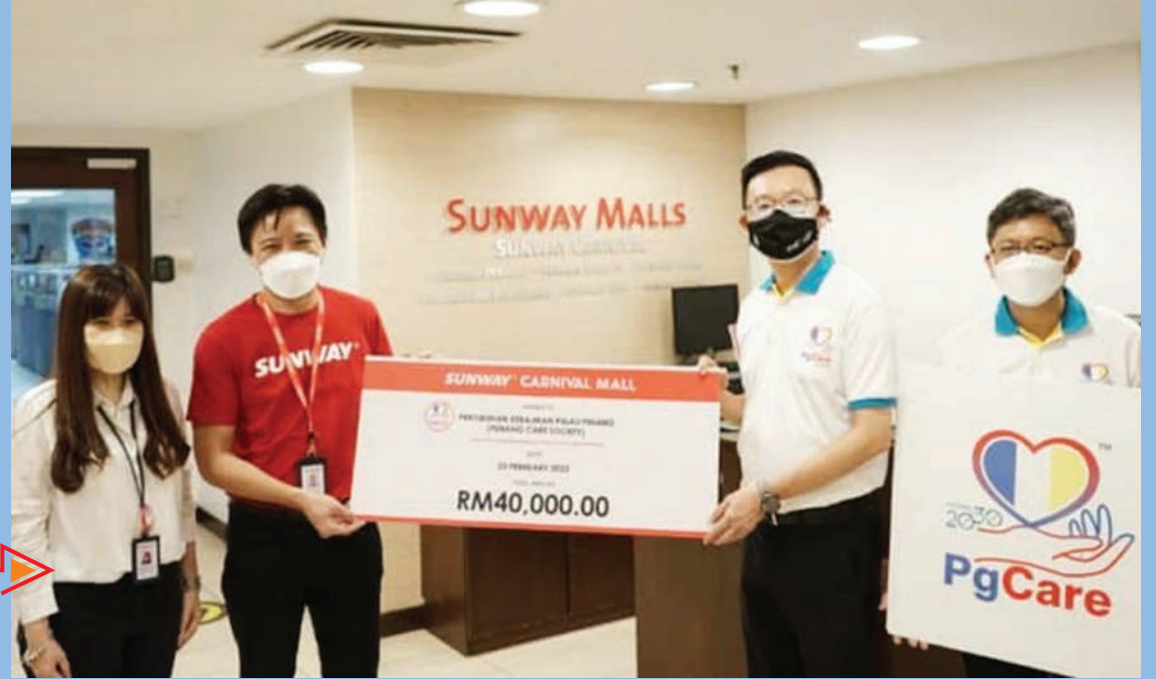
சன்வே கார்னிவல் பேராங்காடி தரப்பினர் கோவிட்-19 தொற்றுநோய் தாக்கத்தால் பாதிக்கப்பட்ட பொது மக்களுக்கு உதவும் நோக்கில் பிணங்கு சமூகநலன் அமைப்புக்கு (பி.எஸ்.சி) ரிம40,000 நிதியுதவி வழங்கியது.