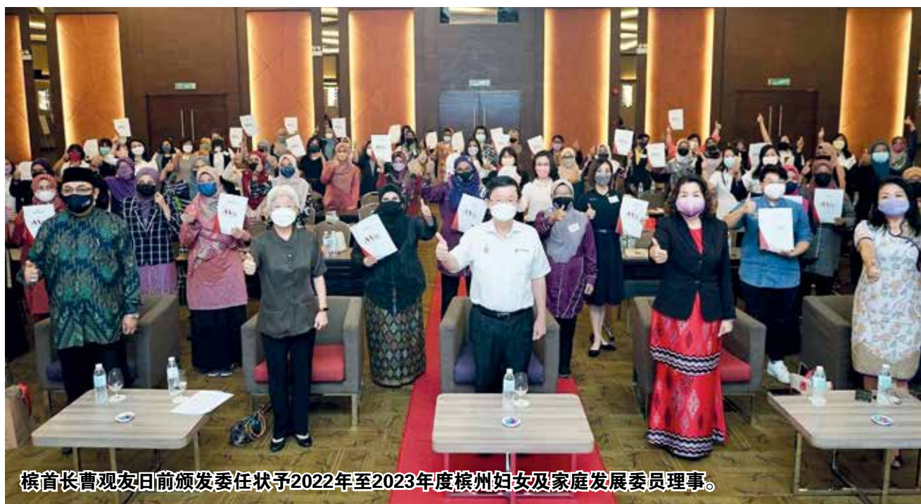
槟首长曹观友日前颁发委任状予2022年至2023年度槟州妇女及家庭发展委员理事。