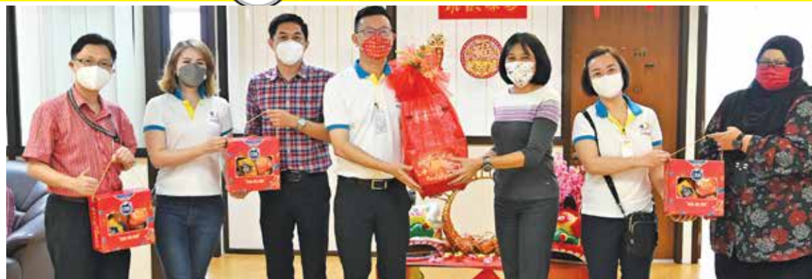
The team from PgCare Society with the Buletin Mutiara team in Komtar.