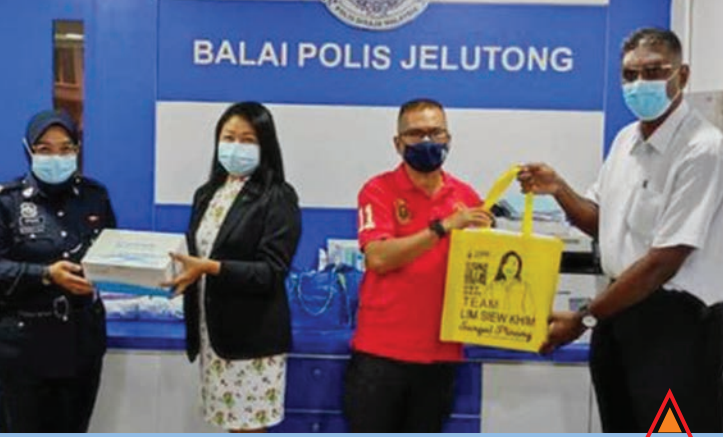
ஜெலுத்தோங் நாடாளுமன்ற உறுப்பினர் ஆர்.எஸ்.என் இராயர் மற்றும் சுங்கை பிணங்கு சட்டமன்ற உறுப்பினர் லிம் சியூ கிம் ஜெலுத்தோங் காவல் நிலைய அதிகாரிகளுக்கு கோவிட்-19 தொற்று பரிசோதனை கருவிகளை சன்மானமாக வழங்கினர்.