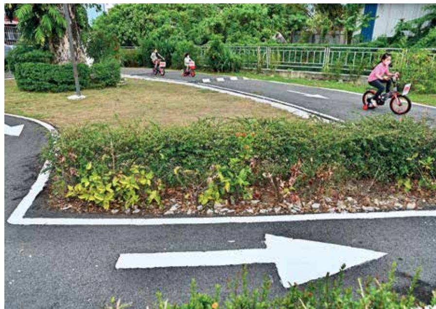
交通公园可让小孩子提早认识交通规则。

之后，学生发挥各自创意想法，以3D打印笔绘制。看着一个个平面图形变成立体的小灯笼，学生都感到非常开心，从中也可看到传统佳节及科技相融合之妙。