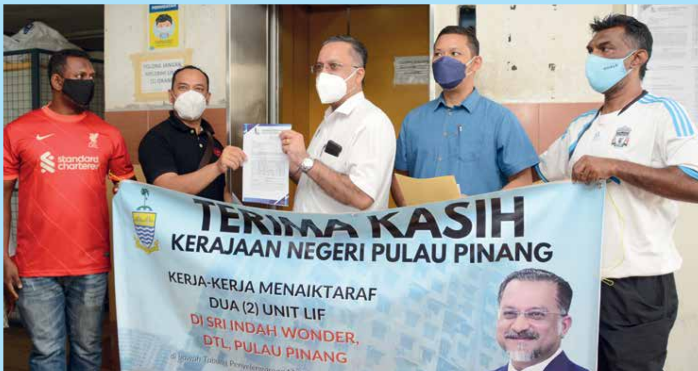
Sri Indah Wonder组屋居民代表感谢佳日星（中）协助拨款维修升降机。

槟州政府致力于为民打造舒适居住环境，从2008年至今年2月18日，拨出约2.9393亿令吉，为公共及私人组屋进行维修保养。