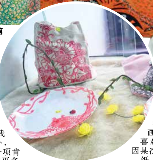
将禅绕图案画在碟子或包包上，另有一番别样艺术呈献。

“疫情两年来，都是禅绕画陪伴着我，我就把禅绕画当作生活的记录，尤其行动管制令及疫情严重当儿，我创作了《紧急呼唤》禅绕画，画出了