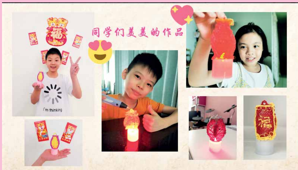
中山小学学生开心参与3D打印技术绘制灯笼。