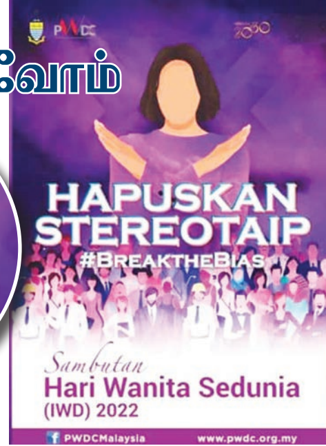
2022 ஆண்டுக்கான மகளிர் தினக் கொண்டாட்டப் பிரச்சாரம்.

"சிங்கப்பூர் (69.7 சதவீதம்) மற்றும் தாய்லாந்து (66.8 சதவீதம்) ஆகியவற்றுடன் ஒப்பிடுகையில், 2020ல் 55.3 சதவீத பெண் தொழிலாளர்கள் பங்கேற்பு விகிதத்தை மட்டுமே மலேசியா பதிவு செய்துள்ளது.