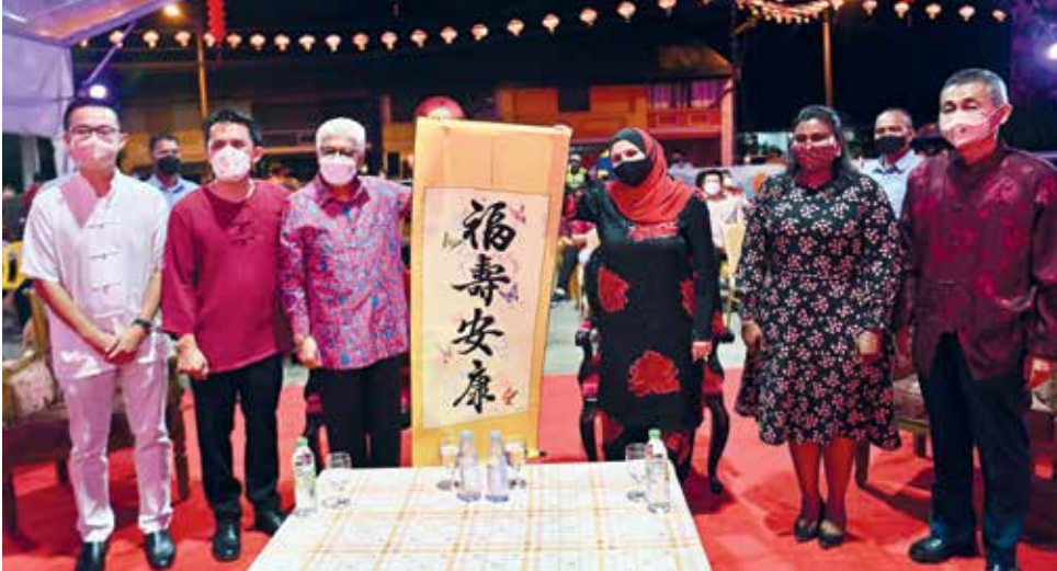
槟州元首敦阿末弗兹偕夫人杜潘卡蒂嘉在元宵庆典上点墨挥春，祝福人民福寿安康。

武吉淡汶区州议员吴俊益表示，上述年度节庆是槟州新年庆典的重头戏之一，在疫情之前的元宵节庆典活动，更是获得民众热烈参与。“疫情期间我们改为直播形式进行