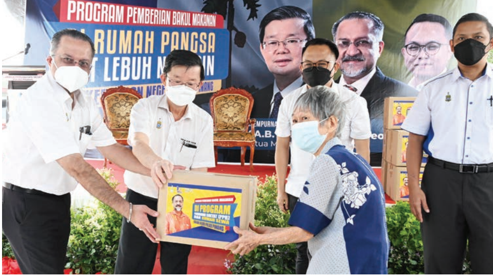
மாநில முதல்வர் மேதகு சாவ் கொன் இயோவ் பொது வீடமைப்புத் திட்ட குடியிருப்பாளர்களுக்கு உணவுக்கூடை எடுத்து வழங்கினார் (உடன் ஆட்சிக்குழு உறுப்பினர் ஜெக் டிப் சிங் டியோ).

தேர்ந்தெடுக்கப்பட்ட குடும்பங்களுக்கு 100 உணவுக்கூடைகள் கொடுக்கப்பட்டுள்ளன. இந்த சிறிய பங்களிப்பு அவர்களின்