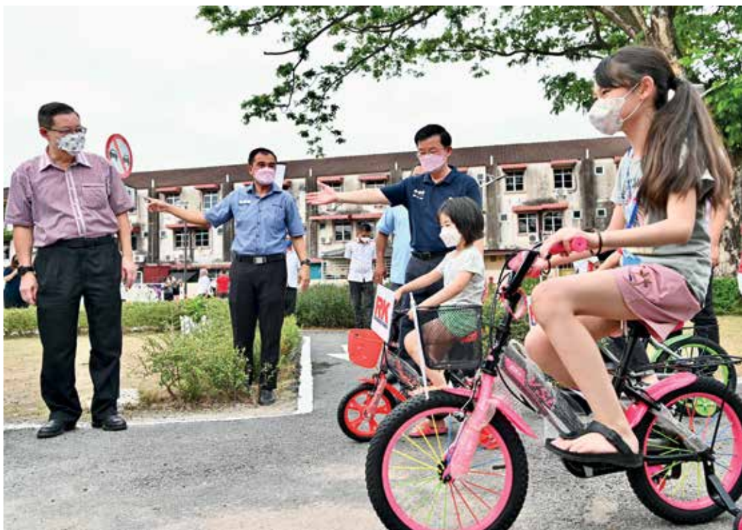
威北达丽雅花园交通公园开幕礼上，儿童开心踏脚车。左起林冠英、孙意志及曹观友。

首长是于日前为有关公园主持开幕。出席者包括威省市市长拿督阿兹哈及南亚有限公司执行董事拿督李添财等。