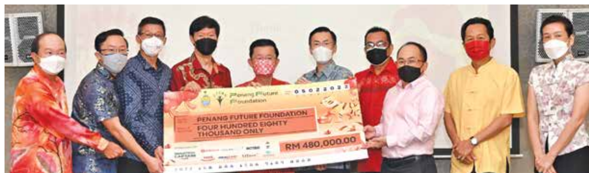
Representatives from OCBC Bank, Ideal Healthcare, Sky Resources, YBS Berhad, Solarvest Holdings Berhad, Hotayi Electronic, Vitrox Technologies and Menara Kerjaya Fasteners with a mock cheque for RM480,000 which they contributed to PFF.

"According to the Malaysia Healthcare Travel Industry Blueprint 2021-2025, Penang leads the way in healthcare travel revenue, earning RM750 million from 500,000 patients who flew to the state in 2019. Penang was named as the 'Most Established State in Healthcare Travel'," Chow added.