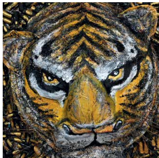
利用再循环物品包括纸皮箱、厕纸卷、毛线、布料等制作成的‘虎进甘来’作品。

他运用了细腻入微的绘画手法，将中国风以及逗趣卡通元素的老虎绘画在火柴盒上，这是他的强项，也是特色作品。