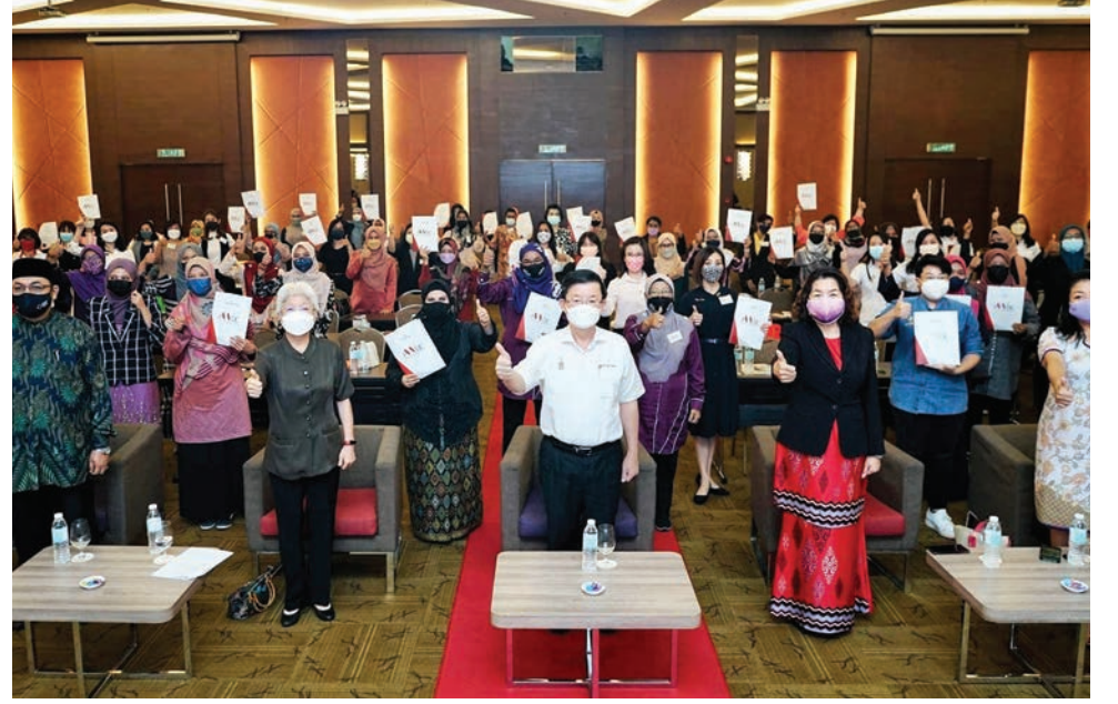
நியமனக் கடிதம் பெற்ற 40 JPWK குழுவினருடன் மாநில முதல்வர் மேதகு சாவ் கொன் இயோவ் (நடுவில்) மற்றும் பிரமுகர்கள்.

மட்டுமின்றி பெண்கள் மற்றும் குடும்ப முன்னேற்றத்திற்கு ஊன்றுகோளாகத் திகழ்வது பாராட்டக்குரியது.