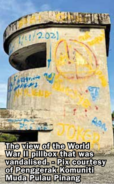
The view of the World War II pillbox that was vandalised.

The joint statement also added that both the youth groups cleaned up the abandoned pillbox on Feb 6.