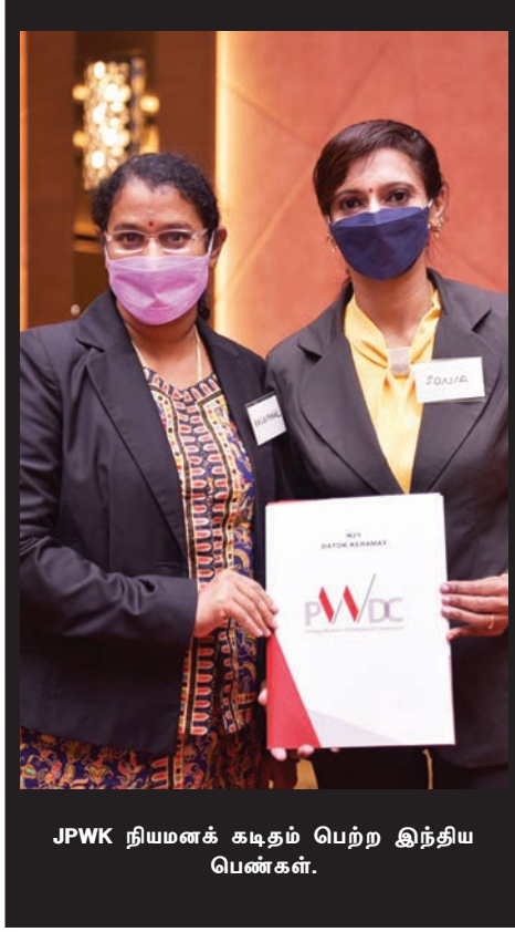
JPWK நியமனக் கடிதம் பெற்ற இந்திய பெண்கள்.

JPWK குழு, சமூக மேம்பாட்டுக்கு திட்டங்கள் செயல்படுத்துவது