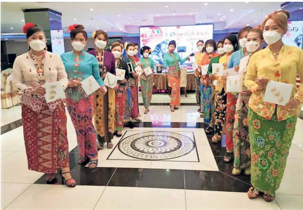
盛装的娘惹们展示华丽珠宝。

槟城州华人公会主办元宵节庆典，峇峇娘惹翩翩起舞跳传统舞蹈“弄浪沙央”，以及办珠宝展，展现令人目眩的华丽首饰，让槟城的“十五暝”依然美丽非凡！