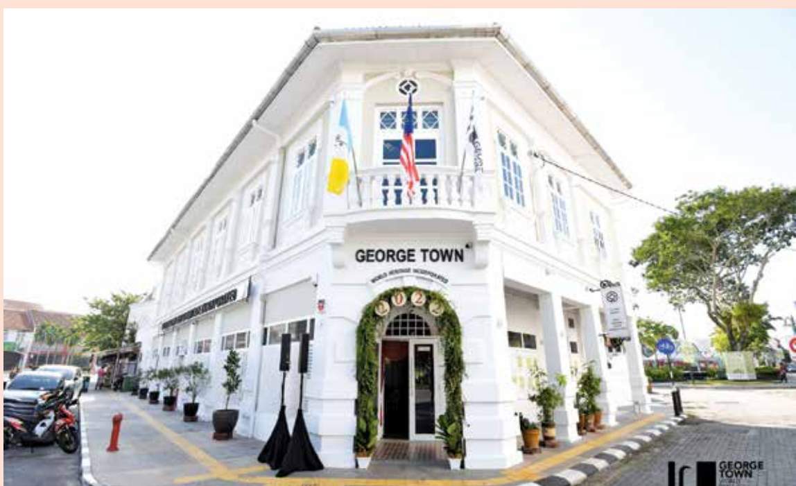
乔治市世界遗产机构外观。

“我们期待与这项拨款有关的更多详情，并希望这项重要资源有助乔治市世遗区以永续发展为大方向，维护与守护杰出普世价值。”