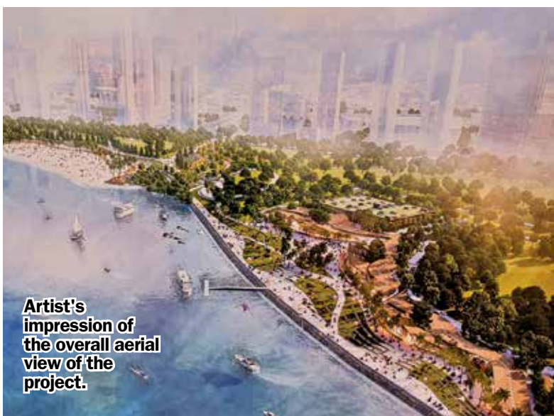
Artist's impression of the overall aerial view of the project.