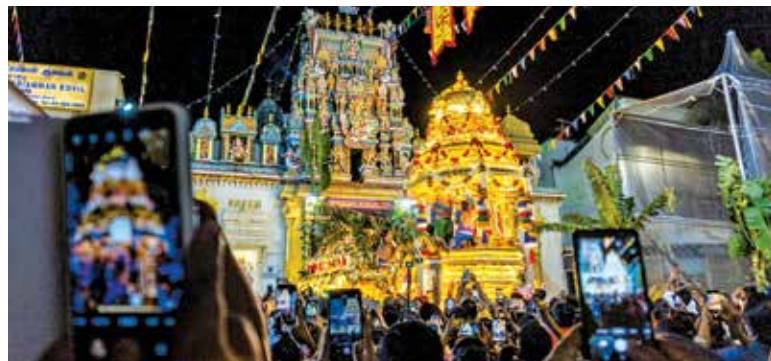
Thousands of Hindu devotees flocking to the Sri Maha Mariamman Temple in Queen Street to witness the departure of the golden chariot to the Waterfall Hilltop Murugan Temple.

"Have a safe and healthy celebration while fulfilling your