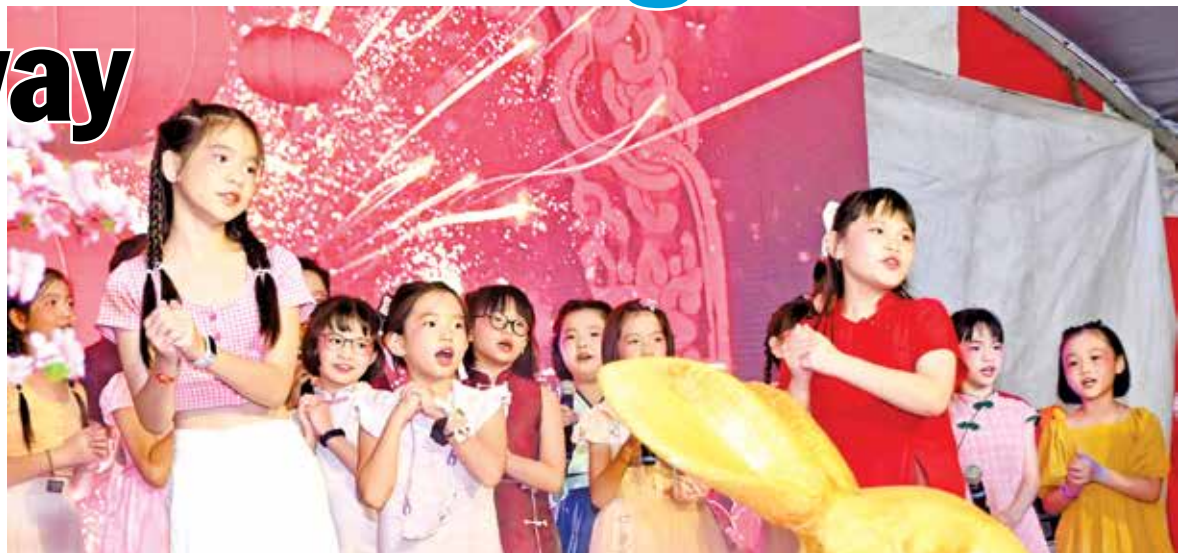
Children entertaining the crowd with their colourful dance performance at the event.

ect (Juru-Sungai Dua elevated highway) gets the attention of the federal government so that it becomes a priority project to rectify the traffic woes in the major part of Seberang Perai.