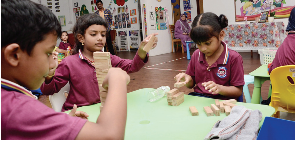
தாமான் மேவா பாலர்பள்ளி மாணவர்கள் பள்ளி நடவடிக்கையில் ஈடுபடுவதைப் படத்தில் காணலாம்.

பாகான் டாலாம் - பினாங்கு மாநில அரசாங்கம், குறைந்த வருமானம் பெறும் குடும்பங்களின் குழந்தைகளுக்கு ஆரம்பக் கல்வியை வழங்குவதில் நிதிச் சுமையைக் குறைக்க உதவும் வகையில் தபிகா பெர்பாடுவான் தாமான் மேவாவை நிறுவ ரிம60,000-ஐ நிதி ஒதுக்கீடு செய்துள்ளது.