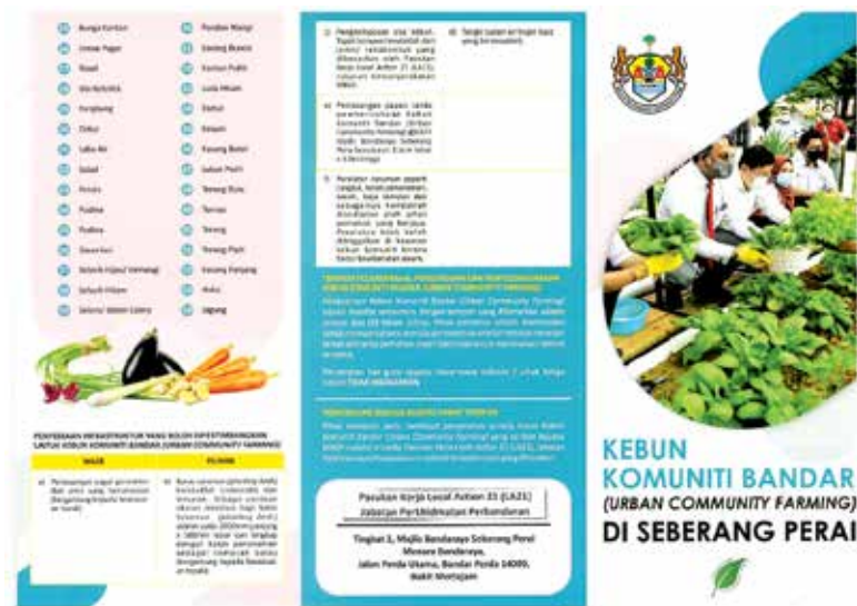
威省市厅积极推动城市农耕计划。

他也说，采石业或是少数几个受到政府监管最多的领域，其他行业在运营过程中可能只需和一两个部门接洽，采石业则需经多部门的繁杂手续。