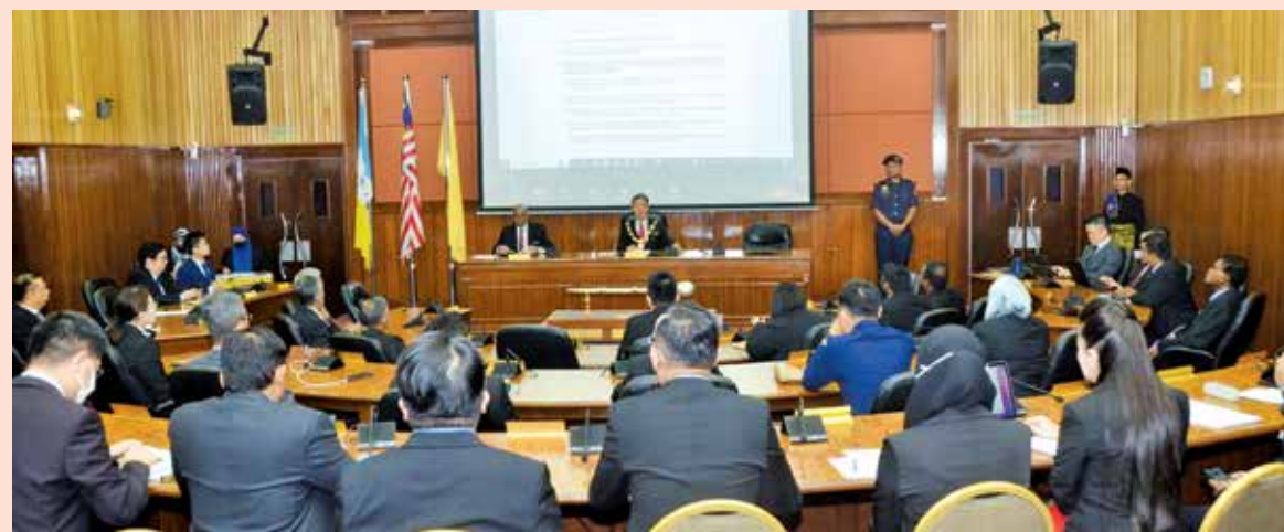
槟岛市厅暂豁免发林巴刹小贩摊租。