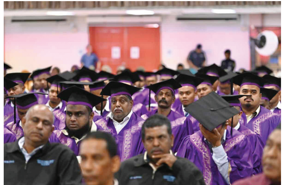
பிளாங்கு நீர் விநியோக வாரியத்தின் SLDN திட்டத்தின் கீழ் மொத்தம் 193 பட்டதாரிகள் சான்றிதழ்களைப் பெற்றனர்.

இந்த நிறுவனத்தின் 230 மூத்த தொழில்நுட்ப வல்லுநர்களில் 97 சதவீதத்தினர் SKM சான்றிதழைப் பெற்றுள்ளனர், மீதமுள்ள பணியாளர்கள் இந்த ஆண்டில் பயிற்சியை நிறைவுச் செய்வர் என்று அவர் கூறினார்.