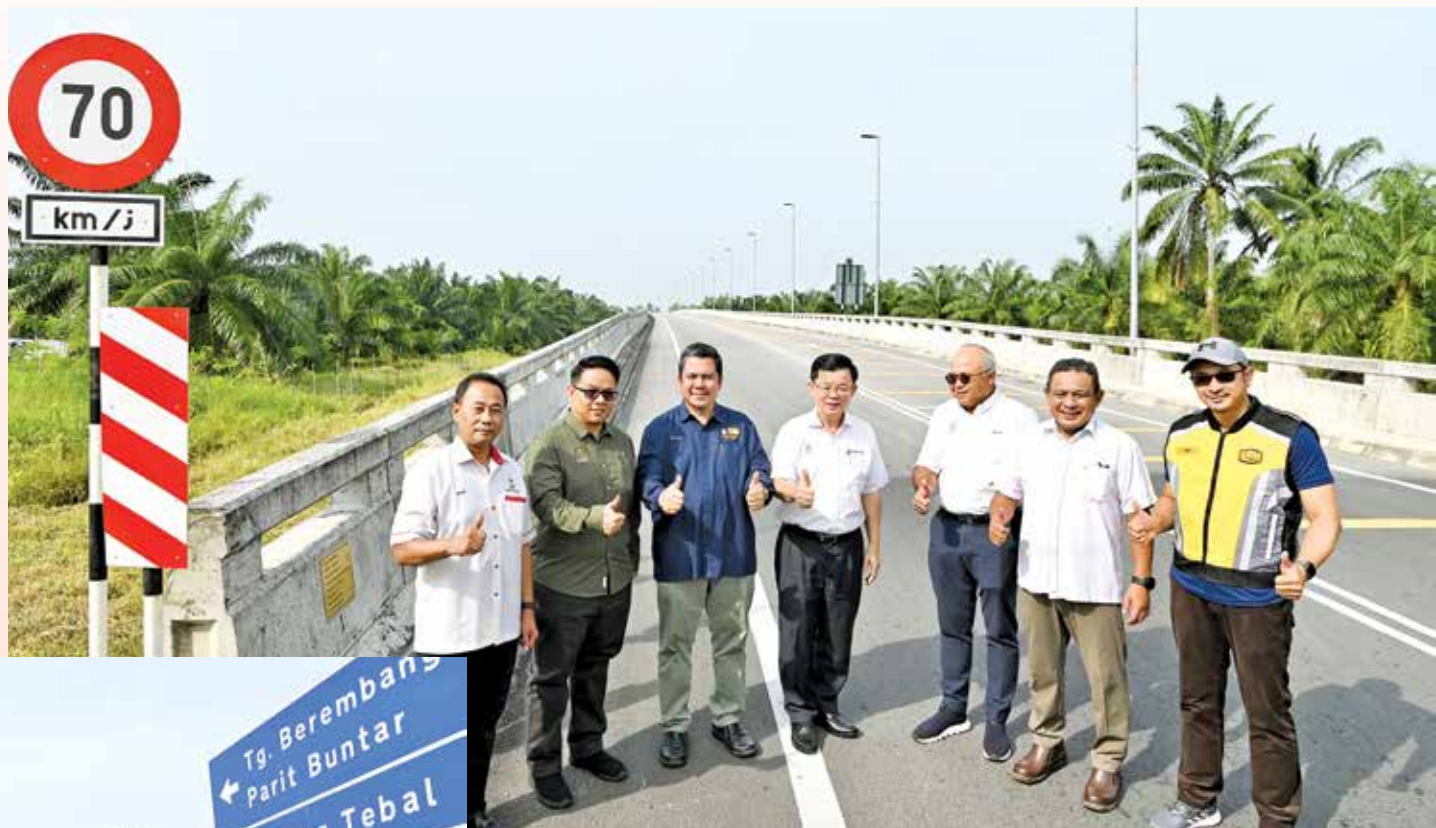
槟首长曹观友（左4）为丁加镭渡跨河桥主持启用礼。