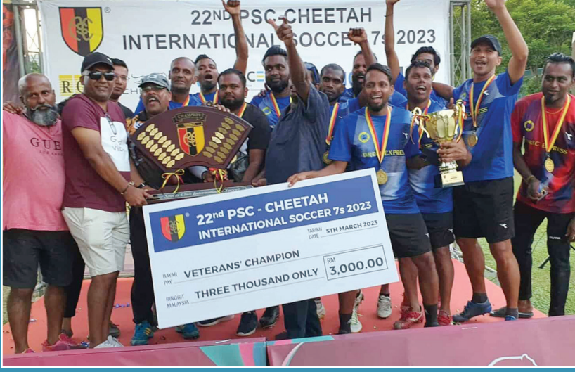
அனைத்துலக சோக்கர் போட்டி விளையாட்டில் MRM 'B' குழுவினர் வெற்றி வாகைச் சூடினர்.