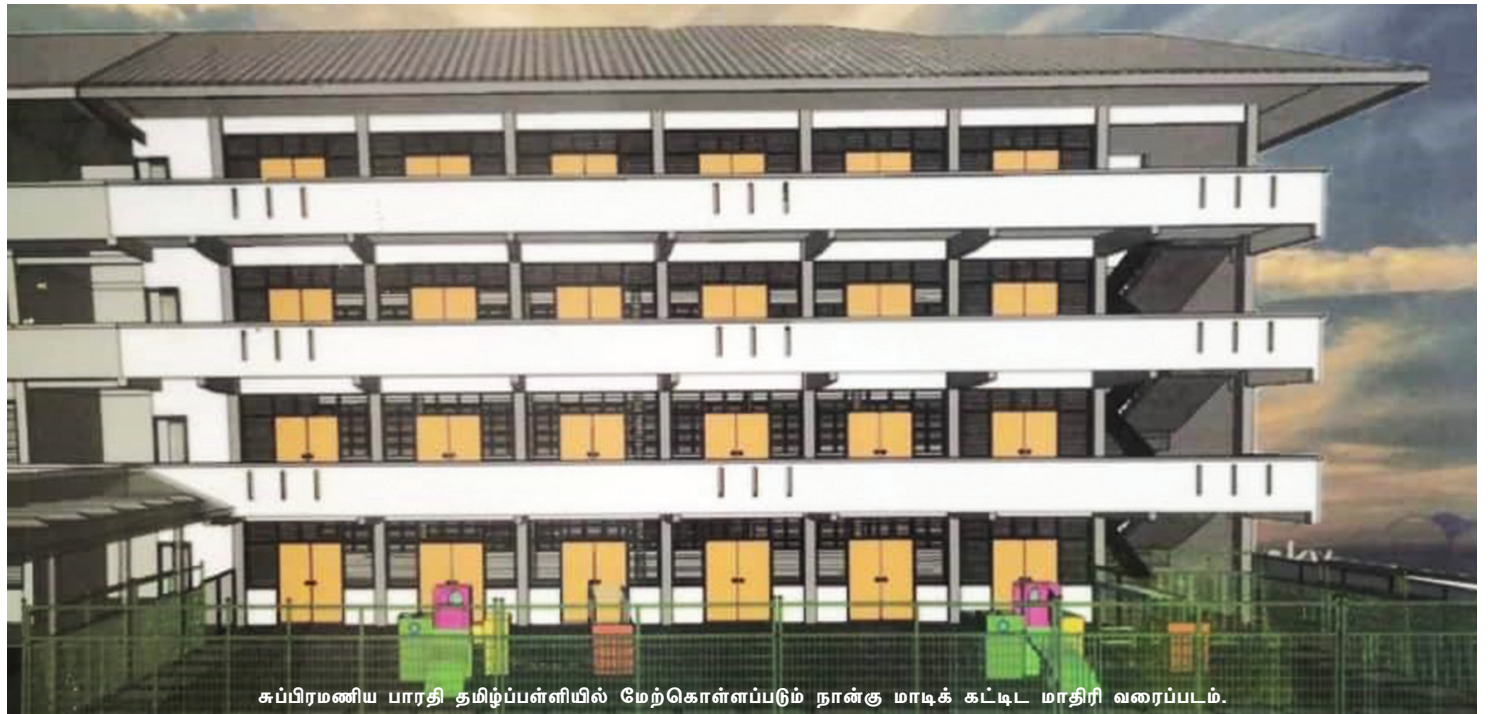
சுப்பிரமணிய பாரதி தமிழ்ப்பள்ளியில் மேற்கொள்ளப்படும் நான்கு மாடிக் கட்டிட மாதிரி வரைபடம்.

"இப்பள்ளியின் கட்டுமானத் திட்டத்திற்கு நன்கொடை அளிக்க விரும்பும்