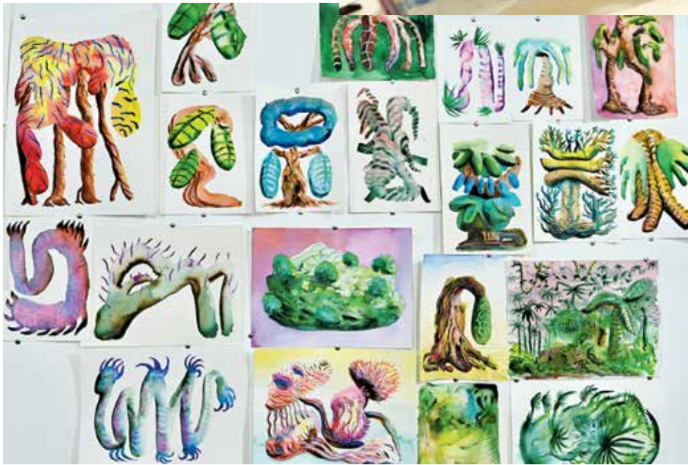
杰里米灵活运用笔下色彩，再结合多元艺术媒介，打造融入槟城元素的VR项目。

已提前了解槟城的特点，如建筑、宗教、大自然及手工艺等，之后也拍下很多地方的照片以便创作。