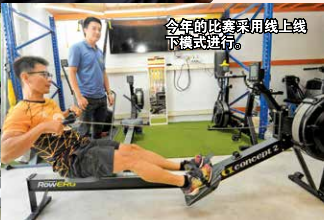
今年的比赛采用线上线下模式进行。