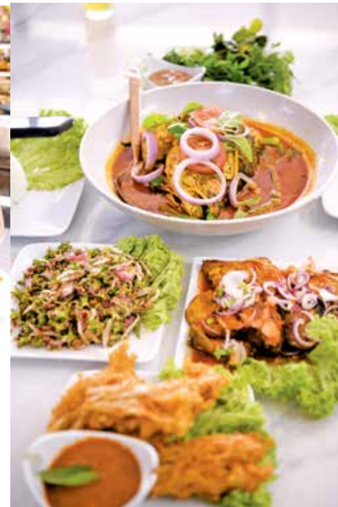
(From top, clockwise) Ulam, fish head curry, ayam goreng Minah, crispy enoki mushroom, and beansprout kerabu are among the favourite dishes.

Food hunters can check out Restoran Minah from Tuesdays to Sundays.