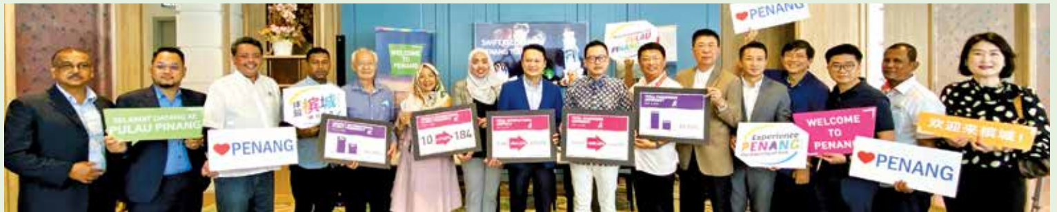
Yeoh and the state's key tourism players are in a happy mood with the increase in tourist arrivals to Penang.

"This was an increase of 1,740% while the arrival of