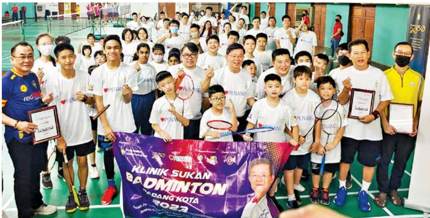
巴当哥打区羽球训练营全体出席者大合照。