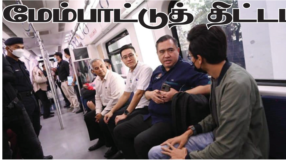
போக்குவரத்து அமைச்சர் அந்தோணி லோக் கே.டி.எம் சேவை குறித்த பொதுமக்களின் கருத்துகள் அறிய முற்பட்டார் (உடன் ஆட்சிக்குழு உறுப்பினர் ஜைரில் கீர் ஜோஹாரி).

புக்கிட் மெர்தாஜாம் - முதியவர்கள், கர்ப்பிணிகள் மற்றும் மாற்றுத்திறனாளிகள் பொதுப் போக்குவரத்தை அவர்களின் தேர்வாகப் பயன்படுத்துவதற்கு இடமளிக்கும் வகையில் கே.டி.எம் இரயில் சேவை நிலையங்களில் மின் தூக்கிகளை நிறுவுவதற்கான பேச்சுவார்த்தைகள் தற்போது நடைபெற்று வருவதாக போக்குவரத்து அமைச்சர் உறுதிப்படுத்தியுள்ளார்.