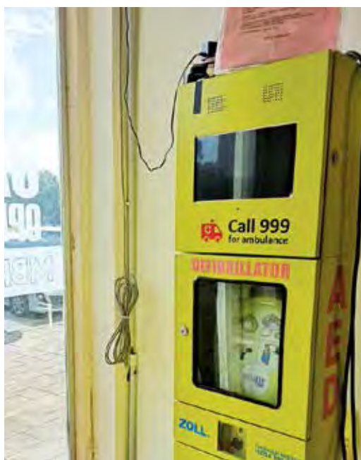
槟州政府鼓励装置AED。