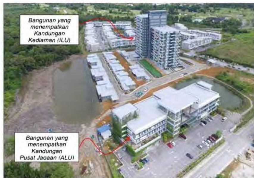
Foto 1.0: Contoh pembangunan Perumahan Mesra Warga Emas di Kuching Sarawak yang disediakan secara bangunan berasingan (free standing building)

Sumber: Diambil dari http://eden-on-the-park.com.my/