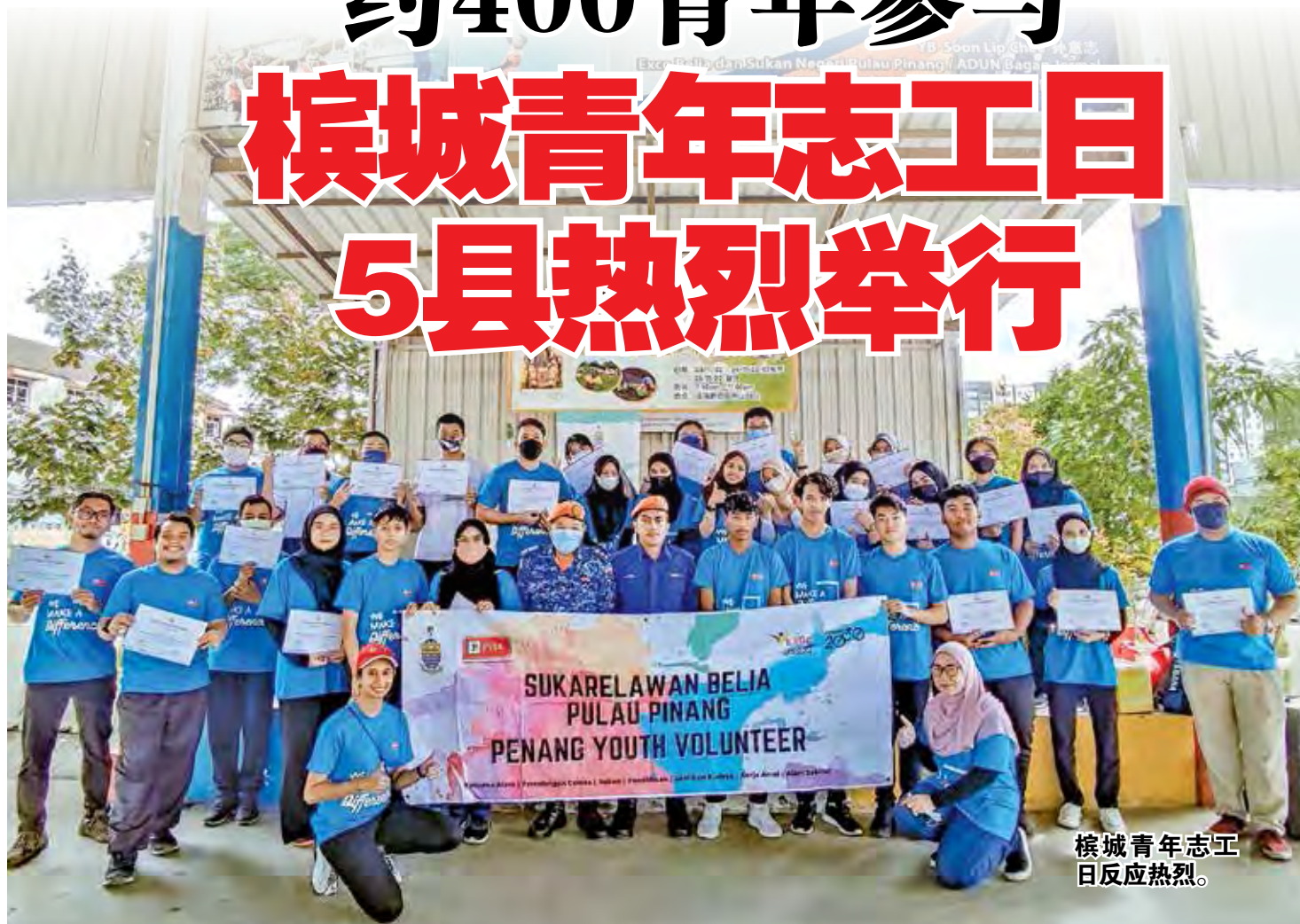
槟城青年志工日反应热烈。