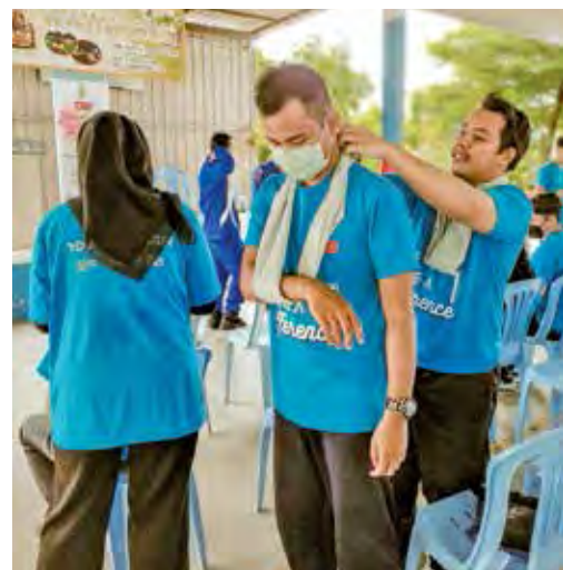
学习基本急救法，让志工长知识。