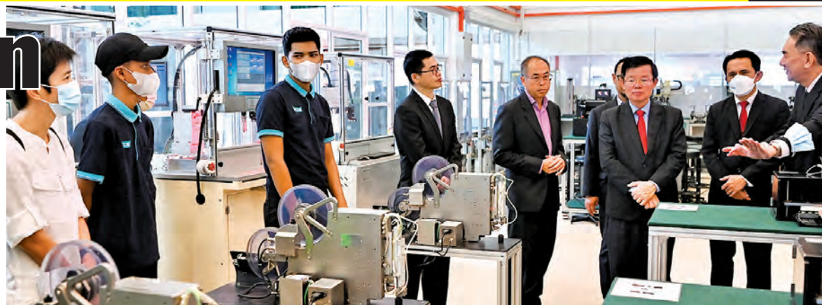
Chow and his delegation being shown around the WCOE centre in Batu Kawan.

"WCOE is a corporate skills development and TVET centre as over 1,400 participants