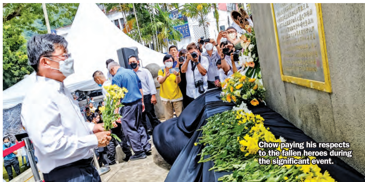
Chow paying his respects to the fallen heroes during the significant event.

Among those present were state Tourism and Creative