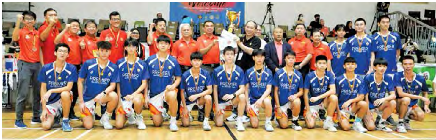
槟城男队获得季军，领奖后球队与嘉宾合影。

取得圆满成功的各方表示感谢和祝贺。希望本届赛事的成功举办将为今后举办更大规模、国际化的体育赛事奠定基础。”