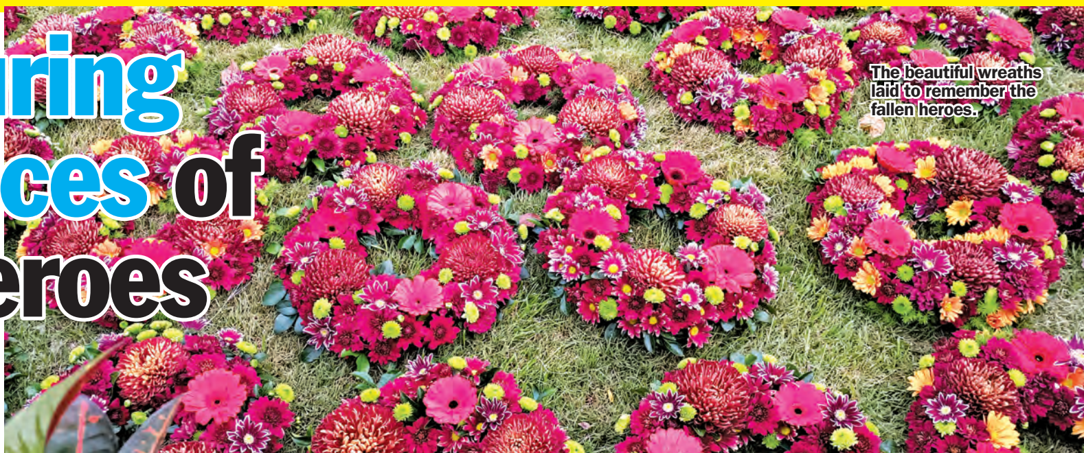
The beautiful wreaths laid to remember the fallen heroes.

■ Story by Edmund Lee