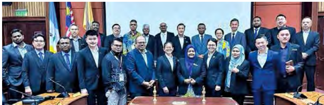
槟岛市厅最后一次例常会议后,全体出席者大合照。

槟岛市政厅通过“自动体外除颤器”(AED)指南,规定槟岛超过100个单位的新建高楼住宅必须装置AED。