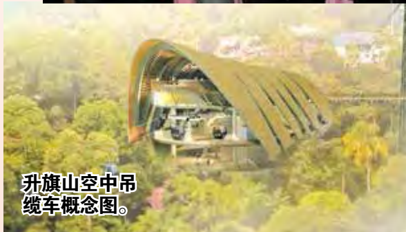
升旗山空中吊缆车概念图。