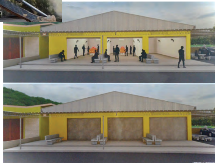
பண்டார் ஆயர் ஈத்தாம் தலத்தில் இந்திய சவக்கிடங்கு கட்டிடத்திற்கான மாதிரி வரைபடம்.