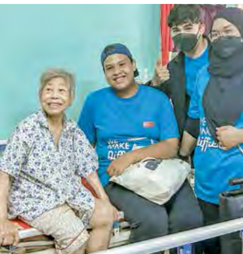
志工与老人家互动，让老人家开心不已。