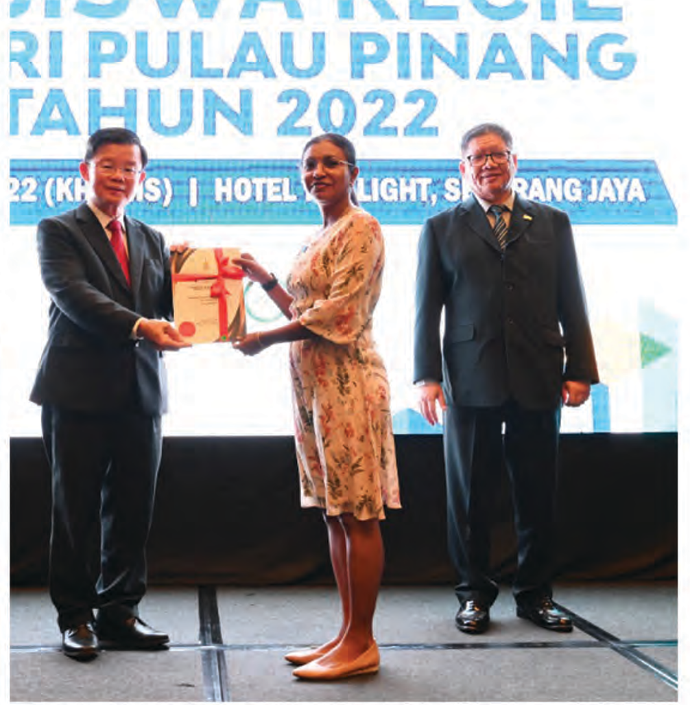
மாநில முதல்வர் மேதகு சாவ் கொன் இயோவ் பிணங்கு மாநில உபகாரச் சம்பளத்திற்கான மாதிரி காசோலையை பள்ளிப் பிரதிநிதியிடம் வழங்கினார்.