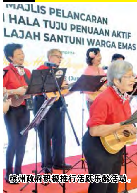
槟州政府积极推行活跃乐龄活动。