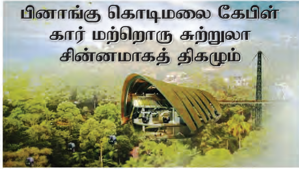
பினாங்கு கொடிமலை கேபிள் கார் திட்ட மாதிரி வரைப்படம்.

"பல ஆண்டுகளாக பிறை தொழில்துறை மண்டலத்தில் பொம்மைத் தொழிலுக்கான செழிப்பான சுற்றுச்சூழல்