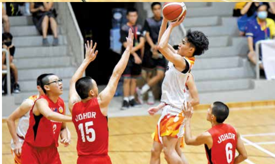
槟城男队击退柔佛拿下季军。

出席颁奖仪式者包括大马篮总会长拿督斯里李典和、马篮总署理会长兼槟州篮总会长拿督黄坤荣等。