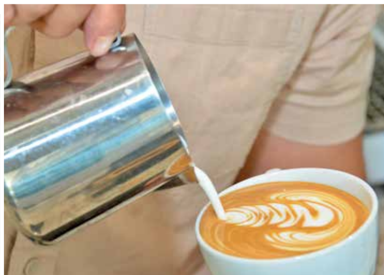
HASIL seni latte yang menarik.