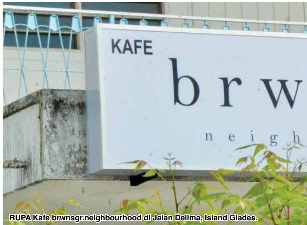
RUPA Kafe brwnsgr.neighbourhood di Jalan Delima, Island Glades .

Meskipun memiliki kelulusan dalam bidang kejuruteraan mekanikal