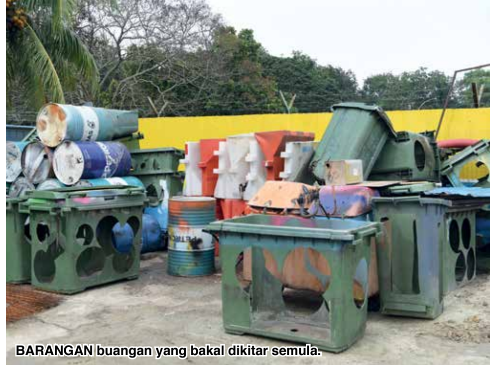
BARANGAN buangan yang bakal dikitar semula.

Tambah beliau, terdapat sesetengah produk seperti pelekat adalah dilukis sendiri, kecuali bahagian ukiran yang dibuat menggunakan gabungan seni tangan serta mesin ukir.