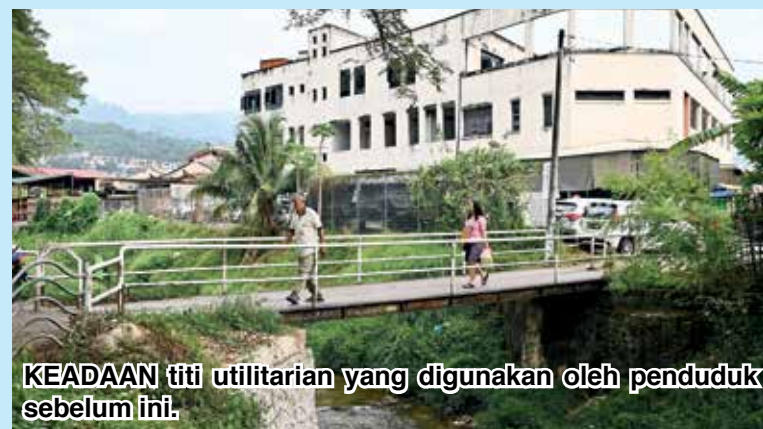
KEADAAN titi utilitarian yang digunakan oleh penduduk sebelum ini.

Sementara itu, Kon Yeow ketika ditemui pada majlis