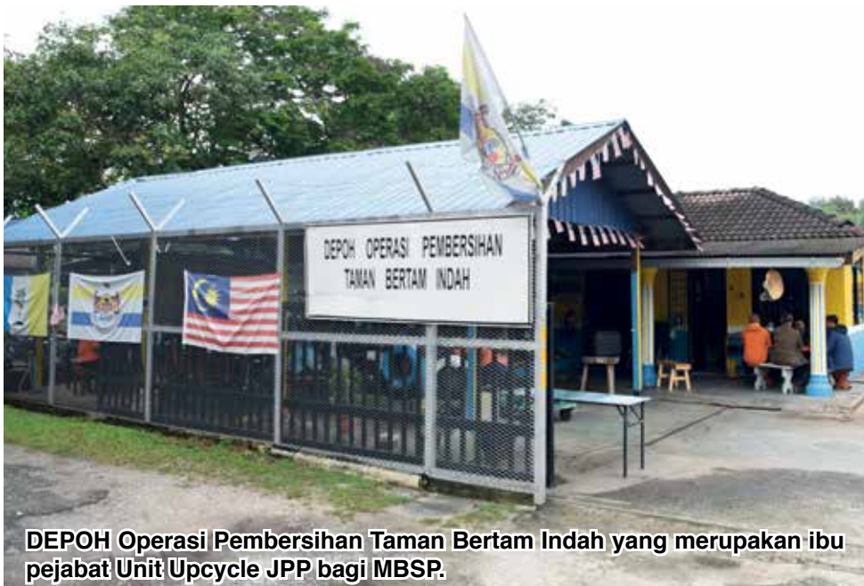
DEPOH Operasi Pembersihan Taman Bertam Indah yang merupakan ibu pejabat Unit Upcycle JPP bagi MBSP.