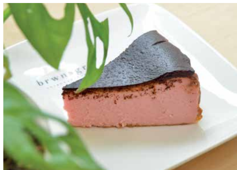
KEK keju berperisa bandung yang menjadi antara tarikan kafe ini.