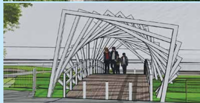
ILUSTRASI artis menunjukkan cadangan reka bentuk titi pejalan kaki di sini.

tersebut menzahirkan sokongan atas inisiatif wakil-wakil rakyat membangunkan projek pembangunan demi manfaat rakyat.