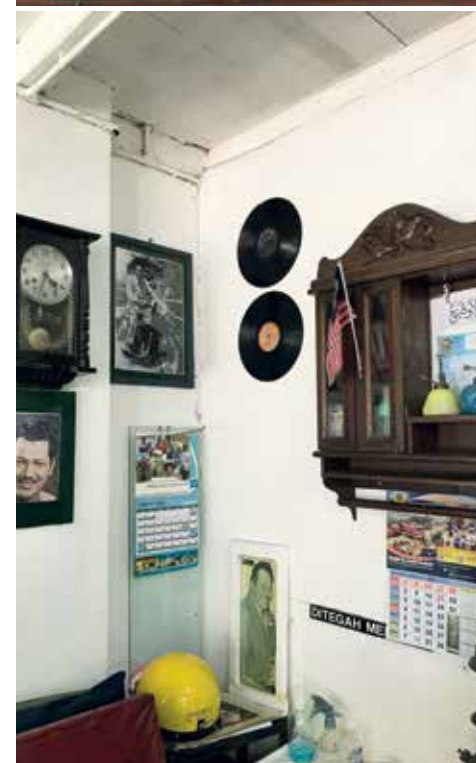
KOLEKSI seniman negara.