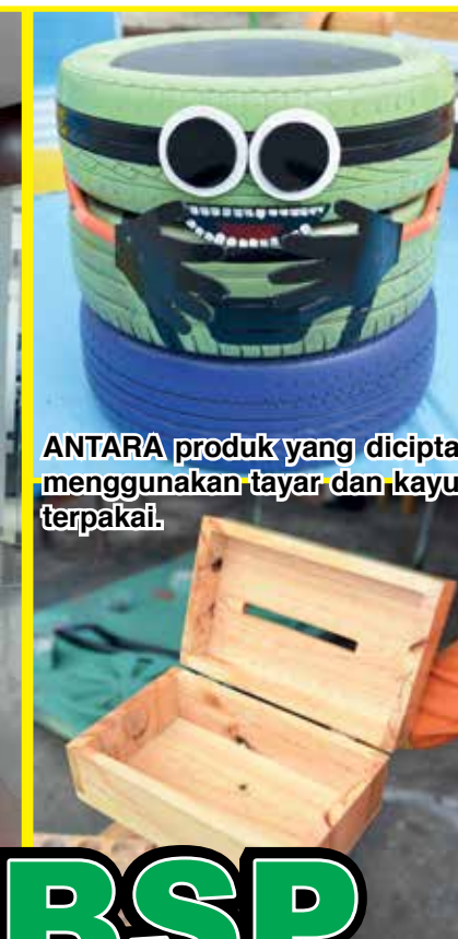
ANTARA produk yang dicipta menggunakan tayar dan kayu terpakai.