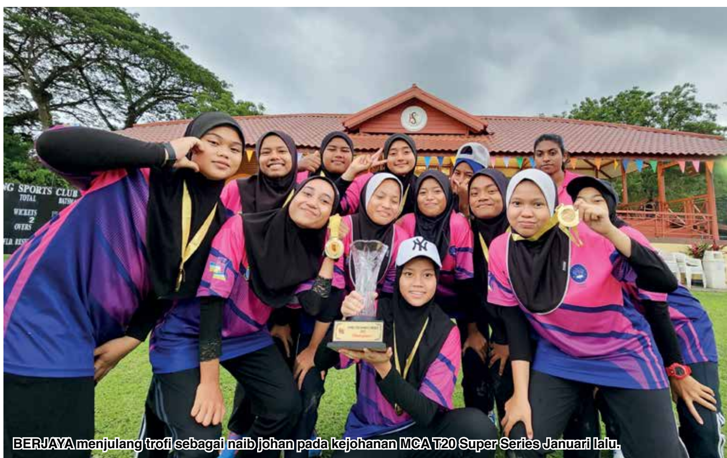
BERJAYA menjulang trofi sebagai naib johan pada kejohanan MCA T20 Super Series Januari lalu.