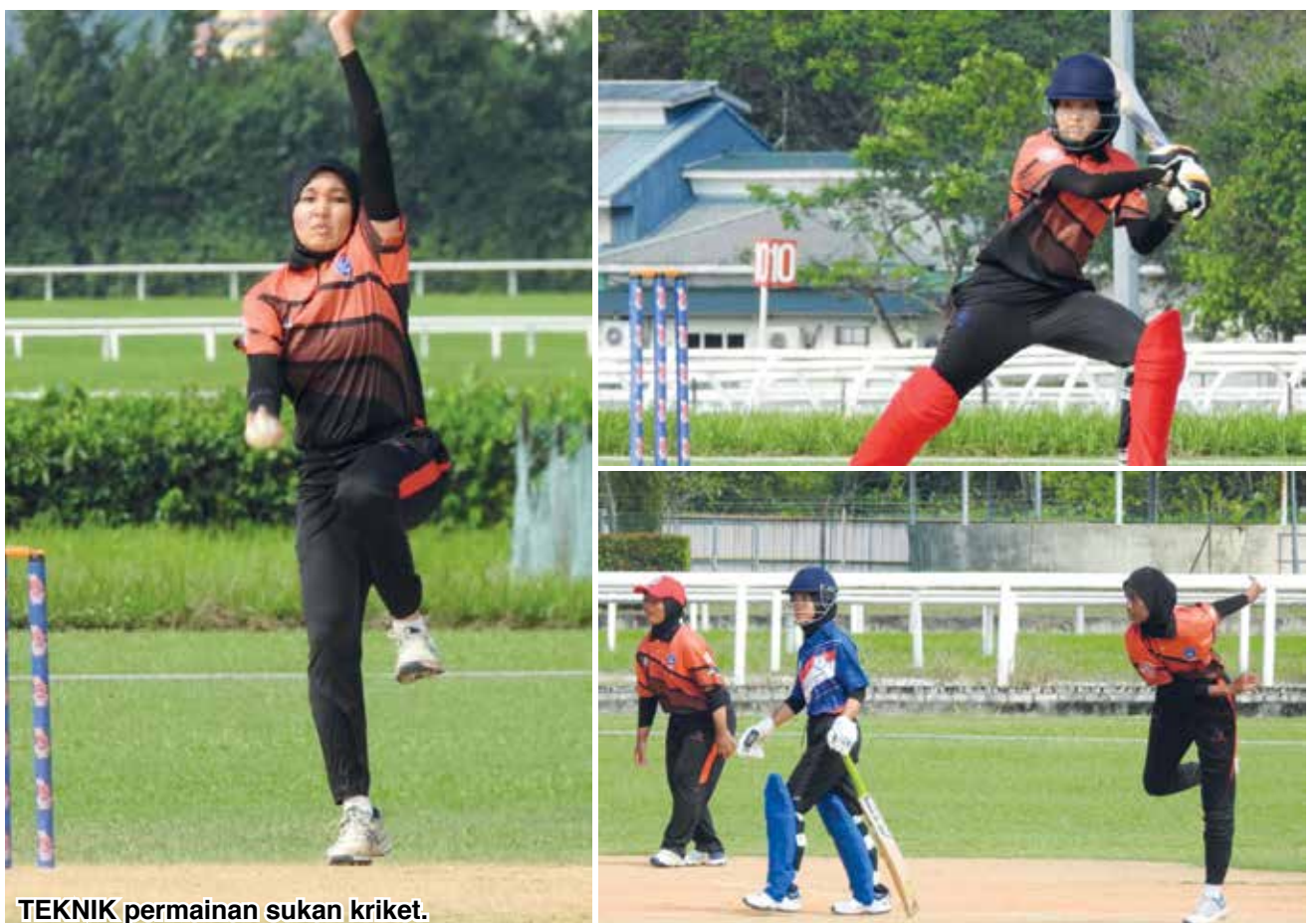
TEKNIK permainan sukan kriket.

"Alhamdulillah... walaupun berlatih dalam masa yang sangat singkat tetapi kami berjaya mendapat gelaran naib johan," ujarnya yang turut bergiat aktif dalam beberapa sukan lain seperti bola jaring, bola baling, bola tampar dan memanah.