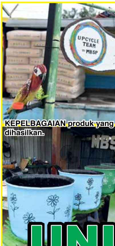
KEPELBAGAIAN produk yang dihasilkan.