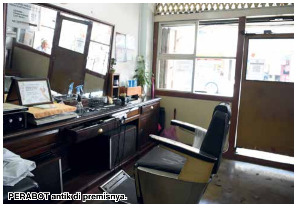
PERABOT antik di premisnya.